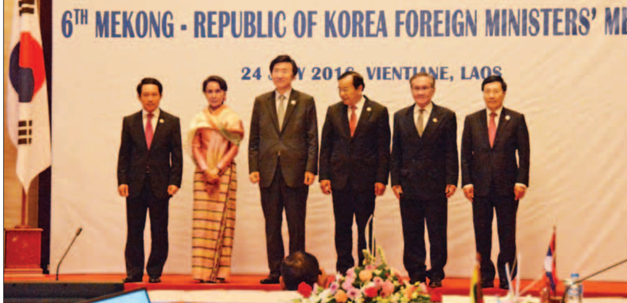
(၆) ကြိမ်မြောက် မဲခေါင် - ကိုရီးယား နိုင်ငံခြားရေးဝန်ကြီးများအစည်းအဝေးတွင် နိုင်ငံခြားရေးဝန်ကြီးများ မှတ်တမ်းတင်ဓာတ်ပုံရိုက်ကြစဉ်။

နိုင်ငံခြားရေးဝန်ကြီးများ၏ကြေညာချက်ကို ချမှတ်ခဲ့သည်။ အစည်းအဝေးက ချီလီ၊ အီဂျစ်၊ အီရန်နှင့် မော်ရိုကိုနိုင်ငံတို့က TAC သို့ဝင်ရောက်ရေး မေတ္တာရပ်ခံချက်ကိုလည်း သဘောတူခဲ့သည်။ အာဆီယံနိုင်ငံခြားရေးဝန်ကြီးများသည် အာဆီယံ၏ ပြည်ပဆက်ဆံရေးကို တိုးမြှင့်ရေးနှင့် အာဆီယံကဦးဆောင်သော ယန္တရားများအတွင်း အာဆီယံ၏ အဓိကကျမှုတို့ကိုလည်း ဆွေးနွေးခဲ့ကြသည်။ ၎င်းအပြင် ဝန်ကြီးများသည် အကြမ်းဖက်ဝါဒ၊ လူကုန်ကူးမှု၊ တရားမဝင် ပူးပေါင်းဆေးဝါးရောင်းဝယ်မှု၊ သဘာဝဘေးအန္တရာယ်များ၊ ပုံမှန်မဟုတ်သော ကူးပြောင်းဝင်ရောက်မှုနှင့် အရှေ့အလယ်ပိုင်း၊ ကိုရီးယားကျွန်းဆွယ်နှင့် တောင်တရုတ်ပင်လယ်တို့၌ ဖြစ်ပေါ်တိုးတက်ပြောင်းလဲမှုများကို ရင်းနှီးပွင့်လင်းပြီး အပြုသဘောဖြင့် အမြင်ချင်းဖလှယ်ခဲ့ကြသည်။