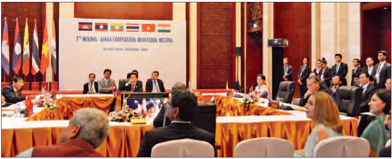
(၇)ကြိမ်မြောက် မဲခေါင်- ဂင်္ဂါ ပူးပေါင်းဆောင်ရွက်ရေးဆိုင်ရာအစည်းအဝေးကျင်းပစဉ်။ (သတင်းစဉ်)

(၄၉)ကြိမ်မြောက် အာဆီယံနိုင်ငံခြားရေးဝန်ကြီးများအစည်းအဝေးနှင့် ဆက်စပ်အစည်းအဝေးများတွင် အာဆီယံအဖွဲ့က အာဆီယံအသိုက်အဝန်းရည်မှန်းချက် ၂၀၂၅ အကောင်အထည်ဖော်ရေးမူ၊ ပြည်ပမိတ်ဖက်နိုင်ငံများနှင့် ပူးပေါင်းဆောင်ရွက်ရေး မြှင့်တင်မှုအပေါ် အာရုံစိုက်လုပ်ဆောင်နေချိန်ဖြစ်သည့် အထူးအရေးကြီးသောအချိန်ကာလတွင် ကျင်းပလိုက်သော အစည်းအဝေးများဖြစ်ကြောင်း၊ တစ်ချိန်တည်းမှာပင် အခွင့်အလမ်းနှင့် စိန်ခေါ်မှုနှစ်မျိုးစလုံးကို ပေးစွမ်းနိုင်သည့် မြန်ဆန်သောပြောင်းလဲမှုများကို ဒေသတွင်းနှင့် နိုင်ငံတကာတို့က ဆက်လက်ရင်ဆိုင်နေချိန်ဖြစ်ကြောင်း၊ ကမ္ဘာ့နိုင်ငံများအနေဖြင့် ပိုင်နက်အခြင်းပွားမှု၊ အစွန်းရောက်မှုနှင့်အကြမ်းဖက်မှု၊ သဘာဝဘေးအန္တရာယ်၊ ရာသီဥတုပြောင်းလဲမှု၊ ဒုက္ခသည်များပြဿနာ၊ တရားမဝင်ရွှေ့ပြောင်းသွားလာမှု၊ လူ့မှောင်ခိုကုန်ကူးမှုကဲ့သို့သော သမားရိုးကျနှင့် သမား