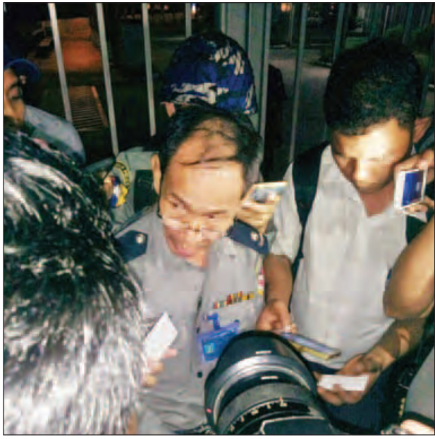
သက်ဆိုင်ရာက သွားရောက်စစ်ဆေးမှုပြုလုပ်နေသည်ကို တွေ့ရစဉ်။