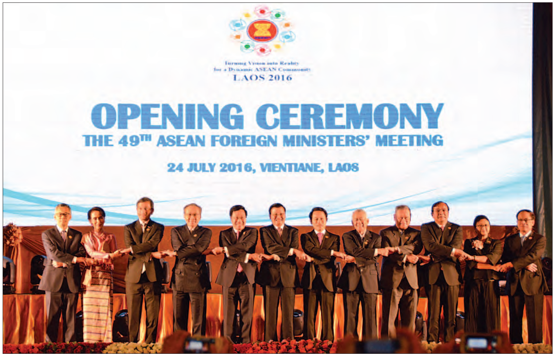
ဗီယက်ကျန်း၊ ဇူလိုင် ၂၄

(၄၉) ကြိမ်မြောက် အာဆီယံနိုင်ငံခြားရေးဝန်ကြီးများအစည်းအဝေးဖွင့်ပွဲအခမ်းအနားကို လာအိုပြည်သူ့ဒီမိုကရက်တစ်သမ္မတနိုင်ငံ ဗီယက်ကျန်းမြို့ရှိ Don Chan Palace Hotel ၌ ယနေ့ ဒေသစံတော်ချိန် နံနက် ၈ နာရီခွဲတွင် ကျင်းပသည်။ (အပေါ်ပုံ)