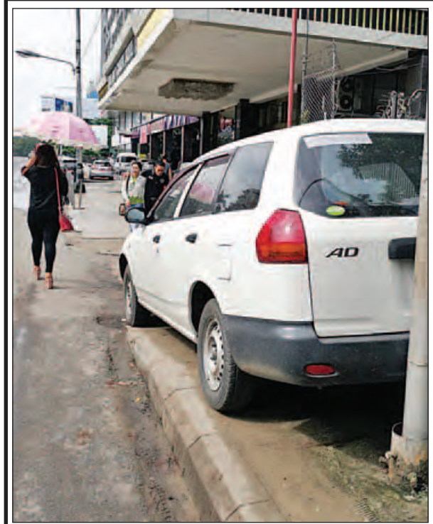
ရန်ကုန်မြို့ ပြည်လမ်း တော်ဝင်စင်တာအနီး လူသွားစင်္ကြံပေါ်တွင် ရပ်ထား သော မော်တော်ယာဉ်တစ်စီးကိုတွေ့ရပြီး လမ်းသွားလမ်းလာများမှာ ယာဉ်သွားလမ်းပေါ်မှ သွားလာနေစဉ်။ [အဆိုပါနေရာတွင် နေ့စဉ်လိုလို အငှားယာဉ်များ ရပ်နားထားလျက် ရှိပါသည်။ အရေးယူမှုမရှိသေးပါ။ အများသူငါ သွားလာမှုမှာ ယာဉ်သွား လမ်းပေါ်သွားလာနေရပါသည်။] (ဆုနှင်းလဲ့)