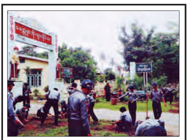
ပဲခူးတိုင်းဒေသကြီး (အနောက်ပိုင်း) ဒေသကပ်ကမူ စစ်ဌာနချုပ် (ပြည်) လက်အောက်ခံတပ်ရင်းတပ်ဖွဲ့များမှ တပ်မတော်သားများ၊ အရာရှိ၊ အရာခံ၊ အကြပ်တပ်သားများ၊ ပြည်ခရိုင်ရဲတပ်ဖွဲ့မှူးနှင့် ရဲတပ်ဖွဲ့ဝင်များ၊ မိသားစုဝင်များ၊ မီးသတ်တပ်ဖွဲ့ဝင်များစုပေါင်း၍ ပြည်မြို့ တိုးတားရိပ်သာ အတွင်းအပြင်တို့တွင် အမှိုက်များရှင်းလင်းခြင်း၊ ချွံနွယ်များခုတ်ထွင် ရှင်းလင်းခြင်း၊ ရေစီးရေလာကောင်းမွန်ရေးအတွက် ရေမြောင်းများပြုပြင် ဆောင်ရွက်ခြင်းတို့ကို ဇူလိုင် ၂၃ ရက်က ဆောင်ရွက်ကြစဉ်။ မြင့်နိုင်(ပြည်)