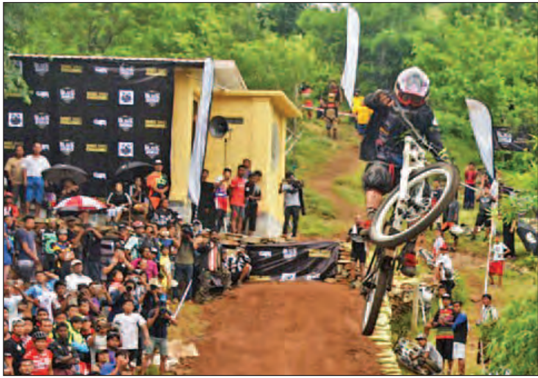
မန္တလေးမြို့ရှိ ရေတံခွန်တောင်ဖိတ်ခေါ် Mountain Bike (XC & DH) စက်ဘီးစီးပြိုင်ပွဲ ကျင်းပစဉ်။