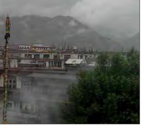
Jokhang Temple ပေါ်မှ Potala Palace နှင့် ပတ်ဝန်းကျင်သို့ ထိုနေ့က မြင်ရသည့်မြင်ကွင်း။