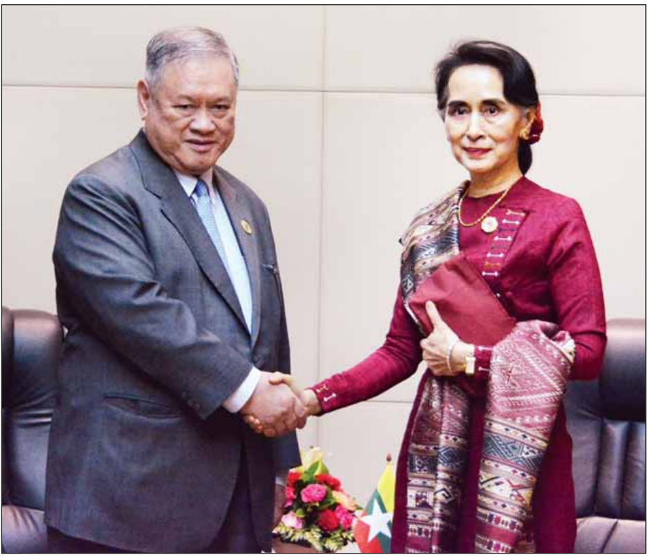
နိုင်ငံခြားရေးဝန်ကြီးဌာန ပြည်ထောင်စုဝန်ကြီး ဒေါ်အောင်ဆန်းစုကြည်နှင့် ဘရူနိုင်း ဒါရူဆလမ်နိုင်ငံ ဝန်ကြီးချုပ်ရုံး ဝန်ကြီးနှင့် နိုင်ငံခြားရေးဝန်ကြီး Dato Seri Setia Lim Jock Seng တို့ ရင်းရင်းနှီးနှီးတွေ့ဆုံနှုတ်ဆက်စဉ်။

များမှာ အာဆီယံဒေသအတွင်း လူ့အခွင့်အရေးဆိုင်ရာ အသိပညာပေးမှုဖြင့်တင်ခြင်းအပါအဝင် လူ့အခွင့်အရေးများ ကာကွယ်ခြင်းတင်ခြင်းမှသည့် အာဆီယံအသိုက်အဝန်း တည်ဆောက်ရေးလုပ်ငန်းစဉ်အား အထောက်အကူပြုခဲ့သဖြင့် တိုးတက်မှုများစွာရှိကြောင်း ချီးကျူးထောပနာပြုခဲ့ကြသည်။ ထို့အပြင် AICHR ၏ လက်ရှိလုပ်ငန်းများနှင့်အညီ AICHR ၏ ဦးစားပေးလုပ်ငန်းစဉ်များ ထိရောက်စွာ အကောင်အထည်ဖော်ရာတွင် ကြိုးပမ်းမှုများ ဆက်လက်လုပ်ဆောင်သွားရန် ဝန်ကြီးများက အားပေးလှုံ့ဆော်ခဲ့ကြသည်။ ညပိုင်းတွင် ပြည်ထောင်စုဝန်ကြီး ဒေါ်အောင်ဆန်းစုကြည်သည် အစည်းအဝေးသို့ တက်ရောက်လာကြသူများနှင့်အတူ လာအိုပြည်သူ့ဒီမိုကရက်တစ်သမ္မတနိုင်ငံ နိုင်ငံခြားရေးဝန်ကြီး Mr. Saleumxay Kommasith က တည်ခင်းဧည့်ခံသည့် ဂုဏ်ပြုညစာစားပွဲသို့ တက်ရောက်ခဲ့သည်။