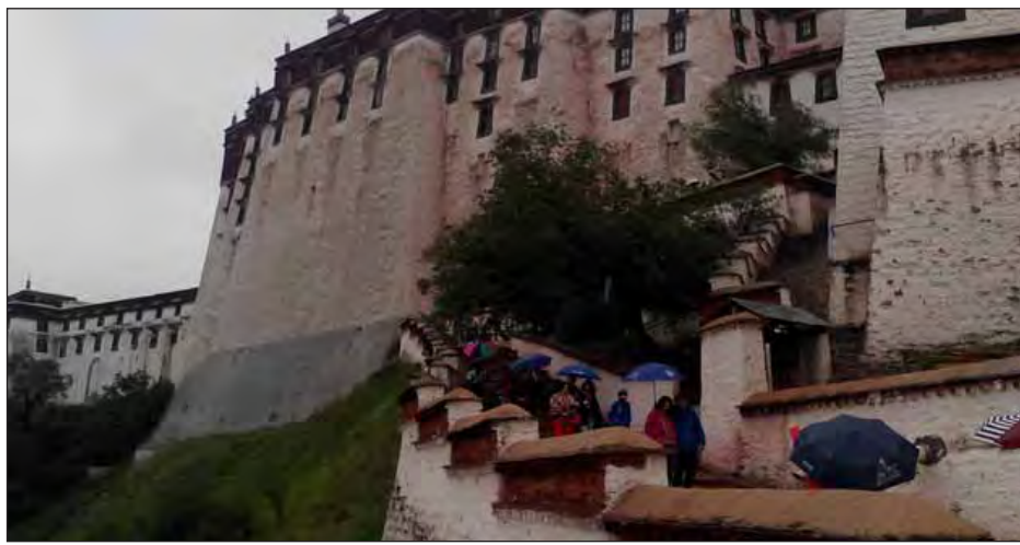
ပိုတာလာနန်းတော်တွင် အထပ်ပေါင်း ၁၃ ထပ်ရှိပြီး အခန်းပေါင်း ၁၀၀၀ ကျော် ရှိသည်။

ပိုတာလာနန်းတော်ထဲဝင်ဖို့နဲ့ အထဲမှာကို သုံးလေး ကြိမ်လောက် လက်မှတ်ပြု၊ ပတ်စ်ပို့ပြု စစ်ဆေးခံရတယ်။ လုံခြုံရေးကတော့ အထူးတင်းကြပ်တယ်။ အထဲရောက် တော့ နန်းတော်နဲ့ပတ်သက်လို့ ဧည့်လမ်းညွှန်ကလည်း တရုတ်ရင်းပြပါတယ်။ အထဲမှာ ဓာတ်ပုံရိုက်လို့ မရတော့ ဘူး။ နန်းတော်ထဲမှာ တိဘက်ဒေသမှာ အုပ်စိုးခဲ့တဲ့