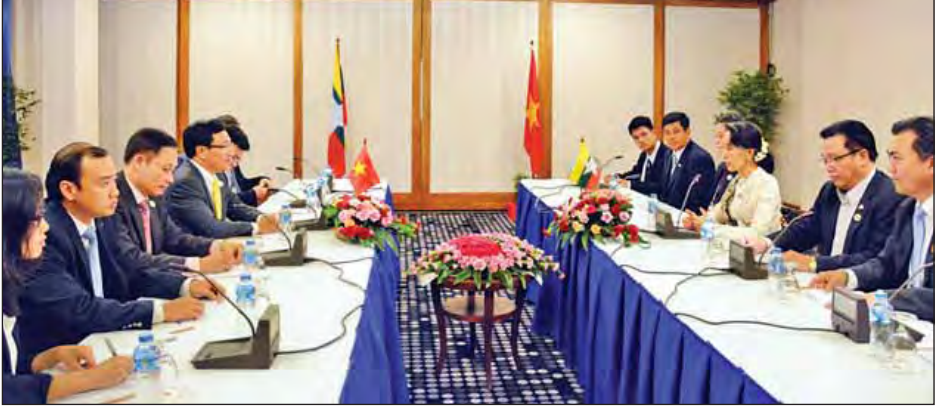
နိုင်ငံခြားရေးဝန်ကြီးဌာန ပြည်ထောင်စုဝန်ကြီး ဒေါ်အောင်ဆန်းစုကြည်နှင့် ဗီယက်နမ်ဆိုရှယ်လစ် သမ္မတနိုင်ငံ ဒုတိယဝန်ကြီးချုပ်နှင့် နိုင်ငံခြားရေးဝန်ကြီး Mr. Pham Binh Minh တို့ တွေ့ဆုံဆွေးနွေးကြစဉ်။ (သတင်းစဉ်)