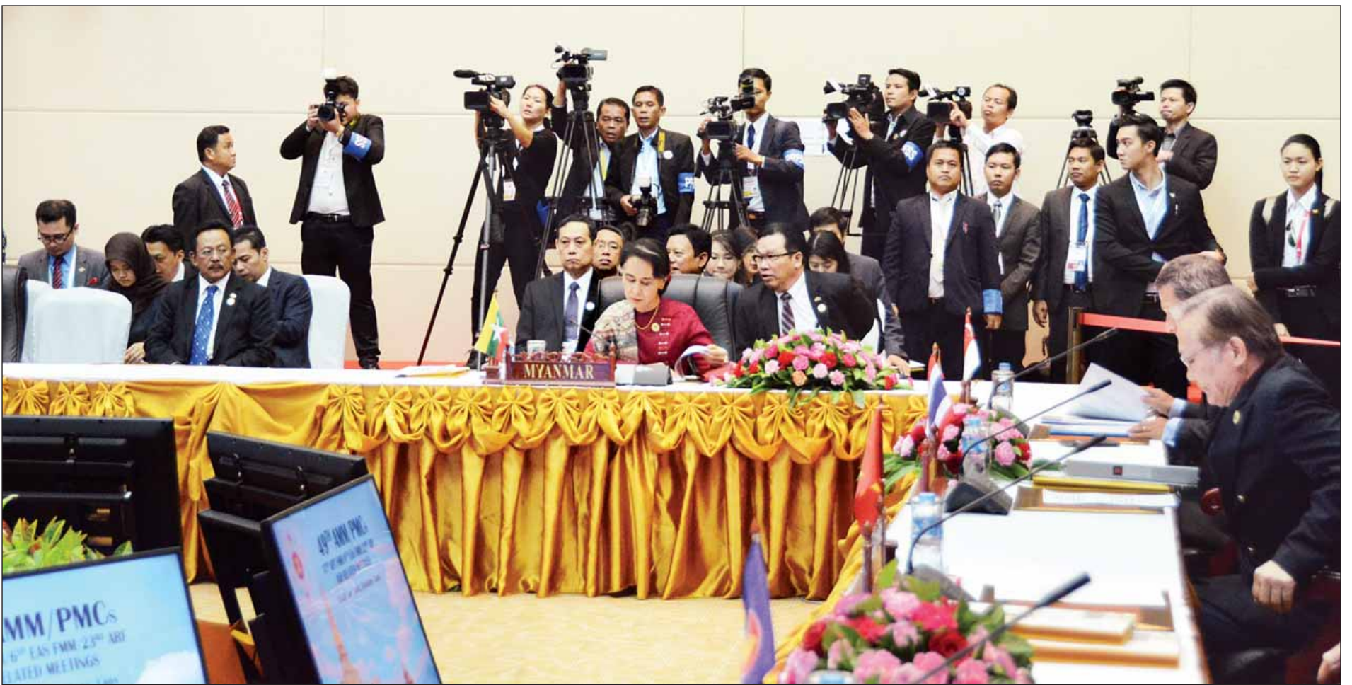
အရှေ့တောင်အာရှ နျူကလီးယားလက်နက်ကင်းမဲ့ရေးဆိုင်ရာ ကော်မရှင်အစည်းအဝေးသို့ ပြည်ထောင်စုဝန်ကြီး ဒေါ်အောင်ဆန်းစုကြည် တက်ရောက်စဉ်။ (သတင်းစဉ်)

ဗီယက်ကျွန်း ဇူလိုင် ၂၃ နိုင်ငံခြားရေးဝန်ကြီးဌာန ပြည်ထောင်စုဝန်ကြီး ဒေါ်အောင်ဆန်းစုကြည်သည် ယနေ့တွင် အရှေ့တောင်အာရှ နျူကလီးယားလက်နက်ကင်းမဲ့ရေးဆိုင်ရာ ကော်မရှင်အစည်းအဝေးနှင့် အာဆီယံနိုင်ငံခြားရေးဝန်ကြီးများနှင့် အာဆီယံအစိုးရချင်း ပူးပေါင်းဆောင်ရွက်ရေးဆိုင်ရာ လူ့အခွင့်အရေး