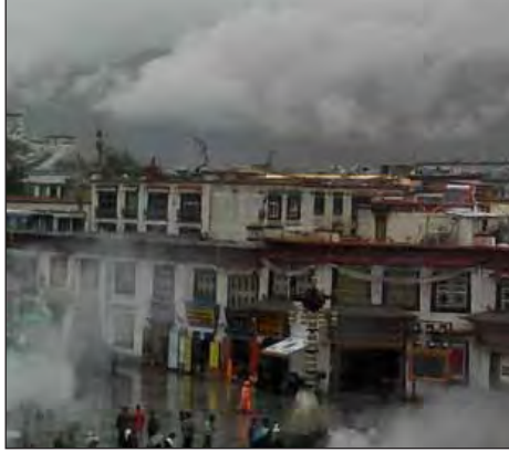
Jokhang Temple ပေါ်မှ Potala Palace နှင့် ပတ်ဝန်းကျင်သို့ ထိုနေ့က မြင်ရသည့်မြင်ကွင်း။

ကိုဒင်ရေး- ပိုတာလာနန်းတော်ကို ၁၆၄၅ ခုနှစ် ပဉ္စမမြောက် ဒလိုင်လားမားလက်ထက်မှာ စတင်တည်ဆောက်ခဲ့ပြီး (၁၃)ဆက်မြောက် ဒလိုင်လားမားက အခုလက်ရှိအရွယ် အစားအထိ ထပ်မံတိုးချဲ့တည်ဆောက်ခဲ့တယ်လို့ သိရ တယ်။ နန်းတော်ရဲ့အကျယ်အဝန်းက အရှေ့အနောက် မီတာ ၄၀၀ နဲ့ တောင်မြောက်မီတာ ၃၅၀ ရှိတယ်။ ဆင်ခြေလျှောက်ကျောက်နံရံကြီးတွေနဲ့ တည်ဆောက်ထားတာ မှာ ကျောက်နံရံကြီးတွေက ပျမ်းမျှ ၃ မီတာအထူရှိတယ်။ အောက်ခြေဘက်ဆို ၅ မီတာအထိ ထူတယ်ပြောတယ်။ ငလျင်ဒဏ်ခံနိုင်စေဖို့ အုတ်မြစ်အတွင်းမှာ ကြေးနီတွေ