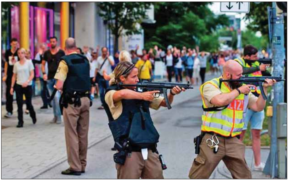
ဒုက္ခသည်တစ်ဦးက ပုဆိန်တစ်လက်ဖြင့် လိုက်လံခုတ်ခဲ့ရာ လူငါးဦး ထိခိုက်ဒဏ်ရာများ ရရှိခဲ့သည်။ ယင်း အသေပစ်ခတ်ဖမ်းဆီးခဲ့သည်။ အကြမ်းဖက်သမားကို ရဲအရာရှိများက အင်န်အိတ်ချ်ကေ။

ကဆိုသည်။ အကြမ်းဖက်သမားနှင့် အိုင်အက်စ် စစ်သွေးကြွအဖွဲ့တို့ ပတ်သက်မှု ရှိ မရှိ ဆိုသည်ကိုမူ ဆက်လက်စုံစမ်းသွားမည်ဖြစ်ကြောင်း ၎င်းတို့က ပြောကြားခဲ့သည်။ အခင်းဖြစ်ပွားပြီးနောက် ယာယီပိတ်ဆို့ထားသည့် ပို့ဆောင်ရေး ဝန်ဆောင်မှုများကို ပြန်လည်သွားလာခွင့်ပေးခဲ့ပြီးဖြစ်သည်။ ယခုဖြစ်ပွားခဲ့သည့် အကြမ်းဖက်မှုသည် ဂျာမနီနိုင်ငံတောင်ပိုင်းတွင် ဖြစ်ပွားခဲ့သော ဒုတိယမြောက် တိုက်ခိုက်မှုဖြစ်သည်။ လွန်ခဲ့သော ငါးရက်ခန့်က ဝူးယားဘတ်ဂျီမြို့အနီး ရထားတစ်စင်းပေါ်တွင် အသက် ၁၇ နှစ်အရွယ် အာဖဂန်စစ်ဘေးရှောင်