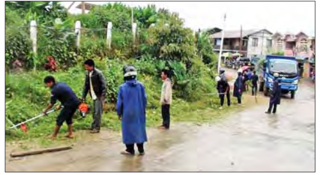
မြို့တွင်းသာယာလှပရေးနှင့် ခြင်အန္တရာယ်ကင်းရှင်းရေးဆောင်ရွက်