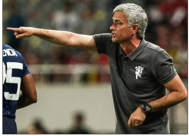
မေလွဲသင်း-ရေးသားသည်

စတီဗ်ဘရစ်သည် ၂၀၁၂ ခုနှစ်တွင် ဟားလ်စီးတီးကို စတင်တာဝန်ယူ ကိုင်တွယ်ခဲ့ပြီးနောက် ပရီမီယာလိဂ်သို့နှစ်ကြိမ် တန်းတက်နိုင်စေရန်ဦးဆောင် နိုင်ခဲ့သလို အက်ဖ်အေဖလားဝိုင်းပွဲ တစ်ကြိမ်နှင့် ယူရိုပါလိဂ်ဝင်ခွင့် တစ်ကြိမ် ဝင်ခွင့်ရရှိစေရန်ပါ ဆောင်ရွက်ပေးနိုင်ခဲ့သည်။ ပြီးခဲ့သည့် မေလတွင် ဟားလ်စီးတီးအသင်းသည် ရှက်ဖီးဝင်စံဒေးအသင်းနှင့် Play-Off ပွဲစဉ် ကစားပြီးနောက် ပရီမီယာလိဂ်သို့ တန်းတက်ခွင့်ရရှိခဲ့သည်။