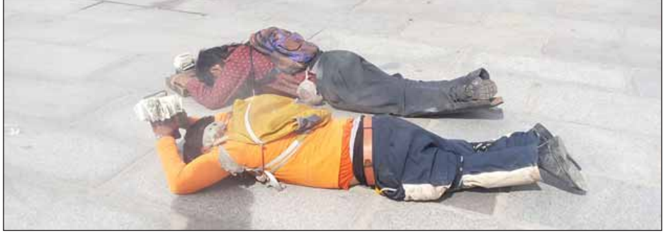
တစ်ကိုယ်လုံးကို ပစ်လှဲချပြီး တိဘက်ပုံစံဖြင့် ကန်တော့နေသူ နှစ်ဦး(လက်ထဲတွင် ဒေသခံများ၏ လျှာဒါန်းငွေများ)

ဒီလောက်ပဲ ကိုဒင်။ နောက်တစ်ပတ်မှာ တိဘက်ခရီး စဉ်နဲ့ ပတ်သက်လို့ လက်စသတ်ပါပြီ။ အပိုင်း (၄) နိဂုံး ပိုင်းလေးကိုတော့ ကျေးဇူးပြုပြီး စောင့်ဖတ်ပေးပါဦး။ ။