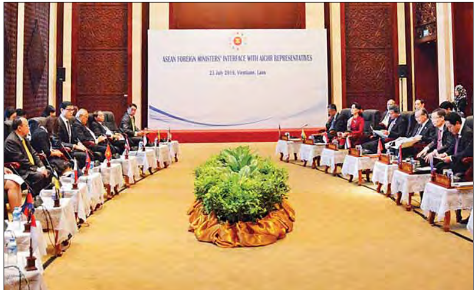
အာဆီယံအစိုးရချင်း ပူးပေါင်းဆောင်ရွက်ရေးဆိုင်ရာ လူ့အခွင့်အရေးကော်မရှင်ကိုယ်စားလှယ်များ တွေ့ဆုံပွဲသို့ ပြည်ထောင်စုဝန်ကြီး ဒေါ်အောင်ဆန်းစုကြည် တက်ရောက်စဉ်။ (သတင်းစဉ်)

အစည်းများနှင့် ကဏ္ဍစုံအသင်းအဖွဲ့များ၊ ဆွေးနွေးဖက်နိုင်ငံများနှင့် အရပ်ဘက်လူမှုအဖွဲ့အစည်းများ (CSO) အပါအဝင် အခြားသောပြင်ပအဖွဲ့အစည်းများအကြား အပြန်အလှန် သွားရောက်လည်ပတ်မှုနှင့်အာဆီယံလူ့အခွင့်အရေးကြေညာစာတမ်း(AHRD)အား အကောင်အထည်ဖော်မှု အပါအဝင် ယမန်နှစ်က လူ့အခွင့်အရေးနှင့် စပ်လျဉ်းသည့် အာဆီယံအစိုးရချင်းဆိုင်ရာ ကော်မရှင်၏ လုပ်ငန်းဆောင်ရွက်ချက်များအား အကောင်အထည်ဖော်ရာတွင် တိုးတက်အောင်မြင်မှုများနှင့်ပတ်သက်၍ အဆိုပါကော်မရှင်၏ ဥက္ကဋ္ဌဖြစ်သော မစ္စတာ ဖူခေါင်ဆီဆူ လတ်သံတင်သွင်းသည့် အစီရင်ခံစာအပေါ် မှတ်ချက်ပြုခဲ့ကြသည်။ တက်ရောက်လာသည့် ဝန်ကြီးများက ယမန်နှစ်က AICHR (လူ့အခွင့်အရေးနှင့် စပ်လျဉ်းသည့် အာဆီယံအစိုးရချင်းဆိုင်ရာကော်မရှင်) ၏ လုပ်ငန်းဆောင်ရွက်ချက်