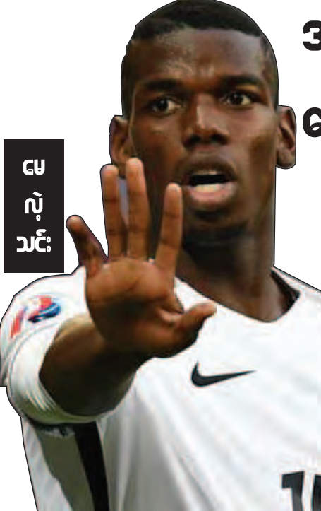
ဇေလုံသင်း