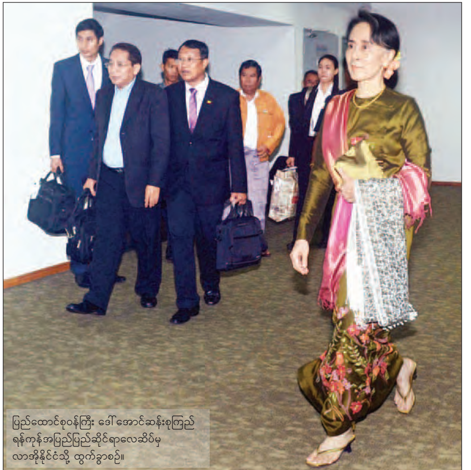
ပြည်ထောင်စုဝန်ကြီး ဒေါ်အောင်ဆန်းစုကြည် ရန်ကုန်အပြည်ပြည်ဆိုင်ရာလေဆိပ်မှ လာအိုနိုင်ငံသို့ ထွက်ခွာစဉ်။

ပြည်ထောင်စုဝန်ကြီး ဒေါ်အောင်ဆန်းစုကြည်သည် ယင်းနေ့တွင်ကျင်းပမည့် (၂၃)ကြိမ်မြောက် အာဆီယံဒေသ ဆိုင်ရာဖိုရမ်၏ ဝန်ကြီးအဆင့်မျက်နှာစုံညီအစည်းအဝေး နှင့် သီးသန့်အစည်းအဝေးသို့လည်း တက်ရောက်မည် ဖြစ်သည်။ အစည်းအဝေးသို့ အာဆီယံဒေသဆိုင်ရာဖိုရမ်မှ အဖွဲ့ဝင်နိုင်ငံ ၂၇ နိုင်ငံမှ နိုင်ငံခြားရေးဝန်ကြီးများ ပါဝင် တက်ရောက်မည်ဖြစ်ကြောင်း သိရသည်။ (သတင်းစဉ်)