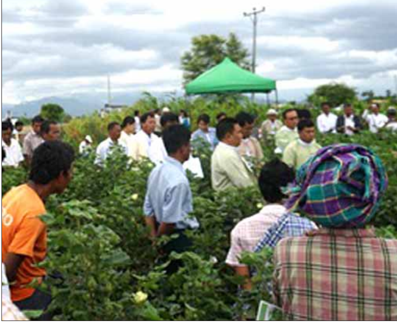
တွက်ခြေကိုက်သော သီးနှံဖြစ်ကြောင်း ရှင်းလင်း ဆွေးနွေးခဲ့ကြသည်။ ဝါစိုက်တောင်သူတစ်ဦးက မိမိတို့သည် ဝါကိုပိုမို စိုက်လိုကြောင်း၊ သို့သော်လည်း စိုက်ဘဏ်ချေးငွေ