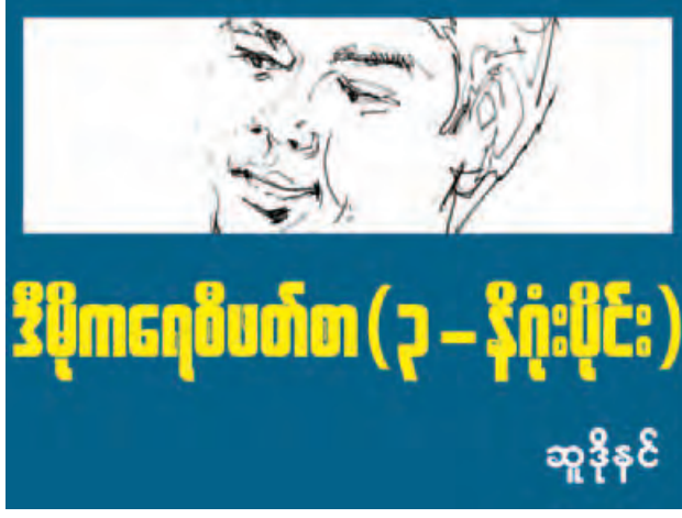
ဒီမိုကရေစီပတ်စ (၃ - နိဂုံးပိုင်း) သူဒိုနှင့်

“တခြားသူတွေဆိုတာ နိုင်ငံရေးမှာ ပါဝင် ပတ်သက်နေတဲ့ တခြားသူတွေကို ယုံကြည် ဖို့ပါပဲ။ တိုင်းပြည်ကို ကောင်းစေချင်တဲ့ စိတ် ငါတို့မှာရှိသလို သူတို့မှာလည်း ရှိတယ်ဆိုတာလောက်ကလေးကိုတော့ အဖျင်းဆုံး ယုံကြည်ထားဖို့ လိုတာပါ။”