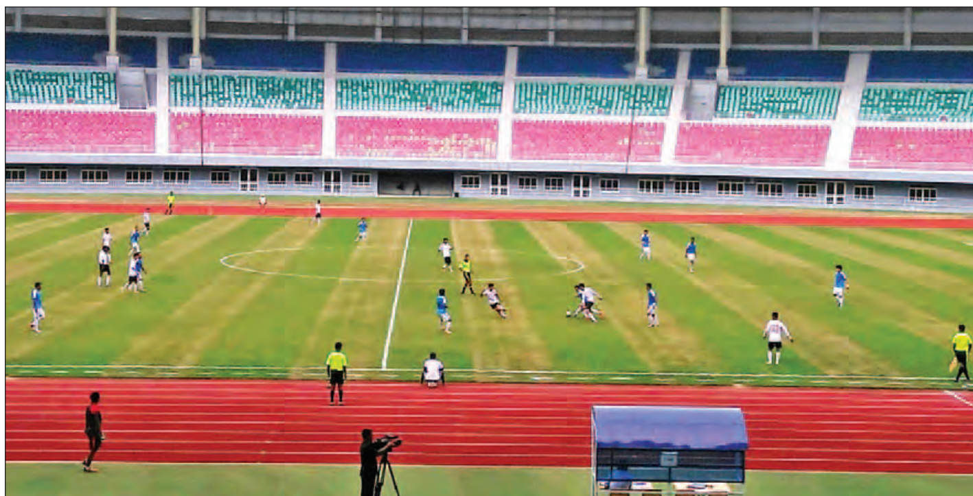
ပြန်ကြားရေးအသင်းနှင့် ဆောက်လုပ်ရေးအသင်းတို့ အကြိတ်အနယ်ယှဉ်ပြိုင်ကြစဉ်။

နေပြည်တော် ဇူလိုင် ၂၂ ၂၀၁၆ ခုနှစ် အဋ္ဌမအကြိမ်မြောက် နေပြည်တော် ဝန်ကြီးဌာနပေါင်းစုံ အမျိုးသားဘောလုံးပြိုင်ပွဲ အုပ်စုဒုတိယအဆင့်ပွဲစဉ်များကို ဆက်လက်ကျင်းပလျက်ရှိသည်။