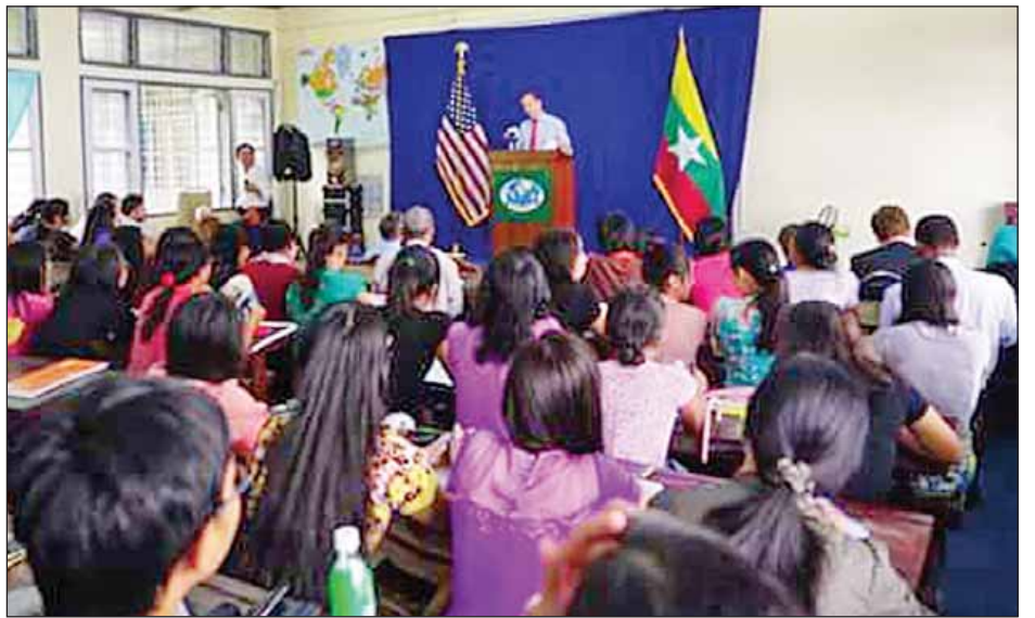
အမေရိကန်နိုင်ငံ အမျိုးသားလုံခြုံရေး ဒုတိယအကြံပေး မစ္စတာ ဘန်ဂျမင်ရှင်နှင့် ရန်ကုန်တက္ကသိုလ် နိုင်ငံတကာဆက်ဆံ ရေးဌာန ကျောင်းသားကျောင်းသူများ တွေ့ဆုံစဉ်။