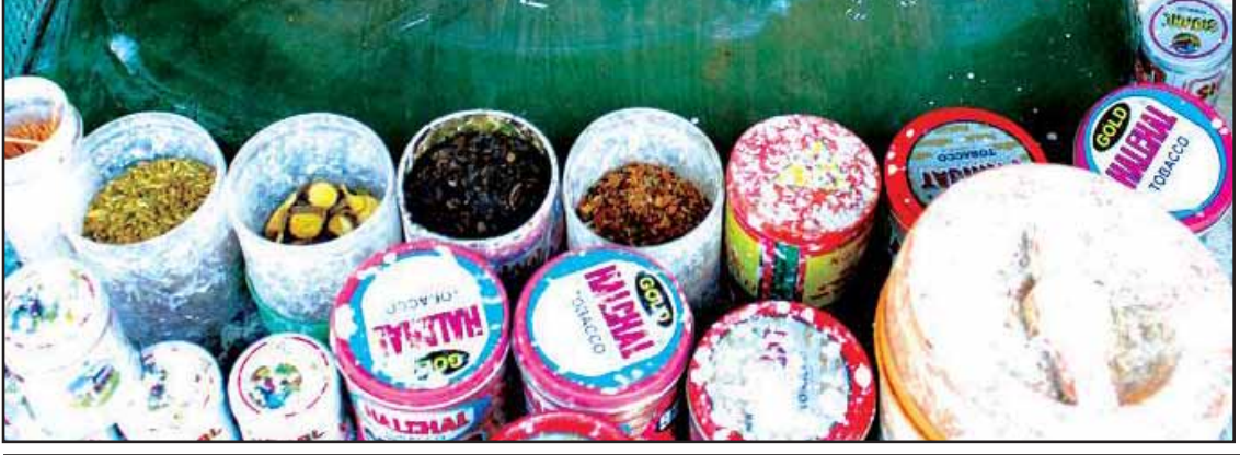
နည်းလမ်းမျိုးစုံဖြင့် တရားမဝင် ဝင်ရောက်လာသော ကွမ်းစားဆေးများအားတွေ့ရစဉ်။

American Tobacco ၏ Sustainability Report 2015 တွင် ဖော်ပြထားသည်။ မြန်မာနိုင်ငံ၏ တရားမဝင်မှောင်ခိုကူးသန်းရောင်းဝယ်မှုတွင် စီးကရက်များနှင့် အခြားဆေးရွက်ကြီးထွက် ပစ္စည်းများလည်း ပါဝင်လျက်ရှိရာ ဆေးရွက်ကြီးနှင့်ပြုလုပ်သည့် ကွမ်းစားဆေးများသည် ပြည်တွင်းတွင် နေရာအနှံ့ ကျယ်ကျယ်ပြန့်ပြန့်သုံးနေကြသည်ကို တွေ့ရသည်။ ယင်းနှင့် စပ်လျဉ်း၍ British American Tobacco(BAT) မြန်မာက မြန်မာနိုင်ငံမှာ ၂၀၁၃ ခုနှစ်ကစပြီး နှစ်နှစ်တာကာလအတွင်း နိုင်ငံတကာစံနှုန်းများနှင့်အညီ လုပ်ငန်းတွေကို ဆောင်ရွက်နိုင်ခဲ့ကြောင်း၊ စိုက်ပျိုးရေးကဏ္ဍ ဖွံ့ဖြိုးတိုးတက်လာစေရေး ပြုလုပ်နိုင်ခဲ့ပြီး အခွန်ငွေများကို ပြည့်ပြည့်ဝဝ ပေးဆောင်နိုင်ခဲ့သည့်အတွက် နိုင်ငံခြားရင်းနှီးမြှုပ်နှံမှုများနှင့် နိုင်ငံတော်ဝင်ငွေကိုလည်း တိုးမြှင့်စေခဲ့ကြောင်း၊ ဆေးလိပ်ထုတ်ကုန်များ၊ တရားမဝင် ကုန်သွယ်မှုဆိုင်ရာကိစ္စရပ်များနှင့်ဆိုင်ရာလူသိ အကျိုးဆက်များကိုလည်း အသိအမြင်များရရှိအောင် လုပ်ဆောင်ခဲ့ကြောင်း British American Tobacco (BAT)မှ မန်နေဂျင်ဒါရိုက်တာ Rehan Baig ၏ ပြောကြားချက်အရ သိရသည်။