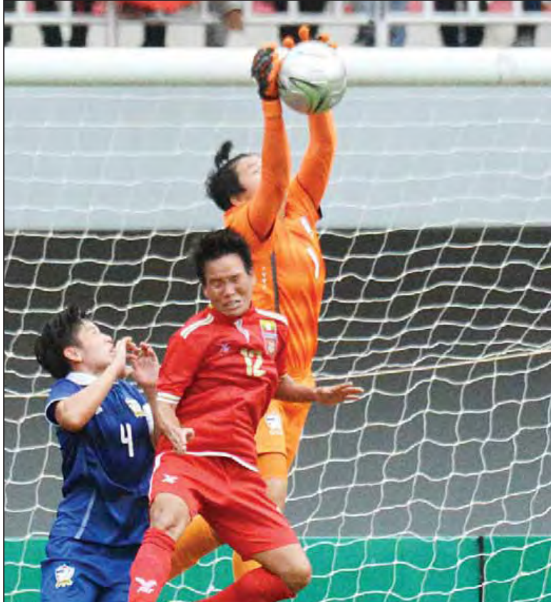
မြန်မာအသင်းနှင့် ထိုင်းအသင်း ခြေစမ်းကစားခဲ့ကြစဉ်။

၂၀၁၆ အာဆီယံ အမျိုးသမီးဘောလုံးပြိုင်ပွဲကို မြန်မာနိုင်ငံက အိမ်ရှင်အဖြစ် လက်ခံကျင်းပမည်ဖြစ်ပြီး ဇူလိုင် ၂၆ ရက်မှ ဩဂုတ် ၄ ရက်အထိ မန္တလေးမြို့ရှိ မန္တလေးသီရိကွင်း၌ ကျင်းပမည်ဖြစ်သည်။ မြန်မာနိုင်ငံအနေဖြင့် အာဆီယံ အဆင့်ပြိုင်ပွဲသုံးခုကို အိမ်ရှင်အဖြစ်လက်ခံကျင်းပမည်ဖြစ်ပြီး ဒုတိယမြောက် ပြိုင်ပွဲအဖြစ် ကျင်းပခြင်းဖြစ်သည်။ အာဆီယံအမျိုးသမီးပြိုင်ပွဲကို အသင်းရှစ်သင်း ဝင်ရောက်ယှဉ်ပြိုင်မည် ဖြစ်ပြီး အိမ်ရှင်မြန်မာအသင်းသည် အုပ်စု (ခ)တွင် ဩစတြေးလျ ယူ-၂၀၊ မလေးရှား၊ တီမောအသင်းတို့နှင့် အတူပါဝင်နေပြီး အုပ်စု(က)တွင် လက်ရှိ ချန်ပီယံ ထိုင်း၊ ဗီယက်နမ်၊ စင်ကာပူနှင့် ဖိလစ်ပိုင်အသင်းတို့ ပါဝင်လျက်ရှိသည်။ အုပ်စုစုစဉ်များကို ဇူလိုင် ၂၆ ရက်မှ ၃၁ ရက်ထိ တစ်နေ့လျှင် နှစ်ပွဲနှုန်းဖြင့် ကျင်းပမည်ဖြစ်ပြီး ဆီမီးဖိုင်နယ်ပွဲများကို ဩဂုတ် ၂ ရက်၊ တတိယနေရာလှည့်နှင့် ဗိုလ်လှည့်ကို ဩဂုတ် ၄ ရက်တွင် ကျင်းပမည်ဖြစ်သည်။ အိမ်ရှင်မြန်မာအမျိုးသမီးအသင်းသည် အုပ်စုစုစဉ်များအဖြစ် ဇူလိုင် ၂၇ ရက်တွင် တီမောအသင်း၊ ဇူလိုင် ၂၉ ရက်တွင် မလေးရှားအသင်း၊ ဇူလိုင် ၃၁ ရက်တွင် ဩစတြေးလျ ယူ-၂၀ အသင်းတို့နှင့် ယှဉ်ပြိုင်ရမည်ဖြစ်သည်။ မြန်မာအမျိုးသမီးအသင်းသည် ယင်းပြိုင်ပွဲယှဉ်ပြိုင်ရန်အတွက် စာမျက်နှာ ၉ ကော်လံ ၄ သို့ ○