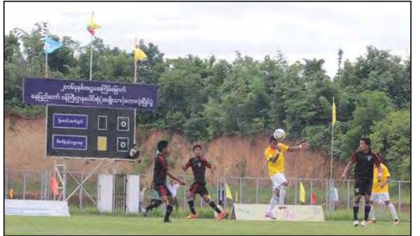
ပို့ဆောင်ရေးနှင့်ဆက်သွယ်ရေးဝန်ကြီးဌာနဘောလုံးအသင်းနှင့် စီမံကိန်းနှင့်ဘဏ္ဍာရေး ဝန်ကြီးဌာန ဘောလုံးအသင်းတို့ ယှဉ်ပြိုင်ကစားကြစဉ်။

ဇူလိုင် ၂၂ ရက် ပွဲစဉ်များအဖြစ် ညနေ ၃ နာရီခွဲတွင် အုပ်စု(ကက)မှ ကျန်းမာရေးနှင့် အားကစားဝန်ကြီးဌာန ဘောလုံးအသင်းနှင့် လူမှု ဝန်ထမ်း၊ ကယ်ဆယ်ရေးနှင့် ပြန်လည်နေရာချထားရေး