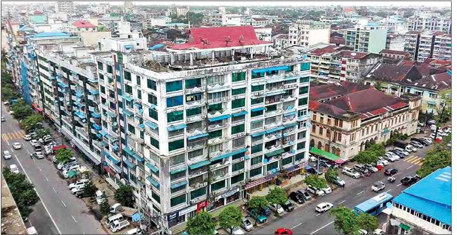
ရန်ကုန်မြို့ရှိ အထပ်မြင့်အဆောက်အအုံများကို တွေ့ရစဉ်။

ရန်ကုန်မြို့တော်အတွင်း အထပ်မြင့် အိမ်ရာစီမံကိန်းများ ရပ်ဆိုင်းထားရမှုနှင့်ပတ်သက်၍ ဆောက်လုပ်ရေးလုပ်ငန်းရှင်များအချင်းချင်း တွေ့ဆုံဆွေးနွေး၍ သတင်းစာရှင်းလင်းပွဲကို ရန်ကုန်မြို့ Novotel Hotel ၌ ယနေ့ မွန်းလွဲပိုင်းက ပြုလုပ်ခဲ့သည်။ ပြီးခဲ့သည့် မေ ၁၄ ရက်မှစတင်၍ ရန်ကုန်မြို့တော်၏ အထပ်မြင့် အိမ်ရာစီမံကိန်းများရပ်ဆိုင်းခဲ့ရသောကြောင့် ယခုအခါ ဆောက်လုပ်ရေးလုပ်ငန်းရှင်များအတွက် ဆုံးရှုံးမှုများဖြစ်ပေါ်ခဲ့ရပြီး လုပ်ငန်းများပြန်စတင်သောအခါအပြေများ မရှိတော့ဘဲ ၎င်းတို့၏ဆောက်လုပ်ရေးလုပ်ငန်းများမှ အင်ဂျင်နီယာများ၊ ဝန်ထမ်းများနှင့် အလုပ်သမားများအတွက်ပါ အလုပ်အကိုင် အခွင့်အလမ်းများ စိုးရိမ်စရာရှိနေသောကြောင့် ထိုကဲ့သို့ တွေ့ဆုံဆွေးနွေးမှုများ ပြုလုပ်ရခြင်းဖြစ်ကြောင်း ဆောက်လုပ်ရေးလုပ်ငန်းရှင်များ အသိုင်းအဝိုင်းမှ သိရသည်။