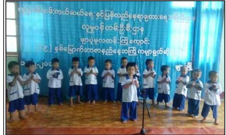
(၆၉) နှစ်မြောက် အာဇာနည်နေ့အကြို ကဗျာရွတ်ဆိုပြိုင်ပွဲကို ဇူလိုင် ၁၄ ရက်က လူမှုဝန်ထမ်း၊ ကယ်ဆယ်ရေးနှင့် ပြန်လည်နေရာချထားရေးဝန်ကြီးဌာန လူမှုဝန်ထမ်းဦးစီးဌာန ဖျာပုံမူလတန်း ကြိုကျောင်းကျင်းပစဉ်။ (ကြေးမုံ)