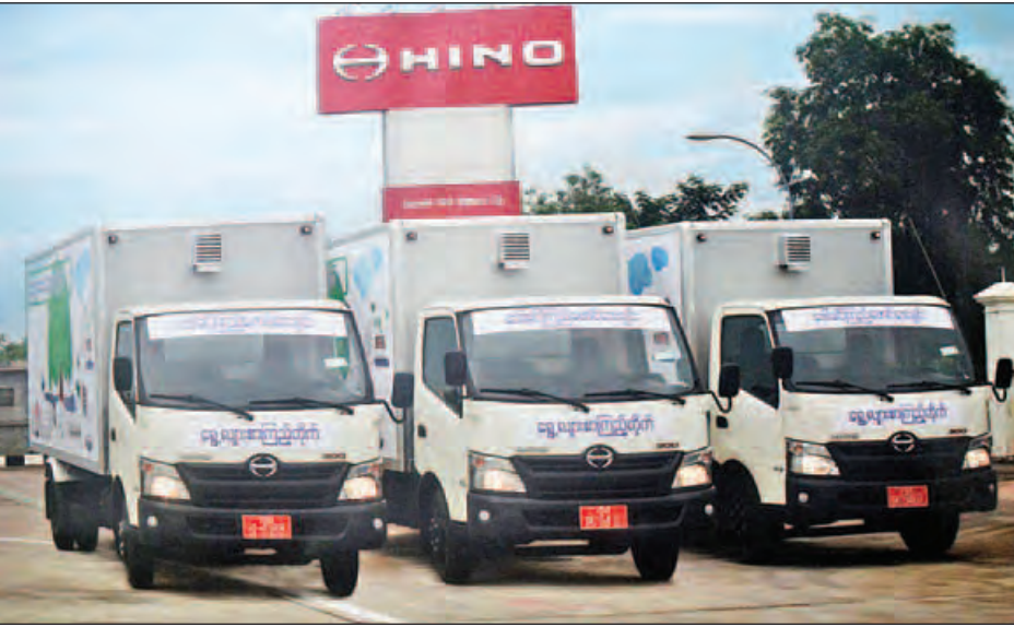
ဖြင့် ကော့မုန်းမြို့တွင် ရွေ့လျားစာကြည့်တိုက် စတင်ဖွင့်လှစ်နိုင်ခဲ့ပြီး ယခုအခါ ကော့မုန်းမြို့အပြင် နေပြည်တော်၊ ကလေး၊ နတ်မောက်နှင့် မြောင်းမြမြို့တို့တွင်လည်း ရွေ့လျားစာကြည့်တိုက်များကို တိုးချဲ့ဖွင့်လှစ်ဆောင်ရွက်လျက်ရှိရာ လက်ရှိကာလတွင် စာအုပ်ပေါင်း ခြောက်သောင်းခွဲကျော်ရှိပြီး စာဖတ်သူအသင်းဝင် လေးသောင်းခွဲကျော်ရှိကြောင်း သိရသည်။ “ကျွန်တော်တို့အနေနဲ့ အချိန် ၁၄ ရက်ကြာ ခရီးစဉ် ဆွဲထားတယ်။ သတ်မှတ်ရက်ထဲမှာ လမ်းမှာရှိတဲ့ နေရာ နှစ်နေရာကနေ သုံးနေရာအထိရပ်ပြီး ဆောင်ရွက်သွား

ရန်ကုန် ဇူလိုင် ၁၈ လူငယ်များ စာဖတ်ရရှိနိုင်စေရန်အတွက် ပြည်နယ်နှင့် တိုင်းဒေသကြီးအသီးသီးတွင် ရွေ့လျားစာကြည့်တိုက်များကို ထပ်မံ၍ တိုးချဲ့ဖွင့်လှစ်ရန် စီစဉ်နေကြောင်း ဒေါ်ခင်ကြည်ဖောင်ဒေးရှင်းမှ အလုပ်အမှုဆောင် အဖွဲ့ဝင် ဒေါက်တာသန်းသော်ကောင်းက ယနေ့ညနေပိုင်းတွင် ပြောသည်။ “ကျွန်တော်တို့နိုင်ငံမှာ စာဖတ်အားတွေတက်လာအောင် ရည်ရွယ်ပြီး ဒေါ်ခင်ကြည်ဖောင်ဒေးရှင်းက (Truck) ကားတွေနဲ့ ရွေ့လျားစာကြည့်တိုက်အဖြစ် ဖွင့်လှစ်ဆောင်ရွက်နေတယ်။ လောလောဆယ်အနေနဲ့ ကတော့ တစ်နိုင်လုံးမှာ ငါးနေရာဖွင့်နိုင်ပါပြီ။ အထူးသဖြင့် ကျောင်းသား လူငယ်တွေနဲ့ သွားလာရခက်တဲ့ဒေသတွေက ပြည်သူတွေ စာဖတ်အားကောင်းလာအောင် ရည်ရွယ်ပြီးဆောင်ရွက်နေတာပါ။ နောက်ထပ်လည်း တိုင်းဒေသကြီးနဲ့ ပြည်နယ်အသီးသီးမှာ ဖွင့်လှစ်သွားနိုင်ဖို့ စီစဉ်နေပါတယ်”ဟု ဒေါက်တာသန်းသော်ကောင်းက ပြောကြားသည်။ ဒေါ်ခင်ကြည်ဖောင်ဒေးရှင်းအနေဖြင့် လူငယ်များ စာဖတ်ရရှိနိုင်စေရန်အတွက် ၂၀၁၃ ခုနှစ် ဇူလိုင်လတွင် ဟီးနိုးကုမ္ပဏီက လှူဒါန်းခဲ့သည့် ရွေ့လျားစာကြည့်တိုက် (HINO TRUCK) ယာဉ် နှစ်စီး