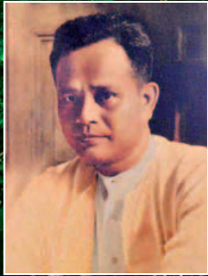
မန်းဘိုင်