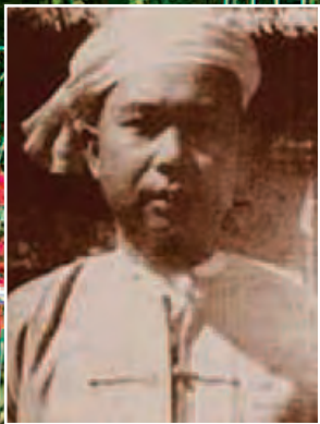
စင်စံထွန်း