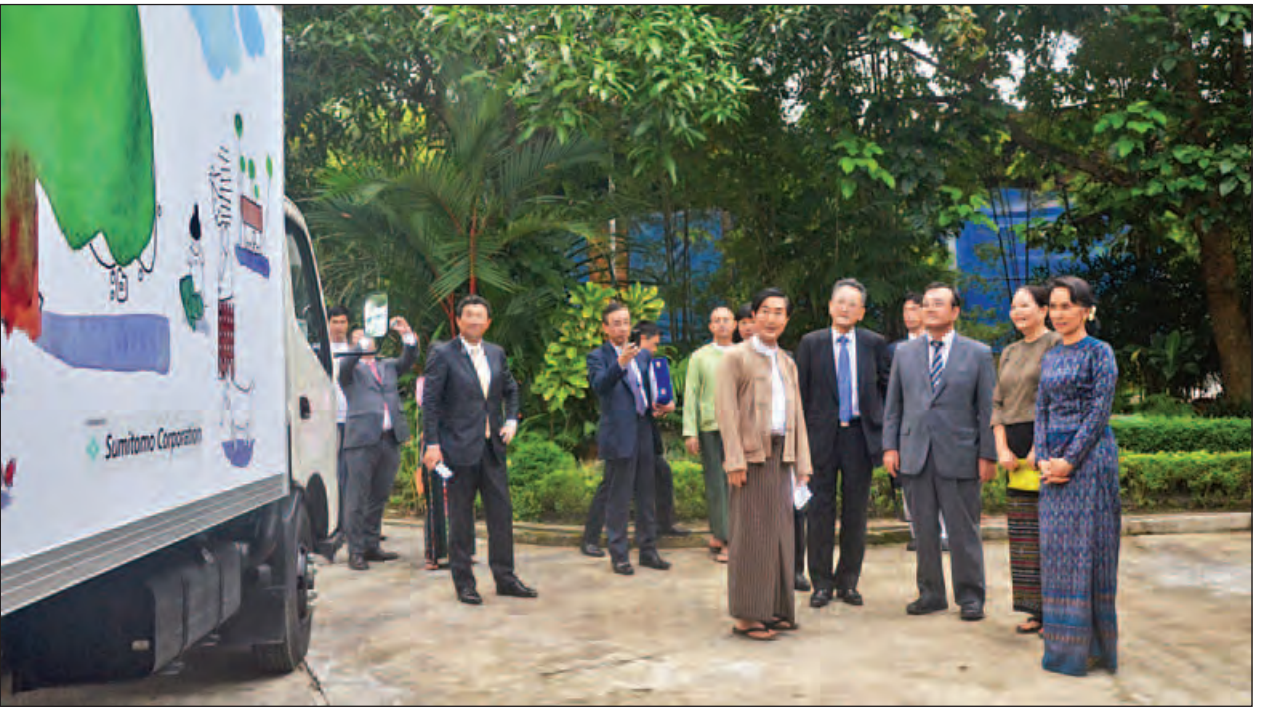
ရွေ့လျားစာကြည့်တိုက် အတွက် မော်တော်ယာဉ်နှစ်စီး လှူဒါန်းခဲ့ကြောင်း သိရသည်။ ဒေါ်ခင်ကြည်ဖောင်ဒေးရှင်းသည် ပြည်သူ့ထုတ် စာဖတ်အားမြှင့်တင် လာစေရန် ရည်ရွယ်ပြီး ရွေ့လျားစာကြည့်တိုက်များကို တိုင်းဒေသကြီးနှင့် ပြည်နယ်များတွင် ထားရှိရေး စီစဉ်ဆောင်ရွက်နေပြီး လက်ရှိတွင် မြို့ကြီး ငါးမြို့၌ မော်တော်ယာဉ် ရှစ်စီးဖြင့် ရွေ့လျားစာကြည့်တိုက် လုပ်ငန်းများကို ဆောင်ရွက်နေကြောင်း၊ ထို့အပြင် ဒေါ်ခင်ကြည် နိုင်ငံရန် သဘောတူလက်မှတ်ရေးထိုး ပူးပေါင်းပြီး စာကြည့်တိုက်လုပ်ငန်းများ အချိန်အဟုန်မြှင့် ဆောင်ရွက် နိုင်ရန် သဘောတူလက်မှတ်ရေးထိုး သွားမည်ဖြစ်ကြောင်းလည်း သိရသည်။ (သတင်းစဉ်)

ဖောင်ဒေးရှင်း သဘာပတိ နိုင်ငံတော်၏ အတိုင်ပင်ခံပုဂ္ဂိုလ်က မော်တော်ယာဉ်များ လှူဒါန်းခြင်းအတွက် ကျေးဇူးတင်စကား ပြန်လည်ပြောကြားသည်။ ယင်းနောက် နိုင်ငံတော်၏ အတိုင်ပင်ခံပုဂ္ဂိုလ် ဒေါ်အောင်ဆန်းစုကြည်က CEO Mr. Masao Sekiuchi အား ဒေါ်ခင်ကြည်ဖောင်ဒေးရှင်းအမှတ်တရ ဂုဏ်ပြုမှတ်တမ်းလွှာ ပေးအပ်သည်။ ဆက်လက်၍ နိုင်ငံတော်၏ အတိုင်ပင်ခံပုဂ္ဂိုလ် ဒေါ်အောင်ဆန်းစုကြည်သည် Sumitomo Corporation Asia & Oceania Pte. Ltd. က လှူဒါန်းသည့် ရွေ့လျားစာကြည့်တိုက်မော်တော်ယာဉ်အား လှည့်လည်ကြည့်ရှုသည်။ ယနေ့ ဒေါ်ခင်ကြည်ဖောင်ဒေးရှင်း ရွေ့လျားစာကြည့်တိုက် အတွက် Sumitomo Corporation Asia & Oceania Pte. Ltd. က လှူဒါန်းသည့် မော်တော်ယာဉ်များသည် တစ်စီးလျှင် အမေရိကန်ဒေါ်လာ ခုနစ်သောင်းခန့် တန်ဖိုးရှိကြောင်း၊ ယခင် ၂၀၁၃ ခုနှစ်ကလည်း ဟီးနိုးကုမ္ပဏီအနေဖြင့်