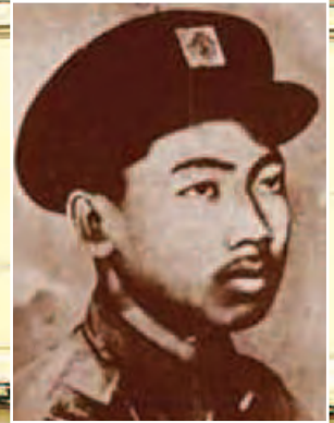
ရဲဘော်ကိုထွေး