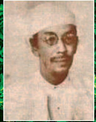
ဒီးဒုတ်ဦးဘချို