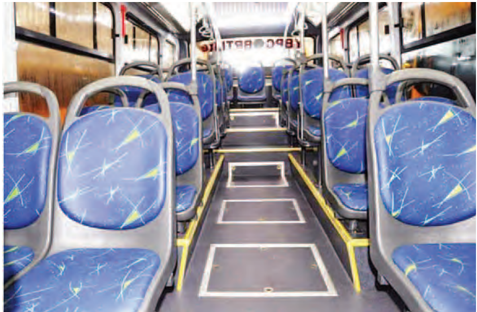
လည်း ကနဦး စတင်အကောင်အထည်ဖော်သည့်အနေဖြင့် ပြေးဆွဲအကောင်အထည်ဖော်သွားရန် သက်ဆိုင်ရာက BRT Lite စနစ်ကို ယာဉ်အစီးရေ ၆၅ စီးဖြင့် အကောင်စီစဉ်လျက်ရှိကြောင်း သိရသည်။ အခြားသော ယာဉ်လိုင်းများတွင်လည်း အဆိုပါ အများပိုင်စနစ်ကဲ့သို့ သတင်း-၀၀၀

ရန်ကုန်မြို့တွင် BRT Lite စနစ်ဖြင့် ယာဉ်လိုင်းပြေးဆွဲရန် ရန်ကုန်ဘတ်စ်ကား အများပိုင်ကုမ္ပဏီလီမိတက်ကို နိုင်ငံတော်အစိုးရ၏ ထည့်ဝင်ငွေ၊ ပုဂ္ဂလိက လုပ်ငန်းရှင်ကြီးများ၏ ထည့်ဝင်ငွေနှင့် အများပြည်သူများထံသို့ ရောင်းချထားသည့် အစုရှယ်ယာထည့်ဝင်ငွေများဖြင့် အများပိုင်ကုမ္ပဏီထူထောင်ကာ အများပြည်သူသယ်ယူပို့ဆောင်ရေးလုပ်ငန်းဆောင်ရွက်သွားမည်ဖြစ်သည်။ နိုင်ငံတကာတွင် ဆောင်ရွက်နေသည့် BRT စနစ် ပီပီပြင်ပြင် အကောင်အထည်ဖော်နိုင်ခြင်းမရှိသေးသော်