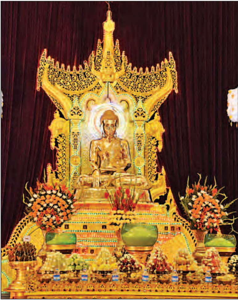
နိုင်ငံတော်၏အတိုင်ပင်ခံပုဂ္ဂိုလ် ဒေါ်အောင်ဆန်းစုကြည် နေပြည်တော် ဥပ္ပါတသန္နိဓေတီတော် သာသနာ့ဗိမာန်တော်အတွင်းရှိ ဗုဒ္ဓရုပ်ပွားတော်မြတ်အား ဆွမ်း၊ သစ်သီး၊ ပန်း၊ ရေချမ်း၊ ဆီမီးတို့ ကပ်လှူပူဇော်စဉ်။ (သတင်းစဉ်)

□ ကျောပိုးမှ နိုင်ငံတော်သံယမဟာနာယကအဖွဲ့ ဒုတိယဥက္ကဋ္ဌ ဆင်ဖြူကျွန်း ဆရာတော် ဘဒ္ဒန္တဉာဏိန္ဒထံ လည်းကောင်း၊ အမျိုးသားလွှတ်တော် ဥက္ကဋ္ဌ၏ဇနီး ဒေါ်နန်းကြင်ကြည်က နိုင်ငံတော်သံယမဟာနာယက အဖွဲ့ ဒုတိယဥက္ကဋ္ဌ ဆင်မင်းဆရာတော် ဘဒ္ဒန္တဩဘာသဘိဝံသ ထံလည်းကောင်း၊ ပြည်ထောင်စုတရားသူကြီးချုပ် ဦးထွန်းထွန်းဦးက နိုင်ငံတော်သံယမဟာနာယကအဖွဲ့ ဒုတိယဥက္ကဋ္ဌ ရေဦးဆရာတော် ဘဒ္ဒန္တဥက္ကမဉာဘိဝံသထံ လည်းကောင်း၊ တပ်မတော်