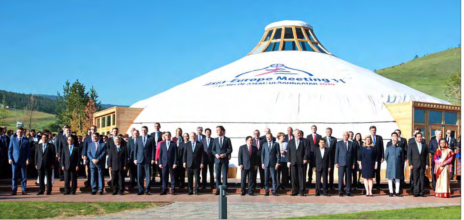
နိုင်ငံတော်သမ္မတဦးထင်ကျော် အာရှ-ဥရောပနိုင်ငံများမှ ခေါင်းဆောင်များနှင့်အတူ အေအမ်အီလာရှီ မွန်ဂိုလီးယားနိုင်ငံတွင် ရှေ့မှတ်တမ်းတင်စုပေါင်းဓာတ်ပုံရိုက်ကြစဉ်။ (သတင်းစဉ်)