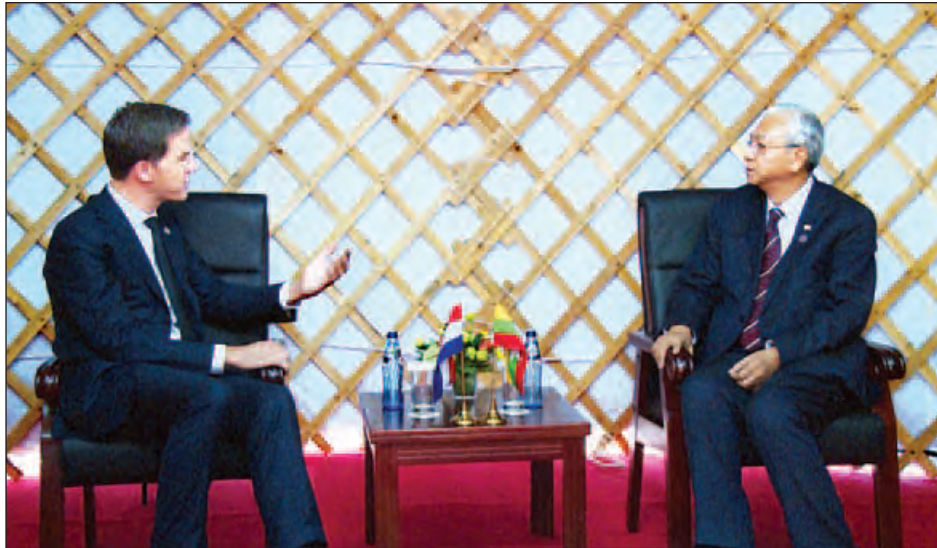
နိုင်ငံတော်သမ္မတ ဦးထင်ကျော် နယ်သာလန်နိုင်ငံ ဝန်ကြီးချုပ် မက်ရူတာနှင့် တွေ့ဆုံဆွေးနွေးစဉ်။