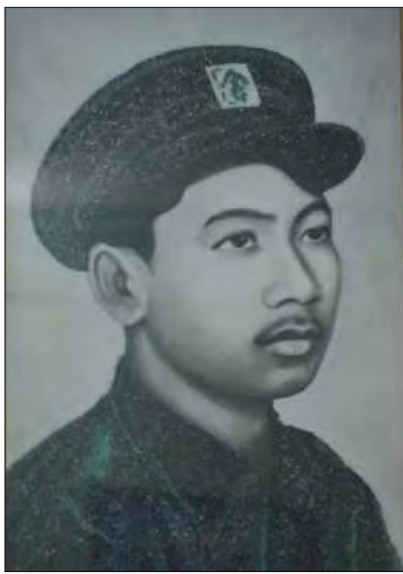
အာဇာနည်ခေါင်းဆောင် ရဲဘော်ကိုထွေး။

ရဲဘော်ကိုထွေး ကျဆုံးခဲ့ရပုံမှာလည်း ကြေကွဲဝမ်းနည်းဖွယ်ရာကောင်းလှသည်။ အာဇာနည်ခေါင်းဆောင်ကြီးများအား မသမာသူလူတစ်စုက အစည်းအဝေးခန်းမကြီးအတွင်း ဝင်ရောက်လုပ်ကြံပြီးနောက် ပြန်အထွက်တွင် လုပ်ကြံမှုတွင်ပါဝင်သူတစ်ဦး (ရန်ကြီးအောင်)က စက်သေနတ်ဖြင့် ပစ်လိုက်သည့်အတွက် ရဲဘော်ကိုထွေးမှာ ဒဏ်ရာရခဲ့ပြီး ချက်ချင်းသေဆုံးခြင်းမရှိသော်လည်း ယင်းနေ့ မွန်းလွဲ ၂ နာရီ ၁၅ မိနစ်ခန့်တွင် ဆေးရုံ၌ သေဆုံးသွားကြောင်း သိရသည်။ “ရဲဘော်ကိုထွေးက ဦးရာဇတ်ရဲ့ သက်တော်စောင့်ဖြစ်တဲ့အချိန် သူ့အစ်မ ဒေါ်ကြည်ကြည်ကလေး အိမ်(၃၁ လမ်း အောက်ဘလောက် အမှတ် ၇၂) မှာ နေထိုင်ပြီး တာဝန်ထမ်းဆောင်ခဲ့ရတာပါ။ ကျန်တဲ့မောင်နှမတွေနဲ့ မိဘတွေကတော့ မန္တလေးမှာနေပါတယ်။ လုပ်ကြံခံရတဲ့ သတင်းကိုကြားတော့ အဲဒီအိမ်မရဲ့ယောက်ျား ဦးစောဖေက ဆေးရုံကိုရောက်သွားခဲ့တယ်။ ဆေးရုံရောက်တော့ သူ့ကိုကြည့်ပြီး ရဲဘော်ကိုထွေးက ပြုံးနေတယ်။ စကားတော့ မပြောနိုင်တော့ပါဘူး။ ဒဏ်ရာရထားခဲ့ပေမယ့် ညည်းညူမနေပါဘူး။ ကျေနပ်နေပုံရနေတယ်လို့ သိခဲ့ရပါတယ်” ဟု ၎င်းက ဆိုသည်။ ဆက်လက်၍ “ရဲဘော်ကိုထွေးဆိုလို့ တပ်သားလေး