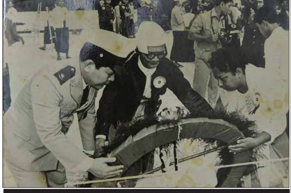
၁၉၉၅ အာဇာနည်ခေါင်းဆောင် ရဲဘော်ကိုထွေး၏ အစ်ကို ဦးသာချိုနှင့် မိသားစုဝင်များ ပန်းခွေချစဉ်။

လုပ်ငန်းများချပေးခြင်း၊ BOC ရေနံကုမ္ပဏီကလည်း ဓာတ်ဆီအရောင်းဆိုင် တစ်ဆိုင်စီဖွင့်လှစ်ပေးခြင်းများ ပြုလုပ်ပေးခဲ့သော်လည်း ရဲဘော်ကိုထွေး၏ မိသားစုဝင်များအနေဖြင့် အာဇာနည်များ ကျဆုံးပြီးချိန်တွင် အစိုးရကပေးသည့် ထောက်ပံ့ကြေးငွေတစ်မျိုးသာ ရရှိခဲ့ကြောင်း ဦးအောင်ကိုကိုက ပြောကြားချက်အရ သိရသည်။ ယခင်က အာဇာနည်နေ့ အခမ်းအနားကျင်းပရာတွင် နိုင်ငံတော်အကြီးအကဲအဆင့် တက်ရောက်ခဲ့ကြသော်လည်း ၁၉၈၇ ခုနှစ် အာဇာနည်မိသားစုခွဲခွဲချိမ်း နောက်ပိုင်းမှစတင်၍ အာဇာနည်နေ့ အခမ်းအနားကျင်းပရာသို့ ဝန်ကြီး၊ ဒုဝန်ကြီးနှင့် မြို့တော်ဝန်အဆင့်တို့သာ တက်ရောက်လေ့ရှိပြီး သမ္မတဦးသိန်းစိန် လက်ထက်တွင် ဒုတိယသမ္မတအဆင့်အထိ ပြန်လည်တက်ရောက်လာခဲ့ကြောင်း ခေတ်အဆက်ဆက် အာဇာနည်နေ့အခမ်းအနားကျင်းပခဲ့မှုနှင့်ပတ်သက်၍ ၎င်းက ပြောသည်။ “အခုဆိုရင် အာဇာနည်မိသားစုကို အရင်တုန်းက ပုံစံအတိုင်း ရာနှုန်းပြည့် အကြီးစားပြင်ဆင်မွမ်းမံမှုတွေ လုပ်နေတယ်လို့ ကြားနေရတယ်။ ဒီနှစ်ရဲ့ အာဇာနည်နေ့ အခမ်းအနားကတော့ အရင်နှစ်တွေထက် ထူးခြားပြီး ပြည်သူတွေမျှော်လင့်နေတဲ့ပုံစံမျိုး ဖြစ်လာလိမ့်မယ်လို့မြင်ပါတယ်” ဟု အစိုးရသစ်လက်ထက် အာဇာနည်နေ့ အခမ်းအနားကျင်းပရန် ပြင်ဆင်မှုများ ပြုလုပ်နေသည့် အပေါ် သူ၏ အမြင်ကိုပြောသည်။ ရဲဘော် ကိုထွေးသည် အသက်(၁၈) နှစ်အရွယ်တွင် ကျဆုံးခဲ့၍ ကျဆုံးချိန်တွင် မိဘနှစ်ပါးနှင့်အတူ ၎င်း၏ အစ်ကို သုံးဦးနှင့် အစ်မနှစ်ဦးရှိကျန်ရှိခဲ့သော်လည်း ယခုအချိန်တွင် အားလုံးဆုံးပါးသွားခဲ့ပြီး တူ၊ တူမ တော်စပ်သူများသာ ရန်ကုန်မြို့နှင့် မန္တလေးမြို့တို့တွင် နေထိုင်လျက်ရှိကြောင်း သိရသည်။ ။