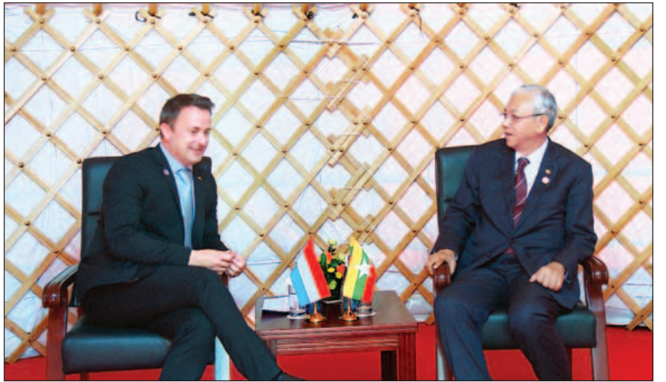
နိုင်ငံတော်သမ္မတ ဦးထင်ကျော် လူဇင်ဘတ်နိုင်ငံ ဝန်ကြီးချုပ် ဇေဗီးယား ဘက်တယ်လ်နှင့် တွေ့ဆုံဆွေးနွေးစဉ်။