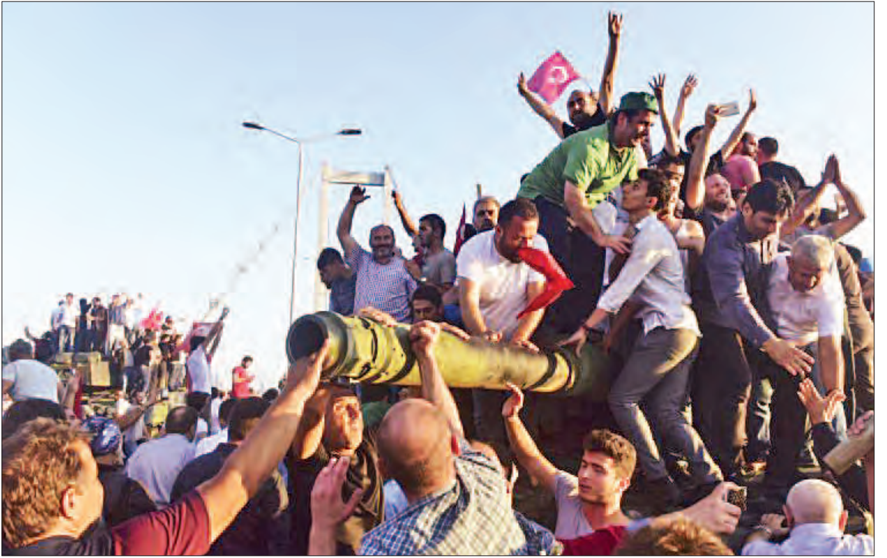
သမ္မတအယ်ဒိုဂ်က အာဏာသိမ်းပိုက်မှု၏ အရင်းအမြစ်ကို သေချာစုံစမ်းစစ်ဆေးမည်ဖြစ်ပြီး အလားတူဖြစ်ရပ်မျိုး နောက်ထပ်မပေါ်ပေါက်စေရန် ကြိုးပမ်းမည်ဖြစ်သည်ဟု ပြည်သူများအားကတိပေးပြောကြားခဲ့သည်။ အင်န်အိတ်ချ်ကေ။

အဆိုပါ အာဏာသိမ်းပိုက်ရန်ကြိုးပမ်းမှုဖြစ်စဉ်ကို ဘာသာရေးခေါင်းဆောင် ဖီသုလာရှ် ဂုလ်နီ၏နောက်လိုက်များက ကြိုးကိုင်ဆောင်ရွက်ခဲ့ခြင်းဖြစ်သည်ဟု ဝန်ကြီးချုပ်ကဆက်လက်ပြောသည်။