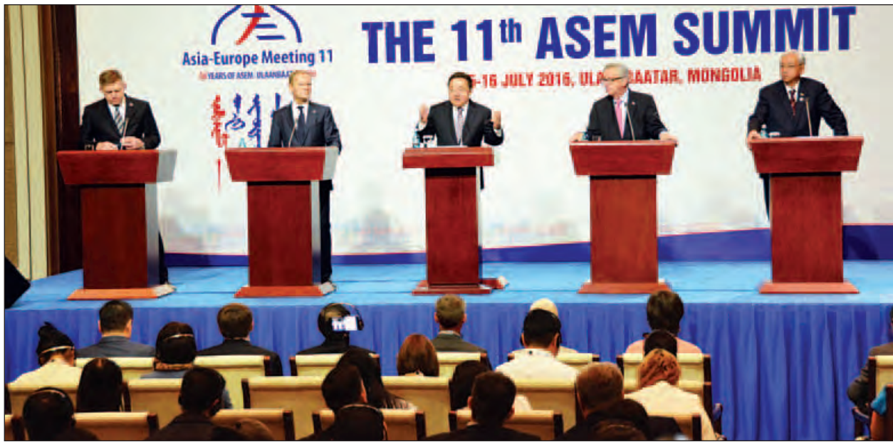
အာရှ-ဥရောပ ထိပ်သီးအစည်းအဝေး(အေအမ်ပီ)၏ သတင်းစာရှင်းလင်းပွဲကျင်းပစဉ်။ (သတင်းစဉ်)

ရေပန်း လူငယ်ရေးရာဆိုင်ရာဆွေးနွေးပွဲများလည်း ကျင်းပနိုင်ခဲ့ပါကြောင်း၊ မွန်ဂိုလီးယား နိုင်ငံ၏ငြိမ်းချမ်းသော၊ ယဉ်ကျေးမှုကို ကိုယ်စားပြုသော "Naadam" ယဉ်ကျေးမှု ပွဲတော်ကို ဥရောပနှင့် အာရှနိုင်ငံများမှ ကိုယ်စားလှယ်များ၊ ခေါင်းဆောင် များကိုပြသရသည့်အတွက် များစွာကျေနပ်မိပါကြောင်း ပြောကြားခဲ့သည်။ နိုင်ငံတော်သမ္မတ ဦးထင်ကျော်က (၁၁)ကြိမ်မြောက် အာရှ-ဥရောပ ထိပ်သီးအစည်းအဝေးသို့ အာရှဘက်မှ အာဆီယံအထွေထွေအတွင်းရေးမှူးချုပ် အပါအဝင် ၂၁ ဦး၊ ဥရောပဘက်မှ ၃၁ ဦး ကိုယ်စားပြုတက်ရောက်ခဲ့ပါ ကြောင်း၊ ထိပ်သီးအစည်းအဝေး၏ ယမန်နေ့နှင့် ယနေ့တွင် မိမိတို့အနေဖြင့် အကျိုးရှိသောဆွေးနွေးမှုများပြုလုပ်နိုင်ခဲ့ပါကြောင်း၊ နှစ်ရက်တာ ထိပ်သီး အစည်းအဝေးတွင် တရားဝင်ဆွေးနွေးပွဲများနှင့် တရားဝင် မသတ်မှတ်ထားသော