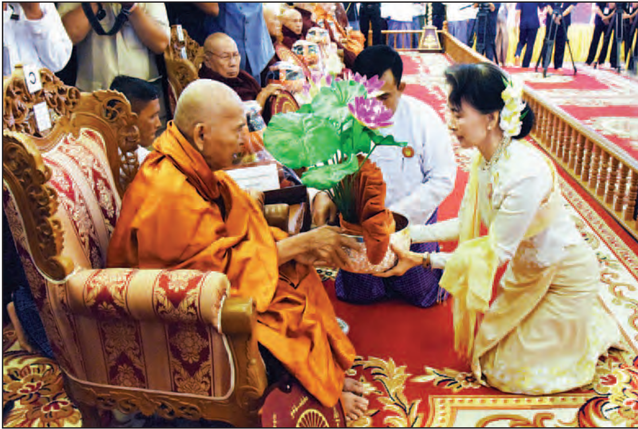
နိုင်ငံတော်၏အတိုင်ပင်ခံပုဂ္ဂိုလ် ဒေါ်အောင်ဆန်းစုကြည် မန္တလေးမြို့၊ ဗန်းမော်ကျောင်းတိုက် ဆရာတော်ထံ ဝါဆိုသင်္ကန်းဆက်ကပ်လှူဒါန်းစဉ်။ (သတင်းစဉ်)