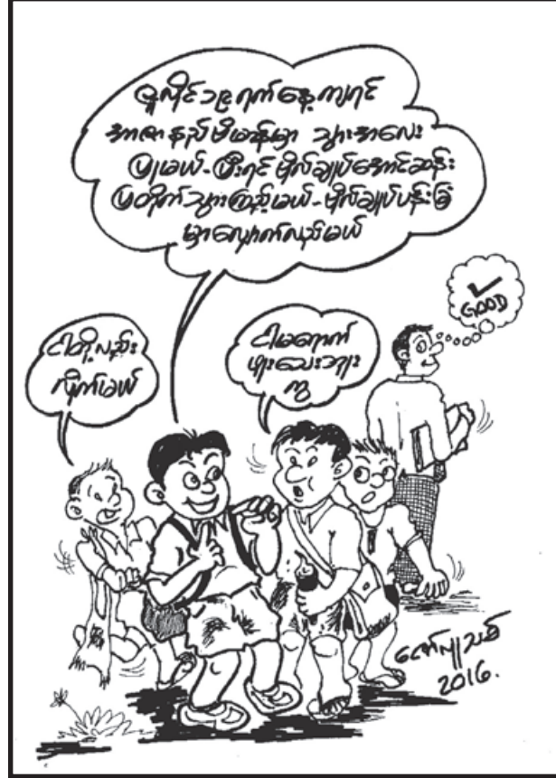
မောင်စေအောင်