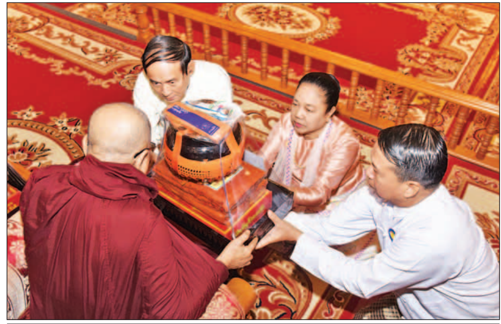
ပြည်သူ့လွှတ်တော်ဥက္ကဋ္ဌ ဦးဝင်းမြင့်နှင့်ဇနီး ဒေါ်ချိုချိုတို့ နိုင်ငံတော်သံယမဟာနာယကအဖွဲ့ ဒုတိယဥက္ကဋ္ဌ ဆင်ဖြူကျွန်းဆရာတော်ထံ ဝါဆိုသင်္ကန်းနှင့် လှူဖွယ်ပစ္စည်းများ ဆက်ကပ်လှူဒါန်းစဉ်။ (သတင်းစဉ်)