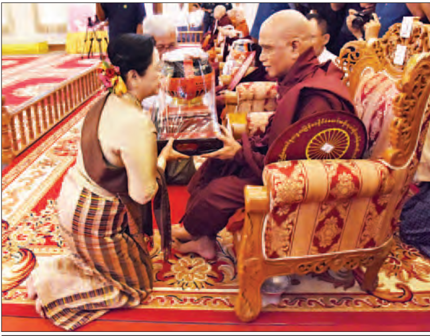
နိုင်ငံတော်သမ္မတ၏ဇနီး ဒေါ်စုစုလွင် နိုင်ငံတော်သံယမဟာနာယကအဖွဲ့ အကျိုးတော်ဆောင် မင်းကျောင်း ဆရာတော်ထံ ဝါဆိုသင်္ကန်းနှင့် လှူဖွယ်ပစ္စည်းများ ဆက်ကပ်လှူဒါန်းစဉ်။ (သတင်းစဉ်)