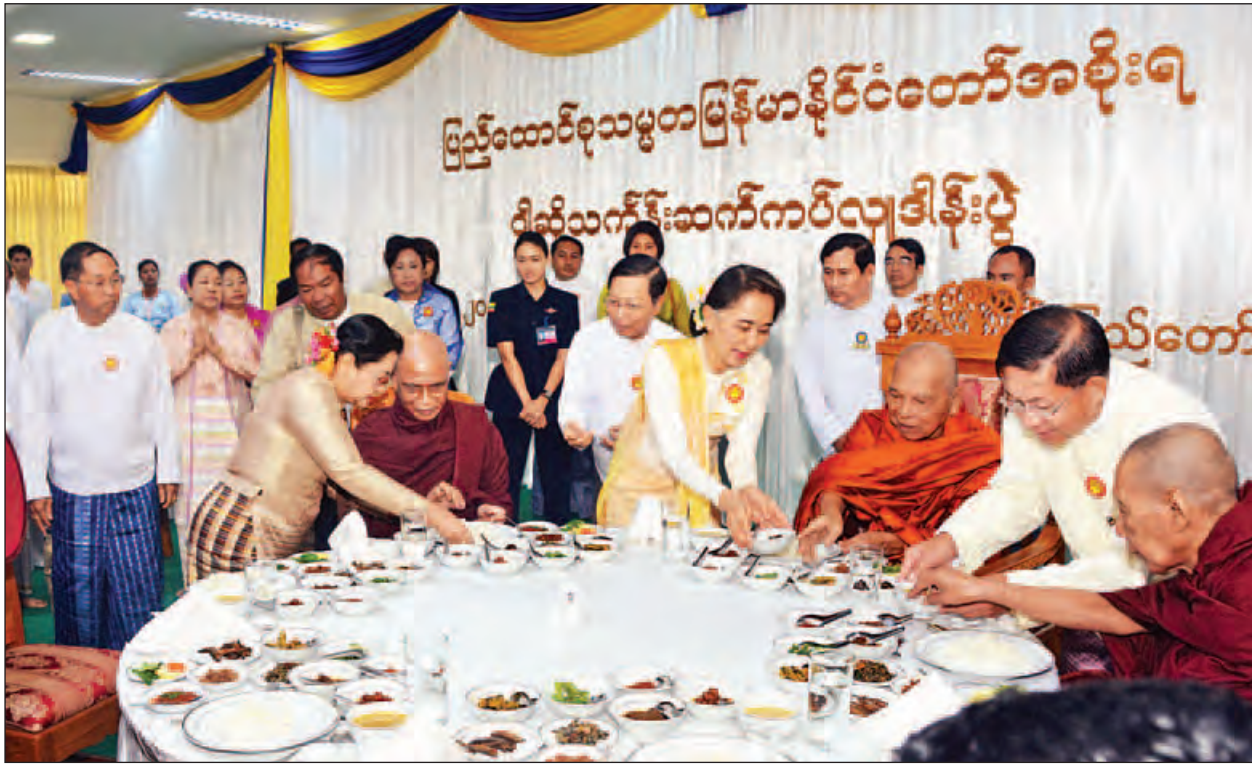
နိုင်ငံတော်၏အတိုင်ပင်ခံပုဂ္ဂိုလ် ဒေါ်အောင်ဆန်းစုကြည်နှင့် ဧည့်ပရိသတ်များက ဆရာတော်၊ သံဃာတော်များအား နေ့ဆွမ်း ဆက်ကပ်လှူဒါန်းကြစဉ်။ (သတင်းစဉ်)