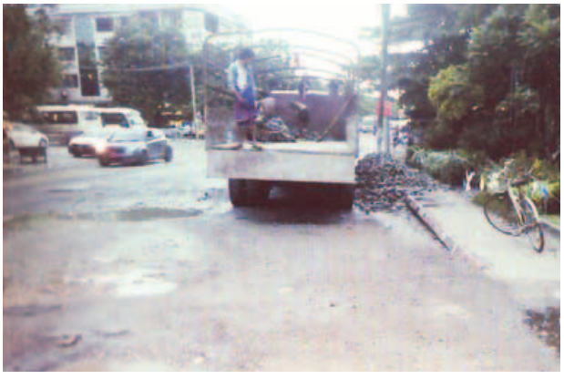
ပွဲရုံဝင်းအဝင် ကုံကော်လမ်းမထိပ်တွင် လမ်းထက်ဝက်နီးပါး ချိုင့်ခွက်ကြီး၊ ချိုင့်ခွက်ငယ်များဖြစ်ပေါ်နေပြီး ကျန်လမ်းတစ်ဖက်အစွန်တွင်လည်း ရေအိုင်ဖြစ်နေရာ လမ်းလယ်တွင်

ရန်ကုန်-သန်လျင်တံတား အမှတ်(၁) ချဉ်းကပ်လမ်းများတွင် ချိုင့်ခွက်များ ဖြစ်ပေါ်ပြီး လမ်းပျက်စီးမှုများနေသကဲ့သို့ ဘုရင့်နောင်ပွဲရုံဝင်းတံတားအောက်လွှာ၏ မြို့ထဲမှလာသော ယာဉ်ကြောပေါ်တွင် တံတားအတက်၊ အဆင်း နှစ်ဖက်စလုံး ချိုင့်ကြီးများ ရှိနေသည်။ ဘုရင့်နောင်ပွဲရုံဝင်းအဝင်၊ အထွက် အဓိကလမ်းမကြီး လေးလမ်းအနက် ကုံကော်လမ်းနှင့် ယင်းမာလမ်းတို့တွင်လည်း ချိုင့်ခွက်ငယ်များ များပြားနေဆဲဖြစ်ရာ ကားလမ်းပေါ် မြတ်သနားသွားလာနေသော ယာဉ်မျိုးစုံအခက်အခဲ ကြုံတွေ့နေရသည်ဟု ကျန်တင်ယာဉ်မောင်းမှားက ဆိုသည်။ ပွဲရုံဝင်းရှိ အဓိကလမ်းမကြီးများကို နိုင်ငံပိုင်ငွေ အလုံးအရင်းဖြင့် ပြုပြင်ပေးခဲ့သည်။ ၂၀၁၅ ခုနှစ် ဒီဇင်ဘာလကုန်ပိုင်းတွင် စက်အား၊ လူအားဖြင့် ထပ်ပိုးကတ္တရာခင်း ပြုပြင်ခဲ့သော ကုံကော်လမ်းမကြီးသည် နှစ်ဝက်ခန့် အကြာတွင် ပျက်စီးမှုများ ရှိလာသည်။