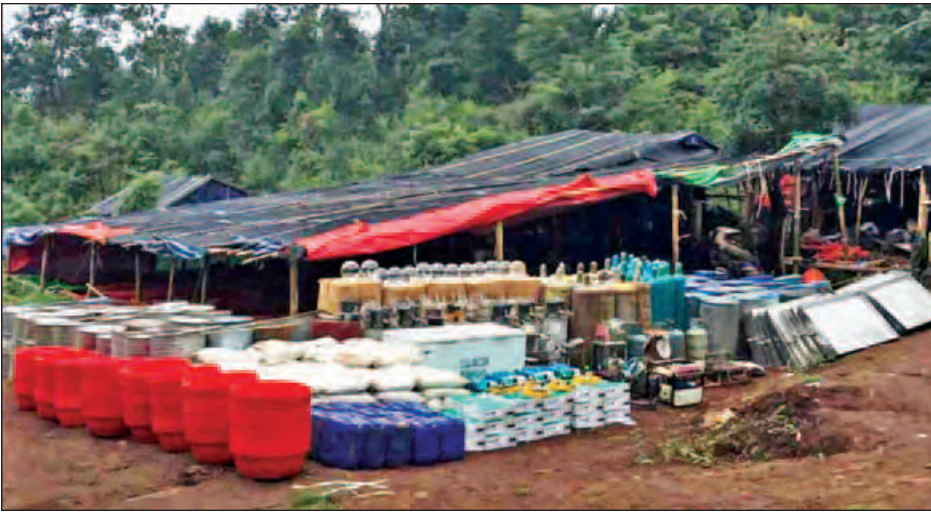
ဘိန်းချက်စခန်း၌ မူးယစ်ဆေးဝါးချက်လုပ်ရာတွင် အသုံးပြုသည့် ဓာတုပစ္စည်းများနှင့် ဆက်စပ်ပစ္စည်းများကို တွေ့မြင်ရစဉ်။