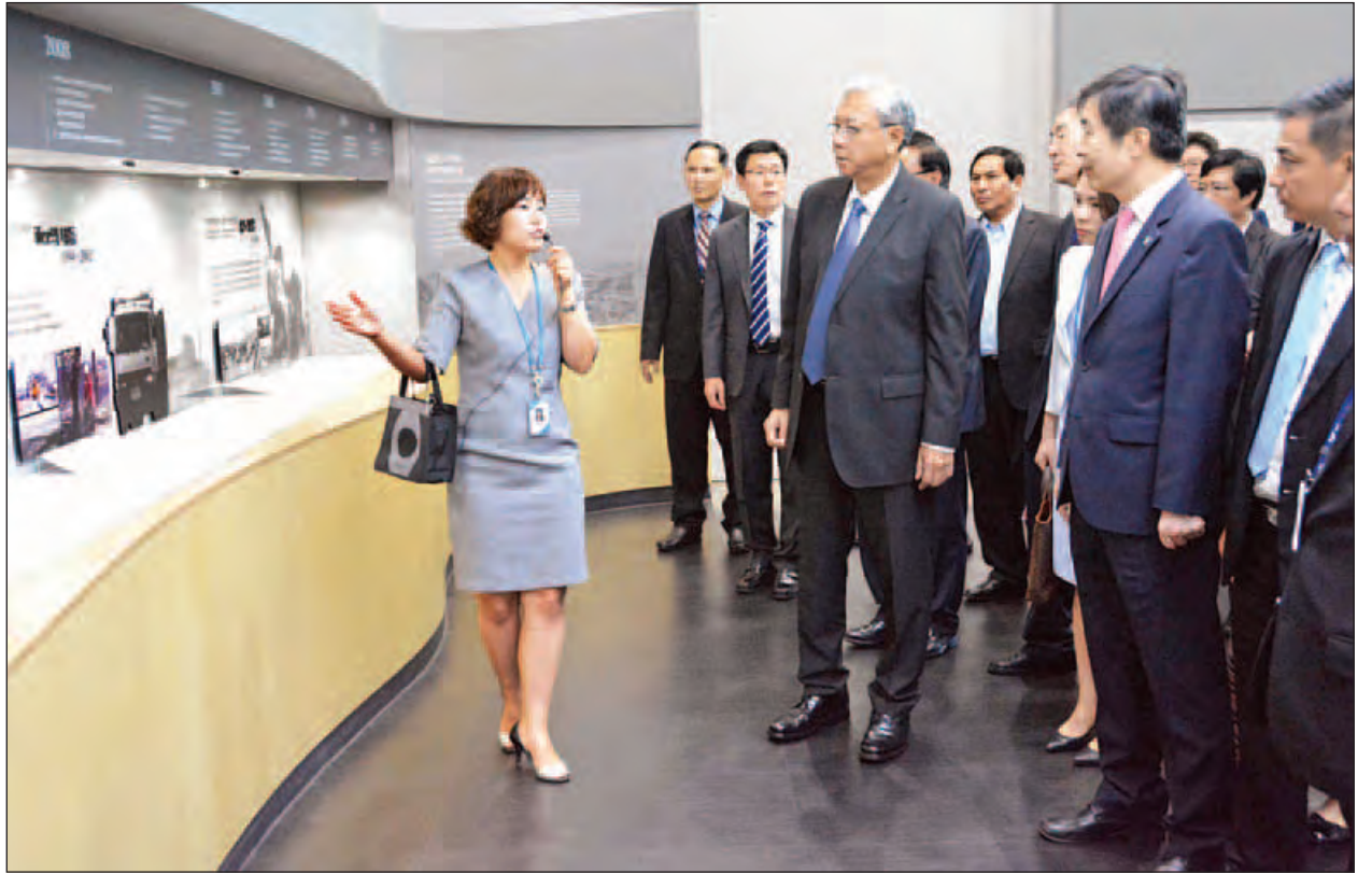
အင်ချွန်းအထူးစီးပွားရေးဇုန်ရှိ ဆုံးဒိုဂီတာဝါ၌ နိုင်ငံတော်သမ္မတ ဦးထင်ကျော် ကြည့်ရှုလေ့လာစဉ်။