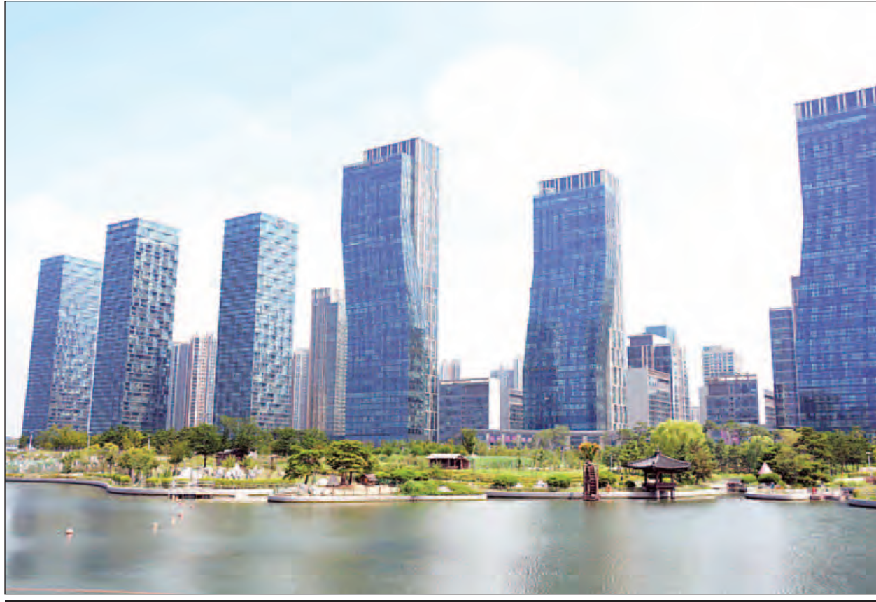
ဆုံးစိုးအပြည်ပြည်ဆိုင်ရာ စီးပွားရေးမြို့တော်အား တွေ့မြင်ရစဉ်။ (ဇေသုရ-သတင်းစဉ်)