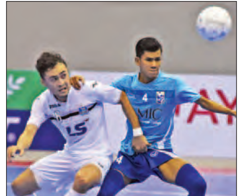
အမျိုးသားပြိုင်ပွဲ MIC (မြန်မာ)နှင့် ထိုင်ဆွန်နမ် (ဗီယက်နမ်)တို့ ယှဉ်ပြိုင်နေစဉ်။