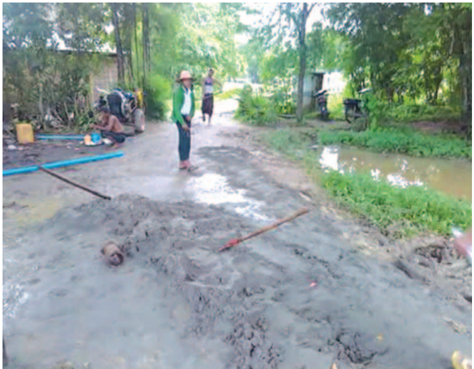
နေဝင်းစော်(မြန်အောင်)

မြန်အောင် ဇူလိုင် ၁၄ ဧရာဝတီတိုင်းဒေသကြီး မြန်အောင်မြို့နယ် လေးတူးကျေးရွာအုပ်စုရှိ လေးတူးကြီးရွာနှင့် ဂျမ်းရွာတို့တွင် မိုးများပြီး ရွာထဲလမ်းများပျက်စီးနေပါသဖြင့် လမ်းခင်းရန်သဲများကို အခြားနေရာမှ သယ်ယူ၍ မရသဖြင့် အဝိစိတွင်းပညာရှင်တစ်ဦးက အဝိစိတွင်းတူးကာ မြေအောက်မှ သဲများထုတ်ယူပြီး လမ်းခင်းလျက်ရှိသည်ဟု ဒေသခံတစ်ဦးက ပြောသည်။ လမ်းခင်းရန်သဲနှင့်ကျောက်များဝယ်ပြီး သယ်ယူရန် အခက်အခဲရှိသောကြောင့် အဝိစိတွင်းပညာရှင်တစ်ဦးက မြေအောက် ပေ ၆၀ အနက် အထိအဝိစိ တွင်းတူးကာ သဲများကိုလေမှုတ်စက်ဖြင့်ထုတ်ယူပြီး ရွာထဲရှိ ပျက်စီးနေသောလမ်းများကို ရွာသူ ရွာသားများက ကိုယ်အားကိုယ်ကိုးပြီး လုပ်ဆောင်ခဲ့ကြသည်ဟု ရွာသားတစ်ဦးက ပြောသည်။ အဝိစိတွင်းတစ်တွင်းလျှင် သဲကျပ်ပါက သဲ ငါးကျင်းလောက်ရပြီး သဲချောင်ပါက ခြောက်ကျင်းမှ ခုနစ်ကျင်းအထိရကြောင်း အဝိစိတွင်း တူးသူက ပြောပြသည်။ အဝိစိတွင်းတူးရာတွင် ကုန်ကျစရိတ်မှာ တွင်းတူးခ၊ ရေပိုက်ဖိုး၊ ရေစုပ်စက်ငှားခနှင့် စက်သုံးဆီဖိုးများ ကျပ်ငါးသောင်းခန့် ကုန်ကျမှုရှိပြီး စေတနာရှင်အလှူရှင်များက စုပေါင်းလှူဒါန်းကာ ဒေသခံများ၏လုပ်အားဖြင့် ဆောင်ရွက်ခဲ့ကြသဖြင့် ယခုအခါတွင် လေးတူးကြီးရွာနှင့် ဂျမ်းရွာတို့ရှိ ရွာထဲလမ်းများမှာ ကောင်းမွန်သွားသည်ဟု ဒေသခံ တစ်ဦးထံမှ သိရသည်။