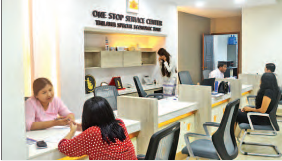
သီလဝါအထူးစီးပွားရေးဇုန်အတွင်းရှိ One Stop Service Center အား တွေ့ရစဉ်။

ရန်ကုန်တိုင်းဒေသကြီးဝန်ကြီးချုပ်က “One Stop Service နဲ့ပတ်သက်ပြီး ရန်ကုန်တိုင်းဒေသကြီး တစ်ခုလုံး