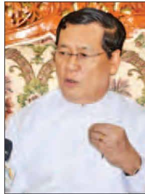
ဦးသိန်းဆွေ