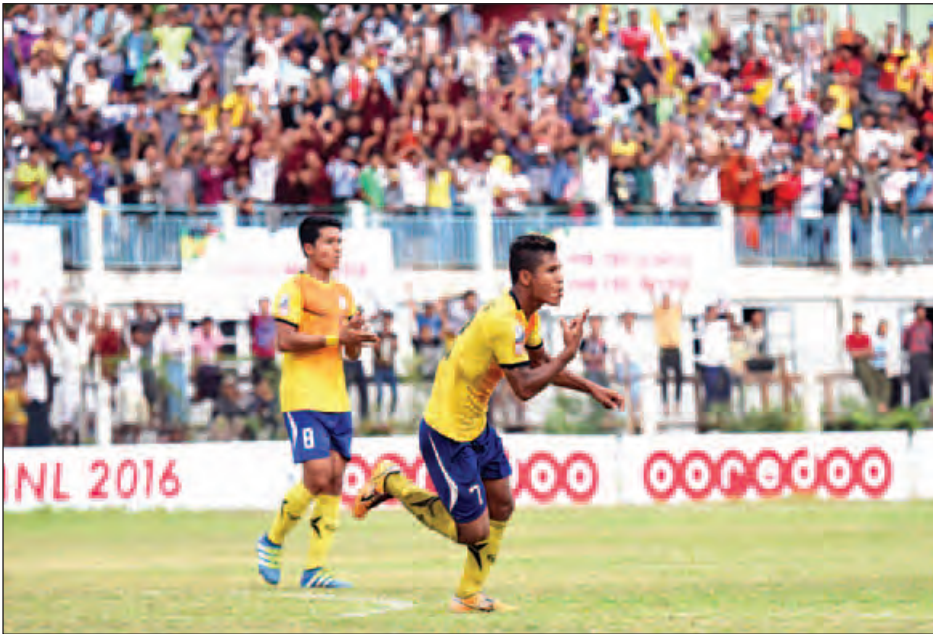
ဒုတိယအကျော့၌ ရလဒ်ကောင်းများ ရယူထားသည့် ဇေယျာရွှေမြေအသင်း။