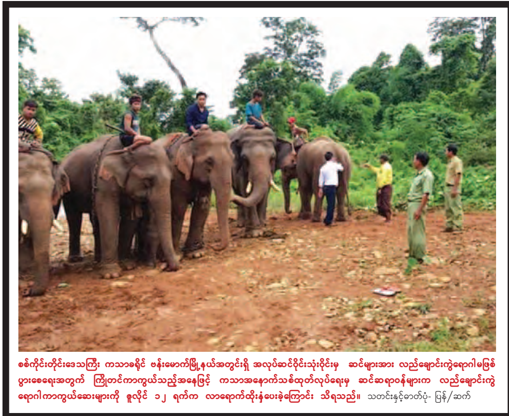
စစ်ကိုင်းတိုင်းဒေသကြီး ကသာခရိုင် ဗန်းမောက်မြို့နယ်အတွင်းရှိ အလုပ်ဆင်ပိုင်းသုံးပိုင်းမှ ဆင်များအား လည်ချောင်းကွဲရောဂါမဖြစ်ပွားစေရေးအတွက် ကြိုတင်ကာကွယ်သည့်အနေဖြင့် ကသာအနောက်သစ်ထုတ်လုပ်ရေးမှ ဆင်ဆရာဝန်များက လည်ချောင်းကွဲရောဂါကာကွယ်ဆေးများကို ဇူလိုင် ၁၂ ရက်က လာရောက်ထိုးနှံပေးခဲ့ကြောင်း သိရသည်။ သတင်းနှင့်စာတတ်ပုံ- ပြန်/ဆက်