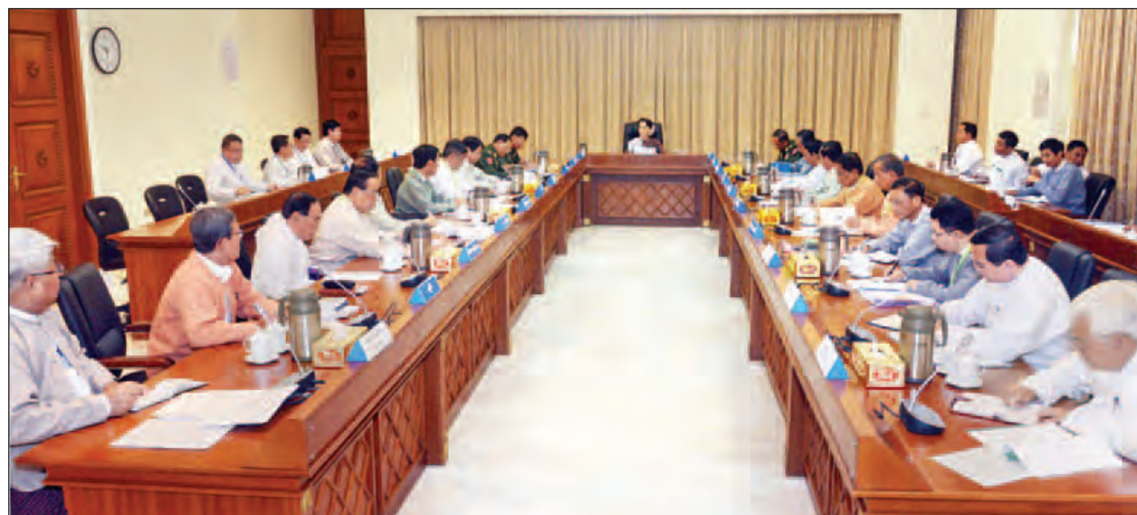
ရခိုင်ပြည်နယ် တည်ငြိမ်အေးချမ်းမှုနှင့် ဖွံ့ဖြိုးတိုးတက်ရေးအကောင်အထည်ဖော်ရေးဗဟိုကော်မတီလုပ်ငန်းညှိနှိုင်းအစည်းအဝေးကျင်းပစဉ်။ (သတင်းစဉ်)