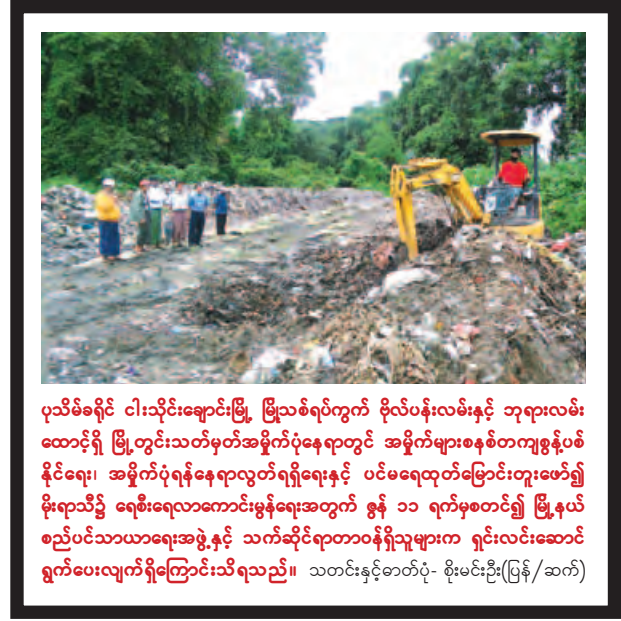
ပုသိမ်ခရိုင် ငါးသိုင်းချောင်းမြို့၊ ဗြိသစ်ရပ်ကွက် ဗိုလ်ပန်းလမ်းနှင့် ဘုရားလမ်း ထောင့်ရှိ မြို့တွင်းသတ်မှတ်အမှတ်ပုံနေရာတွင် အမှိုက်များစနစ်တကျစွန့်ပစ်နိုင်ရေး၊ အမှိုက်ပုံရန်နေရာလွတ်ရရှိရေးနှင့် ပင်မရေထုတ်ပြောင်းတူးဖော်၍ မိုးရာသီ၌ ရေစီးရေလွှာကောင်းမွန်ရေးအတွက် စွန့် ၁၁ ရက်မှစတင်၍ မြို့နယ်စည်ပင်သာယာရေးအဖွဲ့နှင့် သက်ဆိုင်ရာတာဝန်ရှိသူများက ရှင်းလင်းဆောင်ရွက်ပေးလျက်ရှိကြောင်းသိရသည်။ သတင်းနှင့်စာတိပုံ- စိုးမင်းဦး(မြန်/ဆက်)

အောင်လံ ဇူလိုင် ၁၄ မကွေးတိုင်းဒေသကြီး သရက်ခရိုင် အောင်လံမြို့တွင် ယခင်ရက်များက မိုးများရွာသွန်းခဲ့သဖြင့် လမ်းများပေါ်သို့ ရေလျှံခြင်းကြောင့် နန်းခြေများတင်ကျန်နေခြင်း၊ ချောင်းကူးတံတားများ ရေတိုက်စားမှုများကြောင့် ပျက်စီးမှုများရှိနေခဲ့သဖြင့် မြို့နယ်စည်ပင်သာယာရေးအဖွဲ့မှ လမ်းများပေါ်တွင် တင်ကျန်ရစ်နေသော နန်းသဲများအား ဖယ်ရှားခြင်း၊ တံတားများ တိုးချဲ့တည်ဆောက်ခြင်းလုပ်ငန်းများကို ဆောင်ရွက်လျက်ရှိကြောင်း သိရသည်။