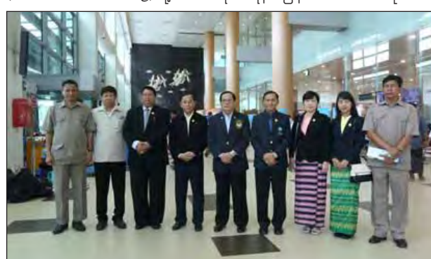
လှယ်အဖွဲ့သည် ဇူလိုင် ၁၂ ရက်က ရန်ကုန်အပြည်ပြည်ဆိုင်ရာလေဆိပ်မှ တစ်ဆင့် မလေးရှားနိုင်ငံသို့ ထွက်ခွာသွားသည်။

၂၀၁၇ ခုနှစ် မလေးရှားနိုင်ငံ၌ အိမ်ရှင်အဖြစ် လက်ခံကျင်းပမည့်(၂၉)ကြိမ်မြောက် အရှေ့တောင်အာရှအားကစားပြိုင်ပွဲအတွက် မလေးရှားနိုင်ငံ ကွာလာလမ်ပူမြို့တွင် ဇူလိုင် ၁၃ ရက်မှ ၁၄ ရက်အထိ ကျင်းပမည့် ဒုတိယအကြိမ် အရှေ့တောင်အာရှ အားကစားပြိုင်ပွဲ အဖွဲ့ချုပ်များအစည်းအဝေး (2nd SEAGF Meeting)သို့ တက်ရောက်ရန် မြန်မာအားကစားကိုယ်စား