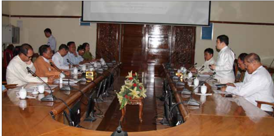
နိုင်ငံတကာနှင့် ယှဉ်ပြိုင်နိုင်စွမ်းရှိသော လွတ်လပ်သည့် ပို့ကုန်/သွင်းကုန် မူဝါဒများချမှတ်ပေးရန်၊ export processing zone များ အကောင်အထည်ဖော် ဆောင်ရွက်မှုကို အားပေးသည့် အကောက်ခွန်နှုန်းထားများ ပြန်လည်သုံးသပ်ရန်၊