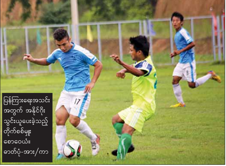
ပြန်ကြားရေးအသင်းအတွက် အနိုင်ရိုးသွင်းယူပေးခဲ့သည့် တိုက်စစ်မျှစောဝေယံ။

နေပြည်တော် ဇူလိုင် ၁၃ ၂၀၁၆ ခုနှစ် အငွေမအကြိမ်မြောက် နေပြည်တော်ဝန်ကြီးဌာနပေါင်းစုံ အမျိုးသားဘောလုံးပြိုင်ပွဲ အုပ်စုပွဲစဉ်များကို နေပြည်တော် ဝဏ္ဏသိဒ္ဓိအားကစားလေ့ကျင့်ရေးကွင်းများ၌ ဆက်လက်ကျင်းပခဲ့သည်။ နံနက်ပိုင်းပွဲစဉ်များအဖြစ် ယနေ့နံနက် ၇ နာရီခွဲတွင် လေ့ကျင့်ရေးကွင်းအမှတ်(၃)၌ အုပ်စု(၈)မှ ပြန်ကြားရေးဝန်ကြီးဌာန ဘောလုံးအသင်းနှင့် သာသနာရေးနှင့်ယဉ်ကျေးမှုဝန်ကြီးဌာနဘောလုံးအသင်းတို့ ယှဉ်ပြိုင်ကစားကြရာ ပြန်ကြားရေးဝန်ကြီးဌာနအသင်းမှ တစ်ရိုး-ရိုးမရှိဖြင့်လည်းကောင်း၊ လေ့ကျင့်ရေးကွင်းအမှတ်(၄)၌ အုပ်စု(၈)မှ စီမံကိန်းနှင့်ဘဏ္ဍာရေးဝန်ကြီးဌာနဘောလုံးအသင်းနှင့် နေပြည်တော်စည်ပင်ဘောလုံးအသင်းတို့ ယှဉ်ပြိုင်ကစားကြရာ စီမံကိန်းနှင့်ဘဏ္ဍာရေးဝန်ကြီးဌာနအသင်းမှ ၁၁ ရိုး-နှစ်ရိုးဖြင့်လည်းကောင်း၊ စာမျက်နှာ ၉ ကော်လံ ၁ သို့ ၀