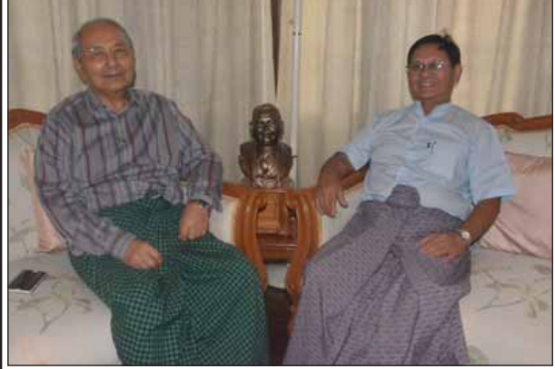
အာဇာနည်ခေါင်းဆောင် ဦးရာဇတ်၏အကြီးဆုံးသား ဦးတင်မြင့်နှင့် အငယ်ဆုံးသား ဦးလှကြည်။

အာဇာနည်ခေါင်းဆောင်ကြီး ဦးရာဇတ်သည် မြန်မာ့လွတ်လပ်ရေး ရရှိရန် ကြိုးစားအားထုတ်ခဲ့ရုံသာမက မျိုးချစ်စိတ်ဓာတ်ရှင်သန်ထက်မြက်စေသည့် အမျိုးသားကျောင်းများ ပေါ်ထွန်းလာစေရန်နှင့် ပညာရေး၊ စစ်ရေး၊ နိုင်ငံရေးအသိအမြင် နိုးကြားလာစေရန် မျိုးစေ့ချပေးခဲ့သည့်အပြင် ပါဠိဘာသာထွန်းကားပြန့်ပွားရေးအတွက်လည်း ဆောင်ရွက်ခဲ့ရာ မင်းကွန်းကျောင်းတိုက်၌ ကိုရင်လေးများကို ပါဠိဘာသာသင်ကြားပေးခဲ့သည်။ ထို့အပြင် ၎င်းသင်ကြားပေးသည့် မန္တလေး ဗဟိုအမျိုးသားအထက်တန်း