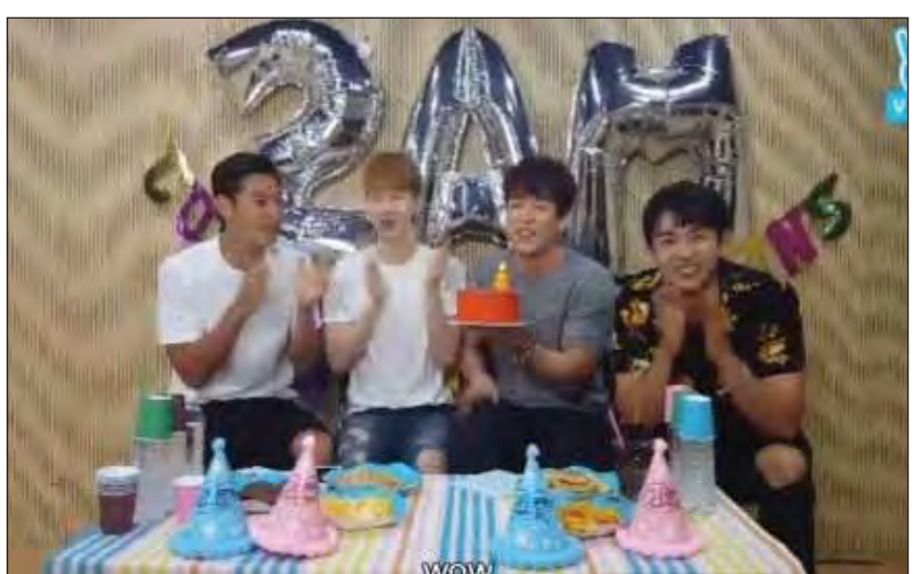
အထူးလက်ခံအားပေးမှုရရှိနေသည့် အမျိုးသား အဖွဲ့လိုက် အယ်လ်ဘမ်လေးခုနှင့် ကမ္ဘာတစ်ဝန်းတွင် ကေပေါ့ပေါ့အဖွဲ့တစ်ဖွဲ့လည်းဖြစ်သည်။ ထို့ပြင် အဖွဲ့ဝင် ဂီတပျော်ဖြေပွဲပွဲကိုလည်း ကျင်းပခဲ့ပြီဖြစ်သည်။ (မျိုးစန္ဒာမြင့်)

ဂျေပိုင်ပီအင်နိုတာတီနန်းမန်မှ အခြေပြုထားပြီး အာရှအမျိုးသမီးပရိသတ်အချိန်အစာရရှိထားသည့် တောင်ကိုရီးယားအမျိုးသားပေါ့ပေါ့အဖွဲ့ 2AM သည် ၂၀၀၈ ခုနှစ် ဇူလိုင် ၁၁ ရက်က စိတ်တူကိုယ်တူဖြင့် ဂီတလမ်းကြောင်းပေါ်သို့ လျှောက်လှမ်းခဲ့ကြသည်မှာ ရှစ်နှစ်ပြည့်မြောက်သည့်အထိမ်းအမှတ်အပါအဝင် အဖွဲ့ဝင်များ ပြန်လည်ပေါင်းစည်းလှည့်ပတ်သည့်အထိမ်း အမှတ်အဖြစ် ပျော်ပွဲရွှင်ပွဲတစ်ခုကို ကျင်းပခဲ့ပြီး ယင်းအစီအစဉ်ကို V App ရုပ်သံလိုင်းမှ တိုက်ရိုက် ထုတ်လွှင့်ပြသခဲ့ကြောင်း သိရသည်။ အဆိုပါအစီအစဉ်တွင် အဖွဲ့ဝင်တစ်ဦးချင်းစီ အလိုက် လက်ရှိလှုပ်ရှားမှုများနှင့် 2AM အဖွဲ့ အနေဖြင့် အနာဂတ်တွင် ဆက်လက်လှုပ်ရှား ဆောင်ရွက်မည့်အစီအစဉ်များကို ပရိသတ်များအား ရှင်းလင်းဆွေးနွေးပေးခဲ့ကြောင်းသိရသည်။ 2AM အဖွဲ့သည် ၂၀၀၈ ခုနှစ်က This Song အမည်ရှိအယ်လ်ဘမ်ဖြင့် ဂီတလောကကို စတင်ခြေချ ခဲ့ကာ ယခုအခါ ကမ္ဘာတစ်ဝန်းရှိ ပေါ့ပရိသတ်များ၏