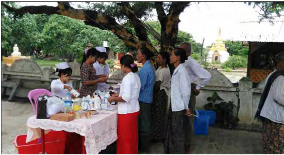
ဟောပြောပွဲများ၊ ဖွဲ့သွန်လဲစစ်လုပ်ငန်း မှတ်ခြင်းများနှင့်ကျေးရွာသူ ကျေးရွာစောင့်ရှောက်ကုသပေးခဲ့ကြောင်း သိရသည်။