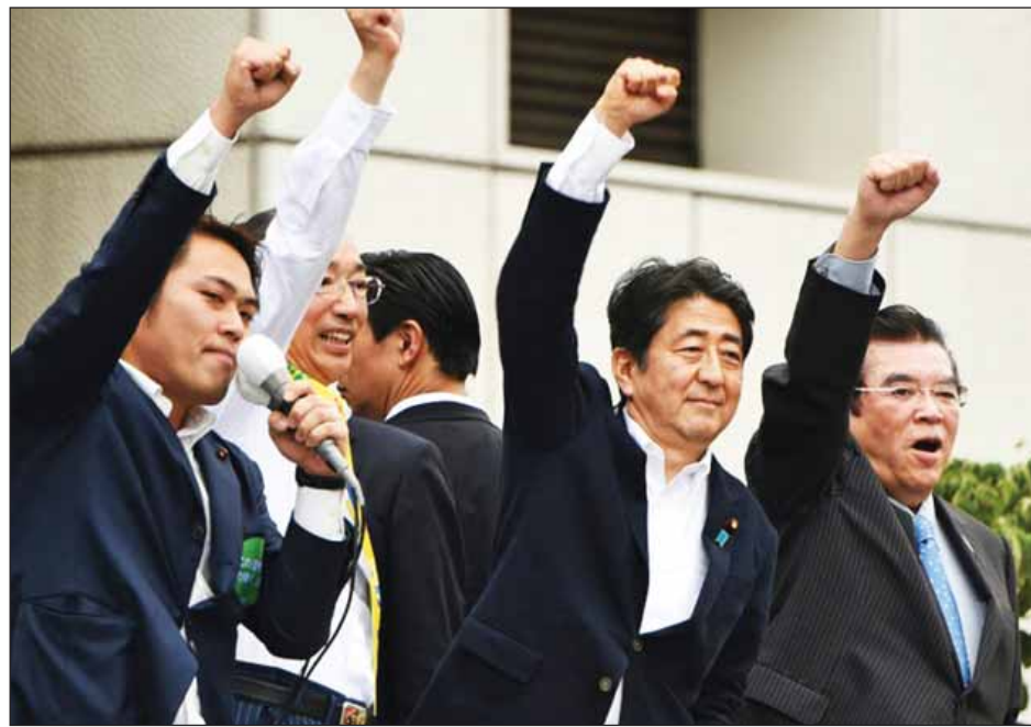
အယ်လ်ဒီပီ-ကိုမေတိုး အာဏာရ ညွန့်ပေါင်းအဖွဲ့အပါအဝင် ဖွဲ့စည်းပုံအခြေခံဥပဒေပြင်ဆင်ရေးကို ထောက်ခံသော ပါတီလေးပါတီတို့မှ အမတ်လောင်းများက စုစုပေါင်း အမတ်နေရာ ၇၆ နေရာအတွက် ရွေးချယ်ခံရသည်။

တိုကျို ဇူလိုင် ၁၁ ဂျပန်နိုင်ငံ၌ ဇူလိုင် ၁၀ ရက်က ကျင်းပသော အထက်လွှတ်တော်ရွေးကောက်ပွဲတွင် ဝန်ကြီးချုပ် ရှင်ဒိုအာဘေး၏ အာဏာရ လစ်ဘရယ်ဒီမိုကရက်တစ်ပါတီနှင့် ယင်း၏ မဟာမိတ်များက အနိုင်ရရှိကြောင်း ဒေသဆိုင်ရာသတင်းဌာနများက ဇူလိုင် ၁၁ ရက်တွင် သတင်းထုတ်ပြန်သည်။