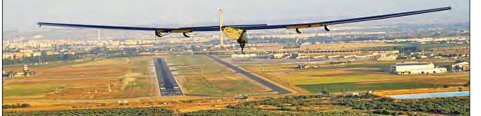
ဘော့ချီဘာဖြစ်သည်။ မြေထဲပင်လယ်ကို ဖြတ်ကျော် ပျံသန်းရမည့် ခရီးစဉ်အတွင်း အယ်လ်ဂျီးရီးယား၊ တူနီးရှား၊ အီတလီ၊ မော်လ်တာနှင့် ဂရိလေကြောင်းပိုင်နက်တို့ကို ဖြတ်သန်းရမည်ဖြစ်သည်။ အဆိုပါလေယာဉ်သည် ဇူလိုင် ၁၃ ရက်တွင် ကိုင်ရိုမြို့သို့ ဆင်းသက်မည်ဖြစ်သည်။ နေစွမ်းအင်သုံးလေယာဉ်သည် မော်တော်ယာဉ်တစ်စီးထက် ကျော်လွန်သော အလေးချိန်မရှိသော်လည်း ဘိုးရင်း-၇၄၇ လေယာဉ်၏ တောင်ပံတပ်ဆင်ထားသည်။ နေစွမ်းအင်သုံး လေယာဉ်၏ ကမ္ဘာတစ်ပတ် နောက်ဆုံးခရီးစဉ်အရ အဘူဒါဘီမြို့သို့ ဆက်လက်ပျံသန်းရန် စီစဉ်ထားသည်။ ပြန်လည်ပြည့်ဖြိုးမြဲ စွမ်းအင်အသုံးပြုမှုကို အားပေးမြှင့်တင်သည့်လှုပ်ရှားမှုအဖြစ် နေစွမ်းအင်အသုံးပြုသော လေယာဉ်ဖြင့် ကမ္ဘာပတ်ခြင်းဖြစ်သည်။

ဆီဗီးလ် ဇူလိုင် ၁၁ နေရောင်ခြည်စွမ်းအင်ကို လုံးလုံးလျားလျား အသုံးပြုသော လေယာဉ်ကြီးသည် ကမ္ဘာတစ်ပတ်ခရီးစဉ်၏ နောက်ဆုံးခရီးတစ်ထောက် ခရီးစဉ်မတိုင်မီ ပျံသန်းသော ခရီးစဉ်အဖြစ် စပိန်နိုင်ငံ ဆီဗီးလ်မြို့မှ အီဂျစ်နိုင်ငံ ကိုင်ရိုမြို့သို့ ဇူလိုင် ၁၁ ရက် အစောပိုင်းတွင် ထွက်ခွာသွားပြီဖြစ်ကြောင်း ဒေသဆိုင်ရာ သတင်းဌာနများက သတင်းထုတ်ပြန်သည်။ နေရောင်ခြည်တွန်းအား-၂ ဟု အမည်ပေးထားသော အဆိုပါလေယာဉ်သည် စမ်းသပ်ပျံသန်းသည့် ခရီးစဉ်အဖြစ် ကမ္ဘာပတ်လျက်ရှိသည်။ စပိန်နိုင်ငံ တောင်ပိုင်း ဆီဗီးလ် လေဆိပ်မှ ဇူလိုင် ၁၁ ရက် ဒေသစံတော်ချိန် နံနက် ၆ နာရီ မိနစ် ၂၀ တွင် စတင်ပျံသန်းခဲ့ပြီး အီဂျစ်နိုင်ငံ ကိုင်ရိုမြို့သို့ ရောက်ရှိရန် နာရီပေါင်း ၅၀ နှင့် မိနစ် ၃၀ ကြာမျှ ပျံသန်းရမည်ဟု မျှော်လင့်ရသည်။ မောင်းသူအတွက် ထိုင်ခုံတစ်လုံးတည်းသာ ပါရှိသော အဆိုပါလေယာဉ်၏ လေယာဉ်မှူးမှာ ဆွစ်ဇာလန် အင်ဒီဂေါ