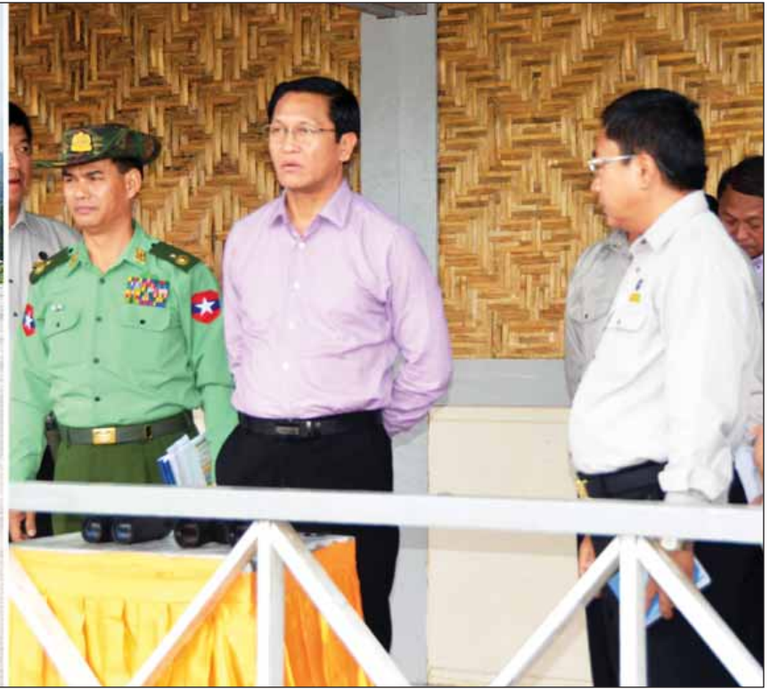
ချင်းတွင်းတံတား (ကလေးဝ) တည်ဆောက်မှုလုပ်ငန်းများအား ဒုတိယသမ္မတ ဦးဟင်နရီပန်ထီးယူ ကြည့်ရှုစစ်ဆေးစဉ်။ (သတင်းစဉ်)