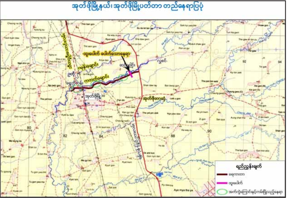
လုပ်ငန်းဆောင်ရွက်ပြီးစီးမှု အခြေအနေ

လုပ်ငန်း ပမာဏမှာ အလျား သုံးမိုင်၊ မြေကြီး ၅၀၄၄၂ ကျင်း ဖြစ်ပါသည်။ ၂၀၁၆-၂၀၁၇ ခုနှစ် ပဲခူးတိုင်းဒေသကြီး အစိုးရအဖွဲ့ရန်ပုံငွေ (B.E)ဖြင့် ၂၀၁၆ ခုနှစ် မေ ၁၇ ရက်နေ့မှစ၍ လုပ်ငန်းစတင်ဆောင်ရွက်လျက်ရှိသည်။ သာယာဝတီခရိုင် အုတ်ဖိုမြို့နယ်ရှိ ရေကြီးမှုကြောင့် ပျက်စီးခဲ့သော အုတ်ဖိုမြို့ပတ်တာအား တာပုံစံကျပြန်လည် ပြုပြင်ပေးခြင်းဖြင့် အုတ်ဖိုမြို့အား ရေကြီးနှစ်မြုပ်မှုမှ ကင်းဝေးစေမည်ဖြစ်သည့်အတွက် မြို့နေပြည်သူလူထု၏ လူနေမှုဘဝ တိုးတက်မြှင့်တင်ပေးမည်ဖြစ်ပါကြောင်း။