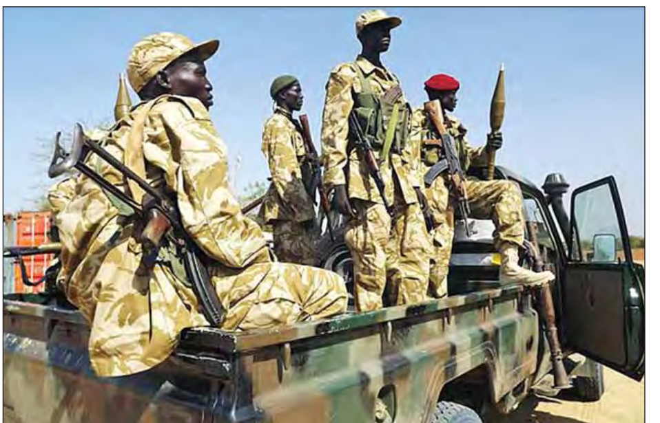
အစိုးရတပ်များနှင့် ဆန့်ကျင်ဘက်လက်နက်ကိုင်တပ်ဖွဲ့များအနေဖြင့် အပစ်အခတ်ရပ်စဲကြရန်နှင့် အတူအညီလိုအပ်နေသည့် အရပ်သားများအတွက် ကုလသမဂ္ဂနှင့် လူသားချင်းစာနာထောက်ထားမှုအကူအညီပေးအပ်ရေးလုပ်ငန်းများ မြို့တွင်းသို့ ဝင်ရောက်ခွင့်ပေးရန် လုံခြုံရေးကောင်စီက တောင်းဆိုခဲ့သည်။ ဆူဒန်တွင် အစိုးရတပ်များနှင့် သူပုန်တပ်ဖွဲ့များကြား နှစ်နှစ်ကြာ ပြည်တွင်းစစ်ဖြစ်ပွားပြီးနောက် ၂၀၁၁ ခုနှစ်တွင် တောင်ဆူဒန်သည် လွတ်လပ်သည့် နိုင်ငံတစ်နိုင်ငံ ဖြစ်လာခဲ့သည်။

ဂျူးဘား ဇူလိုင် ၁၁ တောင်ဆူဒန်တွင် အစိုးရတပ်များနှင့် ဆန့်ကျင်ဘက်လက်နက်ကိုင်တပ်ဖွဲ့များကြား တိုက်ပွဲများဖြစ်ပွားနေမှုနှင့် ပတ်သက်၍ ပြည်တွင်းစစ်ပွဲတစ်ပွဲ ထပ်မံဖြစ်ပွားလာနိုင်မည့်အရေး စိုးရိမ်မှုများ မြင့်တက်လျက်ရှိသည်။ သမ္မတ ဆာလ်ဟာ ကီယာ၏ အစိုးရတပ်များနှင့် ဒုတိယ သမ္မတ ရိမ်မာချာကို သစ္စာခံသည့် ဆန့်ကျင်ဘက်လက်နက်ကိုင်တပ်ဖွဲ့များသည် ဇူလိုင် ၇ ရက်မှစ၍ မြို့တော်ဂျူးဘားတွင် အပြန်အလှန် ပစ်ခတ်တိုက်ခိုက်ခဲ့ကြသည်။ အဆိုပါတိုက်ခိုက်မှုများအတွင်း အရပ်သား ၃၃ ဦးအပါအဝင် ၂၇၂ ဦး သေဆုံးခဲ့ရပြီးဖြစ်သည်။ မြို့တော်တွင်ရှိသည့် လူရာပေါင်းများစွာက ထွက်ပြေးလွတ်မြောက်ရန် ကြိုးစားခဲ့ကြပြီး အကာအကွယ်ပေးရန် မိမိတို့ထံတော်ဆီရှိသည့် တောင်ဆူဒန်တွင်ရှိသည့် ကုလသမဂ္ဂငြိမ်းချမ်းမှု ထိန်းသိမ်းရေးတပ်ဖွဲ့က ပြောကြားသည်။ မြို့တော်ဂျူးဘားတွင်ဖြစ်ပွားခဲ့သည့် တိုက်ပွဲများနှင့် ပတ်သက်၍ ကုလသမဂ္ဂလုံခြုံရေးကောင်စီက ကန့်ကွက်ရှုတ်ချကြောင်း ဇူလိုင် ၁၀ ရက်တွင် ကြေညာချက်တစ်စောင် ထုတ်ပြန်ခဲ့သည်။ ဇူလိုင် ၇ ရက်နှင့် ၈ ရက်တွင် ဖြစ်ပွားခဲ့သည့် တိုက်ပွဲများတွင် ကုလသမဂ္ဂဝန်ထမ်းများနှင့် သံတမန်များသည်လည်း ပစ်မှတ်ဖြစ်ခဲ့ရသည်ဟု လုံခြုံရေးကောင်စီက ပြောကြားသည်။