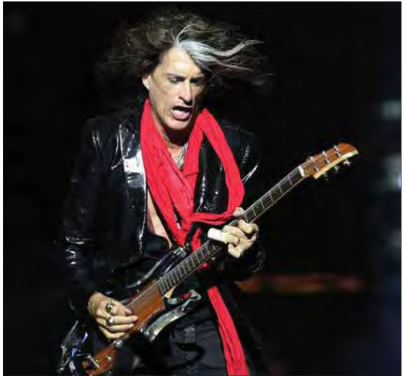
အဆိုပါဂီတပျော်ဖြေပွဲတွင် ရုပ်ရှင်သရုပ်ဆောင် တို့လည်း ပါဝင်ဖျော်ဖြေခဲ့ကြောင်းသိရသည်။ များဖြစ်သည့် Johnny Depp နှင့် Alice Cooper

အမေရိကန်ရော့ခ်ဂီတအဖွဲ့တစ်ဖွဲ့သည် ဇူလိုင် ၁၀ ရက် ညပိုင်းက နယူးယောက်မြို့တွင် Hollywood Vampires concert ဖျော်ဖြေပွဲကျင်းပနေစဉ် စတိတ်စင် ရုတ်တရက်ပြိုကျမှုဖြစ်ပွားခဲ့သဖြင့် ယင်းအဖွဲ့မှ ဂစ်တာသမား ဂျိုးပယ်ရီမှာ ဒဏ်ရာ အနည်းငယ်ရရှိခဲ့သဖြင့် နီးစပ်ရာဆေးရုံသို့ ပို့ဆောင်ပေးခဲ့ကြောင်း သိရသည်။ "ကျွန်တော့်ရဲ့အစ်ကိုကို သတင်းမေးကြတဲ့ ပရိသတ်ကြီးနဲ့ အနုပညာမောင်နှမအားလုံးကို ကျေးဇူး တင်ပါတယ်။ သူက အခု သက်သာနေပါတယ်။ မိသားစုတွေလည်း ဘေးမှာရှိနေပြီး အကောင်းဆုံး ဆေးဝါးကုသမှုခံယူနေပါတယ်"ဟု အဖွဲ့မှ Alice Cooper က ၎င်း၏တွစ်တာစာမျက်နှာတွင် ယနေ့ နံနက်ပိုင်းက ရေးသားခဲ့သည်။