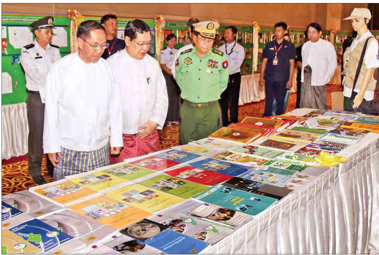
ကမ္ဘာ့လူဦးရေနေ့အထိမ်းအမှတ်အခမ်းအနားတွင် ခင်းကျင်းပြသထားသည့် စာအုပ်များကို ဒုတိယသမ္မတ ဦးမြင့်ဆွေနှင့် ပြည်ထောင်စုဝန်ကြီးများ လှည့်လည်ကြည့်ရှုစဉ်။ (သတင်းစဉ်)