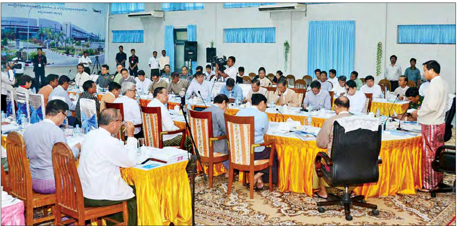
အမျိုးသားယာဉ်အန္တရာယ်၊ လမ်းအန္တရာယ်ကင်းရှင်းရေးကောင်စီ ညှိနှိုင်းအစည်းအဝေး ကျင်းပစဉ်။ (သတင်းစဉ်)

နေပြည်တော် ဇူလိုင် ၇ ယာဉ်အန္တရာယ်၊ လမ်းအန္တရာယ် ကင်းရှင်းရေးဆောင်ရွက်သည့်နေရာ တွင် ပြည်သူများ၏ ဗဟုသုတရှိမှု၊ မူဝါဒများကောင်းမွန်မှု၊ စည်းကမ်း တကျလိုက်နာသည့် အလေ့အကျင့် ရှိမှုနှင့် လူထုတစ်ရပ်လုံးပူးပေါင်းပါဝင် မှုသည် အရေးကြီးကြောင်း အမျိုးသား ယာဉ်အန္တရာယ်၊ လမ်းအန္တရာယ် ကင်းရှင်းရေးကောင်စီဥက္ကဋ္ဌ ဒုတိယ သမ္မတ ဦးဟင်နရီဗန်ထီးယူ က ပြောကြားသည်။ နေပြည်တော်ရှိ ပို့ဆောင်ရေးနှင့် ဆက်သွယ်ရေးဝန်ကြီးဌာန အစည်း အဝေးခန်းမ၌ ယနေ့နံနက် ၉ နာရီ တွင် ကျင်းပသည့် အမျိုးသားယာဉ် အန္တရာယ်၊ လမ်းအန္တရာယ် ကင်းရှင်း ရေးကောင်စီညှိနှိုင်းအစည်းအဝေး၌ ဒုတိယသမ္မတက အမှာစကား ပြောကြားရာတွင် ထိုသို့ပြောကြားခဲ့ ခြင်းဖြစ်သည်။ ထို့ပြင် ဒုတိယသမ္မတက ယနေ့ ကမ္ဘာပေါ်တွင် ယာဉ်တိုက်မှုကြောင့် စာမျက်နှာ ၈ ကော်လံ ၁ သို့ *