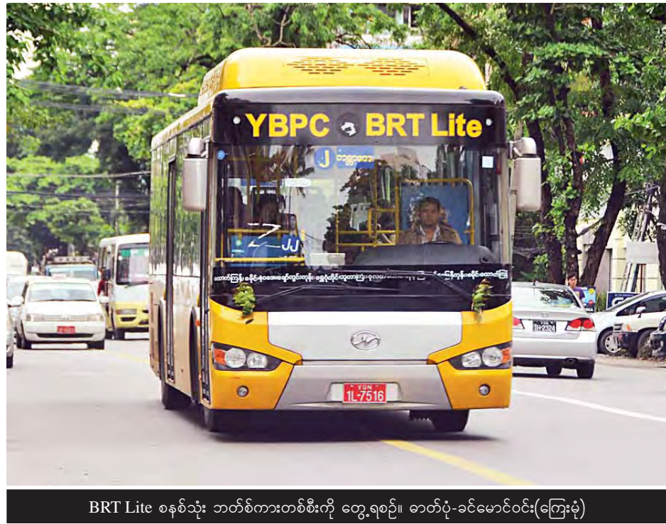
BRT Lite စနစ်သုံး ဘတ်စ်ကားတစ်စီးကို တွေ့ရစဉ်။