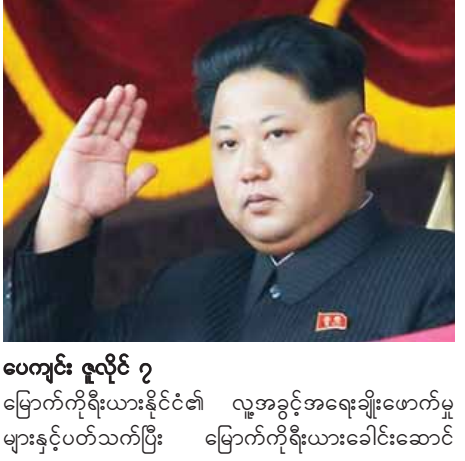
ပေကျင်း ဇူလိုင် ၇

မြောက်ကိုရီးယားနိုင်ငံ၏ လူ့အခွင့်အရေးချိုးဖောက်မှုများနှင့်ပတ်သက်ပြီး မြောက်ကိုရီးယားခေါင်းဆောင်