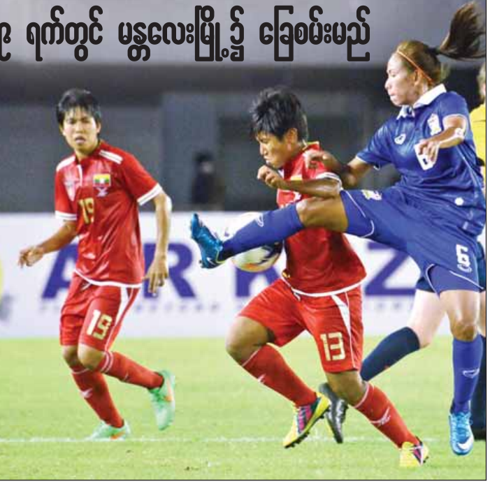
မြန်မာနှင့် ထိုင်းအမျိုးသမီးအသင်းတို့ ၂၀၁၆ အိုလံပစ် ခြေစမ်းပွဲ၌တွေ့ဆုံခဲ့စဉ်။

ရန်ကုန် ဇူလိုင် ၇ မြန်မာအမျိုးသမီးအသင်းသည် အိမ်ရှင်အဖြစ်လက်ခံကျင်းပမည့် ၂၀၁၆ အာဆီယံ အမျိုးသမီးဘောလုံးပြိုင်ပွဲတွင် အောင်မြင်မှုရရှိရန် ပြင်ဆင်လျက်ရှိပြီး ထိုင်းလက်ရွေးစင် အမျိုးသမီးအသင်းနှင့် ဇူလိုင် ၉ ရက် ညနေ ၅ နာရီတွင် မန္တလေးမြို့ရှိ မန္တလာသီရိကင်း၌ ခြေစမ်းပွဲ ယှဉ်ပြိုင်ကစားမည်ဖြစ်သည်။ ထိုင်းအမျိုးသမီးအသင်းသည် ၂၀၁၅ အမျိုးသမီး ကမ္ဘာ့ဖလားပြိုင်ပွဲယှဉ်ပြိုင်ခဲ့သည့် အသင်းဖြစ်သောကြောင့် မြန်မာအသင်းအတွက် အကျိုးရှိမည့် ခြေစမ်းပွဲဖြစ်သည်။ ၂၀၁၆ အာဆီယံ အမျိုးသမီးဘောလုံးပြိုင်ပွဲကို ဇူလိုင် ၂၆ ရက်မှ ဩဂုတ် ၄ ရက်အထိ မန္တလေးမြို့ရှိ မန္တလာသီရိကင်း၌ ကျင်းပမည်ဖြစ်ပြီး အိမ်ရှင်မြန်မာအသင်းနှင့် လက်ရှိချန်ပီယံ ထိုင်းအသင်းတို့သည် အုပ်စု တစ်ခုစီ ကျရောက်နေသောကြောင့် ပြိုင်ပွဲမတိုင်မီ နောက်ဆုံးခြေစမ်းပွဲ အဖြစ် ယှဉ်ပြိုင်ကစားခြင်းဖြစ်သည်။ မြန်မာအမျိုးသမီးအသင်းသည် ယင်းပြိုင်ပွဲအတွက် ယခုနှစ်ဆန်းပိုင်းကတည်းက လေ့ကျင့်ပြင်ဆင်မှု များပြုလုပ်ခဲ့ပြီး နည်းပြသစ် နယ်သာလန်လက်ရွေးစင် အမျိုးသမီး အသင်းနည်းပြဟောင်း ရော်ဂျာရိုင်နာမှာလည်း အသင်းကိုခြောက်လ နီးပါး ပြင်ဆင်ခွင့်ရရှိထားသည်။ ရော်ဂျာရိုင်နာလက်ထက်တွင် မြန်မာ အမျိုးသမီးအသင်းသည် စာမျက်နှာ ၉ ကော်လံ ၁ သို့ *