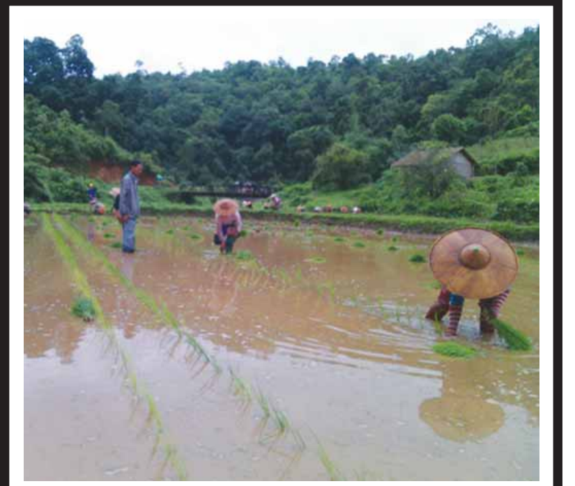
ရှမ်းပြည်နယ်(မြောက်ပိုင်း) ကျောက်မဲခရိုင် ခိုင်းလုံမြို့တွင် ဇူလိုင် ၅ ရက်က စိုက်ပျိုးရေးဦးစီးဌာနမှ ဦးဆောင်၍ GAP နည်းပညာစပါး၊ စံပြုကွက်ကို တောင်သူဦးစိုင်းထို၏လယ်မြေငါးစကတွင် စိုက်ပျိုးခဲ့ပြီး အဆိုပါစိုက်ပျိုးနေသောလယ်ကွင်းသို့ စိုက်ပျိုးရေးဦးစီးဌာန မြို့နယ်ဦးစီးမှူးနှင့် ဝန်ထမ်းများက ကူညီပြီး လိုအပ်သည့်များကို ဖြည့်ဆည်းဆောင်ရွက်ပေးခဲ့ကြောင်း သိရသည်။