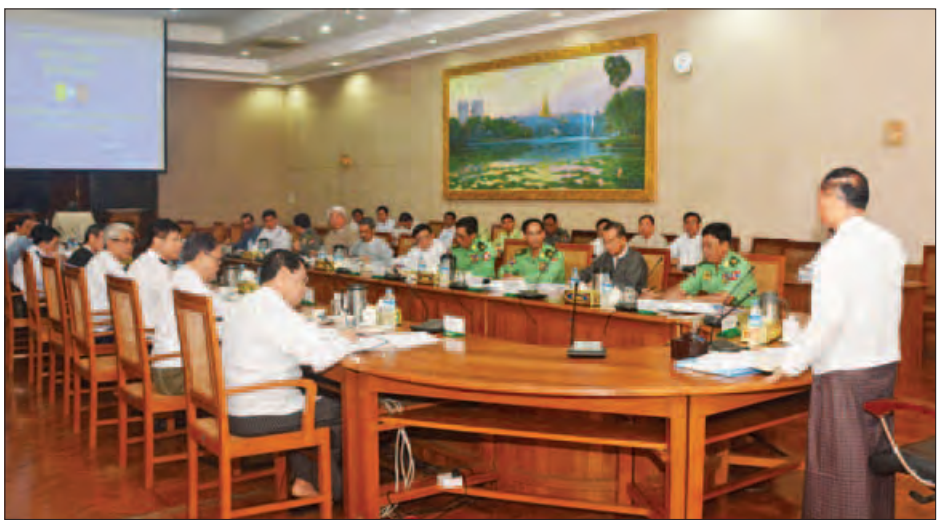
ဒုတိယသမ္မတ ဦးမြင့်ဆွေ နိုင်ငံခြားသားများ ကြီးကြပ်စောင့်ရှောက်ရေး ဗဟိုကော်မတီအစည်းအဝေးတွင် အမှာစကား ပြောကြားစဉ်။ (သတင်းစဉ်)

၍ နိုင်ငံတကာနှင့် ဆက်သွယ်ဆောင်ရွက်ရမည့် လုပ်ငန်း များအတွက် မြန်မာနိုင်ငံ ရဲတပ်ဖွဲ့က I 24/7 Channel ထူထောင်ထားပြီးဖြစ်၍ ဆက်သွယ်ဆောင်ရွက်နိုင်ပါ ကြောင်း၊ ကမ္ဘာလှည့်ခရီးသွားများ မြန်မာနိုင်ငံသို့ နှစ်စဉ် ပိုမိုလာရောက်လည်ပတ်နိုင်ရေးကို ပြုစုစီစဉ်အလိုက် တိုးမြှင့်သတ်မှတ်ထားပါကြောင်း၊ ၂၀၁၅ ခုနှစ်တွင် ကမ္ဘာ လှည့်ခရီးသွား ငါးသန်းသတ်မှတ်ခဲ့ရာ နယ်စပ်ဒေသများနှင့် အပြည်ပြည်ဆိုင်ရာ ဝင်၊ ထွက်ပေါက်များမှ ၄ ဒသမ ၆၈ သန်း ဝင်ရောက်ခဲ့ပါကြောင်း၊ ၂၀၁၆ ခုနှစ်တွင် နိုင်ငံတွင်း သို့ ကမ္ဘာလှည့် ခရီးသွား ၅ ဒသမ ၅ သန်း ဝင်ရောက်လာ နိုင်ရန် မျှော်မှန်းထားသည်ကို ဟိုတယ်နှင့် ခရီးသွားလာရေး ဝန်ကြီးဌာနမှ သိရပါကြောင်း၊ နိုင်ငံတွင်းသို့ ဝင်ရောက်လာ သည့် နိုင်ငံခြားသားများကို ဥပဒေနှင့်အညီ အကာအကွယ် ပေး စောင့်ရှောက်ကြရမည်ဖြစ်ကြောင်း၊ နယ်စပ်ဒေသ စစ်ဆေးရေးစခန်းများတွင် စစ်ဆေးရေးကိရိယာများ ပြည့်စုံလုံလောက်စွာထားရှိရန် လိုအပ်ကြောင်း။