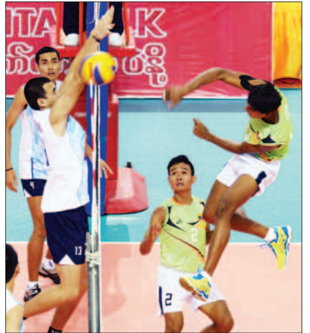
မြန်မာ(ခ)အသင်းနှင့် ထိုင်းအသင်းတို့ ယှဉ်ပြိုင်နေစဉ်။