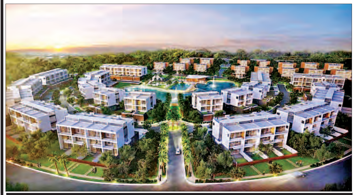
ပန်းလှိုင်အိမ်ရာဝင်းအတွင်း၌ အကောင်အထည်ဖော်မည့် အဆင့်မြင့်အိမ်ရာစီမံကိန်းပုံစံပုံစံကို တွေ့ရစဉ်။ (သတင်း စာမျက်နှာ - ၁၁)