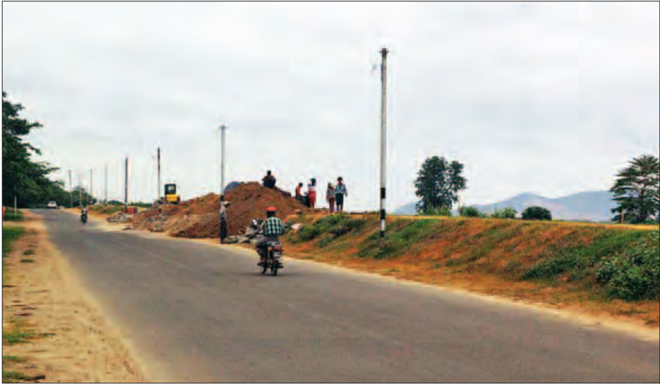
မြေသားမြှင့်တင်ခြင်းလုပ်ငန်း ဆောင်ရွက်မည့် မုံရွာမြို့မြောက်ဘက်ခြမ်း အိုးဘိုတောင်ရပ်ကွက်ရှိ ချင်းတွင်းမြစ် ရေတားတာပေါင်ကို တွေ့ရစဉ်။

မုံရွာ ဇူလိုင် ၄ မုံရွာနှင့် ချောင်းဦးမြို့နယ်အတွင်းသို့ ဖြတ်သန်း စီးဆင်းလျက်ရှိသော ချင်းတွင်းမြစ်သည် နှစ်စဉ်မိုးရာသီ တွင် မြစ်ရေမြင့်တက်မှုများဖြစ်ပေါ် လျက်ရှိရာ မြစ်ကမ်းပါးတစ်လျှောက်ရှိ မြို့ပေါ်ရပ်ကွက်များနှင့် ကျေးရွာများ မြစ်ရေဝင်ရောက်မှုကာကွယ်နိုင်ရန် အတွက် ၂၀၁၆-၂၀၁၇ ဘဏ္ဍာနှစ် အတွင်း မြစ်ရေတား မြေသားတာပေါင် မြှင့်တင်ခြင်းနှင့် ကျောက်ရိုးစီ လုပ်ငန်းများကို လုပ်ဆောင်သွားမည် ဖြစ်ကြောင်း မြို့နယ်ဆည်မြောင်း ဦးစီးဌာနမှ သိရသည်။