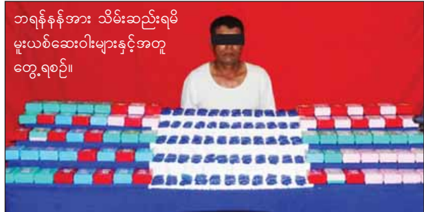
ဘရန်နန်အား သိမ်းဆည်းရမိ မူးယစ်ဆေးဝါးများနှင့်အတူ တွေ့ရစဉ်။