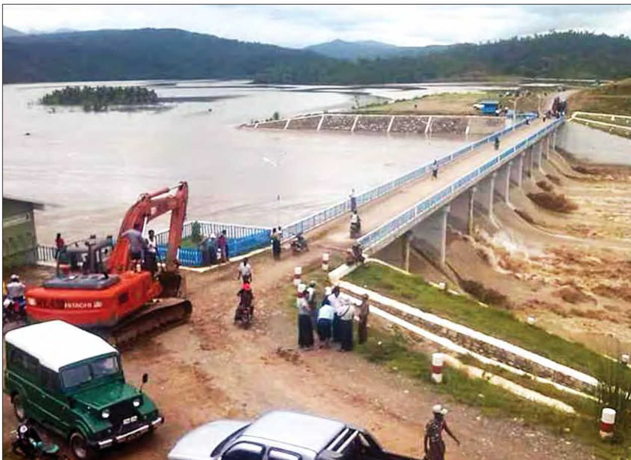
ရာဇဂြိုဟ်ဆည်အတွင်း ရေဝင်ရောက်မှုနှင့် ရေပိုလွှဲမှု ရေထုတ်လွှတ်နေမှုကို ဇူလိုင် ၃ ရက် နံနက်ပိုင်းက တွေ့ရစဉ်။