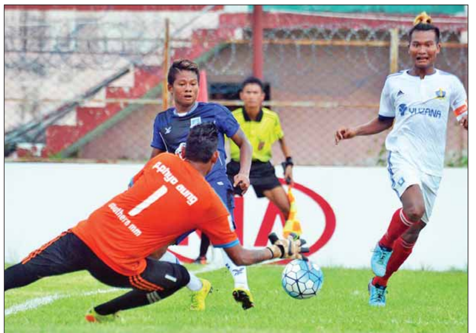
ရတနာပုံအသင်းနှင့် Southern အသင်းတို့ယှဉ်ပြိုင်နေစဉ်။

ယခုရာသီတွင် ပုံမှန်ခြေစွမ်းပြ နေသည့် ရတနာပုံအသင်းသည် ကိုးပွဲဆက် အနိုင်ရလဒ်နှင့်အတူ ချန်ပီယံဖြစ်ရန် ပိုမိုနီးစပ်လာခဲ့သည်။ အမာခံကစားသမားအချို့ မပါနိုင် သော်လည်း ရတနာပုံအသင်းသည် အိမ်ကွင်း၌ ခြေစွမ်းပြကစားနိုင်ခဲ့ပြီး ဂိုးပြတ် အနိုင်ရရှိခဲ့ခြင်းဖြစ်သည်။ Southern အသင်းသည် ယခု နောက်ပိုင်း ပွဲစဉ်များတွင် နှိုးပွဲဆက် လာသောကြောင့် တန်းဆင်းရန်အတွင်း မှ ရုန်းထွက်နိုင်ရန် ဖိအားများလာခဲ့ သည်။ စာမျက်နှာ ၈ ကော်လံ ၃ သို့*