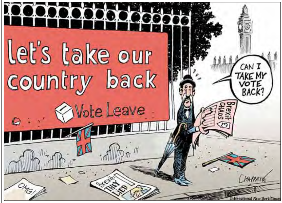
ကာတွန်းစာသားဘာသာပြန် နောက်ခံပိုစတာက “ကျုပ်တို့တိုင်းပြည်အချုပ်အခြာအာဏာ ကျုပ်တို့ပြန်ယူမယ်”ဟု ရေးထားပြီး သတင်းစာဖတ်သူက ဗြိတိန်ခွဲထွက်ရေးကြောင့် စီးပွားရေးကသောင်းကနင်းဖြစ်နေတာကို ဖတ်ပြီး “ကျွန်တော့်ဆန္ဒမဲ ကျွန်တော်ရုပ်သိမ်းလို့မရဘူးလား”လို့ မေးခွန်းထုတ်နေတာပါ။

အများပြည်သူဆိုင်ရာ ဥပဒေပညာရှင်တစ်ဦးကလည်း Times သတင်းစာမှာ “ဝန်ကြီးချုပ်ဟာ ပါလီမန်ရဲ့ ဥပဒေပြဌာန်းချက်မရှိဘဲခွဲထွက်ဖို့ ဥရောပကောင်စီထံ အကြောင်းကြားပိုင်ခွင့် မရှိပါဘူး” လို့ ရေးသားခဲ့ပါတယ်။ ဗြိတိန်ဝန်ကြီးချုပ်က ပါလီမန်ရဲ့ ဥပဒေပြဌာန်းချက်မရှိဘဲ ခွဲထွက်ဖို့ ဥရောပကောင်စီထံ အကြောင်းကြားတာကို ဟန့်တားနိုင်ဖို့ ဗြိတိန်လူထုဆီကနေ အလှူငွေကြေးစုစည်းကောက်ယူနေတဲ့ အင်တာနက်စာမျက်နှာ (Crowd Justice Website)က “မှတ်မိသရွေ့ကာလအတွင်း ဒီကိစ္စကအရေးအကြီးဆုံး အများပြည်သူဆိုင်ရာ ဥပဒေကိစ္စပါ” လို့ တပ်လှန်နှိုးဆော်ထားပါတယ်။ ဗြိတိန်ခွဲထွက်