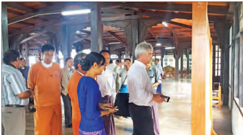
နှင့် ဌာနဆိုင်ရာအကြီးအကဲများက ကြိုဆိုပြီး ဟော်နန်းနှင့် ဖော်ဘွားကြီးများ၏ အုတ်ဂူသင်္ချိုင်းအား ကြည့်ရှု၍ ပတ်သက်သော အချက်အလက်များကို ရှေးဟောင်း သုတေသနဦးစီးဌာန တာဝန်ခံက ရှင်းလင်းပြောကြားခဲ့ သည်။ ၎င်းအဖွဲ့သည် ညနေပိုင်းတွင် ညောင်ရွှေမြို့ရှိ

အဆိုပါအဖွဲ့အား ရှမ်းပြည်နယ် အင်းသားတိုင်းရင်းသား ရေးရာဝန်ကြီး ဒေါက်တာထွန်းလှိုင်နှင့် ပြည်သူ့လွှတ်တော် ကိုယ်စားလှယ်၊ ရှမ်းပြည်နယ်လွှတ်တော်ကိုယ်စားလှယ်