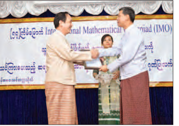
ခုနှစ် ဇူလိုင်လတွင် Hong Kong ၌ ကျင်းပမည့် (၅၇)ကြိမ်မြောက် IMO ပြိုင်ပွဲသို့ သွားရောက်ယှဉ်ပြိုင်ကြမည့် ကျောင်းသား ကျောင်းသူများကို သင်ကြားလေ့ကျင့်ပေးသော ဆရာ ဆရာမများအား ဂုဏ်ပြုလက်မှတ်ချီးမြှင့်ပွဲကျင်းပ ပေးအပ်သည်။

ဆက်လက်၍ ဇူလိုင်လတွင် Hong Kong ၌ ကျင်းပမည့် (၅၇)ကြိမ် မြောက် IMO ပြိုင်ပွဲသို့ သွားရောက်ယှဉ်ပြိုင်ကြမည့် ကျောင်းသား ကျောင်းသူ များကို ထောက်ပံ့ပေးသော အလှူရှင်များအား ဂုဏ်ပြုလက်မှတ်များ ပေးအပ် သည်။ ထို့နောက် မြန်မာနိုင်ငံသင်္ချာအသင်းဥက္ကဋ္ဌ ဒေါက်တာသိမ်းမြင့်က ၂၀၁၆