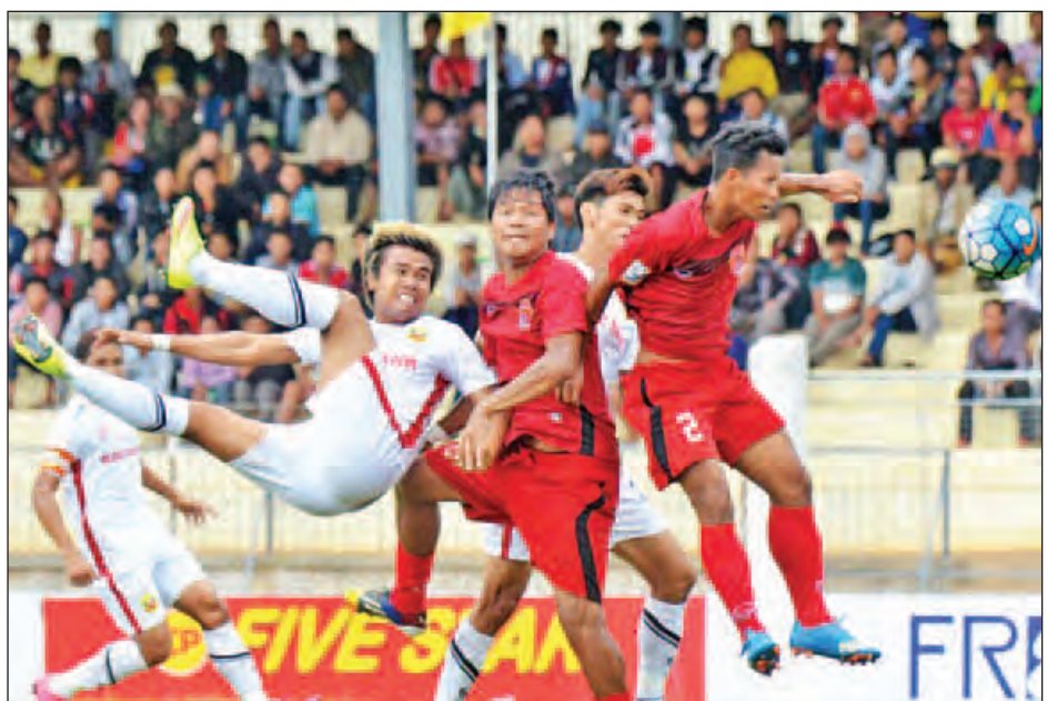
ရှမ်းယူနိုက်တက်နှင့် ဧရာဝတီအသင်းတို့ ယှဉ်ပြိုင်နေစဉ်။