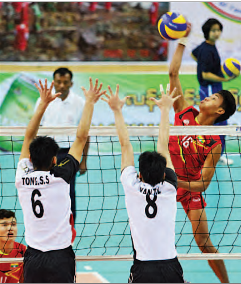
မြန်မာ(ခ)အသင်းနှင့် စင်ကာပူအသင်းတို့ ယှဉ်ပြိုင်နေစဉ်။

ဆက်လက်၍ မြန်မာ-လာအို တပ်မတော်ချစ်ကြည်ရေးပိုက်ကျော်ခြင်းပြိုင်ပွဲကို ဇေယျာသီရိအားကစားရုံ(C)၌ ယှဉ်ပြိုင်ကစားကြရာ မြန်မာ့တပ်မတော်ပိုက်ကျော်ခြင်းအသင်းက လာအိုပြည်သူ့တပ်မတော်ပိုက်ကျော်ခြင်းအသင်းကို ၂၁-၁၈၊ ၂၁-၁၉ မှတ်(နှစ်ပွဲပြတ်)ဖြင့် အနိုင်ရရှိခဲ့သည်။ အဆိုပါချစ်ကြည်ရေးအားကစားပြိုင်ပွဲများကို တပ်မတော်ကာကွယ်ရေးဦးစီးချုပ် ဗိုလ်ချုပ်မှူးကြီး မင်းအောင်လှိုင်၊ ဒုတိယတပ်မတော်ကာကွယ်ရေးဦးစီးချုပ် ကာကွယ်ရေးဦးစီးချုပ်ကြီး(ကြည်း) ဒုတိယဗိုလ်ချုပ်မှူးကြီး စိုးဝင်း၊ ကာကွယ်ရေးဝန်ကြီးဌာန ပြည်ထောင်စုဝန်ကြီး၊ နယ်စပ်ရေးရာဝန်ကြီးဌာန ပြည်ထောင်စုဝန်ကြီး၊ ကာကွယ်ရေးဦးစီးချုပ်(ရေ)၊ ကာကွယ်ရေးဦးစီးချုပ်ရုံးမှ တပ်မတော်အရာရှိကြီးများ၊ နေပြည်တော်တိုင်းစစ်ဌာနချုပ်တိုင်းမှူး၊ မြန်မာနိုင်ငံဆိုင်ရာ လာအိုနိုင်ငံသံအမတ်ကြီးနှင့်ဇနီး၊ လာအို ပြည်သူ့တပ်မတော်မှ Col.Bountao Thongmanila နှင့် အရာရှိများ၊ စစ်သံမှူး Col. Daokai LERTLIBANH တာမျက်နှာ ၉ ကော်လံ ၁ သို့