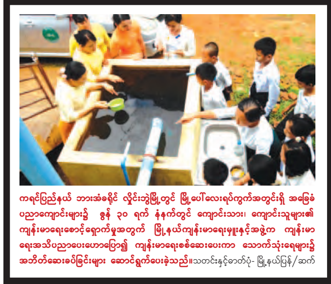
ကရင်ပြည်နယ် ဘားအံခရိုင် လှိုင်းဘွဲ့မြို့တွင် မြို့ပေါ်လေးရပ်ကွက်အတွင်းရှိ အခြေခံပညာကျောင်းများ၌ ဇွန် ၃၀ ရက် နံနက်တွင် ကျောင်းသား၊ ကျောင်းသူများ၏ ကျန်းမာရေးစောင့်ရှောက်မှုအတွက် မြို့နယ်ကျန်းမာရေးမှူးနှင့်အဖွဲ့က ကျန်းမာရေးအသိပညာပေးဟောပြော၍ ကျန်းမာရေးစစ်ဆေးပေးကာ သောက်သုံးရေများ၌ အဘိတ်ဆေးခပ်ခြင်းများ ဆောင်ရွက်ပေးခဲ့သည်။ သတင်းနှင့်စာတတ်ပုံ မြို့နယ်မြန်/ဆက်