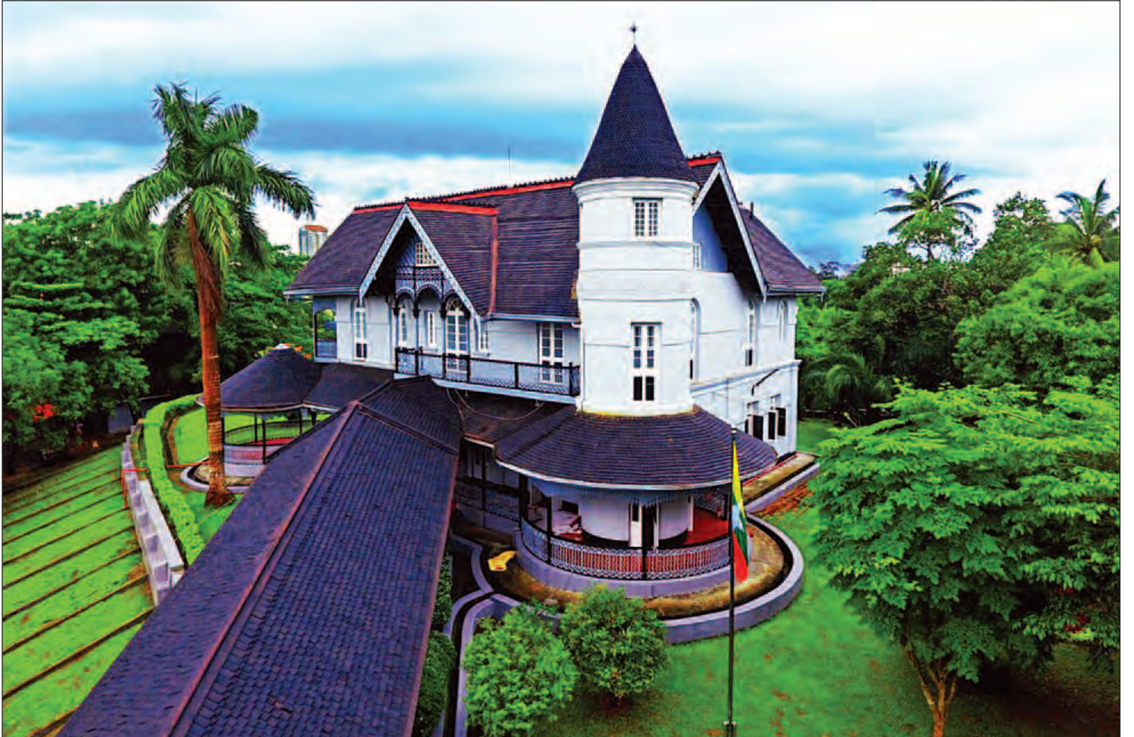
ရန်ကုန်မြို့၊ ဗဟန်းမြို့နယ် ပိုလ်ချုပ်(၁)ရပ်ကွက်ရှိ ပိုလ်ချုပ်အောင်ဆန်းပြတိုက်ကို တွေ့ရစဉ်။

“အာဇာနည်နေ့အတွက် ကျွန်ုပ်တို့ ပုံမှန်လုပ်နေကျဖြစ်တဲ့ ပြတိုက်မွမ်းမံ ပြင်ဆင်တာတွေ၊ ကြိုခိုင်ရေးပိုင်း ပြုပြင်တာတွေ၊ ပြတိုက်ဝင်းနဲ့ အဝင် လမ်း သန့်ရှင်းရေးလုပ်တာတွေ ကတော့ အရင်ကလုပ်ဆောင်နေကျ အတိုင်း ဆောင်ရွက်နေတယ်။ အရင် နှစ်တွေနဲ့မတူတာက ပိုလ်ချုပ် အောင်ဆန်း စာအုပ်ဖတ်နေတဲ့ ဆီလီကွန်ပျူတာရုပ်တုကို ပြတိုက်လေသာ ဆောင်ထားမယ်။ ပြီးတော့ ပိုလ်ချုပ် ဝတ်ဆင်ခဲ့တဲ့ ကုတ်အရှည်ကို ရုပ်လုံး ပေါ်အောင် ပြသထားမယ်။ အရင်လို စာမျက်နှာ ၈ ကော်လံ ၁ သို့ *