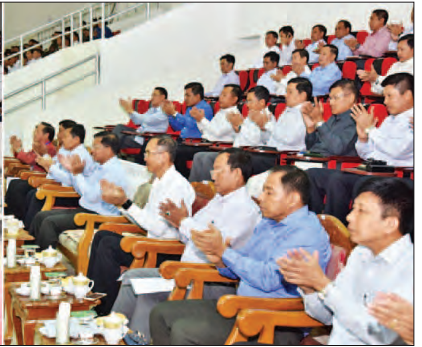
တပ်မတော်ကာကွယ်ရေးဦးစီးချုပ် ဗိုလ်ချုပ်မှူးကြီးမင်းအောင်လှိုင် မြန်မာ-လာအို တပ်မတော်ချစ်ကြည်ရေးပိုက်ကျော်ခြင်းပြိုင်ပွဲကို ကြည့်ရှုအားပေးစဉ်။