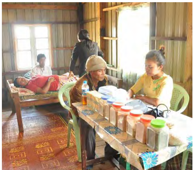
အခမဲ့ကုသပေးခြင်းတို့ကို မွန်းလွဲ ၂ ရွက်ပေးခဲ့ကြကြောင်း သိရသည်။ နာရီမှ ညနေ ၄ နာရီခွဲအထိ ဆောင် (ဟားခါးခရိုင် ဖြန့်/ဆက် )