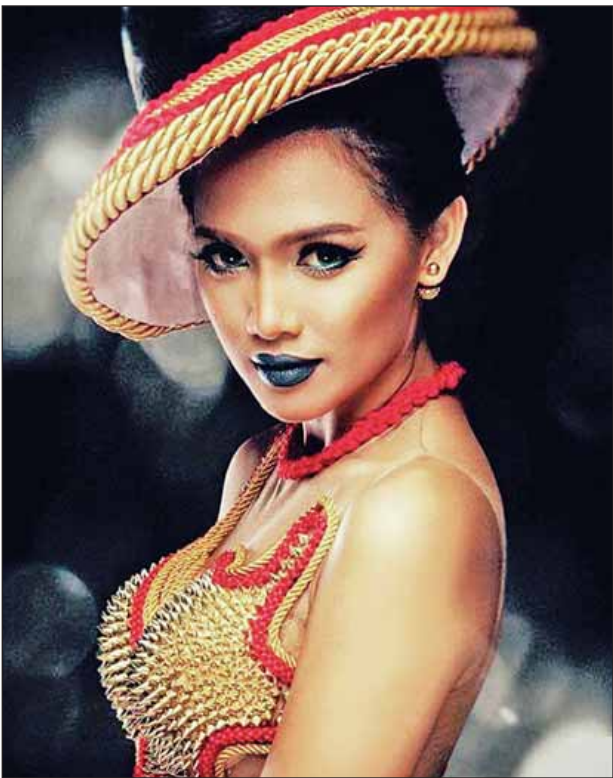
ဇူးရင်းသီးဖက်ရှင်နှင့် အေးမြတ်သူ။

ဖြေ။ ။ ပထမကတော့ ဒီဝတ်စုံလေးကို ကြိုးတွေအများကြီးနဲ့ Elegant ဂါဝန်အပျော့ပုံစံလေးဖန်တီးချင်တာ။ ဂါဝန်အောက်နားပတ်လည်မှာ ကြိုးတွေ ထည့်ချင်ပေမယ့် အချိန်အရရော၊ ပစ္စည်းအရရော မထည့်လိုက်နိုင်ခဲ့ဘူး။ အဲတော့ ကိုယ်ထည့်မှာပဲ ကြိုးတွေအကုန်လုံးခွေပြီး ကနုတ်ပုံစံဖန်တီးလိုက်တယ်။