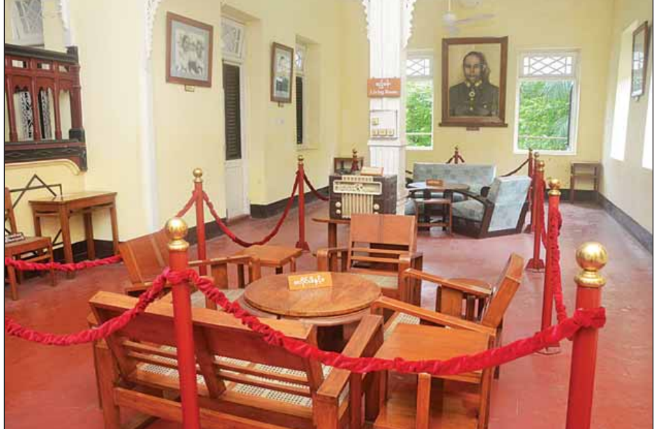
ပိုလ်ချုပ်ပြတိုက်အတွင်း ခင်းကျင်းပြသထားသော ဧည့်ခန်း။

ပြတိုက်၏မြေကွက်သည် ဘဲပုံသဏ္ဍာန်ဖြစ်ပြီး ခြံဝင်းအကျယ်မှာ ၂ သမ ၄၂၃ ဧက ရှိကာ ၁၉၂၁ခုနှစ်တွင်ဆောက်လုပ်ခဲ့သည့် အဆောက်အအုံဖြစ်၍ အနောက်တိုင်း ဗိသုကာဟန် ရောနှောတည်ဆောက်ထားသော နှစ်ဆယ်ရာစု ဥရောပပုံစံဖြစ်သည်။ နေအိမ်အဆောက်အအုံမှာ ခြံဝင်းအတွင်း၌ရှိသော ၁၈ ပေမြင့်သည့် ကုန်းပေါ်တွင် တောင်ဘက်သို့ မျက်နှာစာပြုကာ တည်ဆောက်ထားခြင်းဖြစ်သည်။