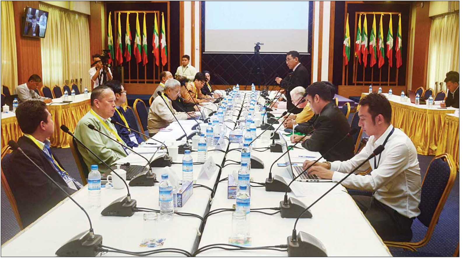
ပြည်ထောင်စုငြိမ်းချမ်းရေးညီလာခံ (၂၁ ရာစုပင်လုံ)အကြိုပြင်ဆင်ရေးကော်မတီနှင့် UNFC က ဖွဲ့စည်းထားသည့် နိုင်ငံရေးဆိုင်ရာ ညှိနှိုင်းဆွေးနွေးရေးကိုယ်စားလှယ်အဖွဲ့တို့ တွေ့ဆုံဆွေးနွေးစဉ်။

ကချင်ပြည်နယ် မိုင်ဂျာယန်တွင်ပြုလုပ် မည့် တိုင်းရင်းသားလက်နက်ကိုင် အဖွဲ့အစည်းများအားလုံးပါဝင်သည့် ညီလာခံမတိုင်မီ တစ်နိုင်ငံလုံးပစ်ခတ် တိုက်ခိုက်မှုရပ်စဲရေးဆိုင်ရာ(NCA) စာချုပ် လက်မှတ်ရေးထိုးထားခြင်းမရှိ သေးသည့် တိုင်းရင်းသားလက်နက်ကိုင် အဖွဲ့အစည်းများနှင့် နိုင်ငံတော်၏ အတိုင်ပင်ခံပုဂ္ဂိုလ်တို့ တွေ့ဆုံသွား မည်ဖြစ်ကြောင်း ပြည်ထောင်စု ငြိမ်းချမ်းရေးညီလာခံ (၂၁ ရာစုပင်လုံ) အကြို ပြင်ဆင်ရေးကော်မတီနှင့် UNFC က ဖွဲ့စည်းထားသည့် နိုင်ငံ ရေးဆိုင်ရာ ညှိနှိုင်းဆွေးနွေးရေး ကိုယ်စားလှယ်အဖွဲ့ (Delegation for Political Negotiation - DPN)တို့ တွေ့ဆုံသည့် အစည်းအဝေး မှ သိရသည်။