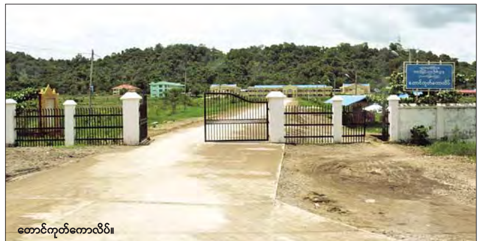
တောင်ကုတ်ကောလိပ်။

တောင်ကုတ်-ကျောက်ဖြူ ကားလမ်းမှာ မိုင် ၁၂၀ ဝေးပြီး တောင်ကုတ်-ပြည်မှာ မိုင် ၁၀၀ ခန့်သာဝေးသည်။ တောင်ကုတ်-သံတွဲမှာ ၄၄မိုင်ဝေးရာ ကားလမ်းများလည်း ကောင်းမွန်သဖြင့် ရာသီဥတုကောင်းမွန်လျှင် သွားလာရေးအဆင်ပြေသည်။ တောင်ကုတ်မြို့သည် တည်ငြိမ်အေးချမ်းသဖြင့် နေချင်စဖွယ်ဖြစ်သည်။ကျွန်တော်တို့ အဝေးပြေးဂိတ်မှတည်းခိုရာ ပြန်ချိန်တွင် မှောင်ရိပ်သန်းနေပြီ။ တောင်ကုတ်မိုးက စွေနေဆဲပင်။ ။