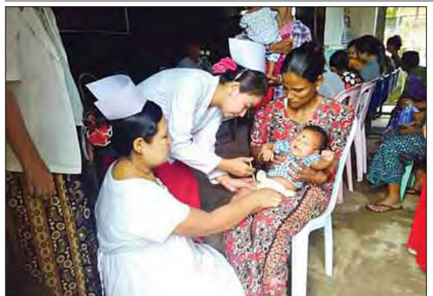
ဒေးဒရီမြို့နယ် ပြည်သူ့ကျန်းမာရေးဦးစီးဌာနမှ ပြင်းထန်အဆုတ်ရောင် ရောဂါပိုး ကာကွယ်ဆေးအသစ်(PCV) ထိုးနှံခြင်းဆောင်ရွက်မှုကို ဇူလိုင် ၁ ရက်မှ ၃ ရက်အထိ မြို့ပေါ်ရပ်ကွက်များနှင့် ကျေးရွာများတွင် ဆောင်ရွက် ပေးစဉ်။ (သပြေထွန်း)

ပဲခူးတိုင်းဒေသကြီး ပြည်သူ့ကျန်းမာရေးဦးစီးဌာန ပုံမှန်ကာကွယ်ဆေးထိုး လုပ်ငန်းတွင် ပြင်းထန်အဆုတ်ရောင်ရောဂါကာကွယ်ဆေးအသစ်(PCV-10) ထည့်သွင်းထိုးနှံခြင်း အခမ်းအနားကို ဇူလိုင် ၁ ရက် နံနက် ၉ နာရီက ပဲခူးမြို့ မြို့တော်ခန်းမ၌ စည်ပင်သာယာရေးနှင့် လူမှုရေးဝန်ကြီးဦးမောင်မောင်လွင်က အဖွင့်အမှာစကားပြောကြားပြီး ပဲခူးတိုင်းဒေသကြီးပြည်သူ့ကျန်းမာရေးဦးစီး ဌာနမှူး ဒေါက်တာအောင်ကျော်ထွေးက ပြင်းထန်အဆုတ်ရောင်ကာကွယ်ဆေး အသစ်(PCV-10)နှင့် ပတ်သက်၍ ရှင်းလင်းတင်ပြကာ အသက်နှစ်လ အရွယ်ကလေးများအား ယင်းဆေးအသစ်ကို ပုံမှန်ကာကွယ်ဆေးထိုးအစီအစဉ် တစ်ရပ်အဖြစ် စတင်ထိုးနှံပေးကြောင်းသိရသည်။ (ခရိုင် ပြန်/ဆက်)