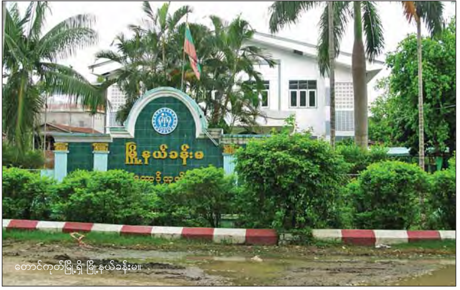
တောင်ကုတ်မြို့ရှိ ကျွန်ုပ်တို့၏ အောင်မြင်မှု။

တောင်ကုတ်တက္ကသိုလ်မှ တောင်ကုတ်မြို့တွင်းသို့ ပြန်လာခဲ့ကြသည်။ တောင်ကုတ်မြို့တွင်း၌ ဆိုင်ကယ်