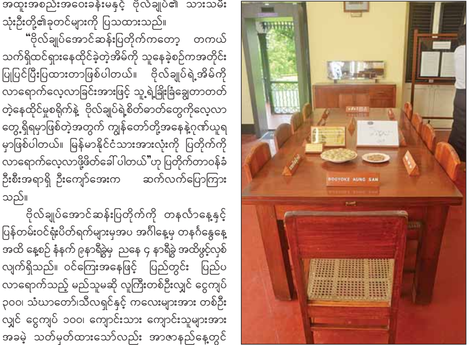
ပိုလ်ချုပ်ပြတိုက်အတွင်းရှိ ခင်းကျင်းပြသထားသော ထမင်းစားခန်း။

ယခု၂၀၁၆ ခုနှစ်တွင်မူ ယခင်နှစ်များက မရှိသေးသည့် လုံခြုံရေးကင်မရာများ တပ်ဆင်ထားသည့်အပြင် မီးဘေးကာကွယ်ရေးအတွက် မီးသတ်ပိုက်များပါ တပ်ဆင်ထားပြီး ပုံမှန်ပြင်ဆင်မှုများအဖြစ် ပြတိုက်အတွင်းအပြင် ဆေးများသုတ်ခြင်း၊ အပေါ်ထပ်တွင် ရေနံချေးသုတ်ခြင်းတို့ လုပ်ဆောင်လျက်ရှိသည်။ ထို့ပြင်ယခုနှစ် အာဇာနည်နေ့အထိ ပိုလ်ချုပ်အောင်ဆန်း၏ ပုံတူ သုံးဘက်မြင် ရုပ်တုကို ပိုလ်ချုပ်ပြတိုက်၌ထားရှိကာ အများပြည်သူများကို ပြသသွားရန် စီစဉ်ထားကြောင်း သိရသည်။