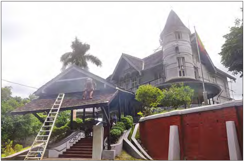
ရန်ကုန်မြို့ရှိ ပိုလ်ချုပ်အောင်ဆန်းပြတိုက်အား တွေ့ရစဉ်။

၁၉၆၂ ခုနှစ် ဇူလိုင်လ ၁၉ ရက်နေ့မှ ၂၅ ရက်နေ့အထိ (၂၅) နှစ်မြောက်အာဇာနည်နေ့ အထိမ်းအမှတ်အခမ်းအနားနှင့်အတူ ပိုလ်ချုပ်အောင်ဆန်းပြတိုက်ကို