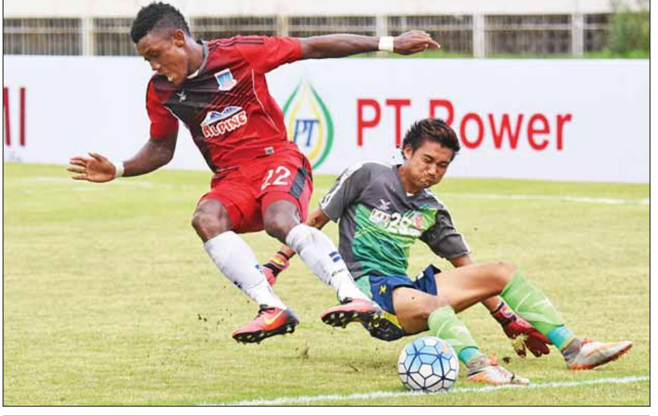
ရတနာပုံတိုက်စစ်မှူး မာတူနာ၏ ထိုးဖောက်မှုကို Horizon ရိုးသမား ကာကွယ်နေစဉ်။

အမှတ်ပေးပြိုင်ပွဲတွင် ချန်ပီယံဆု ဆွတ်ခူးနိုင်ရန် အလားအလာကောင်းနေသည့် ရတနာပုံအသင်းမှာ ရှုံးထွက်ပြိုင်ပွဲတွင်လည်း ရလဒ်ကောင်းရယူနိုင်ခဲ့ပြီး ရိုးပြတ်နိုင်ပွဲနှင့်အတူ ကွာတားဖိုင်နယ်သို့ တက်ရောက်ခဲ့သည်။ Horizon အသင်းမှာ ကစားသမားအစုံအလင်ဖြင့် ကြိုးပမ်းခဲ့သော်လည်း ဒုတိယအဆင့်မှထွက်ခဲ့ရသည်။ စာမျက်နှာ ၉ ကော်လံ ၅ သို့ ○