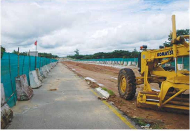
ကိုလွင်(ဆွေ)

ရေတာရှည် ဇွန် ၂၆ ရန်ကုန်-နေပြည်တော်အမြန်လမ်းပိုင်းတွင် ပြုပြင် ရေးလုပ်ငန်းများဆောင်ရွက်နေသည့် နေရာများ၌ ယာဉ်အန္တရာယ်ဖြစ်ပွားမှုမဖြစ်ပွားစေရေးအတွက် အရှိန်လျှော့ကာ မောင်းနှင်သင့်ကြောင်း တာဝန် ရှိသူတစ်ဦးက ပြောကြားသည်။