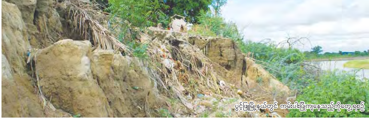
ပွင့်ဖြူမြို့နယ်တွင် တစ်-ပါး-မြို့ကျနေသည့်စိုက်ပျိုးရေးစိုက်

ဖွင့်ဖြူ ဇွန် ၂၆ မကွေးတိုင်းဒေသကြီး မင်းဘူးခရိုင် ပွင့်ဖြူမြို့နယ် ပညောင်ပင်ရွာကျေးရွာတွင် ၂၀၁၅ ခုနှစ် ဩဂုတ် လအတွင်း မုန်းချောင်းရေကြီးမှုများကြောင့် မုန်းချောင်းကမ်းပါးနေ လူနေအိမ်လေးလုံး ကမ်း ပါးပြိုကျပျက်စီးခဲ့ရသည်။ ပညောင်ပင်ရွာ ကျေးရွာ တွင် အိမ်ထောင်စု ၃၀၈ စုရှိပြီး ယခင်ကာလက ကမ်းပါးပြိုကျသဖြင့် လူနေအိမ် အလုံး ၂၀ ဖျက်သိမ်း ရွှေ့ပြောင်းခဲ့ရသည်။ ယခုအခါ အဆိုပါကျေးရွာ သည် မုန်းချောင်းကမ်းပါးအနီးတွင် ကျေးရွာတည် ရှိနေသဖြင့် ကမ်းပါးပြိုကျမှုများ ထပ်မံမဖြစ်ပေါ်