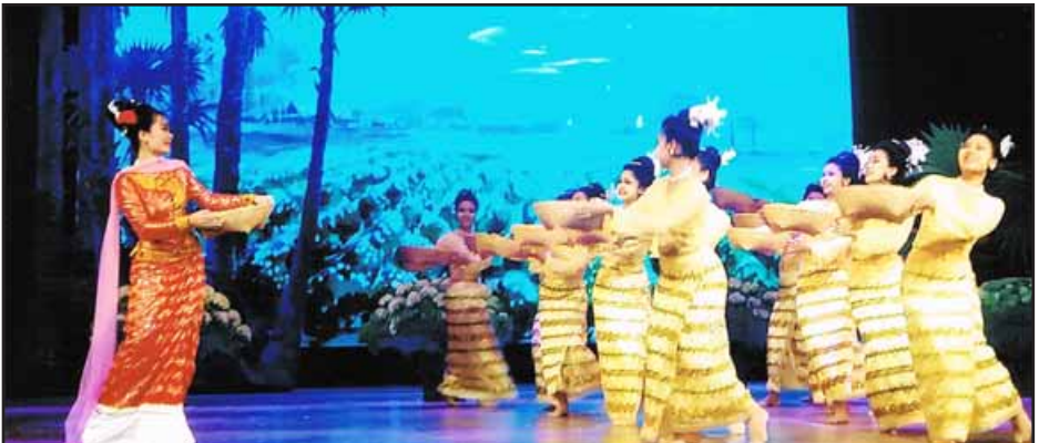
မသီရိနှင့် မန်ကျည်းစင် ကျေးလက်ပျိုဖြူများ “ဝါကောက်ယိမ်း”

“သီရိဝံသ” ဇာတ်ကြီး ဤတွင် နိဂုံးကမ္မတ် အဆုံးသတ် လေပြီ။ ဇာတ်၏ အနှစ်ချုပ်ကို စစ်ထုတ်ကြည့်ပြန်တော့ ပဒေသရာဇ် အရင်းရှင်စနစ် မတရားမှုတွေကြောင့် အများစု အကျိုး မဖြစ်ထွန်းတဲ့အပြင် အဆိုးအညစ်အရှေးတွေနဲ့ ပြည်သူတွေ ဆင်းရဲတွင်း နက်ခဲ့ကြသည်။ ဆန်ကွဲထမင်း ချက်၍ ဟင်းရွက်ရေလုံနဲ့ မသေရဲအသက်ဆက်ခဲ့ကြရတဲ့ အပြင် အဘက်ဘက်က ညှိုးငယ်လာတော့ ကိုးကွယ်ရာ အလျင်အမြန်ကပ်၍ ဘုရင်မင်းမြတ်ချမှတ်သည့် စည်းကမ်း ဥပဒေသာလျှင် ယခုအခြေမှာ ကိုးကွယ်ရာဖြစ်ကြောင်း ဤ “သီရိဝံသ” ရာဇဝင်ကို မှတ်စရာအသွင်မပြတ် ဖော်ညွှန်း၍ ဇာတ်မဟာမော်ကွန်းတင်ကြလေတော့ သတည်း။ ။