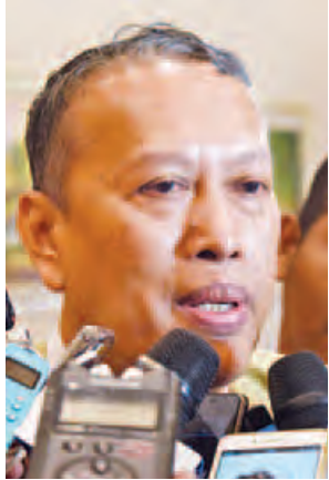
ဦးလှမောင်ရွှေ

နိုင်ငံတော်၏အတိုင်ပင်ခံပုဂ္ဂိုလ် ဒေါ်အောင်ဆန်းစုကြည်နှင့် ငြိမ်းချမ်းရေးလုပ်ငန်းစဉ် ဦးဆောင်အဖွဲ့(PPST)တို့သည် ယနေ့နံနက် ၁၀ နာရီက နေပြည်တော်တွင် တွေ့ဆုံဆွေးနွေးကြသည်။ ထိုသို့ နိုင်ငံတော်၏အတိုင်ပင်ခံပုဂ္ဂိုလ်ပါဝင်သော အစိုးရအဖွဲ့နှင့် PPST တွေ့ဆုံဆွေးနွေးမှုသည် ပထမဆုံးအကြိမ် တွေ့ဆုံမှုဖြစ်သော်လည်း နားလည်မှုရှိသော၊ ပွင့်လင်းမှုရှိသော အပြန်အလှန်ဆွေးနွေးမှုများဖြင့် ရလဒ်ကောင်းများ ရရှိခဲ့သည်ဟု ဆွေးနွေးပွဲမှတစ်ဆင့် သိရသည်။ ငြိမ်းချမ်းရေးဖြစ်စဉ်အတွက် ဆွေးနွေးခဲ့သည့် ဆွေးနွေးပွဲအပေါ် နှစ်ဖက်ပါဝင်ဆွေးနွေးကြသူများက ဤသို့ ပြောကြားကြသည်။