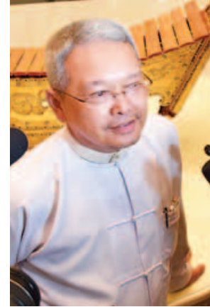
ဒုတိယဗိုလ်ချုပ်ကြီးခင်ဇော်ဦး(ငြိမ်း)

ဦးလှမောင်ရွှေ(အတွင်းရေးမှူး၊ ပြည်ထောင်စုငြိမ်းချမ်းရေးညီလာခံ (၂၁ ရာစု ပင်လုံ)အကြိုပြင်ဆင်ရေးကော်မတီ) နိုင်ငံတော်၏ အတိုင်ပင်ခံပုဂ္ဂိုလ် ဒေါ်အောင်ဆန်းစုကြည် ဦးဆောင်တဲ့ အစိုးရအဖွဲ့နဲ့ NCA လက်မှတ်ရေးထိုးထားတဲ့ တိုင်းရင်းသားလက်နက်ကိုင်အဖွဲ့ (၈)ဖွဲ့တို့ရဲ့ ဆွေးနွေးပွဲက ၂ နာရီ မိနစ် ၅၀ ကြာ ဆွေးနွေးခဲ့တယ်။ မကြာမီပြုလုပ်မယ့် ငြိမ်းချမ်းရေးညီလာခံပတ်သက်တဲ့ အဓိကအချက်တွေ ဆွေးနွေးခဲ့ပါတယ်။ ဩဂုတ်လ နောက်ဆုံးပတ်ထက် နောက်မကျဘဲနဲ့ စတင်သင့်တယ်လို့ နှစ်ဖက်လုံးက မူအားဖြင့်ဆွေးနွေးချက်တွေ ရှိပါတယ်။