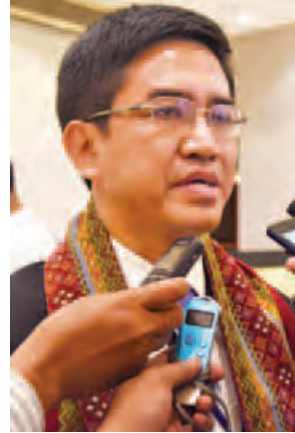
ပူးဇင်ကျား