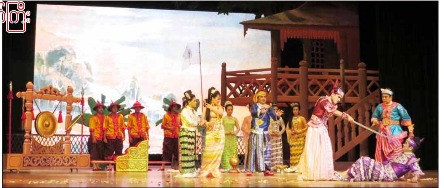
မတရားမှုကို ခေါင်းငုံ့မခံ “မောင်ဝံသ” ပဏ္ဏာကောက်ခန်းတွင် ရဲသီဟကို တော်လှန်စဉ်။

“အင်းဝ” နေပြည်တော်တွင် ထီးနန်းစိုးစံတော်မူခဲ့သော ညောင်ရမ်းခေတ်၊ စတုတ္ထမြောက် သာလွန်မင်းတရား (မြန်မာသက္ကရာဇ် ၉၄၆-၁၀၀၀) လက်ထက်တော်အခါက အဖြစ်အပျက်တစ်ခုကို အခြေခံ၍ ယဉ်ကျေးမှုဝန်ကြီးဌာနက “သီရိဝံသ” ရာဇဝင်ဇာတ်ကြီးအဖြစ် တင်ဆက်ခဲ့သည် မှာ နှစ်ပေါင်း ၄၀ကျော်ကြာခဲ့ပါပြီ။ ထိုအချိန်က ထိုဇာတ်ကြီး စီစဉ်ရေးသားညွှန်ကြားသူမှာ ကွယ်လွန်သူ ဇာတ်စာရေး ဆရာကြီး ဘိုကလေးလှထွန်းဖြစ်ပြီး ၁၉၅၅ ခုနှစ်ခန့်က ယဉ်ကျေးမှုဇာတ်ဌာန (ယခင်အခေါ်အဝေါ်) ကဇာတ် အဖွဲ့ခွဲ(၁)မှ မြန်မာတစ်ပြည်လုံးရှိ တိုင်းနှင့်ပြည်နယ် မြို့ကြီးများ (ထိုစဉ်က အသွားအလာခက်ခဲသည့် ချင်း ပြည်နယ်မှအပ)သို့ လှည့်လည်ကပြခဲ့သည်။