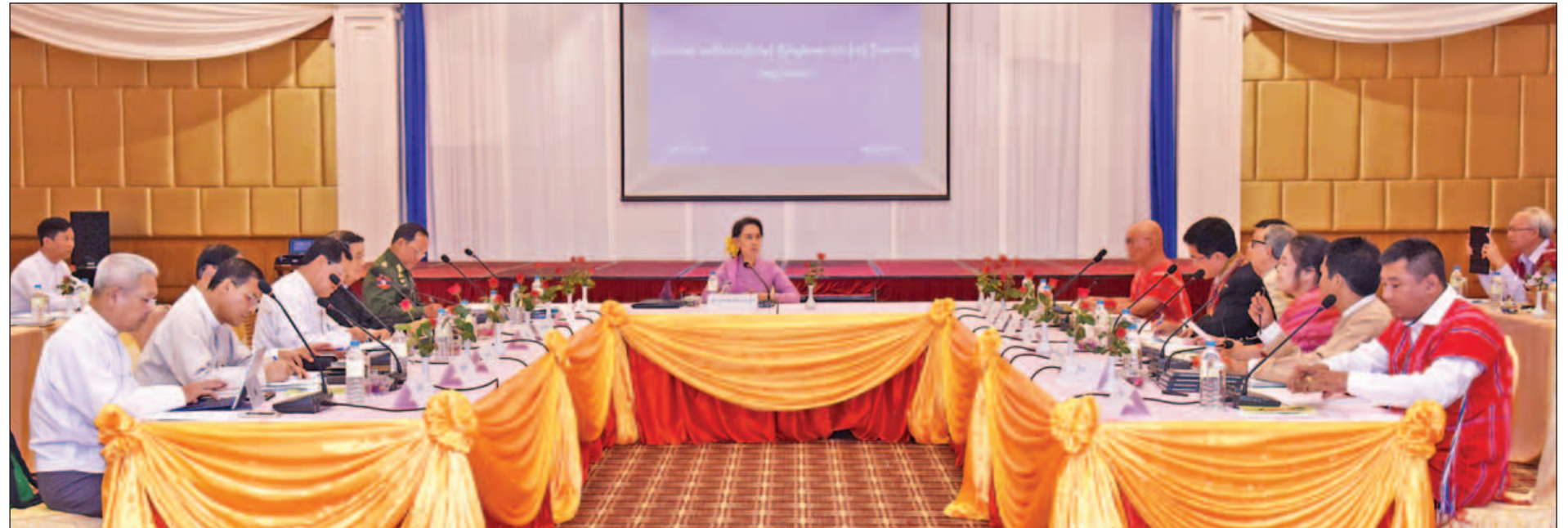
နိုင်ငံတော်၏အတိုင်ပင်ခံပုဂ္ဂိုလ် ဒေါ်အောင်ဆန်းစုကြည်နှင့် ငြိမ်းချမ်းရေးလုပ်ငန်းစဉ်ဦးဆောင်အဖွဲ့တို့ တွေ့ဆုံဆွေးနွေးကြစဉ်။ (သတင်းစဉ်)

“နောင်မျိုးဆက်တွေအတွက်ထားခဲ့ရမယ့် အကောင်းဆုံးအမွေအနှစ်ဆိုတာ ငြိမ်းချမ်းရေးပါ။ ကျွန်မတို့နိုင်ငံဟာ ငြိမ်းချမ်းမှု တိုးတက်နိုင်မှာပါ။ မငြိမ်းချမ်းတဲ့နိုင်ငံဟာ တိုးတက်ဖို့ဆိုတာ ဘယ်လိုမှမဖြစ်နိုင်ပါဘူး။ ညီညွတ်မှု ငြိမ်းချမ်းနိုင်မှာပါ။ ဒါကြောင့် ကျွန်မတို့က ညီညွတ်ရေးကိုရှာဖွေရမယ်။ ညီညွတ်ရေးကိုအခြေခံတဲ့ ငြိမ်းချမ်းရေးကိုတည်ဆောက်ရမယ်”ဟု နိုင်ငံတော်၏အတိုင်ပင်ခံပုဂ္ဂိုလ် ဒေါ်အောင်ဆန်းစုကြည်က ပြောကြားလိုက်သည်။ စာမျက်နှာ ၈ ကော်လံ ၁ သို့ *