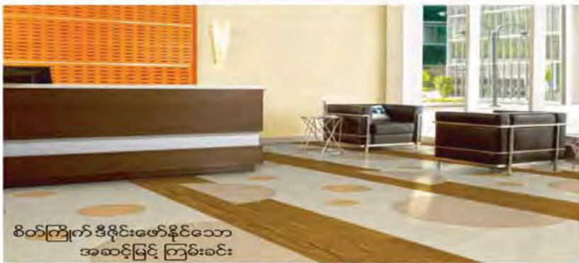
စိတ်ကြိုက် ဒီဇိုင်းဖော်နိုင်သော အဆင့်မြင့် ကြမ်းခင်း