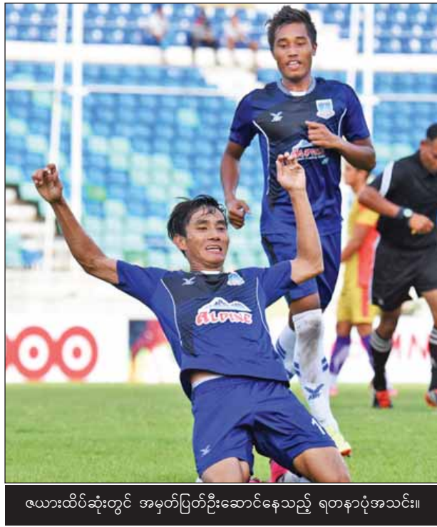
ယောထိပ်ဆုံးတွင် အမှတ်ပြတ်ဦးဆောင်နေသည့် ရတနာပုံအသင်း။

ကျောပိုးမှ နှစ်ပွဲ သရေကျထားသည်။ အခြားအသင်းများ ခြေစွမ်းနှင့်ရလဒ်ပိုင်း မတည့် ငြိမ်နေချိန်တွင် ရတနာပုံအသင်းသည် အမှားအယွင်းမရှိဘဲ ခြေစွမ်းပိုင်း တည်ငြိမ်ခဲ့သောကြောင့် အမှတ်ပြတ်သွားခြင်းဖြစ်သည်။ နည်းပြ အပြောင်း အလဲရှိခဲ့သည့် လက်ရှိချိန်ပီယံ ရန်ကုန်အသင်းသည် အသင်းကြီးများနှင့် တွေ့ဆုံရာတွင် ရမှတ်များဆုံးရှုံးခဲ့သလို ပထမအကျော့က အနီးကပ်လိုက်လံ ဖိအားပေးနိုင်ခဲ့သည်။ ဟံသာဝတီအသင်းမှာ ရတနာပုံနှင့် ထိပ်တိုက်တွေ့ဆုံမှု တွင် နှုံးနိမ့်ပြီးကတည်းက ရလဒ်များ ဆက်တိုက်ဆုံးရှုံးခဲ့သောကြောင့် ရတနာပုံ အသင်းက လွတ်လွတ်ကျွတ်ကျွတ် ဦးဆောင်ခွင့်ရသွားခြင်းဖြစ်သည်။