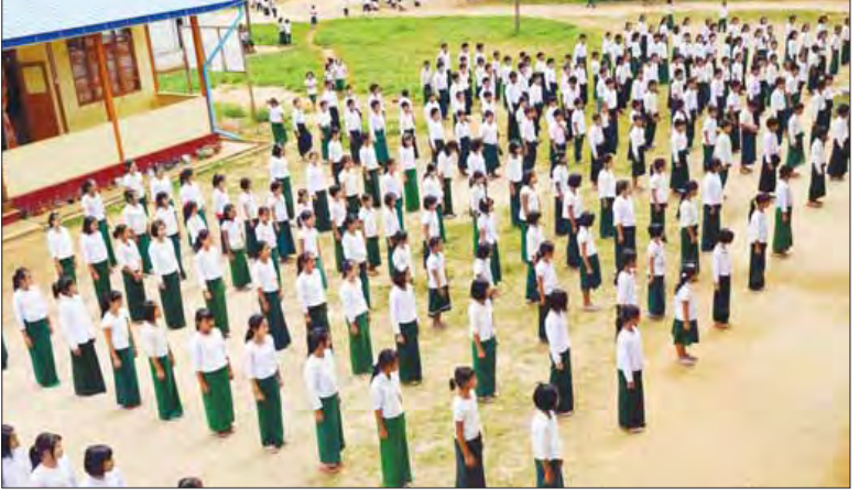
လင်းခေးက အားကစားနှင့် ကာယပညာဦးစီး (၁)၊ (၂) အား ကျောင်းအားကစားကွင်းနေရာ၌ ဌာနမှူးက ကျောင်းသူ ကျောင်းသားများနှင့် သရုပ်ပြဆောင်ရွက်ပေးခဲ့ကြောင်း သိရသည်။ အတူ ကိုယ်ကာယကြံ့ခိုင်ရေး လေ့ကျင့်ခန်း အဖွဲ့