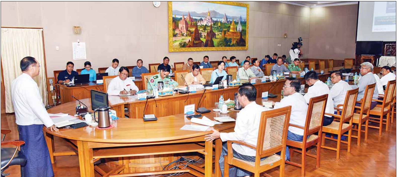
၂၀၁၆ ခုနှစ် (၆၉)နှစ်မြောက် အာဇာနည်နေ့အခမ်းအနား အောင်မြင်စွာကျင်းပနိုင်ရေး ညှိနှိုင်းအစည်းအဝေးကျင်းပစဉ်။ (သတင်းစဉ်)

နေပြည်တော် ဇွန် ၂၇ နောင်လာနောက်သားများ လွတ်လပ်ရေး၏တန်ဖိုးကို သိရှိတန်ဖိုးထား ထိန်းသိမ်း စောင့်ရှောက်နိုင်ရန်နှင့် လွတ်လပ်ရေးမဆုံးရှုံးစေရေး အသက်ပေးကာကွယ် စောင့်ရှောက်သွားမည် ဟူသည့် မျိုးချစ်စိတ်ဓာတ်များ ပိုမို ရှင်သန်တိုးတက် မြင့်မားလာစေရေး အတွက်ရည်ရွယ်၍ အာဇာနည်နေ့ အခမ်းအနားအား ကျင်းပသွားမည် ဖြစ်ကြောင်း ဒုတိယသမ္မတ ဦးမြင့်ဆွေ က ပြောကြားသည်။ နေပြည်တော်ရှိ နိုင်ငံတော်သမ္မတ ရုံး၌ ယနေ့နံနက် ၉ နာရီခွဲတွင် ကျင်းပသည့် ၂၀၁၆ ခုနှစ် (၆၉)နှစ် မြောက် အာဇာနည်နေ့အခမ်းအနား အောင်မြင်စွာကျင်းပနိုင်ရေး ညှိနှိုင်း အစည်းအဝေးတွင် ဒုတိယသမ္မတက ထိုသို့ပြောကြားခဲ့ခြင်းဖြစ်သည်။ ဆက်လက်၍ ဒုတိယသမ္မတက (၆၉)နှစ်မြောက် အာဇာနည်နေ့ စာမျက်နှာ ၃ ကော်လံ ၁ သို့ □