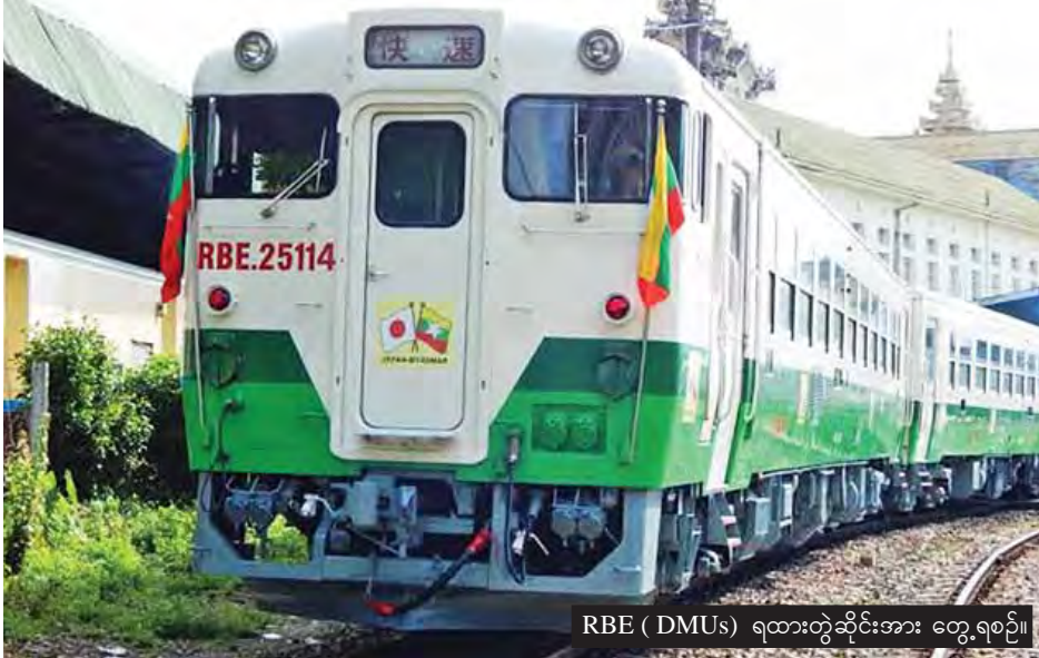
RBE (DMUs) ရထားတွဲဆိုင်းအား တွေ့ရစဉ်။