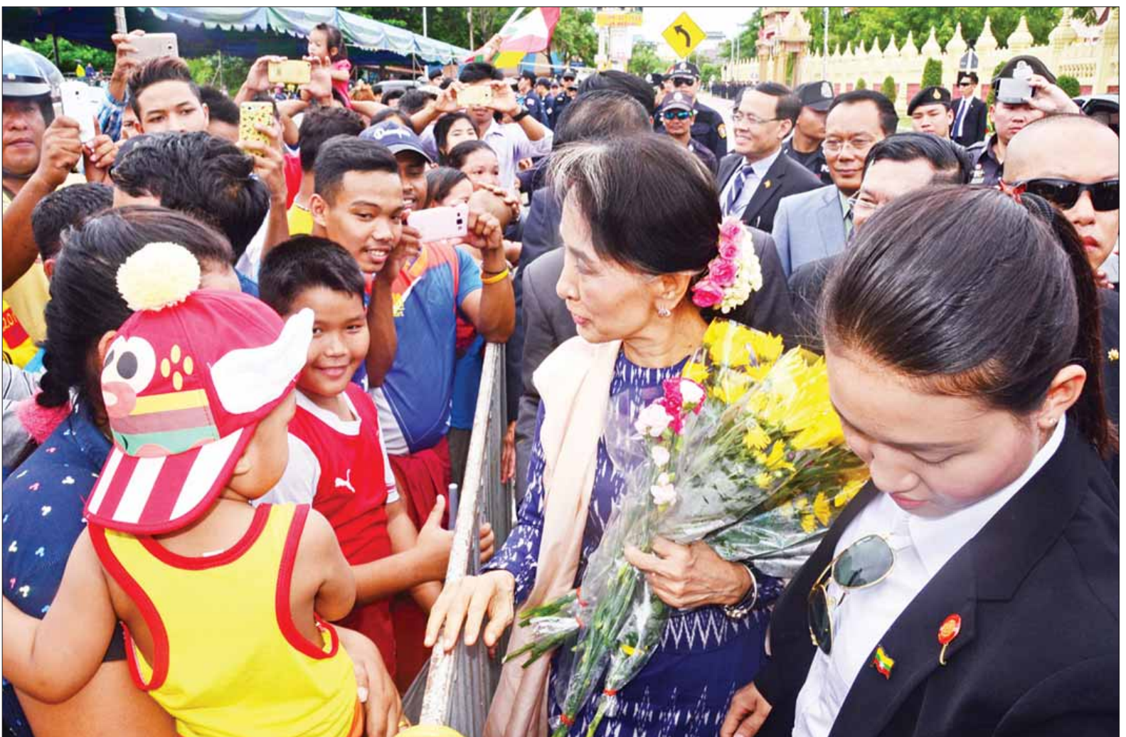
နိုင်ငံတော်၏အတိုင်ပင်ခံပုဂ္ဂိုလ် ဒေါ်အောင်ဆန်းစုကြည် ထိုင်းနိုင်ငံရောက် မြန်မာများအား ရင်းရင်းနှီးနှီးနှုတ်ဆက်စဉ်။ (သတင်းစဉ်)

ထို့နောက် နိုင်ငံတော်၏အတိုင်ပင် ခံပုဂ္ဂိုလ် ဒေါ်အောင်ဆန်းစုကြည်သည် ဘန်ဟိုးအောင် စံပြကျေးရွာအနီး အလုပ်လုပ်ကိုင်နေကြသည့် မြန်မာ အလုပ်သမားများအား တွေ့ဆုံ၍ ရင်းရင်းနှီးနှီးနှုတ်ဆက်သည်။ မွန်းလွဲပိုင်းတွင် နိုင်ငံတော်၏ အတိုင်ပင်ခံပုဂ္ဂိုလ်သည် မြန်မာသံနဲ့၌ Assumption Universityမှ မြန်မာ ဆရာ ဆရာမများ၊ ကျောင်းသား ကျောင်းသူများနှင့်တွေ့ဆုံပြီး မိမိ နိုင်ငံသားများဒုက္ခရောက်လျှင် ကူညီ ကြရမည်ဖြစ်ကြောင်း၊ နိုင်ငံတစ်နိုင်ငံ ၏ တာဝန်သည် နိုင်ငံသူနိုင်ငံသား အားလုံးနှင့်သက်ဆိုင်ကြောင်း၊ ယခု ထိုင်းနိုင်ငံတွင် ရောက်ရှိနေကြသည့် နိုင်ငံသားအချင်းချင်း အပြန်အလှန် ကူညီစေလိုကြောင်း၊ အထူးသဖြင့် ရွှေ့ပြောင်းအလုပ်သမားများနှင့် ဒုက္ခ သည်များကို တတ်နိုင်သည့်ဘက်က ကူညီပေးစေလိုကြောင်း၊ ကျောင်းသား များအနေဖြင့် အသက်အရွယ် ငယ်ရွယ်စဉ်ကပင် ပရဟိတစိတ်ဓာတ် ရှိရန်လိုကြောင်း၊ မိမိတို့နိုင်ငံ၏ကိစ္စ အားလုံးသည် မိမိတို့နှင့်သက်ဆိုင် ကြောင်း၊ ပြောရမည်ဆိုပါက လူသား များ၏ကိစ္စသည် မိမိတို့နှင့်ဆိုင် ကြောင်း၊ မိမိတို့ရရှိထားသည့် အထူး အခွင့်အရေးကို အများအကျိုးအတွက် အသုံးပြုစေလိုပါကြောင်း၊ နိုင်ငံ၏ စာမျက်နှာ ၃ ကော်လံ ၁ သို့ □