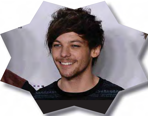
အတွက်လည်း အဖြေမရှိပါဘူး”ဟု အင်တာဗျူးတစ်ခုတွင် ဖြေကြားခဲ့ သည်။

One Direction အဖွဲ့မှ မေမာလိမ် နတ်ထွက်ပြီး နောက်ပိုင်း အဖွဲ့ဝင်များ စိတ်ဝမ်းကွဲကာ အဖွဲ့ယှက်တော့မည့် သတင်းများထွက်ပေါ် လျက်ရှိသည်နှင့်ပတ်သက်ပြီး ဆိုင်မွန်ကော်ဝဲလ်က “သူတို့အဖွဲ့နဲ့ပတ်သက် တဲ့သတင်းတွေထွက်နေတာ သိပေမယ့် အတိအကျ မသိသေးပါဘူး။ အဲဒီ