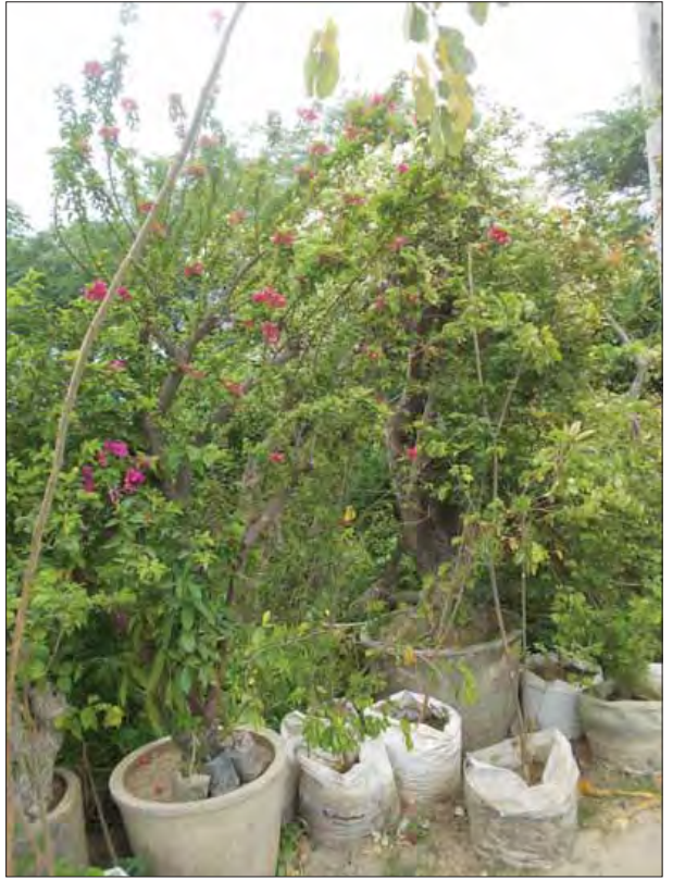
တိမ်တမန်

ပန်းအိုးများကို ပျိုးထောင်ရောင်းချကြသည်။ ထို အပင်များထဲတွင် စက္ကူပန်းပင်ပန်းအိုးများလည်း ပါဝင်သည်။ စက္ကူပန်းပင်ပန်းအိုးတွင်မူလက ရိုးရိုး စက္ကူပန်းအိုး လုံးဒယားမျိုးနှင့်ကိုင်းဆက်ကူးနည်း ဖြင့်ကူးကာ လှပအောင်ပေါင်းစပ်ပျိုးထောင်လေ့ ရှိသည်။ အပင်ပုံသဏ္ဍာန်ကို လိုသလိုပြုလုပ်ပြီးသည် နှင့် လုံးဒယားစက္ကူပန်းမျိုးကို ကိုင်းဆက်ကာ တိတ် ပတ်ခြင်း၊ စက္ကူဖြင့်ကာခြင်း၊ မိုးဒဏ်လေဒဏ်ခံနိုင် ရန် ပလတ်စတစ်အုပ်ခြင်းတို့ ပြုလုပ်ကြသည်။ ခုနစ်ရက်မှ ၁၀ ရက်အတွင်း အတက်ထွက်လာလေ့ ရှိသည်။ လုံးဒယားစက္ကူပန်းမျိုးဖြင့် ကိုင်းကူးပါက အရွက်ဖြူကျားထွက်ကာ အပွင့်အဖြူနှင့်မရန်း ရောင်တို့ပွင့်သည်။ လက်ရှိကာလတွင် ကိုင်းဆက် မျိုးကူးထားသော စက္ကူပန်းပင်များကို လူကြိုက်များ လျက်ရှိပြီးအပင်ကြီးတစ်ပင်လျှင်ငွေကျပ်တစ်သိန်း ကျော်မှ ငါးသိန်းအထိရှိကြောင်းသိရသည်။