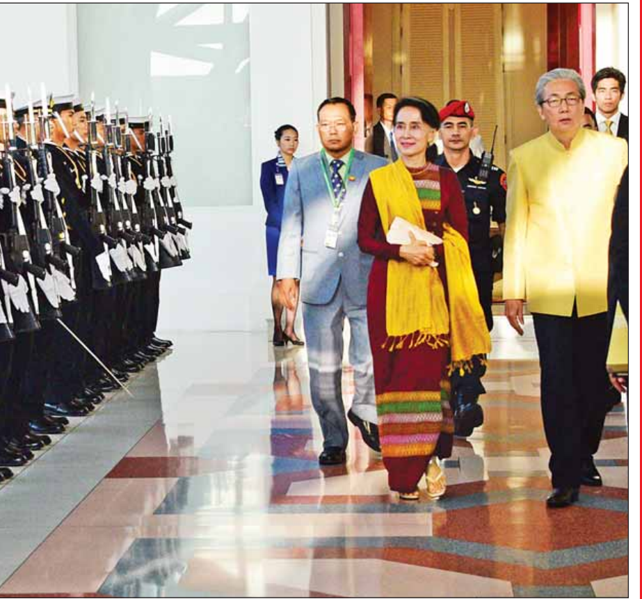
နိုင်ငံတော်၏အတိုင်ပင်ခံပုဂ္ဂိုလ် ဒေါ်အောင်ဆန်းစုကြည် ထိုင်းနိုင်ငံမှ ပြန်လည်ထွက်ခွာရာ ထိုင်းနိုင်ငံ ဒုတိယဝန်ကြီးချုပ်နှင့် တာဝန်ရှိသူများ၊ သံရုံးမိသားစုများက သုဝဏ္ဏဘူမိအပြည်ပြည်ဆိုင်ရာလေဆိပ်၌ ပို့ဆောင်နှုတ်ဆက်ကြစဉ်။