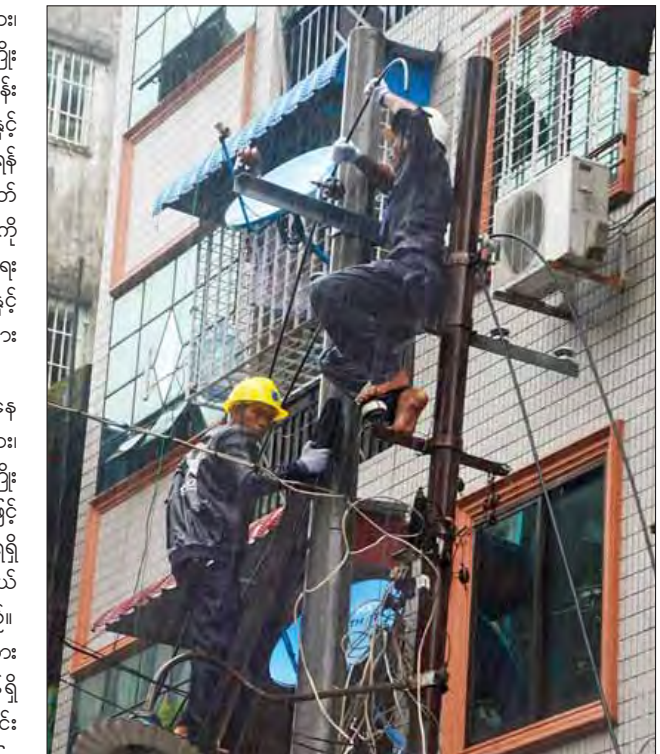
Lighting Star Co., Ltd ရုံးခန်းကို သစ်တောင်ပိုင်းတွင် ဖွင့်လှစ်ပေး မြို့နယ်လျှပ်စစ်မန်နေဂျာရုံး (ဒဂုံမြို့ ခွဲသည်။ (သတင်းစဉ်)

ရှည်လျားနေသည့် ဆားပစ်ကြိုးများ၊ အမြင်မတင့်တယ်သည့် ဆားပစ်ကြိုးများကို စနစ်တကျဖြစ်စေရန် လုပ်ငန်းများဆောင်ရွက်နေမှု (၁၈) ရပ်ကွက်နှင့် (၂၀)ရပ်ကွက်တို့တွင် 200 KV ထရန်စဖော်မာအသစ်တပ်ဆင်ပြီး ဓာတ်အားပို့လွှတ်ရန် ဆောင်ရွက်နေမှုတို့ကို ရန်ကုန် လျှပ်စစ်ဓာတ်အားပေးရေးကော်ပိုရေးရှင်းမှ တာဝန်ရှိသူများနှင့် လွှတ်တော်ကိုယ်စားလှယ်များ သွားရောက်ကြည့်ရှုစစ်ဆေးကြသည်။