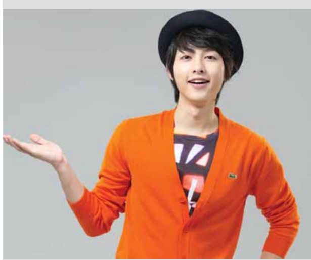
တောင်ကိုရီးယားရုပ်ရှင်သရုပ်ဆောင်တစ်ဦးဖြစ်ပြီး Descendants Of The Sun ဇာတ်ကားဖြင့် အာရှရုပ်ရှင်လောကတွင် နာမည်ရလာခဲ့သူ သရုပ်ဆောင် ဆောင်ရွက်ခဲ့သည့် မေလအတွင်း တောင်ကိုရီးယား ကြော်ငြာ လောက၏ အအောင်မြင်ဆုံးသော သရုပ်ဆောင်တစ်ဦးဖြစ်လာခဲ့သည်။ ဆယ်ကျော်သက်အမျိုးသမီးပရိသတ်များ၏ အထူးအားပေးမှုရရှိ

One Direction အဖွဲ့သည် အချိန်တိုအတွင်း ဝိတလောကတွင် တစ်ရိုက်ထိုး အောင်မြင်မှုရရှိလာခဲ့သည့် အမျိုးသားဝိတအဖွဲ့ တစ်ဖွဲ့ဖြစ် ကြောင်း၊ ၎င်းအနေဖြင့် ၎င်းတို့အဖွဲ့ မပြိုကွဲဘဲ အားလုံးစုံညီစွာဖြင့် ပရိသတ် ရှေ့ပြန်လည်မြင်တွေ့နိုင်ရန် မျှော်လင့်နေသေးကြောင်း ဆိုင်မွန်က ဖြည့်စွက် ပြောကြားခဲ့သည်။