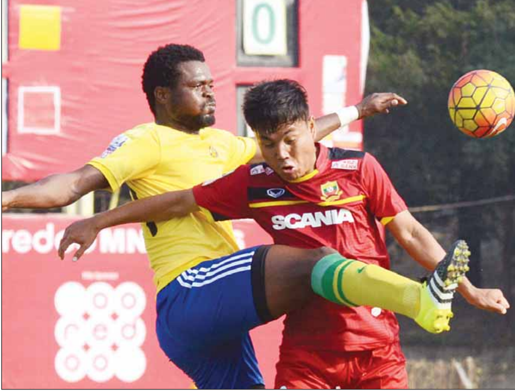
ဇေယျာရွှေမြေနှင့် ရှမ်းယူနိုက်တက်တို့ ပထမအကျော့တွေ့ဆုံခဲ့စဉ်။

၂၀၁၆ ရာသီ MNL အမှတ်ပေးပြိုင်ပွဲမှာ ချန်ပီယံအသင်းထွက်ပေါ်လှဖြစ်နေသော်လည်း အခြားအသင်းများ၏ ရမှတ်များကြောင့် စိတ်ဝင်စားစရာကောင်းနေဆဲဖြစ်သည်။ ယခုတစ်ပတ်တွင် ထိပ်ဆုံးမှ ရတနာပုံအသင်းအမှတ်ထပ်ဖြတ်နိုင်မလား၊ နည်းပြအပြောင်းအလဲလုပ်ထားသည့် ရန်ကုန်အသင်းရှုံးပွဲဆက်မူ ရပ်တန့်နိုင်မလား၊ ဒုတိယအကျော့တွင် သုံးပွဲဆက်အနိုင်ရထားသည့် ရှမ်းနှင့် ဇေယျာရွှေမြေတို့ ထပ်မံနိုင်ပွဲဆက်မလားဆိုသည့် အချက်များကြောင့် စိတ်ဝင်စားစရာကောင်းနေသည်။