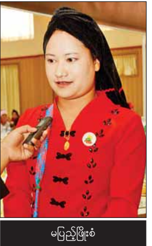
မပြည့်ဖြိုးစံ

လာချင်ပါသေးတယ်။ ကျွန်တော်တို့ကို အခုလို လာရောက်လေ့လာခွင့်ရ အောင် ဆောင်ရွက်ပေးတဲ့ ဝန်ကြီး ဌာနကိုလည်း အလွန်ကျေးဇူးတင်ပါ တယ်ခင်ဗျာ။