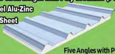
Five Angles with PU

50mm & 35mm Arch Height with Poly Urethane (PU) Sandwich Panel Alu-Zinc Color Roofing Sheet