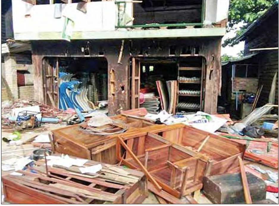
ဝေါမြို့နယ် သူရဲသမိန်ကျေးရွာရှိ ဖျက်ဆီးခံရသည့် နေအိမ်ကို တွေ့ရစဉ်။

နေပြည်တော် ဇွန် ၂၃ ပဲခူးတိုင်းဒေသကြီး ဝေါမြို့နယ် သူရဲသမိန်ကျေးရွာတွင် ရာရှစ် အချို့ ခိုက်ရန်ဖြစ်ပွားမှုအပေါ် ဖြစ်စဉ်အားစိစစ်ပြီး ထိန်းသိမ်း ဆောင်ရွက်လျက်ရှိကြောင်း သိရ သည်။ ဖြစ်စဉ်မှာ ဝေါမြို့နယ် သူရဲသမိန် ကျေးရွာတွင် ယနေ့မနန်းလွဲ ၁ နာရီ ၄၅ မိနစ်ခန့်က ၎င်းကျေးရွာရှိ ကျေးရွာသားအချို့ ခိုက်ရန်ဖြစ်ပွားခဲ့ ကြောင်း သတင်းအရ ၎င်းရွာရဲတပ် စခန်းမှူး ဦးစီးအဖွဲ့မှ သွားရောက် ထိန်းသိမ်းခဲ့ရာ မွန်းလွဲ ၂ နာရီ ၁၅ မိနစ်ခန့်တွင် လူစုကွဲခဲ့ကြောင်း၊ ခိုက်ရန်ဖြစ်ပွားမှုကြောင့် ရာရှစ် ဆိုသူမှာ ဝဲဘက်ချီစောင်းတွင် အနည်းငယ်ဒဏ်ရာရရှိခဲ့သဖြင့် ၎င်း ကျေးရွာရှိ တိုက်နယ်ဆေးရုံတွင် ဆေးကုသပေးခဲ့ကြောင်း၊ ဖြစ်စဉ် ဖြစ်ပွားရာသို့ ဝေါမြို့နယ် အုပ်ချုပ် ရေးမှူးနှင့် မြို့နယ်ရဲတပ်ဖွဲ့မှူးဦးစီး တပ်ဖွဲ့ဝင်များ သွားရောက်ပြီး စစ်ဆေးဆောင်ရွက်လျက်ရှိကြောင်း သိရသည်။ ထို့ပြင် သူရဲသမိန်ကျေးရွာမှ ရွာသူ ရွာသား ၂၀၀ ခန့်သည် ညနေ ၃ နာရီခွဲခန့်တွင် ၎င်းရွာရှိ ဘာသာရေး အဆောက်အအုံနှင့် အနီးရှိနေအိမ်မှ ပစ္စည်းများကို ဝင်ရောက်ဖျက်ဆီး ခဲ့ပြီး ညနေ ၄ နာရီခွဲခန့်တွင် လူစု ကွဲသွားကြောင်း၊ အခင်းဖြစ်ပွားရာ သို့ ပဲခူးတိုင်းဒေသကြီးဝန်ကြီးချုပ် နှင့် တာဝန်ရှိသူများ သွားရောက်ကာ ညှိနှိုင်းဖြေရှင်းပေးလျက်ရှိပြီး တရား ဥပဒေနှင့်အညီ အရေးယူဆောင်ရွက် နိုင်ရေး ဖြစ်စဉ်ကို စိစစ်လျက်ရှိ ကြောင်း၊ လက်ရှိအခြေအနေမှာ တည်ငြိမ်အေးချမ်းလျက်ရှိကြောင်း မြန်မာနိုင်ငံရဲတပ်ဖွဲ့ထံမှ သတင်းရရှိ သည်။ (သတင်းစဉ်)