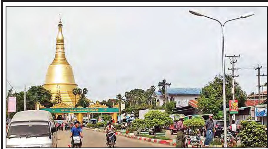
ရက်(၁၀၀) စီမံချက်အရ ပဲခူးတိုင်း ဒေသကြီးစည်ပင်သာယာရေးအဖွဲ့ရန်ပုံငွေဖြင့် ပဲခူးမြို့ ရွှေမော်တော်ဘုရားလမ်း ဘုရားဖူးပြည်သူများနှင့်လုပ်သားပြည်သူများ သွားလာမှုအဆင်ပြေစေရေးအတွက် လမ်းအလယ်ကျွန်း၌ လျှပ်စစ်လမ်းမီးတိုင်(၂၀)ကို မြို့နယ်စည်ပင်သာယာရေးဝန်ထမ်းများက ဇွန် ၂၁ ရက်က စိုက်ထူစေခဲ့ပါ။