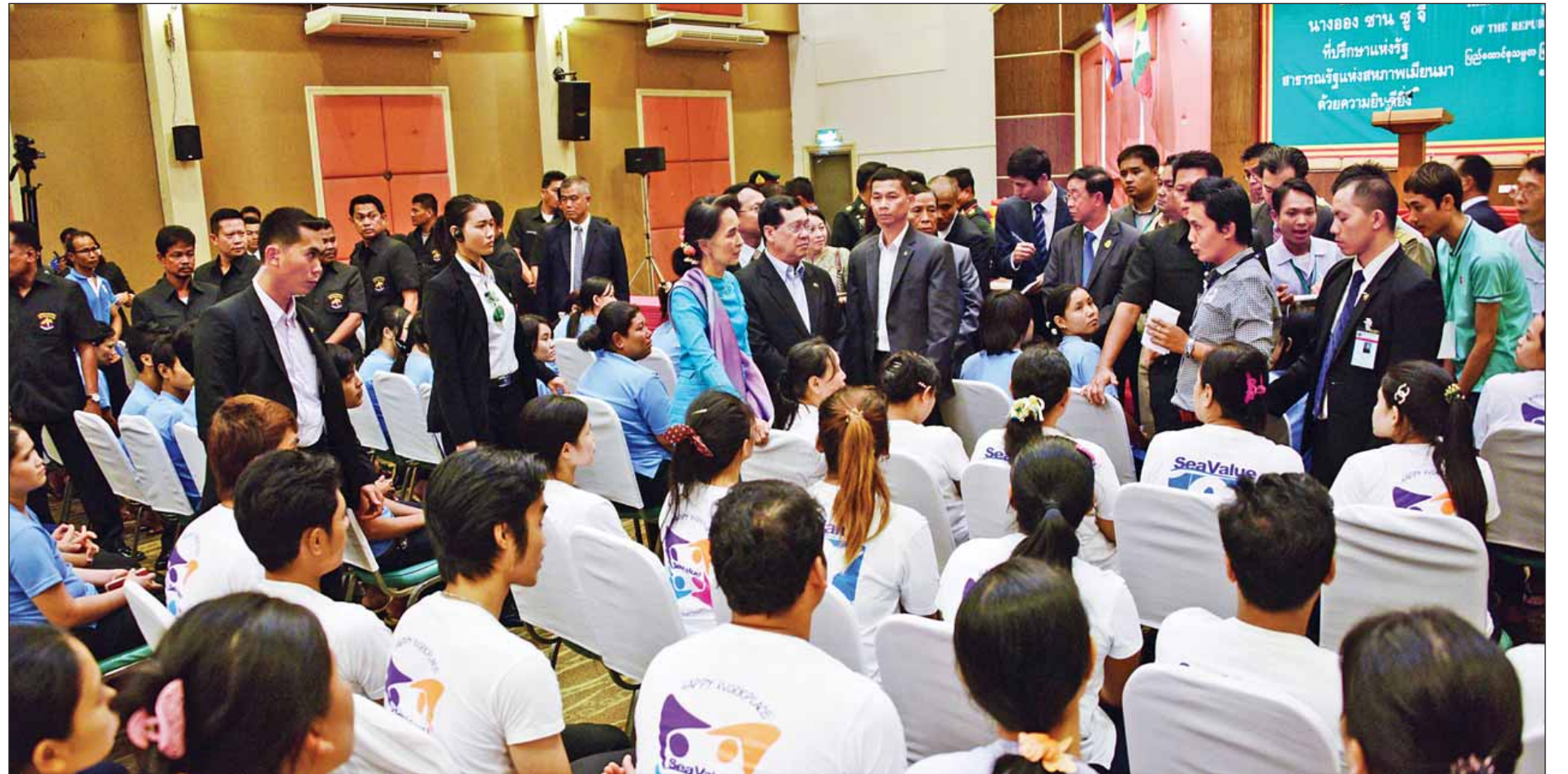
ထိုင်းနိုင်ငံ မဟာချိုင်မြို့သို့ ရောက်ရှိနေသည့် နိုင်ငံတော်၏အတိုင်ပင်ခံပုဂ္ဂိုလ် ဒေါ်အောင်ဆန်းစုကြည် မြန်မာရွှေ့ပြောင်းအလုပ်သမားများအား ရင်းရင်းနှီးနှီးတွေ့ဆုံစဉ်။ (သတင်းစဉ်)