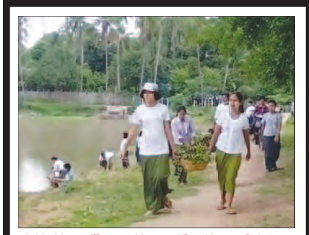
စစ်ကိုင်းတိုင်းဒေသကြီး၊ မုံရွာခရိုင်ဘုတလင်မြို့နယ်ရှိ အများပြည်သူအသုံး ပြုနေသော ကန်မကြီးသန့်ရှင်းသာယာလှပရေးအတွက်ဇွန် ၁၈ ရက် နံနက် ၇ နာရီက ဌာနဆိုင်ရာဝန်ထမ်းများ၊ လူမှုရေးအသင်းအဖွဲ့များနှင့် ရပ်ကွက်သူ ရပ်ကွက်သားများ စုပေါင်းသန့်ရှင်းရေးဆောင်ရွက်ကြသည်။

ဝါးခယ်မ နှစ် ၂၀ ရောဂါတိုင်းဒေသကြီး ဝါးခယ်မမြို့နယ် ပြန်ကြားရေးနှင့်ပြည်သူ့ဆက် ဆံရေးဦးစီးဌာနမှ မိမိတို့မြို့နယ်ရှိ ဒေသပြည်သူများကို မူးယစ်ဆေးဝါး အန္တရာယ် တားဆီးကာကွယ်ရေး အသိပညာပေးလက်ကမ်းစာစောင်ဖြန့် ဝေ ပြန်ကြားရေးနှင့်ပြည်သူ့ဆက်ဆံရေးဦးစီးဌာန(ရုံးချုပ်)မှ အမည် ထုတ်ဝေသော ၂၀၁၆ ခုနှစ် ဇွန် ၂၆ ရက် အတွဲ (၁) အမှတ် (၁) သတင်း စကား လက်ကမ်းစာစောင်အား ဖြန့်ဝေမှုကို ဇွန် ၁၇ ရက် နံနက် ၁၀ နာရီက ဆောင်ရွက်ခဲ့ကြောင်း သိရသည်။