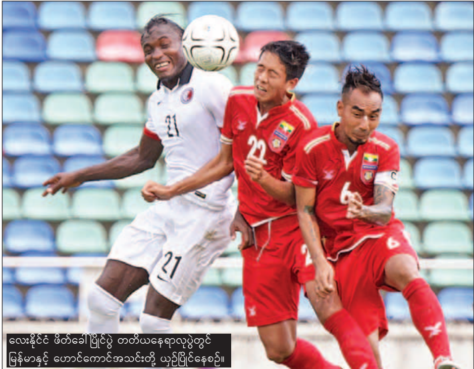
လေးနိုင်ငံ ဖိတ်ခေါ်ပြိုင်ပွဲ တတိယနေရာလှည့်တွင် မြန်မာနှင့် ဟောင်ကောင်အသင်းတို့ ယှဉ်ပြိုင်နေစဉ်။