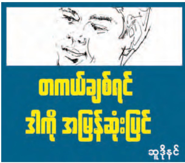
အပြည့်နဲ့။ မေးတာ လည်း တော်တော်ကိုမေးတတ်တယ်။ မှတ်စုတွေလည်း မှတ်လို့။ အကုန်လုံး စနစ်တကျ။

“ နိုင်ငံကို တကယ်ချစ်တယ်ဆိုရင်၊ နိုင်ငံအတွက် လိုအပ်နေတာကိုတကယ် လုပ်ပေးချင်တယ်ဆိုရင်တော့ နိုင်ငံရဲ့ အနာဂတ်အတွက် အရေးကြီးဆုံးရင်းနှီး မြှုပ်နှံမှုဖြစ်လေတဲ့ အတွေးသတ်နေတဲ့ ပညာရေးကိုအမြန်ဆုံးအမြစ်ကလှန်ပြီး ပြုပြင်ပြောင်းလဲကြရပါလိမ့်မယ်။ ”