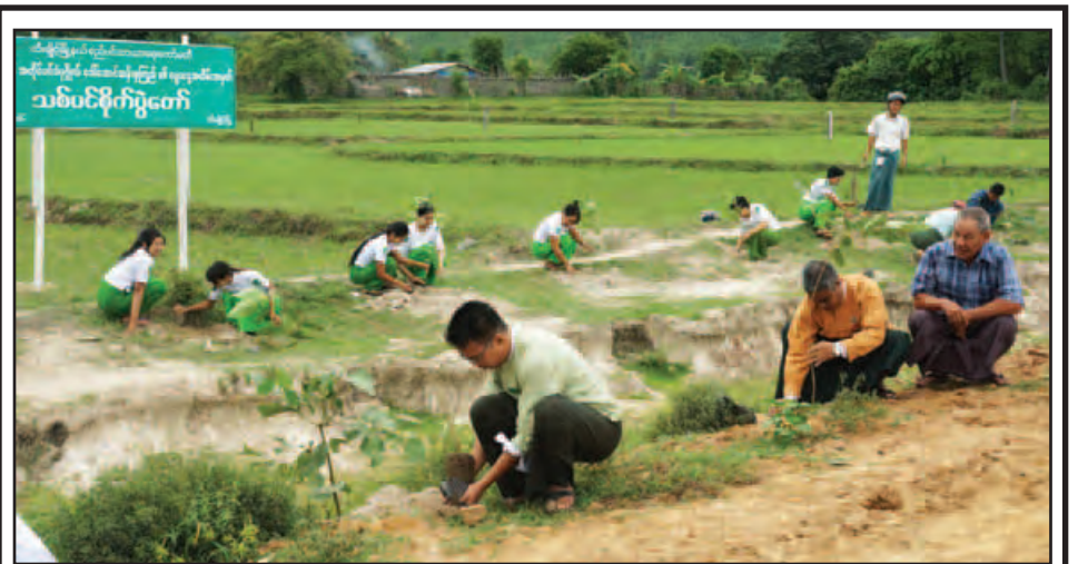
နိုင်တော်၏ အတိုင်ပင်ခံပုဂ္ဂိုလ် ဒေါ်အောင်ဆန်းစုကြည်၏ (၇၁)နှစ်ပြည့် မွေးနေ့အထိမ်းအမှတ်အဖြစ် ၅ နှစ် ၁၉ ရက် နံနက် ၇ နာရီက ကသာခရိုင် ထီးချိုင့်မြို့နယ် စိမ့်ခန့်ခွဲမှုကော်မတီ၊ အမျိုးသားဒီမိုကရေစီအဖွဲ့ချုပ်ပါတီ၊ စည်ပင်သာယာရေးကော်မတီနှင့် ဌာနဆိုင်ရာများစုပေါင်း၍ ထီးချိုင့်-ကျောင်းကုန်းလမ်းပိုင်း ခုတင် ၅၀ ဆေးရုံရှေ့တွင် သစ်ပင်စိုက်ပျိုးပွဲကျင်းပစဉ်။