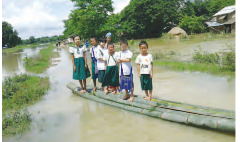
နေဝင်းဇော်(မြန်အောင်)

မြန်အောင်မြို့နယ် ကျွဲတဲကုန်းအုပ်စုရှိ ဒေါင့်ကြီးကျေးရွာနှင့် ရေကူးစုကျေးရွာ၊ လေးတူးအုပ်စုရှိ လေးတူးကျေးရွာတို့မှာ ရေနစ်မြုပ်နေပြီး အကူအညီများလိုအပ်လျက်ရှိကြောင်း၊ လူမှုရေးအဖွဲ့များမှ လာရောက်လှူဒါန်းခြင်းများရှိနေကြောင်း၊ ကနောင်-အင်ပင်လမ်းမှာလည်း ရေနစ်မြုပ်လျက်ရှိကြောင်း ကနောင်တွင်နေထိုင်သူတစ်ဦးထံမှ သိရသည်။