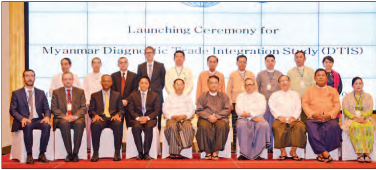
မြန်မာနိုင်ငံ၏ကုန်သွယ်မှုဘက်စုံလေ့လာဆန်းစစ်ခြင်းအစီရင်ခံစာထုတ်ပြန်ခြင်းအခမ်းအနားသို့ တက်ရောက်ကြသူများ စုပေါင်းမှတ်တမ်းတင်ဓာတ်ပုံရိုက်စဉ်။ (သတင်းစဉ်)