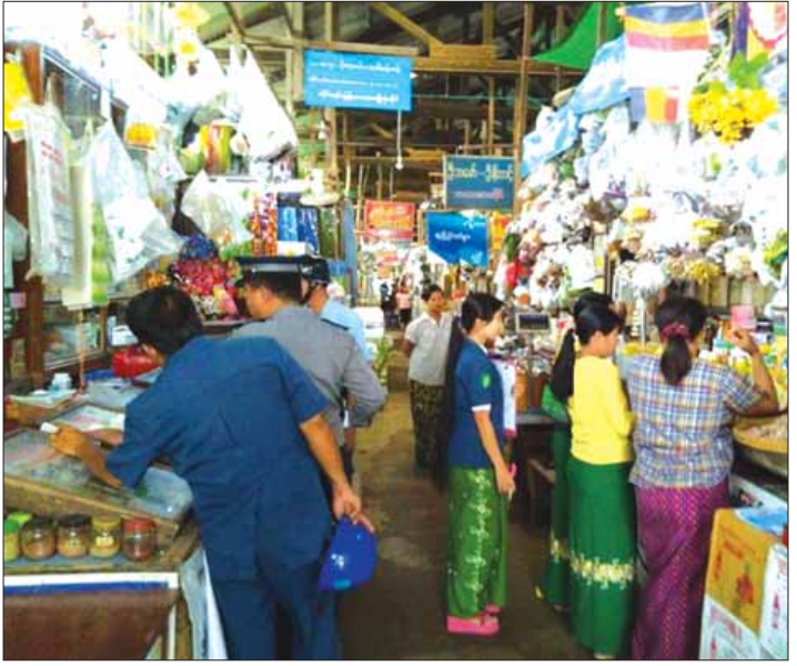
ကြောင်း သိရသည်။ ရှောင်တခင်ဝင်ရောက်စစ်ဆေးခြင်းနှင့် အတူ ဆေးပစ္စည်းရောင်းချနေသူများ အနေဖြင့် အများပြည်သူများ၏ ကျန်းမာရေးကိုထိခိုက်စေမည့် ဆေးပစ္စည်းများ ရောင်းချမှုမရှိစေရန်နှင့် မူးယစ်ထုံထိုင်းဖြစ်စေသော တရားမဝင်ဆေးဝါးများ မရောင်းချစေရေးအတွက် အသိပညာပေးဆွေးနွေးမှုများ ပြုလုပ်ခဲ့ကြောင်း သိရသည်။ ထွန်းကျော်(ညောင်တုန်း)

ညောင်တုန်း ၅ နှစ် ၁၉ ရောဂါတိုင်းဒေသကြီး ညောင်တုန်းမြို့ မြို့မဈေးကြီးအတွင်း၌ တိုင်းရင်းဆေးနှင့် ဆေးပစ္စည်းအရောင်းဆိုင်များအားဆေးဝါး အန္တရာယ်ကင်းရှင်းရေးအတွက် မြို့နယ် တာဝန်ရှိသူများ ပူးပေါင်းပါဝင်သောအဖွဲ့က ဇွန် ၁၇ ရက်က ရှောင်တခင်ဝင်ရောက် စစ်ဆေးခြင်းများ ပြုလုပ်ခဲ့ကြောင်း သိရသည်။ မြို့မဈေးကြီးအတွင်းရှိ အများပြည်သူများအား ရောင်းချနေသော ဆေးပစ္စည်းဆိုင်များတွင် ရောင်းချနေသည့် တိုင်းရင်းဆေးနှင့် ဆေးဝါးပစ္စည်းများသည် မှတ်ပုံတင်ထားသော ဆေးဝါးအစစ်များသာ ရောင်းချနေပါက ရောင်းချနေသောဆေးဝါးပစ္စည်းများ အန္တရာယ်ကင်းရှင်းရေး၊ မှတ်ပုံတင်ထားခြင်းမရှိသော ဆေးဝါးများမရောင်းချရေး၊ သက်တမ်းလွန်ဆေးပစ္စည်းများ မရောင်းချစေရေး၊ ဆေးဝါးပစ္စည်းများ စံချိန်စံညွှန်းနှင့်အညီ ရောင်းချနိုင်ရေးအတွက် မြို့နယ်တိုင်းရင်းဆေးဦးစီးဌာန၊ မြန်မာနိုင်ငံရဲတပ်ဖွဲ့မှူးရုံး၊ မြို့နယ်ကျန်းမာရေးဌာနနှင့် မြို့နယ်စည်သာယာရေးအဖွဲ့မှ တာဝန်ရှိသူများနှင့် ပူးပေါင်းပါဝင်သောအဖွဲ့က အသိပညာပေးဆွေးနွေးရှင်းလင်းမှုများ ပြုလုပ်ခဲ့