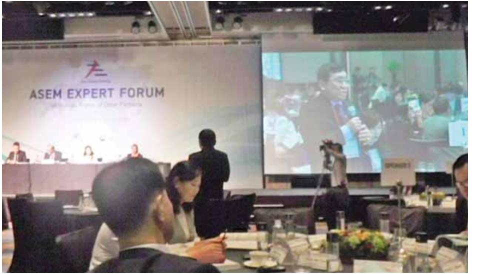
သည့် အောင်မြင်မှုများကို ရှင်းလင်းဆွေးနွေးတင်ပြခဲ့ပြီး မြန်မာနိုင်ငံ၏ လက်ရှိသက်ကြီးရွယ်အိုဆိုင်ရာ မူဝါဒ ရေးဆွဲရာတွင် အမြန်ဆုံးပေါ်ပေါက်နိုင်ရေး အတူပူးပေါင်း ဆောင်ရွက်သွားမည်ဖြစ်ကြောင်း ဆွေးနွေးသည်။ ကိုရီးယားသမ္မတနိုင်ငံ လူ့အခွင့်အရေးကော်မရှင်က ဦးဆောင်ကျင်းပခဲ့သည့် အဆိုပါဖိုရမ်သို့ အာရှ-ဥရောပ ၂၉ နိုင်ငံမှ ကိုယ်စားလှယ် ၂၀၉ ဦး တက်ရောက်ခဲ့ကြ ကြောင်း သတင်းရရှိသည်။ (သတင်းစဉ်)

ဖလှယ်ခဲ့ပြီး ဖိုရမ်ပိတ်ပွဲအခမ်းအနားတွင် အမှာစကား ပြောကြားသည်။ ယင်းသို့ပြောကြားရာ၌ မြန်မာနိုင်ငံတွင် လူမှုဝန်ထမ်း၊ ကယ်ဆယ်ရေးနှင့် ပြန်လည်နေရာချထားရေးဝန်ကြီးဌာန၏ အကောင်အထည်ဖော်ဆောင်ရွက်သွားမည့် လူမှုကာကွယ် စောင့်ရှောက်ရေးအစီအစဉ်နှင့် ရက် ၁၀၀ စီမံကိန်းတွင် ပါဝင်သည့် သက်ကြီးရွယ်အို စောင့်ရှောက်ရေးဆိုင်ရာ လက်ရှိဦးစားပေးဆောင်ရွက်မှုများကို အသိပေးပြောကြား သည်။ ဆွေးနွေးပွဲတက်ရောက်စဉ်အတွင်း HelpAge Korea မှ ဥက္ကဋ္ဌ Mr. Cho Myung က လာရောက် တွေ့ဆုံရုံ မြန်မာနိုင်ငံတွင် ၂၀၀၄ ခုနှစ်က စတင်သည့် သက်ကြီးရွယ်အိုများ စောင့်ရှောက်ရေးဆိုင်ရာ လုပ်ငန်း စဉ်များတွင် ၎င်းတို့၏ ပူးပေါင်းဆောင်ရွက်နေမှုနှင့် ရရှိခဲ့