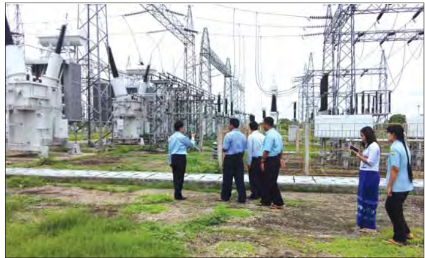
ယင်းနောက် ကျေးလက်ဒေသဖွံ့ဖြိုးရေး၊ ကျေးရွာများတွင် ဦးအားပြည့်စီစွာဖြင့် လျှပ်စစ်ဓာတ်အား ရရှိရေးဆက်သွားကျေးရွာနှင့် ဝိသနိုးရှေးဟောင်း

ဆက်လက်၍ မြို့နယ်လျှပ်စစ်အင်ဂျင်နီယာရုံးမှ ဝန်ထမ်းများနှင့်တွေ့ဆုံ၍ စီမံဘဏ္ဍာ၊ ပစ္စည်း၊ အင်ယာကဏ္ဍ အလိုက်လုပ်ငန်းများစနစ်တကျ ဆောင်ရွက်ကြရန် IUnit Losses ကျဆင်းရေး၊ လျှပ်စစ်အန္တရာယ်ကင်းရှင်းရေး၊ ဦးအားတိုးတက်ကောင်းမွန်စေရေး၊ ဓာတ်အားပြတ်တောက်မှု လျော့နည်းစေရေး၊ ကြေးကျွန်လျော့နည်းစေရေး ကိစ္စများကို ဆွေးနွေးမှာကြားခဲ့သည်။