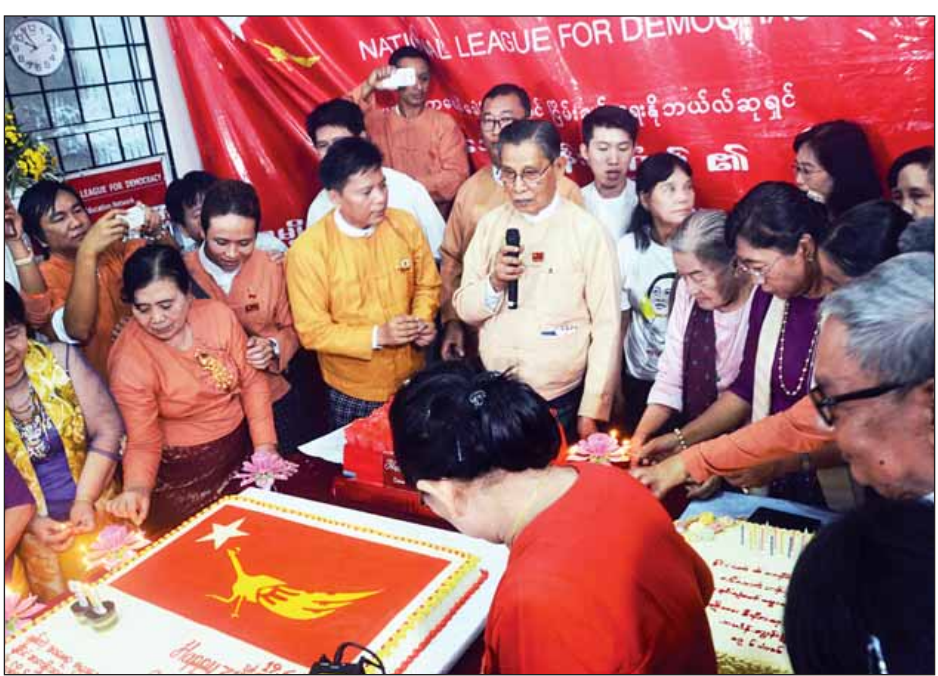
အမျိုးသားဒီမိုကရေစီအဖွဲ့ချုပ်နာယက သူရဦးတင်ဦးက မွေးနေ့ကိတ်လှီး၍ ဆုမွန်ကောင်းတောင်းစဉ်။

ယနေ့ ရန်ကုန် NLD ရုံးချုပ်တွင် ပြုလုပ်သည့် နိုင်ငံတော်၏ အတိုင်ပင်ခံပုဂ္ဂိုလ်မွေးနေ့အခမ်းအနားသို့ ပန်းရဲ့လမ်း အဖွဲ့မှလည်း မွေးနေ့အဖြစ် ဂုဏ်ပြုသီချင်းများ ဖြင့် ဖျော်ဖြေပေးခဲ့သည်။ ပန်းရဲ့လမ်းသည် ပြည်သူ့ဌာန၊ ပြည်သူ့ဌာနဆိုသည့် ဆောင်ပုဒ်ဖြင့် ပရဟိတအလုပ်များ ဆောင်ရွက်လျက်ရှိပြီး ဒုက္ခရောက်နေသူများနှင့် ဆင်းရဲ