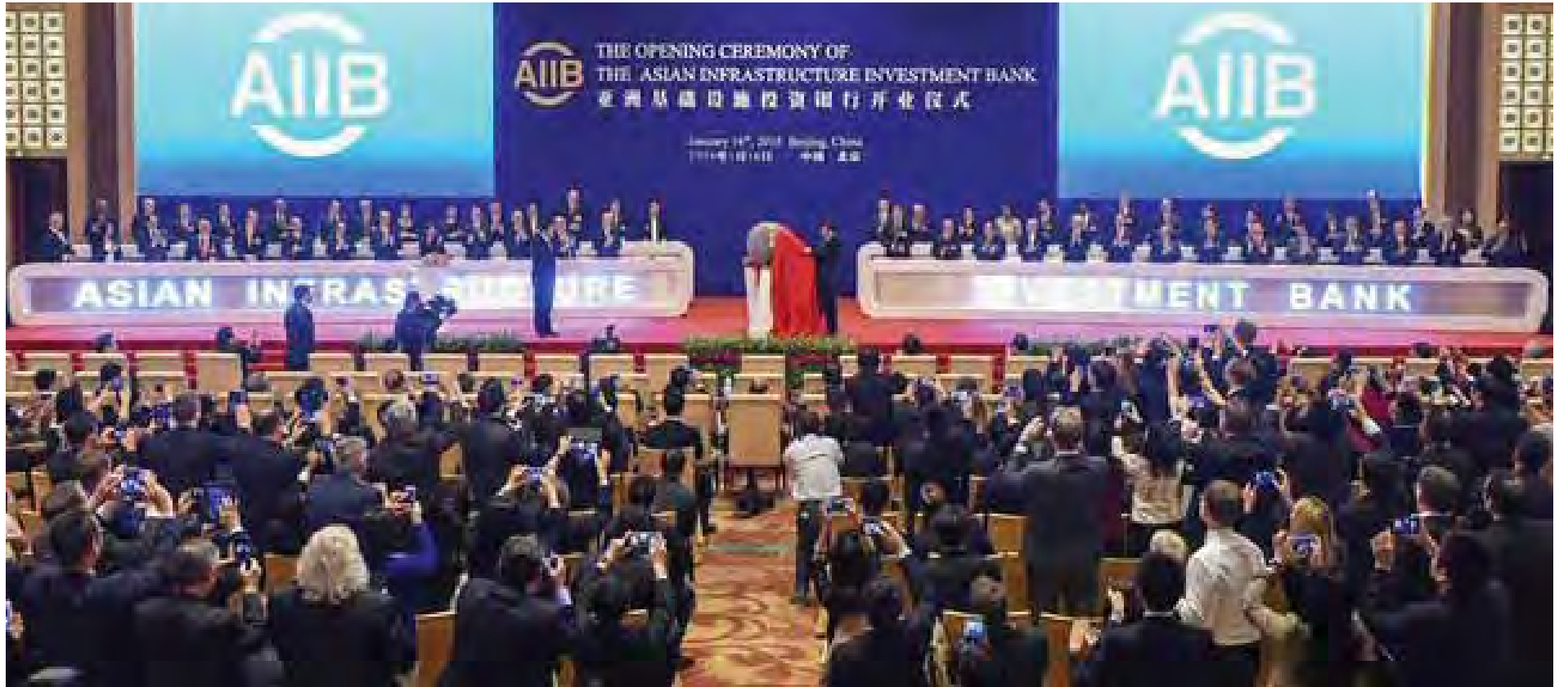
(AIIB ဘဏ်အား ၁၆-၁-၂၀၁၆ ရက်နေ့က တရားဝင်ဖွင့်လှစ်ခဲ့ရာ တရုတ်သမ္မတရီကျင့်ဖျင် တက်ရောက်ဖွင့်လှစ်ပေးခဲ့သည်)

ရုပ်ဝန်းတစ်ခု လမ်းကြောင်းတစ်ခု အစီအစဉ်ဟာ အဓိကအားဖြင့် အာရှ နဲ့ ဥရောပဒေသနှစ်ခုကို မြေပြင်အခြေစိုက် စီးပွားရေးစင်္ကြံနဲ့ ပင်လယ်ရေ လမ်းကြောင်း စီးပွားရေးစင်္ကြံတွေကနေတစ်ဆင့် အဆင့်မြင့်မြင့် ပေါင်းစည်း ဆက်စပ်လာစေဖို့ နီးကပ်စွာပူးပေါင်းဆောင်ရွက်လာနိုင်ဖို့နဲ့ အပြန်အလှန် အကျိုးဖြစ်ထွန်းစေဖို့ မျှော်မှန်းဆောင်ရွက်တဲ့ မဟာဗျူဟာတစ်ခုဖြစ်ပါတယ်။