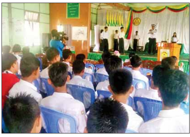
နေပြည်တော်ကောင်စီနယ်မြေ ပျဉ်းမနားမြို့ အထက(၁) ရတနာမွန် ခန်းမ၌ ဇွန် ၁၈ ရက်က အမှတ် (၁)ယာဉ်ထိန်းရဲ(နေပြည်တော်) အမှတ် (၆)ယာဉ်ထိန်းရဲတပ်ဖွဲ့စုမှူး(ပျဉ်းမနား)မှ ဒုရဲမှူးမင်းသူက ယာဉ်တိုက်မှု မဖြစ်ပွားစေရေး၊ ယာဉ်အန္တရာယ်ကင်းရှင်းရေးတို့ကို ဟောပြောစဉ်။ ကိုကိုရူပ(နေပြည်တော်)