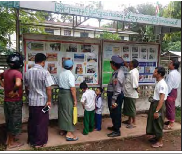
နေမျိုးလွင်(ပြန်/ဆက်)

မိတ္ထီလာ ဇွန် ၁၉ မိတ္ထီလာတွင် ယာဉ်စည်းကမ်း၊ လမ်း စည်းကမ်း အသိပညာပေးလုပ်ငန်း များကို အရှိန်အဟုန်မြှင့်တင် ဆောင်ရွက်ရန်အတွက် လိုအပ်သည့် ငွေကြေးကို တိုင်းဒေသကြီးအစိုးရ အဖွဲ့ထံ တင်ပြတောင်းခံမည်ဖြစ် ကြောင်း ဇွန် ၁၈ ရက် နံနက် ၉ နာရီက မိတ္ထီလာခရိုင် အထွေထွေ အုပ်ချုပ်ရေးဦးစီးဌာန အစည်းအဝေး ခန်းမ၌ ကျင်းပသော တွေ့ဆုံပွဲတွင် တိုင်းဒေသကြီး စိုက်ပျိုးရေး၊ မွေးမြူရေး နှင့် ဆည်မြောင်းဝန်ကြီး ဒေါက်တာ ဦးသန်းက ပြောကြားသည်။ မိတ္ထီလာခရိုင်အတွင်းရှိ ဌာနဆိုင် ရာများ၊ မြို့နယ်စီမံခန့်ခွဲမှု ကော်မတီဝင်များ၏ အခက်အခဲများ ကို ဖြေရှင်းဆောင်ရွက်ပေးရန် ရည်ရွယ် ပြုလုပ်ခြင်းဖြစ်ကြောင်း၊ ထို့ကြောင့် ဒေသဖွံ့ဖြိုးရေး ဆောင်ရွက်ရာတွင် အခက်အခဲများရှိပါက တာဝန်ရှိသူ များက တင်ပြရန်ဖြစ်ကြောင်း ပြောကြားရာ မိတ္ထီလာမြို့နယ်အတွင်း ယာဉ်စည်းကမ်း၊ လမ်းစည်းကမ်း အသိပညာပေး လုပ်ငန်းများကို ဆောင်ရွက်လျက်ရှိကြောင်း၊ ပြည်သူ များမှာ ပညာပေးလုပ်ငန်းဆောင်ရွက် သူများရှေ့တွင် စည်းကမ်းလိုက်နာ သော်လည်း မျက်ကွယ်ရာတွင် စည်းကမ်းလိုက်နာမှု အားနည်းဆဲဖြစ် ကြောင်း၊ ယာဉ်စည်းကမ်း၊ လမ်း စည်းကမ်း အသိပညာပေးလုပ်ငန်း များ ထိရောက်အောင်မြင်အောင်