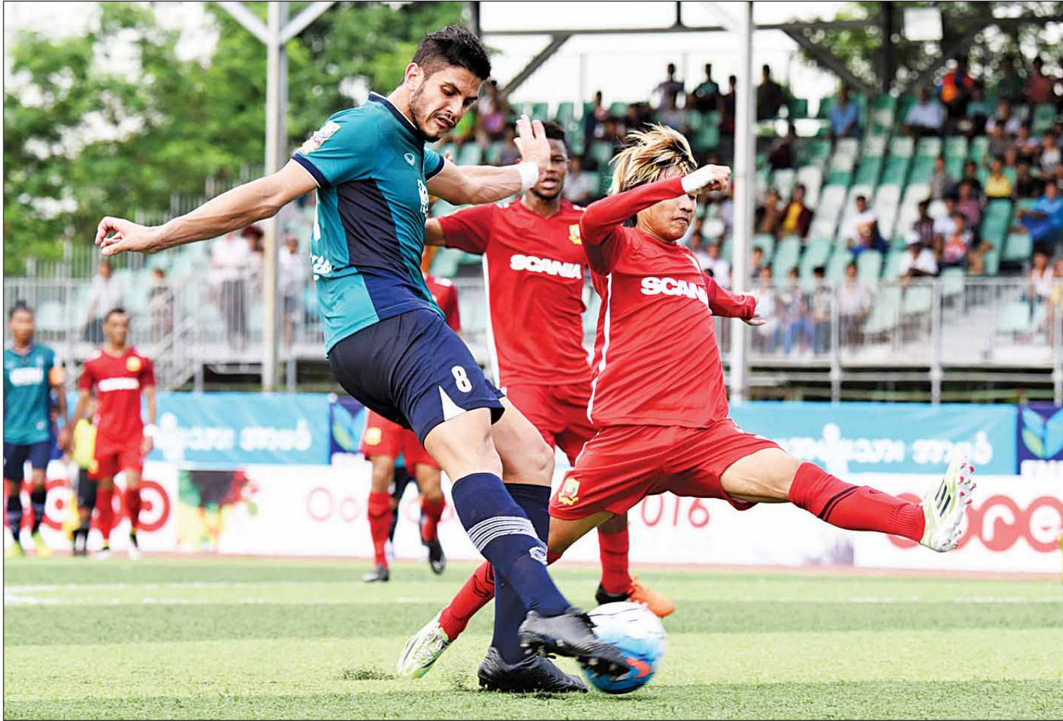
ရန်ကုန်နှင့် ရှမ်းယူနိုက်တက်တို့ ယှဉ်ပြိုင်နေစဉ်။