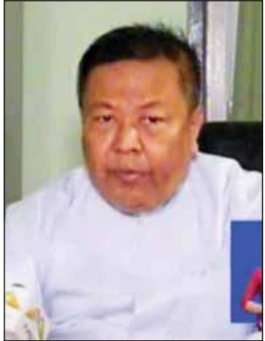
ဒေါက်တာချမ်းသာ (လူမှုရေးဝန်ကြီး) ရခိုင်ပြည်နယ်အစိုးရအဖွဲ့

ကျွန်တော်တို့အိမ်မှာ သဘာဝဘေးအန္တရာယ်တွေ အင်မတန်မှဖြစ်တတ်ပါတယ်။ ရေကြီးတာတို့၊ ဆိုင်ကလုနီးမုန့်တိုင်းတိုက်ခတ်တာတို့၊ နောက်ပြီးတော့ လူတွေပေါ်ဆူမှုကြောင့် မီးလောင်တာတို့ မကြာခဏဖြစ်တဲ့အတွက်ကြောင့် အဲဒီလိုသဘာဝဘေးအန္တရာယ်ဖြစ်လာရင် အချိန်နဲ့တစ်ပြေးညီသွားရောက်ပြီး ကူညီဆောင်ရွက်ပေးနိုင်ဖို့အတွက် ကယ်ဆယ်ရေးဌာနက အမြဲတမ်းအသင့် ပြင်ထားရပါတယ်။ ဥပမာပြောရမယ်ဆိုရင် သံတွဲမြို့၊ ရွှေလီကျေးရွာမှာဖြစ်ခဲ့တဲ့ ရေလွှမ်းမိုးမှုမှာ အိမ် ၂၁၀ လောက် ရေထဲပျော်ပါသွားတယ်။ ဝန်ကြီးဌာန၊ အစိုးရအဖွဲ့တွေနဲ့ တပ်မတော်သားတွေ၊ မြန်မာနိုင်ငံရဲတပ်ဖွဲ့၊ မီးသတ်တပ်ဖွဲ့တွေ အားလုံးပူးပေါင်းပြီးဆောင်ရွက်ခဲ့လို့ ရေလွှမ်းမိုးခံရတဲ့လူတွေကို နေရာချထား ပေးနိုင်ခဲ့ပါတယ်။ အဲဒီနောက်ပိုင်း လိုအပ်တဲ့ပျက်စီးသွားတဲ့စာသင်ကျောင်း တွေ ပြန်ဆောက်ပေးဖို့၊ အိမ်နေရာပြန်ချပေးဖို့ကိစ္စတွေ စီစဉ်ဆောင်ရွက်နေပါတယ်။