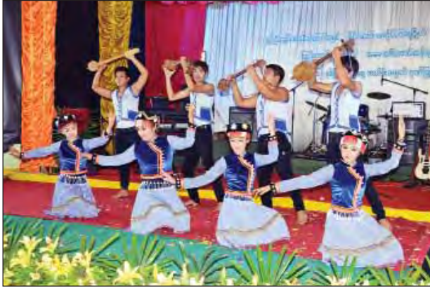
ကျင်းပခြင်းဖြစ်ကာ မိုးကုတ်မြို့၊ အားပေးဂုဏ်ပြုကြသည်။ တိုင်းရင်း ကျင်ပြင်မြို့၊ မိုးမိတ်မြို့နှင့် ပတ်ဝန်းကျင်ဒေသများရှိ တိုင်းရင်းသားမိဘ ပြည်သူအပေါင်းတို့ လာရောက်

မိုးကုတ် ဇွန် ၁၉ နိုင်ငံတော်၏ အတိုင်ပင်ခံပုဂ္ဂိုလ် ဒေါ်အောင်ဆန်းစုကြည်၏ (၇၁) နှစ်မြောက်မွေးနေ့အထိမ်းအမှတ် အနေဖြင့် ကျင်းပသည့် တိုင်းရင်းသားများ ရိုးရာပဒေသာကဗျာနှင့် ကဗျာဂီတပွဲတော်အား မိုးကုတ်မြို့ ဖောင်တော်ဦးမြတ်စွာဘုရားဝင်း အတွင်းရှိ မဏိရတနာခန်းမ၌ ဇွန် ၁၉ ရက် မွန်းလွဲပိုင်းတွင် ကျင်းပသည်။ အဆိုပါအခမ်းအနားကို အမျိုးသားဒီမိုကရေစီအဖွဲ့ချုပ်၊ မန္တလေး တိုင်းဒေသကြီး လူငယ်လုပ်ငန်းအဖွဲ့၊ ပြင်ဦးလွင်ခရိုင်လူငယ်လုပ်ငန်းအဖွဲ့၊ နှင့် မိုးကုတ်၊ မတ္တရာ၊ စဉ့်ကူး၊ သပိတ်ကျင်း၊ ပြင်ဦးလွင်မြို့နယ်များမှ လူငယ်လုပ်ငန်းအဖွဲ့တို့က ဦးဆောင်