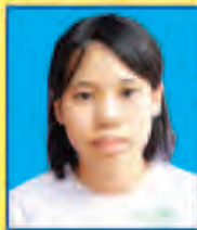
ပဝတ်ပွန်မြယ် ဆရက-၄၇၆ (၅-ဘာသာဂုဏ်ထူး) ရန်ကုန်မြို့