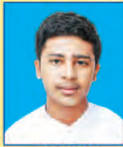
ဟောင်မျိုးမင်းသိန်း ဆရက-၅၇၂ (ဘာသာစုံဂုဏ်ထူး) ဗန်းမော်မြို့