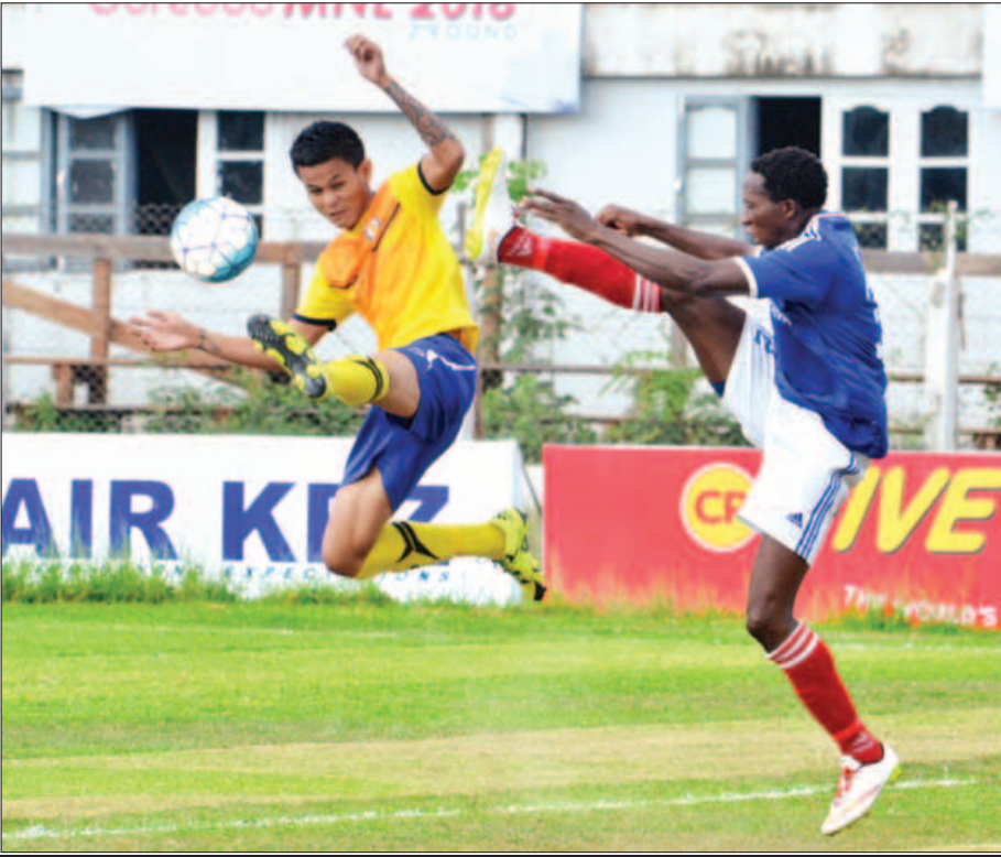
ဇေယျာရွှေမြေနှင့် Southern အသင်းတို့ ယှဉ်ပြိုင်နေစဉ်။