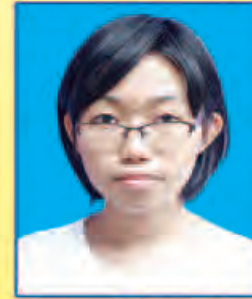
ပစိုးစန္ဒာသော် ဆရက-၅၇၇ (ဘာသာစုံဂုဏ်ထူး) ရန်ကုန်မြို့