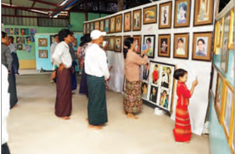
ကြည်၏ ပုံတူပန်းချီကားများ အားလုံး ပင်သာ)က တစ်ကိုယ်တော်ရေးဆွဲပြသ ကဗျာများ၊ ဓာတ်ပုံများကို ခင်းကျင်းပြသ ကို ဦးသန်းထွန်း (မောင်ဥဩ-ညောင် ထားပြီး နယ်စုံမှ ကဗျာဆရာများ၏ ထားသည်။ ၎င်းထွန်း(မြစ်သား)