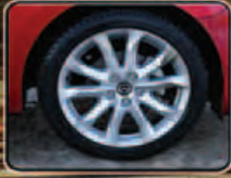
18" LIGHT WEIGHT DYNAMIC MOTION SPORTS RIM