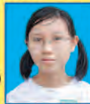
ပနင်းနုဒီအောင် ဆရက-၆၀၇ (၅-ဘာသာဂုဏ်ထူး) သံပြေရပ်မြို့