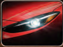
MAZDA LED SIGNATURE HEADLIGHTS