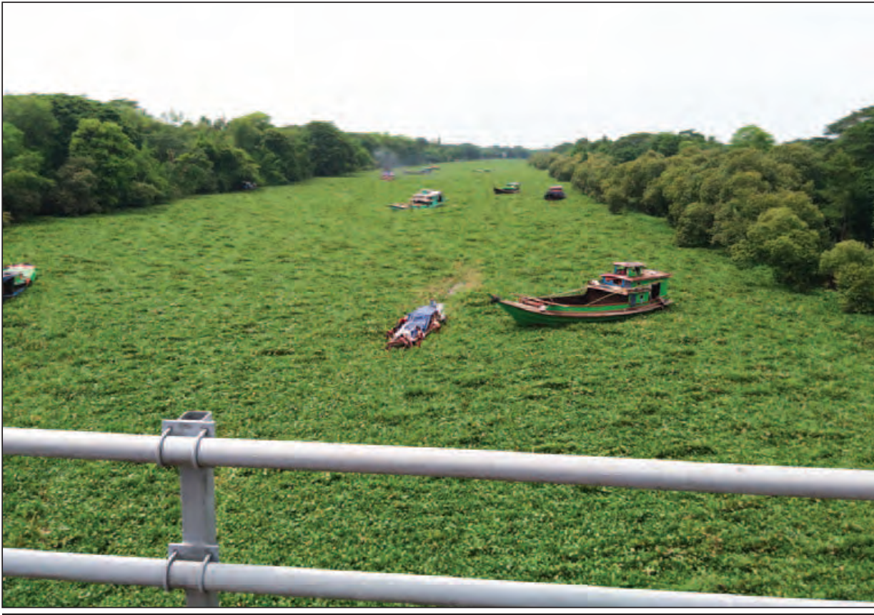
တစ်မိုင်ခန့်အတွင်း စက်လှေများတိုးမပေါက်အောင် ပြည့်ကျပ်နေသောပေဒါများကို မရှင်းလင်းမီတွေ့ရစဉ်။

ပုသိမ် ဇွန် ၁၈ ရောဂါတိုင်းဒေသကြီး ပုသိမ်ခရိုင် ကျောင်းကုန်းမြို့တွင် နေ့စဉ်ရက်ဆက် မိုးအဆက်မပြတ် ရွာသွန်းမှုကြောင့် ဒါးကမြစ်ရေသည် မြင့်တက်လျက်ရှိပြီး သာမန်ပုံမှန်ရေထက် ငါးပေခန့် မြင့်တက်လာကြောင်း ကျောင်းကုန်းမြို့နယ် ဆည်မြောင်းနှင့် ရေအသုံးချမှု စီမံခန့်ခွဲရေးဦးစီးဌာန (ရေအရင်းအမြစ်)မှ သိရသည်။ တချို့ မြေနိမ့်ပိုင်းများဖြစ်သည့် အမှတ်(၃) ရပ်ကွက်ရွှေဘိုတန်းတွင် လမ်းအချို့ ရေနစ်မြုပ်လျက်ရှိကြောင်း ဒေသခံပြည်သူတစ်ဦးက ပြောသည်။ ကျောင်းကုန်းမြစ်ကူးတံတားကြီးမှ ကျောင်းကုန်းမြို့ပေါ်ရပ်ကွက်အထိ တစ်မိုင်ခန့်အတွင်း စက်လှေများ တိုးမပေါက်လောက်အောင် ပြည့်ကျပ်နေသော ပေဒါများသည် ဇွန် ၁၅ ရက်တွင် လုံးဝရှင်းလင်းသွားသော်လည်း မြစ်ရေမြင့်တက်လာမှုကြောင့် စောစောစီးစီး ရေကြီးနိုင်သည့် အန္တရာယ် ဖြစ်ပေါ်လာနိုင်သည်။ နောက်ထပ်အမြင့်ပေ နှစ်ပေခန့် ဆက်လက်မြင့်တက်လာမည်ဆိုလျှင် စာမျက်နှာ ၉ ကော်လံ ၁ သို့ □