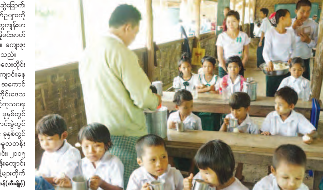
ဇွန်မန်း(ထီးချိုင့်)

“အခုခေတ်အသင့်အစားအစာဖြစ်တဲ့ ခေါက်ဆွဲခြောက်၊ အချိုရည်ဘူးများစားသုံးခြင်းအစား နို့နှင့်ကြက်ဥများကို ကလေးတွေကို တိုက်ကျွေးခြင်းဟာ ကလေးတွေကျန်းမာ ရေးနဲ့ ညီညွတ်တာကြောင့် အသားဓာတ်၊ အိုင်အိုဒိုင်းဓာတ် တွေရရှိတယ်ဆိုတာသိရလို့ ကောင်းပါတယ်။ ကျေးဇူး တင်ပါတယ်” ဟု ကလေးမိဘတစ်ဦးက ပြောသည်။ ယင်းကဲ့သို့ နို့တိုက်ကျွေးရာတွင် “မြန်မာကလေးတိုင်း အတွက် နို့တစ်ခွက်” ဆောင်ပုဒ်နဲ့အညီ ကျောင်းနေ အရွယ်ကလေးများ နို့တိုက်ကျွေးရေးစီမံချက်ကို အကောင် အထည်ဖော်ဆောင်ရွက်လျက်ရှိပြီး စစ်ကိုင်းတိုင်းဒေသ ကြီး ကသာခရိုင် ထီးချိုင့်မြို့နယ် မွေးမြူရေးနှင့်ကုသရေး ဦးစီးဌာနမှ အလှူရှင်များနှင့်ပူးပေါင်း၍ ၂၀၁၃ ခုနှစ်တွင် အမှတ် (၁) အခြေခံပညာအလယ်တန်းကျောင်းခွဲတွင် ကျောင်းသား ၅၀၀ ဦးကိုလည်းကောင်း၊ ၂၀၁၄ ခုနှစ်တွင် ကွင်းကြီးအုပ်စု ရွာသစ်ကုန်း အခြေခံပညာမူလတန်း ကျောင်းတွင် ကျောင်းသား ၃၈ ဦးကိုလည်းကောင်း၊ ၂၀၁၅ ခုနှစ်တွင် ခက်သင်ကျွန်း အခြေခံပညာမူလတန်းကျောင်း တွင် ကျောင်းသား ၄၈ ဦးကိုလည်းကောင်း နို့များတိုက် ကျွေးနိုင်ခဲ့ကြောင်း သိရသည်။