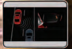
i-ACTIVSENSE TECHNOLOGY (NEW)