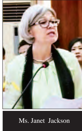
Ms. Janet Jackson