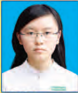
ပပြည့်ကြည်သာရာ ဆရက-၄၇၄ (ဘာသာစုံဂုဏ်ထူး) ရန်ကုန်မြို့