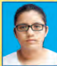
ပသဒ္ဒါမိုးလွင် ဆရက-၅၆၄ (၅-ဘာသာဂုဏ်ထူး) ရန်ကုန်မြို့