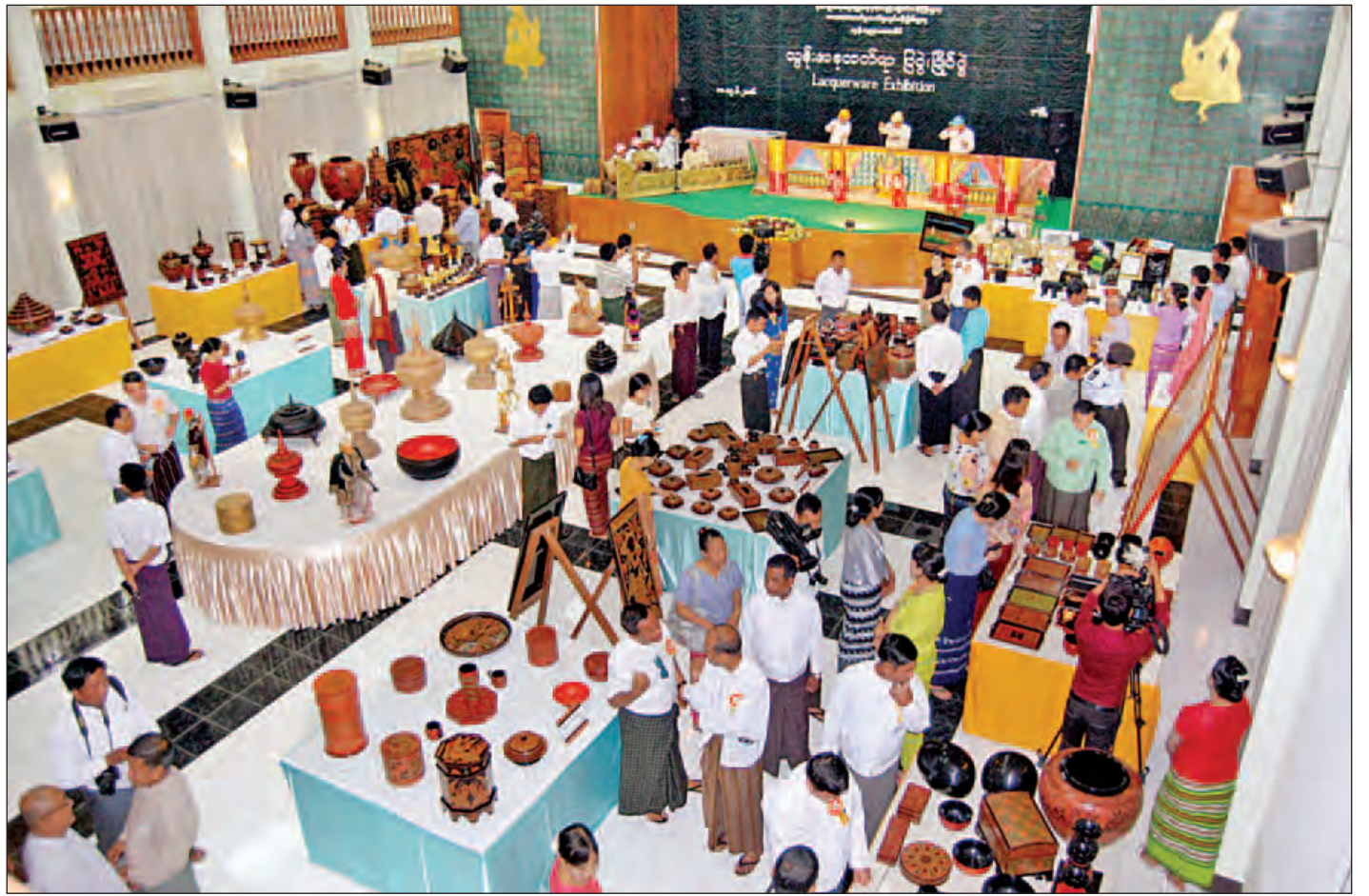
မြန်မာ့ယွန်းအနုပညာပြပွဲ၊ ပြိုင်ပွဲကို ယွန်းပညာကောလိပ်(ပုဂံ)၌ ကျင်းပစဉ်။

အနာဂတ် မန္တလေးသစ်ဆီသို့ ကာတွန်းပြပွဲ နောက်ဆုံးနေ့ထိ ကြည့်ရှုသူများပြား