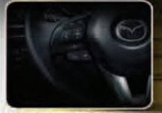
UNIFIED OPERATING STEERING WHEEL