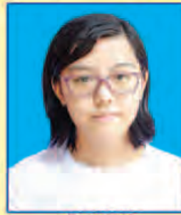
ပဖြူမွန်ကြည် ဆရက-၄၆၄ (ဘာသာစုံဂုဏ်ထူး) ရန်ကုန်မြို့