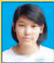
ပမေသရစိကျော် ဆရက-၄၅၇ (၅-ဘာသာဂုဏ်ထူး) ရန်ကုန်မြို့