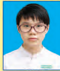
ပကေခိုင်ကြွယ် ဆရက-၄၆၅ (ဘာသာစုံဂုဏ်ထူး) တောင်ကြီးမြို့