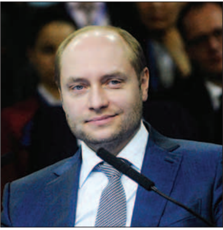
ရုရှားအရှေ့ရပ်ဝန်းဖွံ့ဖြိုးတိုးတက်ရေးဝန်ကြီး အလက်ဇန္ဒား ဂယ်လူဂျာကော့