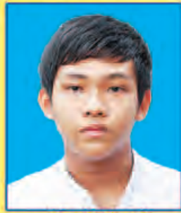
ဟောင်အုန်းပြည့်ကျော် ဆရက-၄၅၆ (ဘာသာစုံဂုဏ်ထူး) ပဲခူးမြို့

၂၀၁၅-၂၀၁၆ ခုနှစ် တက္ကသိုလ်ဝင်တန်းစာမေးပွဲ ဂုဏ်ထူးရ ကျောင်းသား၊ ကျောင်းသူများ