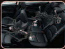
FULL GRAIN LEATHER SEATS