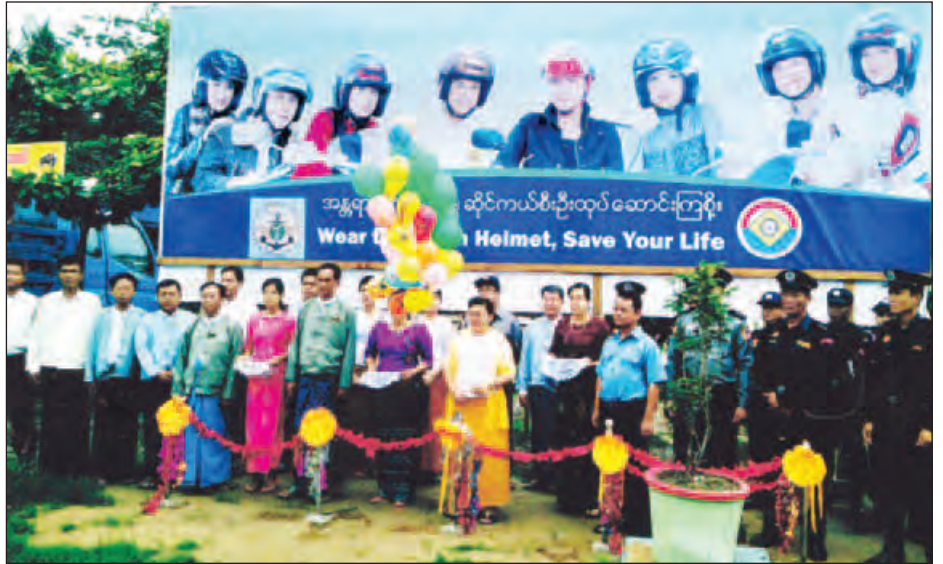
နေပြည်တော်ရုံး၌ “က” ယာဉ်မောင်း မြေစိုက်ခြင်းများ ဆောင်ရွက်ပေးခဲ့လှိုင်စင်များ နေ့ချင်းပြီး စစ်ဆေးကြောင်း သိရသည်။