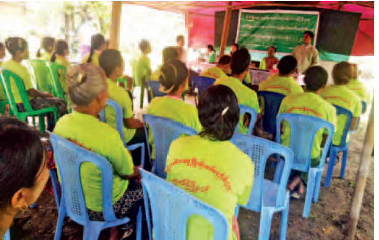
ဇွန် ၁၈ ရက်က အုတ်ဖိုမြို့နယ် ကျေးလက်ဒေသဖွံ့ဖြိုးတိုးတက်ရေးဦးစီးဌာနမှ အောင်သုခ ကျေးရွာတွင် ဒေသခံပြည်သူများအား ဝင်ငွေတိုးပွားရရှိစေရန်အတွက် မြို့နယ်မွေး/ကျဦးစီးဌာန တို့နှင့် ပူးပေါင်း၍ တစ်ပိုင်တစ်နိုင် မွေးမြူရေးသင်တန်းပို့ချပေးစဉ်။ (ကြေးမုံ)

ထို့အပြင် ဖောင်ဒေးရှင်း၏ ပထမအကြိမ် သွေးလျှော့ခြင်းပွဲကို ၂၀၁၅ ခုနှစ် နိုဝင်ဘာလနှင့် ဒီဇင်ဘာလတို့တွင် ရန်ကုန်မြို့နှင့် အထက်မြန်မာပြည် မန္တလေးမြို့တို့တွင် ပြုလုပ်ခဲ့ပြီး စုစုပေါင်းသွေးလျှော့ခြင်း ၉၀၀ ကျော်မှ သွေးလိုအပ်သောနေရာများ၊ လူနာများအတွက် သွေးလျှော့ခြင်းခွဲကြောင်း သိရသည်။ (၀၀၀)