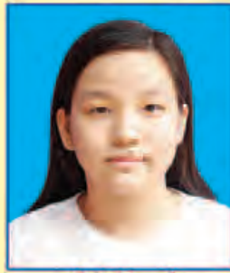
ပပြတ်သီရိကျော် ဆရက-၄၆၂ (ဘာသာစုံဂုဏ်ထူး) ရန်ကုန်မြို့