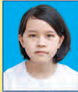
ပဖြူမွန်မြယ် ဆရက-၄၇၅ (ဘာသာစုံဂုဏ်ထူး) ရန်ကုန်မြို့