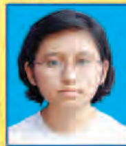
ပစိုးနဒီဝေ ဆရက-၅၆၇ (၅-ဘာသာဂုဏ်ထူး) ရန်ကုန်မြို့