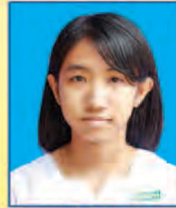
ပပြတ်သီရိနွယ် ဆရက-၅၃၉ (ဘာသာစုံဂုဏ်ထူး) ရန်ကုန်မြို့