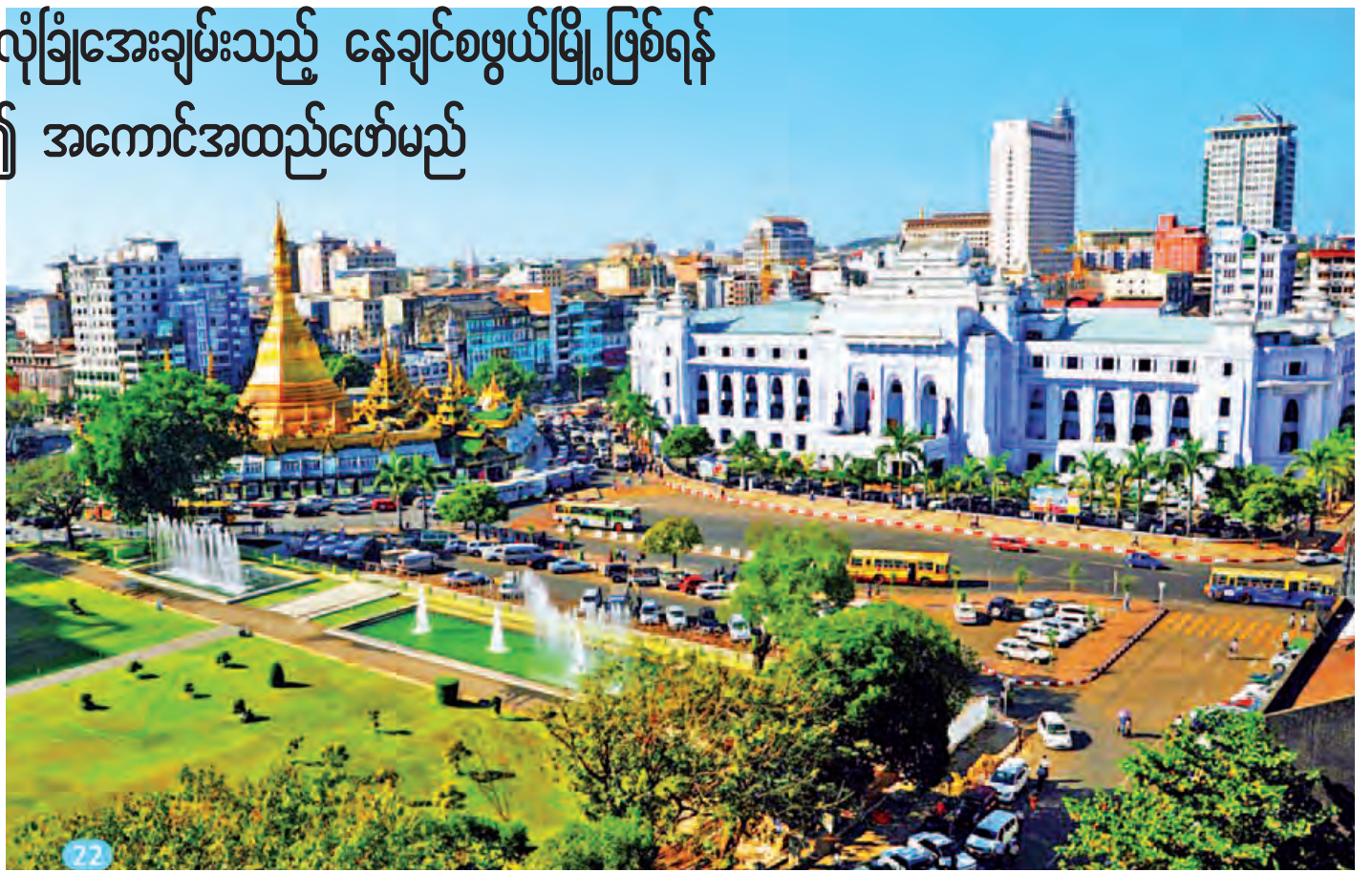
ရန်ကုန်မြို့ရှိ မဟာပန္နလပန်းခြံ ဆူးလေစေတီတော်နှင့် မြို့တော်ခန်းမတို့ကို ပန်သင့်စွာ တွေ့မြင်ရစဉ်။