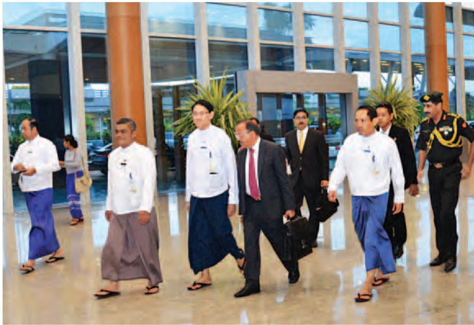
အိန္ဒိယသမ္မတနိုင်ငံဝန်ကြီးချုပ်၏ အထူးကိုယ်စားလှယ် အိန္ဒိယအမျိုးသားလုံခြုံရေးအကြံပေးပုဂ္ဂိုလ် (ဝန်ကြီး ချုပ်ရုံး ဝန်ကြီး) မစ္စတာ အာဂျစ် ဒိုဘယ်လ် ဦးဆောင်သည့်ကိုယ်စားလှယ်အဖွဲ့ ဇွန် ၁၆ ရက်က မြန်မာနိုင်ငံမြောက်ပိုင်းဒေသ ဝန်ကြီးဌာနမှ တာဝန်ရှိသူများက နေပြည်တော်အပြည်ပြည်ဆိုင်ရာလေဆိပ်၌ ပို့ဆောင်နှုတ်ဆက်ကြစဉ်။ (သတင်းစဉ်)