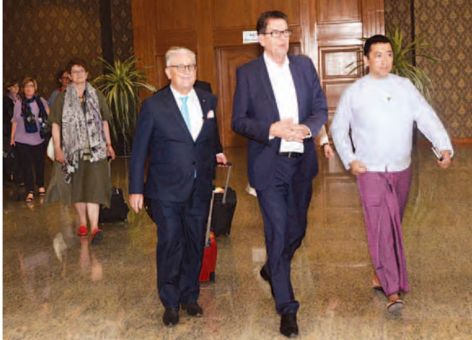
ဂျာမနီနိုင်ငံ စီးပွားရေးဖွံ့ဖြိုးတိုးတက်မှုနှင့် ပူးပေါင်းဆောင်ရွက်မှုဝန်ကြီးဌာနဝန်ကြီး Dr. Gred Muller ဦးဆောင်သည့် ကိုယ်စားလှယ်အဖွဲ့အား နိုင်ငံခြားရေးဝန်ကြီးဌာနမှ တာဝန်ရှိသူများက ဇွန် ၁၆ ရက်တွင် နေပြည်တော် အပြည်ပြည်ဆိုင်ရာလေဆိပ်၌ ကြိုဆိုနှုတ်ဆက်ကြစဉ်။ (သတင်းစဉ်)