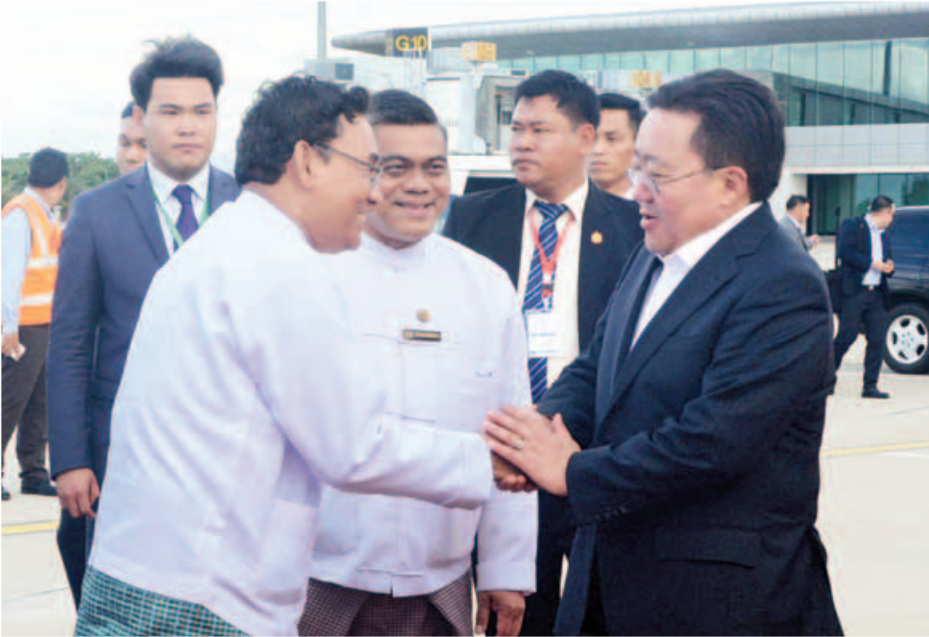
မွန်ဂိုလီးယားနိုင်ငံ သမ္မတ မစ္စတာ ဇော်စ်ဟီးလ်ယာန် အယ်လ်ဘတ်စ်ဒေါ့ဂျီ ဦးဆောင်သည့် ကိုယ်စားလှယ် အဖွဲ့ ဇွန် ၁၆ ရက်က မြန်မာနိုင်ငံမှ ပြန်လည်ထွက်ခွာရာ သယ်ဇာတနှင့် သဘာဝပတ်ဝန်းကျင်ထိန်းသိမ်းရေး ဝန်ကြီးဌာန ပြည်ထောင်စုဝန်ကြီး ဦးအုန်းဝင်းနှင့် တာဝန်ရှိသူများက နေပြည်တော်အပြည်ပြည်ဆိုင်ရာလေဆိပ်၌ ပို့ဆောင်နှုတ်ဆက်ကြစဉ်။ (သတင်းစဉ်)