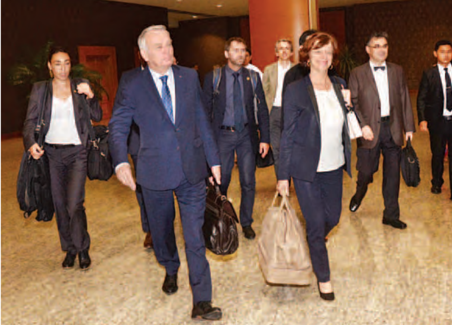
ပြင်သစ်သမ္မတနိုင်ငံ နိုင်ငံခြားရေးနှင့် နိုင်ငံတကာဖွံ့ဖြိုးတိုးတက်ရေးဝန်ကြီး H. E. Mr. Jean-Marc AYRAULT ဦးဆောင်သည့် ကိုယ်စားလှယ်အဖွဲ့ ဇွန် ၁၆ ရက် ညနေပိုင်းက နေပြည်တော်အပြည်ပြည်ဆိုင်ရာ လေဆိပ်သို့ ရောက်ရှိကြစဉ်။