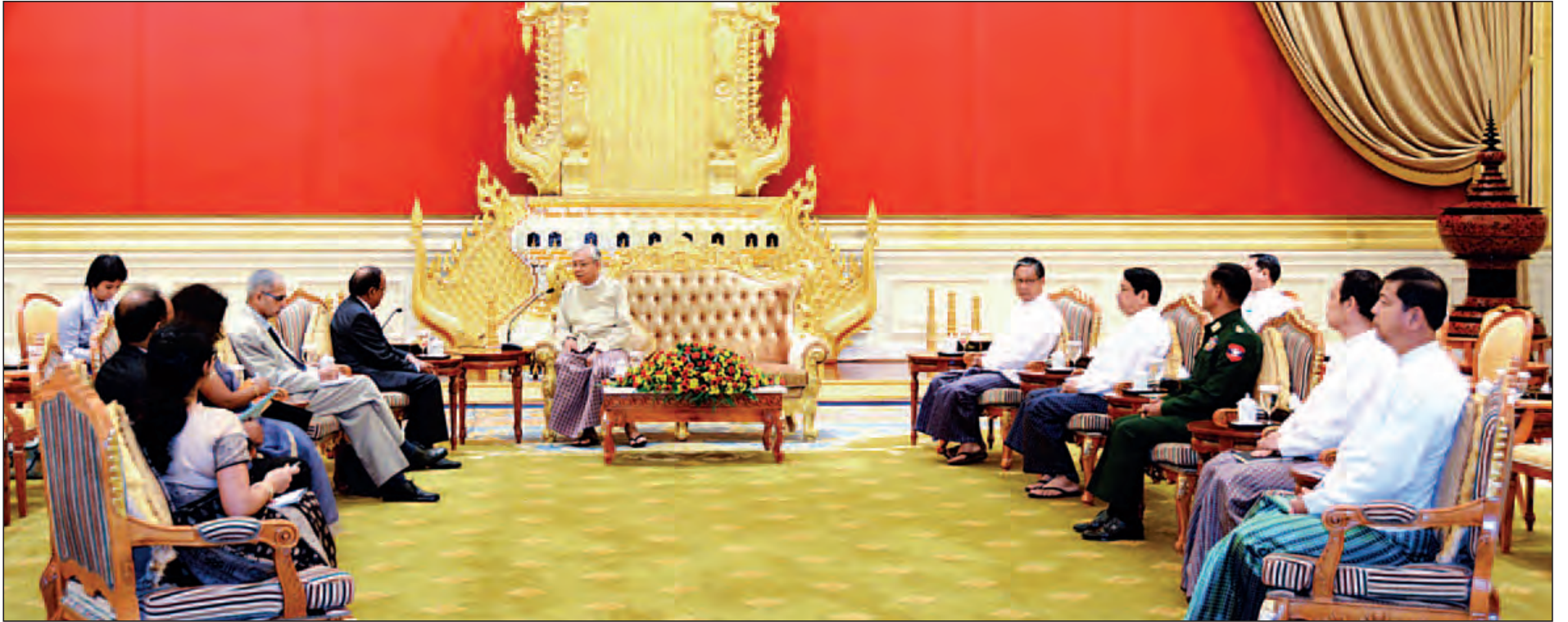
နေပြည်တော် ဇွန် ၁၆

နိုင်ငံတော်သမ္မတ ဦးထင်ကျော်သည် အိန္ဒိယသမ္မတနိုင်ငံ ဝန်ကြီးချုပ်၏ အထူးကိုယ်စားလှယ်ဖြစ်သူ အိန္ဒိယ အမျိုးသားလုံခြုံရေး အကြံပေးပုဂ္ဂိုလ် (ဝန်ကြီးချုပ်ရုံး ဝန်ကြီး) မစ္စတာ အာဂျစ် ဒိုဘယ်လ် ဦးဆောင်သည့်