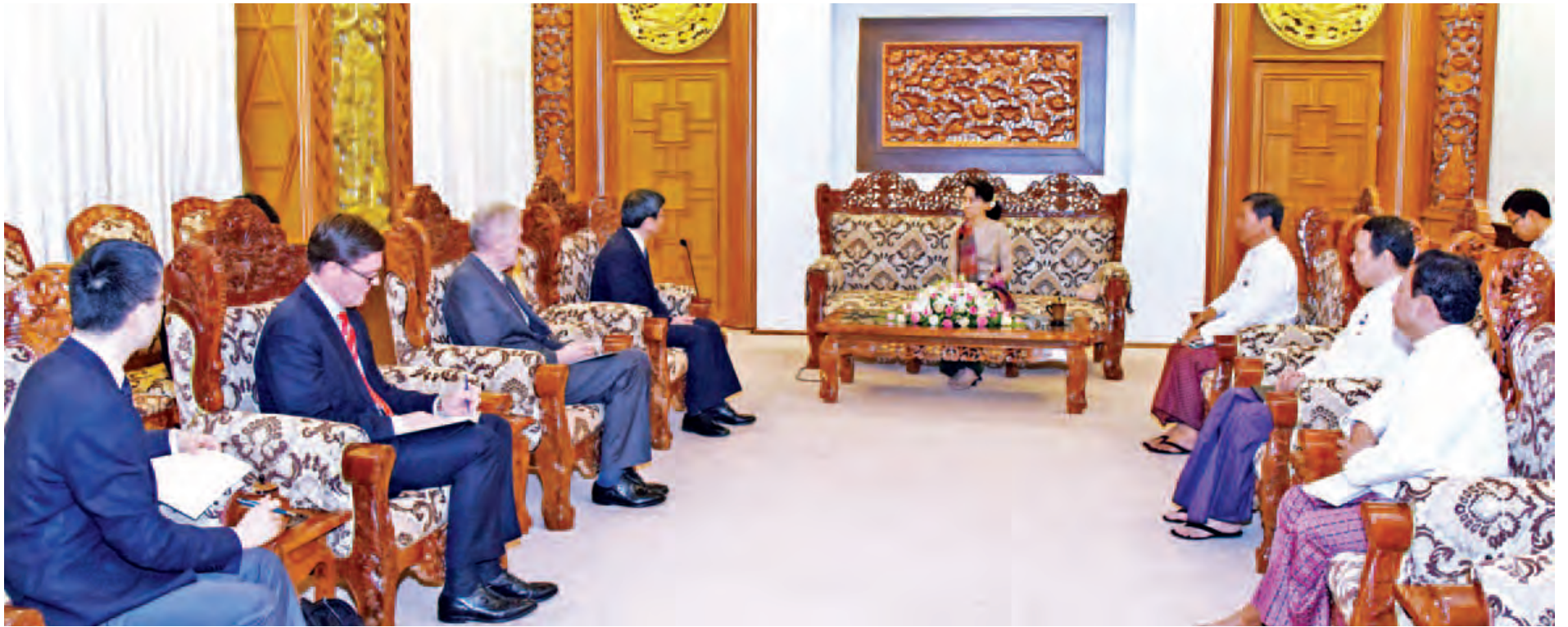
ပြည်ထောင်စုဝန်ကြီး ဒေါ်အောင်ဆန်းစုကြည် အာရှဖွံ့ဖြိုးရေးဘဏ်ဥက္ကဋ္ဌ မစ္စတာ တက်ဟိကို နာကာအိုအား လက်ခံတွေ့ဆုံစဉ်။ (သတင်း စာမျက်နှာ - ၃) (သတင်းစဉ်)

ပြည်ထောင်စုဝန်ကြီး ဒေါ်အောင်ဆန်းစုကြည် အာရှဖွံ့ဖြိုးရေးဘဏ်ဥက္ကဋ္ဌ မစ္စတာ တက်ဟိကို နာကာအိုအား တွေ့ဆုံ အလုပ်အကိုင်အခွင့်အလမ်းများ ပန်တီးပေးနိုင်ရေးနှင့် ကျေးလက်ဒေသဖွံ့ဖြိုးတိုးတက်ရေးကိစ္စရပ်များ ဆွေးနွေး