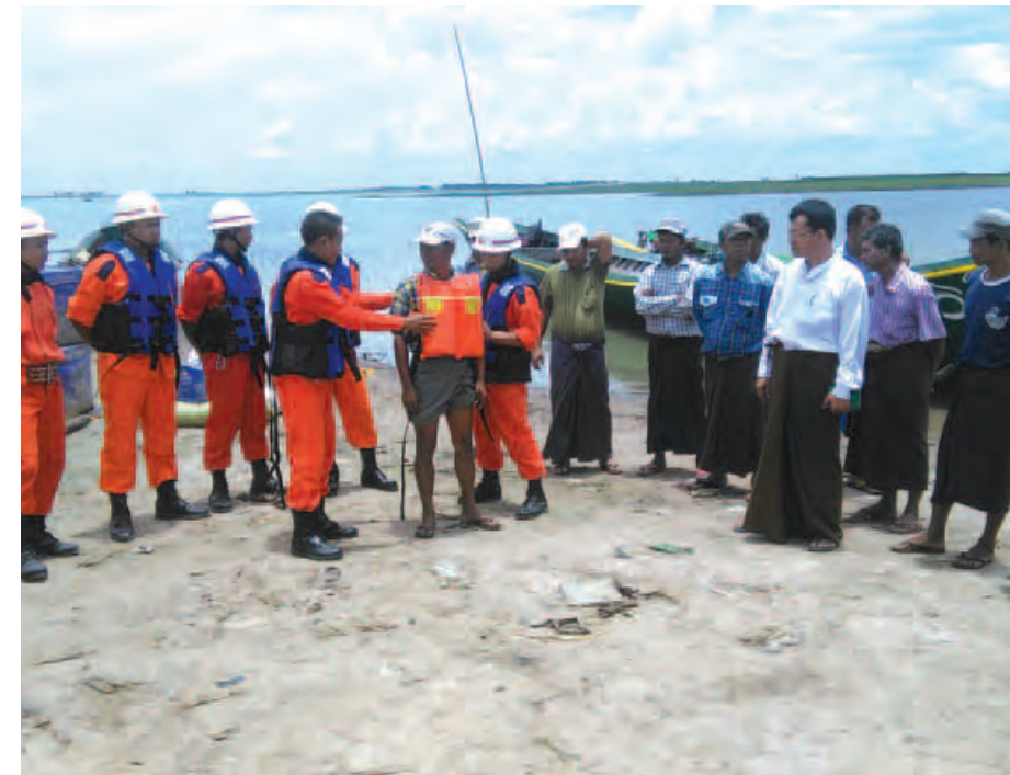
မျိုးဝင်းညို(ကျွန်းလှ)

စစ်ကိုင်းတိုင်းဒေသကြီး ကျွန်းလှမြို့နယ် မီးသတ်ဦးစီးဌာနက ရက် ၁၀၀ စီမံချက်ဖြင့် သပန်းဆိပ်ဆည်အတွင်း သွားလာနေသော ရေကြောင်းခရီးသည်များ အန္တရာယ်ကင်းစေ ရန်ရည်ရွယ်၍ ငါဘတ်အိုင်လှေဆိပ်တွင် ပညာ ပေးခြင်းလုပ်ငန်းများ ဆောင်ရွက်ခဲ့ကြောင်း သိရသည်။