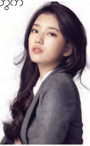
(မျိုးစန္ဒာမောင်)

ဆူဇီ၏ အနုပညာလှုပ်ရှားမှုအနေဖြင့် ယခုနှစ်အစောပိုင်းက Exo အဖွဲ့မှ Baekhyun နှင့် တွဲဖက်သီဆိုထားသည့် Dream သီချင်းသည် တောင်ကိုရီးယား၏ ဂီတဇယားအတော်များများတွင် နံပါတ်တစ်နေရာ၌ ရပ်တည်ခဲ့သည်။