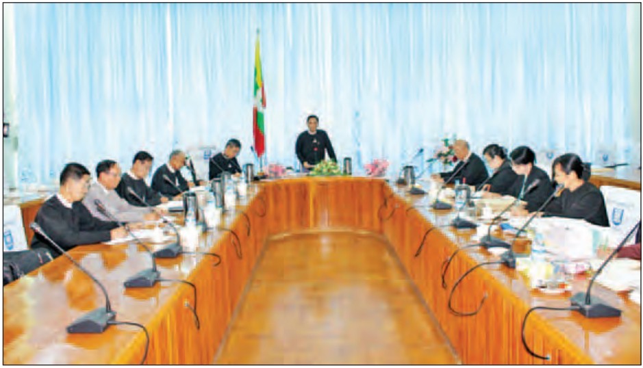
ကြောင်း ပြောကြားသည်။ မြန်မာ ၁၀၈၈၇ ဦးရှိပြီး ယခုအစည်းအဝေး ၆၁၁ စောင်ရရှိသည့်အနက် ၆၀၈ ဦး နိုင်ငံတွင် ယနေ့အထိ တရား တွင် တရားလွှတ်တော်ရှေ့နေအဖြစ် ကို စိစစ်အတည်ပြုထောက်ခံပေးခဲ့ လွှတ်တော်ရှေ့နေ စုစုပေါင်း စာရင်းတင်သွင်းရန် လျှောက်လွှာ ကြောင့် သတင်းရရှိသည်။(သတင်းစဉ်)

ကျင့်ဝတ်သိက္ခာ မြင့်မားရေးတို့ကို အလေးထား ဆောင်ရွက်ကြရမည် ဖြစ်ပါကြောင်း၊ Bar Council Act ကို ခေတ်နှင့်လျော်ညီသည့် ဥပဒေ တစ်ရပ်ဖြစ်လာစေရေးနှင့် တရား လွှတ်တော် ရှေ့နေများကောင်စီ၏ လုပ်ငန်းဆောင်ရွက်မှုများ ပိုမို သွက်လက် မြန်ဆန်လာစေရေး အတွက် ပိုင်းဝန်းစဉ်းစား အကြံပြုကြ စေလိုပါကြောင်း၊ တရားလွှတ်တော် ရှေ့နေများ ကောင်စီ၏လုပ်ငန်းများ ပိုမိုဆောင်ရွက်နိုင်ရေးအတွက် ပုံမှန် အစည်းအဝေးများကို သုံးလလျှင် တစ်ကြိမ်ခန့် ကျင်းပသွားလိုပါ