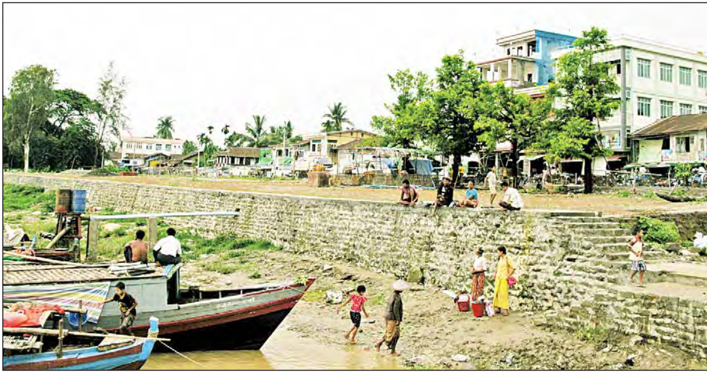
ရခိုင်ပြည်နယ် ကျောက်တော်မြို့ရှိ ရတီဆိပ်ကမ်းနှင့် နေအိမ်အဆောက်အအုံများကို တွေ့ရစဉ်။

ထို့နောက်ကျွန်တော်တို့ ကျောက်တော်တောင်ဘက်သို့ ထွက်လာခဲ့ကြသည်။ ကျောက်တော်မြို့အထွက်တွင်ရှိသော