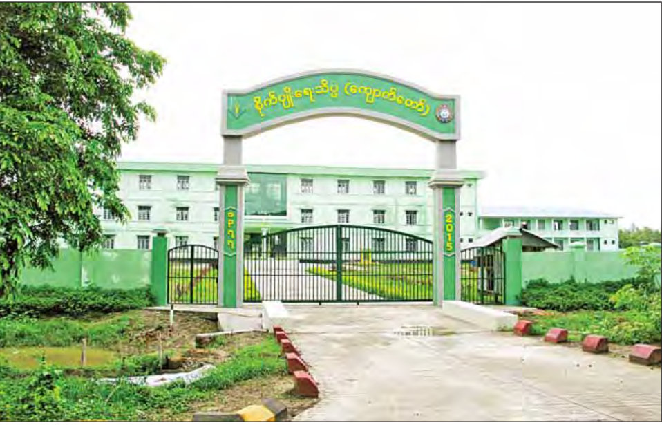
ရခိုင်ပြည်နယ် ကျောက်တော်မြို့ရှိ စိုက်ပျိုးရေးသိပ္ပံ(ကျောက်တော်)ကို တွေ့ရစဉ်။

ချိန်မှာ ညနေ ၃ နာရီ ထိုးတော့မည်။ မိုးကလည်း တဖြည်းဖြည်းသည်းလာပြန်သည်။ ရခိုင်မိုးကား ရက်ဆက်စွေလွန်းလှသည်ဟု တွေးမိသည်။ အပြန်လမ်းတွင် ကားလမ်းဘေးဝဲ၊ ယာတစ်လျှောက် ပြန်ပြူးနေသော စိုက်ပျိုးမြေများကိုကြည့်ကာ စိုက်ပျိုးရေးအကျိုးပြုကမ္ဘာ့ပဒေသာမြစ်ကိုလှမ်းမျှော်ရင်း အနာဂတ်ကျောက်တော်မြို့မြင်ကွင်းက အတွေးထဲတွင်လှပစွာ ရှိနေသည်မှာ အမှန်ပင်။ ။