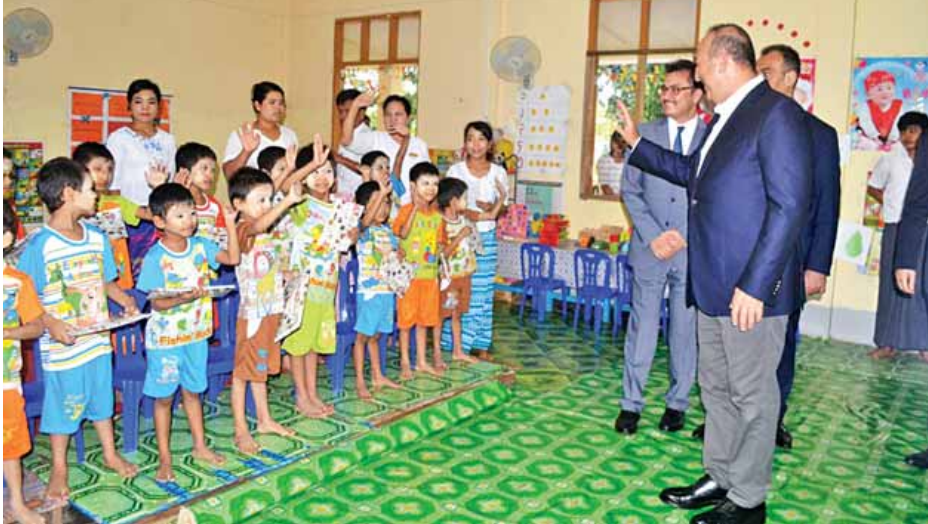
ဇော်ထံသို့လည်းကောင်း ပေးအပ်သည်။ တို့မှတစ်ဆင့် တူရကီနိုင်ငံခြားရေး ဝန်ကြီးနှင့်အဖွဲ့သည် အောင်မင်္ဂလာ ရပ်ကွက်ရှိ အစွလာမိဘာသာ ဝတ်ပြု ကျောင်းသို့ရောက်ရှိကာ ဆန်အိတ် ၁၀၀၊ ဆီပုံး ၇၀အား ပေးအပ်လှူဒါန်း ပြီး ယင်းရပ်ကွက်ရှိ အစွလာမိဘာသာ ကိုးကွယ်သူများနှင့် တွေ့ဆုံသည်။ (ပြည်နယ် မြန်/ဆက်)