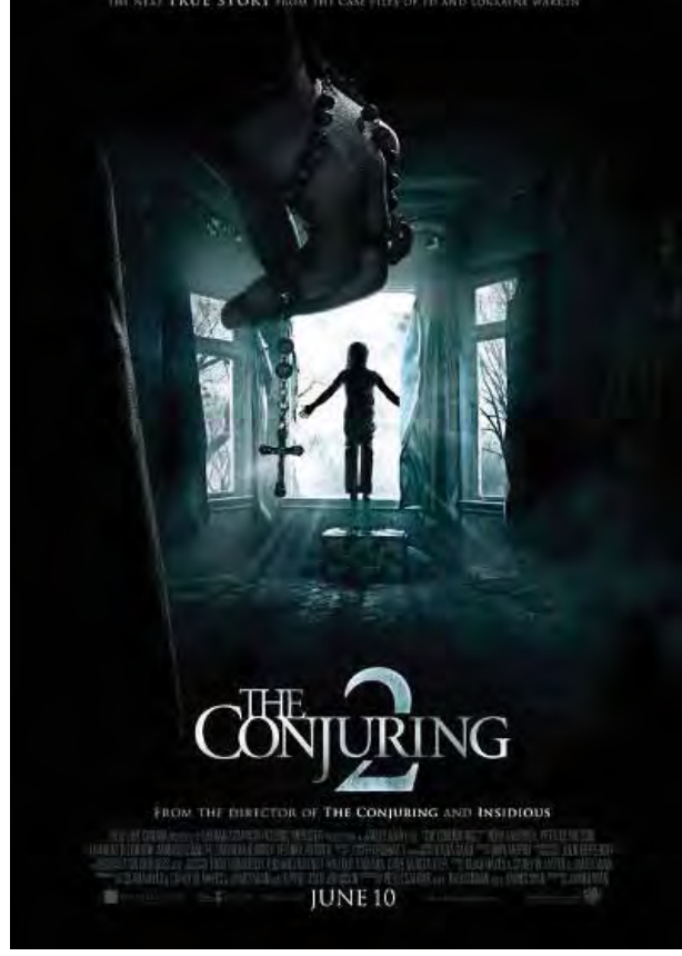
မျိုးစန္ဒာမောင် - စုစည်းသည်

ဗီဒီယိုဂိမ်းတစ်ခုကို အခြေခံရိုက်ကူးထားသည့် Warcraft ဇာတ်ကားက ဒုတိယနေရာတွင်လည်းကောင်း၊ Now You See Me 2 ဇာတ်ကားက တတိယနေရာနှင့် နင်ဂျာဇာတ်ကားသစ် Teenage Mutant Ninja Turtles: Out of the Shadows က စတုတ္ထနေရာတွင်လည်းကောင်း အသီးသီးရပ်တည်လျက်ရှိကြောင်းသိရသည်။