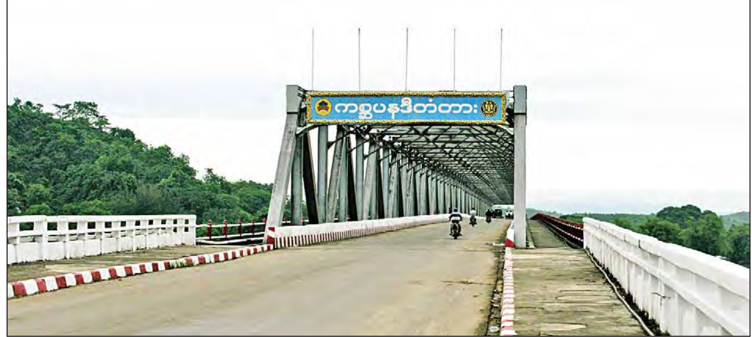
ရခိုင်ပြည်နယ်ရှိ ကမ္ဘာ့ပဒေသာတံတားကို တွေ့ရစဉ်။

ရေခဲ၊ မြေခဲကောင်းမွန်သည့် ကျောက်တော်မြို့နယ်ကို သဘာဝကပေးထားသော လက်ဆောင်မွန်ဖြစ်သည့် ကမ္ဘာ့ပဒေသာမြစ်လည်း စီးဆင်းနေရာ အရှိန်အဟုန်ဖြင့် ဖွံ့ဖြိုးတိုးတက်ရန်မှာ လက်တစ်ကမ်းအကွာသို့ ရောက်ရှိနေပြီဖြစ်သည်။ စိုက်ပျိုးမြေများလည်း လုံလောက်စွာရရှိနေရာ ကျောက်တော်မြို့နယ်ဖွံ့ဖြိုးတိုးတက်ရန် ဒေသခံပြည်သူများက အတူတကွ လက်တွဲဆောင်ရွက်မှသာ ရရှိမည်ဟု