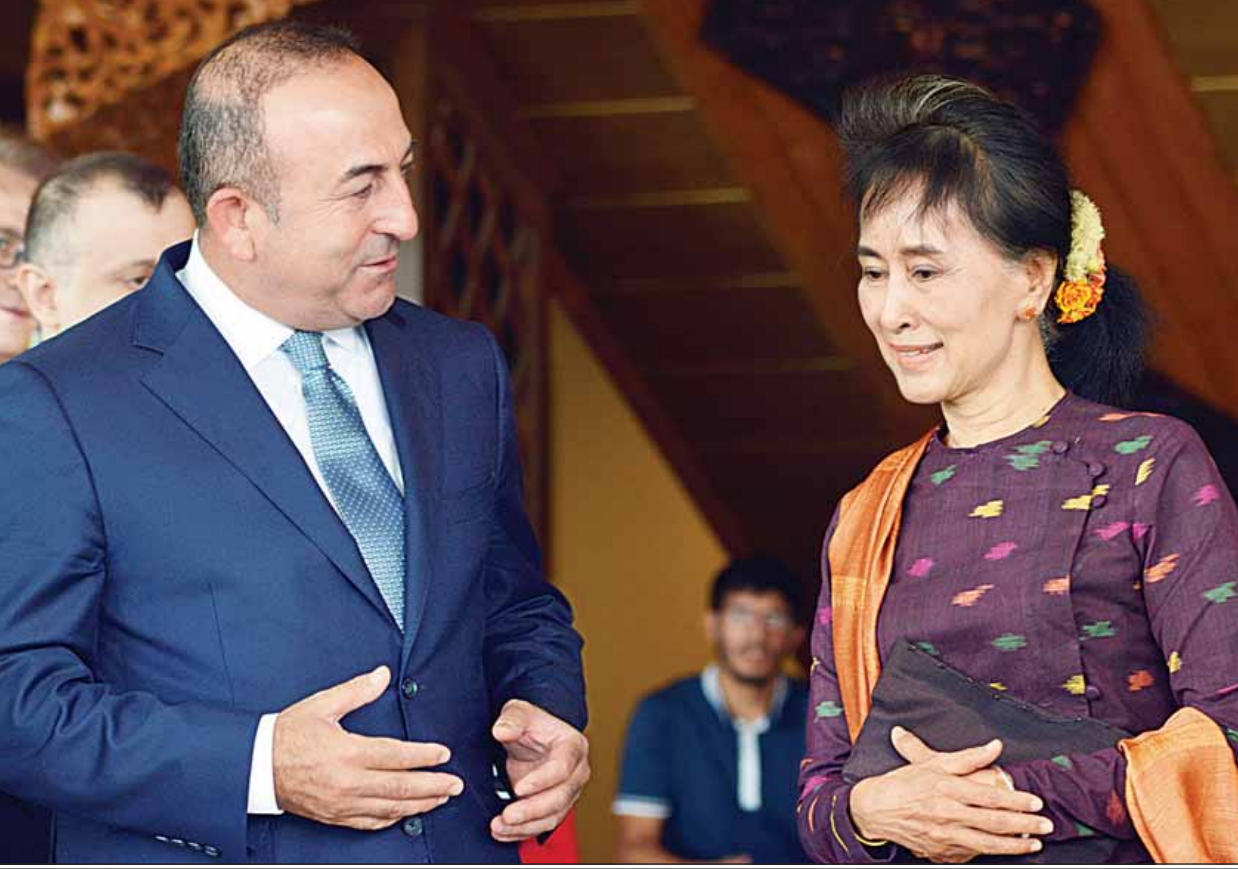
ပြည်ထောင်စုဝန်ကြီး ဒေါ်အောင်ဆန်းစုကြည်နှင့် တူရကီနိုင်ငံခြားရေးဝန်ကြီးတို့ တွေ့ဆုံစဉ်။ (သတင်း စာမျက်နှာ - ၃)