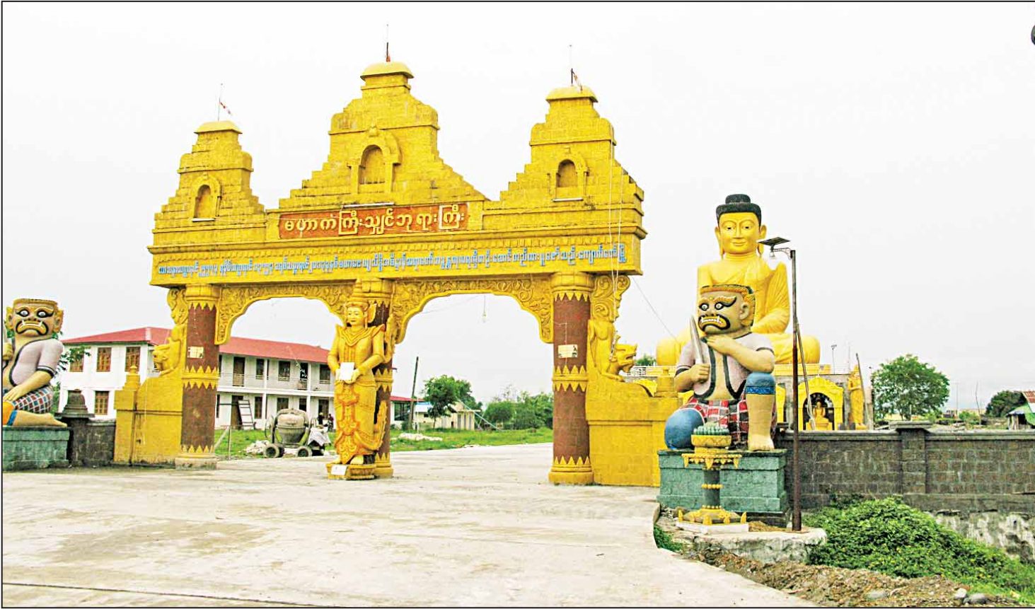
ရခိုင်ပြည်နယ် ကျောက်တော်မြို့ရှိ မဟာကြီးသျှင်ဘုရားကို တွေ့ရစဉ်။

ကျောက်တော်မြို့နယ်သည် အရှေ့မှအနောက်သို့ ၁၉ မိုင်၊ မြောက်မှတောင်သို့ ၃၅ မိုင်ရှိကာ ဧရိယာ စတုရန်းမိုင်ပေါင်း ၆၇၅ ဒသမ ၅၅ မိုင်ရှိကြောင်း သိရသည်။ စိုက်ပျိုးရေးလုပ်ငန်းကို အဓိကထားပြီးလုပ်ကိုင်သော မြို့ဖြစ်ပြီး နွေ၊ မိုး၊ ဆောင်းစိုက်စေများ တိုးချဲ့စိုက်ပျိုးရန် အားထုတ်နေကြောင်း သိရသည်။ ကျောက်တော်မြို့သည် မြို့ပေါ်ရပ်ကွက် ၄ ခု၊ ရပ်ကွက်ရှိပြီး အိမ်ခြေ ၆၄၆၆ အိမ်ရှိကာ မြို့အကျယ်အဝန်းမှာ ၃၃၄ စတုရန်းမိုင်ရှိသည်။ ကျောက်တော်မြို့နယ်အတွင်း ဘာသာပေါင်းစုံနေထိုင်ကြရာ စိုက်ပျိုးရေးလုပ်ငန်းများ လုပ်ကိုင်ရင်း တည်ငြိမ်အေးချမ်းစွာနေထိုင်လျက်ရှိသည်ကိုလည်း တွေ့ရသည်။ နွေ၊ မိုး၊ ဆောင်းစိုက်ပျိုးရေးလုပ်ငန်းများနှင့်သာ အချိန်ကုန်လျက်ရှိသည်က များလေသည်။