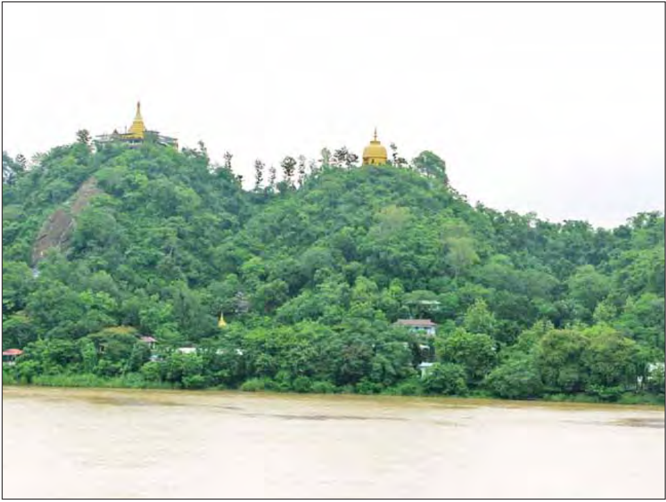
ရခိုင်ပြည်နယ် ကျောက်တော်မြို့အနီး ကျောက်တော်စေတီကို တွေ့ရစဉ်။

ကျောက်တော်မြို့က ထူးခြားသည်။ ရေ၊ မြေ ကောင်းမွန်သဖြင့် စိုက်ပျိုးရေးလုပ်ငန်းများ အောင်မြင်သည်။ စိုက်ကေသစ်များ တိုးချဲ့ဖော်ထုတ်ရန်လည်း အစီအစဉ်ရှိနေပြီး မြစ်ရေတင်စီမံကိန်းများလည်း အကောင်အထည်ဖော်တည်ဆောက်နေရာ မကြာမီပြီးစီးတော့မည်ဖြစ်သည်။ ပို၍စိတ်ဝင်စားစရာကောင်းသည်မှာ ကျောက်တော်မြို့နယ်တွင် စိုက်ပျိုးရေးဇုန်၊ မွေးမြူရေးဇုန်များပြုလုပ်ရန် အနာဂတ်အစီအမံများလည်းရှိနေရာ အကောင်အထည်ဖော်လုပ်ကိုင်နိုင်ပါက တစ်ရှိန်ထိုး ဖွံ့ဖြိုးတိုးတက်လာမည်ဖြစ်သည်ဟု တွေးမိသည်။ ထိုသို့ဖွံ့ဖြိုးတိုးတက်ရန်မှာ တည်ငြိမ်အေးချမ်းမှုရှိမှသာ အကောင်အထည်ဖော် ဆောင်ရွက်နိုင်မည်ဖြစ်သည်မှာ အမှန်ပင်။