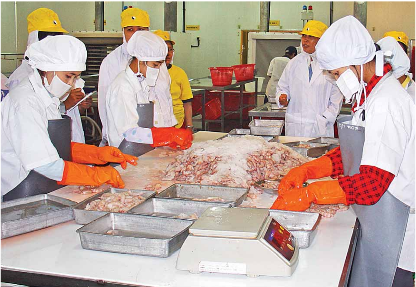
တနင်္သာရီတိုင်းဒေသကြီးရှိ အအေးခန်းစက်ရုံ၌ အရည်အသွေးမီ ပစ္စန်းများကို ချိန်တွယ်စစ်ဆေးနေစဉ်။