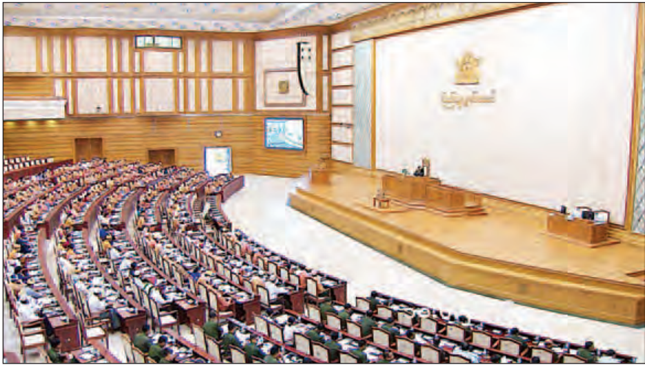
ဒုတိယအကြိမ် ပြည်သူ့လွှတ်တော် ပထမပုံမှန်အစည်းအဝေး ကျင်းပစဉ်။

တာဝန်နှင့် လုပ်ပိုင်ခွင့်တို့ကို ဥပဒေ၊ နည်းဥပဒေ၊ လုပ်ထုံးလုပ်နည်းများနှင့်အညီ ကျေပွန်အောင်ဆောင်ရွက်ရန်နှင့် ပြည်သူများအကြားသို့ ထဲထဲဝင်ဝင်သွားရောက်ပြီး ပြည်သူများ၏ ဆန္ဒသဘောထားများကို လေ့လာမှတ်သားကြရန် မှာကြားသည်။ ဆက်လက်၍ ပြည်သူ့လွှတ်တော်ဥက္ကဋ္ဌက လွှတ်တော်ကိုယ်စားလှယ်များအနေဖြင့် ပြည်သူ့အကျိုးဆောင်ရွက်ရင်း အမျိုးသားရင်ကြားစေရေး၊ ပြည်တွင်းငြိမ်းချမ်းရေး၊ ဒီမိုကရေစီဖက်ဒရယ်ပြည်ထောင်စုဖြစ်ပေါ်ရေးနှင့် ပြည်သူများ၏ လူနေမှုဘဝအဆင့်အတန်း မြင့်မားတိုးတက်ရေးတို့ကို ကြိုးစားဆောင်ရွက်ပေးကြစေလိုကြောင်း။ လွှတ်တော်ရပ်နားစဉ်ကာလအတွင်း ပြည်သူ့လူထုအကျိုးစီးပွားဖြစ်ထွန်းမည့် လုပ်ငန်းတာဝန်များကို စိတ်ကောင်းစေတနာမှန်ဖြင့် ဆက်လက်ထမ်းပိုး ထမ်းဆောင်ကြစေလိုကြောင်း၊ ဒေသဖွံ့ဖြိုးရေးလုပ်ငန်းများကို မဲဆန္ဒရှင်မိဘပြည်သူများ ကျေနပ်နှစ်သက်အောင် ဆောင်ရွက်ပေးနိုင်လိမ့်မည်ဟု ယုံကြည်မျှော်လင့်ပါကြောင်း ပြောကြားသည်။ ဒုတိယအကြိမ် ပြည်သူ့လွှတ်တော် ပထမပုံမှန်အစည်းအဝေး ပထမနေ့ကို ၂၀၁၆ ခုနှစ် ဖေဖော်ဝါရီ ၁ ရက်မှစတင်ခဲ့ပြီး ယနေ့ ဇွန် ၁၀ ရက်တွင် ပြီးဆုံးခဲ့ခြင်းဖြစ်သည်။ ဒုတိယအကြိမ် လွှတ်တော်ပထမပုံမှန်အစည်း