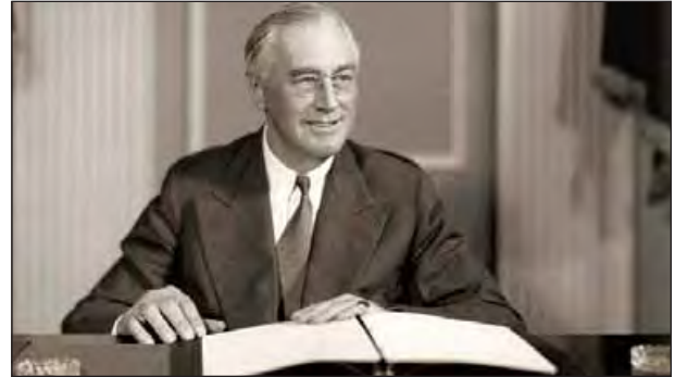
Rural Electrification Act-1936 ကို ပြဋ္ဌာန်းပေးခဲ့သော အမေရိကန်သမ္မတ ဖရန်ကလင်ရိုဗ်ဘဲ

လျှပ်စစ်မီးကို လူသားများအသုံးပြုလာခဲ့ကြတာ နှစ်ပေါင်း ၁၃၀ ကျော် ကြာလာခဲ့ပါပြီ။ လျှပ်စစ်ဓာတ်အားဟာ လူသားတွေအတွက် မရှိမဖြစ်တဲ့ အခြေခံလိုအပ်ချက် ဖြစ်နေပါပြီ။ မြန်မာနိုင်ငံမှာတော့ အိမ်ထောင်စုဦးရေ