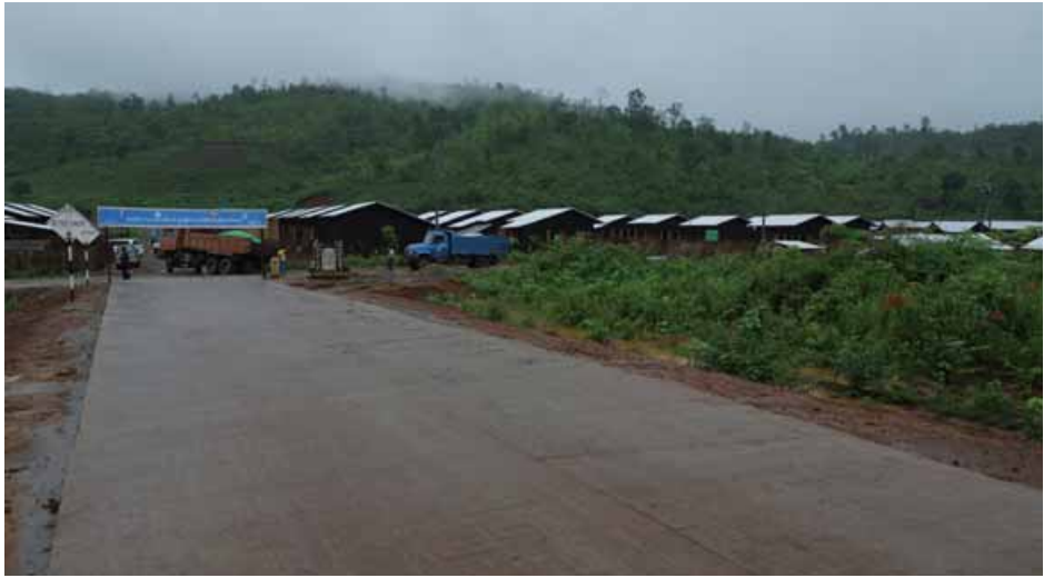
တစ်အိမ်ထောင်လျှင် ငွေကျပ် ၂၅၀၀၀၀ နှုန်းဖြင့် ငွာနနှင့် ပူးပေါင်း၍ အသက်မွေးပညာသင်တန်းများ စိုက်ပျိုးမွေးမြူရေး၊ ဝင်ငွေတိုးပွားရေးလုပ်ငန်းများ ဖွင့်လှစ်ပို့ချပေးလျက်ရှိကြောင်း သိရသည်။ (ပြည်နယ်ပြန်/ဆက်)

တစ်ခုဖြစ်ပြီး ယခင်က မိုးရာသီတွင် အသုံးပြုသွားလာရန်ခက်ခဲကြောင်း၊ ရွာရှိစာသင်ကျောင်းသို့သွားရာတွင် ရေမှာ ခါးလယ်ခန့်အထိရှိပြီး မိမိတို့ကလေးငယ်များအား ကျောပိုး၍လိုက်လံပို့ဆောင်ပေးရကြောင်းနှင့် လမ်းကောင်းသွားသည့်အတွက် မြို့ပေါ်နှင့်အနီးကျေးရွာများသို့ လွယ်ကူအဆင်ပြေစွာ သွားလာနိုင်ပြီဖြစ်ကြောင်း ရွာသူရွာသားများက ၎င်းတို့တွေ့ကြုံရသည့် အခက်အခဲများကို ပြောသည်။