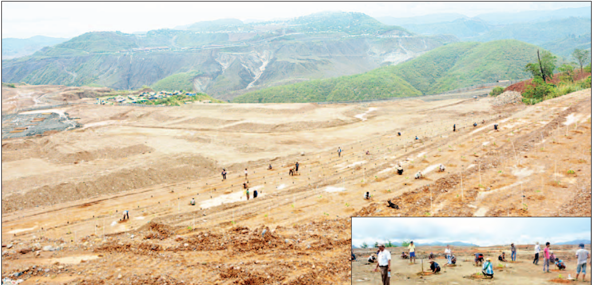
လုံးခင်း၊ ဖားကန့် ရတနာနယ်မြေတွင် သဘာဝပတ်ဝန်းကျင်ထိခိုက်ပျက်စီးမှုကို ပြန်လည်ထိန်းသိမ်းကာကွယ်ရန်အတွက် ပျိုးပင်ပေါက်များ စိုက်ပျိုးကြစဉ်။