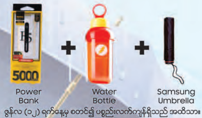
5000mAh Power Bank + Water Bottle + Samsung Umbrella ဇွန်လ (၁၂) ရက်နေ့မှ စတင်၍ ပစ္စည်းလက်ကျန်ရှိသည် အထိသာ။