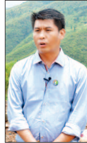
ကိုဇော်လေးမြင့်(ခ)ကိုဝမ်း