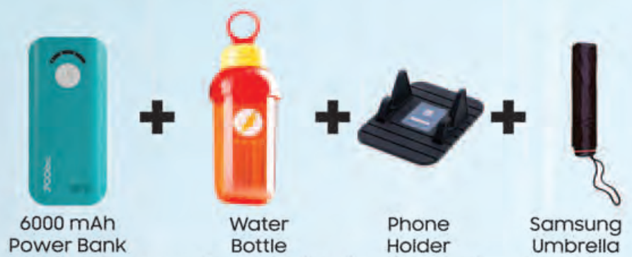
6000 mAh Power Bank + Water Bottle + Phone Holder + Samsung Umbrella ဇွန်လ (၁၂) ရက်နေ့မှ စတင်၍ ပစ္စည်းလက်ကျန်ရှိသည် အထိသာ။