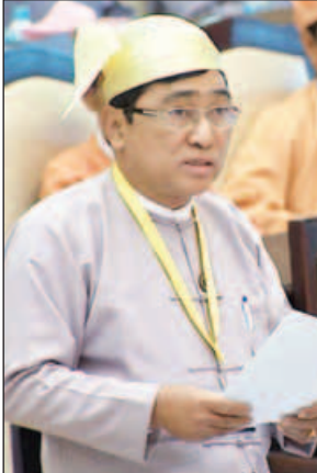
ပြည်ထောင်စုဝန်ကြီး ဒေါက်တာဝင်းမြတ်အေး

မြန်မာနိုင်ငံ လူငယ်မူဝါဒရေးဆွဲရေး ဗဟိုကော်မတီနှင့် မြန်မာနိုင်ငံ လူငယ်မူဝါဒမူကြမ်းရေးဆွဲရေးအဖွဲ့ များ ဖွဲ့စည်း၍ လူငယ်များကိုယ်တိုင် ပါဝင်ရေးဆွဲနိုင်ရေးအတွက် ဆောင်ရွက်လျက်ရှိကြောင်း ပြည်ထောင်စုဝန်ကြီး ဒေါက်တာဝင်းမြတ်အေးက ယနေ့အစည်းအဝေးတွင် ဖြေကြားခဲ့သည်။ တနင်္သာရီတိုင်းဒေသကြီး မဲဆန္ဒနယ် အမှတ်(၈)မှ ဦးဥက္ကာမင်း၏ ပြည်ထောင်စု အစိုးရအနေဖြင့် လူငယ်ရေးရာ မူဝါဒတစ်ရပ်ရေးဆွဲပြဋ္ဌာန်း အကောင်အထည်ဖော်ဆောင်ရွက်ရန် အစီအစဉ် ရှိ မရှိမေးခွန်းနှင့်စပ်လျဉ်း၍ လူမှုဝန်ထမ်း၊ ကယ်ဆယ်ရေးနှင့် ပြန်လည်နေရာချထားရေးဝန်ကြီးဌာန ပြည်ထောင်စုဝန်ကြီးက ၂၀၁၄ ခုနှစ် မြန်မာနိုင်ငံလူဦးရေနှင့် အိမ်အကြောင်းအရာသန်းခေါင်စာရင်းအရ မြန်မာနိုင်ငံစုစုပေါင်းလူဦးရေ၏ ၁၇ ဒသမ ၈၁ ရာခိုင်နှုန်းသည် အသက် (၁၅)နှစ်မှ (၂၄) နှစ်အတွင်းရှိ လူငယ်များဖြစ်ပါ