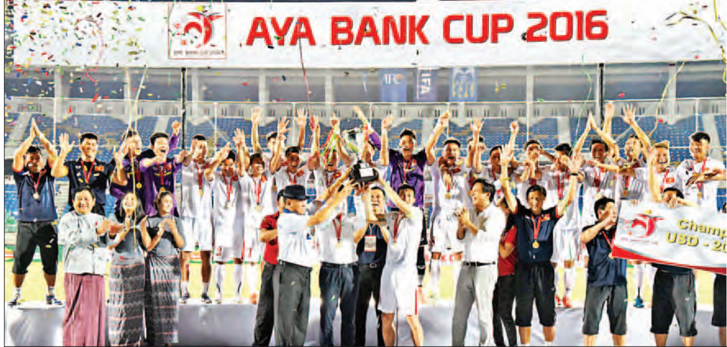
မြန်မာနိုင်ငံဘောလုံးအဖွဲ့ချုပ်နာယက ဦးအောင်ကိုဝင်း ပထမဆုရဗိုလ်ကန်အသင်းအား ချန်ပီယံဆုချီးမြှင့်စဉ်။