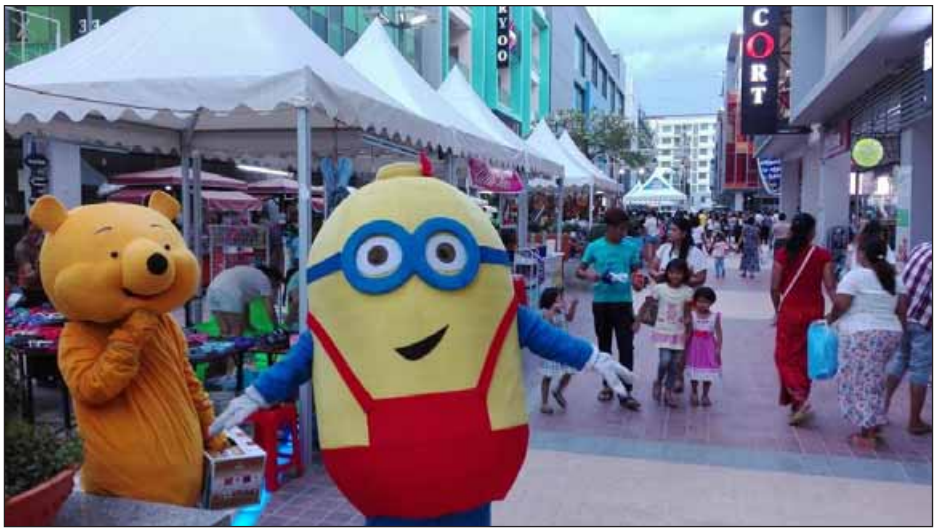
ချမ်းမြသာစည်မြို့နယ်တွင် မင်္ဂလာမူဆယ်ညဈေးဖွင့်လှစ်

“ဇန်နဝါရီလမှာ ခြင်ထောင်အလုံး ၂၄၀၊ ဖေဖော်ဝါရီလမှာ ၄၄၀၊ မတ်လမှာ ၄၁၀၊ ဧပြီလမှာ ၄၁၀၊ မေလမှာ ၂၈၀ နဲ့ အခုဇွန်လမှာ ခြင်ထောင်အလုံး ၃၄၀ တို့ကို