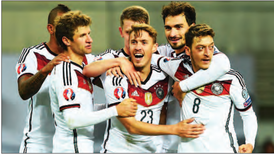
တန်ကြေးအကြီးဆုံး ယူရို-၂၀၁၆ ပြိုင်ပွဲဝင်အသင်းများ

ပူပူနွေးနွေး ကမ္ဘာ့ချန်ပီယံဂျာမနီနဲ့ ယူရိုဖလား နှစ်ကြိမ်ဆက် ချန်ပီယံစပိန်တို့ဟာ တန်ဖိုးအမြင့်မားဆုံး ကစားသမားစာရင်းကို ထိပ်ဆုံးက ဦးဆောင်နေတာ သိပ်ဆန်းကြယ်တဲ့ကိစ္စမဟုတ်ပေမယ့် မကြာသေးခင်ကမှ ကမ္ဘာ့ဘောလုံးစင်မြင့်ထက်ကို တက်လှမ်းလာခဲ့တဲ့ ဘယ်လ်ဂျီယံအသင်းက ဘောလုံးအင်အားကြီးတွေဖြစ်တဲ့ ပြင်သစ်၊ ဂျာမနီ၊ အီတလီအသင်းတွေကို ကျော်ဖြတ်ပြီး တတိယနေရာမှာ ရပ်တည်နိုင်တာကတော့ အနည်းငယ် ထူးခြားတယ်လို့ ယူဆရမှာ ဖြစ်ပါတယ်။ တန်ဖိုးအနည်းဆုံး အသင်းတွေကတော့ ဟန်ဂေရီ၊ မြောက်အိုင်ယာလန်နဲ့ အယ်လ်ဘေးနီးယားအသင်းတို့ ဖြစ်ကြပါတယ်။