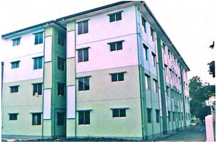
တန်ဖိုးနည်းယူနေအိမ်ရာများ အပိုင်း(၁) တည်ဆောက်ပြီးစီးတော့မည်

Securities ကုမ္ပဏီအနေဖြင့် လုပ်ငန်း/ဝန်ဆောင်မှု စတင်ဆောင်ရွက်မှု ငါးလတာရှိပြီဖြစ်ပြီး စတော့ရှယ်ယာနှင့် ပတ်သက်သည့် ဆွေးနွေးပွဲများ၊ ဟောပြောပွဲများကိုလည်း ကျင်းပပေးလျက်ရှိသည်။ ရန်ကုန်စတော့အိတ်ချိန်းတွင် အများပိုင်ကုမ္ပဏီများက ရှယ်ယာများ စတင်ရောင်းချခြင်းကို ပြီးခဲ့သည့် မတ်လက စတင်ဆောင်ရွက်ခဲ့ခြင်းဖြစ်ပြီး Securities ကုမ္ပဏီများက ရှယ်ယာရောင်းချလိုသူနှင့် ဝယ်ယူလိုသူတို့အကြား ဝန်ဆောင်မှုပေးလျက်ရှိသည်ဟု သိရသည်။