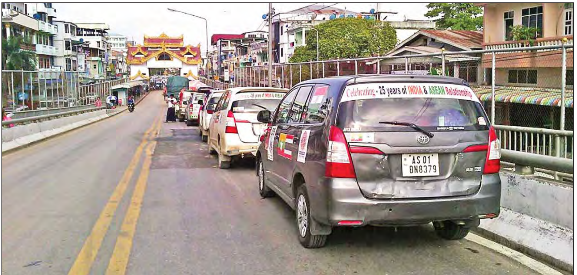
အိန္ဒိယ-မြန်မာ-ထိုင်း သုံးနိုင်ငံ ကုန်သွယ်မှုမြှင့်တင်ရေးနှင့် ချစ်ကြည်ရေးကားမောင်းခရီးစဉ်အဖြစ် အိန္ဒိယနိုင်ငံသား ၃၁ ဦးတို့ မော်တော်ယာဉ်ကိုးစီးဖြင့် ဇွန် ၃ ရက်က ထိုင်းနိုင်ငံမှတစ်ဆင့် မြဝတီမြို့သို့ ရောက်ရှိလာစဉ်။ သတင်း စာမျက်နှာ - ၃