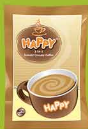
ခရင်(မ်)မိကော်ဖီ