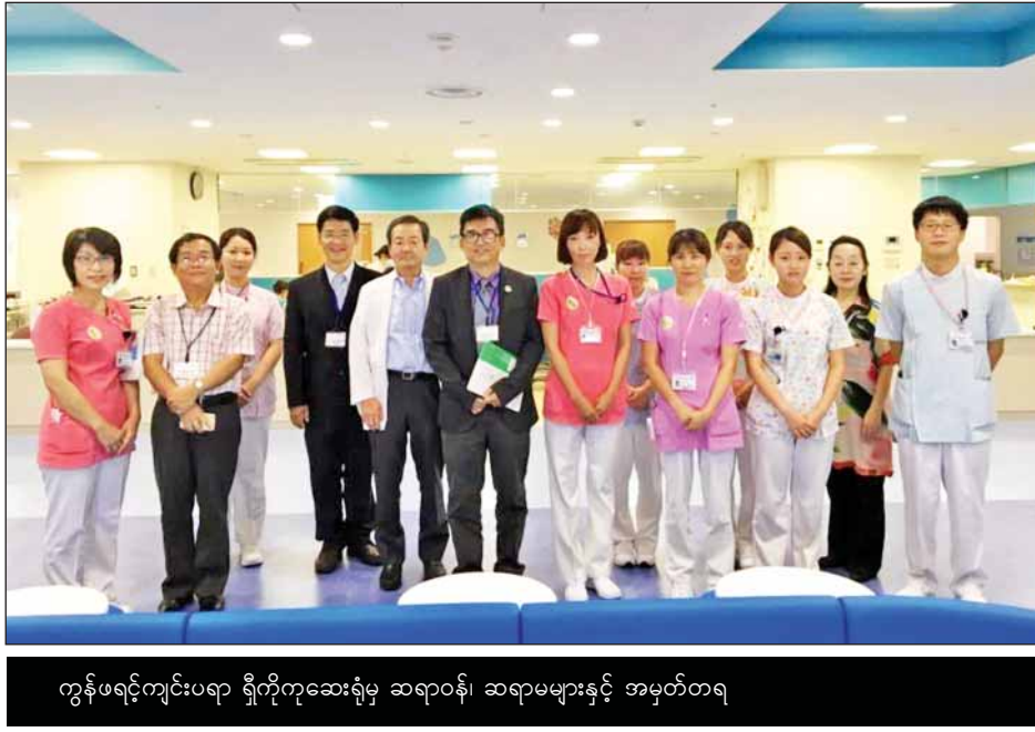
ကွန်ဖရင့်ကျင်းပရာ ရှိကုန်ဆေးရုံမှ ဆရာဝန်၊ ဆရာမများနှင့် အမှတ်တရ

ဂျပန်တို့ကို အတုခိုးရဦးမှာ အမှန်။ ဂျပန်နှင့် တူရမှာတော့ မဟုတ်။ မြန်မာနှင့်ပဲ တူနေရမှာ ဖြစ်ပါသည်။