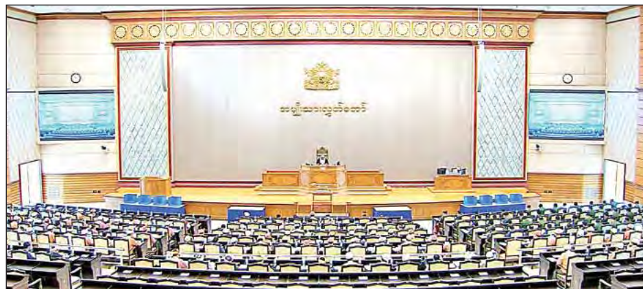
တတိယအကြိမ် အမျိုးသားလွှတ်တော် ပထမပုံမှန်အစည်းအဝေး (၃၆)ရက်မြောက်နေ့ ကျင်းပစဉ်။ (သတင်းစဉ်)

ထို့နောက် အမျိုးသားလွှတ်တော်ဥက္ကဋ္ဌက ဥပဒေ