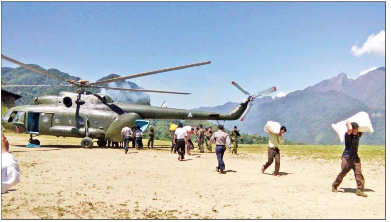
ခေါင်လန်ဖူးဒေသရှိ ဒေသခံပြည်သူများ လတ်တလောစားသောက်ရေးအဆင်ပြေစေရေးအတွက် စားနပ်ရိက္ခာနှင့် လူသုံးကုန်ပစ္စည်းများကို တပ်မတော်မှ ရဟတ်ယာဉ်ဖြင့် ဇွန် ၃ ရက်က ပို့ဆောင်ပေးစဉ်။ (မြဝတီ)

ရာသီဥတုဆိုးရွားသည့်ကြားမှ ခေါင်လန်ဖူးဒေသသို့ တပ်မတော်ရဟတ်ယာဉ်ဖြင့် ရိက္ခာများပို့ဆောင်