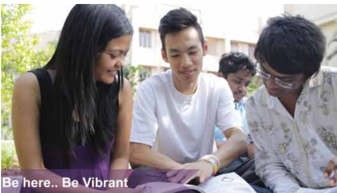
Be here.. Be Vibrant