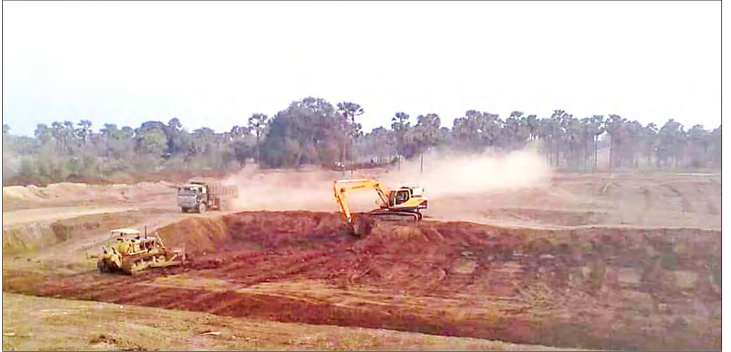
မန်ကျီးရွှေဂူဆည်ကို မြေတူးမြေကော်စက်ကြီးများ၊ မြေသယ်ယာဉ်များဖြင့် ပြန်လည်ပြုပြင်ခဲ့စဉ်။

ဒေသခံလူထုအနေဖြင့် ပြန်လည်ပြုပြင်ရန် အားမတန်၍ မာန်လျှော့ထားခဲ့ရသော်လည်း တစ်ချိန်ချိန်တွင် ရေပြည့်လှုံ့သည့် မန်ကျီးရွှေဂူဆည်ကြီးကို အိမ်မက်ဖြင့် မျှော်လင့်နေခဲ့ကြသည်။ ခေတ်အဆက်ဆက် စာမျက်နှာ ၉ ကော်လံ ၁ သို့ *