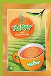
လက်ဖက်ရည်