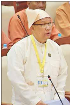
ပို့ဆောင်ရေးနှင့် ဆက်သွယ်ရေး ဝန်ကြီးဌာန ပြည်ထောင်စုဝန်ကြီး ဦးသန့်စင်မောင်

ပေးချေထားပြီးဖြစ်ပါကြောင်း၊ ရထားလမ်းဖောက်လုပ်ရာတွင် ပါဝင်သွားသော သိမ်းဆည်းမြေများ လျော်ကြေးပေးချေနိုင်ရန်အတွက် တောင်သူစာရင်း တိကျစေရေးနှင့် သိမ်းဆည်းမြေများကို တိုင်းတာခြင်း၊ မြေလျော်ကြေးတန်ဖိုးကို ကာလပေါက်စွေးတွက်ချက်အတည်ပြုခြင်း၊ မြေယာလျော်ကြေးတန်ဖိုးစာရင်း