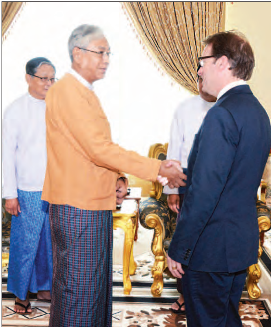
နိုင်ငံတော်သမ္မတ ဦးထင်ကျော် အမေရိကန်ကွန်ဂရက် အောက်လွှတ်တော်၏ ဒီမိုကရေစီမိတ်ဖက်အဖွဲ့ဥက္ကဋ္ဌ မစ္စတာ ပီတာရော့စ်ကမ်နှင့် တွေ့ဆုံနှုတ်ဆက်စဉ်။ (သတင်းစဉ်)

နေပြည်တော် မေ ၃၁ ပြည်ထောင်စုသမ္မတမြန်မာနိုင်ငံတော် နိုင်ငံတော်သမ္မတ ဦးထင်ကျော်သည် အမေရိကန်ကွန်ဂရက် အောက်လွှတ်တော်၏ ဒီမိုကရေစီမိတ်ဖက်အဖွဲ့ ဥက္ကဋ္ဌ မစ္စတာ ပီတာရော့စ်ကမ် ဦးဆောင်သည့် လွှတ်တော် ကိုယ်စားလှယ်အဖွဲ့အား ယနေ့နံနက် ၁၁ နာရီတွင် နေပြည်တော်ရှိ နိုင်ငံတော်သမ္မတ အိမ်တော် ဧည့်ခန်းမ၌ လက်ခံတွေ့ဆုံသည်။ တွေ့ဆုံစဉ် မစ္စတာပီတာရော့စ် ကမ်က မြန်မာနိုင်ငံ အစိုးရအဖွဲ့သစ် အပေါ် ဆန္ဒမဲပေးခဲ့ကြသည့် ပြည်သူများအနေဖြင့် မျှော်လင့်ချက်များစွာ ထားရှိသည်ကို နားလည်ပါကြောင်း၊ အစိုးရအဖွဲ့သစ်အနေဖြင့် ပြည်သူများ အကျိုးရှိမည့်ကိစ္စရပ်များကို ဆောင်ရွက်ရာ၌ အချိန်ယူဆောင်ရွက်ရမည်ကို ပြည်သူများ နားလည်သဘောပေါက်မည်ဟု မိမိအနေဖြင့် ယုံကြည်ပါကြောင်း၊ လွတ်လပ်ခြင်း၊ တည်ငြိမ်အေးချမ်းခြင်းနှင့် လုံခြုံရေးတို့ကိုလည်း ချိန်ညှိဆောင်ရွက်သွားရန် လိုအပ်ပါကြောင်း ဆွေးနွေးပြောကြားခဲ့သည့် အပြင် လွှတ်တော်နှင့် အစိုးရအဖွဲ့တို့ အကြား ထိတွေ့ဆက်ဆံမှု အရပ်ဘက် လူမှုအဖွဲ့အစည်းများ၏ အခန်းကဏ္ဍတို့အပေါ် အမြင်ချင်းဖလှယ်ခဲ့သည်။ နိုင်ငံတော်သမ္မတက မိမိတို့အစိုးရ သစ်အပေါ် ပြည်သူလူထု၏ မျှော်လင့်ချက်ကြီးမားသည်ကို အထူးနားလည်သဘောပေါက်ပါကြောင်း၊ မိမိတို့အစိုးရအဖွဲ့အနေဖြင့် စိန်ခေါ်မှု စာမျက်နှာ ၃ ကော်လံ ၅ သို့ ☆