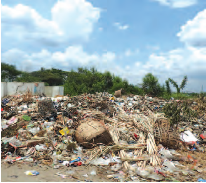
လှိုင်သာယာ ၈၈ ၃၁

ရန်ကုန်တိုင်းဒေသကြီး လှိုင်သာယာမြို့နယ် သို့ ဆက်သွယ်ထားသည့် ဘုရင့်နောင် တံတားနှင့် အောင်ဇေယျ တံတားအကြား ဆိပ်ကမ်းသာလမ်းမကြီးပေါ်တွင် စည်းကမ်းမဲ့ အမှိုက်စွန့်ပစ်မှုများရှိနေသောကြောင့် ပတ်ဝန်းကျင်တွင်နေထိုင်ကြသူများ အတွက် ရေရှည်တွင် လေထုညစ်ညမ်းကာ ကျန်းမာရေးကို ထိခိုက်လာနိုင်၍ ရှင်းလင်းရန် လိုအပ်နေကြောင်း အဆိုပါလမ်းမကြီးအနီး နေထိုင်သူများက ပြောသည်။ “ခွေးသေကောင် ပုပ်တွေလည်းပါတယ်။ အမှိုက်တွေက အစိုဖြစ်တာကြောင့် အနံ့မခံနိုင်ဘူး။ ဒီအမှိုက်တွေရှိနေတာကို စည်ပင်သာယာကသိစေချင်တယ်။ ကျွန်တော်တို့ အနေနဲ့က ရေရှည်သိမ်းဆည်းဖို့ ဆိုတာမဖြစ်နိုင်ဘူးလေ။ ကျွန်တော်တို့အနေနဲ့ ဒီလို လမ်းမကြီးမှာ အမှိုက်တွေညစ်ပတ်နေတာအမြန်ဆုံး လာရောက်သိမ်းဆည်းပေးစေချင်ပါတယ်” ဟု ဒေသခံတစ်ဦးက ပြောသည်။ ယင်းဆိပ်ကမ်းသာ လမ်းမကြီးတစ်