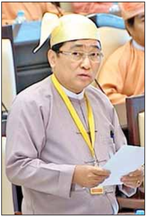
ပြည်ထောင်စုဝန်ကြီး ဒေါက်တာဝင်းမြတ်အေး

နေပြည်တော် မေ ၃၀ ပလမ်းမြို့ မြို့ပြဖွံ့ဖြိုးရေးစီမံကိန်းသို့ ပြောင်းရွှေ့လိုသူများအား လူမှုအဆောက်အအုံနှင့် Proposed Location for Sport Complex နှင့် အထက်တန်းကျောင်း ဆောက်ရန် လျာထားသည့်နေရာတွင် ကျူးကျော်ပြောင်းရွှေ့ခွင့်မပြုဘဲ လူနေရန် လျာထားသည့် နေရာများတွင်သာ ပြောင်းရွှေ့ခွင့်ပြုရန် အစီအစဉ် ရှိ၊ မရှိနှင့် အစိုးရသက်တမ်းကုန်ဆုံးမည့် အချိန်တွင် မြို့ပြစီမံကိန်း မည်သည့် အဆင့်ရောက်ရှိနေသည်ကို သိရှိလိုကြောင်း ချင်းပြည်နယ် မဲဆန္ဒနယ် အမှတ်(၄)မှ ဦးဇန်လှယ်ထန်းက ယနေ့ကျင်းပသည့် အမျိုးသားလွှတ်တော်အစည်းအဝေးတွင် မေးမြန်းသည်။