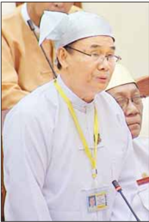
ပြည်ထောင်စုဝန်ကြီး ဦးအုန်းဝင်း

ကချင်ပြည်နယ် မံစီမဲဆန္ဒနယ်မှ ဦးချင်းဖေလင်း၏ ကချင်ပြည်နယ် မံစီမြို့နယ်တွင် ကြီးပိုင်းတော၊ ကြီးပြင်ကာကွယ်တောတွင်း ကျရောက်လျက်ရှိသော ကျေးရွာများ၊ ကျေးရွာမြေများအား သစ်တောဧရိယာမှ ပယ်ဖျက်ပေးရန်