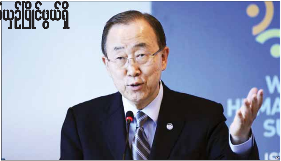
များအပါအဝင် ဝါရင့်နိုင်ငံရေးသမားများနှင့် တွေ့ဆုံခဲ့သည်ဟု ဆိုသည်။ အင်န်အိတ်ချီကော။

တောင်ကိုရီးယားနိုင်ငံ၏ အစိုးရပါတီက လာမည့်နှစ် ဒီဇင်ဘာလတွင် ကျင်းပမည့်ရွေးကောက်ပွဲတွင် ဘန်ကီမွန်း သမ္မတလောင်းအဖြစ် ဝင်ရောက်အရွေးချယ်ခံ ယှဉ်ပြိုင်မည်ဟူသော ကောလာဟလများကို ပျံ့နှံ့စေလိုသည်။ သို့သော်လည်း ဘန်ကီမွန်းကိုယ်တိုင်က ၎င်း၏ ရည်ရွယ်ချက်ကို ပြတ်ပြတ်သားသားချမှတ်နိုင်ခြင်း မရှိသေးသကဲ့သို့ ၎င်း၏ ကုလသမဂ္ဂအတွင်းရေးမှူးချုပ် ရာထူးသက်တမ်း တာဝန်မှာလည်း ယခုနှစ်ကုန်တွင်မှ ပြီးဆုံးမည်ဖြစ်သည်။ ကုလသမဂ္ဂအတွင်းရေးမှူးချုပ်တာဝန်များ ဒီဇင်ဘာလကုန်တွင်ပြီးဆုံးသည့်အခါ တောင်ကိုရီးယားနိုင်ငံ သားတစ်ဦးအနေဖြင့် ၎င်း၏အနာဂတ်ကို စဉ်းစားဆုံးဖြတ်သွားမည်ဟု ဘန်ကီမွန်းက တောင်ကိုရီးယားမီဒီယာများကို ပြောကြားသည်။ ဘန်ကီမွန်းသည် တောင်ကိုရီးယားသို့ ပြန်လည်ရောက်ရှိနေစဉ်ကာလအတွင်း ဝန်ကြီးချုပ်ဟောင်း