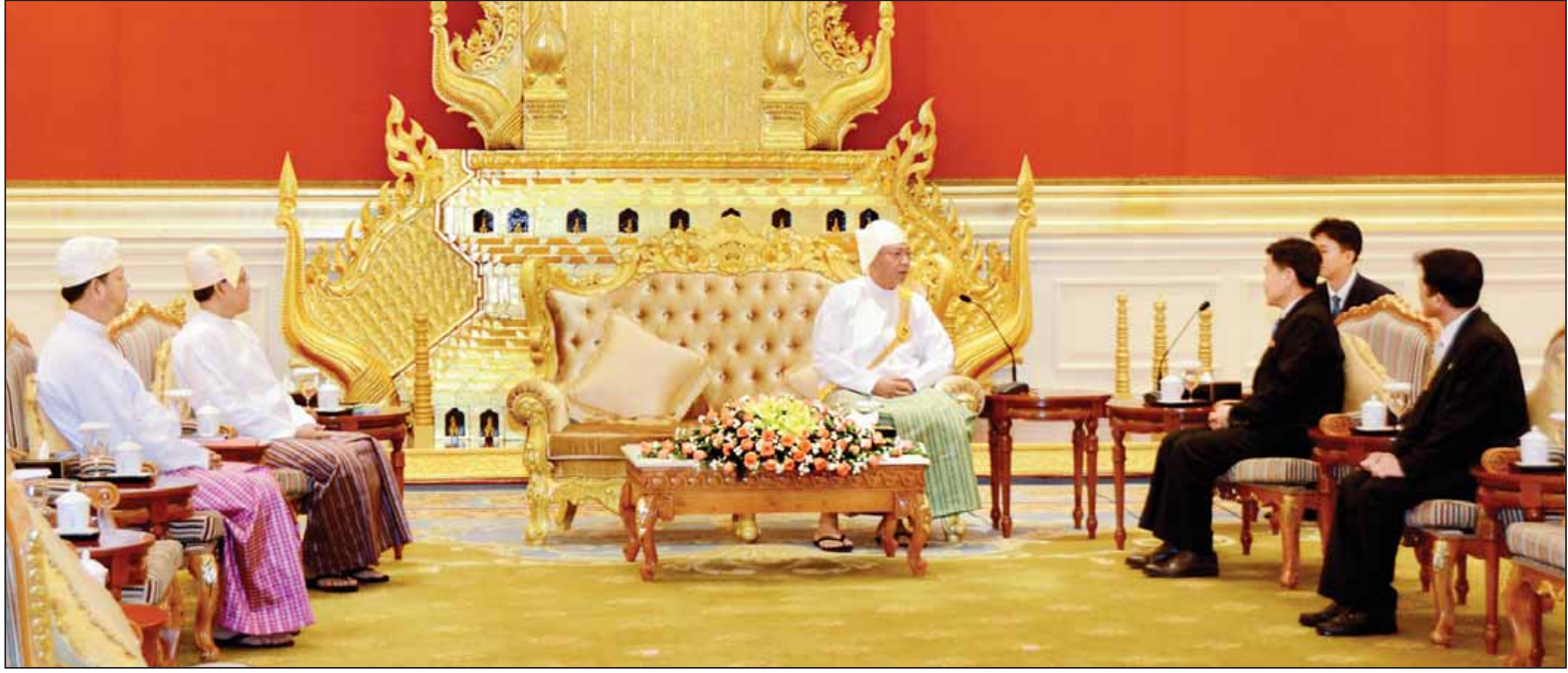
နိုင်ငံတော်သမ္မတ ဦးထင်ကျော် ကိုရီးယားဒီမိုကရက်တစ် ပြည်သူ့သမ္မတနိုင်ငံ သံအမတ်ကြီး မစ္စတာဂျူဟိုဘွန်အား လက်ခံတွေ့ဆုံစဉ်။ (သတင်းစဉ်)

နေပြည်တော် မေ ၃၀ ပြည်ထောင်စုသမ္မတမြန်မာနိုင်ငံတော် နိုင်ငံတော်သမ္မတ ဦးထင်ကျော်ထံ မြန်မာနိုင်ငံဆိုင်ရာ ဖိဂျီသမ္မတနိုင်ငံ သံအမတ်ကြီးအဖြစ် ခန့်အပ်ရန် သဘောတူညီပြီးဖြစ်သော သံအမတ်ကြီး မစ္စတာဖီလီမုန်းကူးသည် ယနေ့ နံနက် ၁၀ နာရီတွင် လည်းကောင်း၊ ကိုရီးယားဒီမိုကရက်တစ် ပြည်သူ့ သမ္မတနိုင်ငံ သံအမတ်ကြီးအဖြစ် ခန့်အပ်ရန်သဘောတူညီပြီးဖြစ်သော သံအမတ်ကြီး မစ္စတာ ဂျူဟိုဘွန်သည် ယနေ့နံနက် ၁၀ နာရီတွင်လည်း ကောင်း နေပြည်တော်ရှိ သမ္မတ အိမ်တော်၌ သံအမတ်ခန့်အပ်လွှာ များ ပေးအပ်ကြသည်။ သံအမတ်ခန့်အပ်လွှာပေးအပ်ပွဲ များသို့ နိုင်ငံခြားရေးဝန်ကြီးဌာန ဒုတိယဝန်ကြီး ဦးကျော်တင်နှင့် သံတမန်ရေးရာဦးစီးဌာန ညွှန်ကြား ရေးမှူးချုပ် ဦးကိုနိုင်တို့ တက်ရောက်ကြသည်။ (သတင်းစဉ်)