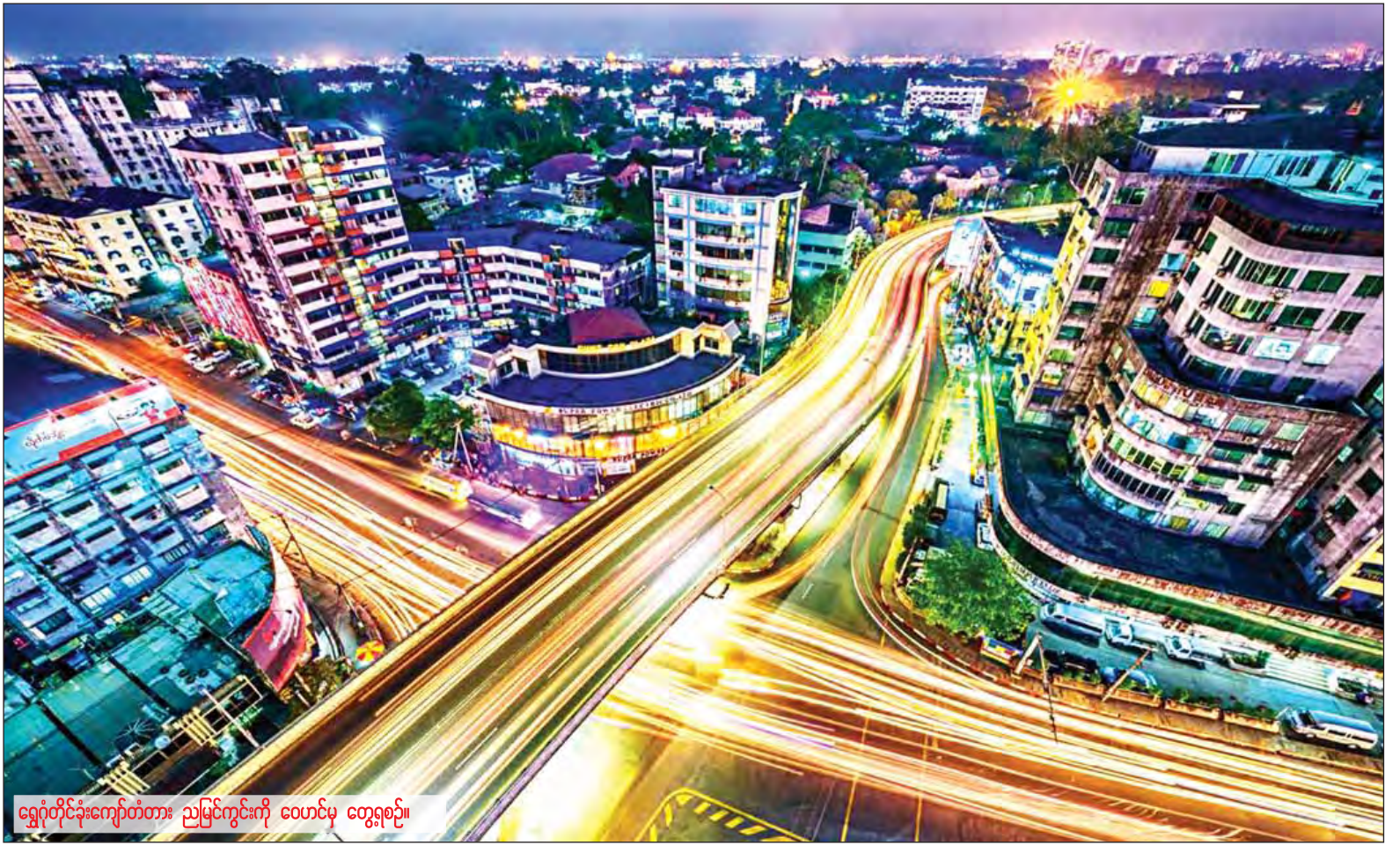
ရွှေဂုံတိုင်ခုံးကျော်တံတား ညပြင်ကွင်းကို ဝေဟင်မှ တွေ့ရစဉ်။