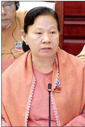
ဒေသစီမံအဖွဲ့ဝင် ဒီရေတောများဖွဲ့စည်းပေးရန်အတွက် ပြည်သူ့လွှတ်တော်အစည်းအဝေးတွင် တင်သွင်းခဲ့ခြင်းဖြစ်ပြီး ကမ်းရိုးတန်းဒေသများ၊ ပင်လယ်ကမ်းခြေဒေသများရှိ ပြည်သူများ၏ သဘာဝဘေးအန္တရာယ်လုံခြုံရေးနှင့် ဂေဟစနစ်များ မပျက်သုဉ်းစေရေးအတွက် ဒီရေတောများဖွဲ့စည်းသင့်ကြောင်းကို ထောက်ပြထားသည်။

အစီအစဉ်ရှိ မရှိနှင့် လူဦးရေတိုးတက်လာသည်နှင့်အမျှ လူနေအိမ်များ တိုးချဲ့လုပ်ဆောင်နိုင်ရန်နှင့် စိုက်ပျိုးမြေများ တိုးချဲ့လုပ်ကိုင်နိုင်ရန်အတွက် ကြီးပြင်ကာကွယ်တောဧရိယာများလျော့ချပေးရန် အစီအစဉ်ရှိ မရှိနှင့် ရှိမည်ဆိုပါက မည်သည့်အချိန်တွင် ဆောင်ရွက်ပေးမည်၊ မရှိပါက အဘယ်ကြောင့်မရှိသည်တို့ကို သိလိုကြောင်း မေးခွန်းနှင့်စပ်လျဉ်း၍ သယံဇာတနှင့် သဘာဝပတ်ဝန်းကျင် ထိန်းသိမ်းရေးဝန်ကြီးဌာန ပြည်ထောင်စုဝန်ကြီး ဦးအုန်းဝင်းက ကချင်ပြည်နယ် ဗန်းမော်ခရိုင် မံစီမြို့နယ်တွင် သစ်တောကြီးပိုင်း ၁၁ ခု(ဧရိယာ တစ်သိန်းကျော်) ကြီးပြင်ကာကွယ်တော ကိုးခု (ဧရိယာ သုံးသိန်းကျော်) စုစုပေါင်း သစ်တောမြေ လေးသိန်းငါးသောင်းကျော်ရှိပြီး နယ်မြေလုံခြုံရေးကော်မရှင်မှန်မရှိသဖြင့် ၂၀၁၃ ခုနှစ် ဖေဖော်ဝါရီနှင့် မတ်လများတွင် သစ်တောမြေအတွင်း ကျူးကျော်မှုစာရင်း