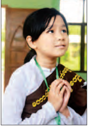
မမြကြာညိုသင်း