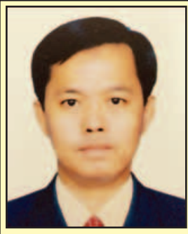
(တက္ကသိုလ် ဟန်စိုးဦး)

၂၀ ရာစု ပင်လယ်ရေကြောင်း ပိုးလမ်းမဟု လူသိများပြီး နိုင်ငံပေါင်းစုံကျယ်ကျယ်ပြန့်ပြန့်ပါဝင်သော စီးပွားရေးလမ်းကြောင်းတစ်ခုကို တရုတ်ပြည်သူ့သမ္မတနိုင်ငံသမ္မတ ရှီကျင့်ဖျင်က စတင်အဆိုပြုခဲ့ပြီး တောင်တရုတ်ပင်လယ်၊ တောင်ပစိဖိတ်သမုဒ္ဒရာ၊ အိန္ဒိယသမုဒ္ဒရာများနှင့် တစ်ဆက်တစ်စပ်တည်းရှိနေသည့် အရှေ့တောင်အာရှဒေသနိုင်ငံများ၊ ပင်လယ်သမုဒ္ဒရာကျွန်းနိုင်ငံများ၊ အရှေ့အာဖရိကနိုင်ငံများ၊ မြေထဲပင်လယ် မြောက်ပိုင်းနိုင်ငံများအကြား ပူးပေါင်းဆောင်ရွက်မှုများ ပြုလုပ်သွားမည့် အစီအစဉ်ဖြစ်ပါသည်။ အဆိုပါ ပိုးလမ်းမကြီးအကြောင်းကို စာရေးဆရာ တက္ကသိုလ်ဟန်စိုးဦးက ရုပ်ဝန်းတစ်ခု လမ်းကြောင်းတစ်ခုအမည်ဖြင့် ရေးသားထားသည်များကို ကြေးမုံစာဖတ်ပရိသတ်များအတွက် အခန်းဆက်ဆောင်းပါးများအဖြစ် ဖော်ပြလိုက်ပါသည်။ (စာတည်း)