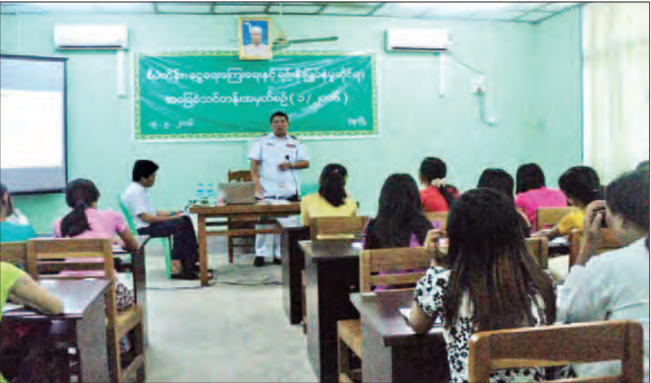
ရောက်ရောက် အကျိုးပြုလာနိုင်မည်ဖြစ်ပြီး သင်တန်းကို သင်တန်းသား ၃၈ ဦး တက်ရောက်သင်ကြားလျက်ရှိကြောင်း မေ ၂၉ ရက်မှ ၅ နေ့ ၁၅ ရက်အထိ ဖွင့်လှစ်သင်ကြားလျက်ရှိရာ ဝန်ထမ်းသင်တန်းသား ၁၀ ဦးနှင့် ပြင်ပ (ဖိုးချမ်း-မုံရွာ)

အဆိုပါ သင်တန်း ဖွင့်လှစ်ခြင်းဖြင့် လူမှုစီးပွား ဖွံ့ဖြိုးတိုးတက်မှုအတွက် ဒေသန္တရစီမံကိန်းနှင့် အမျိုးသားစီမံကိန်းရေးဆွဲရာတွင် စီမံကိန်းရေးဆွဲခြင်း၏ သဘောသဘာဝ၊ ငွေကြေးနှင့် ဘဏ်လုပ်ငန်း၊ ရင်းနှီးမြှုပ်နှံမှုဆိုင်ရာ ဗဟုသုတများ၊ အခွန်၏သဘောတရားများကို လူငယ်လူရွယ်များက သိရှိနားလည်ပြီး နိုင်ငံတော်တည်ဆောက်ရေးကို တစ်ဖက်တစ်လမ်းမှ ထိထိ