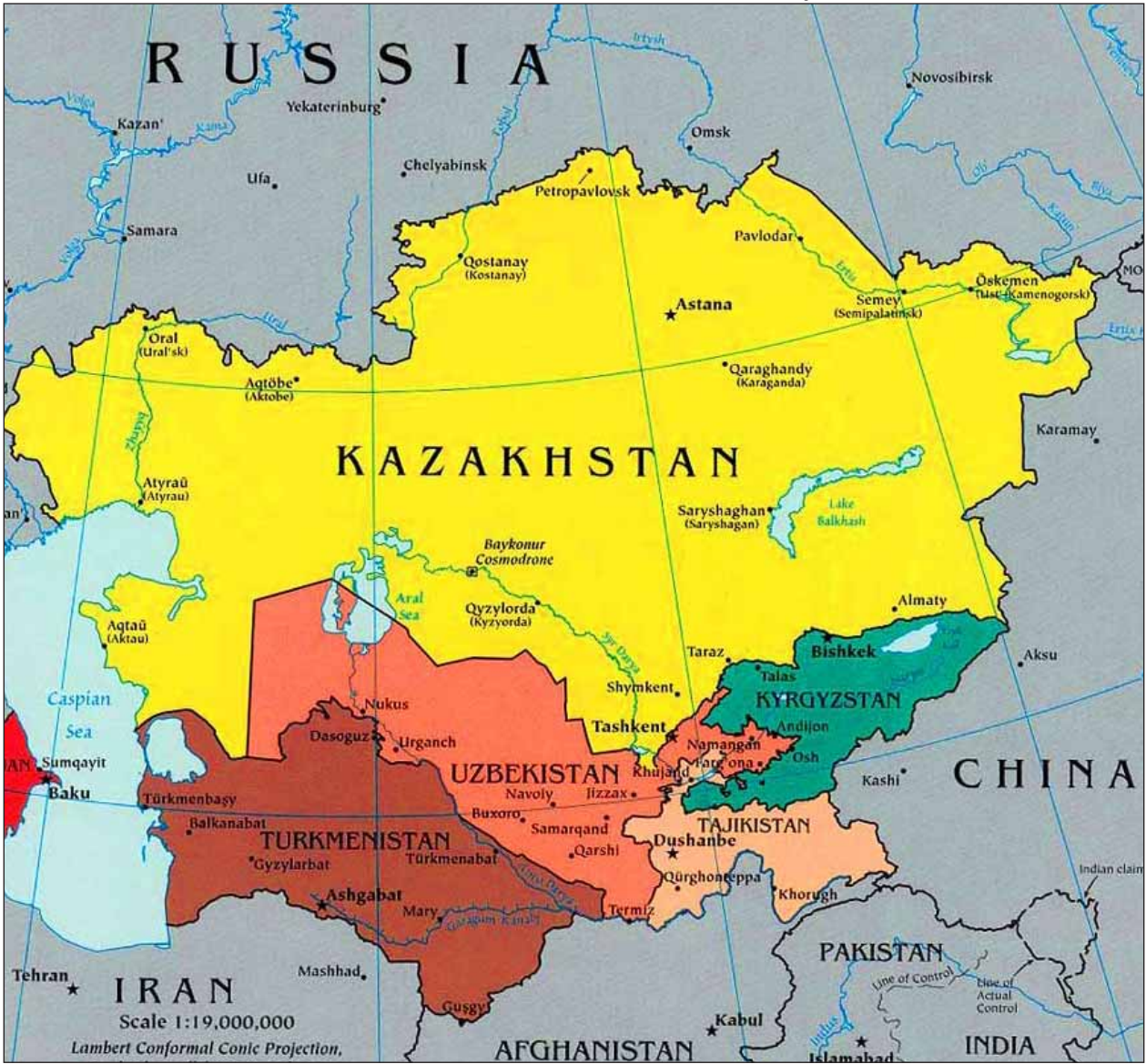
(အာရှအလယ်ပိုင်းနိုင်ငံများ၏ မြေပုံ)

တရုတ်နိုင်ငံဟာ အာရှအလယ်ပိုင်းဒေသအတွင်းမှာ ဒေါ်လာဘီလီယံပေါင်းများစွာ ရင်းနှီးမြှုပ်နှံမှုတွေပြုလုပ်ခဲ့သလို ဒေသတွင်းမှာရှိတဲ့ နိုင်ငံအများစုရဲ့ အကြီးဆုံးကုန်သွယ်ဖက်နိုင်ငံ ဖြစ်လာခဲ့ပေမယ့် ဒေသတွင်းမှာ ရုရှားနိုင်ငံဟာ စီးပွားရေးအရ လွှမ်းမိုးမှုအရှိဆုံးနိုင်ငံအဖြစ် ဆက်လက်ရှိနေဆဲဖြစ်ပါတယ်။ တရုတ်နိုင်ငံဟာ အာရှအလယ်ပိုင်းနိုင်ငံများနဲ့ စွမ်းအင်ကဏ္ဍမှာ နီးကပ်စွာ ဆက်ဆံမှုရှိတဲ့အတွက် သူပြည်ပကနေတင်သွင်းနေရတဲ့ သဘာဝဓာတ်ငွေ့ စုစုပေါင်းရဲ့ ၄၀ ရာခိုင်နှုန်းကို တရုတ်-အာရှအလယ်ပိုင်းသဘာဝဓာတ်ငွေ့ ပိုက်လိုင်းစီမံကိန်းများကနေတစ်ဆင့် တင်သွင်းနိုင်ခဲ့ပါတယ်။ ၂၀၀၉ ခုနှစ်မှာ အဲဒီပိုက်လိုင်းစီမံကိန်းတွေ စတင်အသက်ဝင်လာပြီးတဲ့နောက်မှာ အာရှအလယ်ပိုင်းဒေသနိုင်ငံတွေကနေ ရုရှားနိုင်ငံကို တင်ပို့နေတဲ့ သဘာဝဓာတ်ငွေ့