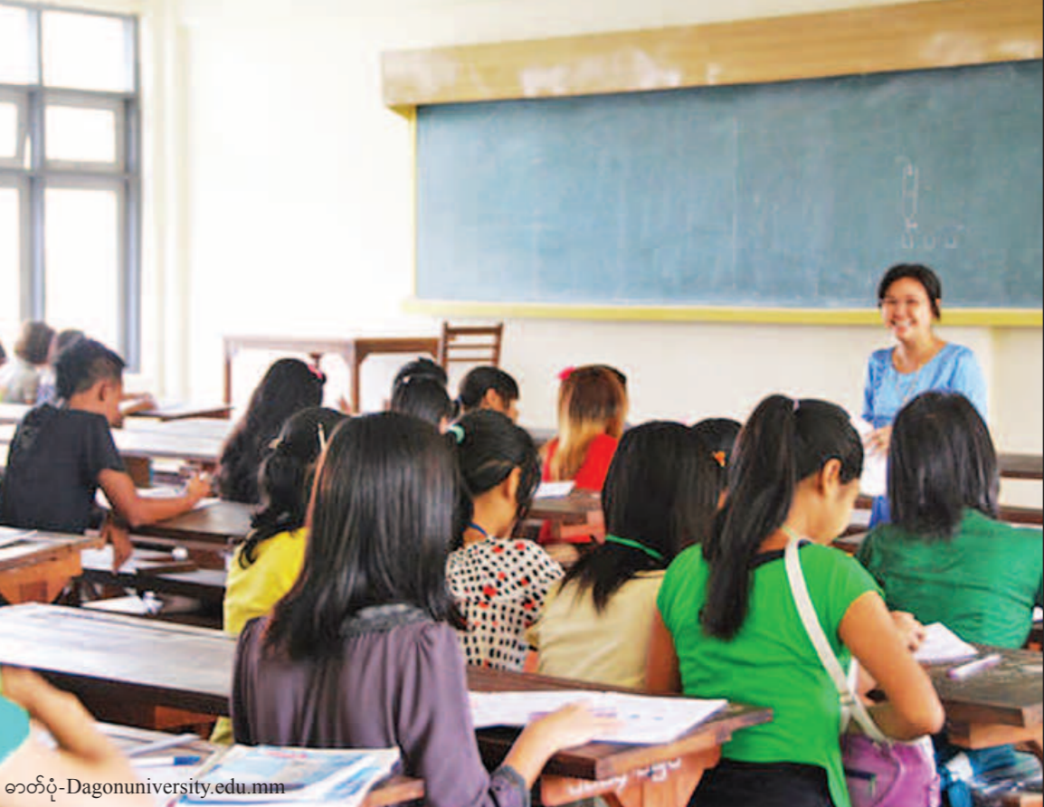
ဓာတ်ပုံ - Dagonuniversity.edu.mm

ဟု ဆရာ ဆရာမများ၏ အရည်အသွေးစစ်ဆေး မှုများပြုလုပ်မည့်အစီအစဉ်ကို ပြည်ထောင်စု ဝန်ကြီးက ပြောကြားသည်။ ထို့ပြင် အဆင့်မြင့်ပညာတွင်လည်း ပညာရေးဝန်ကြီးဌာန၏ Assessment ဆောင်ရွက်မှုအပြင် ပါမောက္ခချုပ်၊ ပါမောက္ခ အဖွဲ့များဖြင့် စစ်ဆေးပေးမည်ဖြစ်ကြောင်း သိရသည်။ အကြောင်းအမျိုးမျိုးကြောင့် အခြေခံ ပညာရေးအဆင့်အသီးသီးကို ဆုံးခန်းတိုင် ပြီးမြောက်စေရန်နှင့် ကျောင်းပြင်ပမှ ပညာ သင်ကြားလိုသူများ ဆက်လက်ပညာသင်ကြား