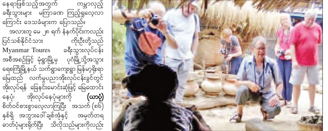
မြို့အိုးများကို ပြုလုပ်ကြပြီး လွန်ခဲ့သောနှစ် ၁၀၀ ကျော်တတည်းက မြန်မာ့ရိုးရာမြေထည် လက်မှုပညာ ထွန်းကားခဲ့ကြောင်း ဒေသခံများ ထံမှ သိရသည်။

မေးမြန်း၍ လက်ဆောင်ပစ္စည်းများကိုလည်း ပေးကြသည်။ အဆိုပါ သက်ရွာကျေးရွာမှ သောက်ရေအိုးအမျိုးမျိုး၊ ပန်းအိုးအမျိုးမျိုး၊ ဟင်းချက်အိုးအမျိုးမျိုး၊ အင်တုံအမျိုးမျိုးနှင့်