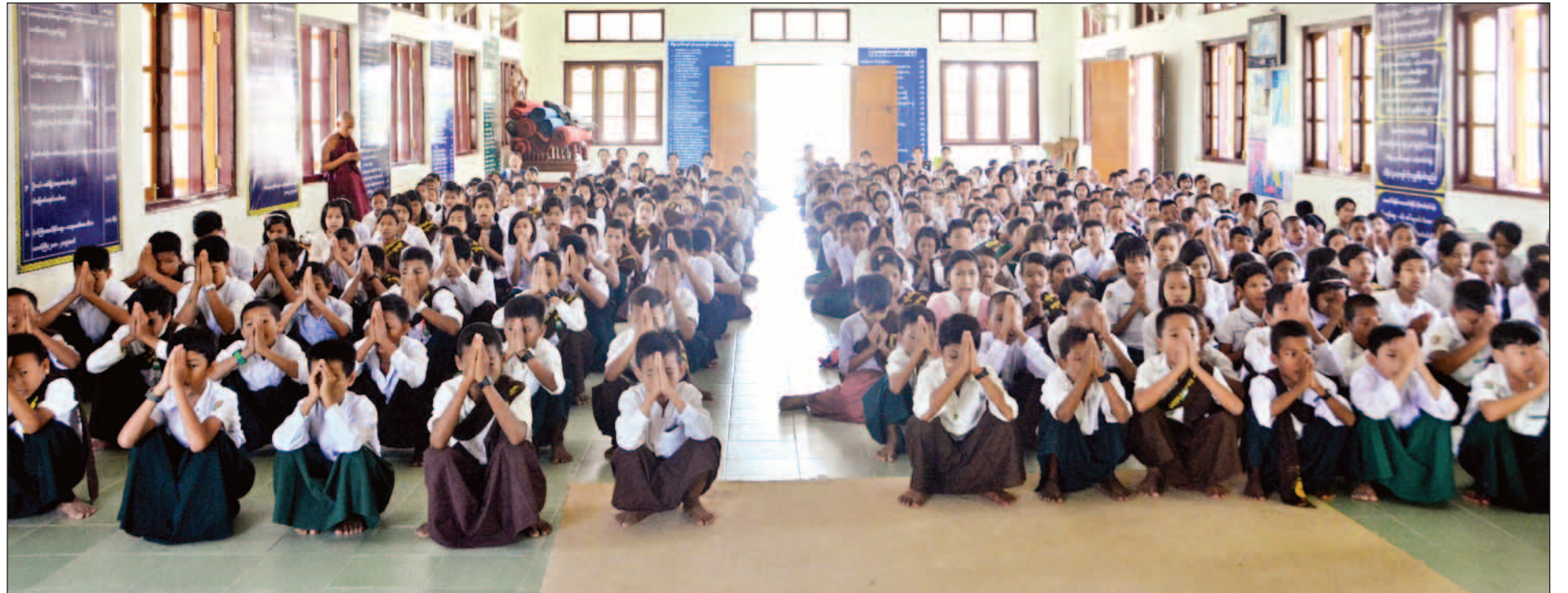
နေပြည်တော် ဇေယျာသီရိမြို့နယ် မဟာရတနာသိုက်ချောင်းတပ်ဦးကျောင်းရှိ ဓမ္မစကူးသင်တန်း၌ ကျောင်းသား ကျောင်းသူများအား တွေ့ရစဉ်။