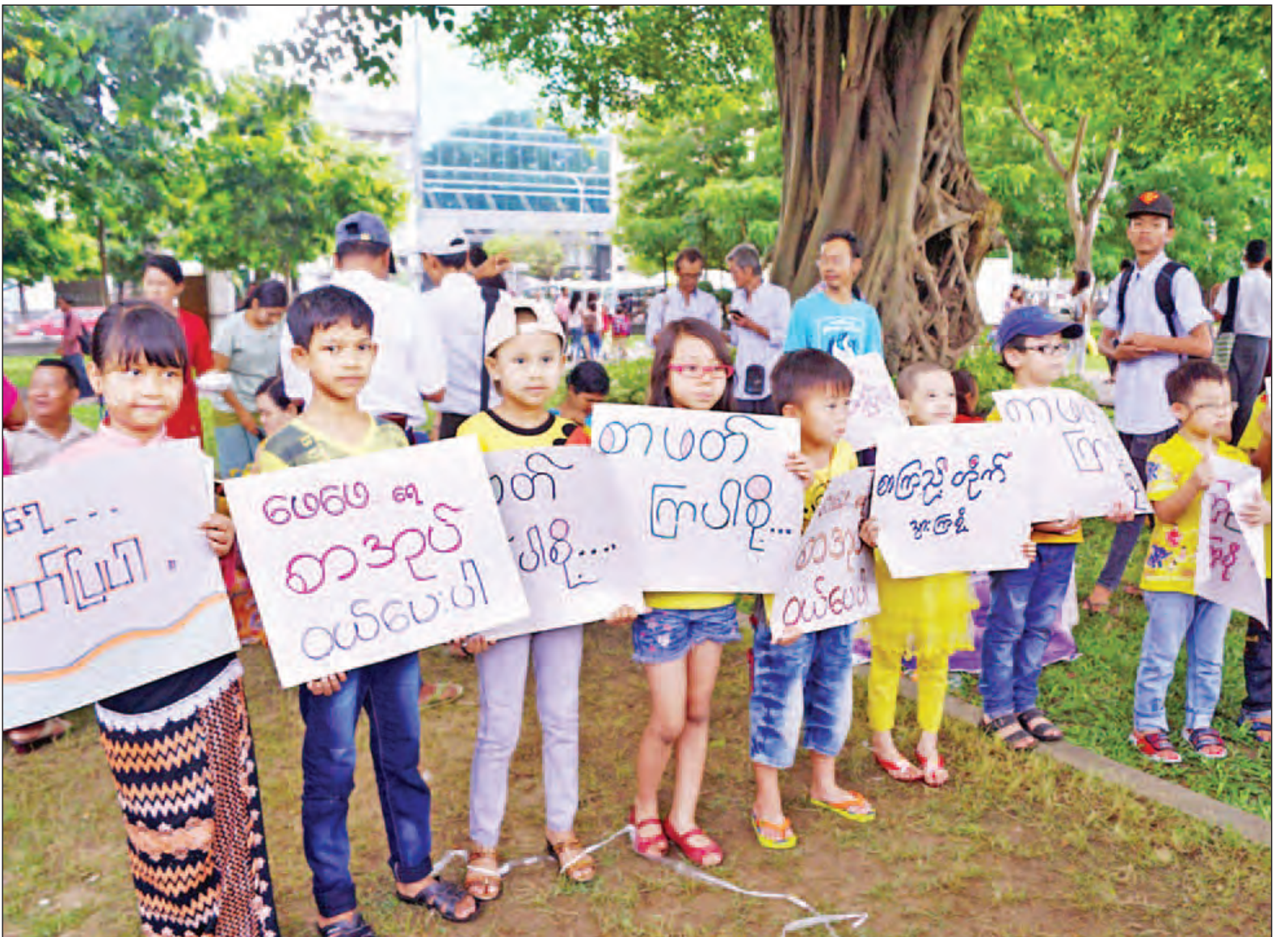
ရန်ကုန်မြို့ မဟာဗန္ဓုလပန်းခြံအတွင်း ကလေးငယ်များ၊ အသင်းအဖွဲ့များ၊ လူငယ်လူရွယ်များပါဝင်သော စာဖတ်ရရှိမှုမြှင့်တင်ရေး လှုပ်ရှားဆောင်ရွက်မှုမြင်ကွင်း။

အဆိုပါပွဲတွင် ပန်းခြံအတွင်း လာရောက်သော ကလေးသူငယ်များ၊ ရဟန်းသံဃာများ၊ လူကြီးလူငယ် မရွေး စာအုပ်များကို ဖတ်ရှုလေ့လာ နိုင်ရန်စီစဉ်ပေးခြင်း၊ သပြေကလေး လူငယ် စာကြည့်တိုက်နှင့် ပူးပေါင်း ပါဝင်သောအဖွဲ့များမှ ထုတ်ဝေသော စာအုပ်များကို ဈေးနှုန်းသက်သာစွာ ဖြင့် ရောင်းချပေးခြင်း၊ လက်ကမ်း စာမျက်နှာ ၃ ကော်လံ ၁ သို့ ၀