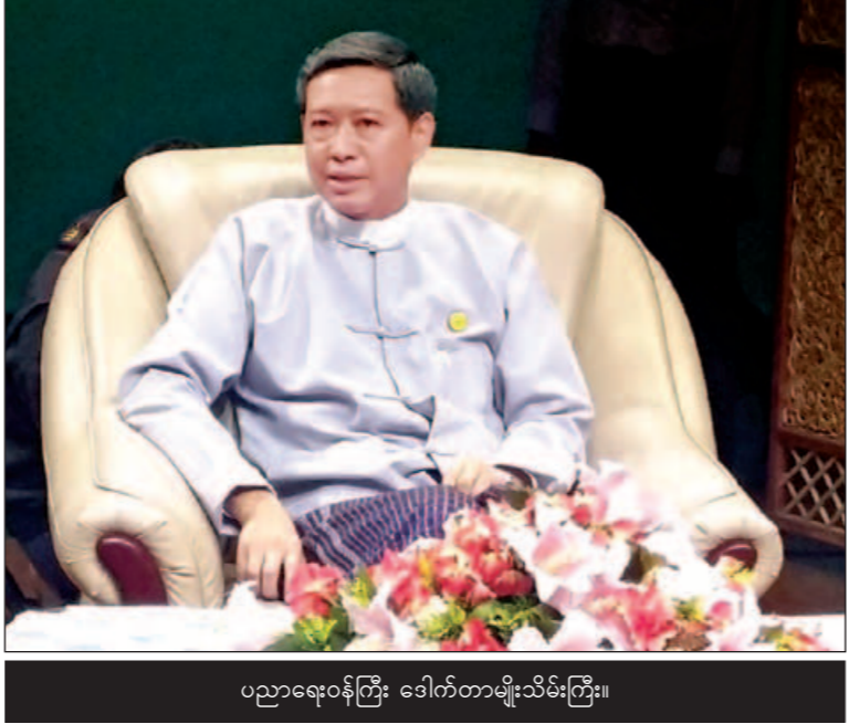
ပညာရေးဝန်ကြီး ဒေါက်တာမျိုးသိမ်းကြီး။

ထို့ပြင် အဆင့်မြင့်ပညာရေးလက်အောက် တက္ကသိုလ်များနှင့် TVET တို့ကို ကမ္ဘာနှင့် ရင်ပေါင်တန်းနီးနိုင်သည်အထိ အရည်အသွေး မြင့်တင်နိုင်ရန်အတွက် မူလတန်းပညာရေး သည် အခြေခံအုတ်မြစ်ဖြစ်ကြောင်း မူလ အုပ်တွေကို အခမဲ့ဖြန့်ဝေပေးသွားမှာဖြစ်ပါတယ်။ ဒါ့အပြင် ကျောင်းလခမီဆာဆရာအသင်း