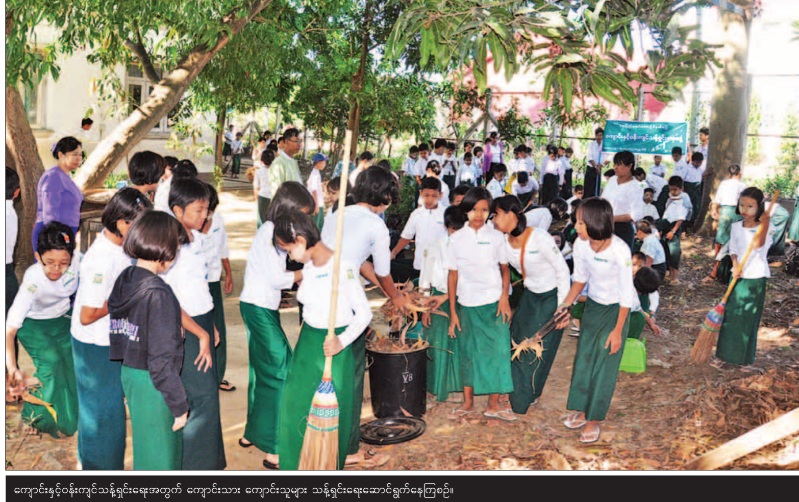
ကျောင်းနှင့်ဝန်းကျင်သန့်ရှင်းရေးအတွက် ကျောင်းသား ကျောင်းသူများ သန့်ရှင်းရေးဆောင်ရွက်နေကြစဉ်။