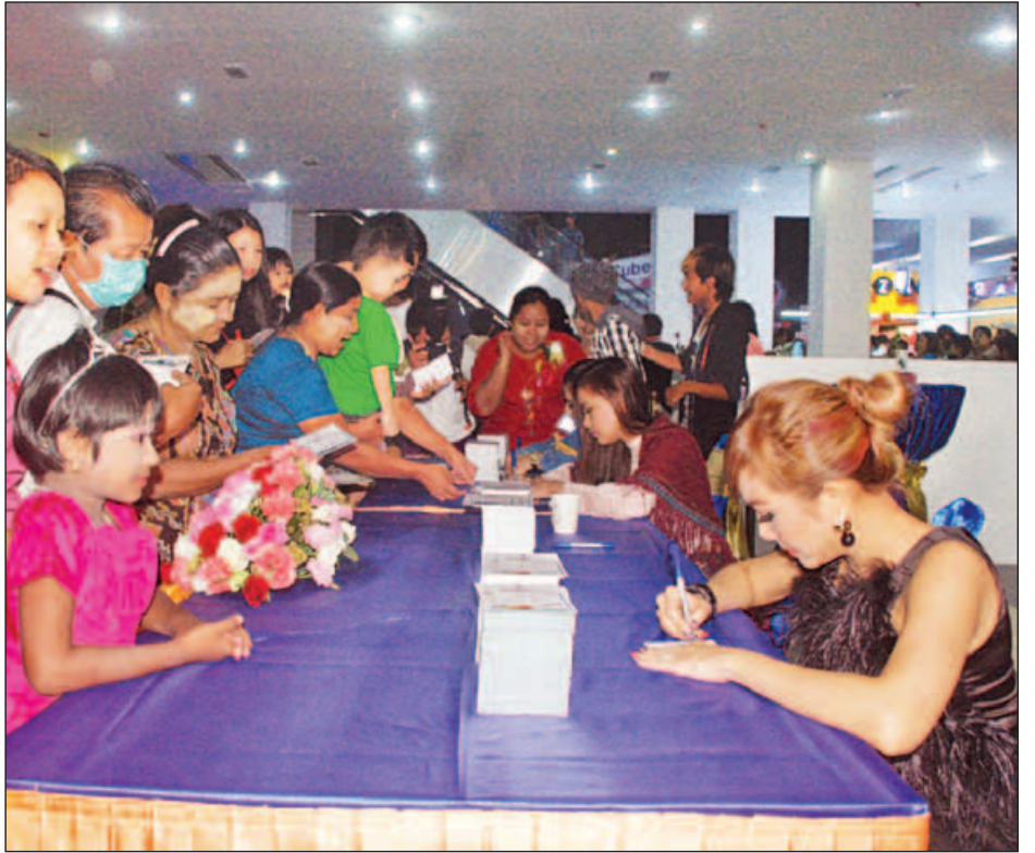
ကြည့်ရှုသည့် ပရိသတ်များအား နာမည်ကျော်အနုပညာရှင် များဖြစ်သည့် နေတိုး၊ ဝိုင်းစုခိုင်သိန်း၊ စန္ဒီမြင့်လွင်၊ အေးဝတ်ရည်သောင်းတို့က အမှတ်တရလက်မှတ်များ လာရောက် ရေးထိုးပေးခဲ့ကြသည်။

ကန်သာယာအဆင့်မြင့် ရုပ်ရှင်ရုံဖွင့်ပွဲသို့ လာရောက်