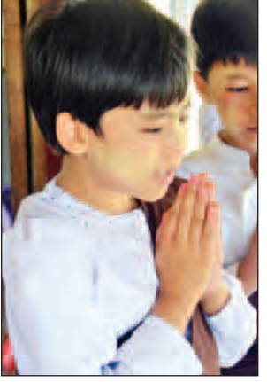
မရွှေယမုံကျော်

(၃၈)ဖြာမင်္ဂလာတရားတော်ကို ကလေး များ နားလည်လွယ်သော ပုံဝတ္ထု လေးများပါသကဲ့သို့ တိရစ္ဆာန်လေး များကို ကိုယ်ချင်းစာကြင်နာရန်၊ အမှိုက်ကောက်ကြမည် စသည်ဖြင့် ကဗျာလေးများ၊ သီချင်းလေး များကိုလည်း တွေ့နိုင်သည်။ ကလေး များက အပြိုင်အဆိုင်သီဆိုကြသည်။ တစ်ဖွဲ့နှင့်တစ်ဖွဲ့ လက်ခုပ်တီး၍ အားပေးကြသည်။ စေတနာဆရာမ လေးများနှင့် ကလေးများပါပျော်ရွှင် ကြသည်။ ကစားချိန်တွင်ကစားကြ သည်။ မုန့်တစ်မျိုးမျိုး၊ အာဟာရ တစ်မျိုးမျိုး အမြဲကျွေးမွေးသည်။ ပန်းများအပြိုင်ခူးကြသည်။ အလှဆုံး ဖြစ်အောင်စုပေါင်း၍ ဘုရားတွင် ကပ်လှူကြသည်။ မဟာရတနာ သိုက်ချောင်းတပ်ဦးကျောင်း ဓမ္မစက္က မေမြန်းတင်ပြအပ်ပါသည်။