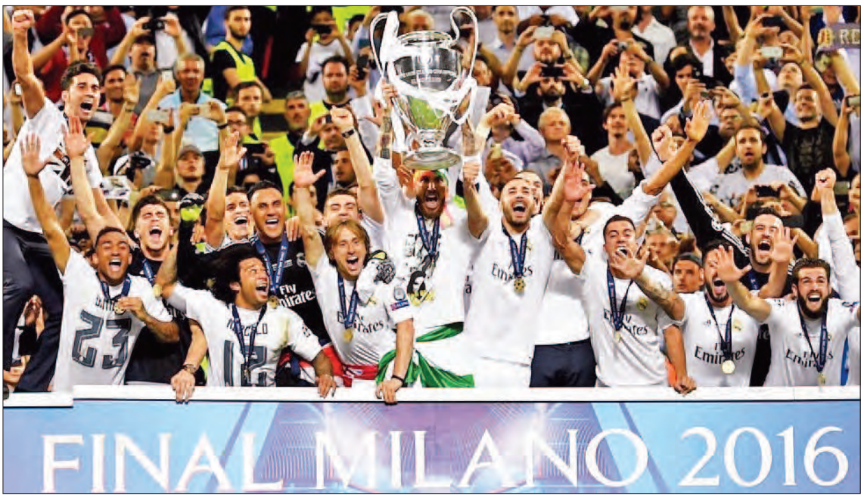
ရီးယဲလ်မက်ဒရစ်အသင်းသည် ငါးဦးမြောက်ကစားသမားလည်းဖြစ်လာခဲ့ပြီး ပထမဆုံး နောက်တန်းကစားသမားလည်းဖြစ်လာခဲ့သည်။ ရီးယဲလ်မက်ဒရစ်အသင်းနှင့် အက်သလက်တီကိုမက်ဒရစ်အသင်းတို့၏ ချန်ပီယံလိဂ်နောက်ဆုံးဗိုလ်လုပွဲတွင် ဂရစ်ဇ်မန်းသည် ပင်နယ်တီလွဲခဲ့ခြင်းကြောင့် ၂၀၁၂ ခုနှစ် ချန်ပီယံလိဂ်ဗိုလ်လုပွဲတွင် ပင်နယ်တီလွဲခဲ့သည့် အကျန်ရော်ဘင်ဗြီးနောက် ပထမဆုံးပင်နယ်တီလွဲခဲ့သည့် ကစားသမားလည်းဖြစ်လာခဲ့သည်။ ယခုပွဲစဉ်တွင် ချန်ပီယံလိဂ်သမိုင်းတွင် အချိန်ပိုကစားရသည့် ရှစ်ပွဲမြောက်ချန်ပီယံလိဂ်ဗိုလ်လုပွဲဖြစ်လာခဲ့ပြီး ပင်နယ်တီအဆုံးအဖြတ်ခံယူရသည့် ခုနှစ်ပွဲမြောက် ချန်ပီယံလိဂ်ဗိုလ်လုပွဲလည်း ဖြစ်လာခဲ့သည်။ (ငွေကြယ်)

ထို့ကြောင့် ရီးယဲလ်မက်ဒရစ်အသင်းက အက်သလက်တီကိုမက်ဒရစ်အသင်းအား အနိုင်ရရှိခဲ့ပြီး ချန်ပီယံလိဂ်ဆုဖလားကို(၁၁)ကြိမ်မြောက်အထိ ဆွတ်ခူးနိုင်ခဲ့သည့် စံချိန်တင်သွားခဲ့ပြီဖြစ်သည်။ ရီးယဲလ်မက်ဒရစ်အသင်းနည်းပြ ဇီဒနန်းသည် ရီးယဲလ်မက်ဒရစ်အသင်းနှင့်အတူ ကစားသမားဘဝနှင့်ရောနည်းပြဘဝနှင့်ပါ ချန်ပီယံလိဂ်ဖလားရရှိခဲ့သည့် မူနေဘူဇီးနောက် ချန်ပီယံလိဂ်ဖလားရယူပေးနိုင်ခဲ့သည့် ဒုတိယမြောက်နည်းပြလည်းဖြစ်လာခဲ့သည်။ ထို့ပြင် ချန်ပီယံလိဂ်သမိုင်းတွင်လည်း ချန်ပီယံလိဂ်ဆုဖလားကိုရယူနိုင်ခဲ့သည့် ပထမဆုံးပြင်သစ်နိုင်ငံသား နည်းပြတစ်ဦးလည်းဖြစ်လာခဲ့သည်။ ချန်ပီယံလိဂ်ဗိုလ်လုပွဲစဉ်တွင် ရီးယဲလ်မက်ဒရစ်အသင်းအတွက် ဦးဆောင်ဂိုးသွင်းယူပေးနိုင်ခဲ့သည့် ရာမိုစ်သည် ရာအူးလီ၊ အီတူ၊ မက်ဆီနှင့်စီရီနယ်လ်ဒို တို့ပြီးပါက မတူညီသည့်ချန်ပီယံလိဂ် နောက်ဆုံးဗိုလ်လုပွဲနှစ်ကြိမ်တွင်