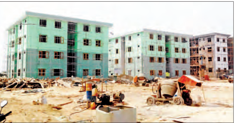
ပဲခူးတိုင်းဒေသကြီး အစိုးရအဖွဲ့အနေဖြင့် တန်ဖိုးသင့် အိမ်ရာများကို ထပ်မံတည်ဆောက်ပေးသွားမည်ဖြစ်ကြောင်း ရက် ၁၀၀ စီမံချက် အကောင်အထည်ဖော်ဆောင်ရွက်ခြင်း အနေဖြင့် တန်ဖိုးသင့်အိမ်ရာများကို ငွန်လဆန်းမှ စတင် တည်ဆောက်သွားမည်ဖြစ်ကြောင်း သိရသည်။ (၄၂၈)

“လူနေတိုက်ခန်း အကျဉ်း အကျယ်အပေါ် မူတည် ပြီး ဈေးသတ်မှတ်ထားတယ်။ တိုက်ခန်းအကျဉ်းဆို တစ်လ ကျပ် ၂၅၀၀၀ ကျသင့်ပြီး တိုက်ခန်းအကျယ်က ကျပ် ၃၀၀၀၀ ပေးနေရတယ်။ အပြင်ငှားနေရတာထက် အဆင်ပြေပါတယ်။ ရေ၊ မီးစိုပါတယ်”ဟု အငြိမ်းစား ဝန်ထမ်းတစ်ဦးက ပြောသည်။ အိမ်ပိုင်မရှိသူများအား ငါးနှစ်စာချုပ်ချုပ်ဆိုပြီး သတ်မှတ်အခန်းတန်ဖိုးအလိုက် အငှားစာချုပ်ဖြင့် ငှားရမ်းနေထိုင်ခွင့် ပြုထားသည်။ “အငှားစနစ်နဲ့နေထိုင်ခွင့် ပြုထားတာပါ။ နှစ်ရှည် ပိုင်ဆိုင်ခွင့်ပုံစံ မဟုတ်ပါဘူး။ ဘယ်လိုပဲဖြစ်ဖြစ် အပြင် မှာ ငှားရမ်းနေထိုင်ရတာထက် အဆင်ပြေအိမ်ရာဖြစ် ပါတယ်။ အိမ်ခန်း၊ မီးဖိုချောင်၊ ရေချိုးခန်း၊ အိမ်သာ အားလုံးပါတယ်”ဟု အိုးအိမ်တာဝန်ရှိသူ တစ်ဦးက ပြောသည်။ အငှားအိမ်ရာကို အစိုးရကပိုင်ဆိုင်ပြီး စာချုပ်