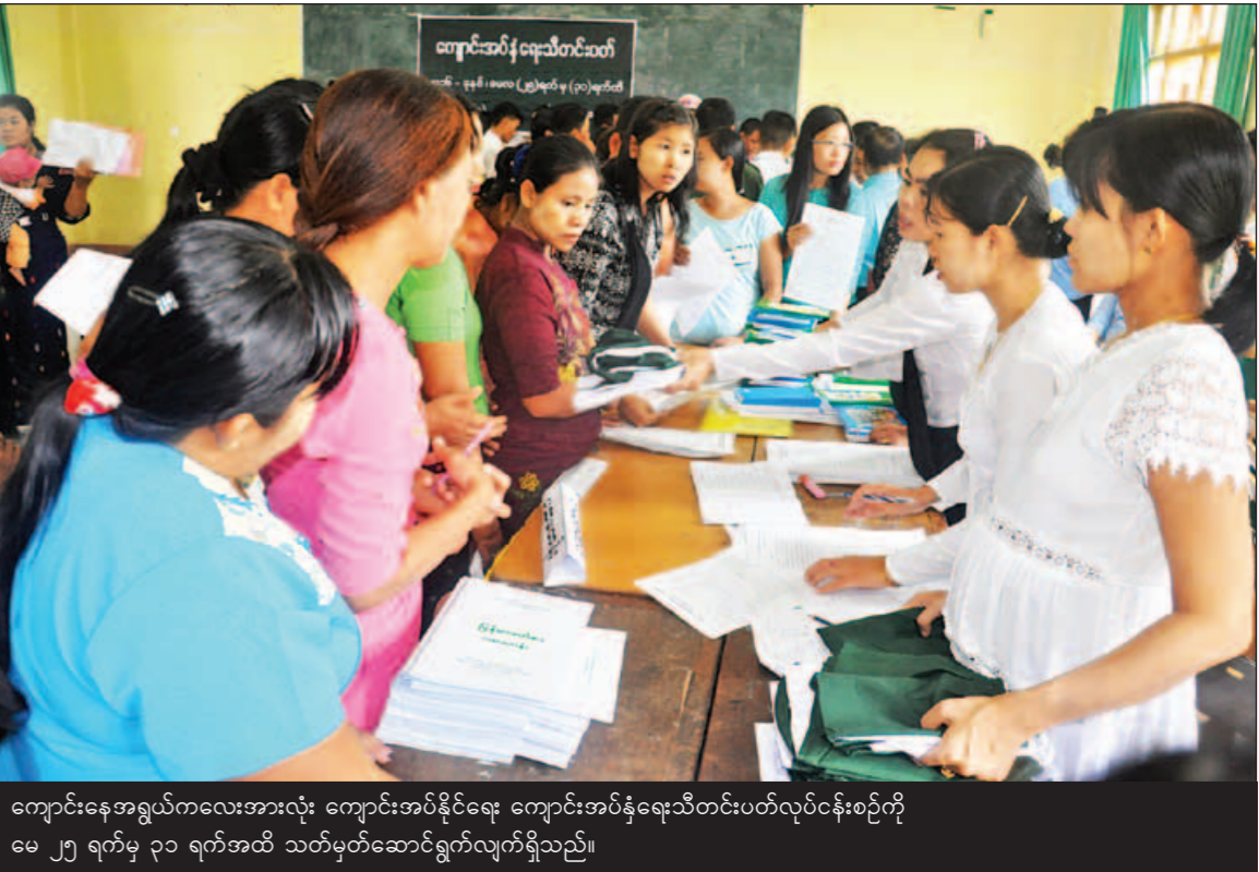
ကျောင်းနေအရွယ်ကလေးအားလုံး ကျောင်းအုပ်ဆိုင်ရေး ကျောင်းအုပ်ဆိုင်ရေးသီတင်းပတ်လုပ်ငန်းစဉ်ကို မေ ၂၅ ရက်မှ ၃၁ ရက်အထိ သတ်မှတ်ဆောင်ရွက်လျက်ရှိသည်။

နိုင်ငံရပ်ကျယ်အတွက် အမျိုးသားပညာရေးဥပဒေ ပုဒ် ၃၂(ခ)နှင့်အညီ ဆောင်ရွက်ပေးရန်အတွက် စီစဉ်နေကြောင်း ပညာရေးဝန်ကြီးဌာနမှ သိရှိ ရသည်။ “မြန်မာနိုင်ငံမှာ အသက် (၅) နှစ်ကနေ (၁၆) နှစ်အရွယ် ကလေး ၂ ဒသမ ၇ သန်း ခန့်ဟာ ကျောင်းဝင်ရောက်မှုမရှိသူတွေနဲ့ အကြံပြုတင်ပြခြင်းနှင့် စီမံကိန်းချမှတ် အကောင်အထည်ဖော်ခြင်းများကို ရက်ပေါင်း ၁၀၀ အတွင်း ဆောင်ရွက်သွားမည်ဖြစ်သည်။ “အခြေခံပညာ၊ အဆင့်မြင့်ပညာ၊ နည်း ပညာနှင့် သက်မွေးပညာရေးနဲ့ သင်တန်းကဏ္ဍ တွေအားလုံးမှာ ဆရာ ဆရာမတွေ အတန်း ဝင်ရောက်ပို့ချမှုတွေကို စစ်ဆေးအကဲဖြတ် ခြင်း ပြုလုပ်မှာဖြစ်ပါတယ်။ အခြေခံပညာ ကျောင်းသားကျောင်းသူတွေရဲ့ သင်ယူ တက်ရောက်မှု အရည်အသွေးမြှင့်တင်ပေးမှုအတွက် စာရင်းကနေ လွှဲပြောင်းထုတ်ယူနိုင်ဖို့ စီမံကိန်း နှင့် ဘဏ္ဍရေးဝန်ကြီးဌာန၊ ကမ္ဘောဇဘဏ်တို့ နဲ့ ပူးပေါင်းညှိနှိုင်းဆောင်ရွက်နေပါတယ်”ဟု ပြည်ထောင်စုဝန်ကြီးက ပြောကြားသည်။