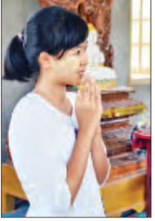
မမြတ်မြင့်မိုးရီ