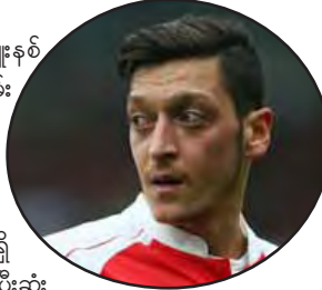
မေလဲ့သင်း-စုစည်းသည်

ဘွန်ဒင်စ်လီဂါကလပ် ဘိုင်ယန်မြူးနစ် အသင်းသည် အာဆင်နယ်နှင့်သက်တမ်း တိုးရန် ညှိနှိုင်း၍ မရသေးသည့် အိုဇေးလ် အား ခေါ်ယူရန် ချိတ်ဆက်နေ သဖြင့် အာဆင်နယ်အသင်းတာဝန်ရှိ သူများ၏ စိုးရိမ်မှုများ မြင့်တက်လျက်ရှိ သည်။ အိုဇေးလ်က ယူရို-၂၀၁၆ ပြိုင်ပွဲပြီးဆုံး ပြီးမှသာ အပြောင်းအရွှေ့ကိစ္စရပ်များကို စဉ်းစားသွားမည်ဟု တုံ့ပြန် ခဲ့ကြောင်း The Sun သတင်းစာက ဖော်ပြသည်။ သို့သော် အိုဇေးလ်က သူ၏ ကစားသမားဘဝ အကောင်းဆုံး အချိန် များကို အာဆင်နယ်တွင်သာ ကုန်ဆုံးသွားမည်ကို စိုးရိမ်နေပြီး တခြား တစ်ဖက်တွင်လည်း အာဆင်နယ်၏ ဖလားလက်ခံ အနေအထားအပေါ် စိတ်ပျက်နေကြောင်း သိရသည်။ အဆိုပါ ဂျာမနီလက်ရွေးစင် ကစားသမားမှာ ၂၀၁၃ခုနှစ်တွင် ရီးယဲလ်မက်ဒရစ်မှ အာဆင်နယ်သို့ စံချိန်တင်ပြောင်းရွှေ့ကြေး ပေါင် ၄၂ဒသမာ့သန်းဖြင့် ပြောင်းရွှေ့လာခဲ့သူဖြစ်သည်။