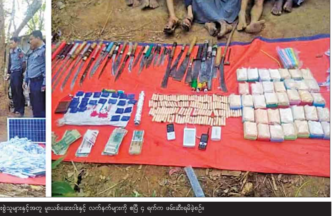
လားရှိုးမြို့နယ်အတွင်း မူးယစ်ဆေးဝါးရောင်းချသည့်တိုက်များအတွင်း မူးယစ်ဆေးဝါးရောင်းချသူ သုံးစွဲသူများနှင့်အတူ မူးယစ်ဆေးဝါးနှင့် လက်နက်များကို ဧပြီ ၄ ရက်က ဖမ်းဆီးရမိခဲ့စဉ်။

မူးယစ်ဆေးဝါးထုတ်လုပ်မှုလျှော့ချနိုင် ဖို့အတွက် မူးယစ်ဆေးဝါးထုတ်လုပ်ရာမှာ အသုံးပြုတဲ့ ထိန်းချုပ်ခရာပစ္စည်း(Precursor)တွေ တရားမဝင် ဝင်ရောက်မှုတွေကို စစ်ဆေးကြပ်မတ်လျက်ရှိပါတယ်။