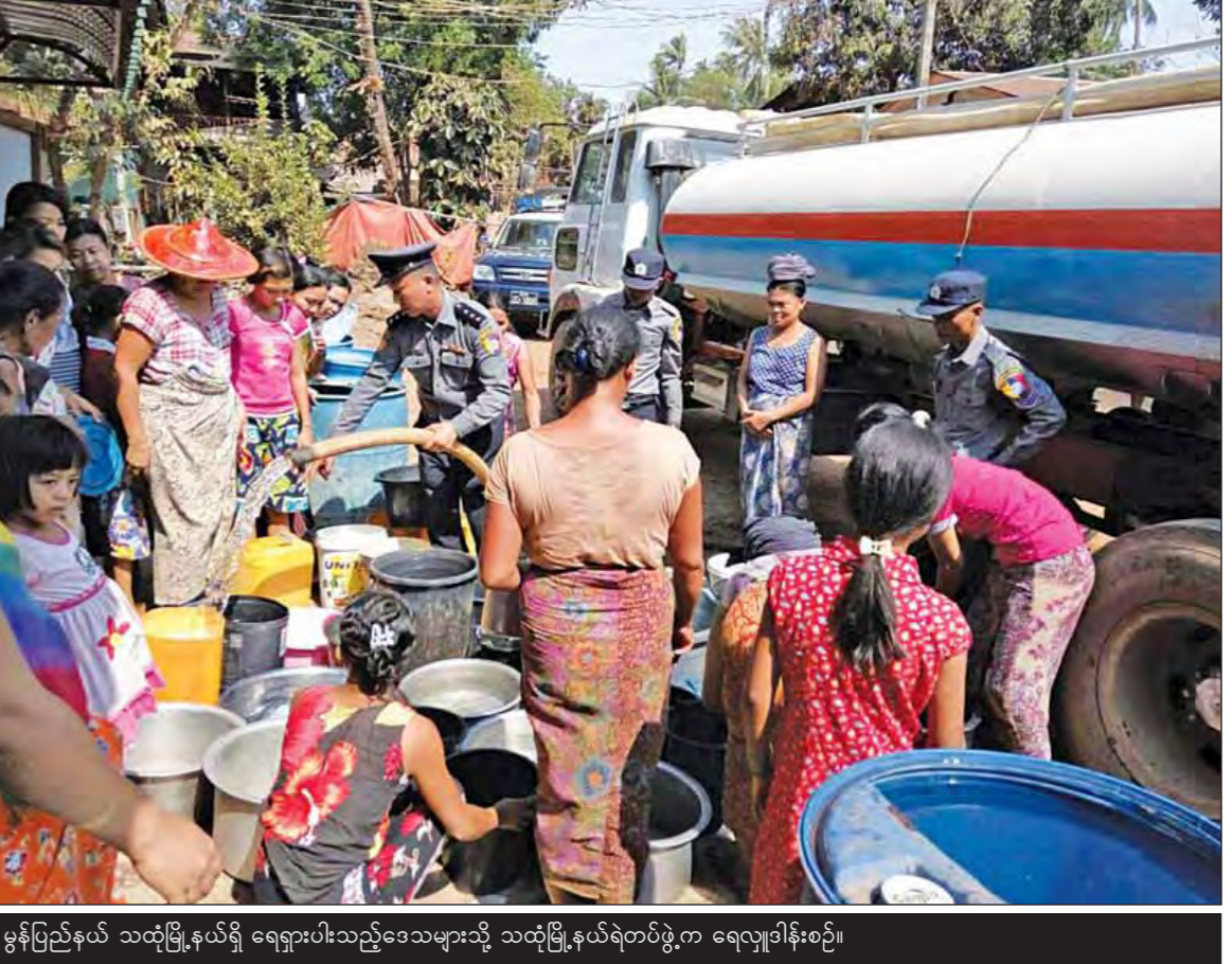
မွန်ပြည်နယ် သထုံမြို့နယ်ရှိ ရေရှားပါးသည့်ဒေသများသို့ သထုံမြို့နယ်ရဲတပ်ဖွဲ့က ရေလျှော့ချပေးခဲ့ပါ။

မူးယစ်ဆေးဝါးထုတ်လုပ်မှုလျှော့ချနိုင် ဖို့အတွက် မူးယစ်ဆေးဝါးထုတ်လုပ်ရာမှာ အသုံးပြုတဲ့ ထိန်းချုပ်ခရာပစ္စည်း(Precursor)တွေ တရားမဝင် ဝင်ရောက်မှုတွေကို စစ်ဆေးကြပ်မတ်လျက်ရှိပါတယ်။