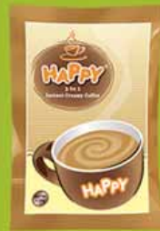
ခရင်(မ်)မိကော်ဖီ