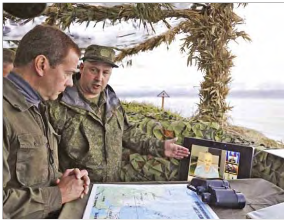
ဖွင့်ဟပြောကြားခဲ့သည်။ သို့သော် ရုရှားတပ်မတော်က အဆိုပါလေ့လာဆန်းစစ် ရေးအဖွဲ့၏ နယ်မြေလေ့လာရေးအစီအစဉ်များကို ထုတ်ဖော်ပြောကြားခြင်းမရှိပေ။ ယင်းအဖွဲ့သည် ဂျပန် နိုင်ငံက ၎င်းတို့ပိုင်ဆိုင်သည်ဟု အခိုင်အမာဆိုထားသော ကျွန်းလေးကျွန်းကို ရုရှားပိုင်နယ်မြေများအဖြစ် သတ်မှတ်ပြီး လေ့လာဆန်းစစ်မှုများပြုလုပ်နိုင်ခြေရှိသည်။ အဆိုပါကျွန်းလေးကျွန်းသည် ဂျပန်နိုင်ငံ၏ ရှေ့ဟောင်း အမွေအနှစ်နယ်မြေများ ဖြစ်သည်ဟု ဂျပန်အစိုးရက အခိုင်အမာဆိုသည်။ ၎င်းကျွန်းများကို ဒုတိယကမ္ဘာ စစ်အတွင်း သိမ်းပိုက်ခြင်းခံခဲ့ရသည်။ အင်နအိတ်ချီကေ။

မော်စကို မေ ၂၈ ရုရှားနိုင်ငံအရှေ့ပိုင်းရှိ ကူရေးကျွန်းဆွယ်ဒေသတွင် ရေတပ်အခြေစိုက်စခန်းတစ်ခု တည်ဆောက်ရန် နယ်မြေ လေ့လာဆန်းစစ်မှုများ လုပ်ဆောင်လျက်ရှိကြောင်း ရုရှား တပ်မတော်က ယနေ့ကြေညာချက်တစ်ရပ်ထုတ်ပြန်သည်။ အဆိုပါကျွန်းဆွယ်ဒေသတွင် ဂျပန်နိုင်ငံက ၎င်းတို့ ကျွန်းများဟု အခိုင်အမာဆိုထားသော ကျွန်းလေးကျွန်း ပါဝင်ကြောင်း သိရသည်။ အဖွဲ့ဝင် ၂၀၀ ပါဝင်သော နယ်မြေဆန်းစစ်လေ့လာ ရေးအဖွဲ့တစ်ဖွဲ့က ကူရေးကျွန်းဆွယ်ဒေသရှိ မာတူရာကျွန်း ပေါ်တွင် ရေတပ်အခြေစိုက်စခန်းတစ်ခု တည်ဆောက်ရန် နယ်မြေလေ့လာရေးများ လုပ်ဆောင်လျက်ရှိကြောင်း ဆာခါလင်မြို့ အစည်းအဝေးတွင် ရုရှားအရှေ့ပိုင်းခရိုင် စစ်ဌာနချုပ်တိုင်းမှူး ဆာဂျီ ချီကိုင်က ဆိုသည်။ ယင်းအဖွဲ့တွင် တပ်မတော်သားများနှင့် ပထဝီဆိုင်ရာ ကျွမ်းကျင်ပညာရှင်များ ပါဝင်သည်။ ရုရှားပစ်ခတ်ရေတပ်မှ စစ်သင်္ဘောခြောက်စင်းသည် မေ ၇ ရက်က ဗလာဒီဗီစတိုက် မြို့မှ ထွက်ခွာလာခဲ့ပြီး မာတူရာမြို့သို့ မေ ၁၅ ရက်တွင် ရောက်ရှိခဲ့သည်။ ဒုတိယကမ္ဘာစစ်မတိုင်မီ အဆိုပါမာတူရာကျွန်းကို ဂျပန်နိုင်ငံက ပိုင်ဆိုင်အုပ်စိုးခဲ့သည်။ ယင်းကျွန်းပေါ်တွင် လေယာဉ်ကွင်းများ တည်ဆောက်ခဲ့သည်။ ယခုအချိန်တွင် အဆိုပါကျွန်းပေါ်၌ လူနေထိုင်မှုမရှိပေ။ မော်စကိုအနေဖြင့် ပစ်ခတ်ရေတပ်စစ်သင်္ဘောများ အခြေစိုက်နိုင်စေရန်အလို့ငှာ ကူရေးကျွန်းဆွယ်ဒေသတွင် စစ်အခြေစိုက်စခန်းများ တည်ဆောက်သွားမည်ဖြစ်ကြောင်း ရုရှားကာကွယ်ရေးဝန်ကြီး ဆာဂျီဂျူဂိုက မတ်လတွင်