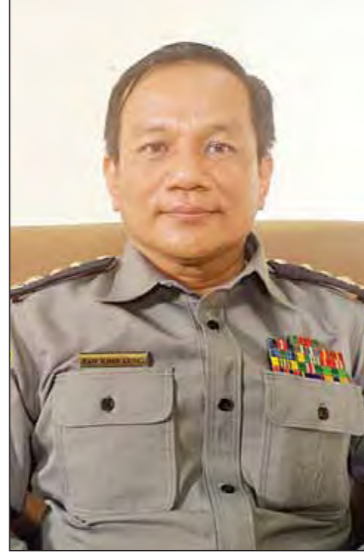
ရဲမှူးကြီး ဇော်ဝင်အောင်။

ပြန်မာနိုင်ငံရဲတပ်ဖွဲ့အနေနဲ့ နေပြည်တော် ပြည်ထောင်စုနယ်မြေနဲ့ တိုင်းဒေသကြီးနဲ့ ပြည်နယ်တွေက အဓိကကျတဲ့ ရန်ကုန်မြို့နဲ့ မန္တလေးမြို့တွေမှာ မူခင်းကျဆင်းရေးလုပ်ငန်း တွေ ဆောင်ရွက်သွားပါမယ်။ တစ်ဆက် တစ်စပ်တည်း မူးယစ်ဆေးဝါးတားဆီးနိမ့်နင်း ရေး စီမံချက်တွေအနေနဲ့ ရန်ကုန်မြို့တော်မှာ ဒဂုံအထူးစီမံချက်နဲ့ မန္တလေးမြို့မှာ ရတနာပုံ အထူးစီမံချက်တွေကို ဆောင်ရွက်သွားမှာ ဖြစ်ပါတယ်။