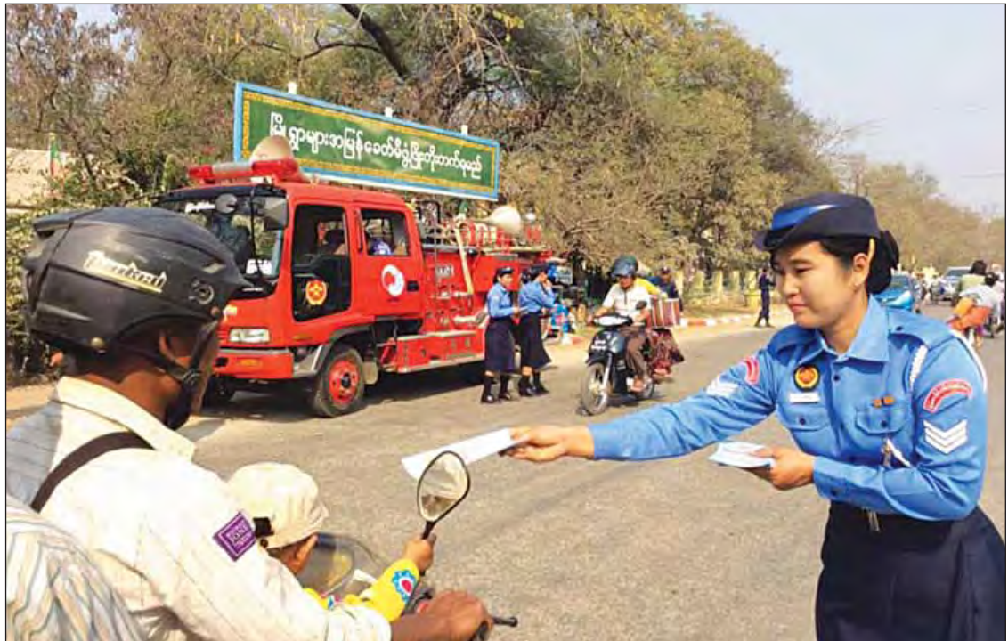
ပြည်သူလူထုအတွင်း မီးသတ်မှုရေးလုပ်ငန်းများ စိမ့်ဝင်ပျံ့နှံ့စေရေးအတွက် ပညာပေးလက်ကမ်းစာစောင်များ ဖြန့်ဝေပေးနေစဉ်။

နိုင်ငံတွင်းအရေးအရာများ ဆောင်ရွက် ရာ၌ ပြည်ထဲရေးဝန်ကြီးဌာနသည် အရေးပါ သည့် အခန်းကဏ္ဍတစ်ရပ်အဖြစ် တာဝန်ယူ ဆောင်ရွက်လျက်ရှိပါသည်။ ပြည်သူ့အရေးသည် နိုင်ငံအရေး၊ နိုင်ငံအရေးသည် ပြည်သူ့အရေး ပင် ဖြစ်သည်။ တရားဥပဒေဘောင်အတွင်းရှိ ပြည်သူများ ကိုယ်စိတ်နှစ်ပါးချမ်းသာစေရေး အတွက် ပြည်ထဲရေးဝန်ကြီးဌာနသာမက ကျန် ဝန်ကြီးဌာနများအနေဖြင့်လည်း သက်ဆိုင်ရာ အခန်းကဏ္ဍများအလိုက် ပူးပေါင်းဆောင်ရွက် ကြရမည်ဖြစ်ပါသည်။ ပြည်ထဲရေးဝန်ကြီးဌာန၏ ရက် ၁၀၀ လှုပ်ရှားမှုအစီအစဉ်များသည် ပြည်သူများ ကိုယ်စိတ်နှစ်ပါးချမ်းသာစေ ရေးအတွက် ရည်ရွယ်ဆောင်ရွက်နေခြင်းဖြစ်ပါ ကြောင်း။ ။