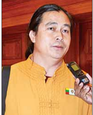
ဦးမိုင်းကျော်ညွန့်

တွေကို တင်ပြတယ်။ အတည်ပြု တယ်။ တိုင်းရင်းသားလက်နက်ကိုင် တွေဘက်ကလည်း သူတို့ရဲ့အသစ် တင်တာကို အတည်ပြုတယ်။ နိုင်ငံရေး ပါတီတွေဘက်ကလည်း မနေ့က နိုင်ငံတော်အတိုင်ပင်ခံပုဂ္ဂိုလ် ပြော တာကို မူအားဖြင့် သဘောတူတယ်။ ရွေးကောက်ပွဲမှာအနည်းဆုံးတစ်နေရာ ပေါ့။ ပြည်သူလွှတ်တော်မှာဖြစ်ဖြစ်၊ အမျိုးသားလွှတ်တော်မှာ ဖြစ်ဖြစ်၊ တိုင်းဒေသကြီး၊ ပြည်နယ်လွှတ်တော် မှာဖြစ်ဖြစ် နိုင်ငံပါတီက သူ့ကို UPDJC အဖွဲ့ဝင်ပြောင်းဖို့ မူအား ဖြင့် သဘောတူတယ်။ ဒါကြောင့် ဒီနေ့ အစည်းအဝေးက အောင်မြင်တယ်