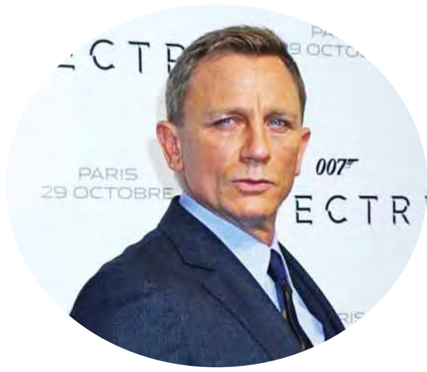
မျိုးစန္ဒာမောင် ရေးသားသည်

Deadline သတင်းဌာန၏ သတင်းဖော်ပြချက်အရ ၎င်းတို့နှစ်ဦးသည် အဆိုပါ ဇာတ်ကားရိုက်ကူးရန်အတွက် အစစအရာရာ ကြိုတင်ပြင်ဆင်မှုများ ဆောင်ရွက်နေပြီဖြစ်ကြောင်းနှင့် အကြိုရိုက်ကူးရေးလုပ်ငန်းများကို မကြာမီ စတင်တော့မည်ဖြစ်ကြောင်း သိရသည်။