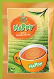
လက်ဖက်ရည်၊