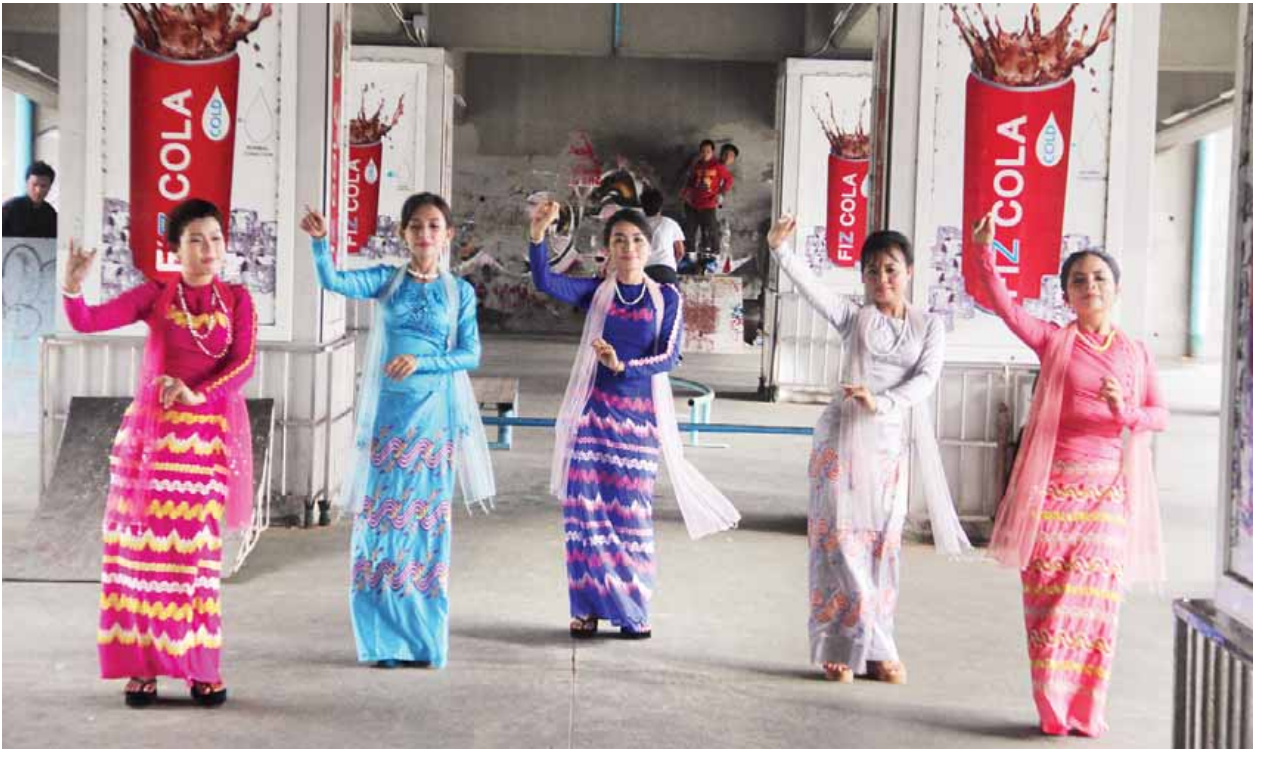
စာမျက်နှာ ၉ ကော်လံ ၁ သို့

အမေရိကန်နိုင်ငံ FREE THINK မီဒီယာမှ မေ ၂၇ ရက်က လှည်းတန်းနိုးကျော် တံတားအောက်တွင် မြန်မာ့အနုပညာအကကို နောက်ခံစက်တံကစားနေသည့် မြင်ကွင်းနှင့်တွဲဖက်၍ မှတ်တမ်းရုပ်ရှင်အဖြစ် ရိုက်ကူးသည်ကို တွေ့မြင်ခဲ့ရသည်။ (ယာပုံ) မှတ်တမ်းရုပ်ရှင် လာရောက်ရိုက်ကူးခြင်းနှင့်ပတ်သက်၍ မေးမြန်းခဲ့ရာ FREE THINK မီဒီယာမှ Ms. AMANDA က “ အမေရိကန် ဝါရှင်တန်က လူတွေဟာ မြန်မာ့ယဉ်ကျေးမှုကို မသိကြဘူး။ မြန်မာ့ယဉ်ကျေးမှုအနုပညာတွေ၊ အကပညာတွေ အခုနောက်ပိုင်းမှာ ပြောင်းလဲလာပြီဆိုတာကိုလည်း ဝါရှင်တန်ကသူတွေကို ပြချင်ပါတယ်။ ပြီးတော့ အရင်က မြန်မာ့ရိုးရာယဉ်ကျေးမှု အနုပညာကို