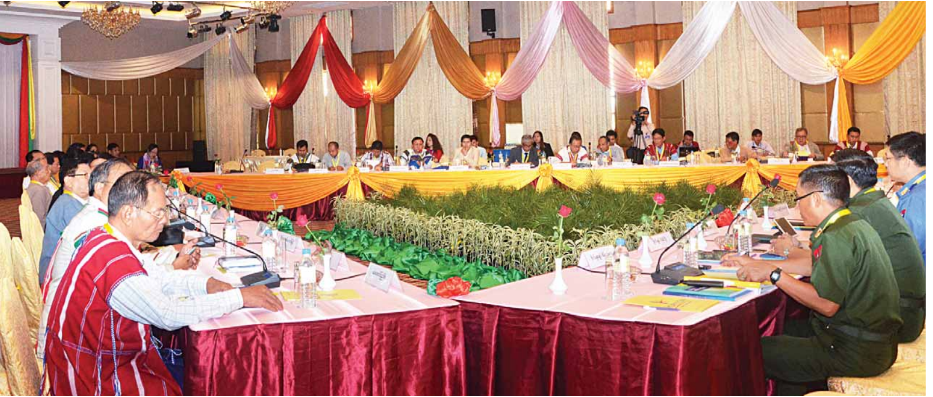
ပြည်ထောင်စုငြိမ်းချမ်းရေးဆွေးနွေးမှု ပူးတွဲကော်မတီ (UPDJC) ပြင်ဆင်ဖွဲ့စည်းမှုနှင့် ရှေ့လုပ်ငန်းစဉ်များ ညှိနှိုင်းဆွေးနွေးပွဲ ဒုတိယနေ့ကျင်းပစဉ်။ (သတင်းစဉ်)