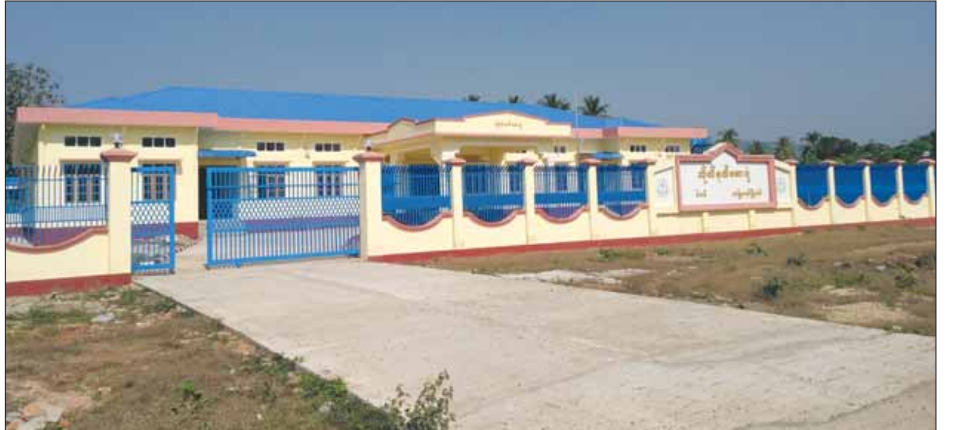
ကျော်စမ်း(ဖြန်/ဆက်)

ခိုင်ထူးတို့က ဂုဏ်ပြုမှတ်တမ်းများ ပေးအပ်ခဲ့သည်။ ဖွင့်လှစ်သည့် ဝဲခမိတိုက်နယ်ဆေးရုံအား ၂၀၁၄-၂၀၁၅ ဘဏ္ဍာနှစ်တွင် နိုင်ငံတော်ခွင့်ပြုငွေ ကျပ်သန်းခြောက်ရာဖြင့် တည်ဆောက်ခဲ့ပြီး ဝဲခမိကျေးရွာနှင့် ပတ်ဝန်းကျင်ကျေးရွာ ၁၉ ရွာမှ တိုင်းရင်းသားပြည်သူ ၁၅၀၀၀ ကျော်အတွက် ကျန်းမာရေးစောင့်ရှောက်မှု ပေးနိုင်မည်ဖြစ်ကြောင်း သိရသည်။ ဆက်လက်၍ ကျေးလက်ကျန်းမာရေးဌာနခွဲ အဆောက်အအုံသစ်များ ဖွင့်ပွဲကျင်းပရာ ဝဲရက်ကျေးရွာ ကျန်းမာရေးဌာနခွဲနှင့် ကွမ်သတ်ကျေးရွာ ကျန်းမာရေးဌာနခွဲတို့ ပြည်နယ်လူမှုရေးဝန်ကြီးနှင့် တာဝန်ရှိသူများက ဖွင့်လှစ်ပေးခဲ့ကြောင်း သိရသည်။