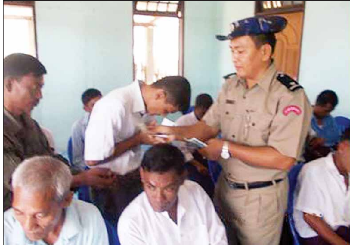
၂၀၁၄ ခုနှစ် အောက်တိုဘာ ၁၀ ရက်တွင် ကျောက်ဖြူအကျဉ်းထောင်မှ လွတ်မြောက်အကျဉ်းသားများအား ငွေကြေးထောက်ပံ့နေစဉ်။

မပြတ် အကဲဖြတ်ဆန်းစစ်ခြင်း၊ ကြီးကြပ် ကွပ်ကဲခြင်း စတဲ့လုပ်ငန်းစဉ်တွေအတိုင်း အချိန်မီကူညီစောင့်ရှောက်နိုင်ဖို့ကိုလည်း စီမံ ဆောင်ရွက်သွားမှာ ဖြစ်ပါတယ်။