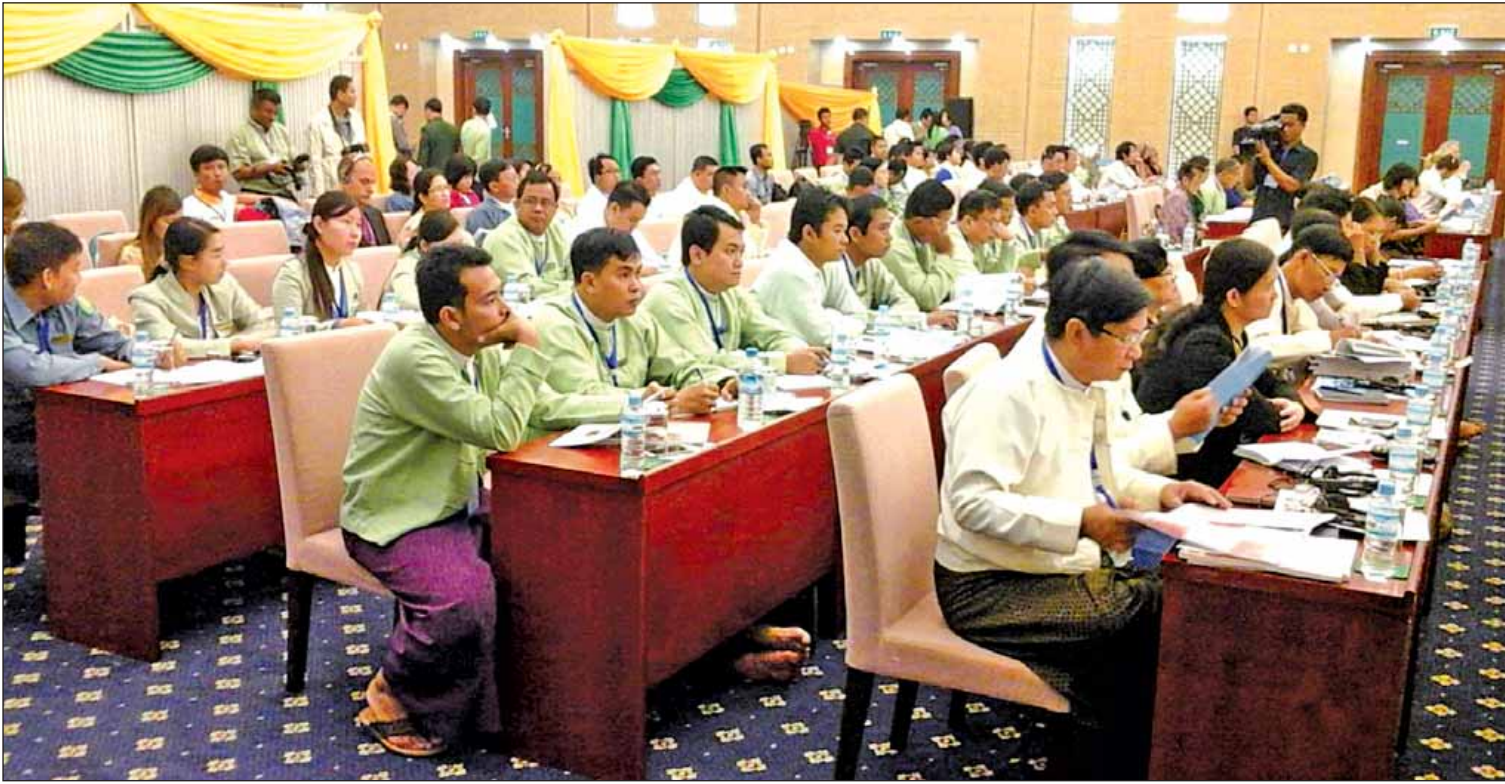
Good Government Forum တွင် OSS ဖြင့် ပြည်သူ့ဝန်ဆောင်မှုပြုရေးဆွေးနွေးစဉ်။