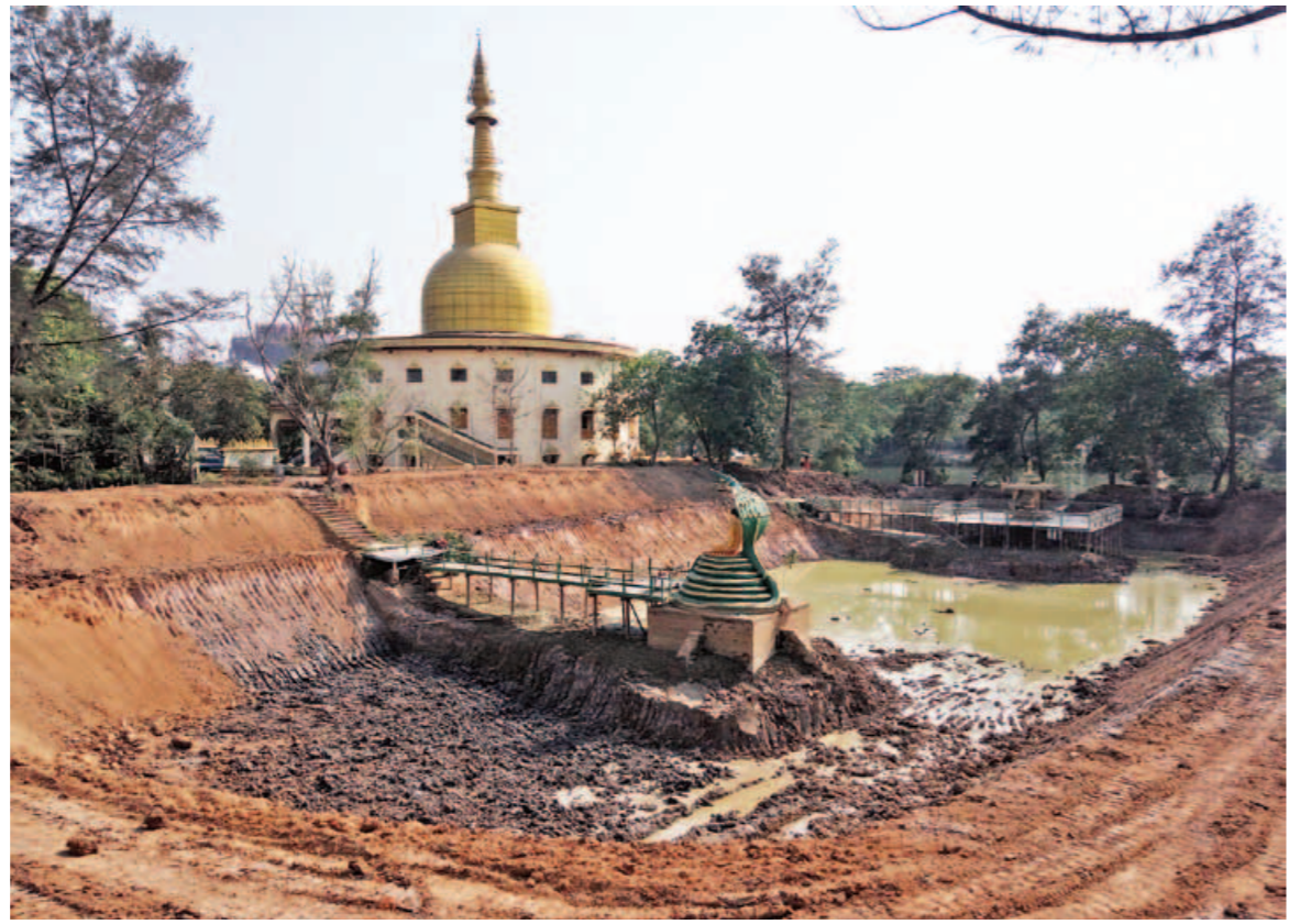
ရန်ကုန်တိုင်းဒေသကြီး မရမ်းကုန်းမြို့နယ်ရှိ ဒဂုံသီရိဘေးမဲ့ကန်တော်ကြီး။

ဖြေ။ မြန်မာနိုင်ငံအရပ်ရပ်မှာ ဘုန်းတော်ကြီးသင် ပညာရေးကျောင်းပေါင်း ၁၅၆၈ ကျောင်းရှိပါတယ်။ အဲဒီကျောင်းတွေမှာ ဆင်းရဲတဲ့ ကလေးငယ်တွေ၊ မိဘမဲ့ကလေးငယ်တွေ စုစုပေါင်း သုံးသိန်းကျော်က ပညာသင်ကြားနေကြပါတယ်။ လုပ်အားပေးနေတဲ့ ဆရာဆရာမက ၇၇၀၀ ကျော်ရှိပါတယ်။ လုပ်အားပေးထားလို့ ပြောတဲ့နေရာမှာ ဘုန်းတော်ကြီးသင် ပညာရေးကျောင်းတွေမှာ ပညာသင်ကြားပေးနေတဲ့ ဆရာ ဆရာမတွေဟာ နိုင်ငံတစ်ဝန်း မဟုတ်ပါဘူး။ လုပ်အားစေတနာအလျောက် လာရောက် သင်ကြားပေးနေတဲ့ ဆရာ ဆရာမတွေ ဖြစ်ပါတယ်။ ဒါနဲ့ပတ်သက်ပြီး သက်ဆိုင်ရာ ကျောင်းအုပ်ဘုန်းတော်ကြီးများက သက်ဆိုင်ရာကျေးရွာတွေမှာ အလှူခံပါတယ်။ အလှူငွေနဲ့ပဲ မှီခိုပေးသဘောမျိုးထောက်ပံ့ကြားပေးနိုင်တာပါ။