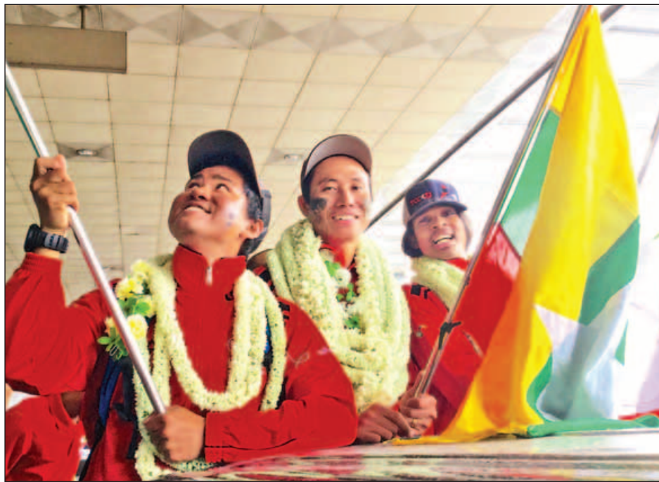
ဧဝရက်တောင်ထိပ်တက်ရောက်နိုင်ခဲ့သော မြန်မာတောင်တက်အဖွဲ့ဝင်သုံးဦးအား ရန်ကုန်အပြည်ပြည်ဆိုင်ရာလေဆိပ်တွင် တွေ့ရစဉ်။

အများပြည်သူနှင့် ဝန်ထမ်းများက ဝယ်ယူရန် စိတ်ဝင်စားမှုများခဲ့သော်လည်း စာမျက်နှာ ၈ ကော်လံ ၁ သို့ ❖