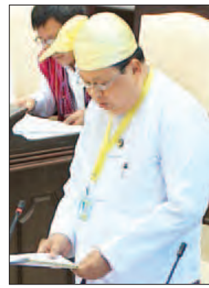
ပြည်ထောင်စုဝန်ကြီး ဦးဝင်းခိုင်

ဥပဒေကြမ်းကော်မတီ၏ အစီရင် ခံစာ၌ ရန်ကုန်မြို့တော်စည်ပင်သာ ယာရေးဥပဒေကို ၁၉၉၀ ခုနှစ် နိုင်ငံ