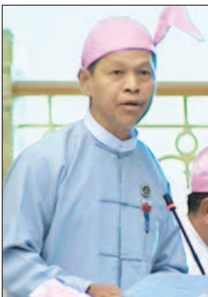
ရခိုင်ပြည်နယ် မဲဆန္ဒနယ် အမှတ်(၄)မှ ဦးကျော်ကျော်

ဆောက်လုပ်ရေးဝန်ကြီးဌာန ပြည် ထောင်စုဝန်ကြီး ဦးဝင်းခိုင်က လက်ပံ တောကျေးရွာ ကြိုးတံတားသည် ဆောက်လုပ်ရေးဝန်ကြီးဌာနပိုင် လမ်း ပေါ်ရှိတံတားမဟုတ်ဘဲ စိုက်ပျိုးရေး၊ မွေးမြူရေးနှင့် ဆည်မြောင်းဝန်ကြီး ဌာန ကျေးလက်ဒေသ ဖွံ့ဖြိုးတိုးတက် ရေးဦးစီးဌာနပိုင်လမ်းပေါ်ရှိ တံတား ဖြစ်ပါကြောင်း၊ ထို့ကြောင့် ၂၀၁၆ - ၂၀၁၇ ဘဏ္ဍာရေးနှစ်တွင် သက်ဆိုင်ရာ ဝန်ကြီးဌာန သို့မဟုတ် ရခိုင်ပြည်နယ် အစိုးရအဖွဲ့ ဖြည့်စွက်ရန်ပုံငွေတွင် ထည့်သွင်းတောင်းခံ၍ ရန်ပုံငွေရရှိ ပါက ဆောင်ရွက်ပေးသွားမည် ဖြစ်ပါ ကြောင်း ဖြေကြားသည်။