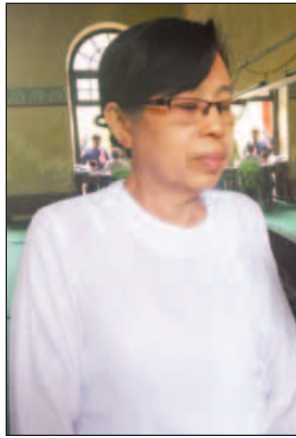
ဒေါ်မြင့်မြင့်ကြူ