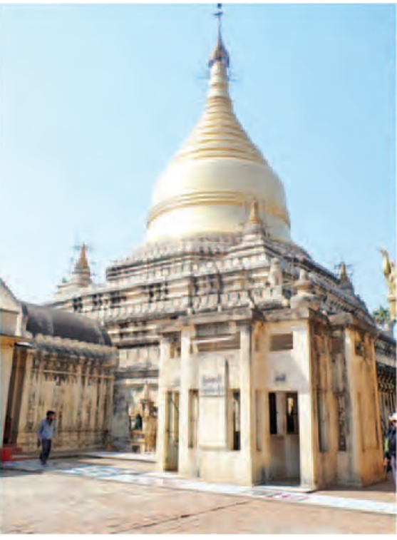
ကမ္ဘာ့မှတ်တမ်းအမွေအနှစ်စာရင်းဝင် မြစေတီ(ရာဇကုမာရ်)ကျောက်စာ လိုဂို။

အနုပညာဆိုင်ရာ သုတေသနစာတမ်း သုံးစောင်ဖတ်ကြားတင်သွင်းခဲ့တယ်။ တေးသီချင်းနဲ့ ဇာတ်သဘင်မှ အချိုးတေးကဗျာများ စာတမ်း၊ အနုပညာဇာတ်သဘင်သမားစဉ်စာတမ်း၊ ဇာတ်ဆောင်စရိုက်ဖန်တီးမှုစာတမ်း တို့ဖြစ်တယ်။ တေးသီချင်းနဲ့ ဇာတ်သဘင်မှ အချိုးတေးကဗျာအား စာတမ်းကနေ ကဗျာတွေစပ်မယ်။ တေးသီချင်းအနေနဲ့ ပါဝင်သွားမယ်။ အနုပညာဦးစီးဌာနအနေနဲ့ပြောရရင်