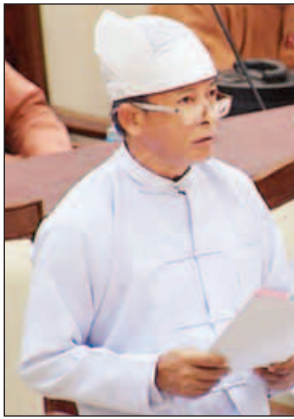
ဒုတိယဝန်ကြီး ဒေါက်တာထွန်းဝင်း

မိုးကုတ်မဲဆန္ဒနယ်မှ ဦးအောင်နိုင်(ခ)ဦးနိုင်ကျော်၏ ပတ်ဝန်းကျင်