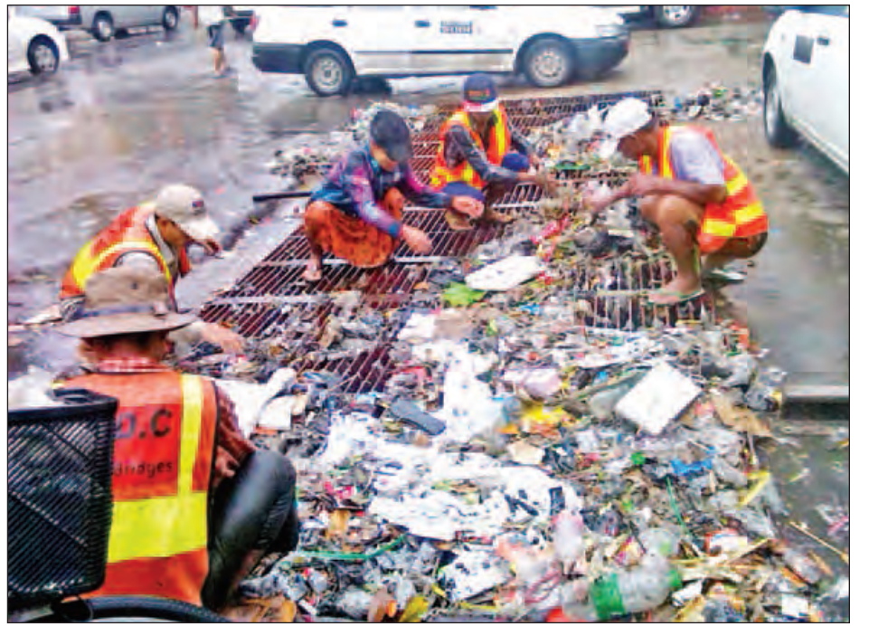
ထို့အပြင် ရန်ကုန်မြစ်အတွင်းသို့စီးဆင်းနေသည့် ထား စောင့်ကြည့်ရှင်းလင်းမှုများ ပြုလုပ်နေကြောင်း ဖြစ်ထွက်ပေါက် ၄၂ ပေါက်၏ စီးဆင်းရာလမ်းကြောင်း၌ အဆိုပါဌာနမှ သိရသည်။

ပိန်အိတ် အထုပ်လိုက် အမှိုက်စွန့်ပစ်ထားတာမျိုးတွေ ရ တဲ့အပြင် ဖော့ဘူး၊ ရေသန့်ဘူးခွဲတွေနဲ့ ပလတ်စတစ်အိတ် တွေကြောင့် ပိတ်ဆို့နေတာတွေ ရတယ်။ မြောင်းဆယ် ပြီးသား နေရာအတော်များများမှာလည်း စည်းကမ်းမဲ့ အမှိုက်စွန့်ပစ်မှုကြောင့် ရေမဆင်းနိုင်ဘဲ လမ်းတွေပေါ် ရေလျှံတဲ့အထိ ဖြစ်သွားတယ်” ဟု ၎င်းက ပြော သည်။ ရန်ကုန်မြို့တွင် ပြီးခဲ့သည့်ရက်ပိုင်းအတွင်းက မိုးတင် ရွာသွန်းခဲ့ပြီးနောက် မြို့တော်စည်ပင်သာယာနယ်နိမိတ် အတွင်းရှိ မြို့နယ်တချို့တွင် ရေလျှံမှုများ ဖြစ်ပေါ်ခဲ့ သည့်အပေါ် ၎င်းက ယခုလိုပြောကြားခြင်းဖြစ်သည်။ ထို့အပြင် ရန်ကုန်မြို့သည် ချောင်းနှင့်မြောင်းများ အတွင်းသို့ ရေစွန့်ထုတ်သည့်စနစ်ကို အခြေခံတည်ဆောက် ထားသည့်အပြင် ရန်ကုန်မြစ်ထွက်ပေါက်သည် ဒီရေ အတက်အကျရှိသည့် မြစ်ချောင်းများဖြစ်သည့်အတွက် ဒီရေတက်ချိန်တွင် မိုးရေချိန်လက်မ များများရွာသွန်းပါက မြို့တွင်းဧရိယာတချို့တွင် ရေကြီးရေလျှံမှုများ ဖြစ်ပွား လေ့ရှိကြောင်း သိရသည်။ ရန်ကုန်မြို့တော် စည်ပင်သာယာနယ်နိမိတ်အတွင်း ရေစီးရေလာကောင်းမွန်ရေးနှင့် မိုးတွင်းကာလ ရေကြီး ရေလျှံမှုများ မဖြစ်ပွားစေရန် လမ်းနှင့် တံတားဌာနမှ ဝန်ထမ်းအင်အား ၆၆၀ အပြင် ယာဉ်နှင့် စက်ယန္တရား များကို အသုံးပြုကာ သက်ဆိုင်ရာ ခရိုင်၊ မြို့နယ်များအလိုက် ကြပ်မတ်ဆောင်ရွက်လျက်ရှိသည်။