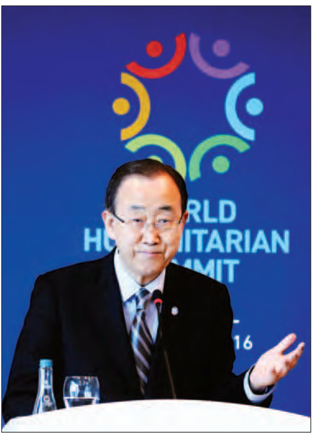
ပေါင်း ၁၅၀၀ အထိ ချမှတ်နိုင်ခဲ့ကြောင်း၊ သို့ရာတွင် အထူးသဖြင့် ဝန်ကြီးချုပ်အိန်ဂျလာမာကလံမှအပ ဂျီ-၇ နိုင်ငံများမှ ခေါင်းဆောင်များ တက်ရောက်နိုင်ခြင်းမရှိခဲ့ကြောင်း ဘန်ကီမွန်းက ပြောကြားသည်။ ဆင်ဟွာ။

အစ္စတန်ဘူလ် မေ ၂၅ ကမ္ဘာ့အင်အားကြီး နိုင်ငံများမှ ခေါင်းဆောင်များသည် လူသားချင်းစာနာထောက်ထားမှုဆိုင်ရာ အကျပ်အတည်းများကို နိုင်ငံရေးအရ ဖြေရှင်းနိုင်ရေးအတွက် ပူးပေါင်းဆောင်ရွက်သင့်ကြောင်း ကုလသမဂ္ဂအတွင်းရေးမှူးချုပ် ဘန်ကီမွန်းက မေ ၂၄ ရက်တွင် ပြောကြားသည်။ ကမ္ဘာ့လူသားချင်းစာနာထောက်ထားမှုဆိုင်ရာ ထိပ်သီးညီလာခံကို တူရကီနိုင်ငံအစ္စတန်ဘူလ်မြို့၌ နှစ်ရက်ကြာကျင်းပခဲ့ပြီးနောက် သတင်းစာရှင်းလင်းပွဲတွင် ကုလသမဂ္ဂအကြီးအကဲက အထက်ပါအတိုင်း တိုက်တွန်းလိုက်ခြင်းဖြစ်သည်။ ကမ္ဘာ့လူသားချင်းစာနာထောက်ထားမှုဆိုင်ရာ ထိပ်သီးညီလာခံမှာ အောင်မြင်မှုရှိသောညီလာခံဖြစ်သော်လည်း ယင်းညီလာခံသို့ ကမ္ဘာ့ခေါင်းဆောင်အချို့ တက်ရောက်ရန် ပျက်ကွက်ခြင်းအတွက် မိမိစိတ်ပျက်မိကြောင်း ဘန်ကီမွန်းကပြောကြားသည်။ အဆိုပါထိပ်သီးညီလာခံ၌ ကုလသမဂ္ဂအဖွဲ့နိုင်ငံများ၊ အဖွဲ့အစည်းများနှင့်အဖွဲ့အစည်းများက ကတိကဝတ်ပြုမှု