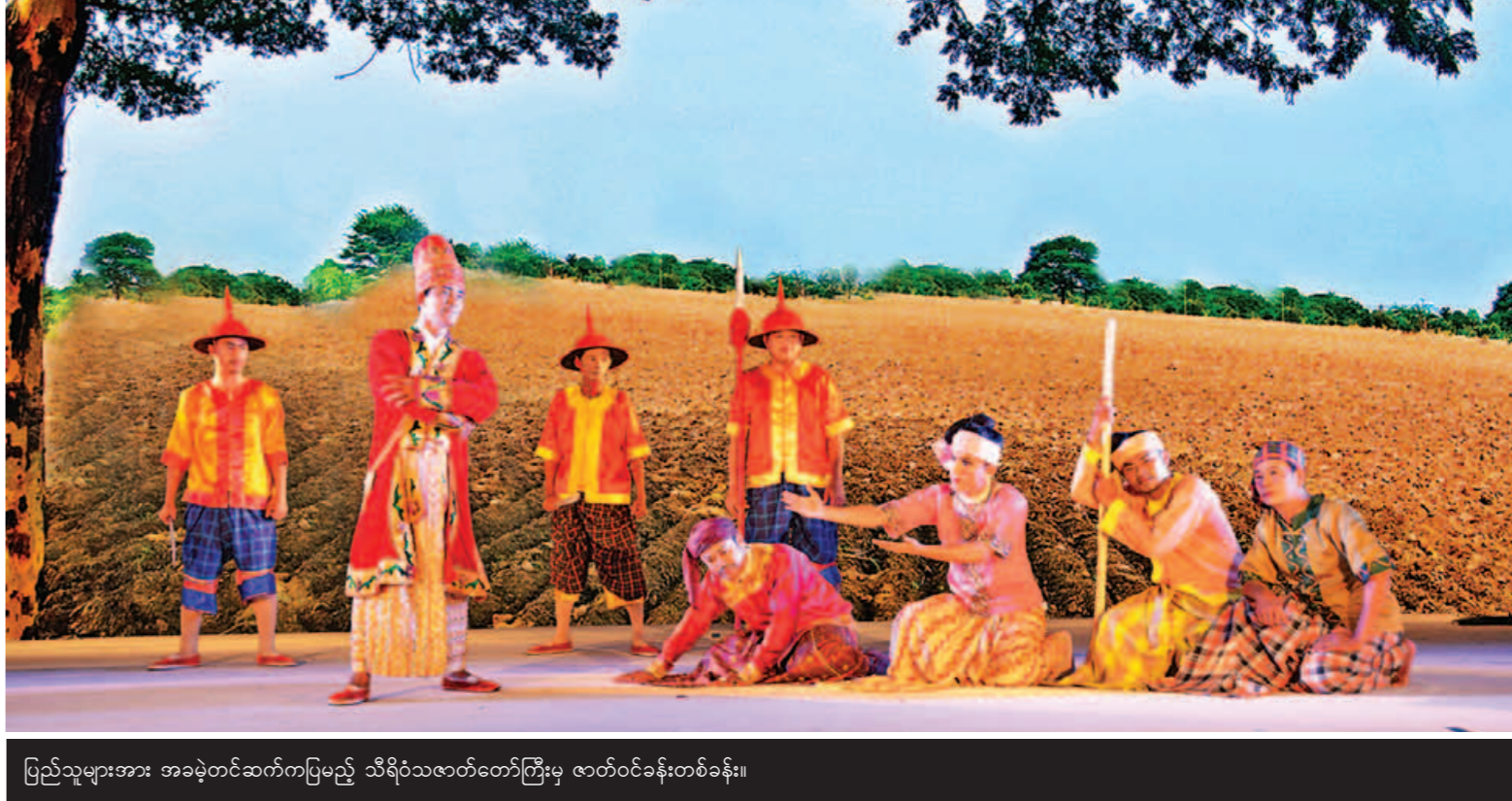
ပြည်သူများအား အခမဲ့တင်ဆက်ကပြမည့် သီရိဝံသဇာတ်တော်ကြီးမှ ဇာတ်ဝင်ခန်းတစ်ခန်း။

မေး။ ဘုန်းတော်ကြီးသင် ပညာရေးကျောင်းတွေက အစိုးရကျောင်းတွေလို ဖြစ်လာအောင်လုပ်ဆောင်နေကြပါသလား။ ဖြေ။ လိုင်းချင်းမတူပါဘူး။ အစိုးရကျောင်းတွေမှာ ကျောင်းပေးနေတဲ့ ဆရာဆရာမတွေက တာဝန်ထမ်းဆောင်တဲ့ ဝန်ထမ်းဆရာဆရာမတွေနဲ့ တစ်ပြေးညီမဟုတ်ရင်တောင်ပိုသင့်တင့်လျောက်ပတ်တဲ့ မိသားစုအတွက် အထောက်အပံ့ဖြစ်ဖို့ တိုးမြှင့်ထောက်ပံ့မှုတွေကို ပြည်ထောင်စုအစိုးရအဖွဲ့ကို တင်ပြပြီးမှ ဘတ်ဂျက်တွေကနေတစ်ဆင့် ထောက်ပံ့သွားဖို့ အစီအစဉ်ရှိပါတယ်။