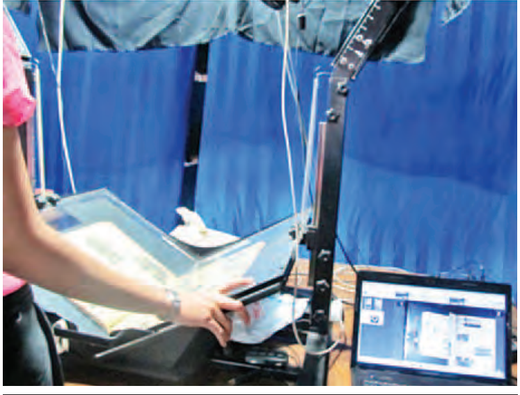
မြန်မာ့ယဉ်ကျေးမှုအမွေအနှစ်များဖြစ်သည့် ပေ၊ ပုရပိုက်များ ရေရှည်တည်တံ့စေရေး ဒစ်ဂျစ်တယ်ပုံစံသို့ ပြောင်းလဲပုံ။

ဒုတိယဆောင်ရွက်မယ့်အစီအစဉ်ကတော့ ရန်ကုန်မြို့မှာရှိတဲ့ ဗိုလ်ချုပ်အောင်ဆန်းနေအိမ်ပြတိုက်ကို မွမ်းမံပြင်ဆင်ခြင်းဖြစ်ပါတယ်။ ဗိုလ်ချုပ်အောင်ဆန်းနေအိမ်ပြတိုက်က ဗိုလ်ချုပ်အောင်ဆန်းနေထိုင်ခဲ့တဲ့ အိမ်တာဝါလိန်းလမ်းမှာ တည်ရှိပါတယ်။ အခုတော့ ဗိုလ်ချုပ်ပြတိုက်လမ်းဆုံပြီး အမည်ပြောင်းလဲခေါ်ပါတယ်။ အဲဒီမှာရှိတဲ့ အထွေထွေထိန်းသိမ်း မွမ်းမံခြင်းတွေ ဆောင်ရွက်သွားမှာဖြစ်ပါတယ်။ မြန်မာနိုင်ငံ အင်ဂျင်နီယာအသင်းရဲ့