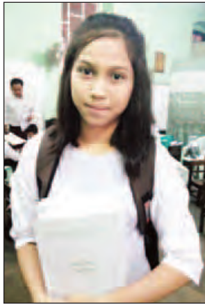
မအေးမြသီရိအောင်