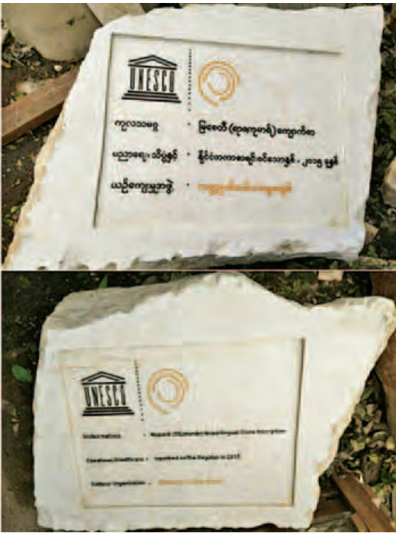
ကမ္ဘာ့မှတ်တမ်းအမွေအနှစ်စာရင်းဝင် မြစေတီ(ရာဇကုမာရ်)ကျောက်စာ လိုဂို။

ဇာတ်တော်ကြီးတွေရှိတယ်။ အဆိုအပို အပြောဆိုတာရှိတယ်။ တေးကဗျာကနေ မင်းသားတွေရဲ့ အဆိုတွေပါလာတယ်။ အငိုခန်းတွေပါလာတယ်။ အပြောတွေပါလာတယ်။ တစ်နည်းအားဖြင့် ပြောရရင် ဆို၊ ငို၊ ပြောတို့ဖြစ်ပါတယ်။ ဆို၊ ငို၊ ပြောတွေရဲ့ စကားလုံးတွေ အားလုံးဟာ အချိုးတေးကဗျာရဲ့ အရေးအသားတွေနဲ့ သွားရတာဖြစ်တဲ့အတွက် အနုပညာရှင်တွေအတွက် တေးသီချင်းစပ်ဆိုသူများအတွက် အလွန်တန်ဖိုးရှိတဲ့ စာတမ်းတစ်စောင် ဖြစ်ပါတယ်။