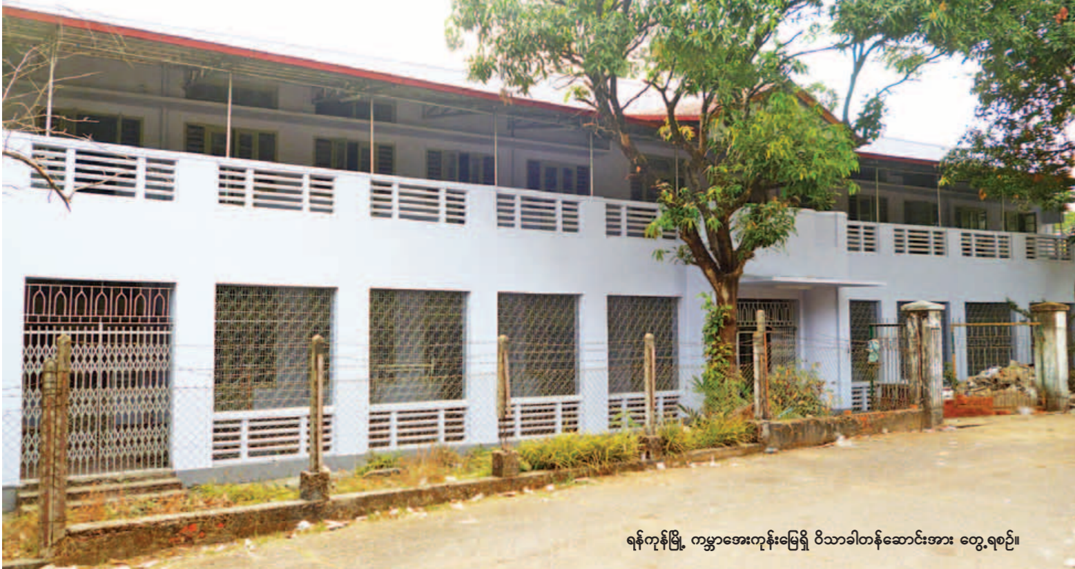
ရန်ကုန်မြို့ ကမ္ဘာ့အေးကုန်းမြေရိ ဝိသာခါတန်ဆောင်းအား တွေ့ရစဉ်။

မေး။ ဘုန်းတော်ကြီးသင် ပညာရေးကျောင်းတွေက အစိုးရကျောင်းတွေလို ဖြစ်လာအောင်လုပ်ဆောင်နေကြပါသလား။ ဖြေ။ လိုင်းချင်းမတူပါဘူး။ အစိုးရကျောင်းတွေမှာ ကျောင်းပေးနေတဲ့ ဆရာဆရာမတွေက တာဝန်ထမ်းဆောင်တဲ့ ဝန်ထမ်းဆရာဆရာမတွေနဲ့ တစ်ပြေးညီမဟုတ်ရင်တောင်ပိုသင့်တင့်လျောက်ပတ်တဲ့ မိသားစုအတွက် အထောက်အပံ့ဖြစ်ဖို့ တိုးမြှင့်ထောက်ပံ့မှုတွေကို ပြည်ထောင်စုအစိုးရအဖွဲ့ကို တင်ပြပြီးမှ ဘတ်ဂျက်တွေကနေတစ်ဆင့် ထောက်ပံ့သွားဖို့ အစီအစဉ်ရှိပါတယ်။