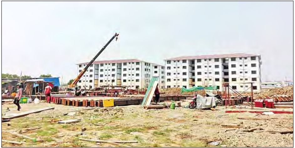
ရန်ကုန်တိုင်းဒေသကြီး လှိုင်သာယာမြို့နယ် ရွှေလင်ဗန်းစက်မှုဇုန်ရှိ တန်ဖိုးနည်းအိမ်ရာကို မတ်လအတွင်းက တွေ့ရစဉ်။

ထပ်မံဖြည့်ဆည်းပေးမည့် အစီအမံများနှင့်ပတ်သက်၍ လည်းကောင်း တင်ပြဆွေးနွေး၍ အစည်းအဝေးတက်ရောက် သူများက လိုအပ်သည်များ ပိုင်းဝန်းအကြံပြုဆွေးနွေးခဲ့ ကြသည်။ ပြည်ထောင်စုဝန်ကြီးက ဆွေးနွေးချက်များအပေါ် လိုအပ်သည်များ ပံ့ပိုးပေးမည်ဖြစ်ကြောင်း၊ သဘာဝ ဘေးတုံ့ပြန်ဆောင်ရွက်ရေးအတွက် အားလုံးပိုင်းဝန်းညှိနှိုင်း ဆောင်ရွက်ရန်လိုကြောင်း ပြောကြားသည်။ (သတင်းစဉ်)