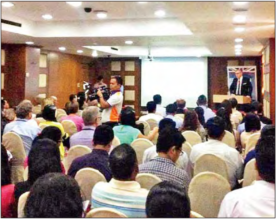
မြန်မာနိုင်ငံဆိုင်ရာ ဗြိတိသျှသံအမတ်ကြီးက အမှာစကားပြောကြားစဉ်။

ဖြေ။ ဒါကတော့ ကျောင်းသားတွေဘက်က အချိန် ရင်းနှီးမြှုပ်နှံတယ်ဆိုတာက လတ်တလော သတင်းတွေ၊ ဂျာနယ်တွေပေါ်မှာ မြင်နေရတဲ့ အခွင့်အလမ်းတွေပေါ်မှာမူထည့်နေပါတယ်။ ဖုန်းတွေအသုံးပြုတာ များလာတယ်။ အင်တာနက်လည်းရနေတော့ Telecom ကဏ္ဍပါ။ IT ကလည်း အများကြီးအလားအလာရှိလာတယ်။