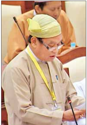
ကျန်းမာရေးဝန်ကြီးဌာန ပြည်ထောင်စုဝန်ကြီး ဒေါက်တာမြင့်ထွေး။

အသုတ်လိုက်ထုတ်လုပ်ရာတွင် Lot Release Certificate များ ရရှိပါက အဆိုပါစက်ရုံမှဝယ်ယူ၍ မွေးကင်းစကလေးငယ်များအတွက်သုံးစွဲရန် ညှိနှိုင်းဆောင်ရွက်သွားမည်ဖြစ်ကြောင်းနှင့် ယခုအခါ Lot Release Certificate မရှိသေးကြောင်း။