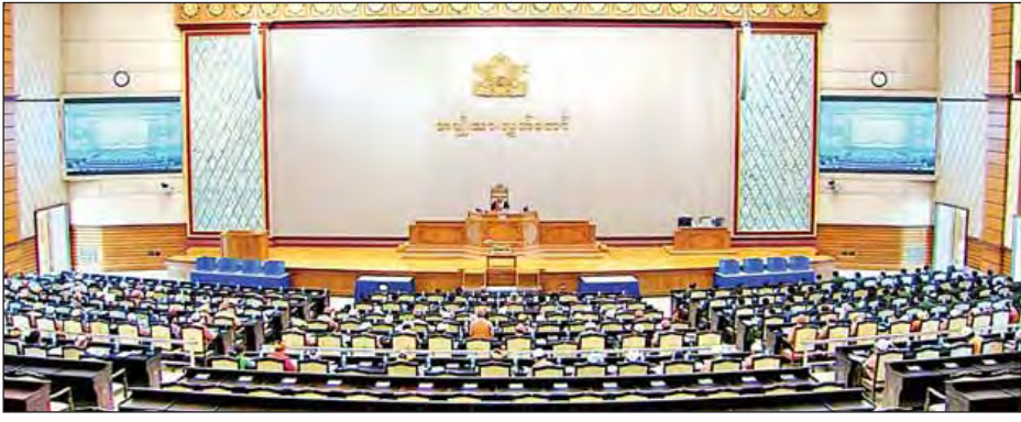
ဒုတိယအကြိမ်အမျိုးသားလွှတ်တော် ပထမပုံမှန်အစည်းအဝေး ၂၇ ရက်မြောက်နေ့ကျင်းပစဉ်။

နေပြည်တော် မေ ၂၀ ပြည်သူ့လွှတ်တော်က ပြင်ဆင်ချက်မရှိ အတည်ပြုပေးပို့လာသည့် နိုင်ငံတော် အား နှောင့်ယှက်ဖျက်ဆီးလိုသူများ၏ ဘေးအန္တရာယ်မှ ကာကွယ်စောင့် ရှောက်သည့်ဥပဒေကို ရုပ်သိမ်းသည့် ဥပဒေကြမ်းနှင့်စပ်လျဉ်း၍ လွှတ်တော် ဥက္ကဋ္ဌက ကန့်ကွက်သူမရှိသည့် အတွက် ပြည်သူ့လွှတ်တော်၏ အတည် ပြုချက်အတိုင်း အတည်ပြုကြောင်း ယနေ့ကျင်းပသည့် အမျိုးသားလွှတ် တော် အစည်းအဝေး ၂၇ ရက်မြောက် နေ့တွင် ကြေညာသည်။