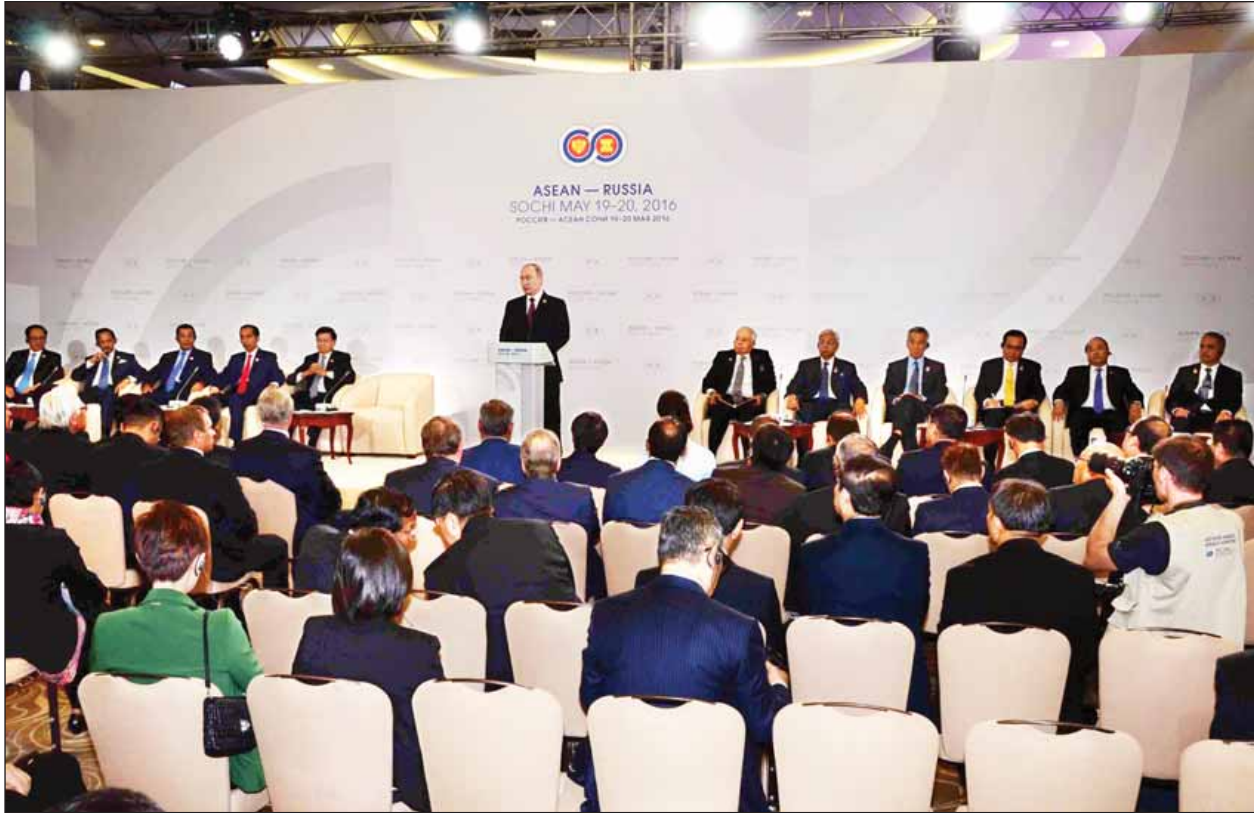
အာဆီယံနှင့်ရုရှားနိုင်ငံတို့မှ နိုင်ငံခေါင်းဆောင်များ၊ အစိုးရအဖွဲ့ အကြီးအကဲများနှင့် စီးပွားရေးဖိုရမ်ကိုယ်စားလှယ်များ တွေ့ဆုံပွဲကျင်းပစဉ်။

ဆိုချိကြေညာချက်တွင် အဓိကအားဖြင့် မိတ်ဖက်ဆက်ဆံရေး တိုးတက် အောင် ဆက်လက်ဆောင်ရွက်ရန်ကိစ္စ၊ နိုင်ငံရေးနှင့် လုံခြုံရေးဆိုင်ရာ ပူးပေါင်း ဆောင်ရွက်ရေးကိစ္စ၊ စီးပွားရေးပူးပေါင်းဆောင်ရွက်ရေးကိစ္စ၊ လူမှုရေးနှင့် ယဉ်ကျေးမှုဆိုင်ရာ ပူးပေါင်းဆောင်ရွက်ရေးကိစ္စ၊ ဖွံ့ဖြိုးတိုးတက်မှုကွာဟမှု နည်းပါးစေရေးနှင့် ပေါင်းစည်းဆက်သွယ်ရေးကိစ္စ၊ ပူးပေါင်းဆောင်ရွက်မှုများ သဘောတူညီချက်များအပေါ် အကောင်အထည်ဖော်ဆောင်ရွက်စွမ်းရည်များ ပါဝင်ကြောင်း သိရသည်။ (သတင်းစဉ်)