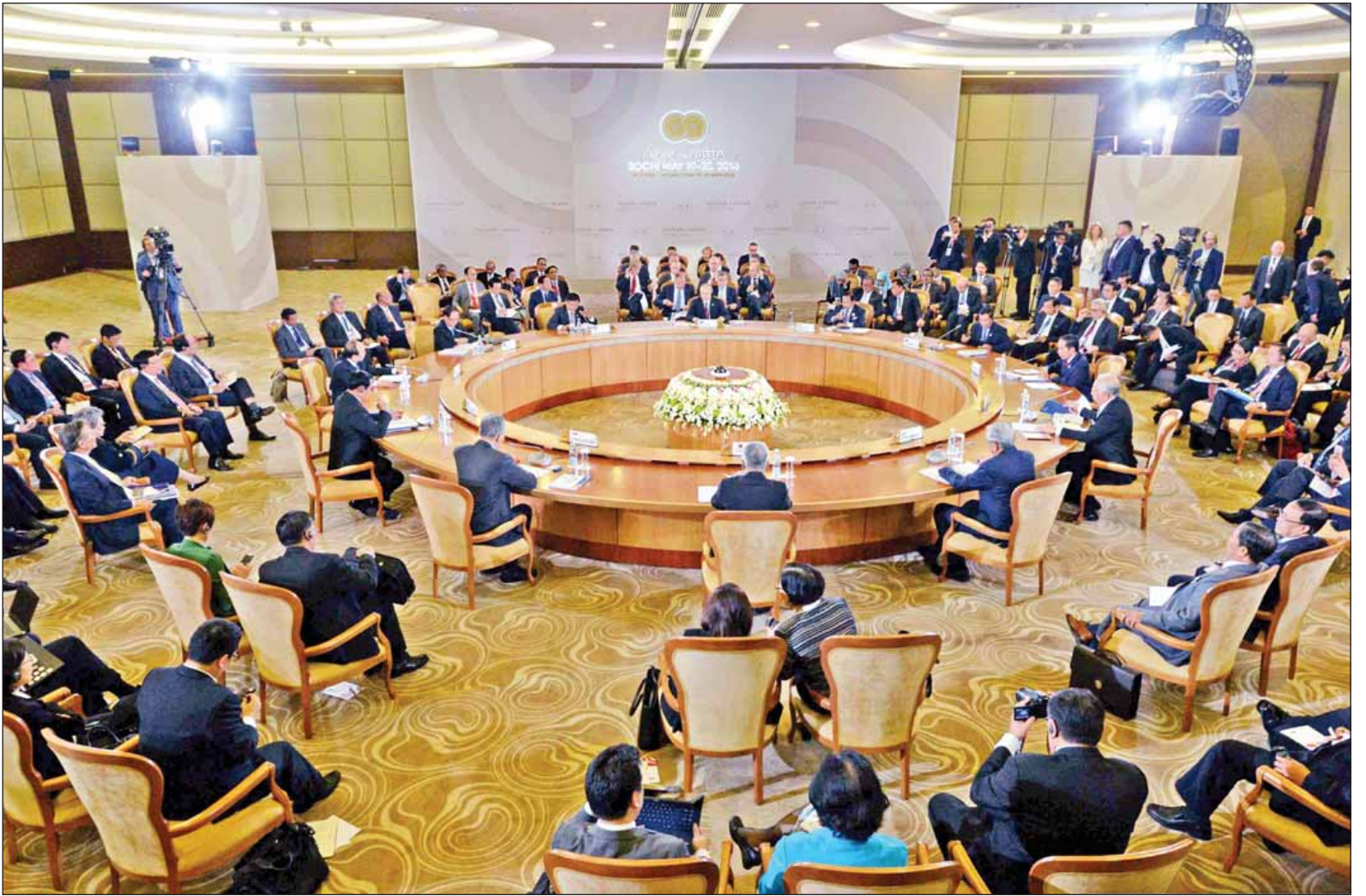
နှစ်(၂၀)ပြည့် အာဆီယံ-ရုရှား ဆွေးနွေးဖက်ဆက်ဆံရေးအထိမ်းအမှတ် ထိပ်သီးအစည်းအဝေးကျင်းပစဉ်။

ထိပ်သီးအစည်းအဝေးတွင် နိုင်ငံတော်သမ္မတ ဦးထင်ကျော်က ဆွေးနွေးပြောကြားရာတွင် ဤအစည်းအဝေးသည် အာဆီယံ-ရုရှားဆက်ဆံရေးတွင် အဓိကကျသောမှတ်တိုင်တစ်ခု စာမျက်နှာ ၃ ကော်လံ ၁ သို့ *