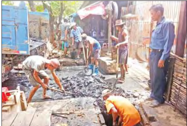
ကိုကျော်(သုံးခွ)

ရန်ကုန် မေ ၂၀ ရန်ကုန်တိုင်းဒေသကြီး သုံးခွမြို့နယ် စည်ပင်သာယာရေးအဖွဲ့မှ ပြည်သူ့အတွက် ရက် ၁၀၀ အကျိုးပြုလုပ်ငန်းစီမံချက်ဖြင့် မြို့မေ့မရမည့် ရေစီးရေလှာမြေပေါ်များ၊ ရေစီးရေလှာကောင်းမွန်စေရေး၊ ဈေးအတွင်း ရေကြီးရေလျှံမှု မဖြစ်ပေါ်စေရေးအတွက် ယနေ့နံနက်က ရေစုတ်မြောင်းများအတွင်း ပိတ်ဆို့နေသော ရွှံ့ညွှန်များ၊ နန်းမြေများ၊ အမှိုက်သရိုက်များအား သန့်ရှင်းရေး ဝန်ထမ်းများက မိုးရာသီမရောက်ခင် ကြိုတင်၍ ဆယ်ယူရှင်းလင်း၊ ဖယ်ရှားလျက်ရှိကြောင်း သိရသည်။