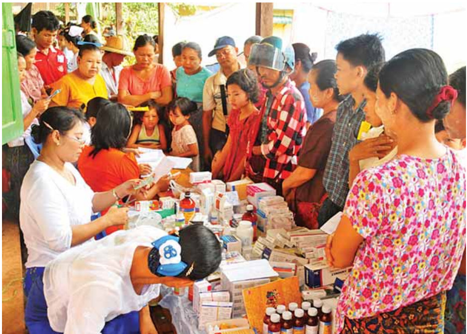
အခမဲ့စစ်ဆေးကုသပေးခြင်းနှင့် ကျန်းမာရေးအသိပညာ ဆောင်ရွက်သွားရန် စီစဉ်ထားကြောင်း သထုံခရိုင် လေးဟောပြောခြင်းများ ပြုလုပ်ခဲ့ကြပြီး သထုံမြို့နယ်အတွင်း ကျန်းမာရေးဦးစီးဌာနမှ သိရသည်။

အဆိုပါနေ့တွင် သထုံဆေးရုံနှင့် မော်လမြိုင်ဆေးရုံတို့မှ အထွေထွေရောဂါ၊ မျက်စိ၊ နား၊ နှာခေါင်း၊ လည်ချောင်း၊ သားဖွားမီးယပ်၊ ခွဲစိတ်၊ ကလေး၊ သွားနှင့်ခံတွင်း စသည့် အထူးကုသမားတော်ကြီးများ၊ တီဘီရောဂါ၊ ဓာတ်မှန်၊ ဓာတ်ခွဲ၊ ဆေးဝါး၊ အရိုးအကြော၊ မျက်မှန်ကျမ်းကျင်ပညာရှင်များအပြင် တိုင်းရင်းဆေးသမားတော်များပါ ပူးပေါင်းပါဝင်သည့် ကျန်းမာရေးဝန်ထမ်းပေါင်း ၆၀ ခန့်က ကျေးရွာ ၁၅ ရွာမှ ဒေသခံပြည်သူ ၁၅၀၀ ကျော်အား