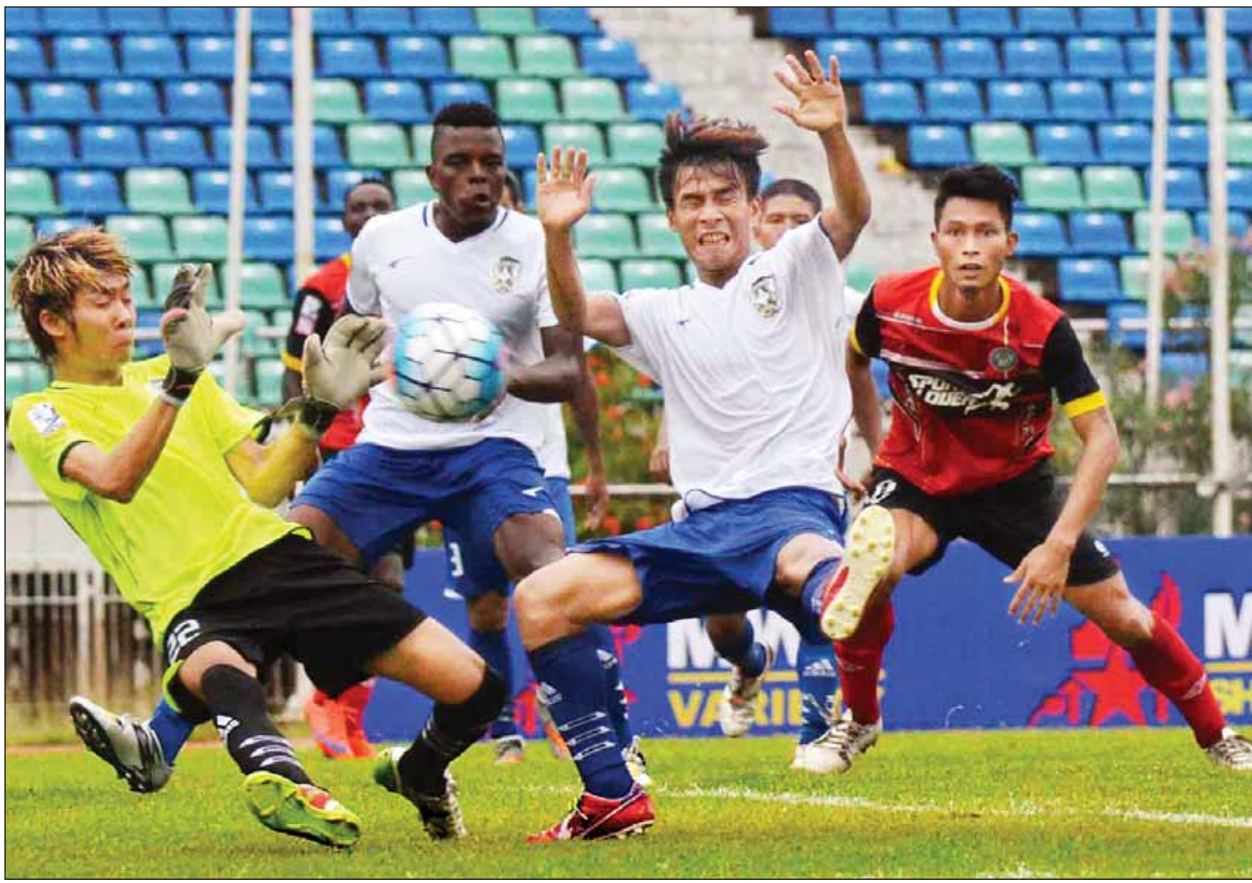
မဟာယူနိုက်တက်အသင်း၏ ရိုးသွင်းရန်ကြိုးပမ်းမှုကို သန်လျင်ယူနိုက်တက်ရိုးသမား ကာကွယ်နေစဉ်။