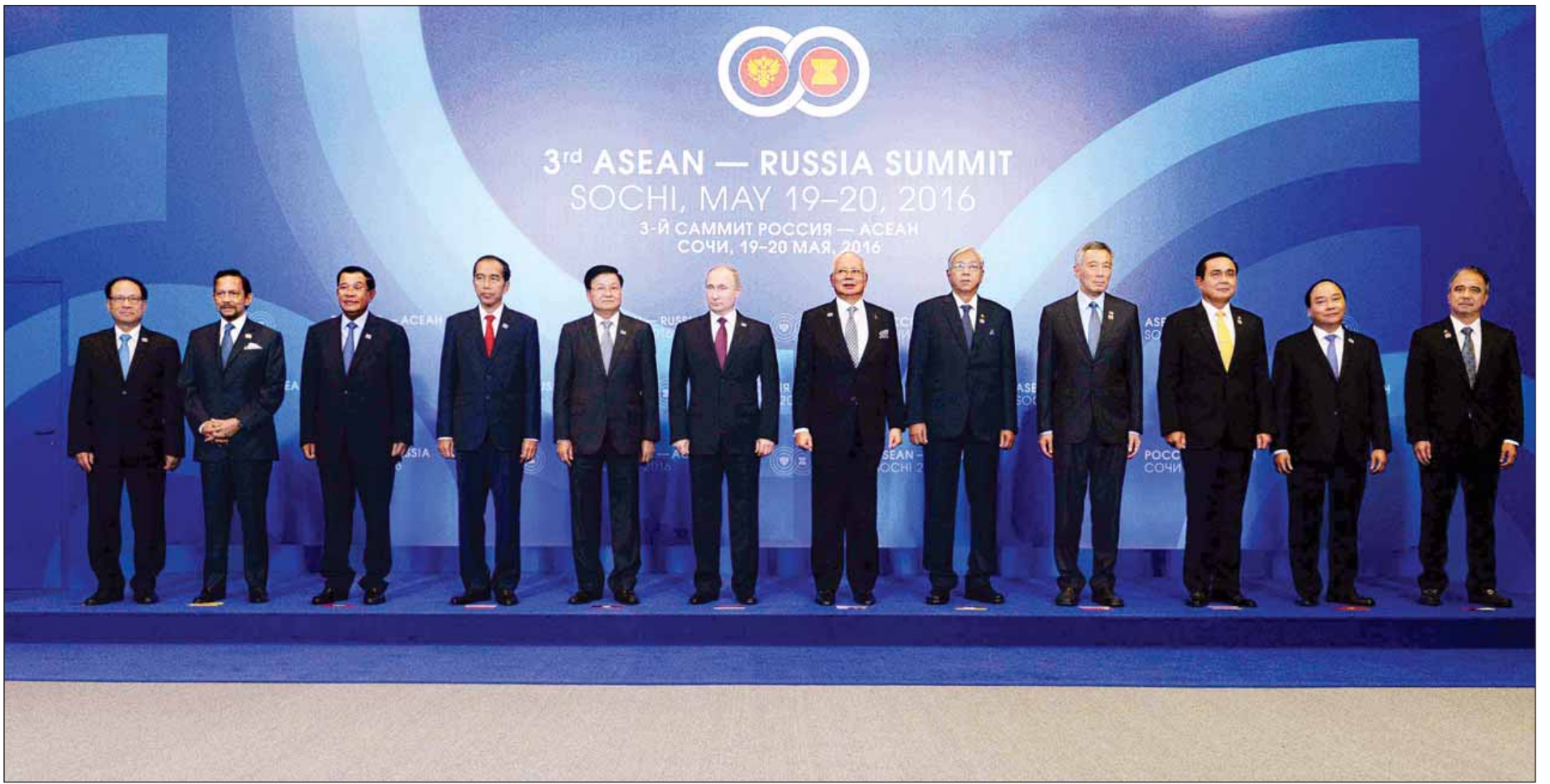
နှစ်(၂၀)ပြည့် အာဆီယံ-ရုရှား ဆွေးနွေးဖက်ဆက်ဆံရေးအထိမ်းအမှတ် ထိပ်သီးအစည်းအဝေးတွင် ရုရှားဖက်ဒရေးရှင်းနိုင်ငံသမ္မတ မစ္စတာ ဗလာဒီမာပူတင်နှင့် အာဆီယံနိုင်ငံများမှ ခေါင်းဆောင်များ စုပေါင်းမှတ်တမ်းတင်ဓာတ်ပုံ ရိုက်စဉ်။

* ရှေ့ဖူးမှု ဖြစ်ကြောင်း၊ ရုရှားနိုင်ငံသည် အာဆီယံနိုင်ငံများအတွက် အရေးကြီးသည့် မိတ်ဖက်ဆက်ဆံရေးနိုင်ငံ တစ်နိုင်ငံဖြစ်ကြောင်း။