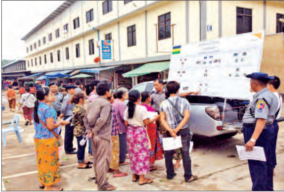
တာချီလိတ်မြို့၊ ဝမ်းကောင်းရပ်ကွက် ဘုရင့်နောင်ဈေးတွင် လူကုန်ကူးမှုတားဆီးကာကွယ်ရေး အသိပညာပေး လက်ကမ်းစာစောင်ဖြန့်ဝေနေစဉ်။

မြန်မာနိုင်ငံရဲ့တပ်ဖွဲ့၊ လူကုန်ကူးမှုတားဆီးနိုင်ရန် ရေးရဲတပ်ဖွဲ့သည် လူကုန်ကူးမှုများ မဖြစ်ပွားစေရေး၊ လူကုန်ကူးမခံရစေရေး အသိပညာပေးခြင်းနှင့် လူကုန်ကူးသူပွဲစားများကို ထိရောက်စွာအရေးယူနိုင်ရေးတို့ အတွက် ရက် ၁၀၀ စီမံချက်ကို မေ ၁ ရက်မှ ဩဂုတ် ၈ ရက်အထိ အကောင်အထည်ဖော်ဆောင်ရွက်လျက်ရှိရာ မေ ၁၅ ရက်တွင် နေပြည်တော်၌ အစောင့် ၄၀၀၊ ကချင်ပြည်နယ်၌ အစောင့် ၁၀၀၀၊ ကယားပြည်နယ်၌ အစောင့် ၆၀၊ ကရင်ပြည်နယ်၌ အစောင့် ၁၂၀၀၊ ချင်းပြည်နယ်၌ ၉၅၀၊ စစ်ကိုင်းတိုင်းဒေသကြီး၌ အစောင့် ၂၄၀၀၊ တနင်္သာရီတိုင်းဒေသကြီး၌ အစောင့် ၁၂၀၊ ပဲခူးတိုင်းဒေသကြီး၌ အစောင့် ၁၀၀၀ မန္တလေးတိုင်းဒေသကြီး၌ အစောင့် ၁၄၀၀၊ မွန်ပြည်နယ်၌ အစောင့် ၄၀၀၊ ရခိုင်ပြည်နယ်၌ အစောင့် ၁၂၀၊ ရန်ကုန်တိုင်းဒေသကြီး၌ အစောင့် ၇၀၀၊ ရှမ်းပြည်နယ်၌ အစောင့် ၄၀၀၊ ဧရာဝတီတိုင်းဒေသကြီး၌ အစောင့် ၅၂၀ စုစုပေါင်း လူကုန်ကူးမှု တားဆီးကာကွယ်ရေး အသိပညာပေး လက်ကမ်းစာစောင် ပေါင်း အစောင့် ၁၃၆၀၂ ဖြန့်ဝေပေးခဲ့သည်။