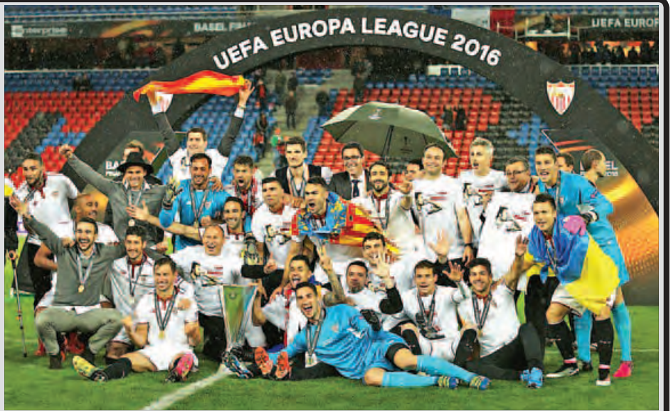
ကစားခဲ့ရာတွင် တစ်ဖက်တစ်ဂိုးစီ သရေရလဒ်ထွက်ပေါ်ခဲ့ခြင်းကြောင့် ပင်နယ်တီအဆုံးအဖြတ်ခံယူခဲ့ရာတွင် မန်စီးတီးအသင်းကို ရှုံးနိမ့်ခဲ့ရသည်။ ထို့ပြင် ယခုယူရိုပါလိဂ်နောက်ဆုံးပိုလ်လုပွဲတွင် ဆီဗီလာအသင်းအား သုံးဂိုး-တစ်ဂိုးဖြင့် ထပ်မံရှုံးနိမ့်ခဲ့ခြင်းဖြစ်သည်။ ဆီဗီလာအသင်းမှာ ဥရောပဖလား၊ ယူရိုပါလိဂ်ဖလား နောက်ဆုံး ၁၁ ကြိမ်အထိ ပိုလ်လုပွဲအထိ တက်လှမ်းနိုင်ခဲ့ရာတွင် ငါးကြိမ်အထိ ဖလားဆွတ်ခူးထားနိုင်ခဲ့သည့်အသင်းလည်းဖြစ်လာခဲ့သည်။ (ဧကွယ်)

လက်ရှိလီဗာပူးအသင်းနည်းပြဖြစ်လာချိန်တွင်လည်း ကတိဝိတယ်ဝမ်းဖလားပြိုင်ပွဲနောက်ဆုံးပိုလ်လုပွဲတွင် မန်စီးတီးအသင်းနှင့် လီဗာပူးအသင်းတို့ယှဉ်ပြိုင်