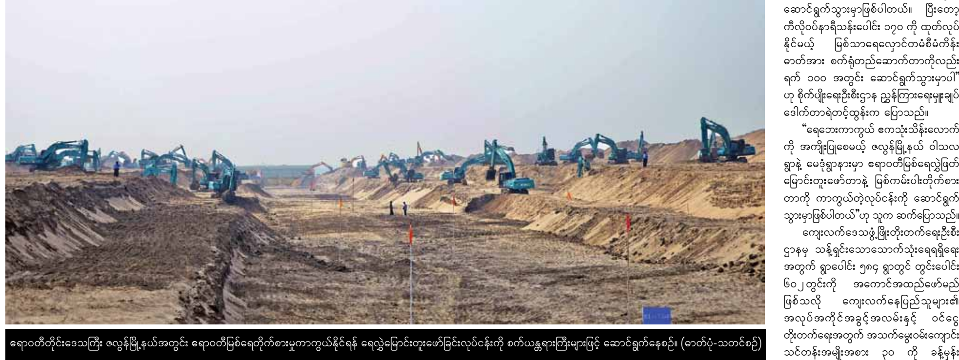
ဧရာဝတီတိုင်းဒေသကြီး၊ လေ့ရှိမြို့နယ်အတွင်း ဧရာဝတီမြစ်ရေတိုက်စားမှုကာကွယ်နိုင်ရန် ရေလွှဲမြောင်းတူးဖော်ခြင်းလုပ်ငန်းကို စက်ယန္တရားကြီးများဖြင့် ဆောင်ရွက်နေစဉ်။

ရက် ၁၀၀ စီမံကိန်းအောက်တွင် ရန်ကုန်နှင့် မန္တလေးတို့၌ အသေးစားစက်မှုလက်မှုထုတ်ကုန်ပစ္စည်းပြုလုပ်ရေး ဈေးရောင်းပွဲတော်ကို အသေးစားစက်မှုလက်မှု လုပ်ငန်းဦးစီးဌာနမှ ကျင်းပသွားမည်ဖြစ်သလို ကျေးလက်နေပြည်သူများအတွက် အသက်မွေးဝမ်းကျောင်း မြန်မြန် ဆောင်ရွက်နိုင်ရန်ရန်ရွယ်၍ စာချုပ်တစ်စာတမ်းမှတ်ပုံတင်စာအုပ်များ လက်ရောက်