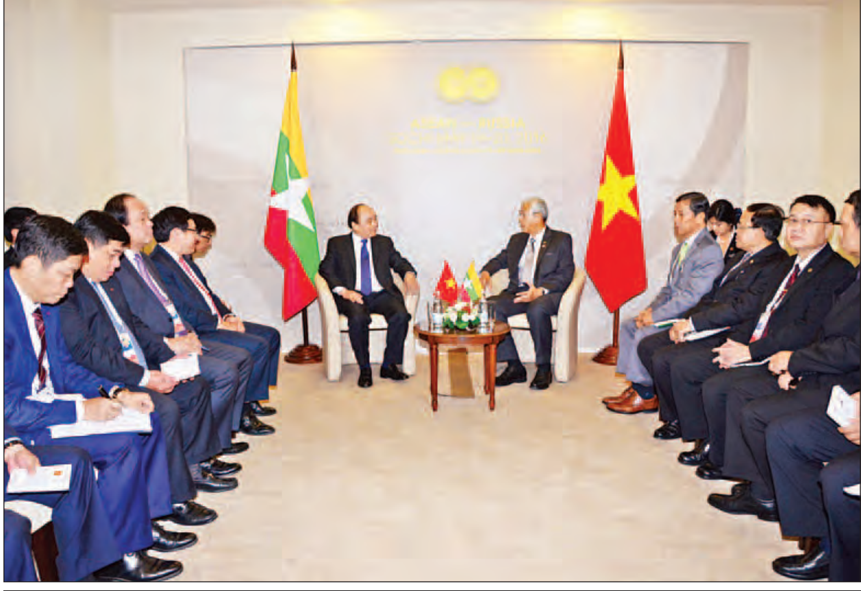
နိုင်ငံတော်သမ္မတ ဦးထင်ကျော် ဗီယက်နမ်ဆိုရှယ်လစ်သမ္မတနိုင်ငံ ဝန်ကြီးချုပ် မစ္စတာ ငုယင်ရွမ်ဖတ်နှင့် တွေ့ဆုံဆွေးနွေးစဉ်။ (သတင်းစဉ်)

မြန်မာနိုင်ငံသည် ဗီယက်နမ်နိုင်ငံနှင့် ၁၉၇၅ ခုနှစ်ကတည်းက သံတမန် ဆက်သွယ်မှု စတင်တည်ထောင်ခဲ့သည့် နိုင်ငံဖြစ်ပြီး နှစ်နိုင်ငံအကြား ဘဏ် လုပ်ငန်းတွင် နှစ်ဖက်နားလည်မှုစာချွန်လွှာကို လက်မှတ်ရေးထိုးထား ကြောင်း၊ နှစ်နိုင်ငံပူးပေါင်းဆောင်ရွက်မှု ပူးတွဲကော်မရှင်နှင့် နိုင်ငံခြားရေး ဝန်ကြီးများအဆင့် မူဝါဒရေးရာများကို ထူထောင်ပြီးဖြစ်ကြောင်း သိရသည်။ (သတင်းစဉ်)