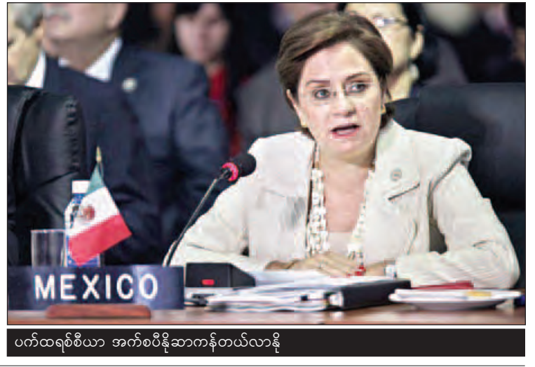
ပက်ထရစ်စီယာ အက်စပီနိုဆာကန်တယ်လာနို

ကုလသမဂ္ဂရာသီဥတုပြောင်းလဲခြင်းဆိုင်ရာ မူဘောင် ကွန်ပင်းရှင်းသည် ၁၉၉၄ ခုနှစ်တွင် အာဏာသက်ဝင်လာခဲ့သော နိုင်ငံတကာသဘာဝပတ်ဝန်းကျင် ထိန်းသိမ်းရေး စာချုပ်တစ်ရပ် ဖြစ်သည်။ ဆင်ယွာ။