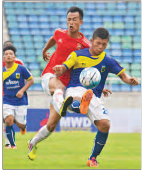
တက္ကသိုလ်လက်ရွေးစင်အသင်းနှင့် နေပြည်တော်အသင်းတို့ ယှဉ်ပြိုင်နေစဉ်။

ပြီးခဲ့သည့်ရာသီများက MNL တွင် ရလဒ်ကောင်းများ ရယူနိုင်ခဲ့သော်လည်း ၂၀၁၅ ရာသီကုန်တွင် တန်းဆင်း ခဲ့ရသည့် နေပြည်တော်အသင်းမှာ ယခုပြိုင်ပွဲတွင် ဒုတိယ အဆင့် တက်ရောက်နိုင်ခဲ့သော်လည်း ခက်ခက်ခဲခဲရုန်းကန် ခဲ့ရသည်။ စာမျက်နှာ ၉ ကော်လံ ၃ သို့ ၀