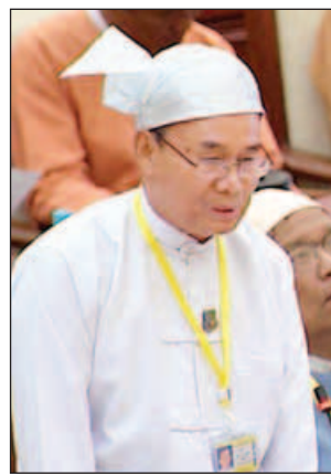
ပြည်ထောင်စုဝန်ကြီး ဦးအုန်းဝင်း

လျက်ရှိပြီး အကြံဉာဏ်ပေးခြင်း၊ အကြံပြုခြင်းတို့ဆောင်ရွက်လျက်ရှိပါကြောင်း ဖြေကြားသည်။ မောက်မယ်မဲဆန္ဒနယ်မှ ဦးစိုင်းဇော်အောင်က မောက်မယ်မြို့နယ်တွင်(GSM) ဖုန်းလိုင်းများ မည်သည့်အချိန်၌ အသုံးပြုခွင့်ရရှိနိုင်မည်နည်း မေးမြန်းချက်အပေါ် ပို့ဆောင်ရေးနှင့်ဆက်သွယ်ရေးဝန်ကြီးဌာန ပြည်ထောင်စုဝန်ကြီး ဦးသန့်စင်မောင်က မောက်မယ်မြို့နယ် ဟိုနန်ရွာအနီးတွင် GSM စနစ်ရရှိစေရန် တယ်လီနော၏ တာဝါကို ငှားရမ်းတပ်ဆင် သုံးစွဲသွား