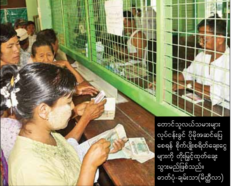
တောင်သူလယ်သမားများ လုပ်ငန်းခွင် ပိုမိုအဆင်ပြေစေရန် စိုက်ပျိုးစိုက်ပျိုးရေးနှင့် မွေးမြူရေးဦးစီးဌာနမှ ကျင်းပသည့် အသက်မွေးဝမ်းကျောင်းသင်တန်းအမျိုးအစား ၃၀ ကို ခန့်မှန်း