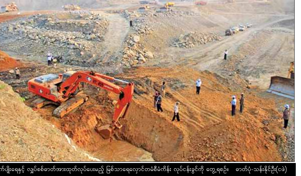
စိုက်ပျိုးရေးနှင့် လျှပ်စစ်ဓာတ်အားထုတ်လုပ်ပေးမည့် မြစ်သာရေလှောင်တစ်စီမံကိန်း လုပ်ငန်းခွင်ကို တွေ့ရစဉ်။