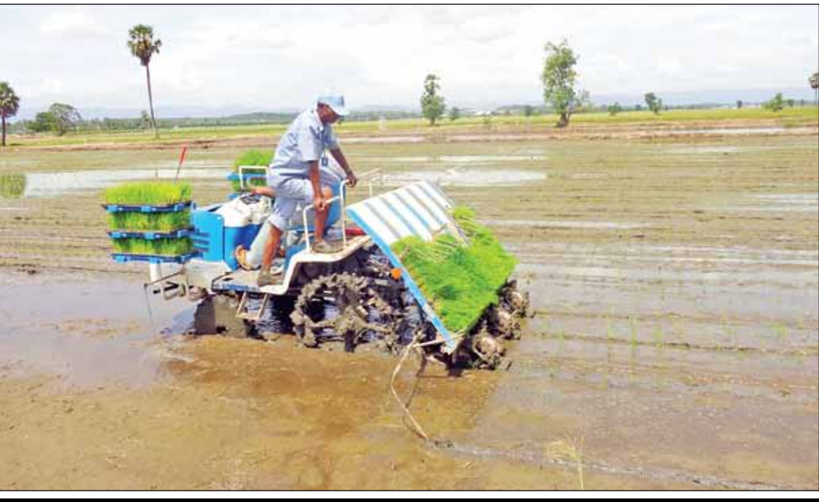
လယ်ယာစိုက်ပျိုးရေးကဏ္ဍတွင် ခေတ်မီကောက်စိုက်စက်ဖြင့် လုပ်ငန်းခွင်ဝင်နေသည်ကို တွေ့ရစဉ်။

တနင်္သာရီနှင့် စစ်ကိုင်းတိုင်းဒေသကြီးမှ ကျေးရွာ ၁၀၀ တွင် ဆောင်ရွက်သွားမည်ဖြစ်သည်။ စီမံကိန်းပါကျေးရွာများ၏ ကျေးရွာဖွံ့ဖြိုးတိုးတက်မှုလုပ်ဆောင်နိုင်စွမ်းကို အကဲဖြတ် သုံးသပ်ပြီး တိုးတက်မှုရှိသည့် ကျေးရွာများကို အမေရိကန်ဒေါ်လာ ၄၀၀၀၀ ထပ်မံပံ့ပိုးသွားမည်။ အမေရိကန်ဒေါ်လာ ၂၂ သန်း ကူညီထောက်ပံ့သွားမည့် KOICA ၏ အဆိုပါစီမံကိန်းသည် ငါးနှစ်ကြာမြင့်မည်ဖြစ်သည်။ လက်မှုလယ်ယာစနစ်မှ စက်မှုလယ်ယာစနစ်သို့ ကူးပြောင်းရေးအတွက် စက်မှုလယ်ယာဦးစီးဌာနမှ ဝန်ဆောင်မှုအဖြစ် တိုင်းဒေသကြီး၊ ပြည်နယ်များရှိ ဌာနပိုင်ထွန်စက် ၁၂၂၃ စီးကို အသုံးပြု၍ မြို့နယ်ပေါင်း ၁၄၀ တွင် စက် ၁၉၃၄၉၀၊ စိုက်သိမ်းခြွေလှေ့စေ့ဝန်ဆောင်မှုအဖြစ် နွေစပါးစိုက်ပျိုးနိုင်သည့် မြို့နယ်ပေါင်း ၄၆ မြို့နယ်တွင် ဌာနပိုင်ဆိုင်ဆောင်ရွက်သိမ်းခြွေလှေ့စက် ၁၈၃ စီးအသုံးပြု၍ ၇၇၇၇ ဧက ဆောင်ရွက်သွားမည်။ နည်းပညာဝေမျှသည့်အသွင်ဖြင့် ဌာနပိုင်ကောက်စိုက်စက် ၃၃ စီးကို အသုံးပြု၍ နွေစပါး ဖြစ်စေစိုက်ပျိုးမည့် တိုင်းဒေသကြီးနှင့် ပြည်နယ် ၁၀ ခုမှ မြို့နယ် ၁၂ မြို့နယ်တွင် ၂၄၄ ဧက စိုက်ပျိုးသွားမည်ဖြစ်သည်။ စနစ်ကျစက်မှုလယ်ယာမြေများ ဖော်ထုတ်