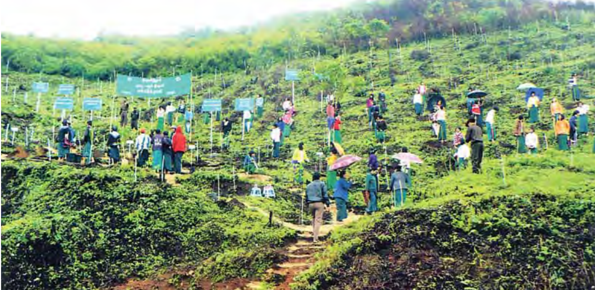
သဘာဝပတ်ဝန်းကျင်ပျက်စီးမှုကို ကုစားရန်နှင့် ဒေသစိမ်းလန်းစိုပြည်စေရန် ဤကဲ့သို့သော သစ်ပင်စိုက်ပျိုးမှုများကို စီမံချက်ချမှတ်ပျိုးသွားရန်လိုအပ်သည်။

အစိုးရသစ်၏ ရက် ၁၀၀ စီမံကိန်းအောက်တွင် သယံဇာတနှင့် သဘာဝပတ်ဝန်းကျင်ထိန်းသိမ်းရေးဝန်ကြီးဌာနက ဓာတ်သတ္တုထုတ်လုပ်မှုအတွက် အလက်များ ထုတ်ပြန်ခြင်းနှင့် ဓာတ်သတ္တုဖြစ်ထွန်းမှုစနစ်တည်ဆောက်ခြင်း၊ ချင်းပြည်နယ်တွင် ခရိုမီယံသတ္တုဖြစ်ထွန်းမှုများအပေါ် သုတေသနပြုလုပ်ခြင်း၊ မကြာခင်ဖြစ်ပေါ်နေသည့် ဖားကန့်မြေစာပုံပြိုကျမှုအပေါ် အရေးယူဆောင်ရွက်မှုများ၊ ပဓာနလျော့ကျလာနေသော သစ်တောကဏ္ဍမှ ထုတ်ယူသုံးစွဲမှုလျော့ချခြင်းနှင့် သစ်အချောထည်လုပ်ငန်းများတိုးမြှင့်ခြင်း၊ သစ်၊ တောရိုင်းတိရစ္ဆာန်နှင့် သဘာဝအပင်များခိုးထုတ်မှုများ လျော့နည်းရေးနှင့် အများပြည်သူနှင့် သက်ဆိုင်ရာနေရာများတွင် Green Environment Campaign အစီအစဉ်ဖြင့် သစ်ပင်စိုက်ပျိုးမှုများနှင့် လောင်စာလိုအပ်ချက်အတွက် လုပ်ဆောင်မည်ဟုဆိုသည်။