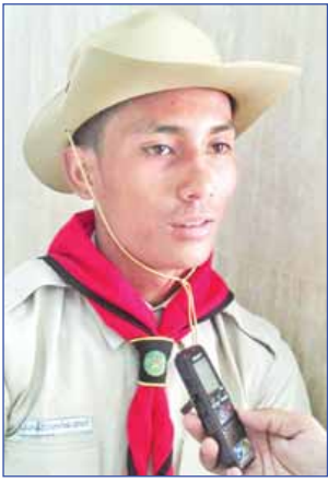
တွေ့ဆုံ ပေးပြန်- မင်းသစ် (သတင်းစဉ်) တက်ပုံ - သန်းဦး (လေးမျက်နှာ)