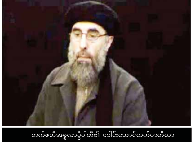
ဟက်မာတီယာ၏ ခေါင်းဆောင်ဟက်မာတီယာ