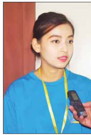
မျိုးသန္တာဦး