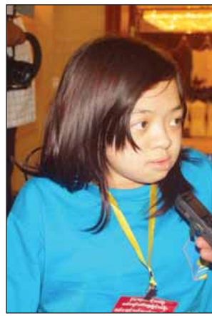
သဇင်ငြိမ်းခေတ်