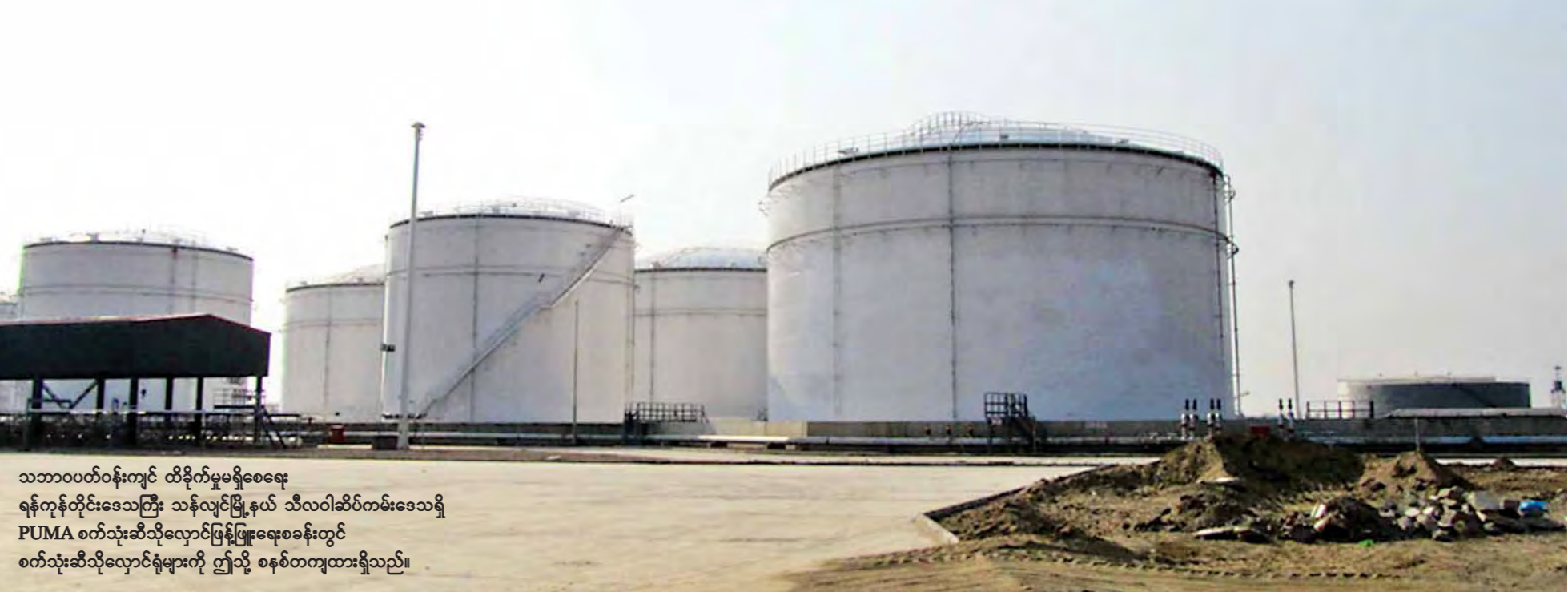
သဘာဝပတ်ဝန်းကျင် ထိခိုက်မှုမရှိစေရေး ရန်ကုန်တိုင်းဒေသကြီး သန်လျင်မြို့နယ် သီလဝါဆိပ်ကမ်းဒေသရှိ PUMA စက်သုံးဆီသိုလှောင်ဖြန့်ဖြူးရေးစခန်းတွင် စက်သုံးဆီသိုလှောင်ရုံများကို ဤသို့ စနစ်တကျထားရှိသည်။