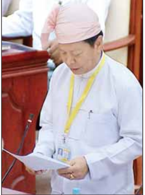
ပြည်ထောင်စုဝန်ကြီး သူရဦးအောင်ကို

ဘုန်းတော်ကြီးသင် ဆရာ ဆရာမများသည် စေတနာ့၊ ဝါသနာအရ ပရဟိတစိတ်ဖြင့် ဆောင်ရွက်နေကြသူများဖြစ်ပြီး ဝန်ထမ်းဖွဲ့စည်းပုံပြဌာန်းချက်နှင့် အကျိုးမဝင်သည့်အတွက် နိုင်ငံ့ဝန်ထမ်းများခံစားခွင့် ရှိသည့် လစာ၊ ထောက်ပံ့ကြေး၊ ခရီးစရိတ်နှင့် အခြားစရိတ်များ ခံစားခွင့်မရှိကြောင်း စလင်းမဲဆန္ဒနယ်မှ ဦးခင်မောင်နှင့် စပ်လျဉ်း၍ သာသနာရေးနှင့် ယဉ်ကျေးမှုဝန်ကြီးဌာန ပြည်ထောင်စုဝန်ကြီးသူရဦးအောင်ကိုယ်စားပြု ယနေ့ ပြည်သူ့လွှတ်တော် အစည်းအဝေးတွင် မြေကြားလိုက်သည်။