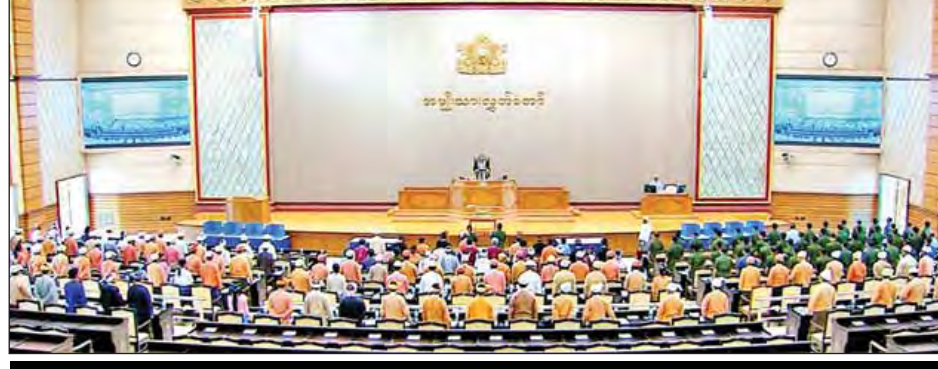
ဒုတိယအကြိမ်အမျိုးသားလွှတ်တော် ပထမပုံမှန်အစည်းအဝေး ၂၅ ရက်မြောက်နေ့ကျင်းပစဉ်။

ယနေ့ကျင်းပသည့် အမျိုးသားလွှတ်တော်အစည်းအဝေးတွင် ပြည်သူ့လွှတ်တော်မှ ပြင်ဆင်ချက်ဖြင့် အတည်ပြုပေးပို့လာသည့် ပြည်သူ့လွှတ်တော်၊ အမျိုးသားလွှတ်တော်နှင့် တိုင်းဒေသကြီး သို့မဟုတ် ပြည်နယ်လွှတ်တော်တို့၏ ရွေးကောက်ပွဲဥပဒေကို စတုတ္ထအကြိမ် ပြင်ဆင်သည့်ဥပဒေကြမ်းများနှင့် စပ်လျဉ်း၍ အမျိုးသားလွှတ်တော် ဥပဒေကြမ်းကော်မတီ၏ အစီရင်ခံစာများကို ကော်မတီဝင်များက ဖတ်ကြားတင်ပြပြီး အမျိုးသားလွှတ်တော် ဥက္ကဋ္ဌ မန်းဝင်းခိုင်သန်းက ဥပဒေကြမ်းကော်မတီ၏ အစီရင်ခံစာများနှင့်စပ်လျဉ်း၍ ဆွေးနွေးလိုသည့် လွှတ်တော်ကိုယ်စားလှယ်များရှိပါက အမည်စာရင်းတင်သွင်းနိုင်ကြောင်း ကြေညာသည်။ အဆိုပါအစီရင်ခံစာများတွင် ပြင်ဆင်ချက်အနေဖြင့် ကြားဖြတ်ရွေးကောက်ပွဲ ကျင်းပခြင်းဆိုင်ရာ သတ်မှတ်ချက်