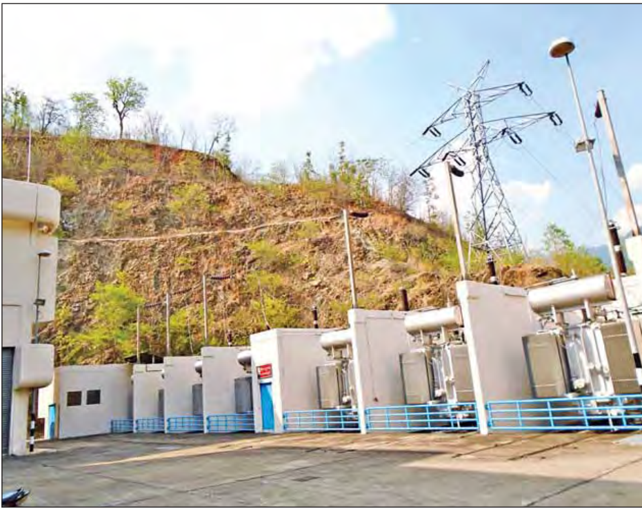
ယခုကင်းတားရေးအားလျှပ်စစ်စက်ရုံ ပိတ်ထားရခြင်းဟာ လည်း အဓိကအနေနဲ့ ကင်းတားရေးလှောင်တံခံအတွင်း ရေဝင်ရောက်မှုနည်းပါးလို့ ရေအားလျှပ်စစ်ထုတ်လုပ်တဲ့

“ဒီရိုင်းအရ အမှန်အတိုင်း လျှပ်စစ်ဓာတ်အား ထုတ်လုပ်ပေးရမှာဆိုရင် တစ်နှစ်ကို ယူနစ်သန်းပေါင်း ၁၆၅ သန်း ထုတ်လုပ်ပေးရမှာပါ။ ရာခိုင်နှုန်းအားဖြင့် လေးပုံတစ်ပုံတောင် မထုတ်လုပ်ပေးနိုင်ခဲ့ပါဘူး။