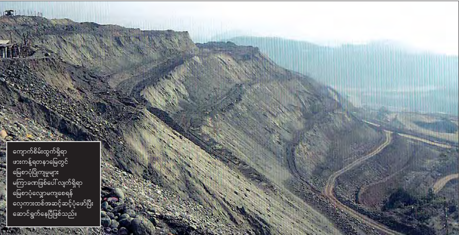
ကျောက်စိမ်းထွက်ရှိရာ ဖားကန့်ရတနာမြေတွင် မြေစာပုံပြိုကျမှုများ မကြာခင်ဖြစ်ပေါ်လျက်ရှိရာ မြေစာပုံလျှော့မကျစေရန် လေ့ကျင့်ထမ်းဆောင်ဆင်ပုံဖော်ပြီး ဆောင်ရွက်နေပြီဖြစ်သည်။