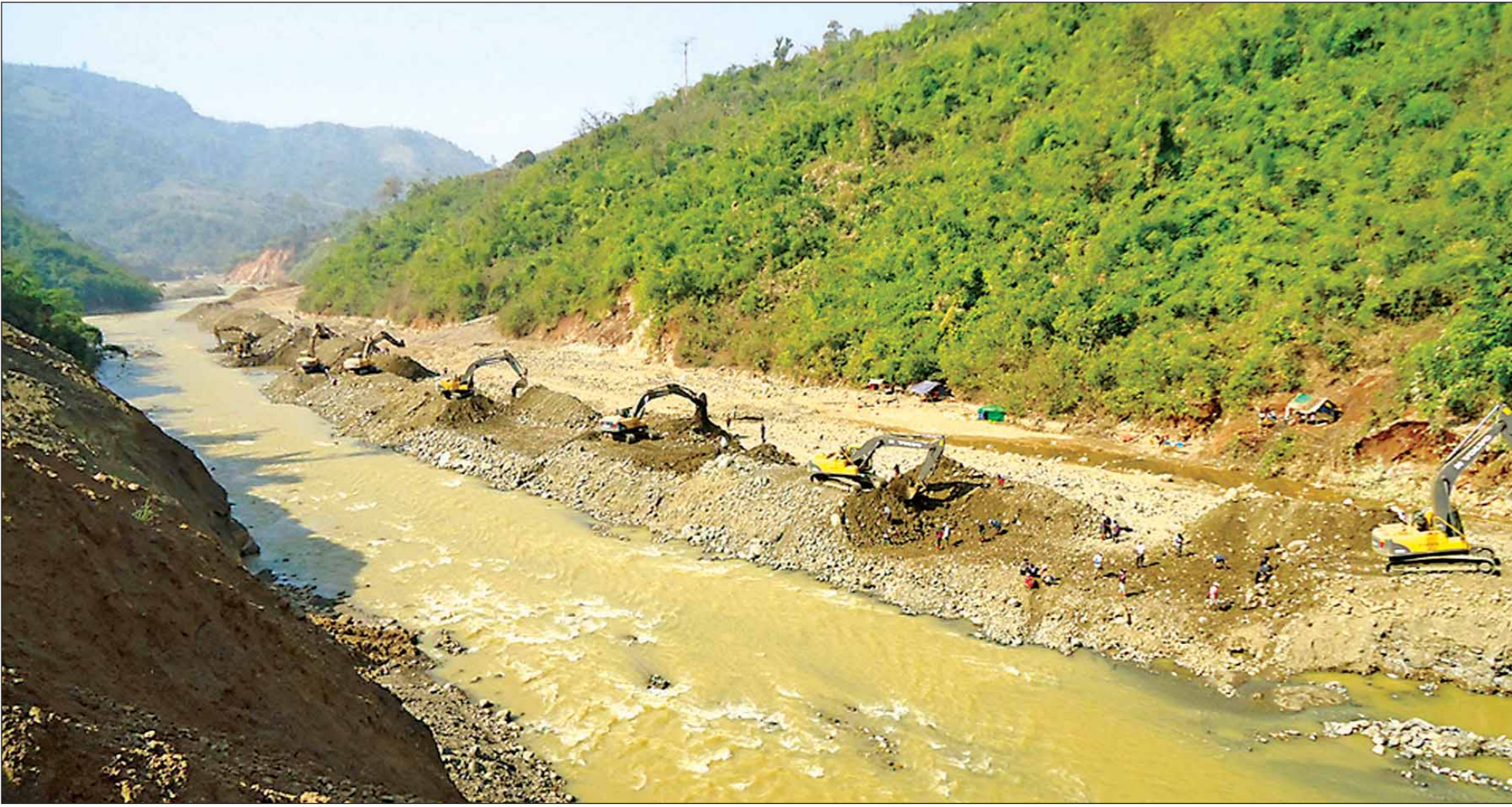
ဓာတ်သတ္တုရှာဖွေတူးဖော်မှုများကြောင့် ဥတုချောင်းမပျက်စီးစေရန် စက်ယန္တရားများအသုံးပြု၍ ရေစီးရေလာကောင်းမွန်အောင် ဆောင်ရွက်လျက်ရှိသည်။