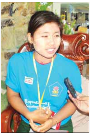
ဖြူဖြူသင်း

မြန်မာနိုင်ငံ တိုင်းဒေသကြီးနဲ့ ပြည်နယ်ဒေသအသီးသီးမှာ ရှိကြတဲ့ အသက်(၁၀)နှစ်ကနေ (၁၉)နှစ်ကြား မှာရှိတဲ့ ဆယ်ကျော်သက်လူငယ်တွေ တွေ့ဆုံကြတာပါ။ သူတို့ကြားမှာ ရှိတဲ့ အခက်အခဲတွေ၊ လိုအပ်ချက် တွေကို ဆွေးနွေးဖော်ထုတ်နိုင်ဖို့ ဒီပွဲကို စီစဉ်တာပါ။ ကျေးလက်ဒေသ က လူငယ်တွေ၊ မသန်စွမ်းဆယ်ကျော် သက် လူငယ်တွေ၊ ကျောင်းတက်နေ တဲ့ ဆယ်ကျော်သက်လူငယ်တွေ၊ ကျောင်းပြင်ပ ရောက်နေတဲ့ ဆယ်ကျော်သက် လူငယ်တွေ၊ အလုပ် လုပ်နေတဲ့ ဆယ်ကျော်သက် လူငယ် တွေ၊ ကင်းထောက်လူငယ်တွေ၊ ကြက်ခြေနီလူငယ်တွေ အားလုံး အယောက် ၄၀၀ကျော် တက်ကြတယ်။ နှစ်ရက်တာ အစီအစဉ်မှာ ဆယ် ကျော်သက်လူငယ်တွေရဲ့ လိုအပ်ချက် တွေ ဆွေးနွေးမယ်။ ဒေသအချင်းချင်း က အတွေ့အကြုံတွေမျှဝေကြမယ်။ ဒုတိယနေ့မှာ သက်ဆိုင်ရာကဏ္ဍ အလိုက် အစိုးရဌာနဆိုင်ရာတာဝန် ရှိသူတွေက အပြန်အလှန်ဆွေးနွေး မယ်။ ဆယ်ကျော်သက်လူငယ်တွေ ရဲ့ ပညာရေး၊ ကျန်းမာရေးနဲ့ ပတ်သက်ပြီး လိုအပ်ချက်တွေရှိမယ်။ အဲဒါတွေကို အဖြေရှာမယ်။ တစ်ဦးချင်း အခက်အခဲတွေ ကျေးရွာ၊ ရပ်ကွက်၊ မြို့နယ်၊ တိုင်း အဆင့် အခက်အခဲတွေကို ဘယ်လို ဖြေရှင်းမလဲဆိုတာတွေ ဆွေးနွေး မယ်။ ဒီကနေတစ်ဆင့် ဆယ်ကျော် သက်လူငယ်တွေရဲ့ မူဝါဒရေးရာ