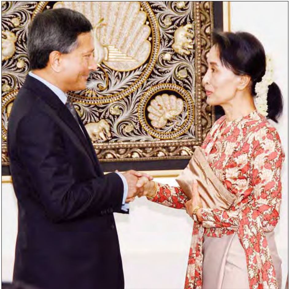
ပြည်ထောင်စုဝန်ကြီး ဒေါ်အောင်ဆန်းစုကြည် စင်ကာပူနိုင်ငံခြားရေးဝန်ကြီး ဒေါက်တာ ဗီဗီယန်ဘာလာခရစ်ရှ်နန် အား ရင်းရင်းနှီးနှီးဆက်စဉ်။ (သတင်းစဉ်)