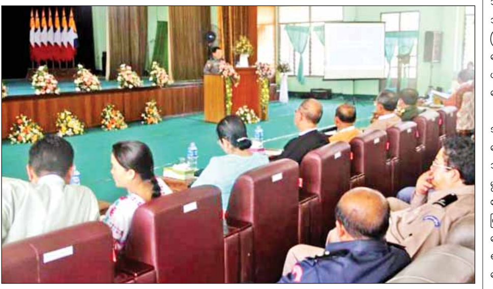
ကိုယ်စားလှယ်များ၊ ဌာနဆိုင်ရာများ၊ သူများ စုစုပေါင်း ၅၅၃ ဦးတက်ရောက် NGO, INGO များနှင့် ဖိတ်ကြားထားခဲ့သည်။