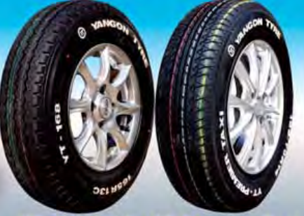
YT-165R13C YT-Premier Taxi