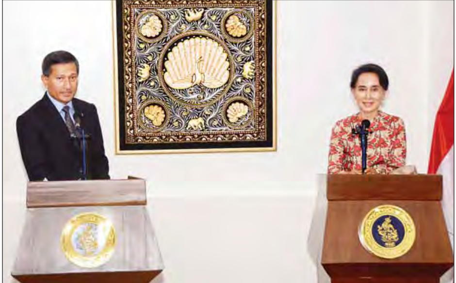
မြန်မာ-စင်ကာပူနှစ်နိုင်ငံ နိုင်ငံခြားရေးဝန်ကြီးများ ပူးတွဲသတင်းစာရှင်းလင်းပွဲ ပြုလုပ်စဉ်။

ချွေဖိုးမှ အာဆီယံအဖွဲ့ဝင်နိုင်ငံများဖြစ်ပြီး တူညီသည့်အတွေ့အကြုံ များနှင့် နီးကပ်သည့် စီးပွားရေးဆက်ဆံမှုများလည်း ရှိပါ ကြောင်း၊ အခြေခံအဆောက်အအုံ နယ်ပယ်တွင် စင်ကာပူ နိုင်ငံက မြန်မာနိုင်ငံ၌ ရင်းနှီးမြှုပ်နှံမှုများပြုလုပ်လျက် ရှိသကဲ့သို့ မြန်မာလူငယ်များအတွက် ပညာရေးနှင့် သက် နွေးပညာသင်တန်းများ ဖွင့်လှစ်ပေးပြီး အလုပ်အကိုင် အခွင့် အလမ်းများ ဖော်ဆောင်ပေးမည်ဖြစ်ပါကြောင်း ပြောကြား သည်။ ဆက်လက်၍ ပြည်ထောင်စုဝန်ကြီး ဒေါ်အောင်ဆန်း စုကြည်က မြန်မာနိုင်ငံအပေါ် ပိတ်ဆို့မှုများနှင့်ပတ်သက်၍