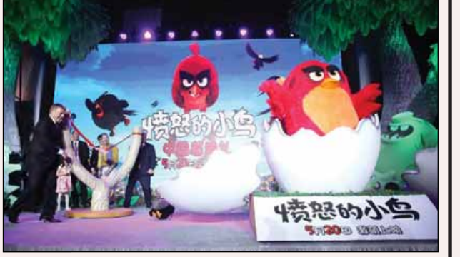
တရုတ်နိုင်ငံ ပေကျင်းမြို့၌ မေ ၁၇ ရက်က ကျင်းပခဲ့သည့် ဇာတ်ကားမိတ်ဆက်ပွဲတွင် တက်ရောက်လာကြသူများ Angry Birds ဂိမ်းတွင် ပါဝင်ကစားနေကြစဉ်။

ကမ္ဘာပေါ်တွင် ရေပန်းစားနေသည့် ဂိမ်းတစ်မျိုးဖြစ်သည့် Angry Birds ဂိမ်းကို အခြေခံကာရိုက်ကူးထားသည့် The Angry Birds Movie ဇာတ်ကားကို သရိုးဒီအန်နီမေးရှင်းဇာတ်ကားအဖြစ် ပြန်လည်ပုံဖော်ရိုက်ကူးခဲ့ရာ မေလအတွင်းက စတင်ဖြန့်ချိပြသခဲ့သည်။ အဆိုပါဇာတ်ကားကို မြောက်အမေရိကနှင့် တရုတ်နိုင်ငံတို့၌ မေ ၂၀ ရက်တွင် စတင်ပြသမည်ဖြစ်ပြီး ကမ္ဘာ့ရုပ်ရှင်ဈေးကွက် ၇၂ ခုသို့ ဖြန့်ချိပြသသွားမည်ဖြစ်သည်။