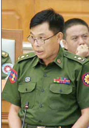
ဒုတိယဗိုလ်မှူးကြီး မျိုးခိုင်အောင်

များကျရောက်ပါက လျင်မြန်စွာတုံ့ပြန်နိုင်ရန် သုံးစွဲမည်ဖြစ်ပြီး အများပြည်သူအကျိုးကိုဆောင်ရွက်မည့်လုပ်ငန်းဖြစ်သည့်အတွက် ကြိုဆိုထောက်ခံကြောင်း၊ စီမံကိန်းများ၏တိုးတက်မှုများကို ပြည်ထောင်စုလွှတ်တော်သို့ ၆ လတစ်ကြိမ် အစီရင်ခံစာတင်ပြကြောင်း၊ ချေးငွေများနှင့်ပတ်သက်၍ ပွင့်လင်းမြင်သာစွာ အကောင်အထည်ဖော် ဆောင်ရွက်ပေးရန်လိုအပ်ပါကြောင်း ဆွေးနွေးသည်။ အဆိုပါ ကမ္ဘာ့ဘဏ်မှချေးယူမည့် အမေရိကန်ဒေါ်လာသန်း ၂၀၀ သည် အတိုးပေးချေးငွေဖြစ်ပြီး ဝန်ဆောင်ခ တစ်နှစ်လျှင် သူည ၅၀၀ ၇၅ ရာခိုင်နှုန်းပေးရမည်ဖြစ်ကာ ဆိုင်းငံ့ကာလ ၆ နှစ်၊ ပြန်ဆပ်ကာလ ၃ နှစ်ဖြစ်သည်။ အစည်းအဝေးတွင် ၂၀၁၆-၂၀၁၇ ဘဏ္ဍာရေးနှစ် စိုက်ပျိုးစရိတ်ချေးငွေ