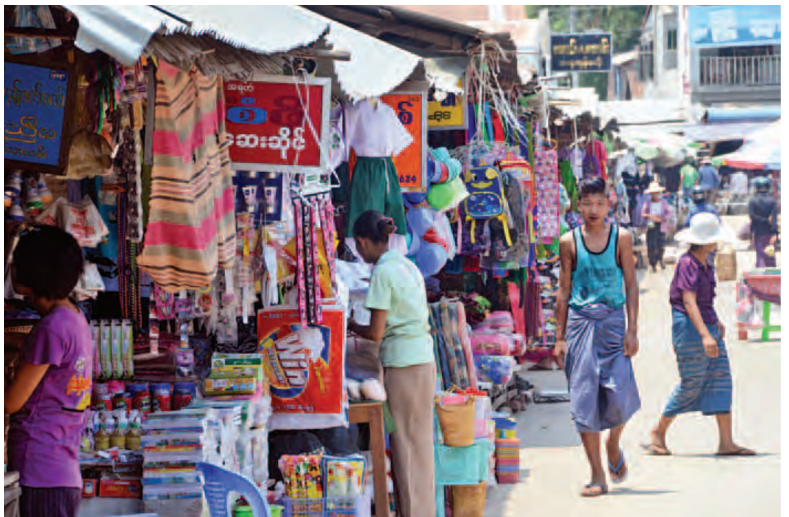
ပြည်သူများဘေးအန္တရာယ်ကင်းရှင်းပြီး ယုံကြည်စိတ်ချစွာ သုံးစွဲနိုင်ရေးအတွက် အစားအသောက်နှင့် လူသုံးကုန်ပစ္စည်းများ စစ်ဆေးရေးလုပ်ငန်းများကို ဆောင်ရွက်ပေးလျက်ရှိသည်။ (ဓာတ်ပုံ-ဇာဏီ)

ဟုတ်ကဲ့။ အခုလို စိတ်ရည်လက်ရည် အချိန်ပေးပြီး မြေကြားပေးတဲ့ ပြည်ထောင်စု ဝန်ကြီးနဲ့ တာဝန်ရှိသူအားလုံးကို အများကြီး ကျေးဇူးတင်ပါတယ်ခင်ဗျာ။