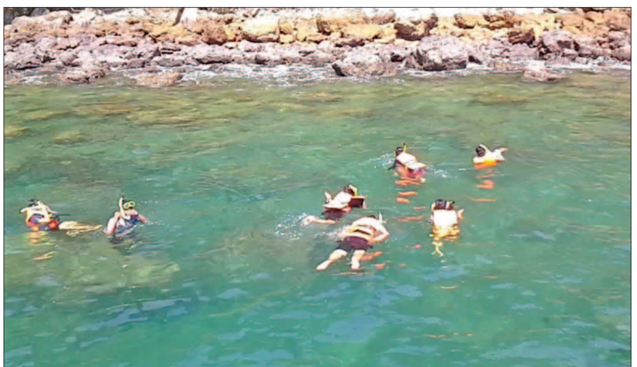
မြန်မာ့ကမ်းရိုးတန်း မြိတ်ကျွန်းစုတွင် ကမ္ဘာလှည့်ခရီးသည်များ လာရောက်အပန်းဖြေနေသည်ကို တွေ့ရစဉ်။

နေပြည်တော် မေ ၁၇ သဘာဝအလှများဖြင့်ပြည့်စုံပြီး ရှည်လျားသည့်ပင်လယ်ကမ်းရိုးတန်း၊ ထူးခြား ဆန်းကြယ်လှပသည့် သဘာဝတောတောင်ရွာခင်းများ၊ ရှားပါးသည့် သဘာဝ အပင်များနှင့် ကျေးဇူးတိရစ္ဆာန်အမျိုးပေါင်း မြောက်မြားစွာနေထိုင်သည့် ပင်လယ်ရေအောက် သန္တာကျောက်တန်းနှင့် ရေနေသတ္တဝါများ ပေါများသည့် မြန်မာ့ကမ်းရိုးတန်းအတွင်းရှိကျွန်းများသို့ ကမ္ဘာလှည့်ခရီးသည်များက စက်တင်ရှက်လေ့များဖြင့် လာရောက်လည်ပတ်ကာ အပန်းဖြေလျက်ရှိသည်။ ဟိုတယ်နှင့်ခရီးသွားလာရေးဝန်ကြီးဌာန၏ကြီးကြပ်မှု၊ Mergui Sakura Travels & Tour Co., Ltd ၏ စီစဉ်မှုဖြင့် ဗြိတိန်နိုင်ငံသားလေးဦးပါဝင်သော အဖွဲ့သည် Mergui Angel စက်လှေဖြင့် မေ ၁၃ ရက်မှ ၁၅ ရက်အထိ ပန်းဇင်ရွာ၊ ရေပြည်ကျွန်း၊ ရေပြည်အော်ကျွန်း၊ ခုံးရေတံခွန်၊ ခုံးညောင်ပိုင်းရွာ၊ နတ်သမီးရေတွင်းကျွန်းများသို့ စာမျက်နှာ ၈ ကော်လံ ၁ သို့ ❖