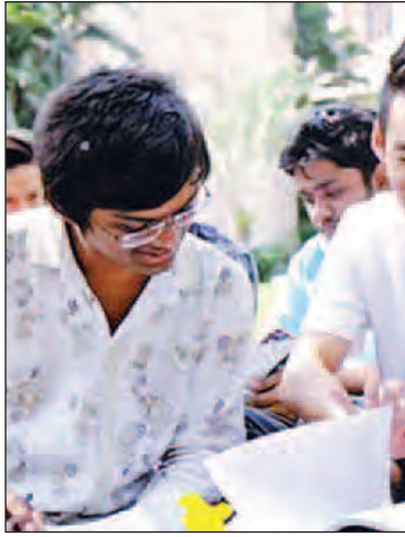
Parul University ၏ အရှေ့တောင် အာရှဆိုင်ရာ Marketing Executive က "မြန်မာနိုင်ငံဟာ လက်ရှိအချိန်မှာ ဖွံ့ဖြိုးစေနိုင်တတ်နိုင် ဖြစ်ပါတယ်။ ပညာပေးတဲ့ကု...

ရန်ကုန် မေ ၁၇ မြန်မာနိုင်ငံနှင့် ဘာသာရေး၊ ယဉ်ကျေးမှု၊ ဓလေ့ထုံးစံအခြေခံချင်းနီးစပ်သည့် အိမ်နီးချင်း အိန္ဒိယနိုင်ငံမှ မြန်မာ့ပညာရေးဖွံ့ဖြိုးတိုးတက်မှုအတွက် ပညာသင်ဆုများအား ပေးအပ်ချီးမြှင့်ခြင်းဖြင့် ပညာရေးဝန်ဆောင်မှုကဏ္ဍ၌ တက်ကြွစွာ ပူးပေါင်းပါဝင်လာကြောင်း သိရသည်။