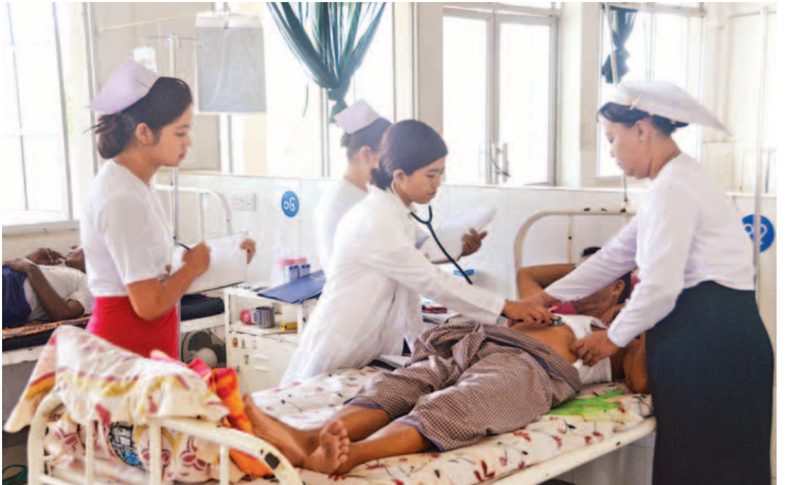
ပြည်သူ့ကျန်းမာရေးမြှင့်တင်ဆောင်ရွက်ပေးနိုင်ရန် ရက် ၁၀၀ စီမံကိန်းဆောင်ရွက်ရာတွင် တပ်ကုန်းမြို့၊ ခုတင် (၁၀၀) ဆုံဆေးရုံတွင်လည်း ဒေသခံပြည်သူများအား ဆရာဝန်၊ သူနာပြုများက အထူးဂရုစိုက်ကုသပေးလျက်ရှိသည်ကို မေ ၁၆ ရက်က တွေ့ရပုံ။

နောက်ထပ်ဥပဒေကတော့ Medical Device Law လို့ခေါ်ပါတယ်။ အလှကုန်နဲ့ ဆေးပစ္စည်းဆိုင်ရာဥပဒေ ဖြစ်ပါတယ်။ ဒါလည်းပဲ မကြာခင် First Draft ထွက်ပါ မယ်။ နောက်တစ်ခုကတော့ ဆေးဝါးဥပဒေ