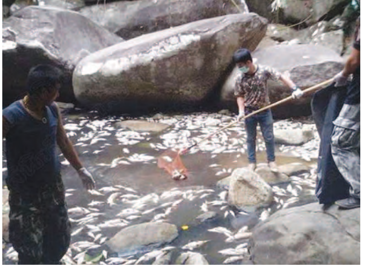
ကျေးသောင်း မေ ၁၇

မြန်မာ-ထိုင်းနယ်စပ် ကျေးသောင်းမြို့နယ်တစ်ဖက်ကမ်း ထိုင်းနိုင်ငံ ရနောင်းမြို့ရှိ အမျိုးသားသစ်တောကြီးပိုင်းအတွင်းရှိ ခေါ်ချမော Khao Cha Mao ရေတံခွန်တစ်ဝိုက်တွင် မေ ၁၅ ရက်က ထူးဆန်းစွာ ငါးများသေဆုံးနေကြောင်း သိရသည်။