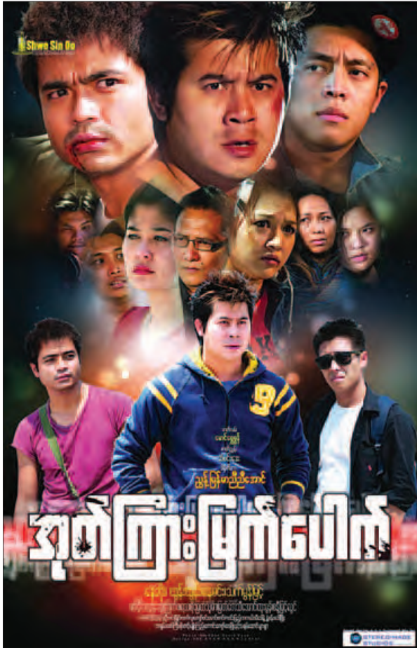
ရွှေစင်ဦးရဲ့ မင်္ဂလာဒိုင်မင်းမုန်းရုပ်ရှင်ရုံတို့မှာ ဆက်လက်ကြည့်ရှုခံစားနိုင်ကြမှာဖြစ်ကြောင်း တစ်ပတ်စာရုပ်ရှင်အညွှန်းကဏ္ဍအဖြစ် ရေးသားတင်ဆက်လိုက်ရပါမည်။ (ပြီးစနာမြင့်)

ပြီးခဲ့တဲ့တစ်ပတ်ကမှ အသစ်ရုံတင်ခဲ့တဲ့ လျှို့ဝှက်သည့်ဖိုဇာတ်ကား The Huntsman Winter's War ကိုလည်း ဒီတစ်ပတ်မှာ ဆက်လက်ရုံတင်ပေးသွားဦးမှာဖြစ်တယ်လို့ သိရပါတယ်။ ယူနိုက်တက်စတိတ်လုပ်ငန်းကနေထုတ်လုပ်ပြီး သရုပ်ဆောင် ခရစ္စတယ်ပန်း၊ ဂျက်စီကာချက်စတိတ်နဲ့ အမ်မီလီဘန်တို့က ခေါင်းဆောင်ပါဝင်ထားပြီး သည်းထိတ်ရင်ဖို အက်ရှင်ဒရမ်ဇာတ်ကားတစ်ကားလည်း ဖြစ်ပါတယ်။ ဒီဇာတ်ကားသစ်ကို