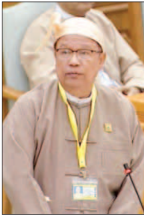
ပြည်ထောင်စုဝန်ကြီး ဦးသန့်စင်မောင်

ရရှိနိုင်သည့်အပြင် နိုင်ငံတကာနှင့် ရင်းနှီးသည့်ဆက်ဆံမှုများ ရရှိနိုင်မည်ဖြစ်ကြောင်း၊ အဆိုပါစာချုပ်၌ ပါဝင်လက်မှတ်ရေးထိုးခြင်းဖြင့် သတ်မှတ်နှုန်းထားများ ပေးဆောင်ရခြင်း ရှိ၊ မရှိကိုလည်း ပြည်သူများအား ချပြသင့်ပါကြောင်း ဆွေးနွေးသည်။