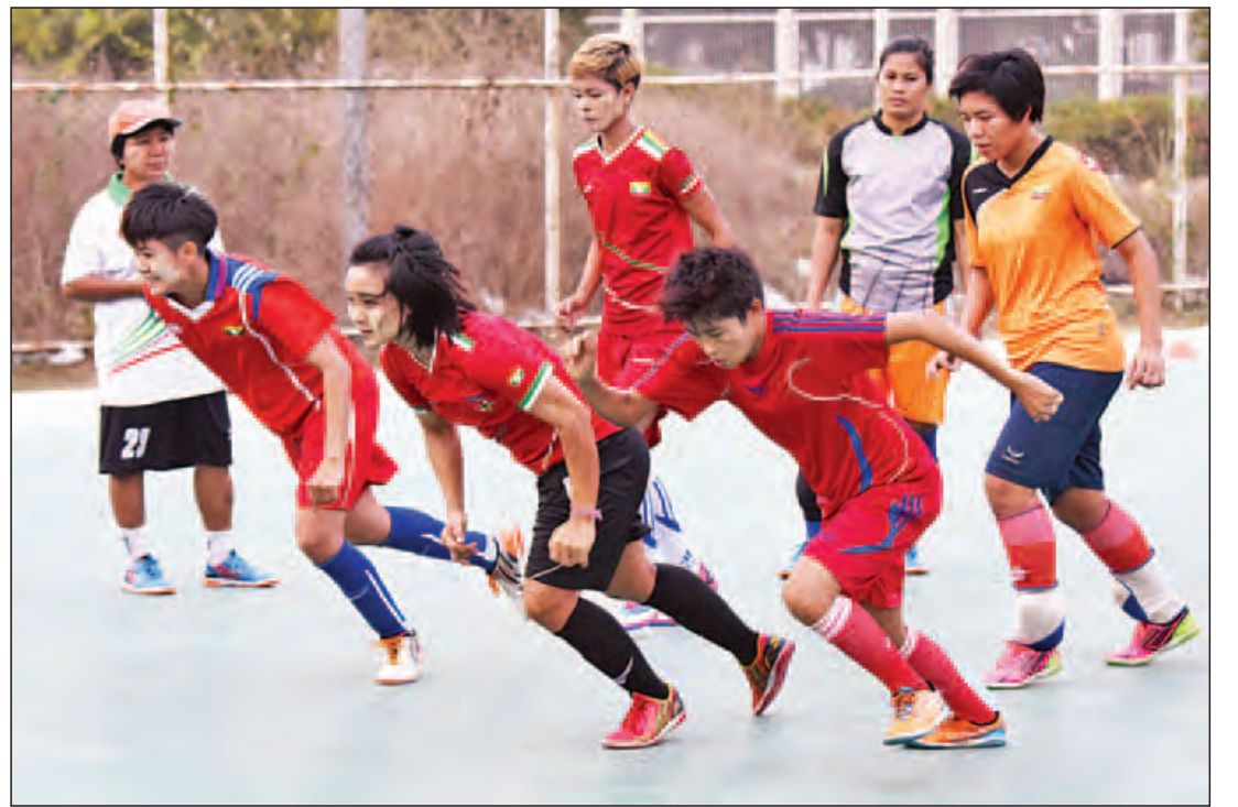
မြန်မာအမျိုးသမီး ဖူဆယ်အသင်း လေ့ကျင့်နေစဉ်။