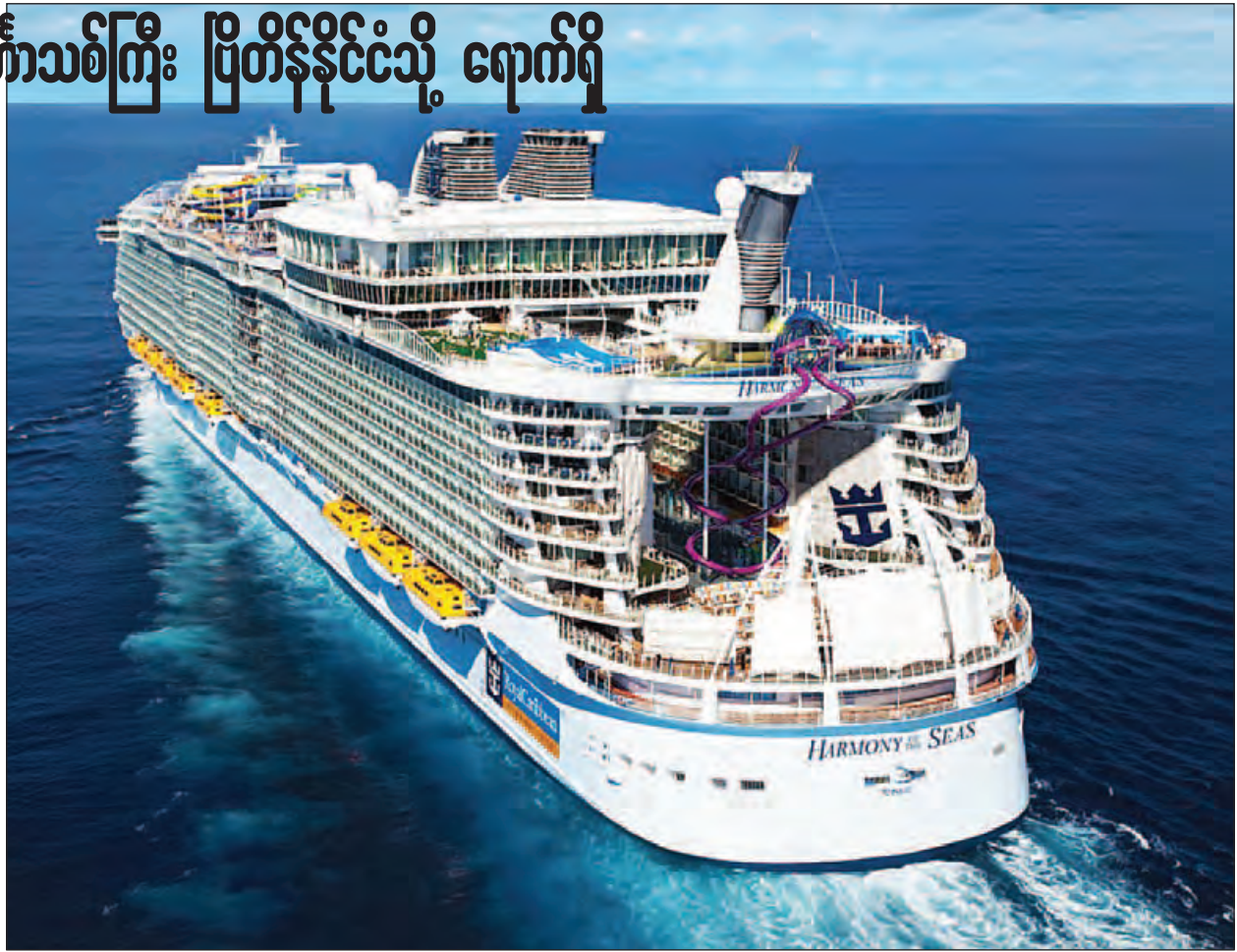
ရိုက်တာ။

ဆောက်သစ်တန်(အင်္ဂလန်) မေ ၁၇ ကမ္ဘာ့အကြီးဆုံး ဇိမ်ခံအပျော်စီးသင်္ဘောသစ်ကြီးဖြစ်သော Harmony of the Seas သည် ပထမဦးဆုံးအကြိမ် ပင်လယ်ရေကြောင်းခရီးရှည် မစတင်မီ အပြီးသတ်ပြင်ဆင်မှုခရီးတိုအဖြစ် ပြုတ်နုနိုင်ငံသို့ ဆောက်သစ်တန်ပင်လယ် ဆိပ်ကမ်းသို့ မေ ၁၇ ရက်တွင် ဆိုက်ရောက်လာကြောင်း ဒေသဆိုင်ရာ သတင်းဌာနများက သတင်းထုတ်ပြန်သည်။ ရွှင်ရယ်ကာရစ်ဘီယန် အင်တာနေရှင်နယ်ကုမ္ပဏီ၏ ဒေါ်လာ ၁ ဘီလီယံတန်ဖိုးရှိ သင်္ဘောကြီးဖြစ်သော ဇိမ်ခံအပျော်စီးသင်္ဘောကြီးသည် ၃၆၂ မီတာ(၁၁၈၇ ဒေသမ ၆၆ ပေ)အရှည်ရှိပြီး ဘောလုံးကွင်းလေးကွင်းစာနီးပါး တမျှ အရွယ်အစားကြီးမားသည်။ အလေးချိန်မှာမူ ၂၂၇၀၀၀ ဂျီတီတန် ရှိသည်။ ခရီးသည် ၇၈၀ စီးနင်းလိုက်ပါနိုင်သော ဇိမ်ခံအပျော်စီးသင်္ဘောကြီး ပေါ်တွင် စားသောက်ဆိုင် ၂၀၊ ရေကူးကန် ၂၃ ကန်ပါရှိပြီး တည်ဆောက်မှု ကာလ နှစ်နှစ်ခွဲကြာမြင့်ခဲ့သည်။ မတ်လတွင် ပထမဆုံးအကြိမ် စမ်းသပ် ခုတ်မောင်းခဲ့သည်။ ဇိမ်ခံအပျော်စီးသင်္ဘောသစ်ကြီးသည် ပြင်သစ်နိုင်ငံ စိန်နာဇိုင်ရှိ သင်္ဘောကျင်းမှ ထွက်ခွာလာခဲ့ပြီး အင်္ဂလိပ်ရေလက်ကြားကို မေ ၁၆ ရက် တွင် ဖြတ်သန်းခဲ့ပြီးနောက် ဆောက်သစ်တန် ပင်လယ်ဆိပ်ကမ်းသို့ မေ ၁၇ ရက် နံနက် ၆ နာရီ ၁၅ မိနစ်တွင် ဆိုက်ရောက်လာခဲ့သည်။ မေ ၂၂ ရက်တွင် ပင်လယ်ရေကြောင်းခရီးတိုအဖြစ် နယ်သာလန်နိုင်ငံရှိ ရောတာဒမ်မြို့သို့ လေးရက်ကြာခရီးစဉ် သွားရောက်မည်ဖြစ်သည်။ မေ ၂၉ ရက်တွင် ပထမဆုံးအကြိမ် ပင်လယ်ရေကြောင်းခရီးရှည် ခရီးစဉ်အဖြစ် စပိန်နိုင်ငံဘာစီလိုနာမြို့သို့ ခရီးနှင့်မည်ဖြစ်သည်။