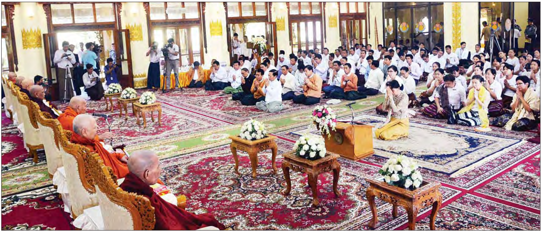
နိုင်ငံတော်သံယမဟာနာယကအဖွဲ့ဥက္ကဋ္ဌ မန္တလေးမြို့ ဗန်းမော်ကျောင်းတိုက်ဆရာတော် အဘိဓဇမဟာရဋ္ဌဂုရု အဘိဓဇအဂ္ဂမဟာသဒ္ဓမ္မဇောတိက ဒေါက်တာ ဘဒ္ဒန္တကုမာရာဘိဝံသထံမှ နိုင်ငံတော်၏ အတိုင်ပင်ခံပုဂ္ဂိုလ် ဒေါ်အောင်ဆန်းစုကြည် အမျိုးပြုသော ဧည့်ပရိသတ်များက ငါးပါးသီလခံယူဆောက်တည်ကြစဉ်။ (သတင်းစဉ်)

* ရှေ့ဖုံးမှ ဒကာမများ၏အရေးအတွက် ဆောင်ရွက်ပေးခြင်းလည်းရှိကြောင်း၊ ဒကာမကြီး၏ နှစ်သစ်ကူးမိန့်ခွန်းတွင်ပြောခဲ့သော ဒကာမကြီး၏ဖခင် ဗိုလ်ချုပ်အောင်ဆန်းပြောခဲ့သည့်စကားလေးကို မိမိတို့လည်း အလွန်နှစ်ခြိုက်ပါကြောင်း၊ ယင်းမှာ နိုင်ငံကို မေတ္တာ၊ သစ္စာနှင့် အုပ်ချုပ်မည်ဆိုသည့် စကားဖြစ်ကြောင်း၊ မင်းကောင်းမင်းမြတ်တို့မည်သည် ပြည်သူပြည်သားများ၏အကျိုးကို ဆောင်ရွက်ရာ၌ ရင်ဝယ်သားကဲ့သို့ မေတ္တာထားပြီး နိုင်ငံတော်၏ အကျိုးစီးပွား