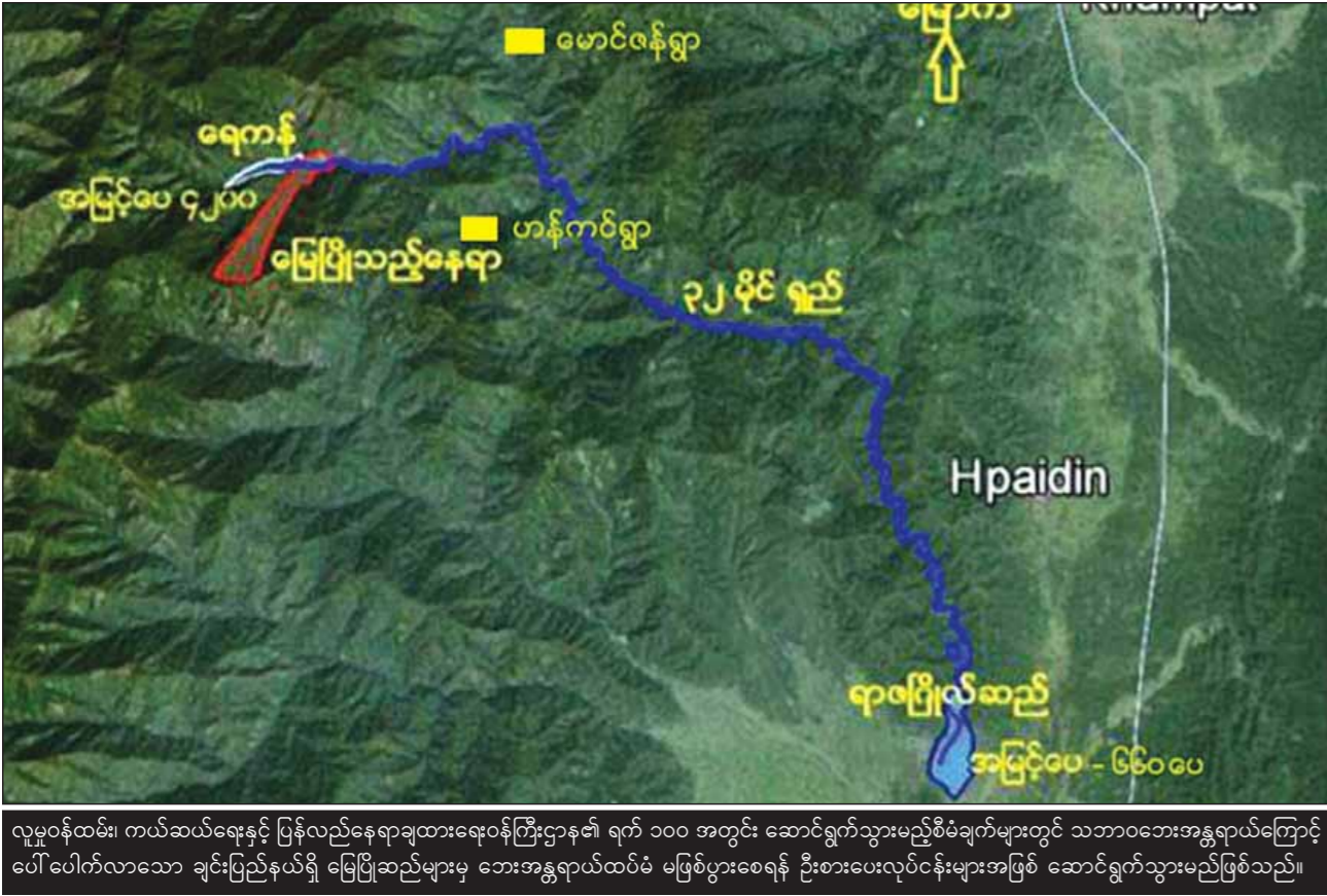
လူမှုဝန်ထမ်း၊ ကယ်ဆယ်ရေးနှင့် ပြန်လည်နေရာချထားရေးဝန်ကြီးဌာန၏ ရက် ၁၀၀ အတွင်း ဆောင်ရွက်သွားမည့်စီမံချက်များတွင် သဘာဝဘေးအန္တရာယ်ကြောင့် ပေါ်ပေါက်လာသော ချင်းပြည်နယ်ရှိ မြေပြိုဆည်များမှ ဘေးအန္တရာယ်ထပ်မံ မဖြစ်ပွားစေရန် ဦးစားပေးလုပ်ငန်းများအဖြစ် ဆောင်ရွက်သွားမည်ဖြစ်သည်။

၀ စာမျက်နှာ ၁၅ မှ စသည် ကဏ္ဍကိုးခုတို့ကို ဦးစားပေးလုပ်ငန်းများအဖြစ် ဆောင်ရွက်လျက်ရှိသည်။ “အစိုးရအဖွဲ့သစ်တက်တက်ချင်းကာလဟာ သဘာဝဘေးအန္တရာယ်တွေ နဲ့ ရင်ဆိုင်ရတဲ့ကာလ ဖြစ်ပါတယ်။ ပြည်သူတွေ ဘေးကင်းလုံခြုံဖို့ ပြည်သူ့အကျိုးစီးပွားကို ပြည့်ဆည်းနိုင်ဖို့နဲ့ ပြည်သူယုံကြည်ကိုးစားတဲ့ဝန်ကြီးဌာန ဖြစ်ဖို့ အဓိကရည်ရွယ်ချက်အဖြစ်ထားပြီး ပြည်သူ့အကျိုး ဘယ်လောက်ဆောင်ရွက်နိုင်ပြီလဲဆိုတာနဲ့ ပြည်သူယုံကြည်မှုဘယ်လောက်ရပြီလဲဆိုတဲ့ ရလဒ်တွေနဲ့ အကောင်အထည်ဖော်သွားမယ်”ဟု လူမှုဝန်ထမ်း၊ ကယ်ဆယ်ရေးနှင့် ပြန်လည်နေရာချထားရေးဝန်ကြီးဌာန ပြည်ထောင်စုဝန်ကြီး ဒေါက်တာဝင်းမြတ်အေးက ဝန်ကြီးဌာနမှ ရက် ၁၀၀ အတွင်း ဆောင်ရွက်သွားမည့်စီမံချက်များ အကောင်အထည်ဖော်ဆောင်ရွက်သွားမည်အပေါ် ပြောကြားသည်။