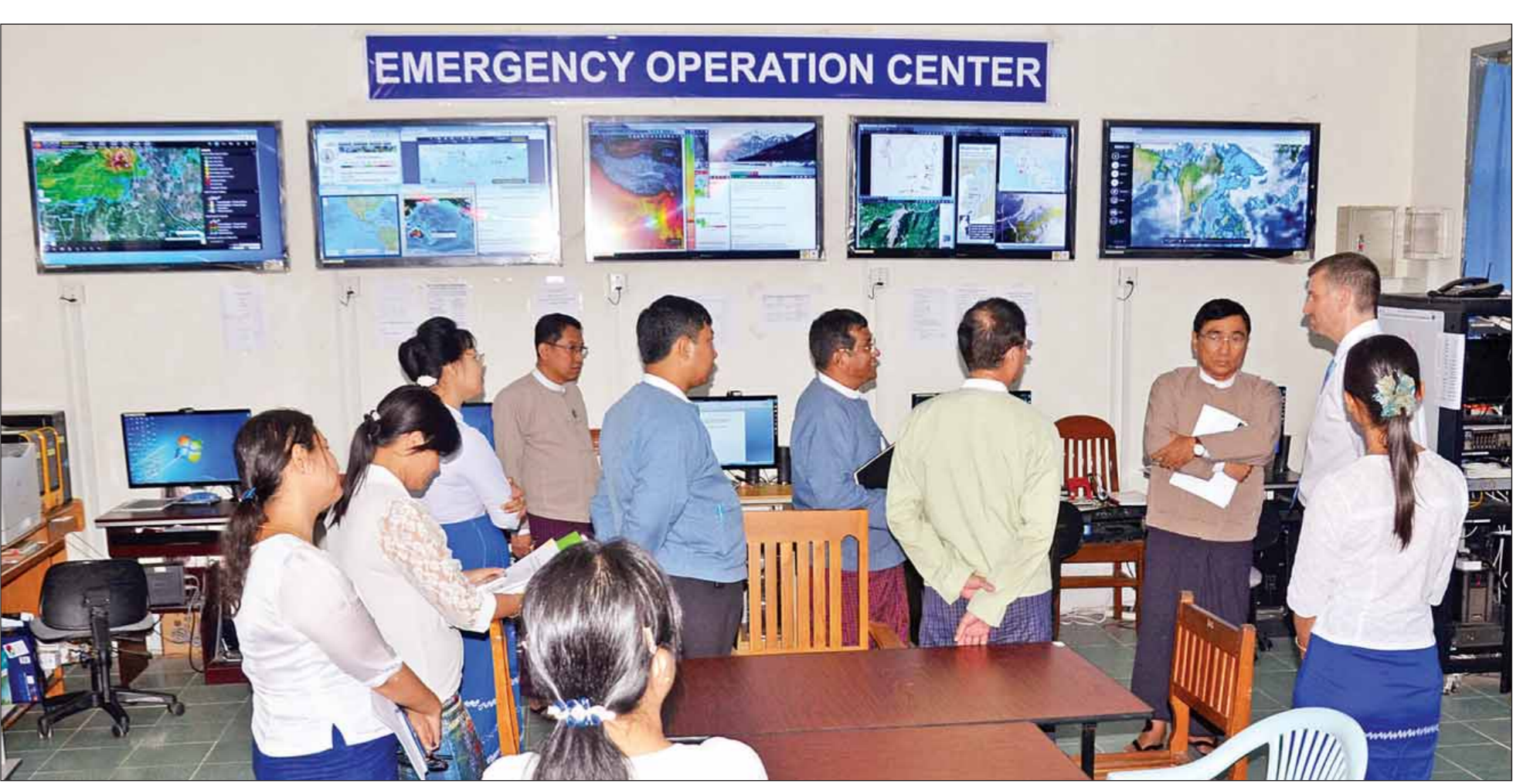
လူမှုကာကွယ်စောင့်ရှောက်ရေးလုပ်ငန်းများကို အဓိကထားဆောင်ရွက်သော ဝန်ကြီးဌာနဖြစ်သည့်အညီ သဘာဝဘေးအန္တရာယ်များဖြစ်ပေါ်လာပါက အရေးပေါ်ကူညီကယ်ဆယ်ရေးလုပ်ငန်းများ တုံ့ပြန်ဆောင်ရွက်နိုင်ရန် အရေးပေါ်စီမံခန့်ခွဲမှုဗဟိုဌာနသည်လည်း မရှိမဖြစ်လိုအပ်သည်။

လူငယ်နှင့် ရက် ၁၀၀ စီမံချက် အသက် (၁၅-၂၄) နှစ်အတွင်းရှိသော လူငယ်များသည် မြန်မာနိုင်ငံ စုစုပေါင်းလူဦးရေ၏ ၁၇ ဒသမ ၈၁ ရာခိုင်နှုန်းရှိသည်။ လူငယ်မူဝါဒ ရေးဆွဲအကောင်အထည်ဖော် ဆောင်ရွက်နိုင်ခြင်းမရှိသေးသည့် နိုင်ငံ ၃၁ နိုင်ငံတွင် မြန်မာနိုင်ငံပါဝင်နေသေးသည်။ “နိုင်ငံဖွံ့ဖြိုးရေးဟာ လူငယ်အရင်းအမြစ်အပေါ်မှာလည်း မူတည်နေတယ်။ လူငယ်တွေရဲ့ လိုအပ်ချက်တွေ၊ တောင်းဆိုချက်တွေ၊ အမြင်တွေကို တရားဝင်မူဝါဒတွေ၊ မူဘောင်တွေချမှတ်ဆောင်ရွက်ပေးနိုင်ဖို့ လူငယ်မူဝါဒရေးဆွဲတဲ့နေရာမှာ လူငယ်တွေကိုယ်တိုင် ပါဝင်စေမယ်။ ကော်မတီတွေဖွဲ့စည်းပြီးတော့ တိုင်းဒေသကြီးနဲ့ ပြည်နယ်တွေမှာ အသိပညာပေးအလုပ်ရုံဆွေးနွေးပွဲတွေ လုပ်မယ်။ ပြီးတော့ တိုင်းဒေသကြီး/ပြည်နယ်အလိုက် လူငယ်တွေ ကိုယ်တိုင်ရွှေ့ချယ်