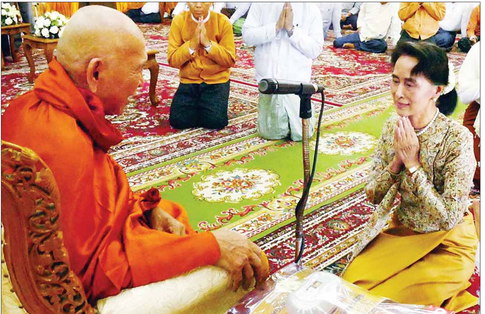
ဗန်းမော်ဆရာတော်ကြီးထံမှ နိုင်ငံတော်၏အတိုင်ပင်ခံပုဂ္ဂိုလ် ဒေါ်အောင်ဆန်းစုကြည် ဩဝါဒခံယူပွဲ။

ထို့နောက် နိုင်ငံတော်သံယမဟာ နာယကအဖွဲ့ဥက္ကဋ္ဌ ဗန်းမော် ဆရာတော်က ဩဝါဒချီးမြှင့်ရာ၌ မိမိတို့သည် သာသနာအတွက် ဆောင်ရွက်ရာတွင် သာသနာတော် သန့်ရှင်းတည်တံ့ပြန့်ပွားရေးကိုသာ ဆောင်ရွက်ခြင်းဖြစ်သည်အတွက် နိုင်ငံရေးနှင့် နီးနွယ်သည့်ကိစ္စရပ် များကို ဆောင်ရွက်ခြင်းမပြုကြောင်း၊ သို့ရာတွင် မြန်မာနိုင်ငံ လူဦးရေ ၅၁ သန်းကျော်အနက် ၄၇ သန်းကျော် သော ပြည်သူများသည် ဗုဒ္ဓဘာသာ ကိုးကွယ်သဖြင့် ကိုးကွယ်သည့် ဒကာ၊ ဒကာမများ၏ ဆန္ဒနှင့် လိုလားချက် များကို သာသနာတော်နှင့် ဒကာ၊ စာမျက်နှာ ၅ ကော်လံ ၁ သို့ *