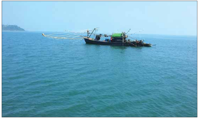
ဒေသခံကိုယ်တိုင်စီမံခန့်ခွဲသော အဏ္ဏဝါရေပြင်ကာကွယ်ရေး နယ်မြေထူထောင်ရေးလုပ်ငန်းဆောင်ရွက်နိုင်ရန် ပြုလုပ်သွားကြမည်ဖြစ်သည်။