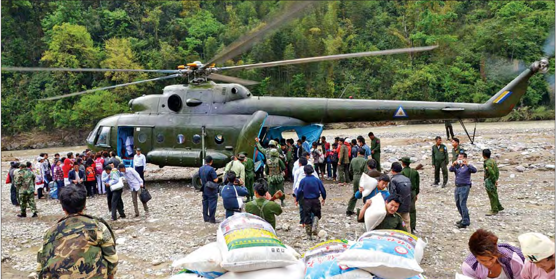
ဆော့လော်မြို့နယ် လန်ဆယ်ဒေသ လာချင်ကျေးရွာအုပ်စုနှင့် လကင်ကျေးရွာအုပ်စုရှိ ရေဘေးသင့်ပြည်သူများအတွက် ကယ်ဆယ်ရေးပစ္စည်းများ၊ ဆန်၊ ငါးသေတ္တာ၊ ခေါက်ဆွဲခြောက်၊ မုန့်များ၊ ရေသန့်ဆေးပြားများနှင့် အစားအသောက်များ ရောက်ရှိစဉ်။

၂၀၁၅ ခုနှစ် နိုဝင်ဘာလတွင် ကျင်းပခဲ့သည့် ပါတီစုံဒီမိုကရေစီအထွေထွေရွေးကောက်ပွဲတွင် ပြည်သူ့လူထုရွေးချယ်ပေးမှုဖြင့် အရပ်သားအစိုးရအဖွဲ့သည် နိုင်ငံတဝန်းများကို ဧပြီလ ၁ ရက်နေ့မှစတင်၍ ထမ်းဆောင်နေပြီဖြစ်သည်။ နိုင်ငံတဝန်းစတင်တာဝန်ယူထမ်းဆောင်သည်နှင့် ရက်ပေါင်း ၁၀၀ ကာလအတွင်း ထင်သာမြင်သာရှိသည့် ပြုပြင်ပြောင်းလဲမှုများကို အစိုးရအဖွဲ့၏ ပြည်ထောင်စုဝန်ကြီးဌာန အသီးသီးက စတင်ကြိုးပမ်းဆောင်ရွက်နေကြပြီဖြစ်သည်။ ပြည်သူတို့၏ တစ်ခဲနက်ထောက်ခံမှုဖြင့် အောင်ပွဲရခဲ့သော အစိုးရအဖွဲ့၏ ပြည်ထောင်စုဝန်ကြီးဌာနများသည် နိုင်ငံတော်နှင့်ပြည်သူတို့၏ အကျိုးစီးပွားမြှင့်တင်ရေးအတွက် ရက်ပေါင်း ၁၀၀ အတွင်း ဆောင်ရွက်လျက်ရှိသည့် ပြုပြင်ပြောင်းလဲဆောင်ရွက်မှုများကို အများပြည်သူသိရှိနိုင်အောင် ဖော်ပြလိုက်ပါသည်။