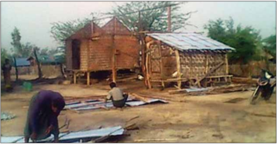
ရဲဝင်းထွန်း(မြစ်သား)

မြစ်သား မေ ၁၄ မန္တလေးတိုင်းဒေသကြီး မြစ်သားမြို့နယ်အတွင်း မေ ၁၃ ရက် ညနေပိုင်းက မိုးသက်လေပြင်းများတိုက်ခတ်ခဲ့ရာ မြစ်သားမြို့ အနောက်ဘက်အခြမ်းရှိ ကျေးရွာခြောက်ရွာမှ လူနေအိမ်များ ပျက်စီးခဲ့ကြောင်း သိရသည်။