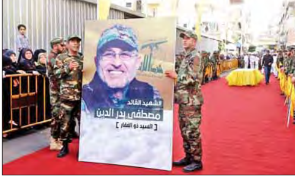
အိန္ဒိယနိုင်ငံ၌ အမေရိကန်နိုးကျည်ကာကွယ်ရေးစနစ်ဖြန့်ဖြူးမှု သမ္မတပူတင်သတိပေး

ဘေရွတ် မေ ၁၄ ဒမတ်စတတ်မြို့တွင် မေ ၁၃ ရက်က ဖြစ်ပွားသည့်တိုက်ခိုက်မှုတစ်ရပ်တွင် သေဆုံးသွားသည့် ဖက်ဒရယ်လက်ချက်အဖွဲ့၏ ထိပ်တန်းတပ်မှူး မူစတာဖာ အာဒရက်ဒင်း၏ရုပ်အလောင်းကို လက်ဘနွန်နိုင်ငံဘေရွတ်မြို့တောင်ပိုင်းရှိ ၎င်းအဖွဲ့အင်အား တောင့်တင်းသည့် ဒေသတွင် စစ်အခမ်းအနားဖြင့် ယင်းနေ့တွင်ပင် သင်္ဂြိုဟ်ခဲ့ကြောင်း