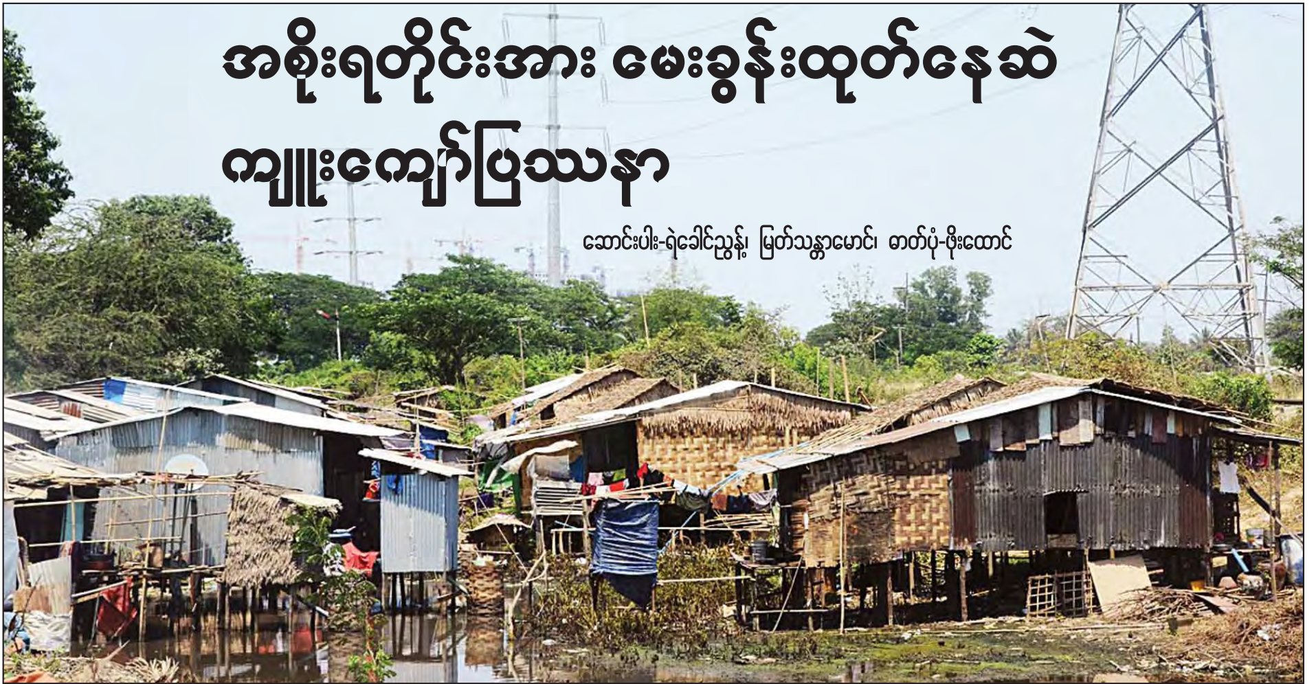
ရန်ကုန်မြို့၊ ဒဂုံမြို့သစ် (ဆိပ်ကမ်း)မြို့နယ်အတွင်းရှိ ကျူးကျော်အိမ်နေရာများကို တွေ့ရစဉ်။

ဆောင်းပါး-ရဲခေါင်ညွန့်၊ မြတ်သန္တာမောင်၊ ဓာတ်ပုံ-ဖိုးထောင်