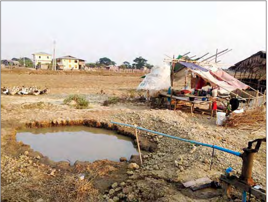
ဒဂုံမြို့သစ် (ဆိပ်ကမ်း) မြို့နယ်အတွင်းရှိ ကျွေးကျော်အိမ်နေရာအား တွေ့ရစဉ်။

လက်ရှိ ကျွေးကျော်များ နေထိုင်နေကြသည့် နေရာ များတွင် အရေအတွက် ထပ်မံမတိုးလာအောင် သက်ဆိုင်ရာ ရာအိမ်မှူး၊ ရပ်ကွက်အုပ်ချုပ်ရေးမှူးများက တားဆီးရန် တာဝန်ရှိကြောင်း၊ ရပ်ကွက်တစ်ခုတွင် ကျွေးကျော် နေထိုင်သူများ တိုးပွားလာမှု၏ ကနဦး တာဝန်ရှိသူမှာ စာမျက်နှာ ၁၀ သို့»