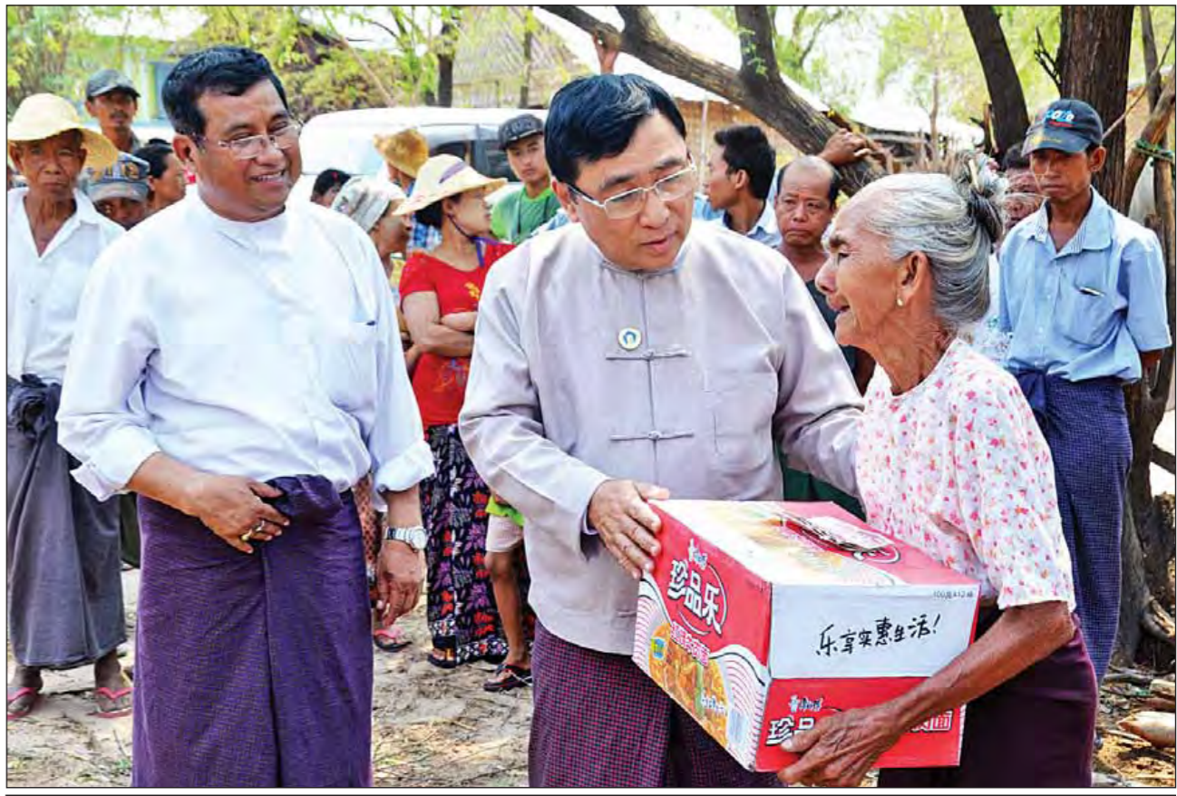
ဧပြီ ၃၀ ရက်က ဖြစ်ပွားခဲ့သည့်လေဘေးကြောင့် ဘေးဒုက္ခကြုံတွေ့ခဲ့ရသည့် ရမည်းသင်းမြို့နယ် ထီးလင်းကျေးရွာအုပ်စု ဆည်တိုရွာရှိ ကျေးရွာသူ ကျေးရွာသားများအား ထောက်ပံ့ပေး ထောက်ပံ့ပေးအပ်စဉ်။

ချင်းပြည်နယ်နှင့် ရက် ၁၀၀ စီမံချက် ရက် ၁၀၀ လုပ်ငန်းစီမံချက် ဦးစားပေးဆောင်ရွက်မှုမှတစ်ဆင့် တစ်နှစ်ကာလသတ်မှတ်၍ လူမှုကာကွယ်စောင့်ရှောက်ရေး ကနဦးစီမံချက်ကို ချင်းပြည်နယ်ရှိ မြို့နယ် ၁၃ မြို့နယ်တွင် ဆောင်ရွက်သွားမည်ဖြစ်ကြောင်း သိရှိရပြီး ကိုယ်ဝန်ဆောင်မိခင်များ၊ အသက် နှစ်နှစ်အထိ ကလေးငယ်များ၊ မသန်စွမ်းသူများနှင့် အသက် (၇၀) အထက် အသက်ကြီးသူများအား ဦးတည်ဆောင်ရွက်သွားမည်ဖြစ်ကြောင်း သိရသည်။