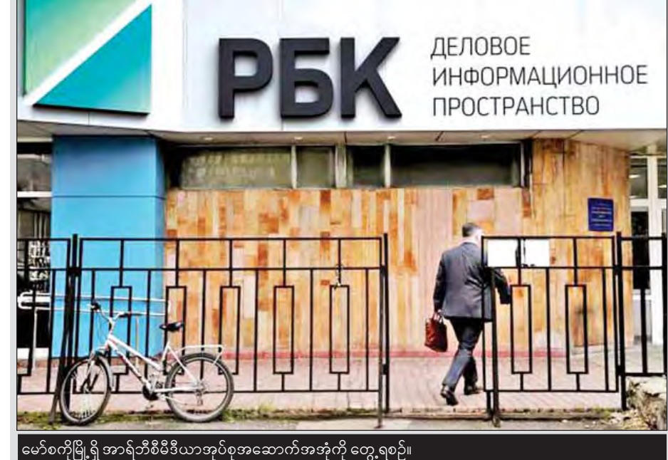
မော်စကိုမြို့ရှိ အာရ်ဘီစီမီဒီယာအုပ်စုအဆောက်အအုံကို တွေ့ရစဉ်။