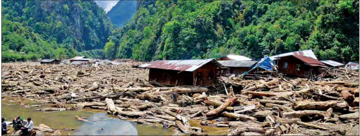
ဆော့လော်မြို့နယ် လန်ဆယ်ဒေသ၌ ရေဘေးကြောင့်ပျက်စီးမှုများကို တွေ့ရစဉ်။

လူမှုဝန်ထမ်း၊ ကယ်ဆယ်ရေးနှင့် ပြန်လည်နေရာချထားရေးဝန်ကြီးဌာနနှင့် ရက် ၁၀၀ စီမံကိန်း ဧပြီလ ၂၁ ရက်မှ စတင်ကာ လူမှုဝန်ထမ်း၊ ကယ်ဆယ်ရေးနှင့် ပြန်လည်နေရာချထားရေးဝန်ကြီးဌာန၏ ရက် ၁၀၀ စီမံကိန်းများအဖြစ် ချင်းပြည်နယ် တွန်းဇံမြို့နယ် မြေပြိုဆည်များနှင့်စပ်လျဉ်း၍ ဆောင်ရွက်နိုင်ရေး၊ သဘာဝဘေး ဖြစ်ပေါ်လာပါက အရေးပေါ်တုံ့ပြန်ဆောင်ရွက်ရေး၊ အရေးပေါ်အခြေအနေ စီမံခန့်ခွဲမှုဗဟိုဌာနအား အဆင့်မြှင့်တင်နိုင်ရေးနှင့် ပြည်တွင်းပြည်ပ အဖွဲ့အစည်းများနှင့် ပေါင်းစပ်ဆောင်ရွက်ရေး၊ Help Line တည်ဆောက် အကောင်အထည်ဖော်ရေး၊ လူငယ်မူဝါဒ ရေးဆွဲအကောင်အထည်ဖော်ရေး၊ လမ်းပေါ်နေ တလေးများနှင့် တောင်းရမ်းစားသောက်သူများ၊ ခိုကိုးရာမဲ့များ၊ စောင့်ရှောက်သူ မဲ့ မသန်စွမ်းသူများအား ကာကွယ်စောင့်ရှောက်ရေး၊ ကနဦးပေးပို့သူနှင့် လက်ခံသူအကြား တစ်ဆက်တစ်စပ်တည်း ချိတ်ဆက်ဆောင်ရွက်နိုင်သည့် ကြိုတင်သတိပေးမှုစနစ်များ တိုးချဲ့ဆောင်ရွက်နိုင်ရေး၊ လူမှုကာကွယ်စောင့်ရှောက်ရေး ကနဦးစီမံချက်ကို ချင်းပြည်နယ်တွင် စတင်အကောင်အထည်ဖော်နိုင် ရေး၊ သက်ကြီးရွယ်အိုများ ပြုစုစောင့်ရှောက်ရေးဆိုင်ရာသင်တန်းများ ဖွင့်လှစ် နိုင်ရေးနှင့် အလုပ်အကိုင်အခွင့်အလမ်းရရှိစေရေး မာမုက်နာ ၁၆ သို့ ၀