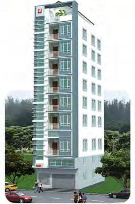
8 1/2 Stories ငြိမ်းမှု ၁၀၀% အမှတ်(၃၇)၊ ဝေယျဝတီလမ်း(ဗဟိုလမ်း)၊ စမ်းချောင်းမြို့နယ်။