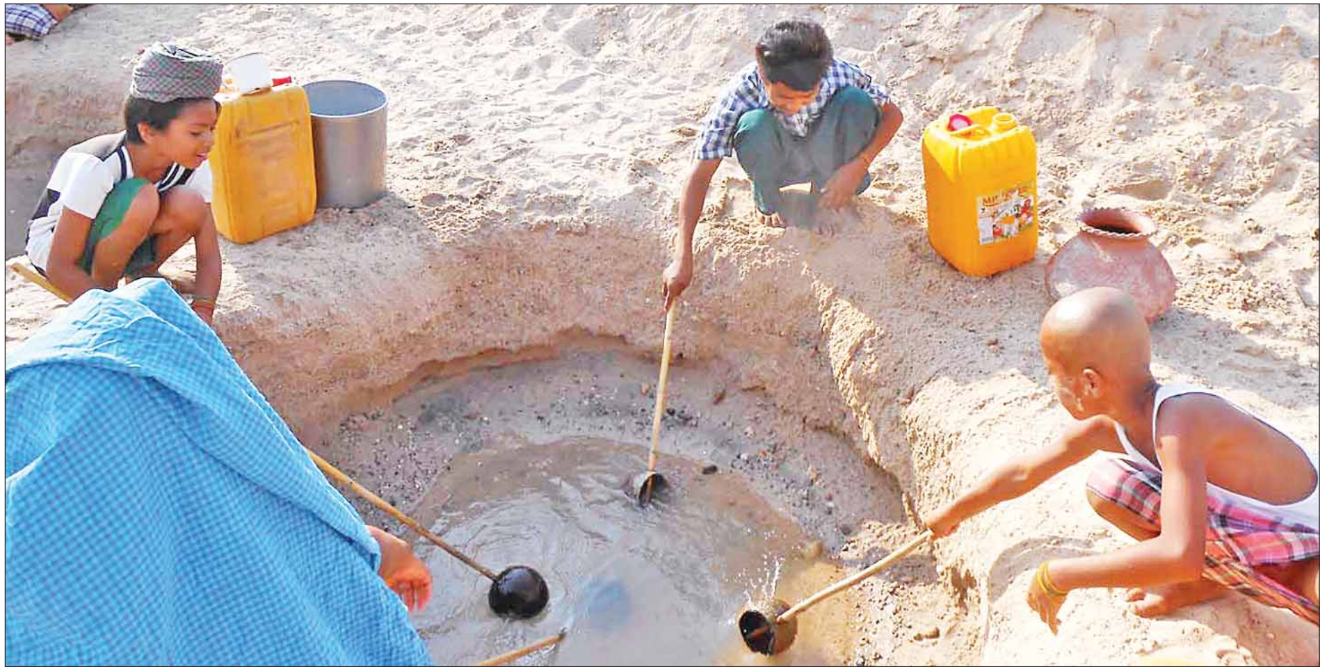
မကွေးတိုင်းဒေသကြီး မကွေးမြို့နယ် သက်ရင်းတောရွာထိပ်ရှိ နဂါးချောင်းတွင် သောက်သုံးရေအတွက် ခက်ခဲစွာ ရေခပ်ယူနေရသည်ကို တွေ့ရစဉ်။

မကွေးမြို့ မိုး/လေ ဌာန၏ ထုတ်ပြန်ချက်အရ မေလအပူချိန်သည် ၄၃ ဒီဂရီစင်တီဂရိတ်မှ ၄၆ ဒီဂရီ ၅ ဒီဂရီစင်တီဂရိတ်အတွင်းရှိသည်။ အဆိုပါ အပူချိန်ကို အန်တု၍ ဒေသခံများက ရေရရှိရေးအတွက် ညနေ ၃ နာရီမှ ည ၇ နာရီအထိ စောင့်ဆိုင်းခပ်ယူရသည်။ စာမျက်နှာ ၅ ကော်လံ ၁ သို့ *