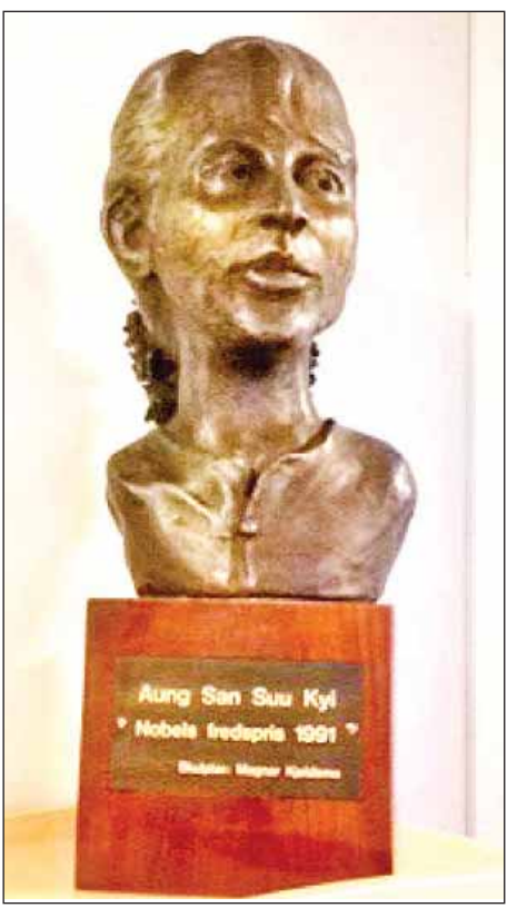
ပန်းခြံ၌ထားရန် စီစဉ်ထားသည့် ဒေါ်အောင်ဆန်းစုကြည်ပုံတူ ကြေးရုပ်တုနှင့်ဆင်တူသည့် နော်ဝေနိုင်ငံ အော်စလိုမြို့ နိုဘယ်ငြိမ်းချမ်းရေးစင်တာတွင် ထားရှိသော ဒေါ်အောင်ဆန်းစုကြည်ပုံတူကြေးရုပ်။

ရိုလ်မတ်နဲဘွန်ဒယ်ဗစ် (Kjell Magne Bondevik) နှင့် နော်ဝေနိုင်ငံ အစိုးရအဖွဲ့ လွှတ်တော်ကိုယ်စားလှယ် ရိုလ်အင်ဂွိုလ်စတင် (Kjell Ingolf Ropstad) အပါအဝင် ဖရိုလန်(န်)မြို့တော်ဝန်နှင့် သံတမန်အချို့၊ ဒေသတွင်းအဖွဲ့အစည်းအသီးသီးမှ ကိုယ်စားလှယ်များ၊ နော်ဝေနှင့် အိမ်နီးချင်းနိုင်ငံအသီးသီးမှ မြန်မာပြည်ဖွားများလည်းပါဝင်ကြမည်ဟု သိရသည်။ ကိုညို(အော်စလို)