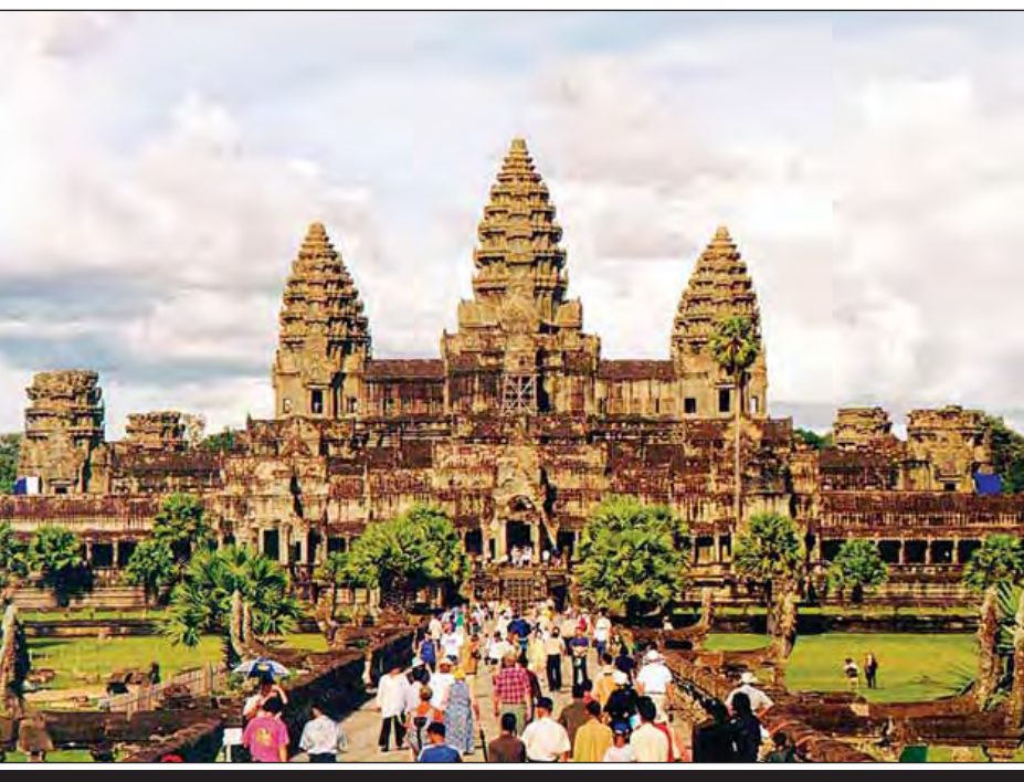
ကမ္ဘောဒီးယားနိုင်ငံရှိ အန်ကောဝပ်ဘုရားကျောင်း။

အန်ကောဝပ်ဘုရားကျောင်းနှင့် ဘေယွန်ဘုရားကျောင်း ထိန်းသိမ်းစောင့်ရှောက်ရေးလုပ်ငန်း၌ ပါဝင်