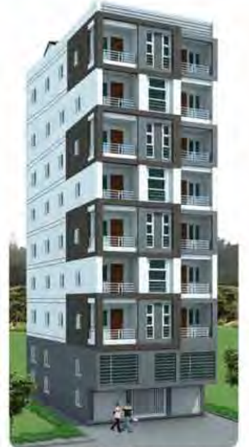
8 1/2 Stories အမှတ်(၉၄)၊ ဗိုလ်တော့လမ်း၊ ကြည့်မြင်တိုင်မြို့နယ်။