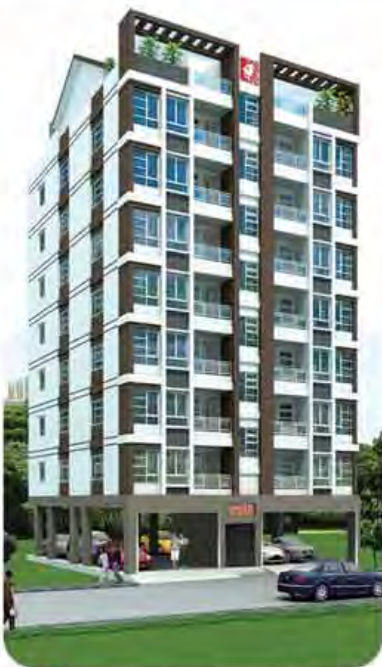
8 1/2 Stories အမှတ်(၅၈၅)၊ မွှားလမ်း၊ လှိုင်မြို့နယ်။

● အသင့်တော်ဆုံးဈေးနှုန်း ● ခိုင်ခံ့ခေတ်မီသောဒီဇိုင်း ● သန့်ရှင်းသပ်ရပ်သော ပတ်ဝန်းကျင်များ၌ တည်ဆောက်ထားသော တကောင်ဘွားကုမ္ပဏီလီမိတက် ရဲ့အဆင့်မြင့်တိုက်ခန်းများအားဝယ်ယူအားပေးနိုင်ပါသည်။