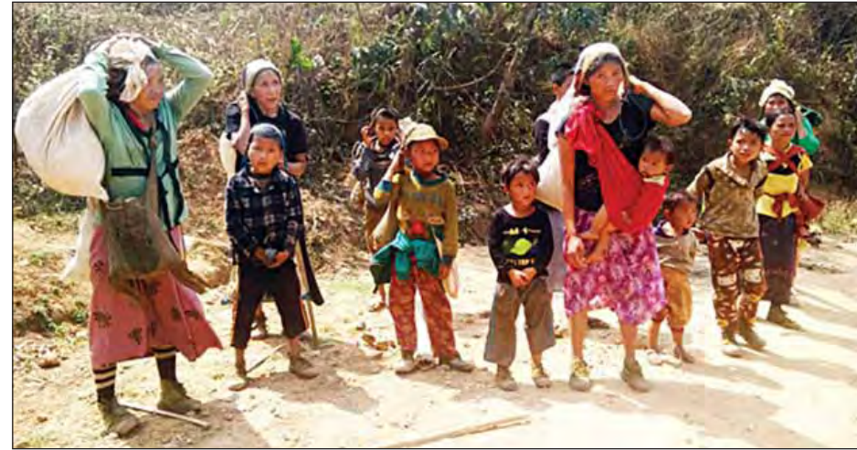
ရှမ်းမြောက်ဒေသရှိ စစ်ဘေးရှောင်မိသားစုတို့တွေ့ရစဉ်။