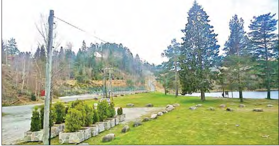
ဒေါ်အောင်ဆန်းစုကြည်ပန်းခြံမှ မြင်ကွင်းများ။