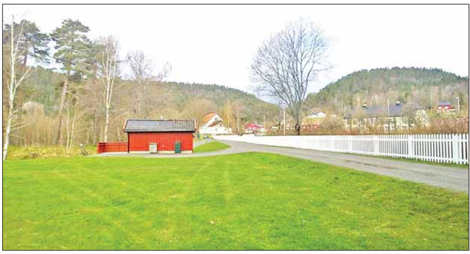
ဒေါ်အောင်ဆန်းစုကြည်ပန်းခြံမှ မြင်ကွင်းများ။