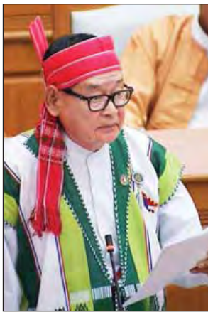
ဖာပွန်မဲဆန္ဒနယ်မှ ဦးစောထွန်းမြအောင်။

တပ်မတော်သားလွှတ်တော်ကိုယ်စားလှယ် ဗိုလ်မှူးချုပ်သန်းလွင်က ယနေ့ခေတ်တွင် ကမ္ဘာ့နိုင်ငံအသီးသီးသည် မိမိတပ်မတော်ကို စွမ်းရည်တိုးမြှင့်ပြီး ခေတ်မီရန် ဘက်စုံနည်းလမ်းများဖြင့် တည်ဆောက်လျက်ရှိကြောင်း၊ မြန်မာ့တပ်မတော်အနေဖြင့်လည်း နိုင်ငံတကာတပ်မတော်များ၏ ဆောင်ရွက်ပုံနည်းလမ်းများနှင့် အတွေ့အကြုံများကို သိရှိခြင်းအားဖြင့် မြန်မာ့တပ်မတော်ကို Standard Army အဖြစ် မြှင့်တင်ရာတွင် အထောက်အကူရရှိစေမည်ဖြစ်ကြောင်း