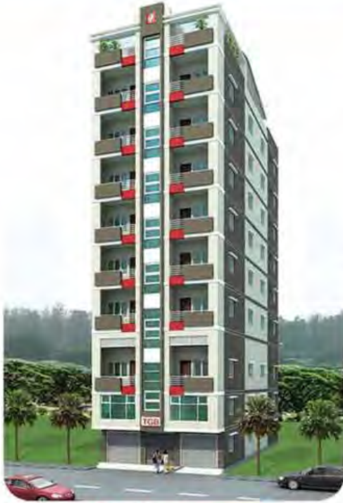
8 1/2 Stories ငြိမ်းမှု ၁၀၀% အမှတ်(၂၂)၊ ဒေါ်နုလမ်း၊ ရေကျော်၊ ပုဇွန်တောင်မြို့နယ်။