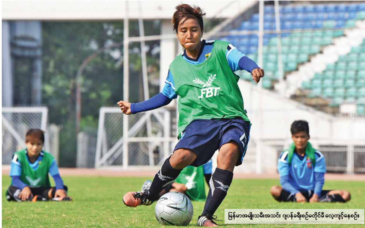
မြန်မာအမျိုးသမီးအသင်း ဂျပန်ခရီးစဉ်မတိုင်မီ လေ့ကျင့်နေစဉ်။