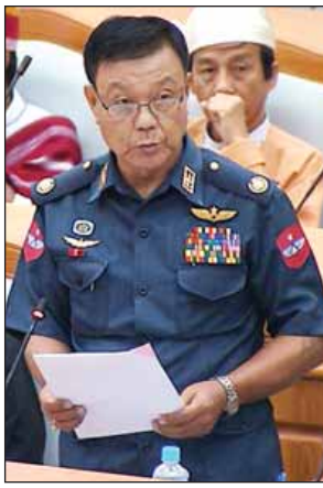
တပ်မတော်သား လွှတ်တော် ကိုယ်စားလှယ် ဗိုလ်မှူးချုပ်သန်းလွင်။