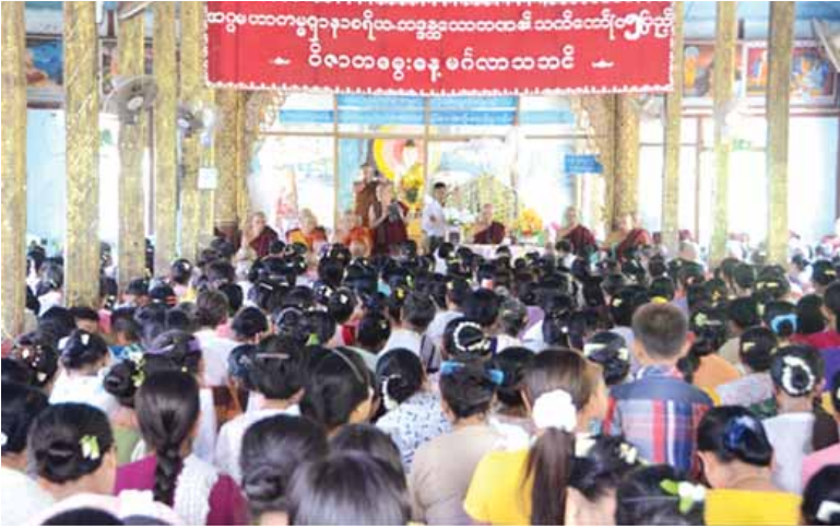
နေပြည်တော်ကောင်စီနယ်မြေ ဥက္ကဋ္ဌသိရီစိုရိုင် ပုပ္ဖသိရီမြို့နယ် ဝဲကြီးအုပ်စု ဆင်ဖြူကျွန်း၊ သုဝဏ္ဏဘူမိ စေတီဝန်ကျောင်းတိုက်၏ ပဓာနနာယကဆရာတော် အဂ္ဂမဟာကမ္မဋ္ဌာနာစရိယဘွဲ့တံဆိပ်တော်ရ ဘဒ္ဒန္တသောဘဏ၏ သက်တော် ၈၅ နှစ်ပြည့် ဝိဇာတဗျူးနေ့မင်္ဂလာကို မေ ၈ ရက် တနင်္ဂနွေနေ့က ကျင်းပခဲ့သည်။ သတင်းနှင့်စာတတ်ပုံ-ကြေးမုံ