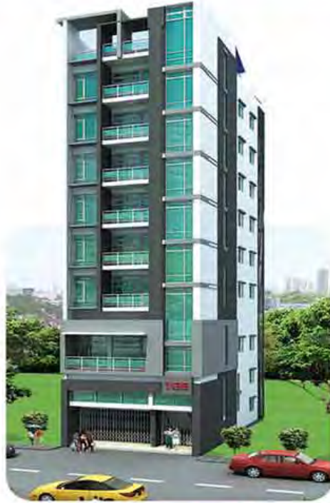
8 1/2 Stories ငြိမ်းမှု ၁၀၀% အမှတ်(၁၉)၊ မဟာဘောဂလမ်း၊ ရေကျော်၊ မင်္ဂလာတောင်ညွန့်မြို့နယ်။