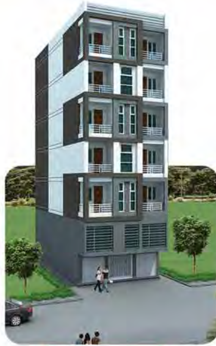
6 Stories ငြိမ်းမှု ၁၀၀% အမှတ်(၂၀)၊ ယုဒေလမ်း၊ ရေကျော်၊ ပုဇွန်တောင်မြို့နယ်။