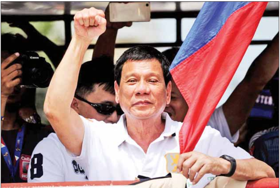
သမ္မတရွေးကောက်ပွဲတွင် ရေပန်းစားနေသော ဒက်ပိုးမြို့တော်ဝန် ရီဒီဂိုဒေးတော့။