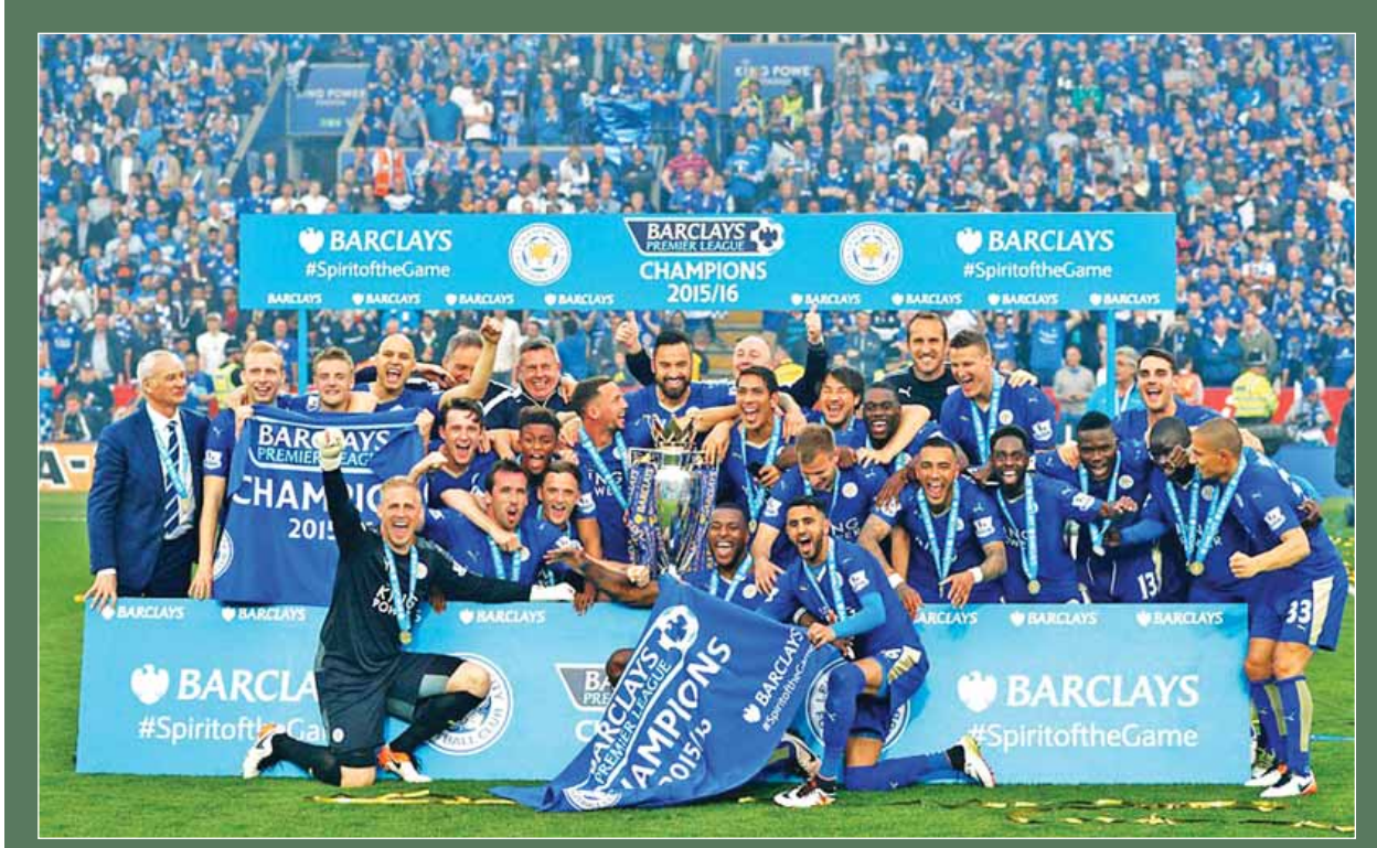
၁၃၂ နှစ်တာကာလအတွင်း လက်စတာစီးတီးအသင်း၏ ပထမဆုံးရယူဆွတ်ခူးနိုင်ခဲ့သည့် ပရီမီယာလိဂ်ဖလားနှင့်အတူ အိမ်ကွင်းကင်းပါဝါ၌ လက်စတာစီးတီးကစားသမားများ အောင်ပွဲခံစဉ်။ (ငွေကြယ်)

အုပ်စုနောက်ဆုံးပွဲစဉ်အဖြစ် ရန်ကုန်အသင်းမှာ မော်လဒိုက်ကလပ် မာဇီယာအသင်းနှင့် ည ၇ နာရီခွဲတွင် သုဝဏ္ဏကွင်း၌ ယှဉ်ပြိုင်ကစားမည်ဖြစ်ပြီး ဧရာဝတီအသင်းမှာ အဝေးကွင်းပွဲစဉ်အဖြစ် မြန်မာစံတော်ချိန် ည ၇ နာရီ ၁၅ မိနစ်တွင် လာအိုကလပ် လာအိုတိုယိုတာအသင်းနှင့် ယှဉ်ပြိုင်ရမည်ဖြစ်သည်။ အုပ်စုပွဲစဉ် (၅) အပြီးတွင် မြန်မာကလပ်အသင်း နှစ်သင်းအနက် ဧရာဝတီအသင်းမှာ အုပ်စုအဆင့်မှထွက်ခဲ့ပြီး ရန်ကုန်အသင်းသာ မျှော်လင့်ချက်ရှိနေခြင်းဖြစ်သည်။ ရန်ကုန်အသင်းသည် ရှုံးထွက်အဆင့်သို့ တက်ရောက်နိုင်ရန် အခွင့်အရေးရှိနေသော်လည်း နောက်ဆုံးပွဲတွင် အနိုင်ရရန်လိုအပ်နေသည့်အပြင် တောင်တရုတ်အသင်း၏ ပွဲရလဒ်ကိုလည်း စောင့်ကြည့်ရမည်ဖြစ်သည်။ ရန်ကုန်အသင်းမှာ အုပ်စု (G)တွင်ပါဝင်နေပြီး ပွဲစဉ် (၅)အပြီးတွင် အိန္ဒိယကလပ် မိုဟန်ဘောဂ်အသင်းက ရမှတ် ၁၁ မှတ်ဖြင့် အုပ်စုပထမရရှိကာ နောက်တစ်ဆင့်တက်သွားပြီဖြစ်သည်။ အုပ်စုဒုတိယနေရာအတွက် အသင်းသုံးသင်းလုံး မျှော်လင့်ချက်ရှိနေပြီး ဟောင်ကောင်ကလပ် တောင်တရုတ်အသင်းက ခြောက်မှတ်၊ စာမျက်နှာ ၉ ကော်လံ ၄ သို့