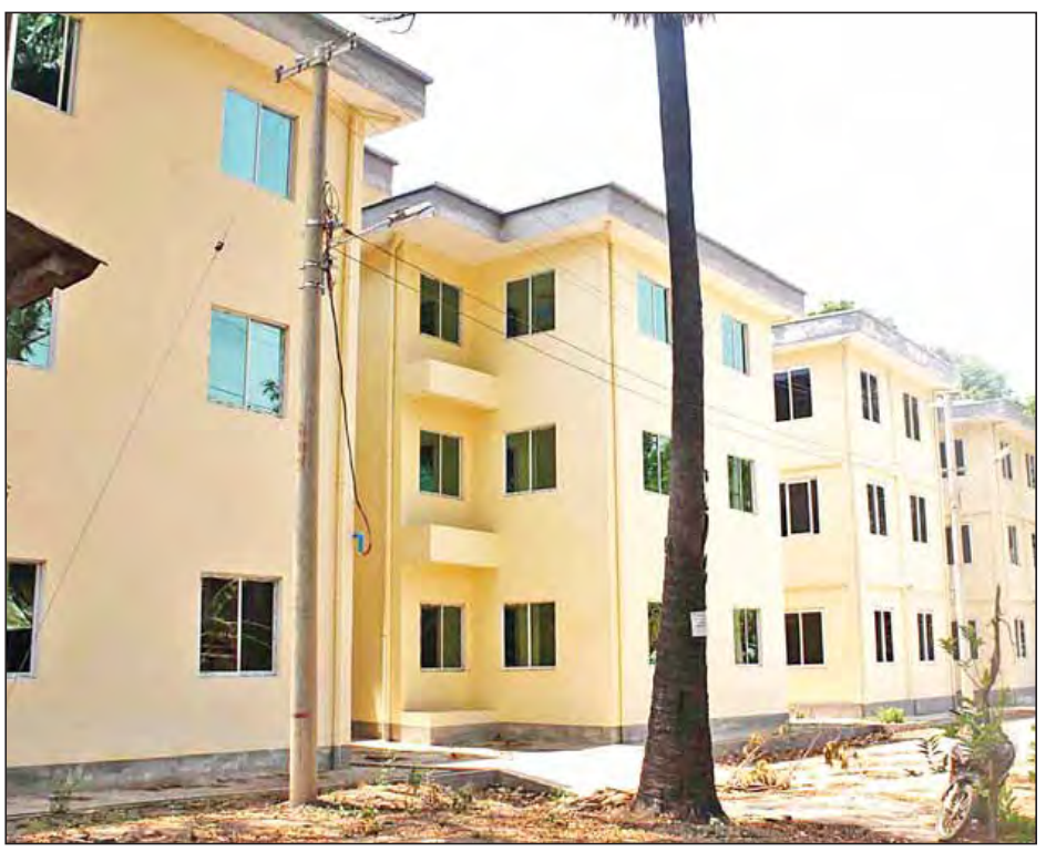
မောင်ကို (သာစည်)

နေ့စဉ်သာစည်ဘူတာမှ နံနက် ၆ နာရီတွင် ထွက်ခွာပြီး ပျော်ဘွယ်ဘူတာသို့ နံနက် ၇ နာရီခွဲတွင် စိုက်ရောက်၍ ပျော်ဘွယ်ဘူတာမှ မွန်းတည့် ၁၂ နာရီတွင် ပြန်လည်ထွက်ခွာလာပြီး သာစည်ဘူတာသို့ မွန်းလွဲ ၁ နာရီခွဲတွင် စိုက်ရောက်သည်။ ကြားဘူတာများဖြစ်သည့် နွားထိုး၊ ညောင်ရမ်း၊ ရှမ်းရွာဘူတာများတွင် ခေတ္တရပ်ထား၍ ခရီးသည်များ တင်ဆောင်ကြောင်းနှင့် ရထားစီးလက်မှတ်ခမှာ သာစည်မှနွားထိုးဘူတာသို့ ကျပ် ၅၀၊ ညောင်ရမ်းဘူတာသို့ ကျပ် ၁၀၀၊ ရှမ်းရွာဘူတာသို့ ကျပ် ၁၅၀ နှင့် ပျော်ဘွယ်ဘူတာသို့ ကျပ် ၂၀၀ တို့ဖြစ်သည်။ အဆိုပါ RBE ခေါက်တိုရထားဖြင့် သာစည်မှ ပျော်ဘွယ်မြို့သို့ ငါးကုန်သည်များ၊ အဝတ်အထည်မျိုးစုံရောင်းချသည့် အထည်ကုန်သည်များ၊ ရေမွှေးပန်းရောင်းချသည့် သနပ်ကန်ကျေးရွာမှ ပန်းသည်များနှင့် ညောင်ရမ်းကျေးရွာနှင့်ပျော်ဘွယ်မြို့တွင် တာဝန်ထမ်းဆောင်လျက်ရှိသည့် ပညာရေးဝန်ထမ်းများ အားထားစီးနင်းကြကြောင်း သိရသည်။