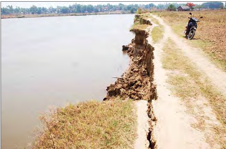
ဆောင်ရွက်ပေးမှ အဆင်ပြေမှာပါ” အတွင်း မြို့လှမြို့အရှေ့၊ ဆွာမြို့၊ ဟု အထက်ပါတောင်သူများကပင် အရှေ့၊ ရွှေကလေးကျေးရွာနှင့် ပြောသည်။ ရေတာရှည်မြို့နယ် ရေတာရှည်မြို့အရှေ့၊ ကျွဲရိုင်းပြင် ကျေးရွာများတွင် ကမ်းပါးပြိုကျမှုများနှင့် ရင်ဆိုင်ခဲ့ကြရသည်ကို တွေ့ရသည်။ ကိုလွင်(ဆွာ)

ရေတာရှည် မေ ၈ ပဲခူးတိုင်းဒေသကြီး ရေတာရှည် မြို့နယ်တွင် မြောက်မှတောင်သို့ စီးဆင်းသည့် စစ်တောင်းမြစ်သည် စိုက်ပျိုးရေးလုပ်ငန်းလုပ်ကိုင်သည့် တောင်သူများအတွက် များစွာအကျိုးဖြစ်ထွန်းလျက်ရှိသော်လည်း နွေရာသီကာလ မြစ်ရေအတိုးအလျှော့ကြောင့် မြစ်ကမ်းပါးများ ပြိုကျမှုများရှိခဲ့ရာ တောင်သူများ၏ စိုက်ခင်းသီးနှံများပါ ပျက်စီးဆုံးရှုံးမှုများနှင့် ကြုံတွေ့နေရကြောင်း ကတ္တဲကျေးရွာအုပ်စုနေ တောင်သူများက ပြောသည်။ “အခုအချိန်က ရေနည်းနေသေးတော့ ကမ်းပါးပြိုတာနဲ့နေသေးတယ်။ မိုးဦးကျလောက်ဆိုရင် တအားပြိုတာ ကျန်တော်တို့တောင်သူတွေရဲ့ပဲစိုက်ခင်းတွေ အတော်များများပါကုန်ပြီ။ မြစ်ထိန်းနံရံ တည်ဆောက်ဖို့ဆိုတာက လည်း မတတ်နိုင်ကြဘူးလေ။ သက်ဆိုင်ရာ တာဝန်ရှိသူတွေက