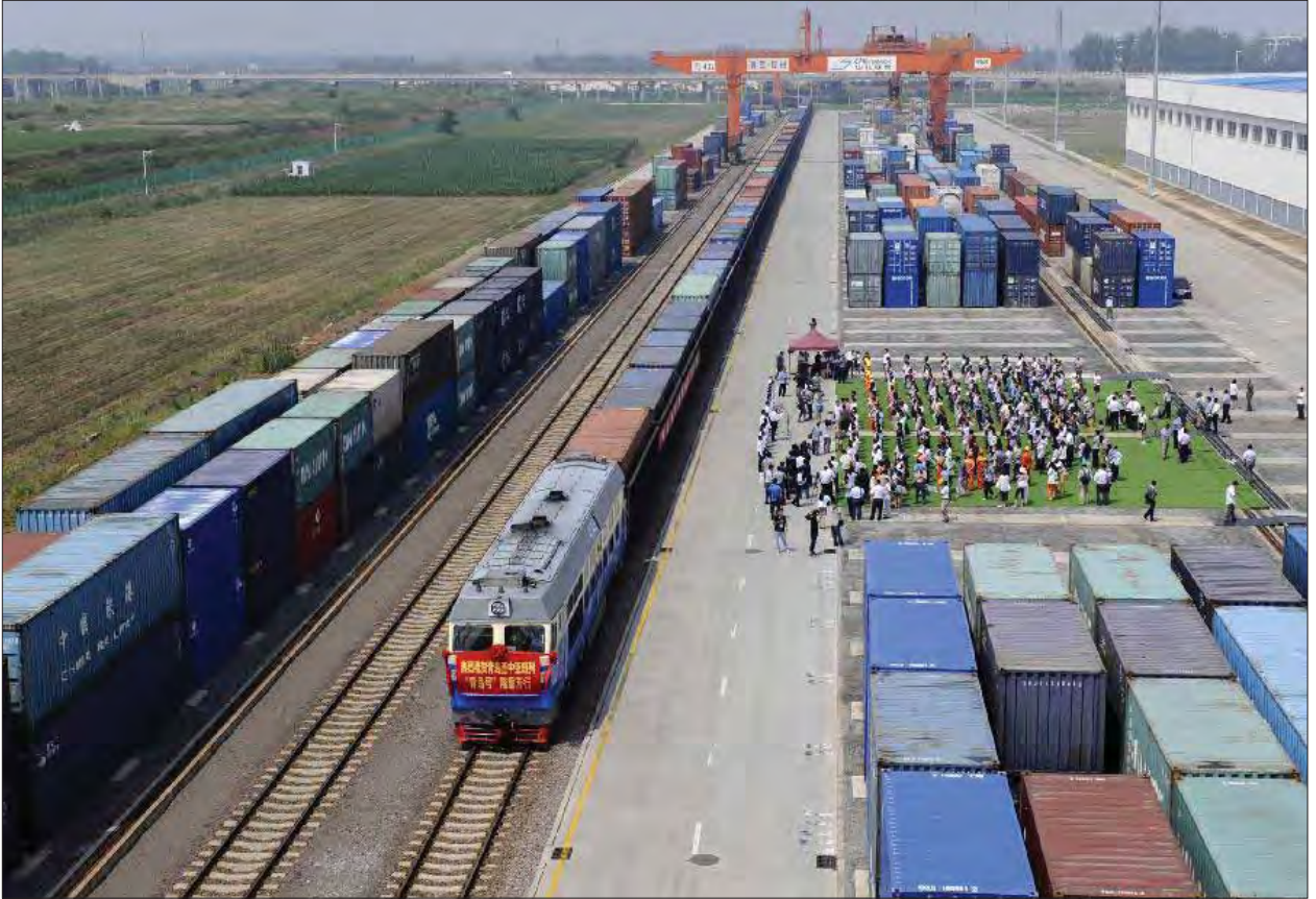
(တရုတ်ပြည်အရှေ့ပိုင်း ရှန်တုန်းပြည်နယ် ကျင်းတောင်မြို့မှ အာရှအလယ်ပိုင်းနိုင်ငံများအထိ ကုန်ပစ္စည်းပို့ဆောင်ပေးနိုင်မည့် ရထားလမ်းပိုင်းကို ၂၀၁၅ ခုနှစ် ဇူလိုင်လက စတင်ဖွင့်လှစ်ခဲ့သည်)

“ ပင်လယ်ရေလမ်းကြောင်းလုံခြုံရေးကို ထိန်းသိမ်း ထားရှိနိုင်ဖို့အတွက် သမားရိုးကျမဟုတ်တဲ့ လုံခြုံရေးဆိုင်ရာ ပူးပေါင်းဆောင်ရွက်မှု လုပ်ငန်းစဉ်တွေဖြစ်တဲ့ ပင်လယ်စားပြ တိုက်ဖျက်ရေး၊ ပင်လယ်ပြင်ကယ်ဆယ်ရေး လုပ်ငန်းတွေနဲ့ နိုင်ငံစုံပါဝင်တဲ့ တရားဥပဒေစိုးမိုးရေး လုပ်ငန်းတွေကို ပူးတွဲ ဆောင်ရွက်သွားကြရမှာ ဖြစ်ပါတယ်။ ”