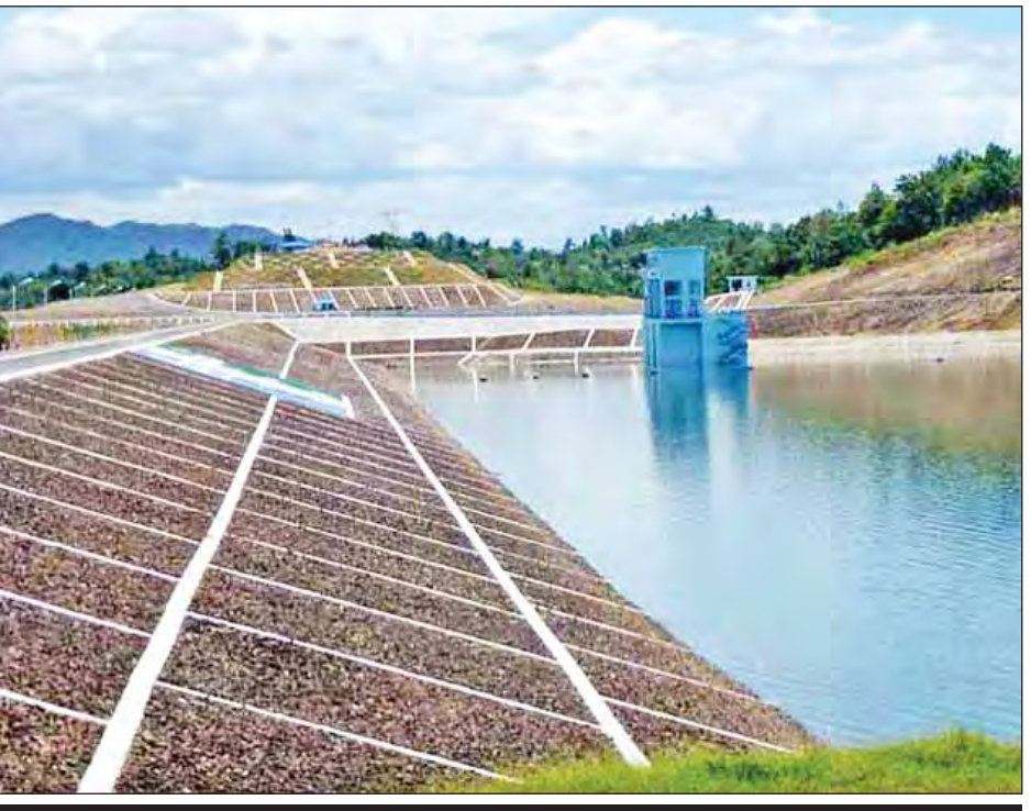
၂၀၁၅ ခုနှစ် မိုးရာသီမတိုင်မီ ကျီးအုံကျီးဝ ရေလှောင်တံမံအား တွေ့ရစဉ်။

စစ်ကိုင်းတိုင်းဒေသကြီးနှင့် ချင်းပြည်နယ်နယ်စပ်ရှိ ရာဇဂြိုဟ်အထက်ရှိ သဘာဝမြေပြိုကန်နှင့်ပတ်သက်ပြီး ကြားသိရသည့် အခြေအနေများနှင့် ဌာန၏သုံးသပ်ချက်အရ စိုးရိမ်စရာမလိုကြောင်း မြေပြိုကန်သို့ သွားရောက်ခဲ့သည့် ပညာရှင်များကလည်း ဓာတ်ပုံ/ဗီဒီယိုအထောက်အထားများဖြင့် ရှင်းလင်းတင်ပြပြီးဖြစ်ကြောင်းနှင့် ရာဇဂြိုဟ်ဆည်ကြောင့်လည်း ကလေးမြို့ ရေကြီးနစ်မြုပ်မှုဖြစ်နိုင်ကြောင်း ဆည်မြောင်းနှင့် ရေအသုံးချမှုစီမံခန့်ခွဲရေးဦးစီးဌာန ညွှန်ကြားရေးမှူးချုပ်က ပြောသည်။