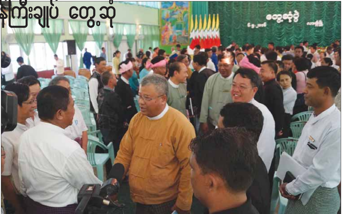
သောက်သုံးရေရရှိရန် ဖြည့်ဆည်းဆောင်ရွက်ပေးရေးနှင့် မိုင်းရယ်မြို့နယ်ဖွံ့ဖြိုးတိုးတက်ရေးအထောက်အကူပြုကော်မတီမှ မိုင်းရယ်မြို့နယ်အတွင်း လေပြင်းတိုက်ခတ်မှုကြောင့်

သည့်အတွက် မြို့မိမြို့ဖများနှင့်တွေ့ဆုံရသည်မှာ ဝမ်းသာကြောင်း၊ မိမိတို့အဖွဲ့အစည်း လိုအပ်ချက်များရှိပါက မြို့မိမြို့ဖများအနေဖြင့် အကြံကောင်း ဉာဏ်ကောင်းများပေးနိုင်ကြောင်း၊ ပြည်သူ့ကိုယ်စားပြု မြို့မိမြို့ဖများအနေဖြင့်လည်း လိုအပ်ချက်များကို တင်ပြဆွေးနွေးအကြံပြုနိုင်ကြောင်း ပြောကြားခဲ့သည်။ ဆက်လက်၍ လားရှိုးမြို့ ဒေသဖွံ့ဖြိုးတိုးတက်ရေးအတွက် မြို့နယ်ဖွံ့ဖြိုးတိုးတက်ရေးအထောက်အကူပြုကော်မတီ၊ မြို့နယ်စည်ပင်သာယာရေးကော်မတီနှင့် မြို့မိမြို့ဖများက မြို့မိမြို့ဖကြီးဘေးပတ်လည် မော်တော်ယာဉ်ပိတ်ဆို့မှု ကင်းရှင်းရေးအတွက် မြို့မိမြို့ဖများက ဈေးတန်းအပေါ်ထပ်ကို မော်တော်ယာဉ်ရပ်နားရန်နေရာ အသုံးပြုခွင့်ပြုရေး၊ မန္တလေး-လားရှိုး-မူဆယ် ပြည်ထောင်စုလမ်းမကြီးတွင် ယာဉ်ကြောပိတ်ဆို့မှုမရှိစေဘဲ အဆင်ပြေချောမွေ့ပြီး ခရီးသည်များ စိတ်ချမ်းမြေ့လွယ်ကူစွာသွားလာနိုင်ရေး၊ အမှတ်(၄)အခြေခံပညာအထက်တန်းကျောင်း၏ ကျောင်းဆောင်သစ်များ တိုးချဲ့ဆောက်လုပ်ပေးရေး၊ ရပ်ကွက်(၁၂)ရှိ အေတီတံတားမြောက်ဘက်နေ ပြည်သူလူထုအတွက် သန့်ရှင်းသော