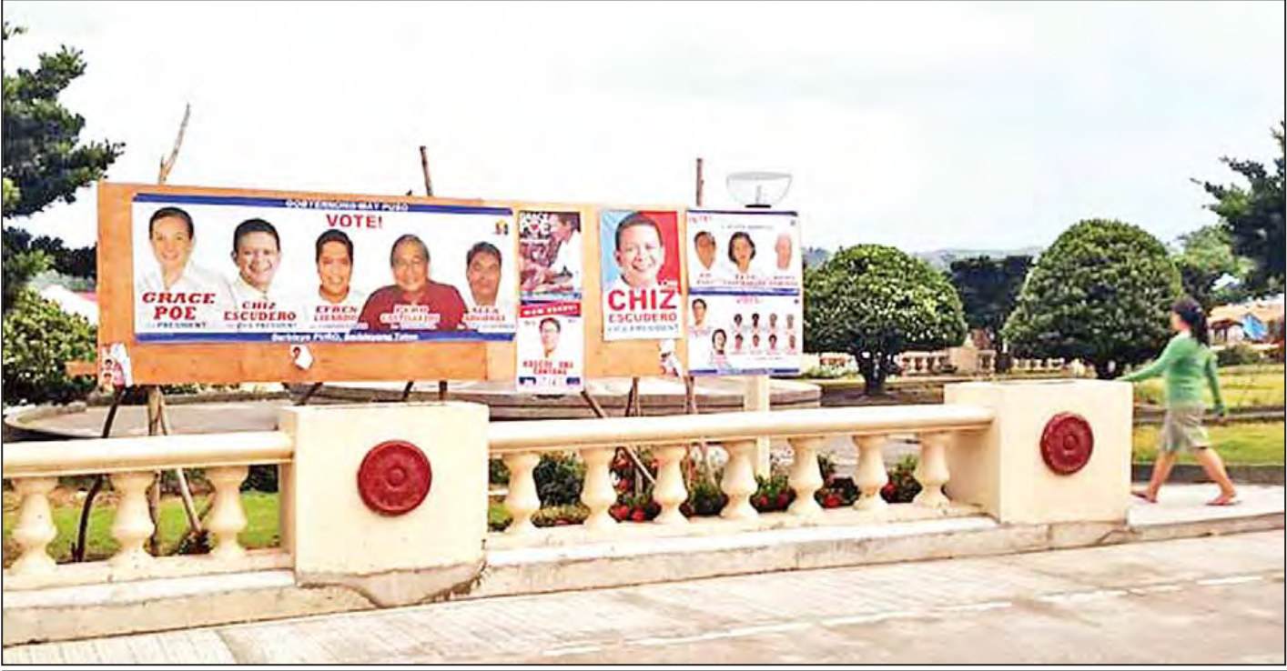
ဖိလစ်ပိုင်နိုင်ငံ ရွေးကောက်ပွဲအတွက် မဲဆွယ်ပုံစံတာများ။

အဆောက်အအုံတွေ လုံလုံလောက်လောက် တိုးချဲ့ရင်းနှီးမြှုပ်နှံမှု ပြောဆိုစည်းရုံးခဲ့သလို လယ်ယာမြေပြုပြင်ရေးနဲ့ အခွန်စနစ် ပြုပြင်ရေးတို့ကိုလည်း ရှင်းလင်းစည်းရုံးခဲ့ပါတယ်။ နောက်သမ္မတလောင်းတစ်ဦးကတော့ ဂျက်ဂျိုးမားဘီနေးပါ။ ဂျက်ဂျိုးမားဘီနေးဟာ အသက်ကိုးနှစ်မှာ မိဘမဲ့ဖြစ်ခဲ့ပေမယ့် ရှေးနေတစ်ဦးဖြစ်လာအောင် ကြိုးစားနိုင်ခဲ့ပါတယ်။ ရှေးနေဘဝမှာ ဂျက်ဂျိုးမားဘီနေးဟာ အာဏာရှင် ဖာဒီနန်မားကိုစ်ကြောင့် အကျဉ်းကျခံနေရတဲ့ နိုင်ငံရေးအကျဉ်းသားတွေအတွက် တက်တက်ကြွကြွဆောင်ရွက်ပေးခဲ့ပါတယ်။ ၂၀၁၀ ခုနှစ်မှာ ဂျက်ဂျိုးမားဘီနေးဟာ ဒုသမ္မတဖြစ်လာပါတယ်။ ဒုသမ္မတဘဝမှာ ဂျက်ဂျိုးမားဘီနေးဟာ အကျင့်ပျက်လာဘိစားမှုပြဿနာတွေမှာ ပါဝင်ပတ်သက်နေတယ်ဆိုတဲ့သတင်းတွေ ကျယ်ကျယ်ပြန့်ပြန့်ထွက်ပေါ်ခဲ့ပေမယ့်လည်း ဂျက်ဂျိုးမားဘီနေးကတော့ ဒီလိုစွပ်စွဲမှုတွေဟာ နိုင်ငံရေးတိုက်တွက်တွေပါလို့ တုံ့ပြန်ပြောဆိုခဲ့ပါတယ်။ မင်ဒါနာအိုကျွန်းကိုယ်ပိုင်အုပ်ချုပ်ခွင့်ပိုပေး/မပေးဆိုတဲ့ကိစ္စရပ်မှာ ဂျက်ဂျိုးမားဘီနေးရဲ့ အယူအဆဟာ တစ်မူထူးခြားပါတယ်။ မင်ဒါနာအိုကျွန်းချမ်း