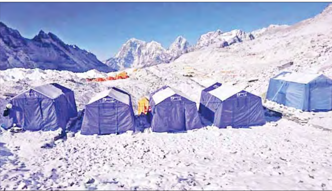
ဝေရက်တောင်သို့တက်ရောက်နေသော မြန်မာတောင်တက်သမားများ စခန်းချနေရာအား တွေ့ရစဉ်။