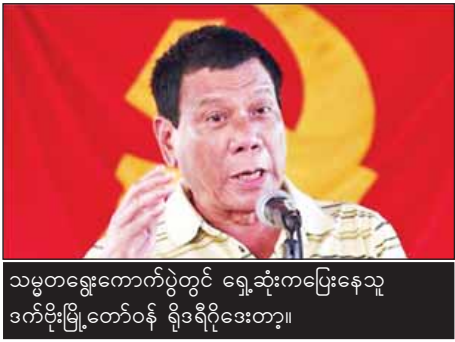
သမ္မတရွေးကောက်ပွဲတွင် ရွေးဆုံးကပြေးနေသူ ဒက်ဗိုးမြို့တော်ဝန် ရိုဒရီဂိုဒေးတာ့