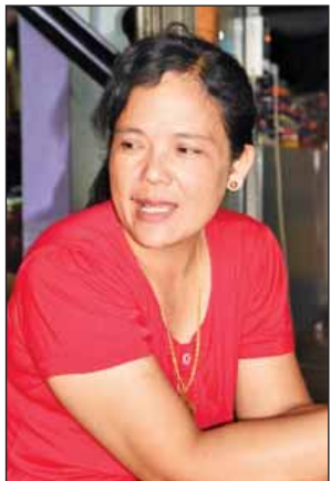
အင်းလေးဒေသခံ မထွေးညို

သစ်ပင်ခတ်ခြင်းကို တင်းတင်းကျပ်ကျပ်တားမြစ်ပြီး ရှိပြီးသား သစ်တောကို ထိန်းသိမ်းကာ သစ်ပင်များစိုက်ရန် လိုအပ်ကြောင်းဒေသခံများအား ထင်အစားထိုးစွမ်းအားမြှင့်မီးဖိုများ အခမဲ့ပေးဝေပြီး လျှပ်စစ်ရရှိသည့် ကျေးရွာများတွင် လျှပ်စစ်နှင့် ချက်ပြုတ်နိုင်ရန် ဆွေးနွေးအကောင်အထည်ဖော်ရန် လိုအပ်ကြောင်း၊ အင်းလေးကန် ရေအရည်အသွေး နိမ့်ကျမှု ဖြစ်ပေါ်နိုင်သည့် စိုက်ပျိုးရေးတွင် အသုံးပြုသည့် ဓာတ်မြေဩဇာနှင့် ပိုးသတ်ဆေးများ၊ နေအိမ်များတိုးချဲ့ ဆောက်လုပ်ခြင်းနှင့် အညစ်အကြေးများ ရေထဲတိုက်ရိုက် စွန့်ထုတ်ခြင်းများကို ကုစားရန်လိုအပ်ကြောင်း၊ ကန်အတွင်းစီးဝင်သည့် အဓိက ချောင်းကြီးလေးချောင်းအား သဘာဝနန်းစစ်အဖြစ် ကိုင်းပင်လိုအပ်ပင်များ အကန့်လိုက်စိုက်ပျိုးပြီး ကန်အတွင်း ရေမှော်များ ခေတ်မီစက်များဖြင့် ရှင်းလင်းကာ မြက်စားငါးကြင်းများ ကောင်ရေသန်းချီမွေးရန် လိုအပ်ကြောင်းကို ပြောကြားခဲ့သည်။ အင်းလေးကန်ရေရှည်တည်တံ့ရေးအတွက် အမျိုးသားရေးတာဝန် တစ်ရပ်အနေဖြင့် နိုင်ငံတော်၊ ပြည်နယ်အစိုးရ၊ ပြည်သူ့လူထုနှင့် အတူတကွ ပူးပေါင်းဆောင်ရွက်ကာ နိုင်ငံတကာအဖွဲ့အစည်းများ၊ လူမှုရေးအသင်းအဖွဲ့များက ပံ့ပိုးကူညီလုပ်ဆောင်မှုဖြင့် အားလုံးပိုင်းဝန်းကူညီဆောင်ရွက်သွားပါက အောင်မြင်မှုများ ရရှိနိုင်မည်ဖြစ်ကြောင်း သိရသည်။