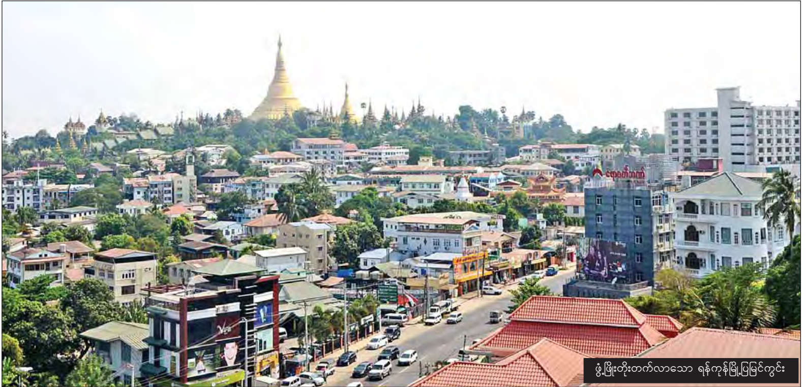
ဖွံ့ဖြိုးတိုးတက်လာသော ရန်ကုန်မြို့ပြမြင်ကွင်း