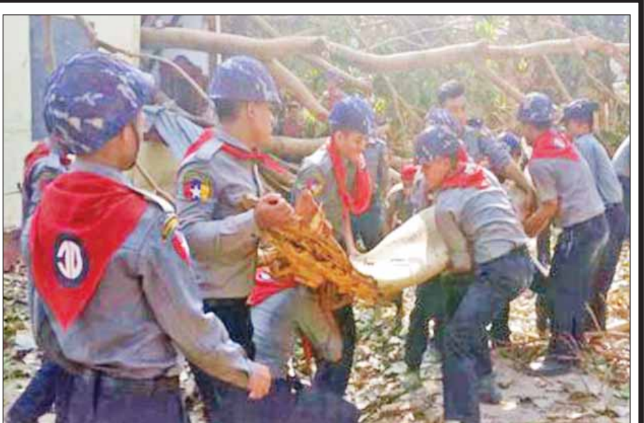
အမှတ်(၁၀)/(၂၇)လုံခြုံရေးရဲတပ်ဖွဲ့မှူးများမှ ရဲတပ်ဖွဲ့ဝင်များ၊ မြို့မ/နယ်မြေ/ရဲကင်းစခန်းမှူးများ ဦးစီးသည့်အဖွဲ့များက မေ ၇ ရက်တွင် စစ်ကိုင်းတိုင်းဒေသကြီး တောလင်းမြို့နယ်၊ မကွေးတိုင်းဒေသကြီး ပွင့်ဖြူမြို့နယ်၊ ဆင်ပေါင်ပဲမြို့နယ်၊ အောင်လံမြို့နယ်၊ ပခုက္ကူမြို့နယ်၊ ရေဝကြိုမြို့နယ်၊ မြိုင်မြို့နယ်တို့တွင် ကယ်ဆယ်ရေး၊ ပြန်လည်ထူထောင်ရေးနှင့် ပိတ်ဆို့နေသည့်လမ်းများရှင်းလင်းရေးလုပ်ငန်းများတွင် ကူညီဆောင်ရွက်ပေးခဲ့ကြစဉ်။ (ရဲပြန်ကြား)

* ကမ္ဘာ့အမြင့်ဆုံးမှ ရာသီဥတုနှင့် ကျန်းမာရေးအခြေအနေများအားလုံးကို စစ်ဆေးချက်ယူကာ လေ့ကျင့်ရေးလုပ်ငန်းများ ဆောင်ရွက်နေကြောင်း သိရသည်။ ထိုမှတစ်ဆင့် အခြေအနေအားလုံး အသင့်ဖြစ်သည်နှင့်တစ်ပြိုင်တည်း နိုင်ငံတကာတောင်တက်သမားများသည် သတ်မှတ်ထားသော Camp -3 မှ အမြင့်ပေ ၈၀၀၀ ရှိ သေမင်းတမန်ဇုန်(Dead Zone)သို့ ဆက်လက်တက်ရောက်ကြမည်ဖြစ်သည်။ လက်ရှိအချိန်တွင် တောင်တက်သမားများစွာတို့သည် အမြင့်ပိုင်းဆိုင်ရာတွင်ဖြစ်တတ်သည့် ဖျားနာမှု (altitude sickness)ရောဂါများ ခံစားနေရကြောင်း သိရသည်။ ထိုရောဂါမှာ တောင်ပေါ်ဆောင်ဦးရာသီဥတု၏ မတည်ငြိမ်သော ရာသီဥတုဒဏ်များကို တွေ့ကြုံခံစားနေကြရ