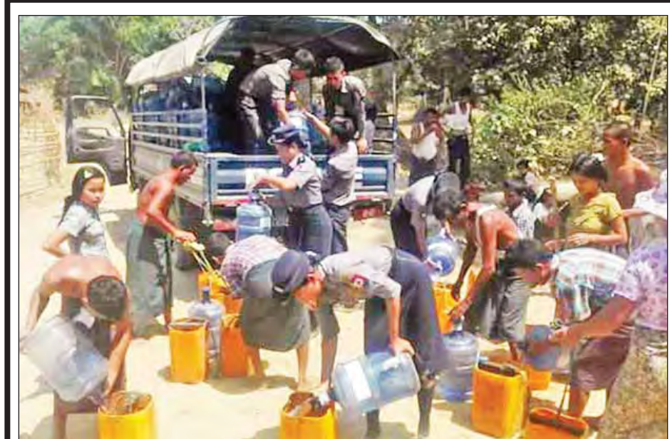
တိုင်းဒေသကြီးရဲတပ်ဖွဲ့မှူး၊ ခရိုင်ရဲတပ်ဖွဲ့မှူး၊ မြို့နယ်ရဲတပ်ဖွဲ့မှူးများ ဦးစီးသည့်အဖွဲ့များက မေ ၇ ရက်တွင် ရန်ကုန်တိုင်းဒေသကြီး လှည်းကူးမြို့နယ်၊ မန္တလေးတိုင်းဒေသကြီး ညောင်ဦးမြို့နယ်၊ ရခိုင်ပြည်နယ် မာန်အောင်မြို့နယ်၊ မွန်ပြည်နယ် ဘီးလင်းမြို့နယ်၊ ပေါင်မြို့နယ်၊ ပဲခူးတိုင်းဒေသကြီး သနပ်ပင်မြို့နယ်တို့တွင် သောက်သုံးရေကလီ ၁၈၁၀၀ ကို မြို့နယ်အတွင်းရှိ ရေရွာပေးသည့် နေရာဒေသအသီးသီးသို့ သွားရောက်လှူဒါန်းခဲ့ကြစဉ်။

နေပြည်တော် မေ ၈ ထိုင်းနိုင်ငံဝန်ကြီးချုပ် မစ္စတာ ပရာယုဒ်ချန်အိုချာ၏ အထူးကိုယ်စားလှယ် ထိုင်းနိုင်ငံ နိုင်ငံခြားရေးဝန်ကြီး H.E.Mr. Don Pramudwinai နှင့်အဖွဲ့သည် ယနေ့ညနေ ၆ နာရီခွဲတွင် နေပြည်တော်သို့ရောက်ရှိလာရာ နိုင်ငံခြားရေးဝန်ကြီးဌာန နိုင်ငံရေးရာဇဝဏ္ဏီဌာန ညွှန်ကြားရေးမှူးချုပ် ဦးကျော်ဇေယျနှင့် တာဝန်ရှိသူများနှင့် မြန်မာနိုင်ငံဆိုင်ရာ ထိုင်းနိုင်ငံသံအမတ်ကြီးတို့က နေပြည်တော်အပြည်ပြည်ဆိုင်ရာလေဆိပ်၌ ကြိုဆိုနှုတ်ဆက်ကြသည်။ ထိုင်းနိုင်ငံခြားရေးဝန်ကြီးသည် မေ ၉ ရက်တွင် နိုင်ငံတော်သမ္မတ ဦးထင်ကျော်၊ နိုင်ငံခြားရေးဝန်ကြီးဌာန ပြည်ထောင်စုဝန်ကြီး ဒေါ်အောင်ဆန်းစုကြည်တို့နှင့် တွေ့ဆုံဆွေးနွေးမည်ဖြစ်ကြောင်း သိရသည်။ (သတင်းစဉ်)