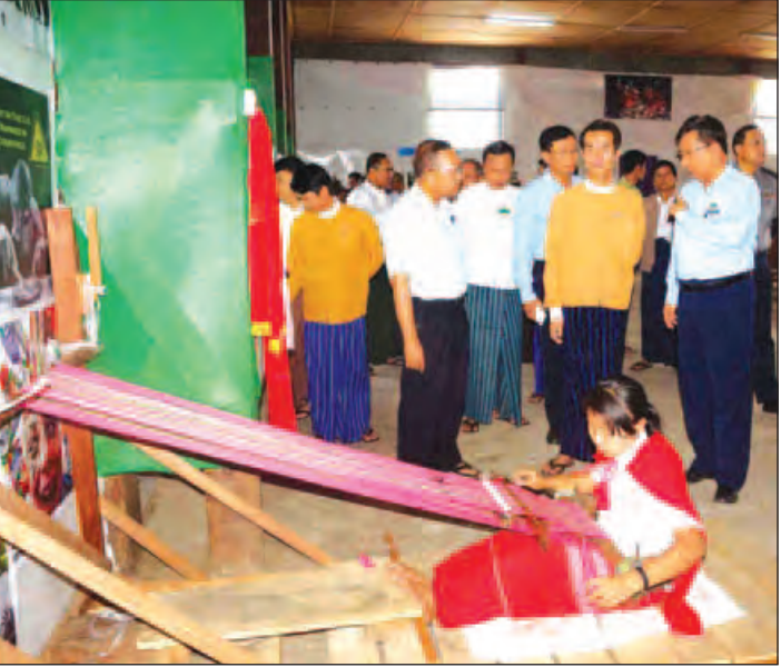
အတွင်း လှည့်လည်ကြည့်ရှုခဲ့ကြသည်။ ကြားရေးမှူးချုပ် (တာဝန်)၊ ဌာနဆိုင်ရာ အဆိုပါအခမ်းအနားသို့ ကယားပြည်နယ် ဝန်ကြီးချုပ်၊ အစိုးရအဖွဲ့ဝင်ဝန်ကြီးများ၊ မြန်မာကုန်သွယ်မှုမြှင့်တင်ရေးအဖွဲ့မှ ညွှန်ကြားရေးမှူးချုပ် (တာဝန်)၊ ဌာနဆိုင်ရာ အကြီးအကဲများ၊ ကုန်သည်လုပ်ငန်းရှင်များ တက်ရောက်ကြကြောင်း သိရသည်။ ကိုနိုင်း (လွိုင်ကော်)

ရေးနှင့် ကူးသန်းရောင်းဝယ်ရေးဝန်ကြီးဌာန မြန်မာကုန်သွယ်မှု မြှင့်တင်ရေး အဖွဲ့ကနေ ကယားပြည်နယ် လွိုင်ကော်မြို့တွင် ကန္တာရဝတီ ကုန်သွယ်မှုဗဟိုဌာနကို စတင်ဖွင့်လှစ် ရခြင်းဖြစ်ကြောင်း၊ မိမိပြည်နယ်က ထွက်ရှိသော ကုန်ပစ္စည်းများ၏ သတင်းအချက်အလက်များအား ကမ္ဘာ့အရပ်ရပ်ကုန်သည်များဆီသို့ ကြော်ငြာပေးမည့် နေရာဖြစ်ကြောင်း၊ ဒေသခံကုန်သည်များ၏ လုပ်ငန်းအောင်မြင်စေရန် ဝန်ဆောင်မှုများအား ဆောင်ရွက်ပေးသွားမည့် နေရာဖြစ်ကြောင်း ပြောကြားခဲ့သည်။ ဆက်လက်၍ မြန်မာကုန်သွယ်မှု မြှင့်တင်ရေးအဖွဲ့မှ ညွှန်ကြားရေးမှူးချုပ် (တာဝန်) ဦးအောင်စိုးက နှုတ်ခွန်းဆက်အမှာစကား ပြောကြားကာ ကန္တာရဝတီ (Trade Center) ဖွင့်ပွဲ အခမ်းအနားကို ကယားပြည်နယ်ဝန်ကြီး ချုပ်၊ စီမံကိန်းနှင့် ဘဏ္ဍာရေးဝန်ကြီးဦးမော်မော်၊ မြန်မာကုန်သွယ်မှု မြှင့်တင်ရေးအဖွဲ့မှ ညွှန်ကြားရေးမှူးချုပ်(တာဝန်)တို့က ဖွင့်လှစ်ပေးခဲ့သည်။ အခမ်းအနားအပြီးတွင် ပြည်နယ်ဝန်ကြီး ချုပ်နှင့် တက်ရောက်လာသည့် ဧည့်သည်တော်များက ကန္တာရဝတီ Trade Center