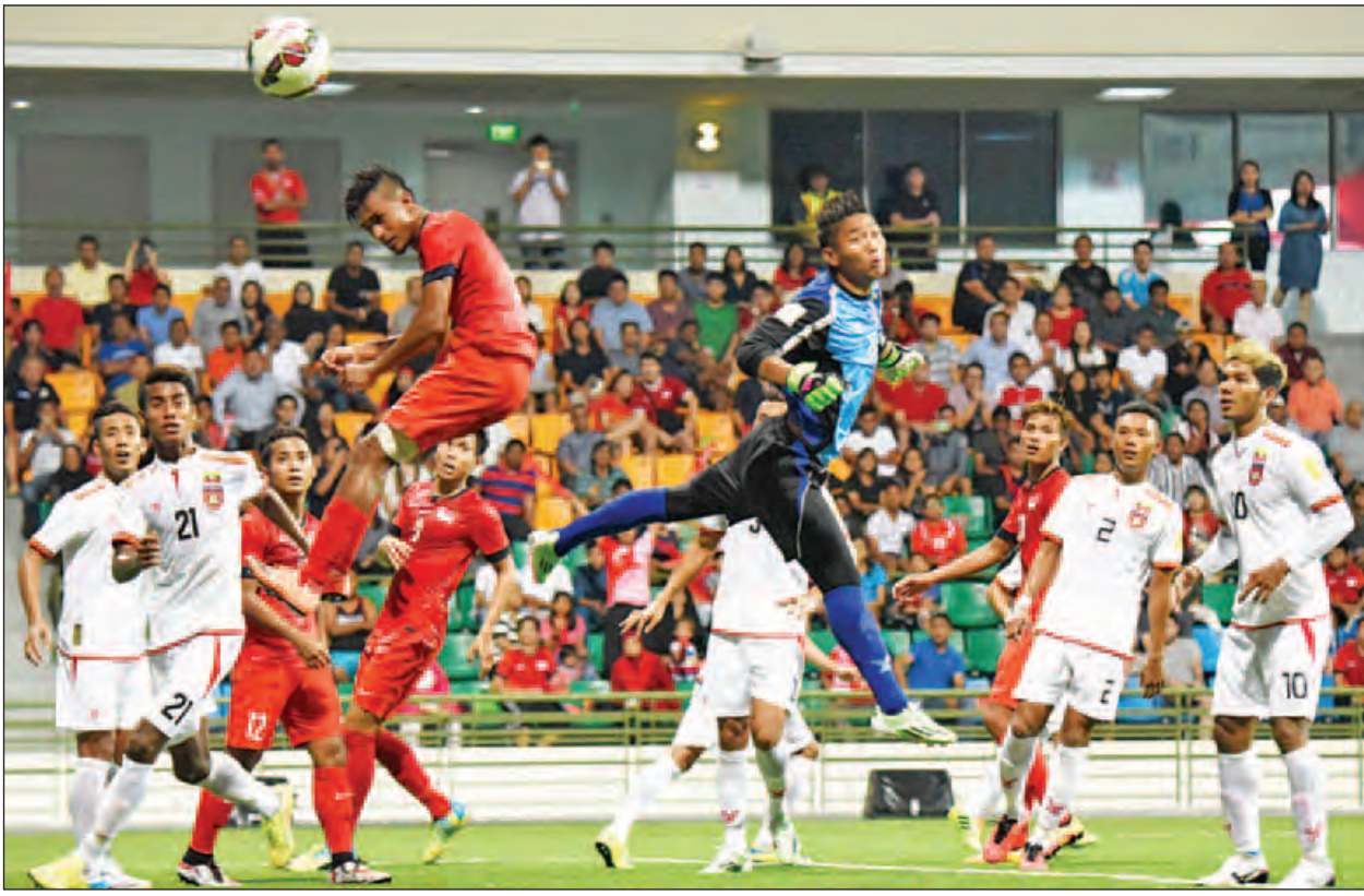
မတ်လအတွင်းက မြန်မာ့လက်ရွေးစင်အသင်းနှင့် စင်ကာပူလက်ရွေးစင်အသင်းတို့ ခြေစမ်းကစားခဲ့စဉ်။