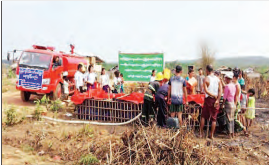
ရေပြတ်လပ်မှုသတင်းများရယူ၍ ယာယီရေသိုလှောင်ကန် များဆောက်လုပ်ပြီး ရေဖြန့်ဝေခြင်းလုပ်ငန်းများ ဆောင်ရွက်လျက်ရှိသည်။ ဧပြီ ၃၀ ရက်က ဘားအံမြို့နယ် လှာကာကျေးရွာ

ထိုသို့ ကရင်ပြည်နယ် ခရိုင် သုံးခရိုင်အတွင်း ဆောင်ရွက်ပေးနေရာတွင် ဘားအံမြို့နယ်တွင် အလယ်ရွာ၊ သစ်ဖြူပင်ဆိပ်၊ လှာကာ၊ လှိုင်ဘွဲ့မြို့နယ်တွင် ကော့တာ ဟို၊ ဖျဉ်းကတိုးကုန်း၊ တောင်ခြေရင်း၊ ကွမ်ဘီ၊ ချမ်းသာ ကျေးရွာ၊ သံတောင်ကြီးမြို့နယ်တွင် မယ်ဇလီကုန်း၊ သူဌေး ကုန်း၊ ကော့ကရိတ်မြို့နယ်တွင် ရွာတန်းရှည်၊ အိတ်တိုင်း ရွာတန်းရှည်၊ ကြာရိုးကုန်း၊ ထီးဖိုးကလောင်၊ ပိတောက်ကုန်း၊ ရသေ့တောင်၊ မြဝတီမြို့နယ်တွင် စံပီလိုက်၊ မဲပလဲ၊ ညောင် နန်းသာ၊ ကြာအင်းဆိပ်ကြီးမြို့နယ်တွင် ကြာအင်းကြီး၊ နန်းသိုင်းထွန်း၊ တံခွန်တိုင်နှင့် ဖာပွန်မြို့နယ်၊ ကမမောင်း မြို့ရှိ ညီညာချမ်းသာကျေးရွာ စသည်ဖြင့် ကျေးရွာ ၂၃ ရွာ၊ အိမ်ခြေ ၂၆၀၀၊ လူဦးရေ ၁၁၀၀၀ အား ရေဂါလန် ၂၃၀၀၀၀ ကို ကျေးရွာများအရောက် ကွင်းဆင်း၍