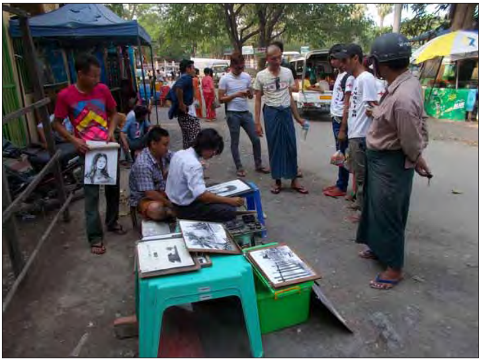
(တိမ်တမန်)

များ၊ ဦးပိန်တံတားရှုခင်းများကို ကြိုက်နှစ်သက်မှုများပြားကြသည်။ ဘုရားဖူးဧည့်သည်များမှာ တောင်သမန်ရောက် အမှတ်တရအဖြစ် ပုံတူပန်းချီကားများကို ရေးဆွဲခိုင်းလေ့ရှိသည်။ မိမိတို့ပုံနှင့် မိမိချစ်မြတ်နိုးသူတို့ ပုံများကို မိမိတို့ဖုန်းအတွင်းရိုက်ကူးထားပြီး ဘရိတ်စားပန်းချီဆရာကို ပုံတူရေးဆွဲခိုင်းကြသည်။ ပုံတူပန်းချီကို ဖုန်းအတွင်းမှ ဓာတ်ပုံကိုကြည့်ကာ ရေးဆွဲပေးကြသည်။ ဦးပိန်တံတားရောက် ဧည့်သည်များမှာ ပုံတူရေးဆွဲခြင်းကို အထူးစိတ်ဝင်စားပြီး စောင့်ကြည့်ကာ အားပေးလေ့ရှိသည်။ အချို့သူများမှာ ပုံကိုပေးကာအပ်ထားပြီး ဦးပိန်တံတားပေါ်လမ်းလျှောက်ပြီးမှ ယူလေ့ရှိသည်။ မိနစ်ပိုင်းအတွင်း ရေးဆွဲပေးသည့်အတွက် ပုံတူဘရိတ်စားပန်းချီကို စိတ်ဝင်စားရေးဆွဲခိုင်းကာ အမှတ်တရအဖြစ်ယူသွားလေ့ရှိသည်။ အချို့သောသူများမှာ မိမိလက်ဆောင်ပေးလိုသူ နာမည်ကိုပင်ရေးကာ အပြီးအစီးပြင်ဆင်သွားလေ့ရှိသည်။ ပုံတူရေးသည့်ဘရိတ်စားပန်းချီကားများကို လူငယ်အများစု ရေးဆွဲခိုင်းမှုများပြားလျက်ရှိကြောင်း သိရသည်။