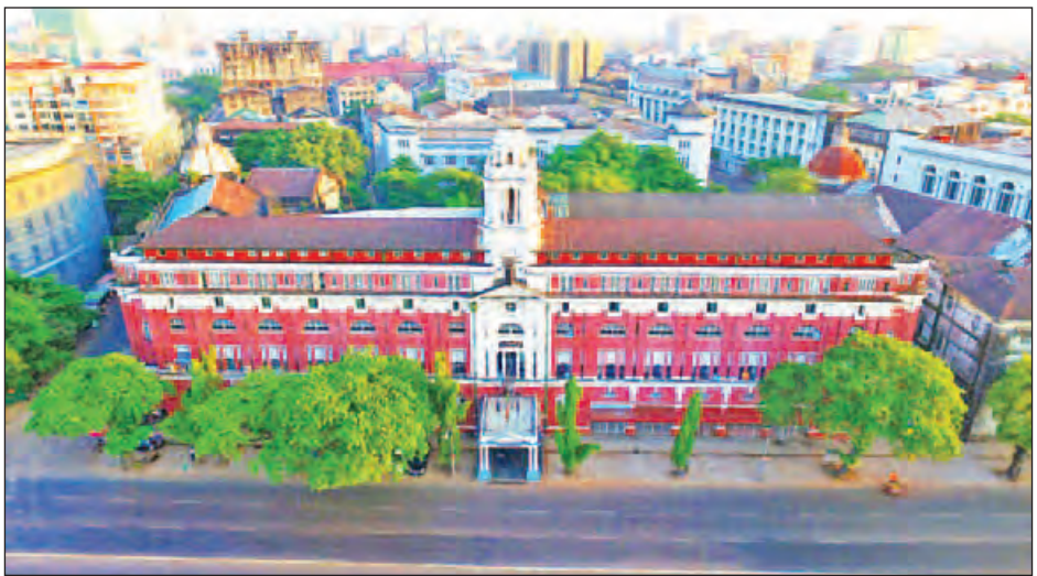
ရန်ကုန်မြို့ရှိ ကိုလိုနီခေတ်ရှေးဟောင်းအဆောက်အအုံ ဝန်ကြီးများရုံးကို တွေ့ရပုံ။ (စောသိန်းဝင်း)

ရန်ကုန် မေ ၁ ရန်ကုန်တိုင်းဒေသကြီး ကျောက် တံတားမြို့နယ် ကုန်သည်လမ်းရှိ အမှတ်(၄၉၁-၅၀၁) လူနေ ရှေးဟောင်း အဆောက်အအုံကို ရှေးမူလကရာယပျက် ပြန်လည်ပြုပြင် ရေးစီမံကိန်းပြီးစီးသည့် အခမ်းအနား ကို ယနေ့ နံနက် ၁၀ နာရီက အဆိုပါ အဆောက်အအုံအတွင်း ကျင်းပ သည်။