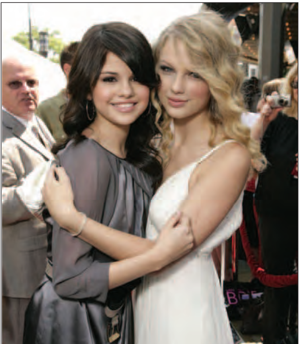
ဖြိုးစန္ဒာမြင့် - ၅ စည်း ရေး သား သည်

ဆယ်လီနာဂိုမက်၏ အနုပညာလှုပ်ရှားမှုများအနေဖြင့် ၂၀၁၆ အတွင်း ရိုက်ကူးမည့် ရုပ်ရှင်ဇာတ်ကားသစ် သုံးကားတွင် ပါဝင်သရုပ်ဆောင်ရန်ရှိပြီး ဂီတလှုပ်ရှားမှုများအနေဖြင့်မူ ၎င်း၏ ၂၀၁၅ ခုနှစ်က ထွက်ရှိခဲ့သည့် ဒုတိယ စတီရီယိုအယ်လ်ဘမ် Revival ၏ ဖျော်ဖြေရေးခရီးစဉ်ကို မြောက်အမေရိက အာရှနှင့် ဥရောပဒေသများတွင် ကျင်းပသွားမည်ဖြစ်ကြောင်း သိရသည်။