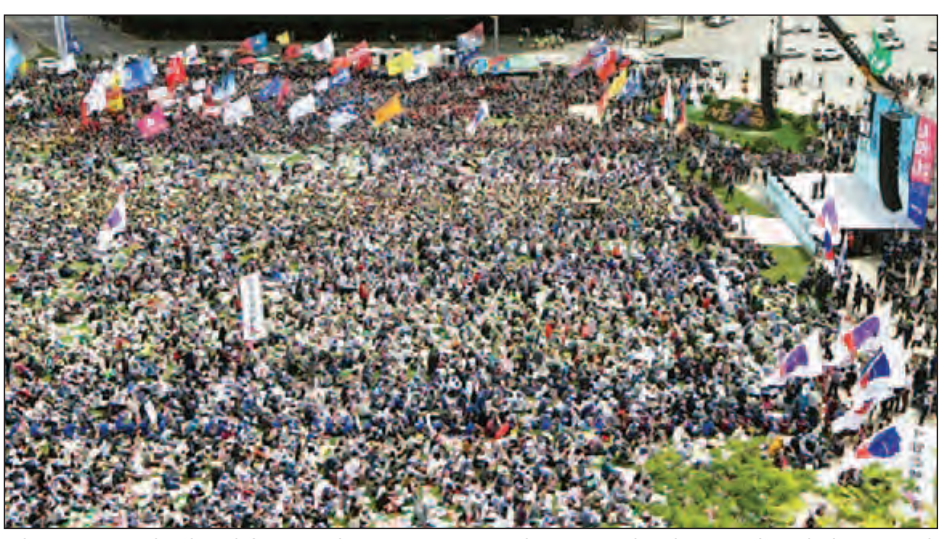
ခွင့်ပြုပေးထားမှုနှင့်ပတ်သက်၍ အလုပ်သမားများက အခွင့်အရေးများနှင့် လုပ်ခလစာ တိုးတက်ရရှိရေးအတွက် အလုပ်သမားများက တောင်းဆိုဆန္ဒပြခဲ့ကြသည်။ အာရှဒေသရှိနိုင်ငံများ၏ မြို့ကြီးများ၌ အလုပ်သမား။

ဟမ်းဘတ်မြို့၌ အကြမ်းဖက်မှုများ ကြီးကြား ကြီးကြားဖြစ်ပေါ်ခဲ့သည်ဟု သတင်းများပေါ်ထွက်ခဲ့သည်။ တူရကီနိုင်ငံ အစွတန်ဘူမြို့ရှိ တက်ဆင်ရင်ပြင်၌ မေဒေ့အထိမ်းအမှတ်အခမ်းအနား မပြုလုပ်ရန် အစိုးရ၏ တားမြစ်ပိတ်ပင်ချက်ကို ဆန့်ကျင်သူအလုပ်သမားထောင်ပေါင်းများစွာကို ရဲတပ်ဖွဲ့က မျက်ရည်ယိုဗုံး အသုံးပြုကာ လူစုခွဲခဲ့ရသည်။ အမေရိကန်ပြည်ထောင်စု ဆီယက်တယ်မြို့၌ အဓိကရုဏ်းများ မဖြစ်ပွားစေရန် ရဲတပ်ဖွဲ့က လုံခြုံရေးအစီအမံများကို တိုးမြှင့်ဆောင်ရွက်ခဲ့သည်။ တောင်ကိုရီးယားနိုင်ငံ၌ မေဒေ့အထိမ်းအမှတ်ပွဲတွင် အလုပ်သမား သိန်းနှင့်ချီကာ ပါဝင်ဆင်နွှဲခဲ့ကြသည်။ အစိုးရအဖွဲ့က ဆောင်ရွက်နေသော အလုပ်သမားရေးရာ ပြုပြင်ပြောင်းလဲရေး အစီအစဉ်ကို ကန့်ကွက်မှုများ ပြုလုပ်ခဲ့ကြသည်။ သမ္မတ ပတ်ကွန်ဟေး၏ အလုပ်သမားပြုပြင်ပြောင်းလဲရေး ဥပဒေကြမ်းအရ အလုပ်သမားများအား အလုပ်မှ ရပ်နားမှုကို ကုမ္ပဏီများက အလွယ်တကူ ပြုလုပ်နိုင်စေရန်