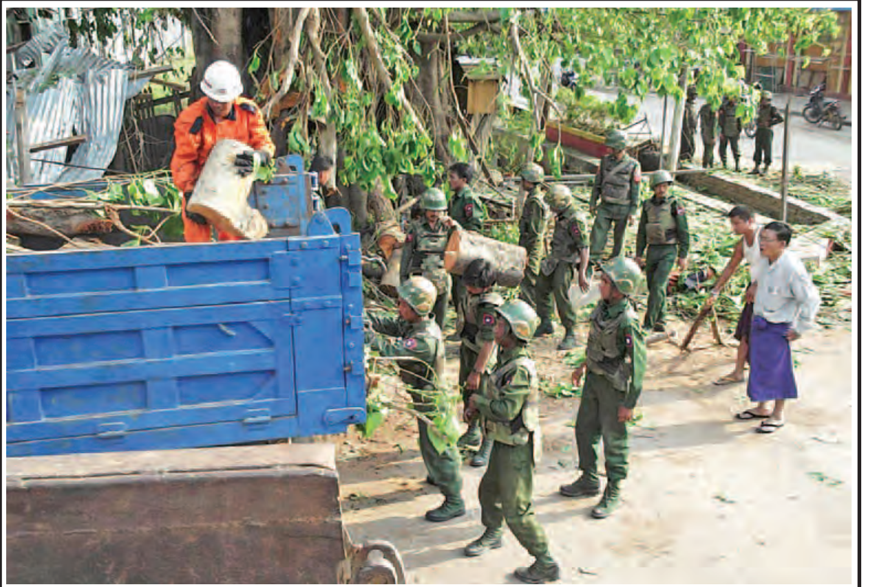
ရှမ်းပြည်နယ်(မြောက်ပိုင်း) မတိမ်းမြို့နယ်တွင် ဧပြီ ၂၂ ရက်က လေပြင်းတိုက်ခတ်မှုကြောင့် ပျက်စီးသွားမှုများကို တပ်မတော်သားများက ရှင်းလင်းဖယ်ရှား၍ ကူညီစောင့်ရှောက်မှုလုပ်ငန်းများ ဆောင်ရွက်နေသည်ကို တွေ့ရစဉ်။ (သတင်း စာမျက်နှာ -၁၁) (မြဝတီ)

“ကျွန်တော်တို့ရဲ့ စက်မှုဇုန်တွေဟာ ဒီမြို့ပြစီမံကိန်းရဲ့ အစိတ်အပိုင်းအဖြစ် ပါဝင်လာမှာပါ။ ရန်ကုန်မြို့ပြစီမံကိန်းကြီးတစ်ခုကို အခိုင်အမာပြန်ပြီးရေးဆွဲသွားဖို့ရှိပါတယ်။ JICA က လုပ်နေတဲ့ ၂၀၄၀ အထိ စီမံကိန်းရှိသလို ဒီမှာ ပုံပျက်ပန်းပျက်နဲ့ စံနှုန်းပျက်သွားတဲ့ အခြေအနေတွေ အများကြီးရှိပါတယ်။ ဒီအခြေအနေတွေကို ပြန်လည်ပြုပြင်ပြီး ပြန်လည်သုံးသပ်ရမှာတွေ ရှိပါတယ်။ KOICA က ကူညီပေးချင်တာတို့ အင်္ဂလန်ကလည်း ကျွန်တော်တို့တိုင်းပြည်က တစ်ချိန်က အင်္ဂလိပ်ရေးဆွဲခဲ့တဲ့ မြို့ကြီးဖြစ်တဲ့အတွက် ကူညီပေးချင်တာတို့ ရှိပါတယ်။ ကျွန်တော်တို့ မျှော်မှန်းထားတဲ့မြို့ဟာ ရှေ့နှစ် ၅၀၊ ၆၀ အနာဂတ်ရှိတဲ့ မြို့ပြစီမံကိန်းဖြစ်ရပါမယ်။ စာမျက်နှာ ၅ ကော်လံ ၁ သို့