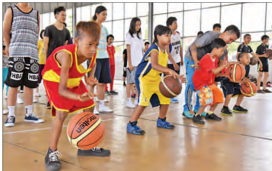
နွေရာသီဘက်စကတ်ဘောသင်တန်း၌ လူငယ်လေးများ သင်ယူနေစဉ်။