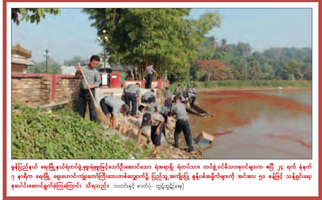
မွန်ပြည်နယ် ရေးမြို့နယ်ရဲတပ်ဖွဲ့မှူးရဲမှူးမြင့်သော်ဦးဆောင်သော ရဲအရာရှိ၊ ရဲတပ်သား တပ်ဖွဲ့ဝင်မိသားစုဝင်များက ဧပြီ ၂၄ ရက် နံနက် ၇ နာရီက ရေးမြို့ ရှေးဟောင်းကျေးတော်ကြီးဘေးတစ်လျှောက်၌ ပြည်သူ့အကျိုးပြု ဖွဲ့စည်းအမှုဆောင်များကို အင်အား ၅၀ ခန့်ဖြင့် သန့်ရှင်းရေး စုပေါင်းဆောင်ရွက်ခဲ့ကြကြောင်း သိရသည်။ သတင်းနှင့် ဓာတ်ပုံ- ထွန်းထွန်း(ရေ)