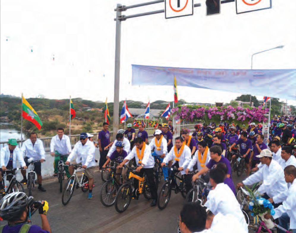
ဆင်နွှဲခဲ့ကြောင်း သိရသည်။ အဆိုပါ အထိမ်းအမှတ်အခမ်းအနား ကို ပထမဆုံးအကြိမ် ကျင်းပခြင်းဖြစ်ပြီး နှစ်နိုင်ငံ ပူးပေါင်းဆောင်ရွက်မှုများ၊ ရင်းနှီးချစ်ကြည်မှုနှင့် ကုန်သွယ်မှုများ ဖွံ့ဖြိုးကာ ကျောင်းသားလူငယ်များနှင့် ပြည်သူများအချင်းချင်း ချစ်ကြည်ရင်းနှီး မှုများ ခိုင်မြဲလာမည် ဖြစ်ကြောင်း သိရ သည်။