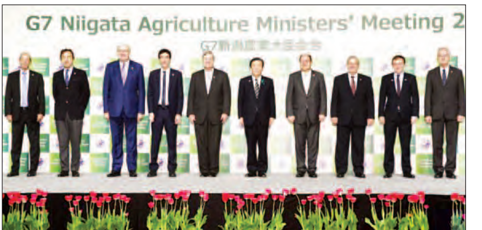
G7 Niigata Agriculture Ministers' Meeting 2016

နိုတ ၂၅ ဧပြီ ၂၀၁၆ မွေးမြူရေး တိရစ္ဆာန်များနှင့် ပတ်သက်နေသော ရောဂါ ဘယများ တားဆီးကာကွယ်နိုင်ရေးအတွက် ကျန်းမာရေး ဆိုင်ရာ သတင်းအချက်အလက်များကို အပြန်အလှန် ဖလှယ်မှု မြှင့်တင်သွားရန် ဂျီ-၇ အဖွဲ့ဝင်နိုင်ငံများမှ လယ်ယာစိုက်ပျိုးရေးဝန်ကြီးများက သဘောတူညီကြ ကြောင်း ဒေသဆိုင်ရာသတင်းဌာနများက ဧပြီ ၂၅ ရက် တွင် သတင်းထုတ်ပြန်သည်။ လယ်ယာစိုက်ပျိုးရေးလုပ်ငန်းများ၌ အမျိုးသမီးများ နှင့် လူငယ်များ ပါဝင်လုပ်ကိုင်မှု တိုးတက်ဖြစ်ပေါ်လာ စေရေးအတွက် ကြိုးပမ်းဆောင်ရွက်ရန်နှင့် ရာသီဥတု ပြောင်းလဲမှုကြောင့် စားနပ်ရိက္ခာထောက်ပံ့မှု မထိခိုက် စေရေးအတွက် ကြိုးပမ်းဆောင်ရွက်ရန် လိုအပ်ပုံကို မြီတိန်၊ ကနေဒါ၊ ပြင်သစ်၊ ဂျာမနီ၊ အီတလီ၊ ဂျပန်နှင့် အမေရိကန်ပြည်ထောင်စုတို့မှ လယ်ယာစိုက်ပျိုးရေး ဝန်ကြီးများ၏ နှစ်ရက်ကြာ အစည်းအဝေးအပြီး ဧပြီ ၂၄ ရက်က ထုတ်ပြန်သော ဖွဲ့စည်းကြေညာချက်တွင် ဖော်ပြထား သည်။ ဂျီ-၇ အုပ်စု၏ လယ်ယာစိုက်ပျိုးရေးဝန်ကြီးများ၏ အစည်းအဝေးကို ဂျပန်နိုင်ငံ ပင်လယ်ကမ်းရိုးတန်းဒေသ ရှိ မြို့ကြီးတစ်မြို့ဖြစ်သော နိုတမြို့၌ ကျင်းပခဲ့သည်။ ကမ္ဘာ့လူဦးရေ တိုးတက်လာမှုနှင့်အတူ စားနပ်ရိက္ခာ လိုအပ်ချက်ကို ဖြည့်ဆည်းပေးနိုင်ရေးအတွက် ကမ္ဘာ့ စားနပ်ရိက္ခာ ထုတ်လုပ်မှုမြှင့်တင်ရန် ကြိုးပမ်းဆောင်ရွက် ကြမည်ဟု ယင်းကြေညာချက်တွင် ဖော်ပြထားသည်။