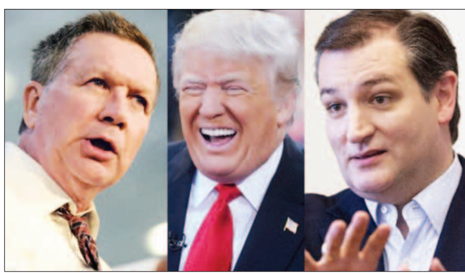
ရီပတ်ဘလီကန်သမ္မတလောင်းများဖြစ်သည့် ဂျွန်ကဆစ်၊ ဒေါ်နယ်ထရမ်နှင့် တက်ဒ်ခရစ်။

တိုကျို ၂၅ ဧပြီ ၂၀၁၆ ဂျပန်နိုင်ငံ၌ မကြာသေးမီက မြေလျင်လှုပ်ခတ်ခဲ့ပြီးနောက် ပြန်လည်ထူထောင်ရေးလုပ်ငန်းများအတွက် ငွေကြေး ထောက်ပံ့နိုင်ရန် နောက်ဆက်တွဲ ဘတ်ဂျက်ရေးဆွဲ ဆောင်ရွက်ရန် ဝန်ကြီးချုပ် ရှင်ဒိုအာဘေးက အစိုးရ အဖွဲ့အား ညွှန်ကြားလိုက်ကြောင်း ဒေသဆိုင်ရာ သတင်း ဌာနများက ဧပြီ ၂၅ ရက်တွင် သတင်းထုတ်ပြန်သည်။ ဂျပန်နိုင်ငံတောင်ပိုင်း ကျူးရှူးကျွန်း၌ မကြာသေးမီက လှုပ်ခတ်သော မြေလျင်ကြောင့် လူပေါင်း ၅၀ ခန့် သေဆုံး ခဲ့ပြီး နေအိမ်အလုံးပေါင်း ၅၀၀၀ ထက်မနည်း ပျက်စီးခဲ့ ရသည်။ ဧပြီ ၂၅ ရက်အခြေပြစာရင်းအရ ပြည်သူ့ ၈၀၀၀၀ ခန့်မှာ ၎င်းတို့၏ နေအိမ်များကို စွန့်ခွာထွက်ပြေးခဲ့ကြရ သည်။ ဂျီ-၇ အုပ်စု၏ ထိပ်သီးအစည်းအဝေးမတိုင်မီတွင် ဂျပန်နိုင်ငံ၏ စီးပွားရေး ပြန်လည်ဦးမော့လာစေရေးအတွက် ဝန်ကြီးချုပ် အာဘေး၏ အစိုးရအဖွဲ့က ပြင်ဆင်ဆောင်ရွက် နေချိန်တွင် မြေလျင် ပြန်လည်ထူထောင်ရေးလုပ်ငန်းများ အတွက် နောက်ဆက်တွဲဘတ်ဂျက်အသုံးစရိတ် ရရှိရန် လုပ်ဆောင်လာခြင်းဖြစ်သည်။ ဂျီ-၇ ထိပ်သီးအစည်း အဝေးကို ဂျပန်နိုင်ငံအလယ်ပိုင်း အိုကီဇီးမားမြို့၌ မေလနှောင်းပိုင်းတွင် ကျင်းပမည်ဖြစ်သည်။ လက်ရှိကျင်းပနေသော ပါလီမန်အစည်းအဝေးတွင် နောက်ဆက်တွဲ ဘတ်ဂျက်ငွေစာရင်းကို အတည်ပြုပေး နိုင်ရန်အတွက် အစိုးရအဖွဲ့က ပြင်ဆင်ဆောင်ရွက်ရန် လိုအပ်ကြောင်း ဝန်ကြီးချုပ်အာဘေးက သဘာဝဘေး အန္တရာယ်တုံ့ပြန်ရေးကော်မတီ အစည်းအဝေးတွင် ပြောကြားသည်။ လက်ရှိ ပါလီမန်အစည်းအဝေးသည် ဇွန် ၁ ရက်တွင် ပြီးဆုံးမည်ဖြစ်သည်။ မြေလျင်ကြီး လှုပ်ခတ်ပြီးနောက် မြေလျင်ငယ်များ ဆက်လက်လှုပ်ခတ်နေဆဲဖြစ်သဖြင့် နောက်ဆက်တွဲ ဘတ်ဂျက် အသုံးစရိတ်၏ ငွေကြေးပမာဏကို ပုံသေသတ်မှတ်နိုင် မည်မဟုတ်ကြောင်း အစည်းအဝေးအပြီးတွင် ဘဏ္ဍာရေး ဝန်ကြီး တာရီအာဒိုက သတင်းထောက်များကို ပြောကြား သည်။