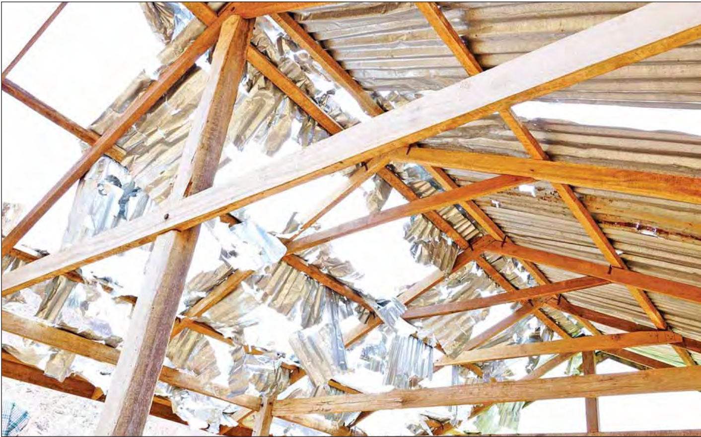
ကျောက်ဆည်မြို့နယ် ရေသရောက်ကျေးရွာတွင် မိုးသီးများကြောကျမှုကြောင့် ပျက်စီးသွားသော အိမ်အမိုးသွပ်များကို တွေ့ရစဉ်။