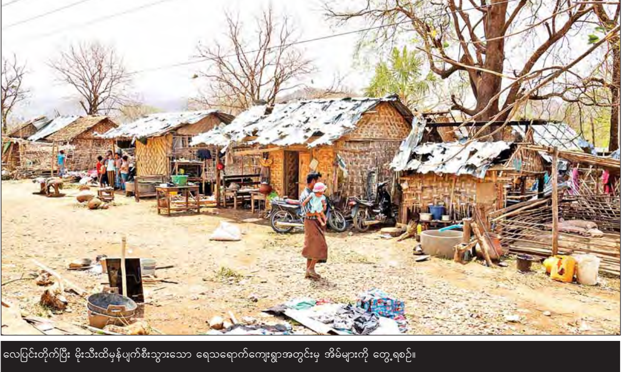
လေပြင်းတိုက်ပြီး မိုးသီးထိမှန်ပျက်စီးသွားသော ရေသရောက်ကျေးရွာအတွင်းမှ အိမ်များကို တွေ့ရစဉ်။

အလားတူ မန္တလေးတိုင်းဒေသကြီးအတွင်း ဒုတိယအထိနာခဲ့သော မြို့နယ်မှာ စဉ့်ကိုင်မြို့နယ်ဖြစ်သည်။ စဉ့်ကိုင်မြို့နယ်တွင် ရွာပေါင်း ၁၅၉ ရွာ ရှိသည့်အနက် ၁၉ ရွာသာပျက်စီးဆုံးရှုံးခဲ့သည်။ လူအသေအပျောက်မရှိဘဲ တိရစ္ဆာန် ၂၄၃ ကောင်သေဆုံးခဲ့သည့်အနက် ဆိတ် ၂၈ ကောင်သေဆုံးခဲ့သည်။ ကံကြီးကျေးရွာတွင် ထိခိုက်မှုများပြီး တိရစ္ဆာန် ၁၁၀ သေဆုံးခဲ့သည်။ ကံကြီးကျေးရွာတွင်နေထိုင်သည့် ရွာသားတစ်ဦးက “အဲဒီနေ့ ညနေက အိမ်ရှေ့မှာ လှည်းဝင်ရိုးတပ်နေတာပါ။ အဲဒီအချိန်မှာ တပေါင်ပေါ်အသံမြည်ပြီး လေပြင်းတွေတိုက်ကာ မိုးရွာချပါတယ်။ ဒါနဲ့ အိမ်ထဲကိုပြန်ဝင်နေတုန်း စက်သေနတ်ပစ်သံလို တဒိုင်းဒိုင်းမြည်လာလို့ ရွာကိုခားပြင်စီးတာလား ထင်လိုက်တာ။ ဘယ်ဟုတ်မလဲ ကျွန်တော့်အိမ်က မကြာသေးမီနှစ်ကမှ ဈေးချိုချိုနဲ့ ဝယ်မိုးခဲ့တဲ့ သွပ်ပြားတွေကို ဖောက်ထွက်၊ လွင့်ထွက်ပြီး မိုးသီးတွေကျလာ ကို မြင်လိုက်မှ လန့်သွားပါတယ်။ အချို့မိုးသီးတွေက ထန်းသီးလုံးငယ်လောက် ရှိလို့ အိမ်အမိုးကို ဖောက်ထွက်သွားတာပါ။ ဒီသွပ်တွေကို လုံးဝပြန်သုံးလို့မရ တော့ပါဘူး။ မိုးတိတ်လို့ကြည့်လိုက်တော့ အပေါက်ဖွာလရာနဲ့ အက်စစ်တွေစား လို့ စုတ်ပြတ်သွားပါပြီ”ဟု သူ၏အတွေ့အကြုံကို ရှင်းပြသည်။ ကံကြီးရွာမှာ ရွာလုံးကျွတ်နီးပါး ပျက်စီးခဲ့ပြီး လူဦးရေ ၁၄၄၁ ဦးရှိသည့် ရွာကြီးတစ်ရွာဖြစ်သည်။ အိမ်အမိုးသင့်ရုံပျက်စီးခဲ့သူများက ကိုယ့်အိမ်ကိုယ် ဖာထေးနေထိုင်ကြပြီး အပျက်အစီးများသူများမှာ ဓမ္မာရုံနှင့်အခြားအရပ်ရှိ အမျိုးမျိုးနေအိမ်သို့ ခေတ္တပြောင်းရွှေ့နေကြရသည်။ ဒဏ်ရာအနည်းငယ်ရသူများအား ဓမ္မာရုံတွင် ဆေးကုသပေးသည်။ ထို့နောက်ကူညီကယ်ဆယ်ရေးကို