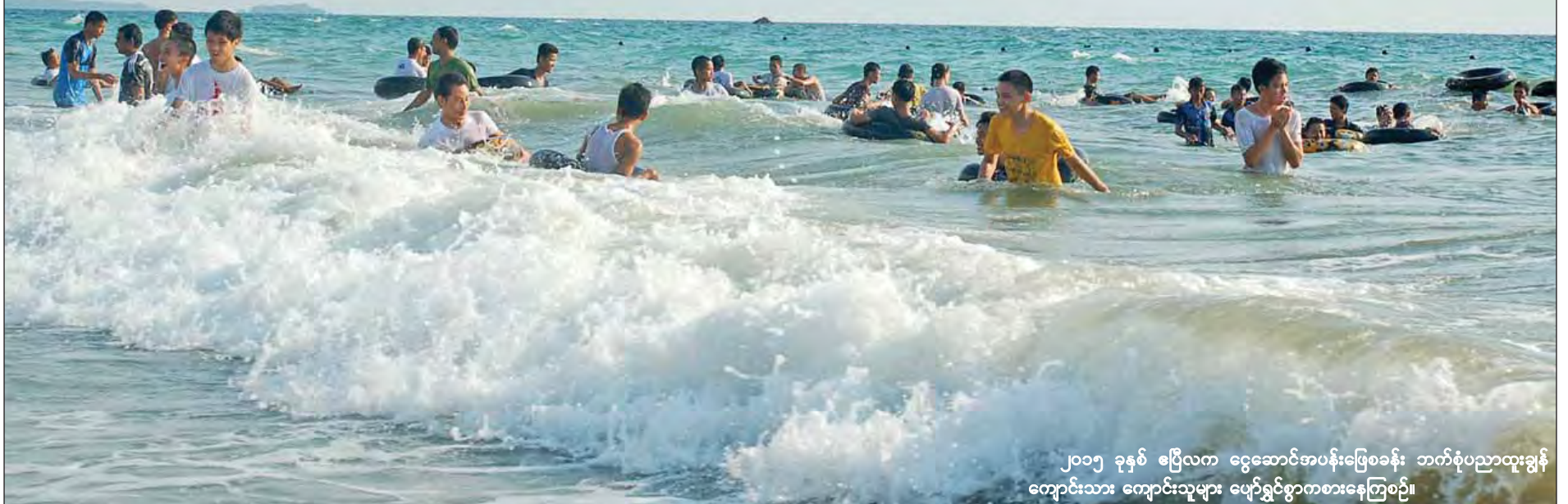
၂၀၁၅ ခုနှစ် ဧပြီလက ငွေဆောင်အပန်းဖြေစခန်း ဘက်စုံပညာထူးချွန် ကျောင်းသား ကျောင်းသူများ ဖျော်ရွှင်စွာကစားနေကြစဉ်။