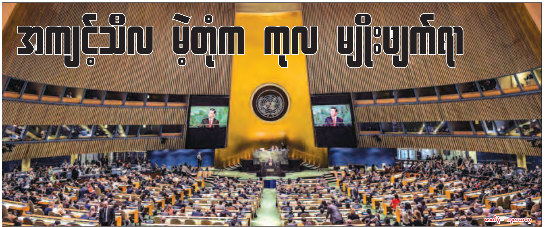
တော်ဝင်- ကုလသမဂ္ဂ