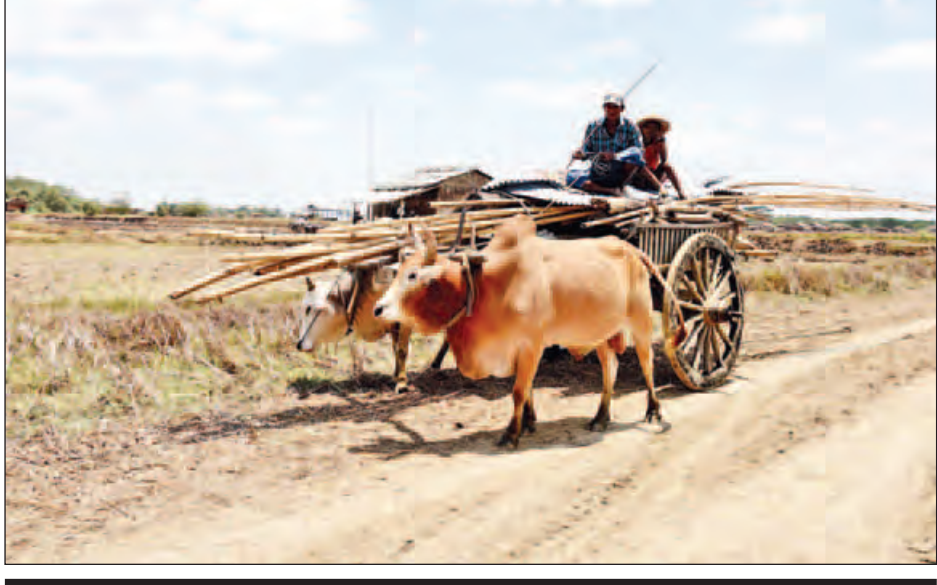
ကမ်းပါးပြိုမှုကြောင့် ကုန်သွယ်မှုကုန်က ရွာသားများ သင့်တော်ရာနေရာသို့ ရွှေ့ပြောင်းနေကြစဉ်။

သနပ်ပင်မြို့နယ် ကုန်သွယ်မှုကုန်ကုန်ကျေးရွာသည် ၁၉၇၅ ခုနှစ်က ကမ်းပါးပြိုမှုကြောင့်မားဆုံးဖြစ်ခဲ့ပြီး ယခုတစ်ကြိမ် ကမ်းပါးပြိုမှုမှာ ၂၀၁၀ ခုနှစ်မှ အနည်းငယ်ပြိုကျလာကာ ၂၀၁၅ ခုနှစ်တွင် အဆိုးရွားဆုံးဖြစ်ပြီး ရွာလုံးကျွတ်နီးပါး ပြောင်းရွှေ့နေရ သည်ဟု သိရသည်။