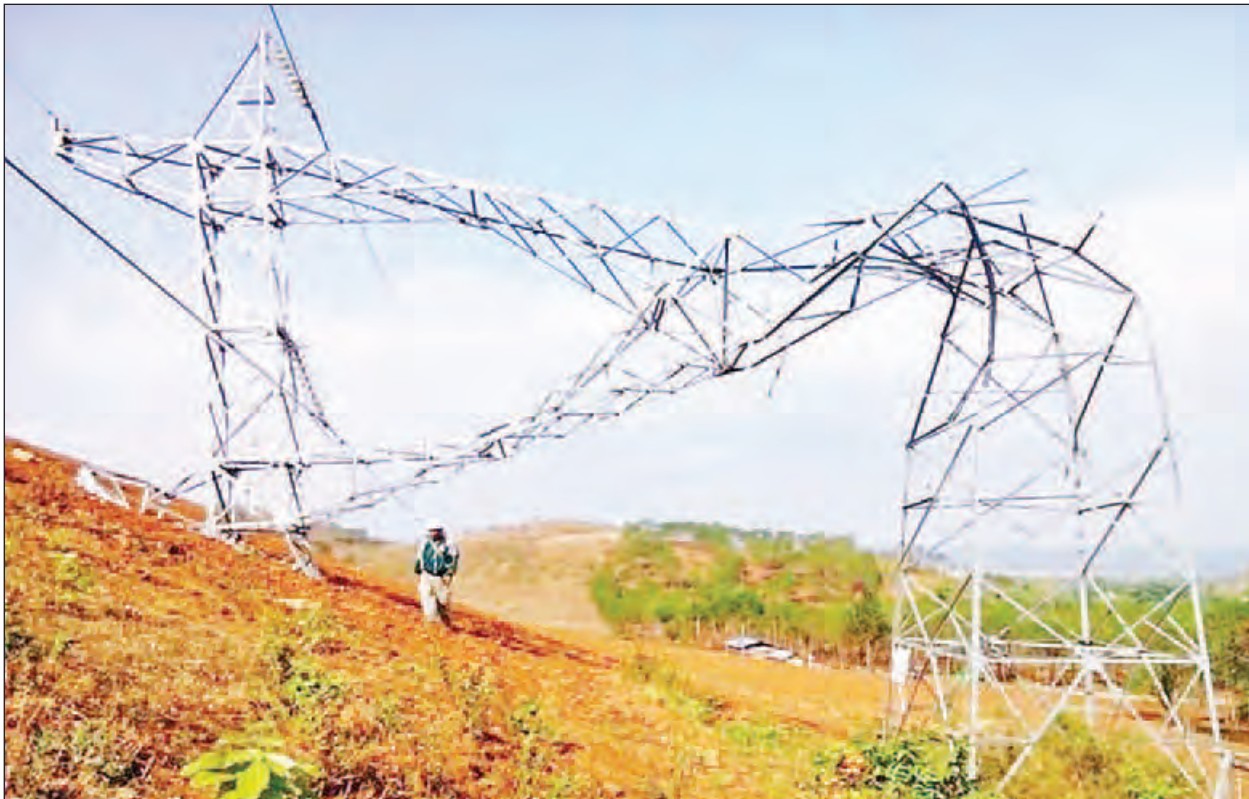
နေပြည်တော် ဧပြီ ၂၃

စစ်ကိုင်းတိုင်းဒေသကြီး၊ မန္တလေး တိုင်းဒေသကြီးနှင့် ရှမ်းပြည်နယ် (မြောက်ပိုင်း)တို့တွင် ဧပြီ ၂၁ ရက်မှ ၂၂ ရက်ထိ မိုးသီးများကြေခြင်း၊ လေပြင်းတိုက်ခတ်ခြင်းများကြောင့် အုန်းတော-ညောင်ပင်ကြီး ၂၃၀ ကေဗီ မဟာဓာတ်အားလိုင်းမှ တာဝါတိုင်