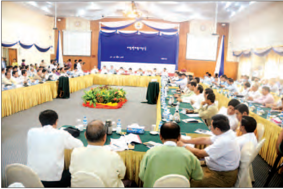
အလိုက် ကျွန်တော်တို့အစိုးရနဲ့ပူးပေါင်းဆောင်ရွက်ဖို့ ဖိတ်ခေါ်ပါတယ်” ဟုပြောသည်။

စီးပွားရေးနှင့် ကူးသန်းရောင်းဝယ်ရေးဝန်ကြီးဌာန ပြည်ထောင်စုဝန်ကြီး ဒေါက်တာသန်းမြင့်က မြန်မာ့ စီးပွားရေးထုတ်ကုန်တင်ပို့မှုကဏ္ဍတွင် ကုန်သွယ်မှု ငါးနှစ် အတွင်း သုံးဆတိုးတက်အောင်ဆောင်ရွက်ရန် ဆန္ဒရှိကြောင်း ဧပြီ ၂၄ ရက် နံနက် ၉ နာရီက ရန်ကုန်မြို့ မင်းရဲကျော်စွာလမ်းရှိ ကုန်သည်/စက်မှုအသင်းချုပ်၌ မြန်မာနိုင်ငံတစ်နိုင်ငံလုံးရှိ စီးပွားရေးလုပ်ငန်းရှင်များနှင့် တွေ့ဆုံစဉ် ပြောကြားခဲ့သည်။ (ယာပုံ)