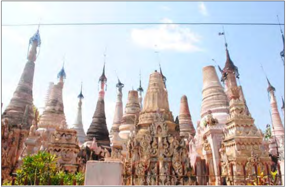
ဝန်းကျင်ခန့် ထီးတော်များ ပျက်စီးပြိုကျပြီး အာသောက ဆုတောင်းပြည့်စေတီတော်မှာ ထက်ပိုင်းကျိုး၍ပျက်စီးခြင်း၊ ဖောင်တော်ဆိုက်စေတီတော်မှာ ငှက်မြတ်နားတော်၊ ထီးတော်ပြိုကျပျက်စီးခြင်း၊ မွေတော်ကဏ္ဍစေတီတော် ပတ်ဝန်းကျင်ရှိ အိမ်များပြိုခြင်း၊ အိမ်ခေါင်မိုးများ ပြိုထွက် လန်သွားခြင်း၊ ဓာတ်မီးတိုင်များ လဲကျခြင်း၊ Transformer များပျက်စီးခြင်း၊ စာသင်ကျောင်း အမိုးများလန်ခြင်း၊ ဖုန်းကြိုးနှင့် သစ်ပင်များကျိုးကျခြင်း၊ ကတ္တူဘုရားအနောက်ဘက်ရှိ ခေတ္တနားနေဆောင် ပြိုကျခြင်း၊ စေတီရင်ပြင်မြောက်ဘက်ရှိ ဓမ္မာရုံအာရုံခံ အဆောက်အအုံများ ပျက်စီးပြိုကျခဲ့ကြောင်း သိရသည်။ မောင်မောင်သန်း(တောင်ကြီး)

ပျက်စီးစာရင်းများ ပြုစုထားရန် ထိခိုက်မှုမရှိစေရန်၊ ဂရုပြုဆောင်ရွက်ရန်တို့ကို မှာကြားခဲ့သည်။ ဆက်လက်၍ မွေတော်ကဏ္ဍစေတီတော် မွေရုံတွင် ပြည်နယ်ဝန်ကြီးချုပ်နှင့် ဝန်ကြီးများ၊ ပအိုဝ်းကိုယ်ပိုင်အုပ်ချုပ်ခွင့်ရဒေသဦးစီးအဖွဲ့ဥက္ကဋ္ဌနှင့် တာဝန်ရှိသူများ တို့သည် တောင်ကြီးမြို့နယ် သံဃနာယက ဆရာတော်ထံ ဩဝါဒခံယူရာ ဆရာတော်ကြီးက စေတီတော်ပတ်ဝန်းကျင်အနီးရှိ သန့်ရှင်းရေးများကို အမြန်ဆုံးဆောင်ရွက်ရန် မိန့်မှာကြားပြီး ပြည်နယ်ဝန်ကြီးချုပ်နှင့် တက်ရောက်လာသည့် တာဝန်ရှိသူတို့က ဆွေးနွေးရာ မူလဗျူဒါန်းထားသော စေတီအလှူရှင်များကို ဦးစားပေးဆက်သွယ်ဆောင်ရွက်ရန် စေတီတော်ပတ်ဝန်းကျင် အဝင်ပေါက်များကို ခေတ္တပိတ်ထားပြီး ဘုရားဖူးဧည့်သည်များကို ပြင်ပမှ ဖူးမြော်ရန် ရှေးဟောင်းသမိုင်းဝင်ပစ္စည်း ပျောက်ပျက်မှုမရှိစေရန်နှင့် တပ်မတော်အင်အား၊ မြန်မာနိုင်ငံရဲတပ်ဖွဲ့နှင့် ဒေသရှိ ပအိုဝ်းလူငယ်များက ဝိုင်းဝန်းပူးပေါင်းဆောင်ရွက်ကြရန် ဆွေးနွေးမှာကြားကြသည်။ လေပြင်းမုန်တိုင်းတိုက်ခတ်မှုကြောင့် ရှေးဟောင်းမွေတော်ကဏ္ဍစေတီတော် ၂၄၇၈ ဆူရီရာ ၁၇၀၀