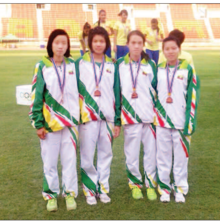
ထိုင်းနိုင်ငံက အိမ်ရှင်အဖြစ် လက်ခံကျင်းပသည့် (၁၁)ကြိမ်မြောက် အရှေ့တောင်အာရှ လူငယ် ပြေးခုန်ပစ်ပြိုင်ပွဲ၏ ယနေ့ကျင်းပသော ဒီတော့ ၄x၄၀၀ လက်ဆင့်ကမ်းပြိုင်ပွဲတွင် ကြေးတံဆိပ် ဆွတ်ခူးရရှိခဲ့သည့် မြန်မာအမျိုးသမီးပြေးခုန်ပစ်အဖွဲ့ကို တွေ့ရစဉ်။

လောင်မီး(ချောင်းဝ)ကမ်းပြိုကျပါ လေး၊ ကပင်စသည့် ကျေးရွာများရှိ ကန်များကို ပြုပြင်ပေးသွားမည်ဟု သိရသည်။ သို့သော်လည်း ယင်း ၁၆ ကန်နှင့် နှစ်သစ်ကူးလက်ဆောင်ပါ ငွေကျပ် သိန်း ၅၀ ဖြင့် တူးဖော်သည့် ကန် ငါးကန် အပါအဝင်စုစုပေါင်း ၂၀ ကန်သာ ပြုပြင်နိုင်မည်ဖြစ်သည်။ သို့ဖြစ်ပါ၍ သနပ်ပင်မြို့နယ်တွင် သောက်သုံးရေအမှန်တကယ် လိုအပ် ၍ ပြုပြင်ဆောင်ရွက်မှု စုစုပေါင်းကန် ၇၀ ကျော်ရှိပြီး ဆက်လက်၍ မတူး ဖော်နိုင်သေးသည့်ကန်များကို ဆက် လက်တူးဖော်ရန် ကျန်ရှိနေသေးသော ကြောင့် အများပြည်သူများအနေဖြင့် ရေကုသိုလ် လျှော့ဒါန်းလိုပါက ဖုန်း- ၀၉-၄၂၈၀၄၈၅၅၅၅၊ ၀၉- ၄၂၈၀၄၂၄၇၀၊ ၀၉-၅၃၀၀၄၉၈ သို့ ဆက် သွယ်လှူဒါန်းနိုင် ကြောင်း သတင်းရရှိသည်။ သတင်း- ကိုသက်