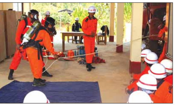
မီးသတ်တပ်ဖွဲ့ဝင်များ ရှာဖွေကယ်ဆယ်ရေးပစ္စည်းများ အသုံးပြုနည်း လက်တွေ့လေ့ကျင့်

ပါကင်များ၊ ရဲကင်းအုပ်ချုပ်ရေးနှင့် စီမံခန့်ခွဲရေး ဆိုင်ရာရုံးခန်းများ၊ လမ်းရေမြောင်းစနစ်နှင့် မိလ္လာ စနစ်များစသည့် လူနေဇုန်နှင့် စီးပွားရေးဇုန်များ ပါဝင်မည်ဖြစ်ကြောင်း သိရသည်။ အဆောက်အအုံအားလုံးသည် သံကူကွန်ကရစ် အမျိုးအစားဖြစ်ပြီး လိုအပ်မှုအပေါ် မူတည်၍ တိုက်ခန်း ၂၅၆၀ ခန်းပါ လူနေတိုက် လေးထပ် တိုက်ခန်း ၅၁၂ ခန်းပါ လူနေတိုက် ၁၀ ထပ်နှင့် တိုက်ခန်း ၇၆၈၀ ခန်းပါ လူနေတိုက် ၁၆ ထပ်တို့ကို ပြောင်းလဲ ဆောက်လုပ်သွားမည်ဖြစ်သည်။ ရောင်းချမှုနှင့်ပတ်သက်၍ ဒေသခံပြည်သူ လူထုနှင့် နိုင်ငံဝန်ထမ်းများကို ဦးစားပေးရောင်း ချသွားမည်ဖြစ်ပြီး ဌာနဆိုင်ရာမှ ဝန်ထမ်းအိမ်ရာ များအဖြစ် အသုံးပြုပေးလိုပါက နှစ်ရှည်ငွေပေး သွင်းမှုဖြင့် ရောင်းချပေးသွားမည်ဖြစ်သည်။ ဝယ်ယူ မည့်သူများအနေဖြင့် နိုင်ငံသားစိစစ်ရေးကတ်၊ အလုပ်သမားကတ်၊ လူမှုဖူလုံရေးကတ်တစ်ခုခု ရှိရ မည်ဖြစ်ပြီး အမည်ပေါက်ဝယ်ယူထားသော အခန်း များအား လွှဲပြောင်းရောင်းချပါက ငွေအကြေးပေး သွင်းရမည်ဖြစ်ကြောင်း သိရသည်။