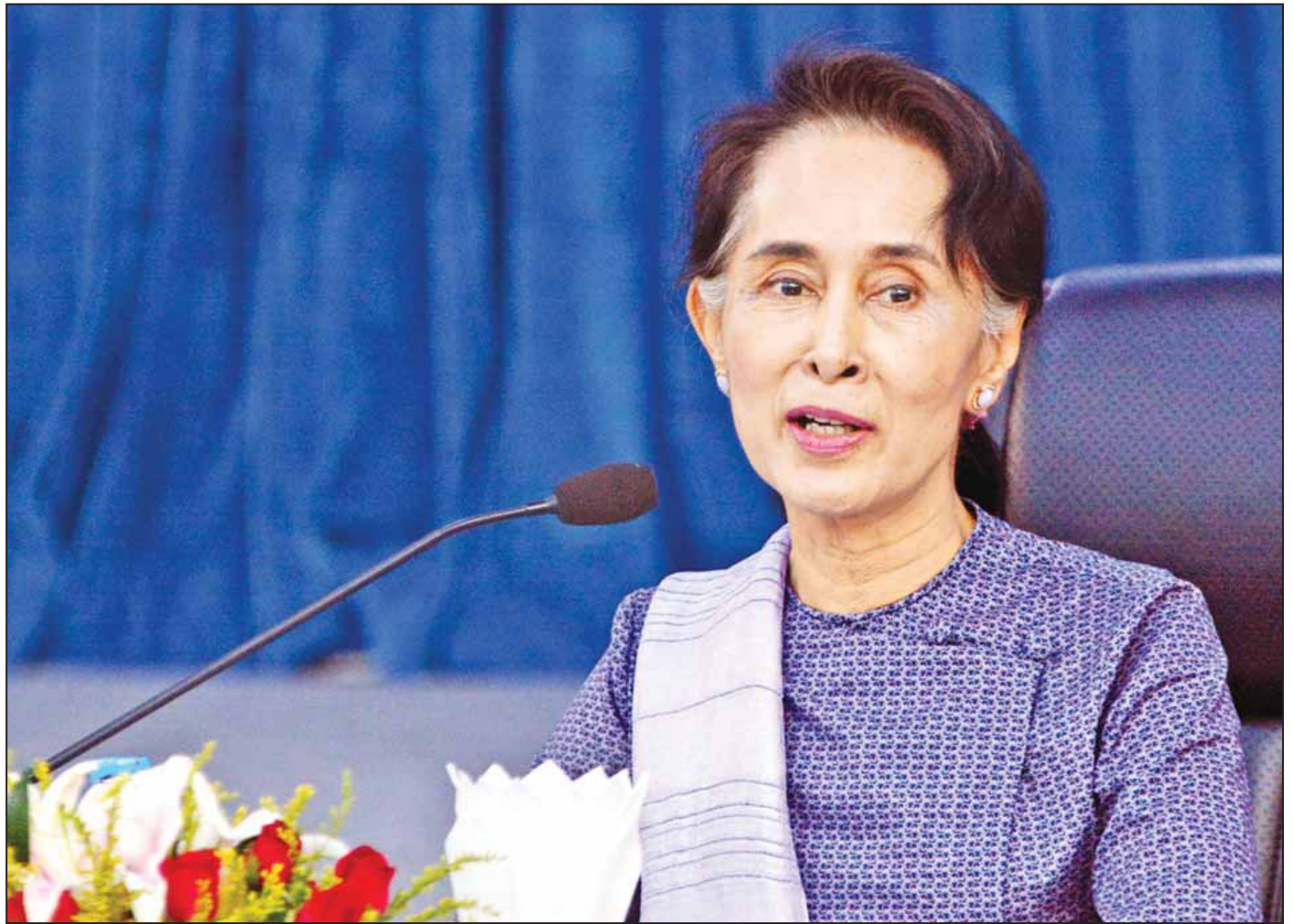
မြန်မာနိုင်ငံ၏ နိုင်ငံခြားရေးမူဝါဒနှင့်စပ်လျဉ်း၍ ပြည်ထောင်စုဝန်ကြီး ဒေါ်အောင်ဆန်းစုကြည် ရှင်းလင်းပြောကြားစဉ်။

မြန်မာနိုင်ငံသည် ယခုအချိန်မှ ခရီးသစ်စတင်ခြင်းဖြစ်ပါကြောင်း၊ ပြဿနာများကို အပြန်အလှန်လေးစားမှု၊