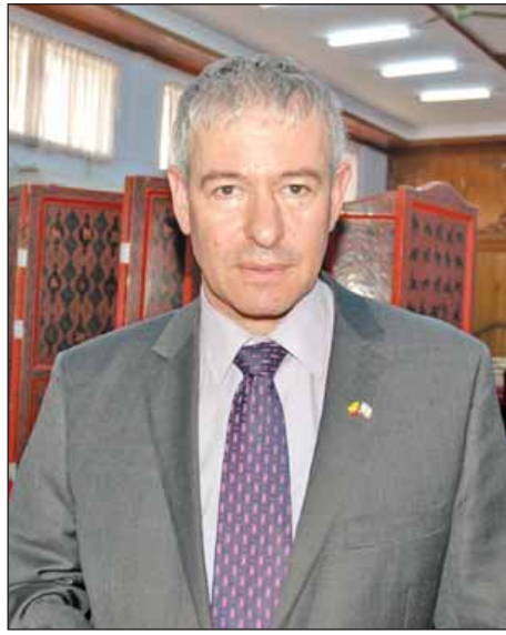
အစ္စရေးသံအမတ်ကြီး မစ္စတာ ဒန်နီရယ် ဇွန်ရှိုင်း