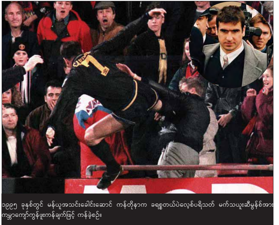
၁၉၉၅ ခုနှစ်တွင် မန်ယူအသင်းခေါင်းဆောင် ကန်တိုနာက ခရစ္စတယ်ပဲလွစ်ပရိသတ် မက်သယူးဆီမွန်အား ကမ္ဘာကျော်ကွန်ဖူးကန်ချက်ဖြင့် ကန်ခဲ့စဉ်။

ကန်တိုနာမှာ မက်သယူးဆီမွန်အား ကွန်ဖူး ကန်ချက်ဖြင့် ကန်ခဲ့သဖြင့် ရှစ်လတာ ပွဲပယ်ပြစ်ဒဏ် ကျခဲ့ခဲ့ရပေမယ့် ယင်းဖြစ်ရပ်ကို တစ်ကြိမ်တစ်ခါမျှ