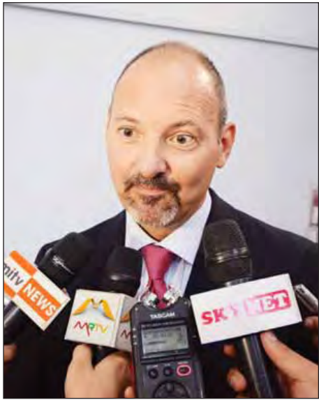
အီးယူသံအမတ်ကြီး မစ္စတာ ရိုလန်ကိုဘီယာ