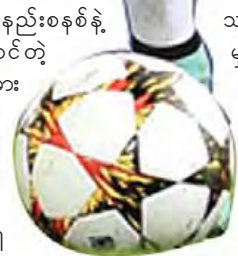
နည်းစနစ်နဲ့ အံ့မဝင်တဲ့ ကစားသမားတွေကို ပြန်လည်ရောင်းချဖို့ ပြင်ဆင်နေတာတွေကို ပေါ်ပေါ်ထင်ထင် လုပ်ဆောင်နေကြပါပြီ။ ဒါ့ကြောင့် အပြောင်းအရွှေ့ဈေးကွက်မရောက်မီ အသင်းပြောင်းဖို့ နာမည်ကြီးနေတဲ့ ကမ္ဘာကျော် ကစားသမားတွေရဲ့ လားရာကို အဖြေထုတ် တင်ပြလိုက်ရပါတယ်။

မကြာမီ ကာလအတွင်းမှာ ဘောလုံးရာသီ ပိတ်သိမ်းပြီး နွေရာသီ အပြောင်းအရွှေ့ဈေးကွက် ဖွင့်လှစ်ချိန်ရောက်ရှိလာ တော့မှာဖြစ်တဲ့အတွက် ကလပ်အသင်း အသီးသီးက သူတို့အလိုရှိရာ ကစားသမားတွေကို ခေါ်ယူဖို့ပါ အခုကတည်းက အကြံချိတ်ဆက်မှုတွေ ခပ်စိပ်စိပ် လုပ်ဆောင်နေကြပါပြီ။ ကလပ်အသင်းတွေက အသင်းရဲ့ အဓိက ကစားသမားတွေကို ဆက်ထိန်းဖို့ ကြိုးပမ်းလာနေကြသလို တစ်ဖက်မှာလည်း ခေါ်ယူချင်တဲ့ ကစားသမားတွေကို အကြံ ကြေးညှိကြတာ၊ အသင်းရဲ့