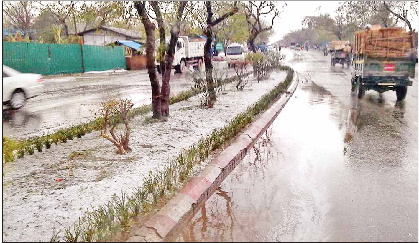
ရန်ကုန်-မန္တလေးလမ်းဟောင်း ဝွယ်တော်ဘုရားအနီးတွင် မိုးသီးများကြွေကျနေစဉ်။

မန္တလေး ဧပြီ ၂၂ မန္တလေးမြို့တွင် သင်္ကြန်မတိုင်မီက အပူချိန်မြင့်မားခဲ့ရာက ဧပြီ ၂၂ ရက် ညနေ ၃ နာရီခွဲခန့်တွင် မိုးရွာသွန်းခဲ့ပြီး တချို့မြို့နယ်များရှိ ရပ်ကွက်များတွင် မိုးသီးများကြွေကျကာ မိုးကြိုးပစ်ခြင်း၊ လေတိုက်ခြင်းများရှိခဲ့ပြီး နေအပူချိန်လျော့ကျခဲ့ကြောင်း သိရသည်။ စာမျက်နှာ ၃ ကော်လံ ၃ သို့ ○