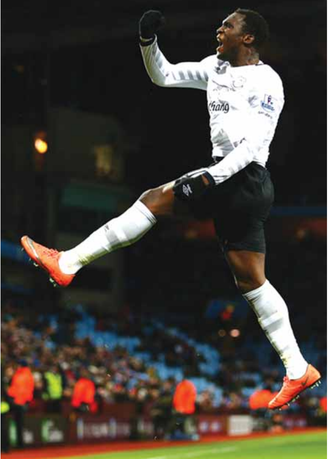
မေလဲ့သင်း