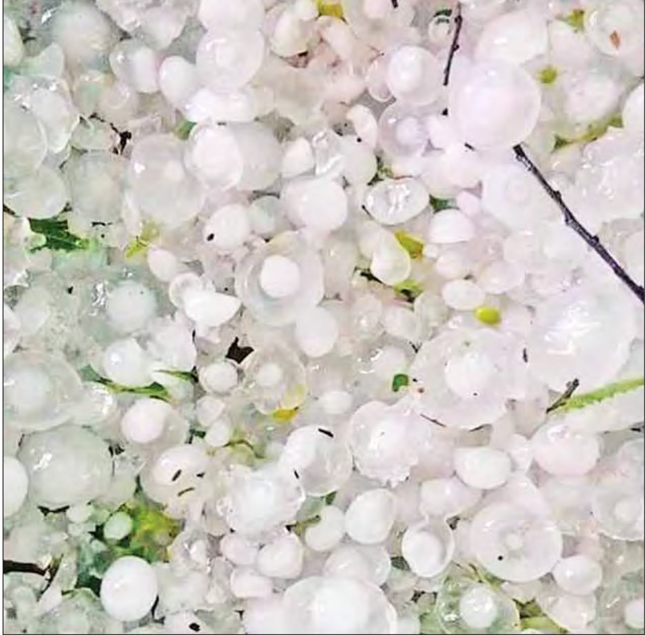
စစ်ကိုင်းမြို့တွင် ဧပြီ ၂၂ ရက် ညနေ ၃ နာရီ ၁၅ မိနစ်က မိုးသက်လေပြင်းများကျရောက်ခဲ့ရာ မြို့ပေါ်ရပ်ကွက်တချို့တွင် မိုးသီးအနည်းငယ်သာကျရောက်ပြီး ပျက်စီးဆုံးရှုံးမှုမရှိခဲ့သော်လည်း ရွှေမင်းဝဲ၊ ပါရမီ၊ နန်းဦးမြို့သစ်ရပ်ကွက်တို့တွင် ထူးကဲစွာဖြင့် မိုးသီးများအဆမတန်ကျရောက်ခဲ့ပြီး သစ်ကိုင်းကျိုးကျခြင်း၊ နေအိမ်သွပ်မိုးလန်ခြင်းတို့ရှိခဲ့သည်ဟု သိရသည်။ (၅၃၁)