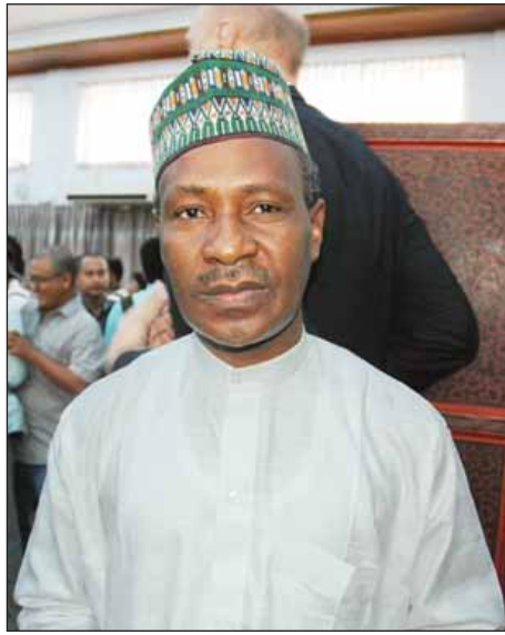
နိုင်ဂျီးရီးယား သံအမတ်ကြီး ကာဘီရူဘယ်လ်လာ