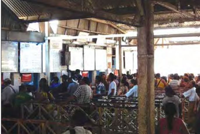
သင်္ကြန်ကာလအတွင်း အမြန်ရထားစီးလက်မှတ်ဝယ်ယူနေကြသော ခရီးသည်များအား တွေ့ရစဉ်။

ရန်ကုန် ၁၉ ၂၂ ၁၃၇၇ ခုနှစ်မဟာသင်္ကြန်မတိုင်မီ ကာ လဖြစ်သော ဧပြီ ၉ ရက်မှ ၁၃ ရက်အတွင်း သင်္ကြန်အထူး ရထားစီးခရီးသည်ဦးရေမှာ ပုံမှန်လိုက်ပါစီးနင်းသူဦးရေထက် အဆ ပေါင်း သုံးဆထိ စံချိန်တင်မြင့်တက်ခဲ့ပြီး ရန်ကုန်-မန္တလေး သင်္ကြန်အထူးရထားတွဲ ဆိုင်းအား သုံးစင်းထိတိုးချဲ့ပြေးဆွဲပေးခဲ့ ရ ကြောင်း မြန်မာ့မီးရထားက ဧပြီ ၂၁ ရက် တွင် ထုတ်ပြန်သော သတင်းများအရ သိရ သည်။ မဟာသင်္ကြန်မတိုင်မီ ကာလဖြစ်သော ဧပြီ ၉ ရက်မှ ၁၃ ရက်ထိကာလအတွင်း ရန်ကုန်ဘူတာကြီးမှ သင်္ကြန်အထူးရထား လိုက်ပါစီးနင်းကြသည့် ခရီးသည်ဦးရေ မှာ တစ်ရက်လျှင် ခရီးသည်ဦးရေ ၁၂၀၀၀ ဦးထိရှိခဲ့ပြီး ပွဲတော်ကာလမဟုတ်သော ပုံမှန်ရက်များတွင် လိုက်ပါစီးနင်းကြသည့် ခရီးသည်ဦးရေမှာ တစ်ရက်လျှင် ခရီး သည်ဦးရေ ၄၀၀၀ ဦးထိသာရှိခဲ့ကြောင်း၊ ရန်ကုန်မြို့ပတ်နှင့် ဆင်ခြေဖူးလမ်းပိုင်းများ ၌ ပြေးဆွဲလျက်ရှိသော ရထားများတွင် လည်း လိုက်ပါစီးနင်းကြသည့် ခရီးသည် ဦးရေမှာတစ်ရက်လျှင် ပုံမှန် ၈၀၀၀ ဦး ဝန်းကျင်ခန့်ထိရှိခဲ့သော်လည်း သင်္ကြန်ပွဲ တော်ကာလဖြစ်သောကြောင့် သင်္ကြန် ကာလအတွင်း ရထားစီးခရီးသည်ဦးရေမှာ ၃၀၀၀၀ ဦးထိသာ လျော့နည်းလိုက်ပါ စီးနင်းခဲ့ကြကြောင်း မြန်မာ့မီးရထား လုပ်ငန်းမှ သိရသည်။ “ရန်ကုန်မှာက သင်္ကြန်ပွဲတော်ရက်ဆို တော့ တချို့က အပြင်မထွက်ကြတာများ ပါတယ်။ ပြီးတော့ ရုံးပိတ်ရက်ဖြစ်တဲ့ အတွက်ကြောင့် အလုပ်သွား၊ အလုပ်ပြန် လည်းမရှိတဲ့အတွက် ဒီရန်ကုန်မြို့ပတ်နှင့် ဆင်ခြေဖူးလမ်းပိုင်းမှာ လိုက်ပါစီးနင်းတဲ့ ခရီးသည်ဦးရေက နည်းပါးသွားတာပါ။ ခုတော့ ရုံးဖွင့်ပြီဆို ရထားစီးခရီးသည်တွေ ပုံမှန်စီးနင်းနေကြပါပြီ။ ဒါကြောင့် ကျွန် တော်တို့ကာလည်း သင်္ကြန်ရက်တွေမှာဆို ရင် မြို့ပတ်လမ်းပိုင်းတွေကို တွဲဆိုင်း ၆ ဆိုင်းနဲ့ ခေါက်ရေ ၆၉ ခေါက်ပဲ ပြေးဆွဲပေး တာပါ။ အရင်ပုံမှန်ရက်တွေဆိုရင် တွဲဆိုင်း