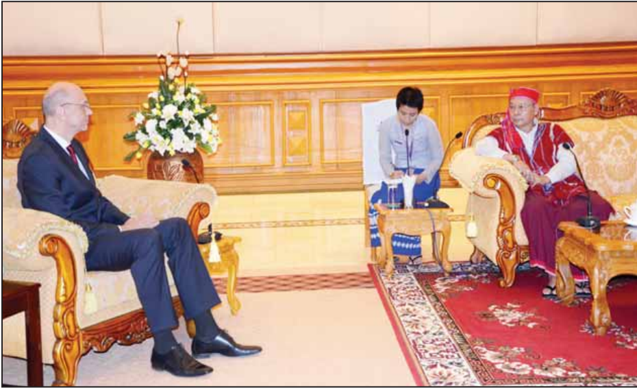
တွေ့ဆုံပွဲသို့ ပြည်ထောင်စု သားလွှတ်တော် ဒုတိယဥက္ကဋ္ဌ လွှတ်တော်ရုံးမှ တာဝန်ရှိသူများ တက်ရောက်ကြသည်။