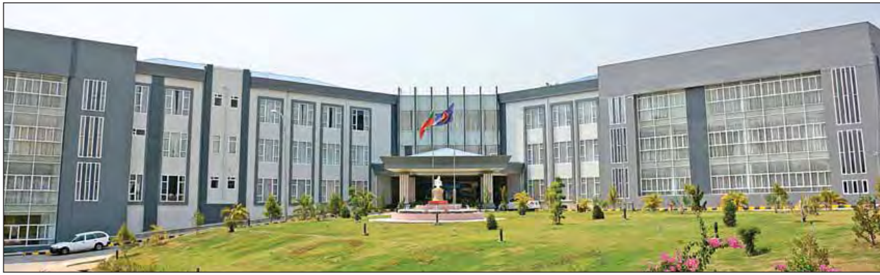
နိုင်ငံခြားရေးဝန်ကြီးဌာန ဝန်ကြီးရုံး အဆောက်အအုံသစ်ကို တွေ့ရစဉ်။