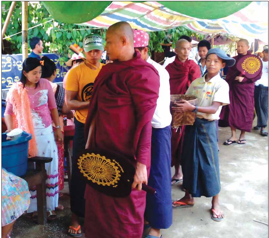
ဖြူး ၈ ဧပြီ ၂၀

၁၂၈၂ ခုနှစ်မှစတင်၍ နှစ်စဉ် နှစ်ဆန်း ၁ ရက်နေ့တွင် ကျင်းပမြဲဖြစ် သော နှစ်ဦးဆွမ်းနှင့် ဆွမ်းဆန်စိမ်း လောင်းလှူပွဲကို ယခုနှစ် ၁၃၇၈ ခုနှစ် တန်ခူးလဆန်း (၁၀) နှစ်ဆန်း ၁ ရက် နေ့ ဧပြီ (၁၇)ရက်တွင် (၉၆) ကြိမ် မြောက် နှစ်ဦးဆွမ်းနှင့် ဆွမ်းဆန်စိမ်း လောင်းလှူပွဲကို ပဲခူးတိုင်းဒေသ ကြီး တောင်ဥဒရိုင် ဖြူးမြို့နယ် ညောင်