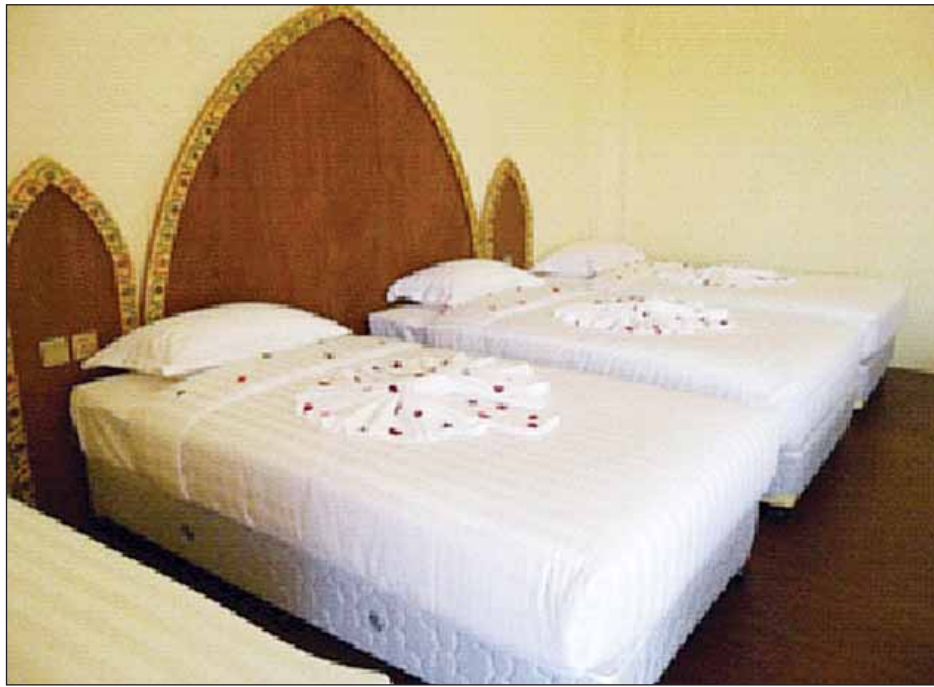
အငွေမတန်းထူးချွန်လူငယ်များတည်းခိုရန် စီစဉ်ထားသည့် ပုဂံ Royal Emerald ဟိုတယ်အခန်းအား တွေ့ရစဉ်။

အင်းလေးအဖွဲ့၊ အထက(၁၄)နဲ့ အထက(၂၂)မှာက ပုဂံအဖွဲ့နဲ့ ငွေဆောင်အဖွဲ့ တည်းကြမှာပါ။ ငွေဆောင်အဖွဲ့က အထက(၁) ပုဂံအဖွဲ့ ကအဝင်ပါ။ သက်ဆိုင်ရာကျောင်း တွေမှာ ဆေးခန်းတွေ ဖွင့်လှစ်ပေးသွား မှာပါ။ ကျွေးမွေးရေးအစီအစဉ်က လည်း အဲဒီစုရပ်စခန်း ကျောင်းတွေ မှာပဲ ကျွေးမွေးဖို့ တစ်ရက် ကျပ် ၅၀၀၀ နှုန်းနဲ့ စီစဉ်ထားပြီးသားပါ။ ပို့ဆောင်ရေးအနေနဲ့ အင်းလေးနဲ့ ပုဂံအတွက် သက်ဆိုင်ရာစခန်းမှူးတွေ ရဲ့ အစီအစဉ်နဲ့ လာခေါ်သွားပါမယ်။ ငွေဆောင်တစ်ခုပဲ မြန်မာနိုင်ငံ အထက်ပိုင်းက အဖွဲ့တွေကို ဧပြီ ၂၅ ရက် ညနေမှာ ရန်ကုန်စုရပ်စခန်းကို ပို့ပေးမယ်။ ပြန်လာတဲ့အခါမှာလည်း မနှစ်ကလိုပဲ ဘယ်အဖွဲ့တွေ ဝင်လာ မလဲဆိုတာကို ကြိုသိအောင် စာရင်း လုပ်ထားပြီး လိုအပ်တဲ့ ကားလက်မှတ်၊ လေယာဉ်လက်မှတ်တွေကို စီစဉ်ပေး သွားမှာပါ။