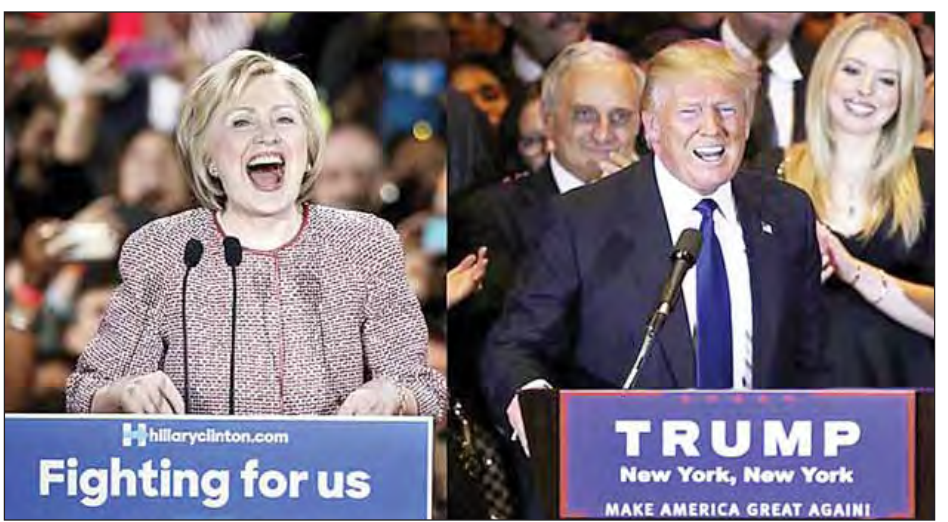
ထရန်တို့သည် နယူးယောက်မြို့ ရွေးကောက်ပွဲတွင် အနိုင်ရရှိခဲ့သည့်အတွက် နောင်လာမည့်ရွေးကောက်ပွဲများအတွက် ရလဒ်ကောင်းများရရှိရန် အရှိန်အဟုန် အနိုင်ရရှိခဲ့သည့်အတွက် နောင်လာမည့်ရွေးကောက်ပွဲကောင်းများရရှိခဲ့ပြီဖြစ်သည်။ အနိုင်နိမ့်အိတ်ချ်ကေ။

သော်လည်း ယခုနယူးယောက်ပြည်နယ်ရွေးကောက်ပွဲတွင် ၎င်းတို့၏ပြိုင်ဘက်များအား မဲအပြတ်အသတ်ဖြင့် အနိုင်ရရှိခဲ့ခြင်းဖြစ်သည်။ ရီပတ်ဘလီကန်ပါတီကိုယ်စားလှယ် ထရန်သည် သူ၏မွေးရပ်ပြည်နယ် နယူးယောက်တွင် ပြိုင်ဘက်ကိုယ်စားလှယ်များအား မဲအပြတ်အသတ်ဖြင့် အနိုင်ရရှိခဲ့သော်လည်း ယခင်စကားရည်လှပွဲများတွင် လွှတ်တော်အမတ် တက်ခရူ့ကို အရေးနိမ့်ခဲ့သည်။ နယူးယောက်မြို့ကိုယ်စားပြုလွှတ်တော်အမတ် အဖြစ် ရှစ်နှစ်ကြာတာဝန်ထမ်းရွက်ခဲ့သည့် ဒီမိုကရက်တစ်ပါတီကိုယ်စားလှယ် ကလင်တန်က လွှတ်တော်အမတ် ဘာနော့ဆန်ဒါးစ်ကို ၅၇ ဒေသမ ၉ ရာခိုင်နှုန်းဖြင့် မဲအသာစီးရကာအနိုင်ရရှိခဲ့သည်။ ကလင်တန်သည် ယခင်စကားစစ်ထိုးပွဲများတွင် သူ့ပြိုင်ဘက်များအား ခုနှစ်ကြိမ်ဆက်တိုက် ရှုံးနိမ့်ခဲ့ကြောင်း သိရသည်။ မည်သို့ပင်ဆိုစေကာမူ ဟီလာရီကလင်တန်နှင့်