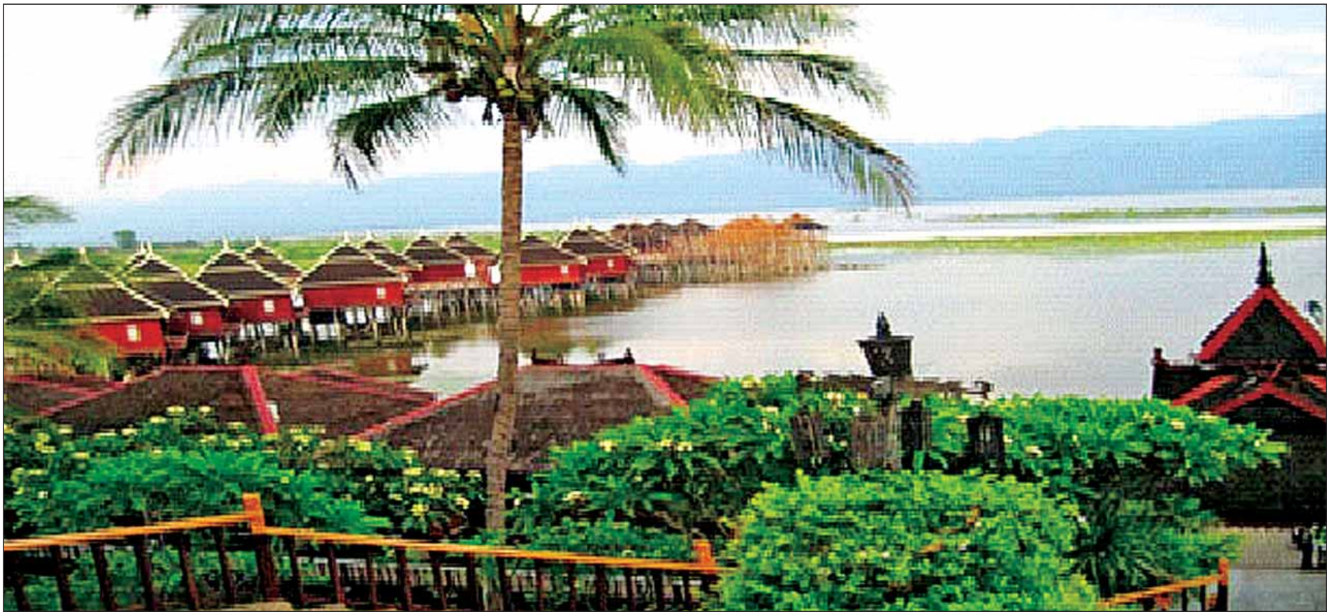
နဝမတန်းထူးချွန်လူငယ်များ တည်းခိုရန် စီစဉ်ထားသည့် ညောင်ရွှေဟူပင်ဟိုတယ်အား တွေ့ရစဉ်။