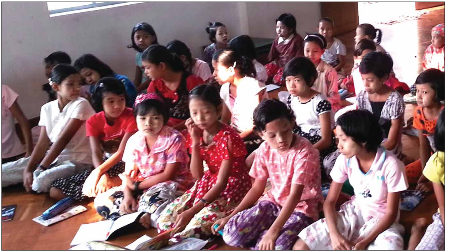
ပြစ်စိတ်၊ သာသနာပြုချင်စိတ်ဖြစ်အောင် ၁၉၅၃ ခုနှစ် ဇန်နဝါရီ၊ မေနှင့် ဩဂုတ်လများတွင်

နယ်သင်တန်းများကို မန္တလေး၊ ပြင်ဦးလွင်၊ နောင်ပိန်၊ ကျောက်မဲ၊ သီပေါ...'