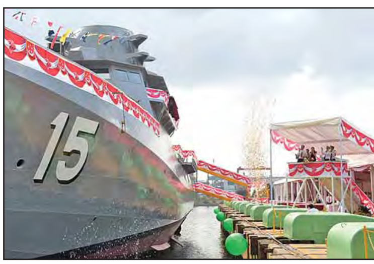
အသုံးပြုနိုင်မည်ဟု မျှော်လင့်ရသည်။ စင်ကာပူနိုင်ငံ၏ ပင်လယ်ရေကြောင်းဆိုင်ရာ နယ်နိမိတ်များကိုကာကွယ်စောင့်ရှောက်နိုင်ရန် စစ်ရေယာဉ်သစ်များလိုအပ်ကြောင်း ရေချပွဲ အခမ်းအနားတွင် စင်ကာပူဒုတိယဝန်ကြီးချုပ်နှင့် အမျိုးသားလုံခြုံရေး ညှိနှိုင်းရေးဝန်ကြီး တို့ချေဟန်က ပြောကြားသည်။ ဆင်ယွာ။

စင်ကာပူ ဧပြီ ၁၇ စင်ကာပူနိုင်ငံ၏ ပင်လယ်ရေကြောင်း လုံခြုံရေးအတွက် ဒုတိယမြောက် ကင်းလှည့်ရေယာဉ်တစ်စင်းကို ဧပြီ ၁၆ ရက်တွင် ရေချပွဲအခမ်းအနား ပြုလုပ်ကြောင်း ဒေသဆိုင်ရာ သတင်းဌာနများက သတင်းထုတ်ပြန်သည်။ “အချုပ်အခြာအာဏာ”ဟု အမည်ပေးထားသော ပင်လယ်ကမ်းရိုးတန်းကင်းလှည့်ရေယာဉ်သည် စင်ကာပူရေတပ်က လက်ရှိ အသုံးပြုနေသော ဖီးယားလက်စ် အမျိုးအစား ကင်းလှည့်ရေယာဉ်များ၏ နေရာတွင် အစားထိုး ဝင်ရောက်လာမည်ဖြစ်သည်။ သက်တမ်းနှစ် ၂၀ ရှိ ကင်းလှည့်ရေယာဉ်များကို အစားထိုးနိုင်ရန် ကင်းလှည့်ရေယာဉ်သစ်များကို တည်ဆောက်သွားမည်ဖြစ်သည်။ ဧပြီ ၁၆ ရက်က ရေချလိုက်သော ကင်းလှည့်ရေယာဉ်ကို စင်ကာပူရေတပ်က ၂၀၁၇ ခုနှစ်တွင် စစ်ဆင်ရေးလုပ်ငန်းများ၌