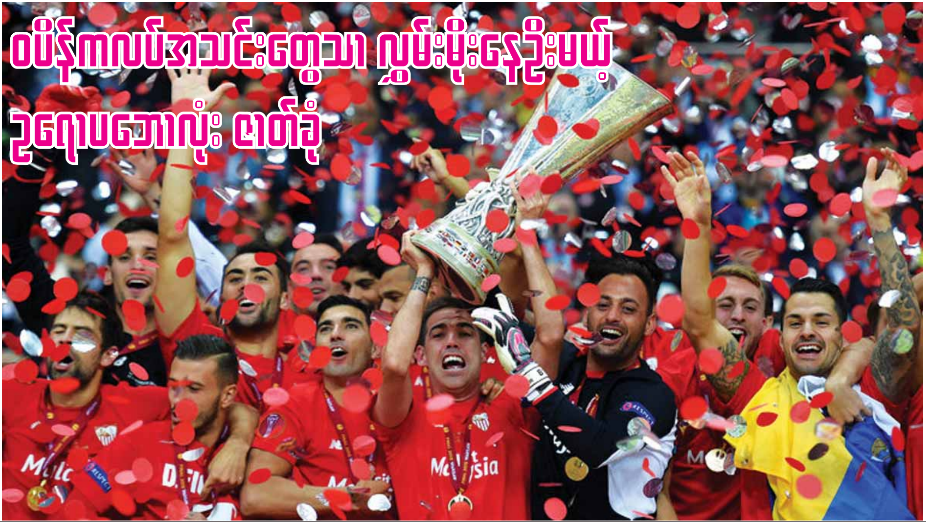
၂၀၁၅ ခုနှစ် ယူရိုပါလိဂ်ချန်ပီယံ ဆီဗီလာအသင်း။

ချန်ပီယံနှင့် ယူရိုပါလိဂ်ကွာတားဖိုင်နယ် ပွဲစဉ်တွေအပြီးမှာ စပိန်ကလပ် အသင်း နှစ်သင်းစီ အကြံဉာဏ်လှပအဆင့်ကို တက် ရောက်လာနိုင်ခဲ့တာကို တွေ့ရပါတယ်။ ဒါ့ကြောင့် စပိန်အသင်းတွေဟာ ဥရောပမှာ အောင်ပွဲခံနိုင်ဖို့ ၅၀ရာခိုင်နှုန်း လောက် သေချာနေပြီး စပိန်ကလပ်ဂါလာ ဥရောပရဲ့ အဆင့်မြင့်ဆုံး အမှတ်ပေးပြိုင်ပွဲဖြစ် တယ်ဆိုတာ သက်သေခံနေသလို အနေ အထားကို မီးမောင်းထိုးပြလိုက်သလိုပါပဲ။ ကွာတားဖိုင်နယ်အဆင့်မှာ စပိန်ကလပ် သုံးသင်းစီ တက်ရောက်နိုင်ကြပေမယ့် ချန်ပီယံလိဂ်မှာ အက်သလက်တီကိုနဲ့ ဘာစီ လိုနာ၊ ယူရိုပါလိဂ်မှာ ဆီဗီလာနဲ့ ဘီဘီအိုတို့ ထိပ်တိုက်တွေ့ဆုံနေခဲ့လို့ နှစ်သင်းစီသာ အကြံဉာဏ်လှပ အဆင့်ကိုတက်ရောက်နိုင်ခဲ့ တာဖြစ်ပါတယ်။ စပိန်ကလပ်အသင်းတွေ ချန်ပီယံလိဂ်လို အဆင့်မြင့်ဆုံးပြိုင်ပွဲမှာ လွှမ်းမိုးနေတာ ဆယ်စုနှစ် တစ်ခုကျော်မက ကြာမြင့်နေပြီး ၁၉၉၈ကနေ ၂၀၀၂ခုနှစ်အထိ နိုယဲလ်မက်ဒရစ်၊ ၂၀၀၆ကနေ အခုထိ ဘာစီ လိုနာက တောက်လျှောက်လွှမ်းမိုးနေတာကို တွေ့ရပါတယ်။ နောက်ဆုံး ဆယ်စုနှစ် တစ်ခု အတွင်း (၂၀၀၆ ခုနှစ်မှ ၂၀၁၅ခုနှစ်) အတွင်း စပိန်ကလပ်အသင်းတွေက ငါးကြိမ်တိုင် ချန်ပီယံဖြစ်ထားပြီး အီတလီအသင်းတွေနဲ့ အင်္ဂလန်တွေက နှစ်ကြိမ်စီ၊ ဂျာမနီကလပ် အသင်းက တစ်ကြိမ် ဖြစ်ခဲ့တာကြောင့် တစ်ခြား ဥရောပကလပ် အသင်းတွေဟာ စပိန်ကလပ်အသင်းတွေရဲ့ အောင်မြင်မှုကို ဘယ်လိုမှ လိုက်မမီနိုင်တာ ထင်ရှားပါတယ်။ ဒီငါးကြိမ်မှာ ဘာစီလိုနာက လေးကြိမ်(၂၀၀၆၊ ၂၀၀၉၊ ၂၀၁၁၊ ၂၀၁၅)နဲ့ နိုယဲလ်မက်ဒရစ်က ၂၀၀၄ခုနှစ်မှာ တစ်ကြိမ် ချန်ပီယံဖြစ်ခဲ့တာဖြစ် ပါတယ်။