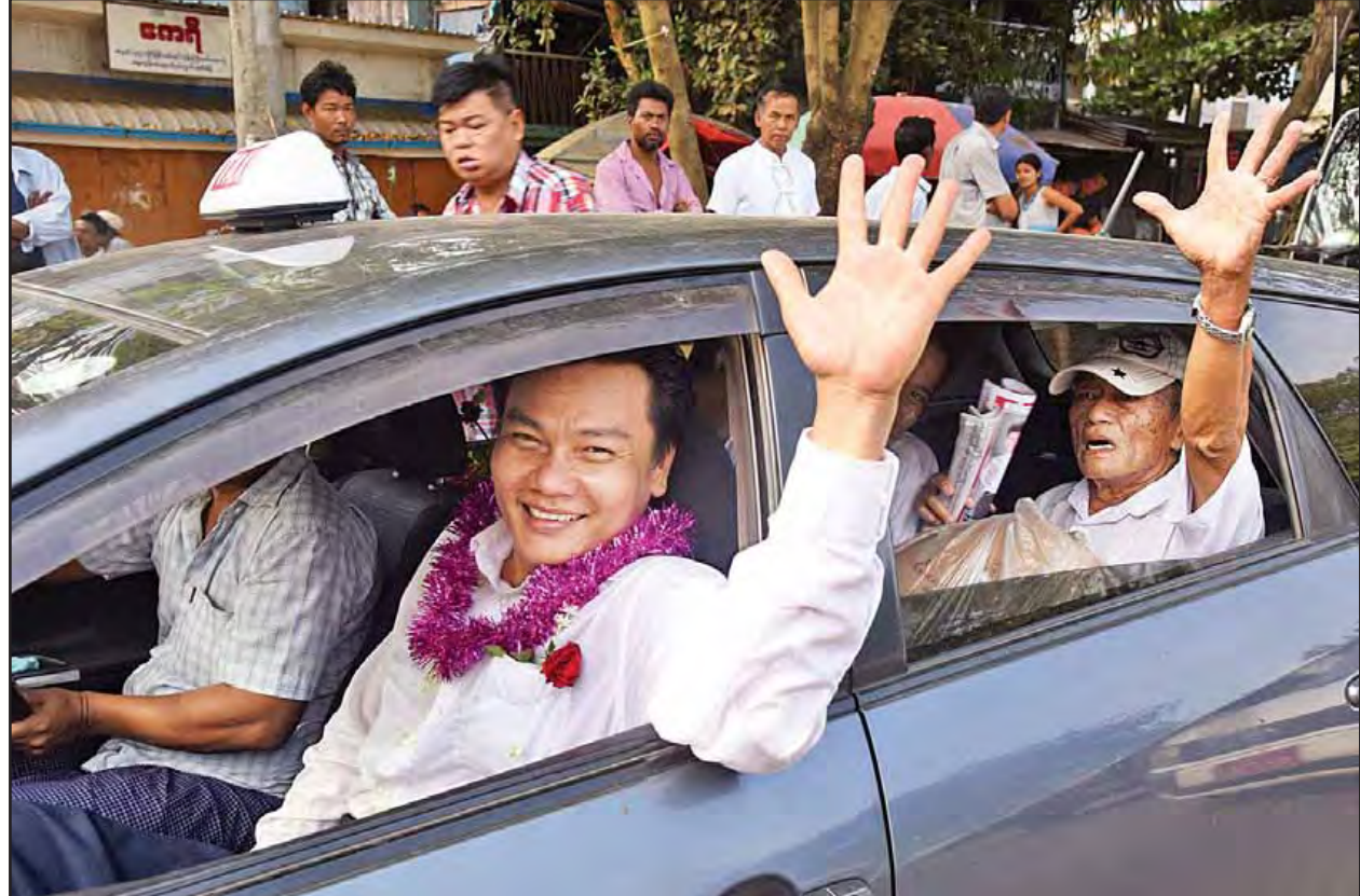
နိုင်ငံတော်သမ္မတ ဦးထင်ကျော်၏ ပြစ်ဒဏ်လွတ်ငြိမ်းခွင့်ဖြင့် ပြန်လည်လွတ်မြောက်လာသော နိုင်ငံရေးတက်ကြွလှုပ်ရှားသူ ဦးနေမျိုးဇင်ကို တွေ့ရစဉ်။

သတင်း - ဇော်ကြီး(ပဏိတ)၊ဓာတ်ပုံ - ငွေအောင်