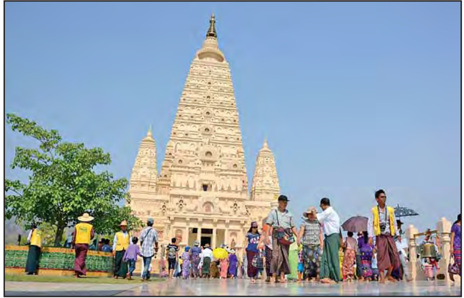
နေပြည်တော်ရှိ သတ္တ သတ္တာဟ စေတီတော်တွင် ဘုရားဖူးများဖြင့် စည်ကားလှပေသည်ကိုတွေ့ရစဉ်။(သတင်းစဉ်)

ကမ္ဘာသူ ကမ္ဘာသားများနှင့် မြန်မာနိုင်ငံသားများ ကျန်းမာချမ်းသာ၍ ဘေးအန္တရာယ်ကင်းရှင်းစေရန် ရည်ရွယ်၍ ယနေ့နံနက် ၇ နာရီခွဲတွင် နိုင်ငံတော်ဩဝါဒါစရိယ နေပြည်တော် ယဉ်ကျေးမှုဦးစီးဌာနမှ မဟာဝိသုတရာမဈေးကုန်းကျောင်းတိုက် ပဓာန နာယကဆရာတော်