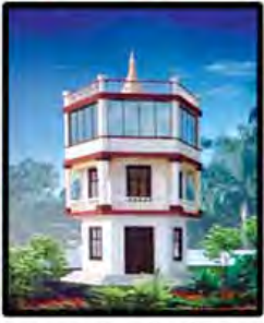
(ဆောက်လုပ်မည့်ပုံစံ)