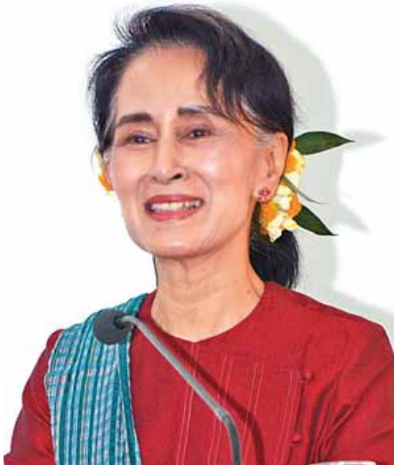
နိုင်ငံတော်၏ အတိုင်ပင်ခံပုဂ္ဂိုလ် ဒေါ်အောင်ဆန်းစုကြည်

စောင့်ရှောက်မှု ဆောင်ရွက်ပေးခဲ့ကြသော ကျန်းမာရေး ဝန်ထမ်းများ အပါအဝင် ပြည်သူ့ရေးရာဝန်ဆောင်မှုများ၊ ရုံးလုပ်ငန်းများ မပျက်ယွင်းမလစ်လပ်စေရန် တာဝန်ထမ်း ဆောင်ခဲ့ကြသော နိုင်ငံတစ်ဝန်းလုံးရှိ နိုင်ငံဝန်ထမ်းများ အားလုံးကိုလည်း ကျေးဇူးအထူးပင်တင်ရှိပါသည်။ ၄။ ထို့အပြင် အများပြည်သူပျော်ရွှင်စွာ ရေသာဘင်ပွဲ ဆင်နွှဲနိုင်ကြစေရန်လည်းကောင်း၊ အမှိုက်ကင်းစင်ရေးနှင့် ပတ်ဝန်းကျင်သန့်ရှင်းရေးအတွက်လည်းကောင်း၊ အရေး ပေါ်အကူအညီ၊ သွေးအလှူ၊ ဆေးဝါးအလှူစသည့် မွန်မြတ်သော လုပ်ဆောင်ချက်များအတွက် လည်းကောင်း၊ လူပျောက်ဆုံးမှု၊ ထိခိုက်ဒဏ်ရာရရှိမှုတို့တွင် ဆွေမျိုးသား ချင်းမိသားစုစိတ်ဖြင့် ကူညီဆောင်ရွက်ပေးခဲ့ခြင်းများ အတွက်လည်းကောင်း၊ မိမိတို့တတ်နိုင်သည့် နေရာများမှ မေတ္တာစေတနာစိတ်အပြည့်အဝဖြင့် ကူညီဆောင်ရွက်ပေး ခဲ့ကြသော မီးသတ်တပ်ဖွဲ့ဝင်များ၊ ကြက်ခြေနီတပ်ဖွဲ့ဝင်များ၊ လူငယ်အဖွဲ့အစည်းများ၊ ပရဟိတအဖွဲ့အစည်းများ၊ လူမှုရေးအသင်းအဖွဲ့များ၊ နိုင်ငံသူ နိုင်ငံသားများအားလုံးကို ကျေးဇူးဥပကာရ အထူးပင်တင်ရှိပါသည်။ ၅။ နောက်ဆုံးအနေဖြင့် မြန်မာ့ရိုးရာနှစ်သစ်ကူး မဟာ သကြိတ်ပွဲတော်ကာလအတွင်း မြန်မာ့ရိုးရာထုံးတမ်းစဉ် လာများကို မပျောက်ပျက်စေရန် ဆက်ခံထိန်းသိမ်း၍ စတုဒိသာအလှူဒါနပြုကြသူ၊ လူကြီးသူမများအား တရော် ကင်ပွန်းများဖြင့် ခေါင်းလျှော်ချေးချိုး၊ ခြေသင်းလက်သင်း သန့်စင်ခြင်းများဖြင့် ကန်တော့ကြသူ၊ ဘုရား၊ ကျောင်းကန် များတွင် သန့်ရှင်းရေးနှင့် ဝေယျာဝစ္စများ လုပ်ဆောင်ကြသူ၊ တိရစ္ဆာန်များအား ဘေးမဲ့ဖမ်းခြင်းစသည့် ဇီဝိတဒါနအလှူ ပြုကြသူ၊ ရပ်ရွာတစ်ဝှင် အန္တရာယ်ကင်းပရိတ်ရွတ်ခြင်း၊ ကောင်းမှုကုသိုလ်ပြုခြင်းများ ဆောင်ရွက်ကြသူ နိုင်ငံသူ နိုင်ငံသားများအားလုံးကိုလည်း ကျေးဇူးတင်ရှိပါသည်။