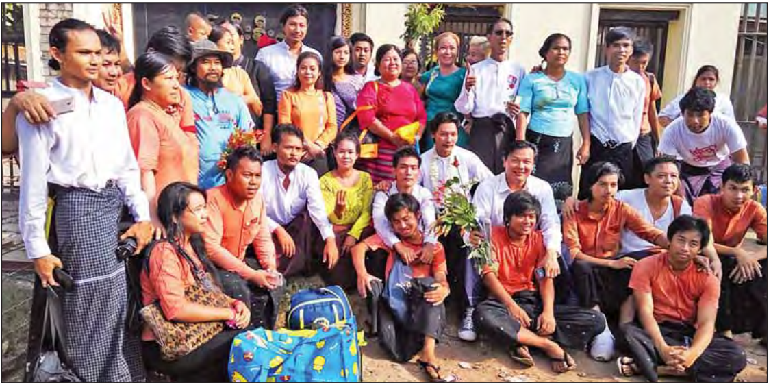
နိုင်ငံတော်သမ္မတ ဦးထင်ကျော်၏ ပြစ်ဒဏ်မှလွတ်ငြိမ်းခွင့်ဖြင့် ဧပြီ ၁၇ ရက်က အင်းစိန်အကျဉ်းထောင်မှ ပြန်လည်လွတ်မြောက်လာသူများကို ကြိုဆိုသူများနှင့်အတူ တွေ့ရစဉ် (ယုဇန)

နေပြည်တော် ဧပြီ ၁၇ အမျိုးသားရင်ကြားစေရေးနှင့် ပြည်သူလူထု နှလုံးစိတ်ဝမ်းငြိမ်းချမ်းစေရေးကို ဦးတည်ပြီး အကျဉ်းသား ၈၃ ဦးကို ယနေ့ (မြန်မာနှစ်ဆန်း ၁ ရက်) နံနက်ပိုင်းမှစတင်၍ အကျဉ်းထောင် အသီးသီးမှ လွတ်ပေးလိုက်ပြီ ဖြစ်သည်။ အဆိုပါ ပြစ်ဒဏ်မှလွတ်ငြိမ်းခွင့်ပြုခြင်းကို နိုင်ငံတော်သမ္မတ ဦးထင်ကျော်က နိုင်ငံတော် ဖွဲ့စည်းပုံအခြေခံဥပဒေပုဒ်မ ၂၀၄၊ ပုဒ်မခွဲ(က)အရ ယမန်နေ့ (ဧပြီ ၁၆ ရက်)က လက်မှတ် ရေးထိုးထုတ်ပြန်ခဲ့ရာ အကျဉ်းထောင်/စခန်း ၂၅ ခုမှ အမျိုးသား ၇၅ ဦးနှင့် အမျိုးသမီး ၈ ဦး စုစုပေါင်း ၈၃ ဦးကို ပြစ်မှုဆိုင်ရာကျင့်ထုံးဥပဒေပုဒ်မ-၄၀၁၊ ပုဒ်မခွဲ(၁)ဖြင့် ပြစ်ဒဏ်မှ လွတ်ငြိမ်းခွင့်ပြုခဲ့ခြင်းဖြစ်သည်။ နိုင်ငံတော်၏အတိုင်ပင်ခံပုဂ္ဂိုလ်အနေဖြင့် အကျဉ်းထောင်အသီးသီး၌ ပြစ်ဒဏ် ကျခံနေရသော နိုင်ငံရေးအကျဉ်းသားများနှင့် နိုင်ငံရေးတက်ကြွလှုပ်ရှားသူများ လွတ်ငြိမ်း သက်သာခွင့်ရရှိပြီး အမြန်ဆုံးပြန်လည်လွတ်မြောက်ရေးအတွက် လိုအပ်သည့်စိစစ်မှုများ ဆောင်ရွက်လျက်ရှိပြီး လုပ်ထုံးလုပ်နည်းများနှင့်အညီ ဆက်လက်ဆောင်ရွက်သွားမည် ဖြစ်ကြောင်း ဧပြီ ၈ ရက်က ကြေညာချက်အမှတ် (၂/၂၀၁၆)ထုတ်ပြန်ခဲ့ပြီးနောက် ယခုကဲ့သို့ ဆက်လက်ဆောင်ရွက်ခဲ့ခြင်းလည်းဖြစ်သည်။ ထို့အတူ နိုင်ငံရေးအကျဉ်းသားများ၊ နိုင်ငံရေးတက်ကြွလှုပ်ရှားသူများ၊ နိုင်ငံရေးနှင့် ဆက်နွှယ်ပြီး အမှုရင်ဆိုင်နေကြရသော ကျောင်းသား၊ ကျောင်းသူများ လွတ်မြောက်ရေးအတွက် ကြိုးပမ်းဆောင်ရွက်သွားမည်ဖြစ်ကြောင်း စာမျက်နှာ ၈ ကော်လံ ၄ သို့ *