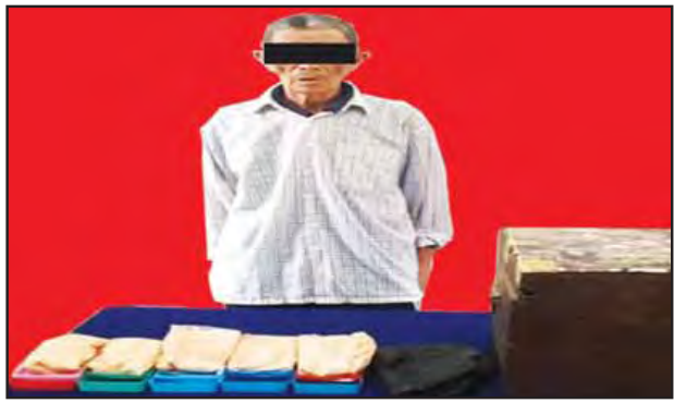
ရန်စန်းရှမ်းအား သိမ်းဆည်းရမိမှုအစီအစဉ်အတွက် ဖမ်းဆည်းရမိမှုများနှင့်အတူ တွေ့ရစဉ်။