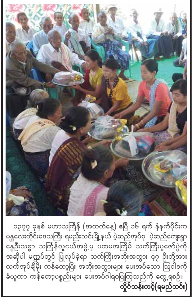
၁၃၇၇ ခုနှစ် မဟာသင်္ကြန် (အတက်နေ့) ဧပြီ ၁၆ ရက် နံနက်ပိုင်းက မန္တလေးတိုင်းဒေသကြီး ရမည်းသင်းမြို့နယ် ပဲခည်အုပ်စု ပဲခည်ကျေးရွာ နွေဦးသစ္စာ သင်္ကြန်လူငယ်အဖွဲ့မှ ပထမအကြိမ် သက်ကြီးပူဇော်ပွဲကို အဆိုပါ မဏ္ဍပ်တွင် ပြုလုပ်ခဲ့ရာ သက်ကြီးအဘိုးအဘွား ၄၇ ဦးတို့အား လက်အုပ်ချီမိုး ကန်တော့ပြီး အဘိုးအဘွားများ ပေးအပ်သော ဩဝါဒကို ခံယူကာ ကန်တော့ပစ္စည်းများ ပေးအပ်ဂါရဝပြုကြသည်ကို တွေ့ရစဉ်။ လှိုင်သန်းတင့်(ရမည်းသင်း)

ခြံ၍တင်ပြရလျှင်လူသားတိုင်းဟာ တစ်ဦးတစ်ယောက်တည်းနေလို့မရပါဘူး။ မိတ်ဆွေအသိုင်းအဝိုင်းဖြင့်နေထိုင်ကြရပါတယ်။ လူတိုင်းတွင် ဇာတိချက်ကြွေးမွေးရပ်မြေများရှိကြပါတယ်။ ထိုမွေးရပ်မြေကို သတိရအောက်မေ့ခြင်းဟာ မင်္ဂလာတစ်ပါးပင်ဖြစ်ပါတယ်။ စာရေးသူလည်း မိမိချွေးနဲ့စာထဲမှ မွေးရပ်မြေတွင် ဘုရားဆင်းတုများ၊ မုခ်ဦးများနှင့်ကျောင်းခန်းများကိုတတ်နိုင်သမျှလှူဒါန်းဖြစ်ခဲ့ပါတယ်။ ထိုကောင်းမှုကုသိုလ် များအားရေစက်ချတဲ့အလှူကိုလည်း မွေးရပ်မြေကျေးရွာကလေး၌ပင်လုပ်ဖြစ်ခဲ့ပါတယ်။ ခေတ်ကာလ မည်သို့ပင်ပြောင်းလဲနေစေကာမူ ကျေးလက်နေပြည်သူများဟာ မိမိကျေးရွာအတွင်း သာရေး၊ နာရေးကိုစွန့်လာလျှင် အကူအညီတောင်းစရာမလိုဘဲ တက်ညီလက်ညီဝိုင်းဝန်းလုပ်ကိုင်ပေးလေ့ရှိကြပါတယ်။ ထိုအစဉ် အလာကောင်းများဟာ မြို့ပြများတွင်တွေ့ရမြင်ရခဲ့လာပါတယ်။ မည်သို့ပင်ဆိုစေကာမူ အနေအေးပြီးရိုးရိုးသားလှသော ကျေးလက်နေပြည်သူများဟာ ၎င်းတို့၏ ပရဟိတစိတ်စာတ်ကိုဆက်လက် ထိန်းသိမ်းနေကြမည်မှာ သံသယဝင်စရာမလိုသောအရှိတရားပင်ဖြစ်ပေတော့သည်။