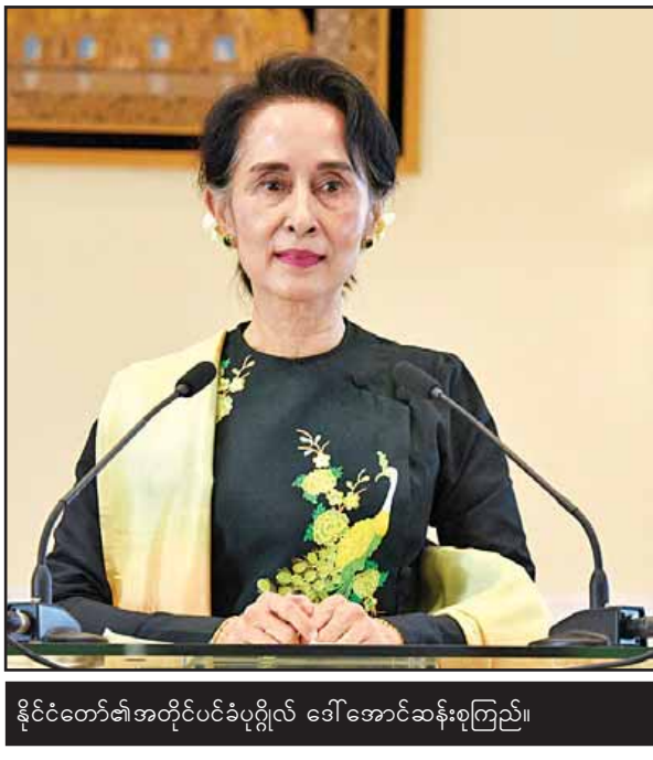
နိုင်ငံတော်၏အတိုင်ပင်ခံပုဂ္ဂိုလ် ဒေါ်အောင်ဆန်းစုကြည်။

နိုင်ငံတော်၏အတိုင်ပင်ခံပုဂ္ဂိုလ် ဒေါ်အောင်ဆန်းစုကြည်ပြောကြားသည့် နှစ်သစ်ကူးမိန့်ခွန်း