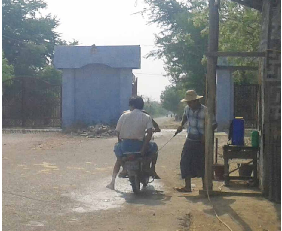
မုံရွာကြက်မွေးမြူရေးဇုန်အဝင်ပေါက်တွင် ဇီဝလုံခြုံရေးဆေးဖျန်းနေသည်ကိုတွေ့ရစဉ်။

ခြံရှင်ခွင့်ပြုချက် ကြက်မွေးမြူရေးဇုန်ကော်မတီရဲ့ ထောက်ခံချက်နဲ့ သုတ်သင်ရှင်းလင်းလာတာ ဧပြီ ၁၄ ရက် အထိ ကြက်ကောင်ရေ ၆၉၂၆ ကောင် ရှင်းလင်းသုတ်သင်ပြီးဖြစ်ပါတယ်။” ဟုမုံရွာခရိုင် တိရစ္ဆာန်မွေးမြူရေးနှင့်ကုသရေးဦးစီးမှူးဒေါက်တာမျိုးချစ်ထံမှ သိရသည်။ ယခင်နှစ်ကထက်ပြင်းထန်သည်ဟု သတ်မှတ်ထားသော H9N2 ရောဂါသည် ကြက်ခြံပိုင်ရှင်များ၏ စည်းကမ်းရှိမှုအပေါ် များစွာမူတည်နေပြီး မိမိလုပ်လိုရာဆောင်ရွက်သွားမည်မဟုတ်ဘဲ ခြံပိုင်ရှင်နှင့်လုပ်သားများပူးဆောင်ရွက်သွားမည်ဖြစ်ကြောင်း ဝန်ကြီးချုပ်ဒေါက်တာမြင့်နိုင်က ပြောကြားသည်။ “ပြီးခဲ့တဲ့ ၂၀၁၂ ခုနှစ် မုံရွာကြက်ဇုန်အထူးဇုန် မီးလောင်တော့လည်း မီးဘေးသင့်ခဲ့ရသလို ၂၀၁၅ ခုနှစ်က ဖြစ်ခဲ့တဲ့ H5N1 တုန်းကလည်း ကြက်တွေအားလုံး သုတ်သင် ရှင်းလင်းတဲ့အထိပါကုန်ခဲ့ပါတယ်။ အဲဒီနောက်ပိုင်း နိုင်ငံတော်က ခြံပိုင်ရှင်တွေကို အထောက်အပံ့ပေးခဲ့တာ ရှိပေမယ့် ပြန်လည်ထူထောင်ဖို့ အရင်းအနှီးငွေ လိုတဲ့အတွက် ငွေချေးပြီးပြန်မွေးနေတာ အခုချိန်အထိ ပြန်ဆပ်တာမကြေ သေးတဲ့သူတွေရှိနေပါသေးတယ်။ တချို့က တော့ ကြေခါစပဲရှိပါသေးတယ်” ဟုမုံရွာကြက်မွေးမြူရေးဇုန် လုပ်ငန်းရှင်တစ်ဦးက ပြောပြသည်။ ယခုအခါ မုံရွာကြက်ဇုန်အတွင်း ကြက်အသေအပျောက်ရှိ၍ ရောဂါပိုးတွေ့သော အပိုင်းမှကြက်များကို သုတ်သင်ရှင်းလင်းနေသလို ကြက်ခြံအတွင်းရှိ ကျန်ရှိသော ရောဂါကင်း၍ အသေအပျောက်မရှိသေးသော ကြက်ခြံများကို စောင့်ကြည့်ကာ ဇီဝလုံခြုံရေးဖြစ်သည့် ခြံဖျန်းဆေးများ ဖြန်းခြင်း၊ အပူဒဏ်ကာကွယ်နိုင်ရန် ခြံအတွင်းရေပန်းပွားများ တတ်ဆင်ခြင်း၊ ခြံပတ်လည်ရေအမြဲစိုစွတ်နေအောင် အဝတ်စောင်များ ကာရံထားခြင်းများအပြင် ဇုန်အဝင်၊ အထွက်နေများတွင် ဆေးဖျန်း၍ ကာကွယ်မှုများကို ယခင်ထက် အရှိန်မြှင့်တင်ဆောင်ရွက်လျက်ရှိကြောင်း သိရသည်။ ထိုသို့ H9N2 ရောဂါဖြစ်နေချိန်တွင် ကြက်မူလူသို့ကူး