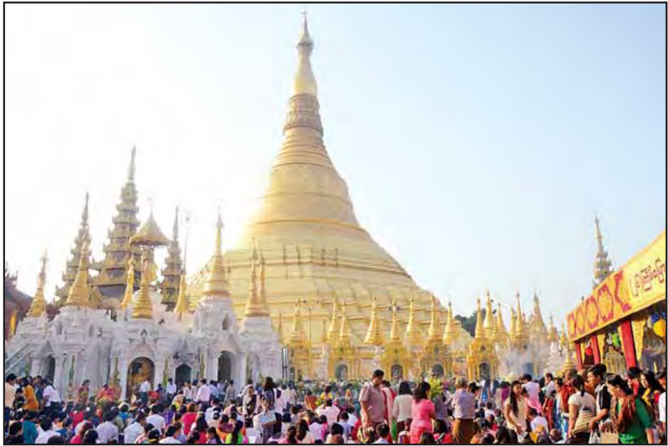
မြန်မာနှစ်ဆန်း ၁ ရက်နေ့က ရန်ကုန်မြို့ ရွှေတိဂုံစေတီတွင် ကုသိုလ်ပြုသူများဖြင့် စည်ကားလှပေသည်ကိုတွေ့ရစဉ်။

လောကချမ်းသာ အဘယလာဘမုနိရုပ်ပွားတော် မြတ်ကြီး၌ (၁၅)ကြိမ်မြောက် မျက်နှာသစ်တော်ရေ ဆက်ကပ်လှူဒါန်းခြင်းနှင့် ရောင်တော်ဖွင့်ခြင်းမင်္ဂလာ အခမ်းအနားကို နံနက် ၆ နာရီတွင်စတင်ကျင်းပရာ ဂေါပကအဖွဲ့ဝင်များ၊ တာဝန်ရှိသူများနှင့် ဝတ်အသင်းအဖွဲ့များက ရုပ်ပွားတော်မြတ်ကြီးအား ဆွမ်း၊ ပန်း၊ ရေချမ်း၊ သစ်သီး ဆွမ်းများ ဆက်ကပ်လှူဒါန်းခြင်း၊ ရှစ်ပါးသီလခံယူ