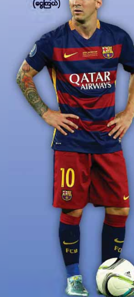
(ဓမ္မဇာယ်)

ချန်ပီယံလိဂ် ကွာတားဖိုင်နယ်အဆင့်တွင် လာလီဂါပြိုင်ဘက် အက်သလက်တီကိုမက်ဒရစ် အသင်းကို နှစ်ကျောပေါင်းရလဒ် သုံးဂိုး-နှစ်ဂိုးဖြင့် ရှုံးနိမ့်ခဲ့ခြင်းကြောင့် ဘာစီလိုနာအသင်းအတွက် တစ်နှစ်တည်းဖလားသုံးလုံးရယူမည်ဆိုသည့် ရည်မှန်း ချက်ပျက်ပြယ်ခဲ့ရသည့်အပြင် လာလီဂါပြိုင်ပွဲတွင် လည်း ရလဒ်ပိုင်းဆိုးရွားမှုပြဿနာနှင့် ရင်ဆိုင် ခဲ့ရသည်။ ထို့ကြောင့် ဘာစီလိုနာအသင်းအနေဖြင့် တိုက်စစ်မှူးမက်ဆီ ပုံမှန်ခြေစွမ်းပြန်လည်ရရှိရန် လိုအပ်နေပြီဖြစ်ကြောင်း သတင်းများက ဖော်ပြ ထားသည်။