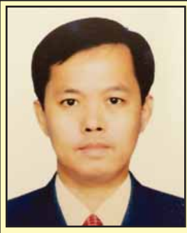
(တက္ကသိုလ် ဟန်စိုးဦး)

၂၁ ရာစု ပင်လယ်ရေကြောင်း ပိုးလမ်းမဟု လူသိများပြီး နိုင်ငံပေါင်းစုံကျယ်ကျယ်ပြန့်ပြန့်ပါဝင်သော စီးပွားရေးလမ်းကြောင်းတစ်ခုကို တရုတ်ပြည်သူ့သမ္မတနိုင်ငံ သမ္မတရှီကျင့်ဖျင်က စတင်အဆိုပြုခဲ့ပြီး တောင်တရုတ်ပင်လယ်၊ တောင်ပစိဖိတ်သမုဒ္ဒရာ၊ အိန္ဒိယသမုဒ္ဒရာများနှင့် တစ်ဆက်တစ်စပ်တည်းရှိနေသည့် အရှေ့တောင်အာရှဒေသနိုင်ငံများ၊ ပင်လယ်သမုဒ္ဒရာကျွန်းနိုင်ငံများ၊ အရှေ့အာဖရိကနိုင်ငံများ၊ မြေထဲပင်လယ် မြောက်ပိုင်းနိုင်ငံများအကြား ပူးပေါင်းဆောင်ရွက်မှုများ ပြုလုပ်သွားမည့် အစီအစဉ်ဖြစ်ပါသည်။ အဆိုပါ ပိုးလမ်းမကြီးအကြောင်းကို စာရေးဆရာ တက္ကသိုလ်ဟန်စိုးဦးက ရုပ်ဝန်းတစ်ခု လမ်းကြောင်းတစ်ခုအမည်ဖြင့် ရေးသားထားသည်များကို ကြေးမုံစာဖတ်ပရိသတ်များအတွက် အခန်းဆက်ဆောင်းပါးများအဖြစ် ဖော်ပြလိုက်ပါသည်။ (စာတည်း)