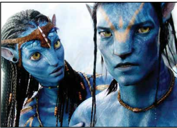
ဝင်ငွေအကောင်းဆုံးသော ရုပ်ရှင်အဖြစ် ရပ်တည်နိုင်ခဲ့တဲ့ အောင်မြင်တဲ့ ရုပ်ရှင်ကားတစ်ကားလည်း ဖြစ်ပါတယ်။

ထုတ်လွှင့်ပြသခဲ့ပြီးတဲ့ “Avatar” ရုပ်ရှင်ဟာ သမိုင်းတစ်လျှောက် မြောက်အမေရိကမှာ ရုံတင်ပြသခဲ့တဲ့ ရုပ်ရှင်တွေအနက် ဒုတိယမြောက်