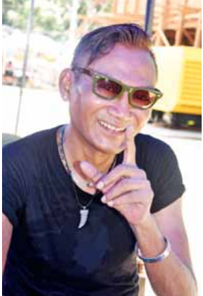
ချစ်ကောင်း

သကြိန်နောက်ဆုံးနေ့(အတက်နေ့) ဖြစ်သည့်အလျောက် ရေပတ်ခံတွက်သူများ၊ ရေကစားသူများမှာ ယခင်နေ့များထက် ပိုမိုစည်ကားများပြားလျက် ရှိသည်ကိုတွေ့မြင်ရသည်။ နှစ်စဉ်နှစ်တိုင်း အထူးစည်ကားသည့်မဏ္ဍပ်တစ်ခုဖြစ်သည့် ၁၉ လမ်း မဏ္ဍပ် (mntv & LifeBuoy) မဏ္ဍပ်ဆိုလျှင် သတ်မှတ်ထားသော ရေကစားသည့် နောက်ဆုံးအချိန် ညနေ ၆ နာရီတွင် ရေပိတ်သိမ်းပြီး ဖျော်ဖြေရေးအစီအစဉ်ကို ည ၇ နာရီမှ ပြန်လည်စတင်ပြီး ည ၁၂ နာရီအထိ ဖျော်ဖြေတင်ဆက်ပေးခဲ့သည်။