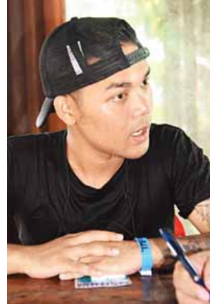
ဒီမိုသော်

ထို့နည်းတူ ပြည်လမ်းရှိ အဲပုဂံမဏ္ဍပ်မှာလည်း ရေကစားချိန်အပြီး သကြိန်သိချင်းဖြစ်သည့် မန်းတောင်ရိပ်ခို သီချင်းဖြင့်ပိတ်သိမ်းသည့်အပြင် တရုတ်သရုံးအဖွဲ့၏ တရုတ်ရိုးရာအကနှင့် SIR အဖွဲ့တို့က ဖျော်ဖြေပေးခဲ့သည်။