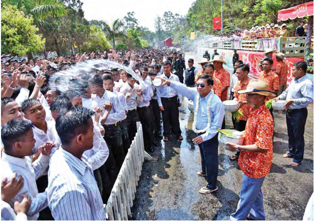
တပ်မတော်ကာကွယ်ရေးဦးစီးချုပ် ဗိုလ်ချုပ်မှူးကြီး မင်းအောင်လှိုင် ပြင်ဦးလွင် စစ်တက္ကသိုလ် မိသားစုရေသဘင်မဏ္ဍပ်တွင် ပါဝင်ဆင်နွှဲစဉ်။ (သတင်းစဉ်)

ဆက်လက်၍ တပ်မတော်ကာကွယ်ရေးဦးစီးချုပ်နှင့် အဖွဲ့ဝင်များသည် ပြင်ဦးလွင်တပ်နယ်ရှိ တပ်မတော်အုပ်ချုပ်မှုကျောင်း မိသားစုရေသဘင်မဏ္ဍပ်သို့ လည်းကောင်း၊ တပ်မတော်ဆက်သွယ်ရေးနှင့် အီလက်ထရွန်နစ်ကျောင်း မိသားစု ရေသဘင်မဏ္ဍပ်သို့လည်းကောင်း၊ တပ်မတော် အင်ဂျင်နီယာ ဆောက်လုပ်ရေးတပ်ခွဲ