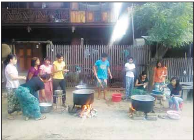
မကွေးတိုင်းဒေသကြီး ရေစိုမြို့နယ်တွင် ဧပြီ ၁၅ရက် သင်္ကြန်အကြတ်နေ့ (ဒုတိယနေ့)တွင် ရပ်ကွက်နှင့်ကျေးရွာအသီးသီး၌ နှစ်သစ်ကူးစတုဒိသာစုပေါင်း အလှူများ၊ ပုဂ္ဂလိကတစ်ဦးတည်းအလှူရှင်များ၏ အာဟာရဒါနစတုဒိသာ လှူဒါန်းသူများဖြင့် စည်ကားလှုပ်ရှားကြောင်းသိရသည်။

မှတ်ချက်။ အထက်ဖော်ပြပါ ဆေးမြီးတို့ လေး များက မျက်စိနာခြင်းကို ထိထိရောက်ရောက် သက်သာစေပါတယ်။ သို့သော် မျက်လုံးထဲသို့ တိုက်ရိုက်မထည့်ဘဲ၊ မျက်ခွံ (သို့မဟုတ်) မျက်စိတစ်ဝိုက်မှာ လိမ်းအံ့ပေးရမှာ ဖြစ်ပါတယ်။