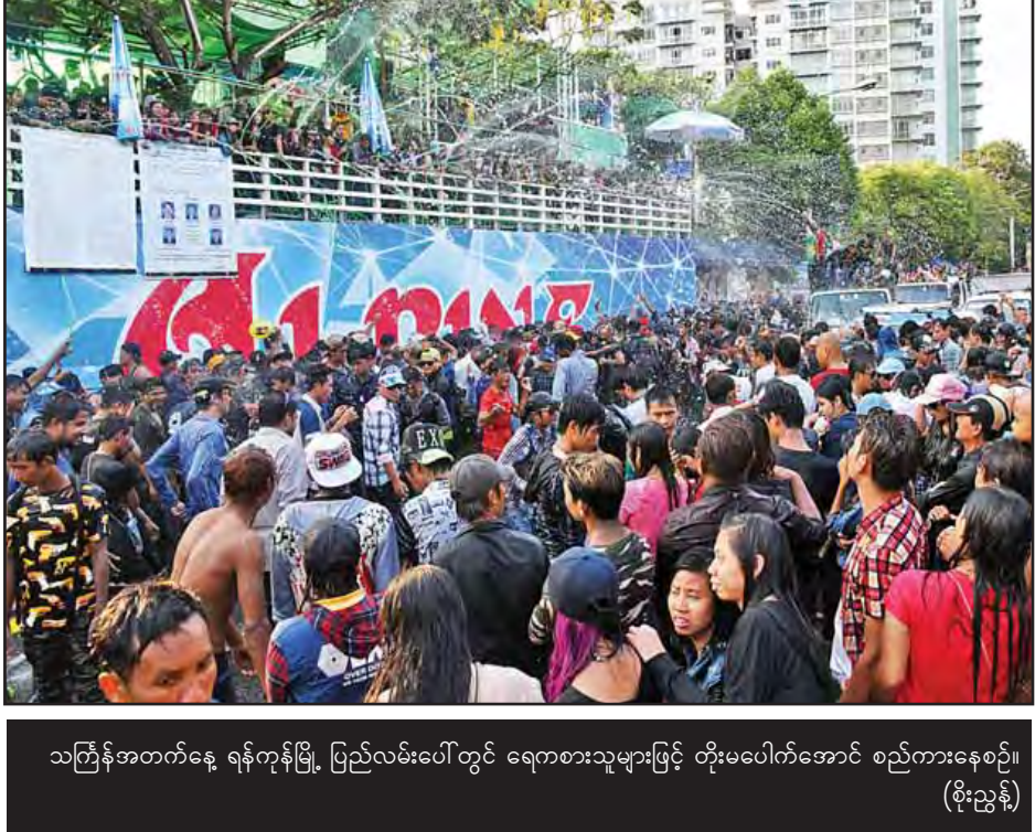
သင်္ကြန်အတက်နေ့ ရန်ကုန်မြို့ ပြည်လမ်းပေါ်တွင် ရေကစားသူများဖြင့် တိုးမပိတ်အောင် စည်ကားနေစဉ်။ (စိုးညွန့်)