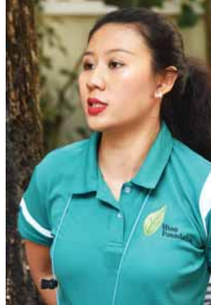
မစုစန္ဒီလတ်