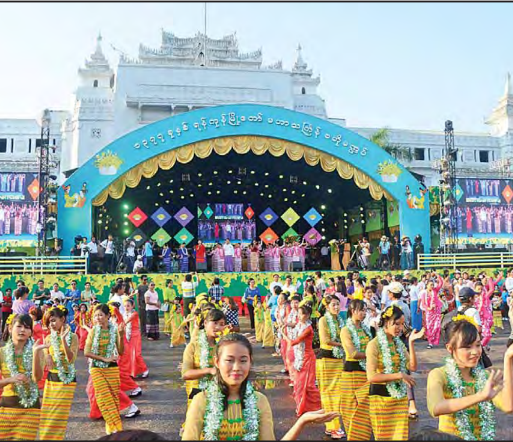
ရန်ကုန်မြို့တော် မဟာသင်္ကြန်ပုထိုးပိတ်ပွဲအခမ်းအနား ကျင်းပမှုမြင်ကွင်း။ (သတင်းစဉ်)

ပြည်ထောင်စုသမ္မတမြန်မာနိုင်ငံတော် နိုင်ငံတော်သမ္မတရုံး အမိန့်အမှတ်၊ ၃၃/၂၀၁၆ ၁၃၇၇ ခုနှစ်၊ တန်ခူးလဆန်း ၉ ရက် (၂၀၁၆ ခုနှစ်၊ ဧပြီလ ၁၆ ရက်) ပြစ်ဒဏ်လွတ်ငြိမ်းခွင့်ပြုခြင်း နှစ်သစ်ကူးအခါသမယတွင် အမျိုးသားရင်ကြားစေရေးနှင့် ပြည်သူလူထုနှလုံးစိတ်ဝမ်းငြိမ်းချမ်းစေရေး တို့ကို ဦးတည်သောအားဖြင့် အကျဉ်းထောင်အသီးသီးတွင် ပြစ်ဒဏ်ကျခံလျက်ရှိသည့် အကျဉ်းသား ၈၃ ဦးကို ၁၃၇၈ တန်ခူးလဆန်း ၁၀ ရက် မြန်မာနှစ်ဆန်း ၁ ရက် (၂၀၁၆ ခုနှစ်၊ ဧပြီလ ၁၇ ရက်) နေ့မှစ၍ နိုင်ငံတော် ဖွဲ့စည်းပုံအခြေခံဥပဒေပုဒ်မ ၂၀၄၊ ပုဒ်မခွဲ (က)အရ ပြစ်ဒဏ်လွတ်ငြိမ်းခွင့်ပြုလိုက်သည်။ (ပုံ)ထင်ကျော် နိုင်ငံတော်သမ္မတ ပြည်ထောင်စုသမ္မတမြန်မာနိုင်ငံတော်