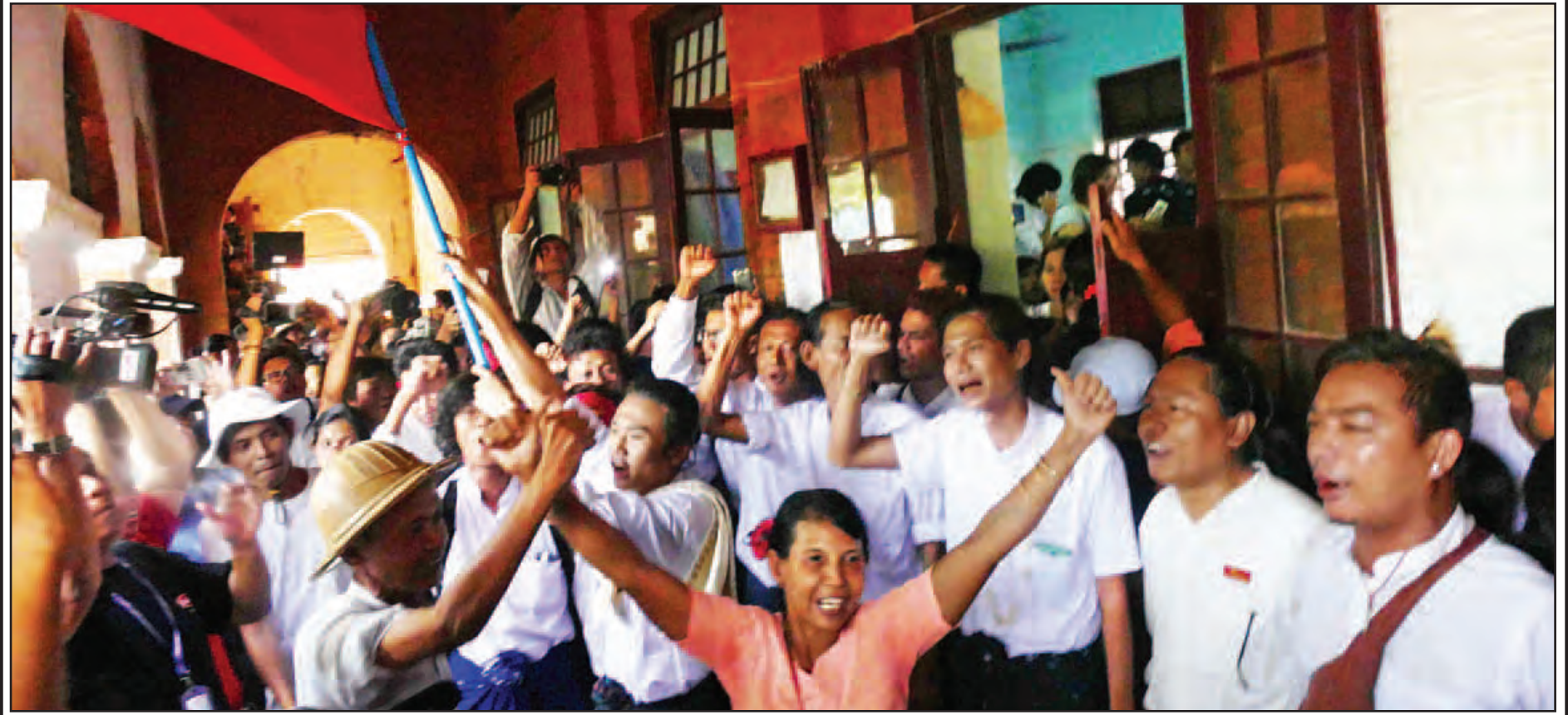
ဧပြီ ၈ ရက်က သာယာဝတီအကျဉ်းထောင်မှ ပြန်လည်လွတ်မြောက်လာကြသူများနှင့် လာရောက်ကြိုဆိုသူများအား တွေ့ရစဉ်။