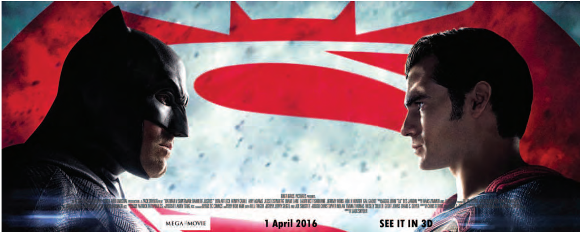
MEGA MOVIE 1 April 2016 SEE IT IN 3D