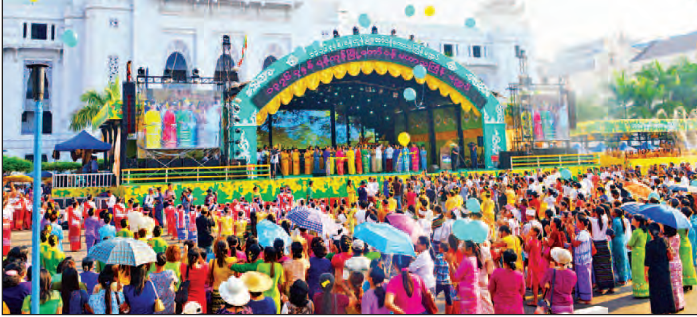
ယခုနှစ်က ရန်ကုန်မြို့တော်ဝန်ရေကစားမဏ္ဍပ်အား စည်ကားသိုက်မြိုက်စွာ တွေ့ရစဉ်။