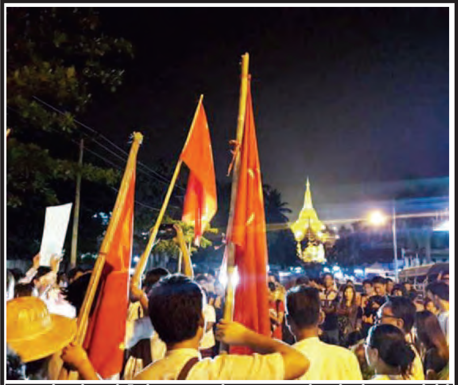
သာယာဝတီထောင်မှ လွတ်မြောက်လာသော ကျောင်းသားများ ရွှေတိဂုံစေတီတော် အရှေ့ဘက်မုခ်သို့ ယနေ့ည ၁၁ နာရီတွင် ရောက်ရှိလာကြစဉ်။