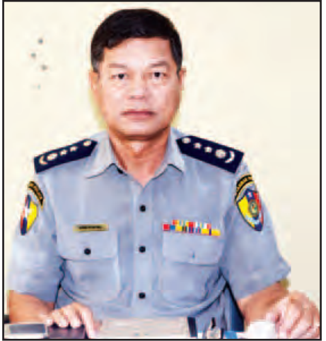
ရဲမှူးကြီးရွှေညာမောင်၊ ဌာနမှူး တားဆီးနှိမ်နင်းရေးဌာနအဖွဲ့

ကျွန်တော်တို့နိုင်ငံရဲ့ဥပဒေကျတော့ သက်ဆိုင်ရာ ကျန်းမာရေးဝန်ကြီးဌာနရဲ့ ဆေးဝါးကုသမှုကိုခံယူရမယ်၊ သက်ဆိုင်ရာလက်မှတ်နဲ့ ဆေးဝါးကုသမှုခံယူတာ