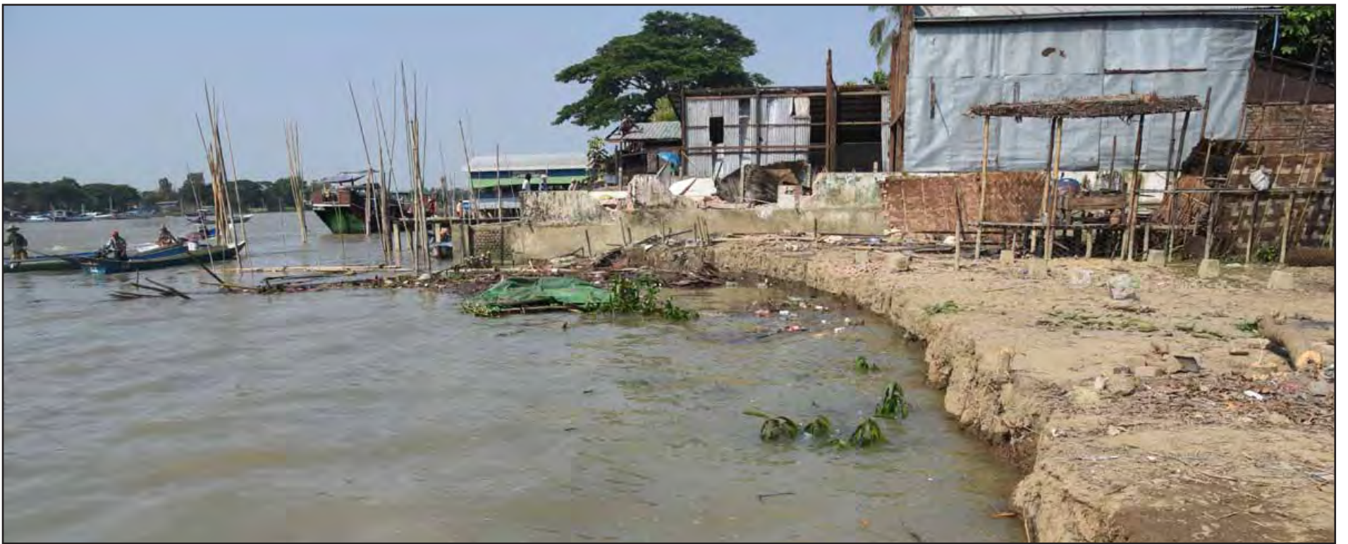
မြစ်ရေစီးကြောင်းပြောင်းလဲမှုကြောင့် တံတေးမြို့နယ် အိုးဖိုအနောက်ရပ်ကွက်အတွင်း မြစ်ကမ်းပါးတိုက်စားပြိုကျမှု မြင်ကွင်း