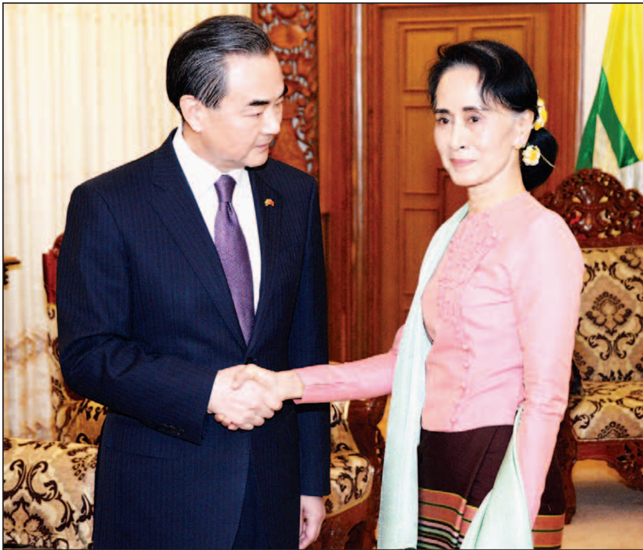
နိုင်ငံခြားရေးဝန်ကြီးဌာန ပြည်ထောင်စုဝန်ကြီး ဒေါ်အောင်ဆန်းစုကြည်နှင့် တရုတ်ပြည်သူ့သမ္မတနိုင်ငံ နိုင်ငံခြားရေးဝန်ကြီး မစ္စတာဝမ်ယီတို့ တွေ့ဆုံကြစဉ်။ (သတင်းစဉ်)