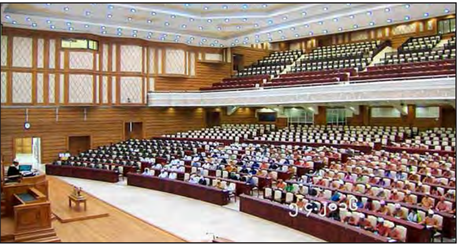
ဒုတိယအကြိမ် ပြည်သူ့လွှတ်တော် ပထမပုံမှန်အစည်းအဝေး(၁၈)ရက်မြောက်နေ့ ကျင်းပစဉ်။

ပြင်ဆင်မှုများ ဆောင်ရွက်ခြင်းမပြုဘဲ ဥပဒေပြင်ဆင်သည့် ပုဒ်မများကို မဲခွဲဆုံးဖြတ်ခြင်းများပြုလုပ်ပြီး အတည်ပြုမှုများ ဆက်လက်ဆောင်ရွက်မည်ဆိုပါက တပ်မတော်သား ကိုယ်စားလှယ်များအနေဖြင့် ဆက်လက်ပါဝင်ဆောင်ရွက် ရန် အခက်အခဲရှိမည်ဖြစ်ပြီး မဲပေးခြင်းများ ဆောင်ရွက်မည် မဟုတ်ကြောင်း တင်ပြသည်။