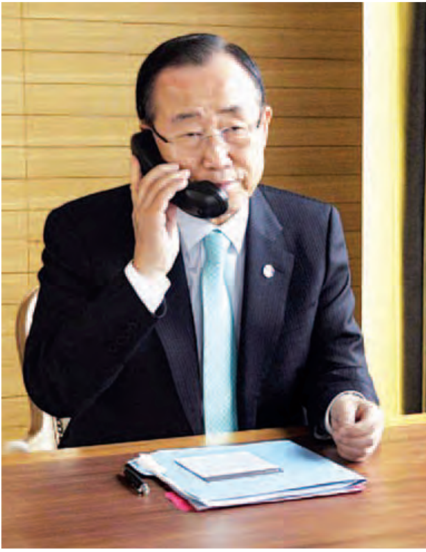
ကုလသမဂ္ဂအတွင်းရေးမှူးချုပ် မစ္စတာဘန်ကီမွန်း

❖ ရှေ့ဖူးမှ မိမိတို့သည် အိမ်နီးချင်းနိုင်ငံဖြစ်သည်နှင့်အမျှ နှစ်နိုင်ငံဆက်ဆံရေးသည် အရေးကြီးကြောင်း၊ နိုင်ငံရေးအရသာမက လူမှုရေး၊ စီးပွားရေးအရပါ အရေးကြီးကြောင်း၊ ထိုကဲ့သို့အရေးကြီးမှုကို တရုတ်နိုင်ငံအနေဖြင့်လည်း အသိအမှတ်ပြုသည်ဟု ထင်မြင်မိကြောင်း၊ မိမိတို့အစိုးရသည် နိုင်ငံခြားရေးမူဝါဒအရ တစ်ကမ္ဘာလုံးနှင့် ခင်မင်ရင်းနှီးစွာ ပူးပေါင်းဆောင်ရွက်လိုပါကြောင်း၊ တစ်ကမ္ဘာလုံးခင်မင်ရင်းနှီးစွာဖြင့် ငြိမ်းချမ်းရေးအတွက်၊ လူသားများ၏ တိုးတက်ဖွံ့ဖြိုးရေးအတွက် ဆောင်ရွက်သည့်နေရာတွင် အိမ်နီးချင်းနိုင်ငံများကလည်း ပူးပေါင်းဆောင်ရွက်မည်ဟု ယုံကြည်ပါကြောင်း၊ ထို့ကြောင့် ယခုကဲ့သို့ အချိန်ကာလတွင် တရုတ်နိုင်ငံ နိုင်ငံခြားရေးဝန်ကြီးက လာရောက်ရုဏ်ပြုသည့်အတွက်၊ မြန်မာအစိုးရကို ဆုမွန်ကောင်းများ တောင်းပေးသည့်အတွက် မိမိအနေဖြင့် ကျေးဇူးတင်ရှိပါကြောင်း ပြောကြားသည်။