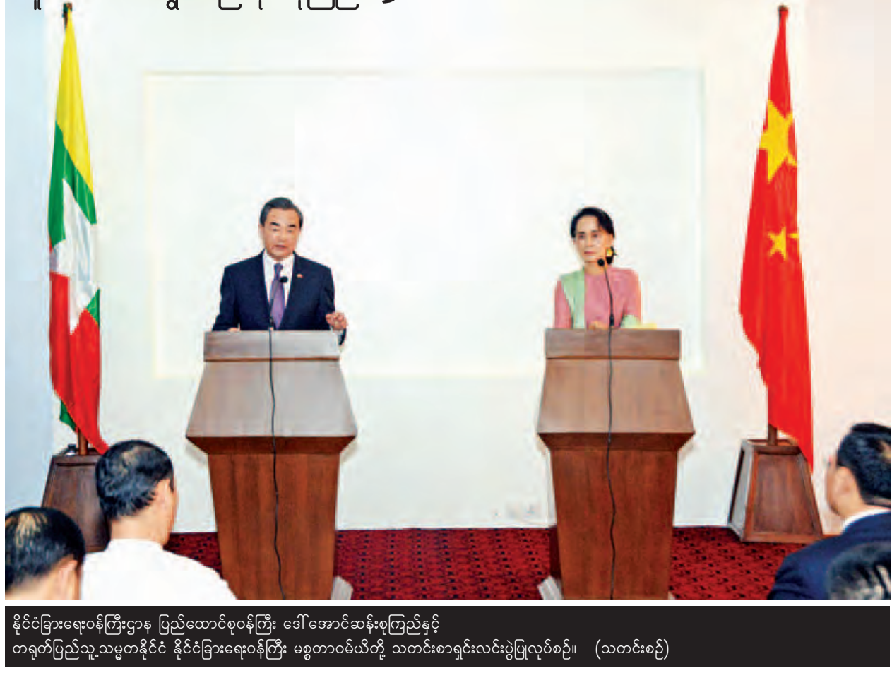
နိုင်ငံခြားရေးဝန်ကြီးဌာန ပြည်ထောင်စုဝန်ကြီး ဒေါ်အောင်ဆန်းစုကြည်နှင့် တရုတ်ပြည်သူ့သမ္မတနိုင်ငံ နိုင်ငံခြားရေးဝန်ကြီး မစ္စတာဝမ်ယီတို့ သတင်းစာရှင်းလင်းပွဲပြုလုပ်စဉ်။ (သတင်းစဉ်)

ထို့ပြင် မိမိအနေဖြင့် မြန်မာနိုင်ငံသို့ ကြိမ်ဖန်များစွာ ရောက်ဖူးသော်လည်း မကြာတော့သောအချိန်တွင် ထပ်မံ၍ အလည်အပတ်လာရောက်ခွင့်ရရှိမည်ဟု မျှော်လင့်ပါကြောင်း၊ နိုင်ငံတော်သမ္မတကြီးနှင့် လာမည့်အာဆီယံအစည်းအဝေးများတွင် ဖြစ်စေ၊ မြန်မာနိုင်ငံသို့ အလည်အပတ်ခရီးလာရောက်၍ဖြစ်စေ ဆောလျင်စွာ တွေ့ဆုံဆွဲရရှိရန် မျှော်လင့်ပါကြောင်းနှင့် နိုင်ငံတော်သမ္မတကြီး တာဝန်ထမ်းဆောင်ရာတွင် အောင်မြင်မှုများ ရရှိစေရန် ဆုမွန်ကောင်းများ ပို့သပါကြောင်း ပြောကြားခဲ့သည်။ (သတင်းစဉ်)