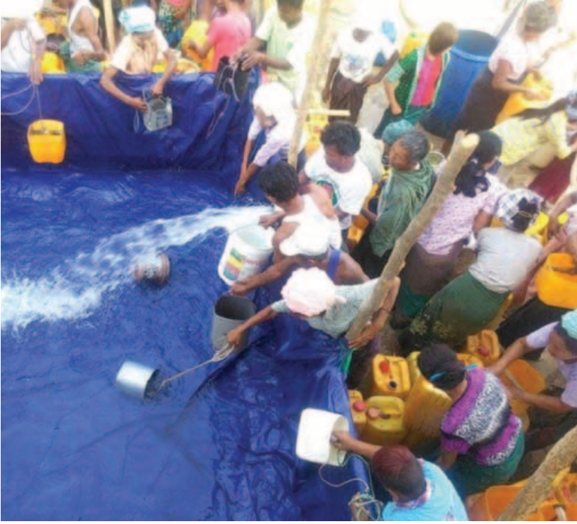
ကျေးရွာသို့ သွားရောက်၍ ရေဂါလန် ၅၀၀၀ ဆံ့ယာယီရွက်ဖျင်ရေကန် နှစ်ကန်ပြုလုပ်ပေးပြီး ရေဂါလန် ၁၂၀၀ ဆံ့ ရေသယ်ယာဉ်ဖြင့်ဖြန့်ဝေပေးခဲ့သည်။ ဆက်လက်၍ အဆိုပါဆပ်ပြာကျင်းအုပ်စုကျောက်ပုံကျေးရွာအား သောက်သုံးရေ (ရေချို)

မိတ္ထီလာ ဧပြီ ၅ မန္တလေးတိုင်းဒေသကြီး မိတ္ထီလာမြို့နယ်ကျေးလက်ဒေသဖွံ့ဖြိုးတိုးတက်ရေးဦးစီးဌာနမှ ဦးစီးမှုနှင့် ဝန်ထမ်းများသည် မြို့နယ်အတွင်းရှိကျေးရွာများအား သောက်သုံးရေအလေအလွင့်မရှိ အကျိုးရှိစွာအသုံးချနိုင်ရေးအတွက် ရေထွက်ပင်ရင်းများ စစ်ဆေးခြင်း၊ အသိပညာပေးဟောပြောခြင်း၊ ဖြေရှင်းဆောင်ရွက်ပေးမည့်နည်းလမ်းများ ကြိုတင်အသိပေးလုပ်ငန်းများကို ဆောင်ရွက်လျက်ရှိရာ ပထမဦးစားပေးအနေဖြင့် သောက်သုံးရေပြတ်လပ်နိုင်သည့် ကျေးရွာများအား ရေတွင်း၊ ရေကန်များ စသည့် ရေထွက်ပင်ရင်းများကို စစ်ဆေးပြီး ၎င်းရေကာလ မည်မျှသုံးစွဲနိုင်မည်ကိုစစ်ဆေး၍ ရေပြတ်လပ်မှုဖြစ်ပေါ်ပါက အချိန်နဲ့တပြေးညီပို့ဆောင်ပေးနိုင်ရန် တွင်းဆင်းဆောင်ရွက်လျက်ရှိသည်။ ယင်းသို့ဆောင်ရွက်ရာတွင် ဆပ်ပြာကျင်းအုပ်စုကျောက်ပုံကျေးရွာသည် အိမ်ခြေ ၆၃ အိမ်၊ လူဦးရေ ၃၅၀ ကျော် ရှိသည့် ၎င်းကျေးရွာသည် ရေခဲထွက်ရှိသည့် စက်ရေတွင်းနှစ်တွင်းရှိသော်လည်း တစ်တွင်းသာ သုံးစွဲရ၍ လက်တူးတွင်းခြောက်တွင်း တူးဖော်အသုံးပြုရာ လေးတွင်းမှာ ရေခဲထွက်ရှိ၍ နှစ်တွင်းသာ ရေချိုထွက်ရှိသဖြင့် သုံးရေအတွက် လုံလောက်သော်လည်း သောက်ရေဖြစ်သည့် ရေချိုအနည်းငယ်သာရရှိသောကြောင့် သောက်ရေ(ရေချို) အခက်အခဲများဖြစ်ပေါ်လာနိုင်ကြောင်း စစ်ဆေးတွေ့ရှိခဲ့သောကြောင့် ကျောက်ပုံကျေးရွာအား သောက်သုံးရေ အခက်အခဲမဖြစ်ပေါ်စေရန် ဧပြီ ၃ ရက်က မြို့နယ်ကျေးလက်ဒေသဖွံ့ဖြိုးတိုးတက်ရေးဦးစီးဌာနနှင့် မီးသတ်ဦးစီးဌာနတို့ ပူးပေါင်း၍ အဆိုပါ