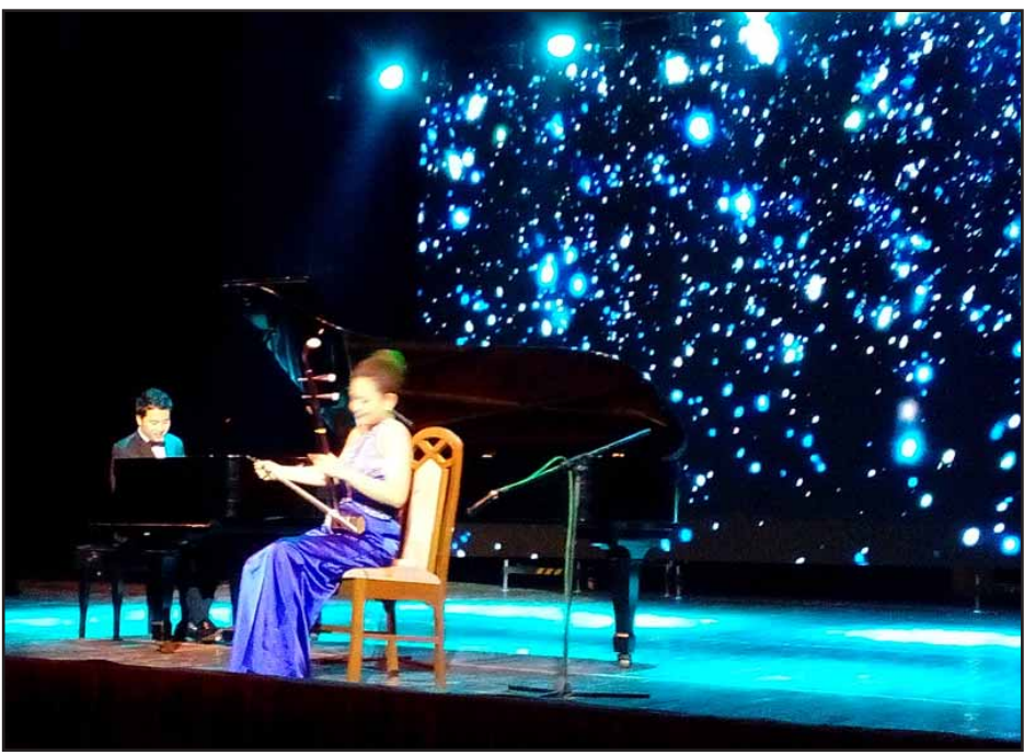
မဟာသင်္ကြန်အကြို ဂန္ဓဝင်တေးဂီတဖျော်ဖြေပွဲ၌ တရုတ်နိုင်ငံမှဂီတပညာရှင်များ ပါဝင်ဖျော်ဖြေကြစဉ်။