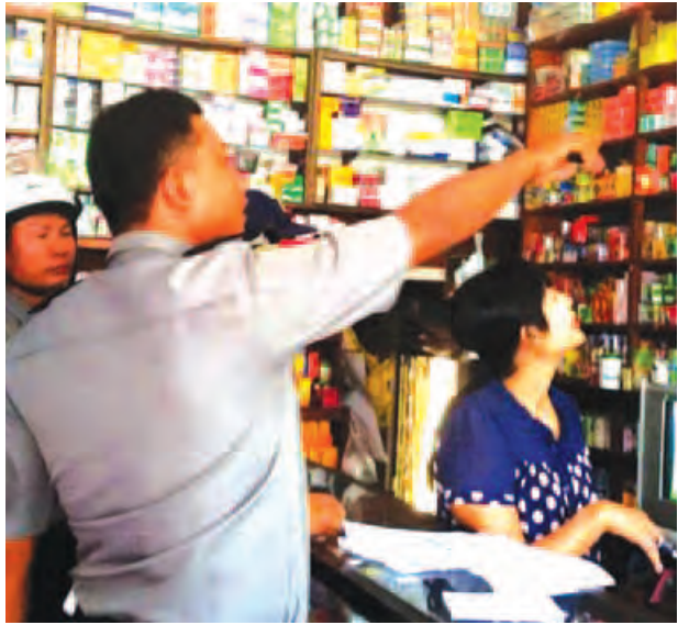
ကျေးသောင်း ဧပြီ ၅ ရက်တွင် သင်္ကြန်ကာလမူဝါဒကျဆင်းရေး ဆေးဆိုင်များ သို့လိုက်လံစစ်ဆေးခဲ့ကြောင်း သိရသည်။

ကာလတွင်း လူငယ်များ အရက်သေစာသောက်စား မူးယစ်ရမ်းကားခြင်း၊ စိတ်ကြွဆေးများ ဝယ်ယူသုံးစွဲကာ မူးယစ်စဉ်များ ကျူးလွန်ခြင်းများ မဖြစ်ပေါ်စေရေး မြို့ပေါ်ရပ်ကွက်များရှိ အိမ်သုံးဆေးအရောင်းဆိုင်များတွင် သင်္ကြန်ကာလအတွင်းစိတ်ကြွဆေးများ၊ မူးယစ်ဆေးများ၊ စိတ်ငြိမ်ဆေးဝါးများ၊ ထိန်းချုပ်ဆေးဝါးများ၊ အမှတ်တံဆိပ်အမျိုးမျိုးဖြင့် တရားမဝင်တင်သွင်းလာသည့် ကာမဆန္ဒနွှေးဆေးဝါးများနှင့် ရက်လွန်ဆေးဝါးများ၊ မှတ်ပုံတင်မရှိသော ဆေးဝါးများ ရောင်းချခြင်း ရှိ၊ မရှိ သိရှိရန်နှင့် ရောင်းချခြင်း မပြုကြရန် မြို့နယ်ရဲတပ်ဖွဲ့၊ မူးယစ်အထူးတပ်ဖွဲ့နှင့် အစားအသောက်နှင့်ဆေးဝါးကွပ်ကဲရေးဦးစီးဌာန မှတာဝန်ရှိသူများ ပူးပေါင်းအဖွဲ့ဖြင့် လိုက်လံစစ်ဆေးသတိပေး နှိုးဆော်ပညာပေးလုပ်ငန်းများ ဆောင်ရွက်ခဲ့ကြောင်း သိရသည်။