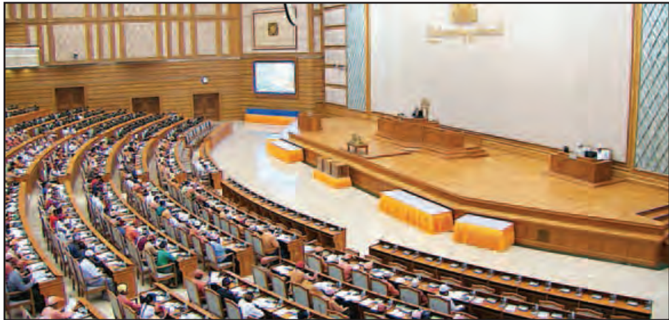
ဒုတိယအကြိမ် ပြည်ထောင်စုလွှတ်တော် ပထမပုံမှန်အစည်းအဝေး (၁၇)ရက်မြောက်နေ့ ကျင်းပစဉ်။

နေပြည်တော် ဧပြီ ၅ ဒုတိယအကြိမ် ပြည်ထောင်စုလွှတ်တော် ပထမပုံမှန် အစည်းအဝေး (၁၇) ရက်မြောက်နေ့ကို ယနေ့နံနက် ၁၀ နာရီတွင် နေပြည်တော်ရှိ ပြည်ထောင်စုလွှတ်တော် အစည်းအဝေးခန်းမ၌ကျင်းပရာ နိုင်ငံတော်သမ္မတက အဆိုပြုတင်ပြထားသော ပြည်ထောင်စုဝန်ကြီး နှစ်ဦးနှင့် ပြည်ထောင်စုရွှေ့နေချုပ်၊ ပြည်ထောင်စုစာရင်းစစ်ချုပ်တို့၏ အမည်စာရင်းများကို လွှတ်တော်က သဘောတူကြောင်း ကြေညာခြင်း၊ ပြည်ထောင်စုလွှတ်တော်ဥပဒေရေးရာနှင့် အထူးကိစ္စရပ်များ လေ့လာဆန်းစစ်သုံးသပ်ရေးကော်မရှင် ပြင်ဆင်ဖွဲ့စည်းခြင်းနှင့် အာဆီယံပါလီမန်များညီလာခံ ဆိုင်ရာ ပူးပေါင်းကော်မတီဥက္ကဋ္ဌ ပြောင်းလဲတာဝန်ပေးခြင်း တို့နှင့် စပ်လျဉ်း၍ လွှတ်တော်၏ သဘောတူညီချက်ရယူခြင်း တို့ကို ဆောင်ရွက်ကြသည်။